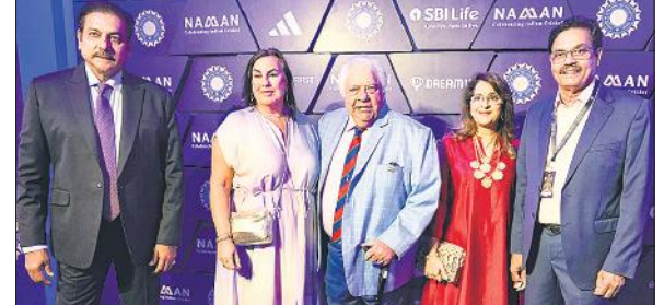
रवि शास्त्री, फारुख इजीनियर, दिलीप वेगसरकर व अन्य।

हैदराबाद, एजेंसी। पूर्व भारतीय ऑलराउंडर और मुख्य कोच रवि शास्त्री और पूर्व विकेटकीपर फारुख इजीनियर को मंगलवार को बीसीसीआई ने लाइफटाइम अचीवमेंट पुरस्कार से सम्मानित किया। बीसीसीआई ने समारोह में 2019-20 सत्र के लिए शीर्ष पुरुष और महिला खिलाड़ियों को सम्मानित किया। शुभमन गिल को 12 महीने में