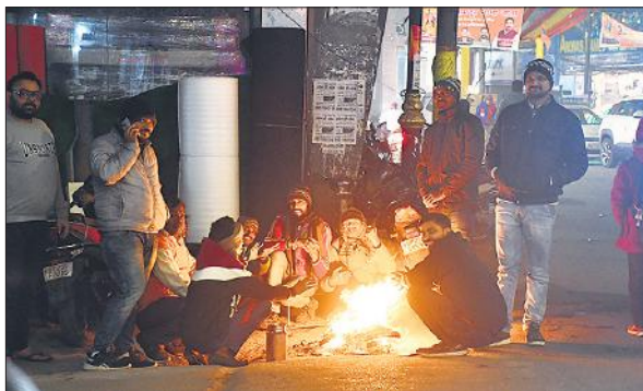
कड़ाके की ठंड से बचने के लिए सिकलापुर में अलाव तापते लोग।