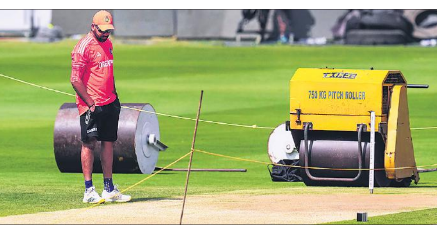
हैदराबाद में इंग्लैंड के खिलाफ टेस्ट श्रृंखला शुरू होने से पहले पिच का मुआयना करते कप्तान रोहित शर्मा।

भारतीय टीम के मुख्य कोच राहुल द्रविड़ ने कहा कि गुरुवार से हैदराबाद में शुरू होने वाली पांच मैचों की टेस्ट श्रृंखला के शुरुआती मैच में जैसे-जैसे खेल आगे बढ़ेगा पिच से स्पिनरों को मदद मिलेगी। टेस्ट मैच से दो दिन पहले पिच काफी सूखी दिख रही थी, खासकर दोनों छोर के गुड लेंथ क्षेत्र के आसपास। द्रविड़ ने कहा कि पिच के बारे में अभी कुछ कहना मुश्किल है। जब मैच शुरू होगा तब इसके बारे में पता करेगा। अब तक जो देखा है उसमें यह पिच अच्छी दिख रही है।