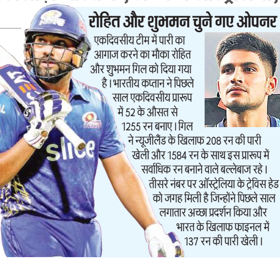
रोहित और शुभमन चुने गए ओपनर

रोहित शर्मा को मंगलवार को आईसीसी की साल की सर्वश्रेष्ठ एकदिवसीय अंतर्राष्ट्रीय टीम का कप्तान चुना गया, जिसमें स्टार बल्लेबाज विराट कोहली और मोहम्मद शमी व मोहम्मद सिराज की तेज गेंदबाजी जोड़ी के अलावा दो और भारतीयों को जगह मिली है। आईसीसी के मुताबिक टीम में जगह बनाने वाले अधिकतर खिलाड़ी फाइनल में पहुंचे भारत और ऑस्ट्रेलिया के अलावा सेमीफाइनल में जगह बनाने वाले न्यूजीलैंड और दक्षिण अफ्रीका से हैं।