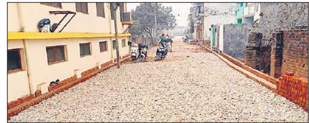
मुंशी नगर कॉलोनी में बन रही सड़क।

बरेली, अमृत विचार : मुंशी नगर में बदहाल सड़क मार्च तक बन पाएगी। इंजीनियरों का कहना है बजरी और पत्थर का रोड़ा बिछाया जा रहा है। उंट के चलते सीसी रोड निर्माण में रफ्तार धीमी है। दूसरी तरफ दिक्कत है कि जिन गलियों में पत्थर बिछाकर बजरफुट डाल दिया गया है, इससे लोगों को निकलने में दिक्कत हो रही है।