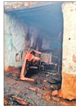
घर में जला पड़ा सामान।

गांव हरामपुर में छप्पर पर गिरे रॉकेट से गृहस्थी का सामान जल गया, साथ ही भैंस भी झुलस गई।