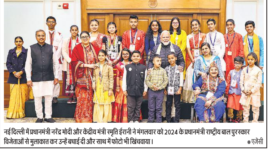
नई दिल्ली में प्रधानमंत्री नरेंद्र मोदी और कैदीय मंत्री स्मृति ईरानी ने मंगलवार को 2024 के प्रधानमंत्री राष्ट्रीय बाल पुरस्कार विजेताओं से मुलाकात कर उन्हें बधाई दी और साथ में फोटो भी खिंचवाया।