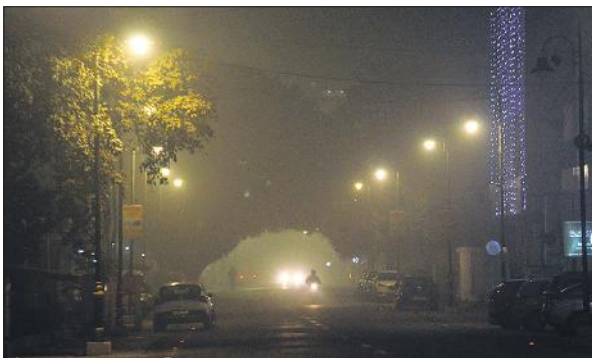
मंगलवार को शाम से ही कोहरे और ठंड की वजह से सड़कों पर सन्नाटा पसर गया।