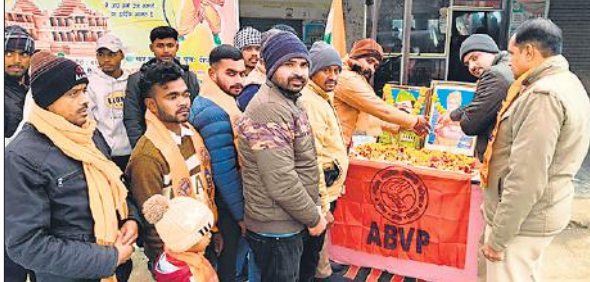
सुभाष चंद्र बोस के चित्र पर पुष्प अर्पित करते एबीवीपी के पदाधिकारी।