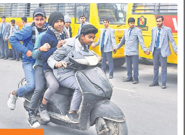
यातायात व्यवस्था बदहाल

शहर में यातायात व्यवस्था बदहाल है। मंगलवार को यातायात जागरूकता रैली के दौरान शहामतगंज में जाम लग गया। इस दौरान स्कूटी सवार नियम तोड़ते भी देखे।