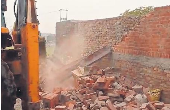
बहेड़ी में पक्के निर्माण को गिराता बुलडोजर।