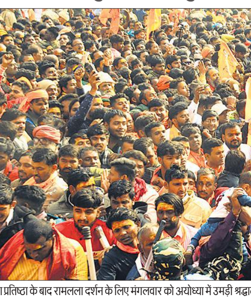
प्राणप्रतिष्ठा के बाद रामलला दर्शन के लिए मंगलवार को अयोध्या में उमड़ी श्रद्धालुओं की भीड़।