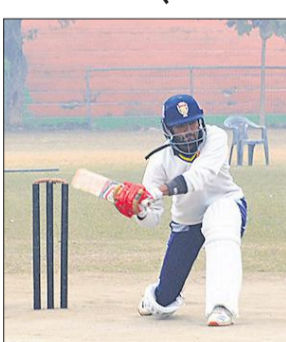
शॉर्ट खेलता खिलाड़ी।