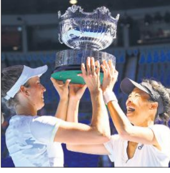
ताईवान की सेह सू वेई ग्रैंडस्लैम युगल खिताब जीतने वाली दूसरे सबसे उम्रदराज महिला बन गईं, जिन्होंने बैल्लियम की एलिसे मर्टेंस के साथ ऑस्ट्रेलियाई ओपन महिला युगल खिताब अपने नाम किया। दूसरी वरीयता प्राप्त इस जोड़ी ने लाटविया की येलेना ओरपाको और यूक्रेन की लिडिया कुचिन्को को 6-1, 7-5 से हराया। यह सू वेई का सातवां महिला युगल ग्रैंडस्लैम खिताब है, जबकि मर्टेंस का चौथा। इससे पहले पुरुष वर्ग में भारत के रोहन बोपणा सबसे उम्रदराज युगल चैंपियन बने, जिन्होंने ऑस्ट्रेलिया के मैथ्यू एबडेन के साथ खिताब जीता। ऑस्ट्रेलिया की लीजा रमंड सू वेई से आठ दिन बड़ी थी जब उन्होंने 2011 अमेरिकी ओपन खिताब जीता था। मार्तिना नवरातिलोवा ने 49 वर्ष की उम्र में 2006 अमेरिकी ओपन जीता था।