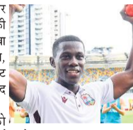
ब्रिसबेन, एजेसी। शामार जोसेफ के 7 विकेट की मदद से वेस्टइंडीज ने गाबा पर दिन रात का टेस्ट जीता, जो ऑस्ट्रेलिया में टेस्ट क्रिकेट में 27 साल बाद मिली जीत है। शामार जोसेफ को वेस्टइंडीज की दूसरी पारी में मिचेल स्टार्क का यॉर्कर लगा था और उन्हें मैदान से जाना पड़ा था। उन्होंने गेंदबाजी में कमाल दिखाते हुए 68 रन देकर 7 विकेट लिए और ऑस्ट्रेलिया को 207 रन पर आउट कर दिया। सलामी बल्लेबाज स्टीव स्मिथ 146 गेंद में 91 रन बनाकर नाबाद रहे। एडीलेड में टेस्ट क्रिकेट में पदार्पण करने वाले 24 साल के शामार जोसेफ 11वें नंबर के बल्लेबाज जोश हेजलवुड का विकेट लेते ही खुशी के मारे उछल पड़े। वेस्टइंडीज ने एडीलेड टेस्ट तीन दिन के भीतर दस विकेट से गंवाने के बाद वापसी करके शृंखला में 1-1 से बराबरी की। 1997 में दस विकेट से जीत दर्ज करने के बाद से वेस्टइंडीज ने ऑस्ट्रेलिया में टेस्ट मैच नहीं जीता था।

शामार जोसेफ को वेस्टइंडीज की दूसरी पारी में मिचेल स्टार्क का यॉर्कर लगा था और उन्हें मैदान से जाना पड़ा था। उन्होंने गेंदबाजी में कमाल दिखाते हुए 68 रन देकर 7 विकेट लिए और ऑस्ट्रेलिया को 207 रन पर आउट कर दिया। सलामी बल्लेबाज स्टीव स्मिथ 146 गेंद में 91 रन बनाकर नाबाद रहे। एडीलेड में टेस्ट क्रिकेट में पदार्पण करने वाले 24 साल के शामार जोसेफ 11वें नंबर के बल्लेबाज जोश हेजलवुड का विकेट लेते ही खुशी के मारे उछल पड़े। वेस्टइंडीज ने एडीलेड टेस्ट तीन दिन के भीतर दस विकेट से गंवाने के बाद वापसी करके शृंखला में 1-1 से बराबरी की। 1997 में दस विकेट से जीत दर्ज करने के बाद से वेस्टइंडीज ने ऑस्ट्रेलिया में टेस्ट मैच नहीं जीता था।