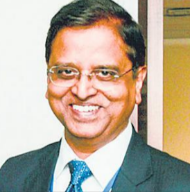
लगातार छठा बजट होगा।

सरकार के आम चुनाव से पहले पेश किए जाने वाले बजट में मोदी की गारंटी की छाप रहने की संभावना है। इस अंतरिम बजट में मध्यम वर्ग, किसानों और असंगठित क्षेत्र के श्रमिकों समेत मतदाताओं के बड़े वर्ग को आकर्षित करने के लिए 'लोकलुभावन योजनाएं' पेश की जा सकती हैं। यह बात पूर्व वित्त सचिव सुभाष चंद्र गर्ग ने रविवार को कही। उन्होंने यह भी कहा कि सरकार इस गारंटी को पूरा करने के लिए अगर जरूरत हुई, तो राजकोषीय घाटे के लक्ष्य को लेकर थोड़ी रियायत भी ले सकती है। वित्त मंत्री निर्मला सीतारमण लोकसभा में एक फरवरी को वित्त वर्ष 2024-25 का अंतरिम बजट पेश करेंगी। यह उनका