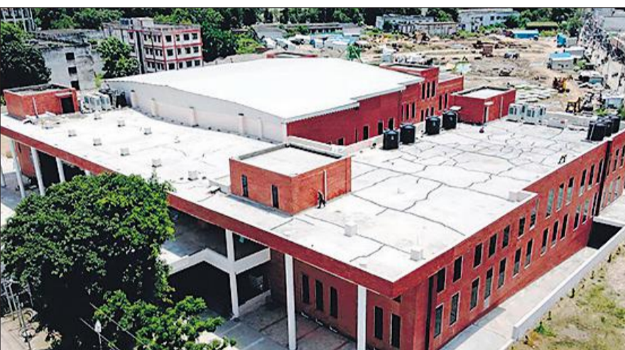
जीआईसी में बने ऑडिटोरियम की छत पर दिख रही बड़ी-बड़ी दरारें।

पहली ही बारिश छत का हाल बुरी तरह खराब कर चुकी है। बताया जाता है कि बारिश के