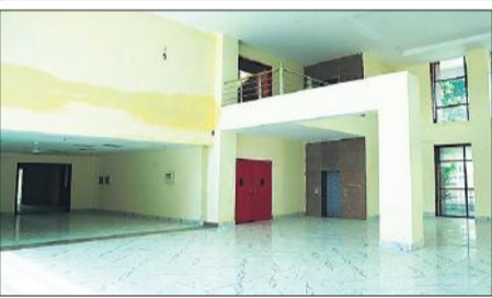
सीलन भी आ गई है ऑडिटोरियम के भवन में।