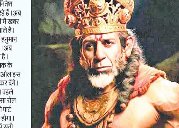
इस फिल्म के लिए विजय सेतुपति से भी बात की जा रही है। मीडिया रिपोर्ट्स में ये भी बताया जा रहा है कि लारा दाता का भी इस फिल्म में कैकेयी का रोल निभा सकती हैं।

पाकिस्तानी सिंगर राहत फतेह अली खान का एक वीडियो तेजी से सोशल मीडिया पर वायरल हुआ। इसमें राहत फतेह अली खान अपने एक स्टूडेंट को वापल-घुसो से मारते दिख रहे हैं। सोशल मीडिया पर हुई फजीहक के बाद पाकिस्तानी सिंगर राहत फतेह अली खान मीडिया के भी निशाने पर आ गए हैं। उनकी जमकर आलोचना हो रही है। वायरल वीडियो में राहत फतेह अली खान अपने घर से एक बोटल ग्राब होने को लेकर छत्र से सवाल जवाब कर रहे हैं। वह इसके गायब होने पर अपना गुस्सा छत्र पर निकालते हैं। अब इस वीडियो पर खुद राहत फतेह अली खान ने भी सफाई दी है। उन्होंने उसी छत्र के साथ एक वीडियो सोशल मीडिया पर शेयर किया है। इसमें वह इस मामले को उरताद और शार्गिद का रिश्ता बता रहे हैं। वीडियो में उन्होंने अपने उसी छत्र से सफाई भी दिलाई है। साथ ही उसके पिता भी मामले पर मिथी डालते हुए दिख रहे हैं। इस वीडियो के सामने आने के बाद भी लोगों का गुस्सा थमा नहीं है। राहत फतेह अली खान के इस माफीनामे में वोलो जमकर अपनी भड़ास निकालते दिखे।