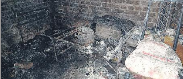
इसी कमरे के अंदर सोए हुए थे अजय और परिवार के लोग।