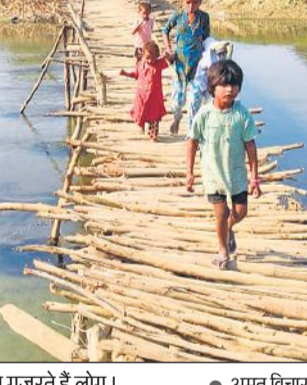
खतरा उठाकर पुल से गुजरते हैं लोग।