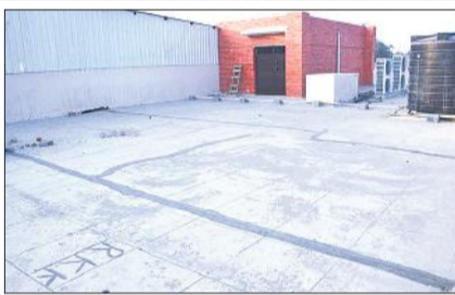
दरारों को सीमेंट से किया गया है बंद।