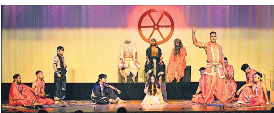
एसआरएमएस रिद्धिमा में नाटक क्यूं पितामह का भावपूर्ण मंचन करते कलाकार।

प्रकार की अनियमितता मिलती है तो उसकी भी सूचना परिषद की मेल आईडी पर भेजी जाएगी।