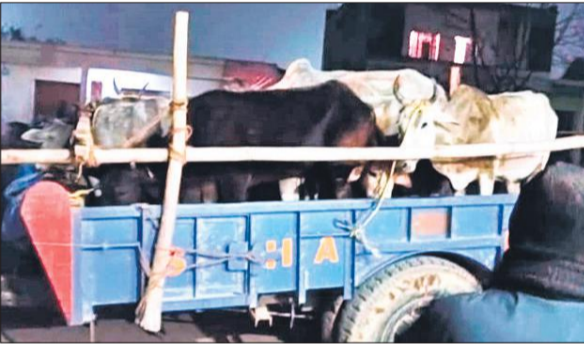
ट्रैक्टर में लादकर लाए गए सांड।

गोशाला संचालक से दर तक उलझने के बाद परेशान किसान सांडों से लदी ट्रालियां लेकर लौट पड़े और रास्ते में दलेलनगर गोशाला से पूर्व ग्राम अथकटा रब्बानी बेगम के जंगल में छोड़कर चले गए। उस गांव में अचानक सांडों का झुंड देखकर ग्रामीणों में अफरा-तफरी मच गई। छोड़े गए भूखे प्यासे सांड खेतों से लेकर