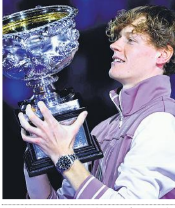
पांच सेट तक चले मैच के साथ ग्रैंडस्लैम के ओपन युग में कोर्ट पर सबसे अधिक समय बिताने का नया रिकॉर्ड बनाया। उन्होंने 2022

अमेरिकी ओपन 2021 के चैंपियन मेदवेदेव की ग्रैंडस्लैम के 6 फाइनल में वह पांचवां हार है। यानिक सिनर ने टूर्नामेंट के अपने चौथे