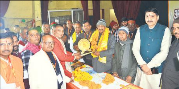
वैवाहिक परिचय सम्मेलन में सांसद धर्मेंद्र कश्यप को सम्मानित करते पदाधिकारी।