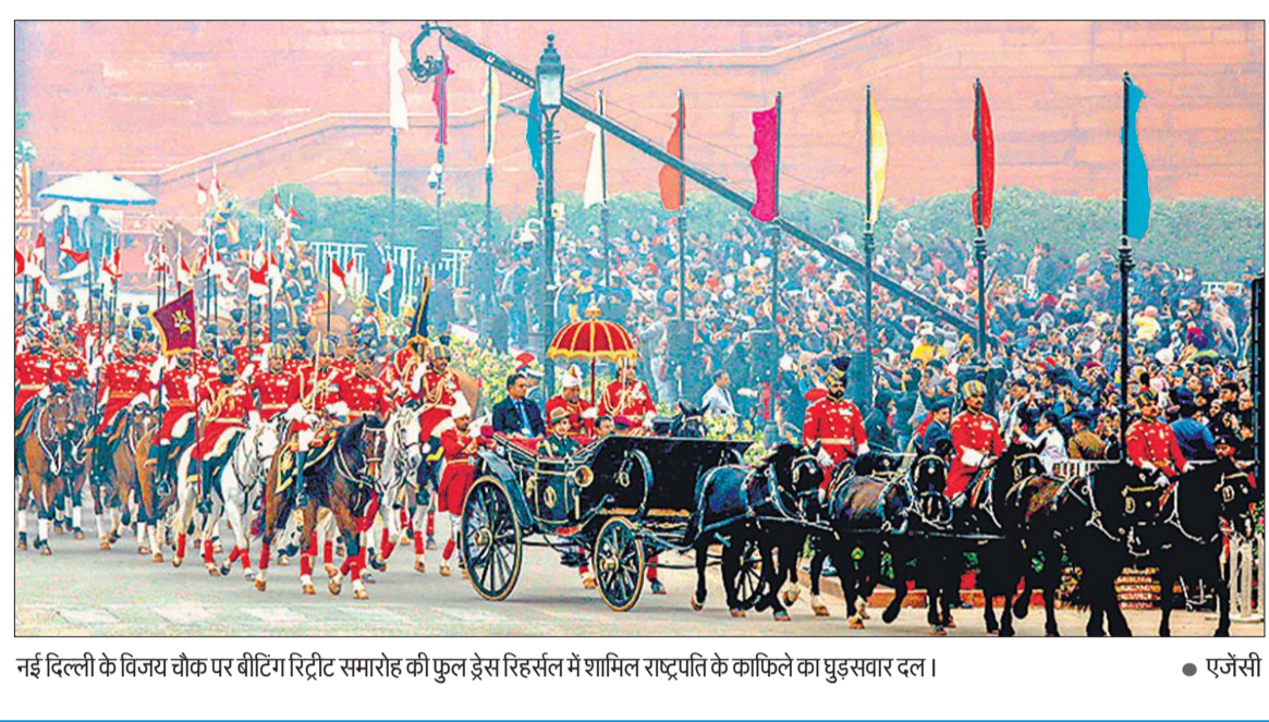
नई दिल्ली के विजय चौक पर बीटिंग रिट्रीट समारोह की फुल ड्रेस रिहर्सल में शामिल राष्ट्रपति के काफिले का घुड़सवार दल।