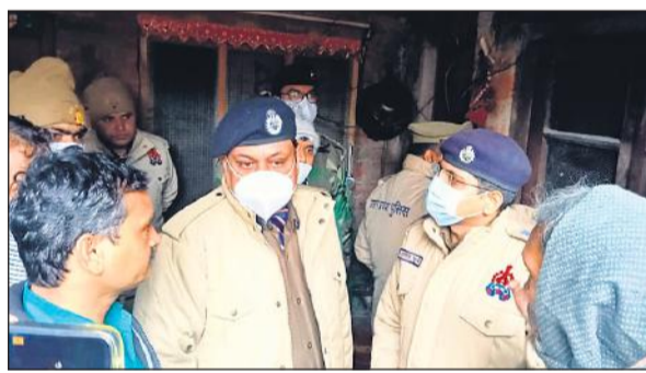
घटनास्थल पर लोगों से पूछताछ करते आईजी और एसएसपी।