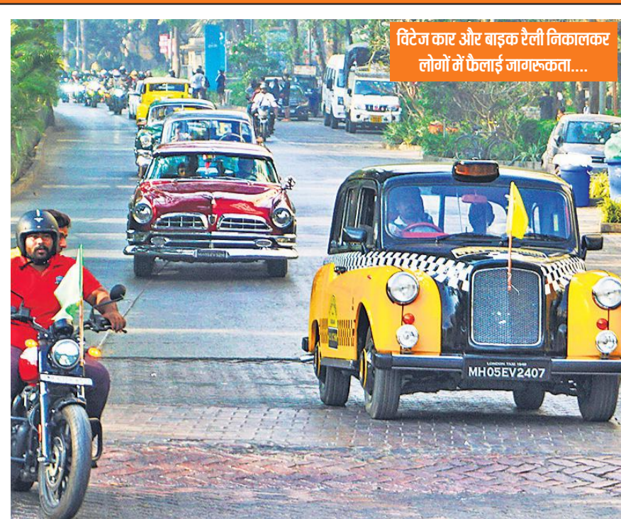
टाणे में रविवार को ट्रैफिक नियमों के बारे में जागरूकता पैदा करने के लिए ट्रैफिक पुलिस द्वारा आयोजित विटेंज कार और बाइक रैली में लोगों ने बंद-चढ़कर हिस्सा लिया।

उन्होंने कहा कि केंद्र सरकार ने सशस्त्र बलों के लिए एक अल्पकालिक भर्ती योजना 'अग्निवीर' को शुरू करके उन युवाओं का मछौल उड़ाया है जो सशस्त्र बलों में शामिल होना चाहते थे। उन्होंने कहा-देशभर में नफरत और हिंसा फैलाई जा रही है। इससे कोई फायदा नहीं होगा।