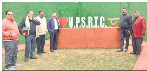
पुराने बस अड्डे पर रोडवेंज अफसरों ने की सेल्फी फ्लॉट की शुरुआत।