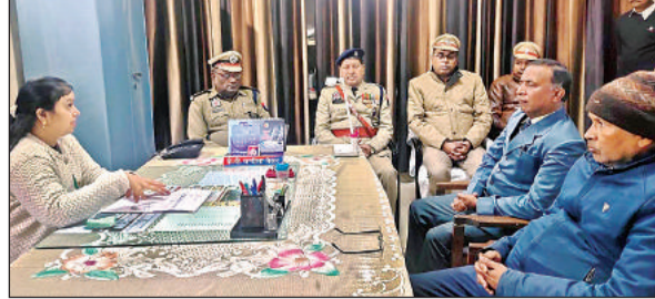
जिला कारागार में पैन इंडिया कैम्पेन 2024 को लेकर बैठक करते न्यायिक अधिकारी ।