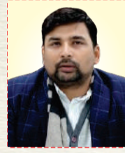
अभिषेक आनंद जिलाधिकारी चित्रकूट

सभी जनपदवासियों को गणतंत्र दिवस की शुभकामनाएं