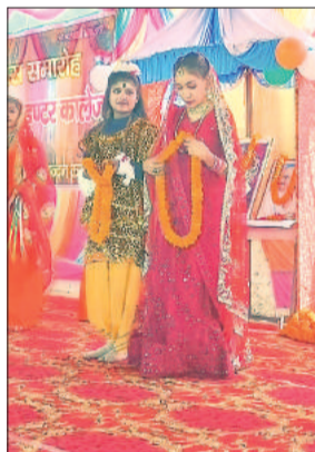
पहाड़ी में कार्यक्रम प्रस्तुत करतीं हरिमोहन इंटर कालेज की छात्राएं।