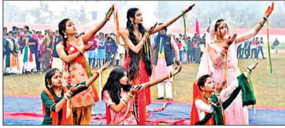
परेड में सांस्कृतिक कार्यक्रम प्रस्तुत करती छात्राएं।