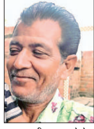
मृतक की फाइल फोटो