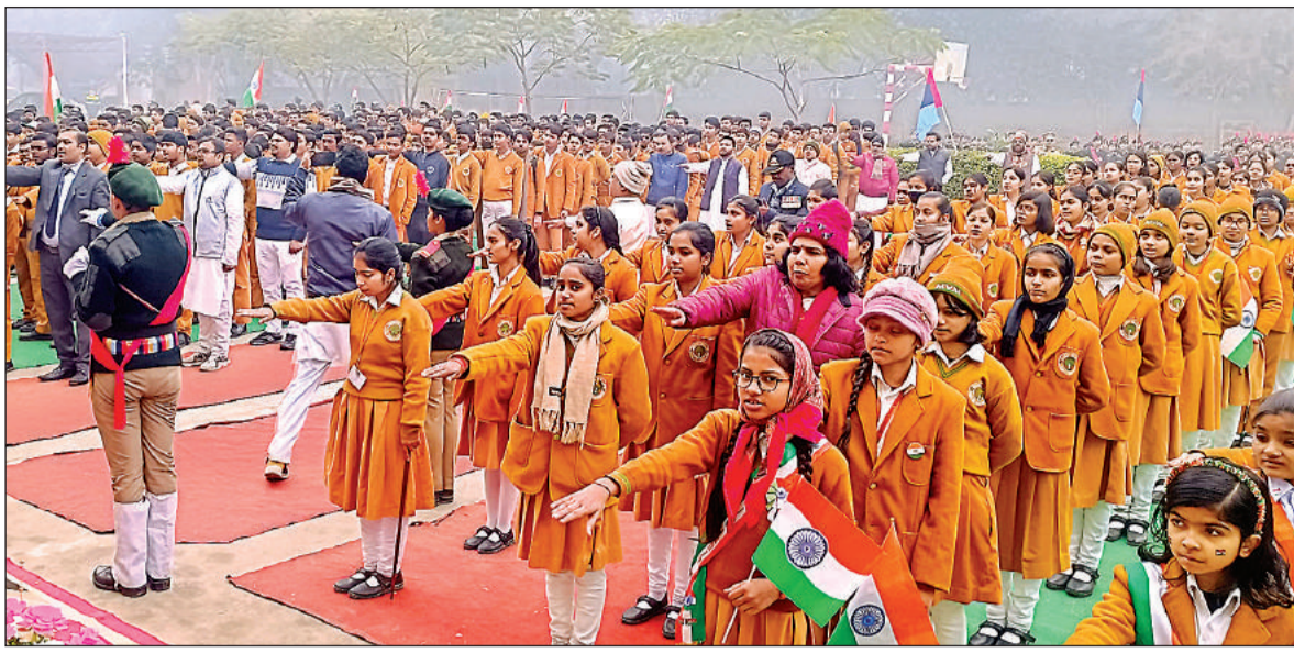
विद्यालय परिसर में सामूहिक रूप से शपथ लेते छात्र-छात्राएं ।