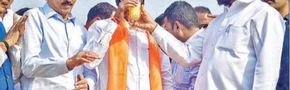
मनोज जरांगे पाटिल को जूस पिलाकर अनशन तुड़वाते सीएम एकनाथ शिंदे।

दरगाह निजामुद्दीन औलिया में कच्चाली का आनंद लेते फ्रांसीसी राष्ट्रपति का वीडियो भी सोशल मीडिया पर खूब वायरल हो रहा है। मैक्रों भारत के 75वें गणतंत्र दिवस में बतौर मुख्य