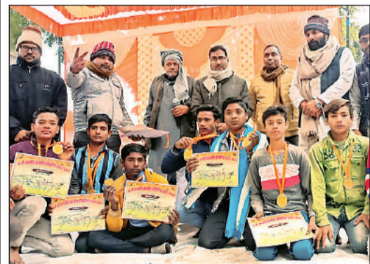
अतिथियों के साथ सम्मानित मेधावी मेडल दिखाते हुए।