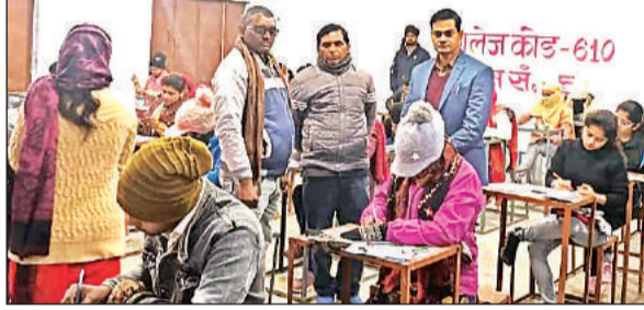
सेमेस्टर परीक्षाओं का निरीक्षण करते उडाका दल।

बुन्देलखण्ड विश्वविद्यालय की विषम सेमेस्टर की परीक्षाएं ऊँ हरिहर स्नातकोत्तर महाविद्यालय में संचालित हो रही है। परीक्षा के दूसरे दिन जिला प्रशासन द्वारा