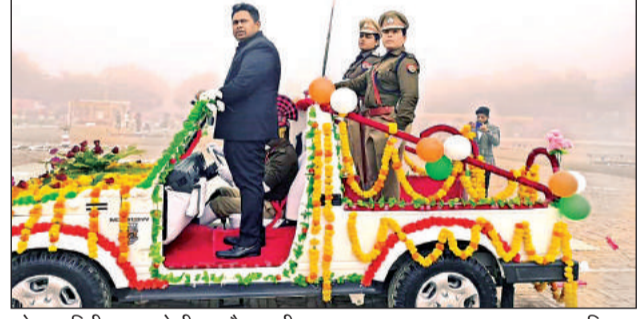
परेड का निरीक्षण करते डीएम और एसपी। अमृत विचार