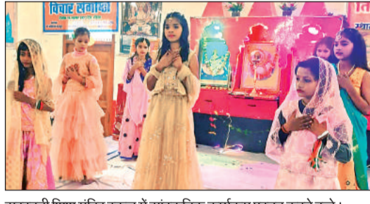
सरस्वती शिशु मंदिर स्कूल में सांस्कृतिक कार्यक्रम प्रस्तुत करते बच्चे।