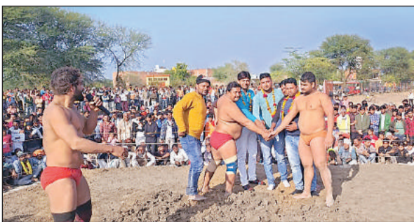
एक-दूसरे से हाथ मिलाकर जोर आजमाइश करते पहलवान।