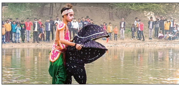
छिमौली गांव में राम केवट संवाद का मंचन करते कलाकार।