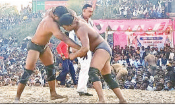
दंगल में दांवपेच दिखाते पहलवान।