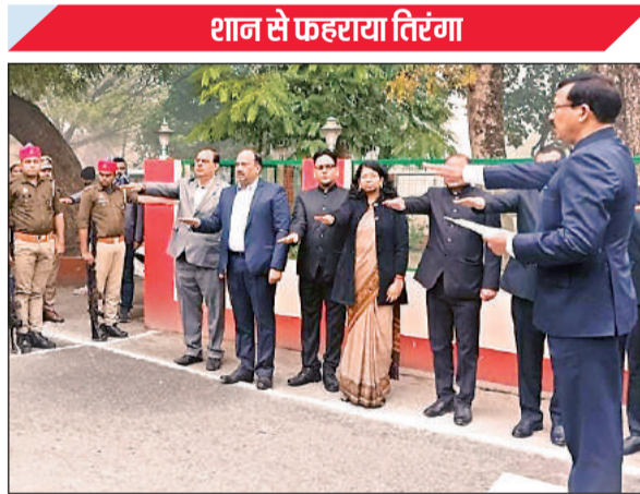
संविधान की शपथ दिलाते डीएम।