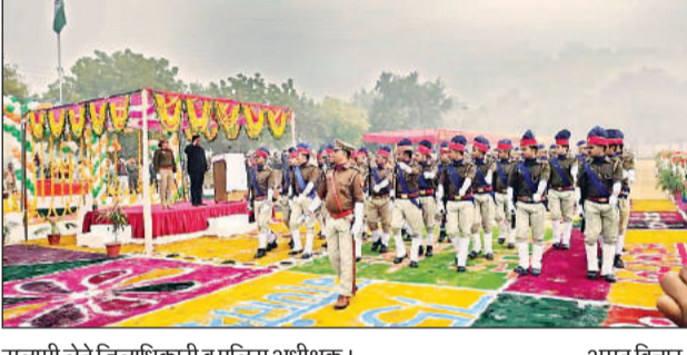
सलामी लेते जिलाधिकारी व पुलिस अधीक्षक। अमृत विचार