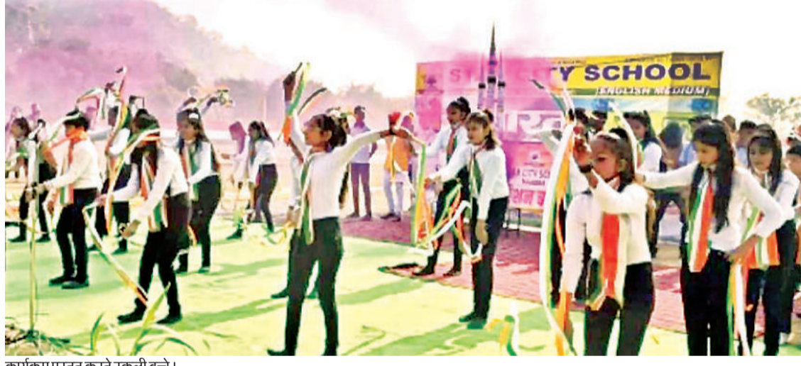
कार्यक्रम प्रस्तुत करते स्कूली बच्चे।