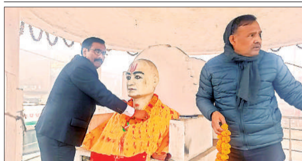
गोस्वामी तुलसीदास की प्रतिमा पर माल्यार्पण करते एसडीएम राजापुर।