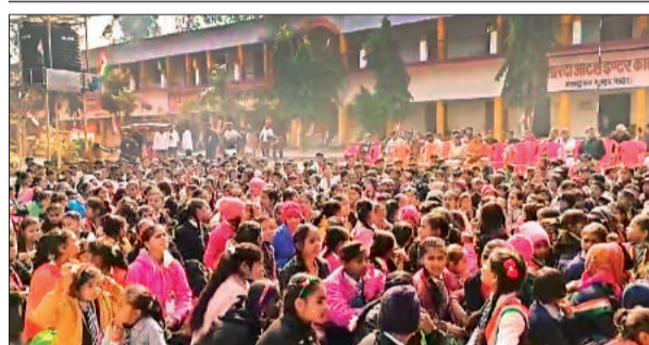
शारदा इंटर कालेज भरतकूप में हुए कार्यक्रम में मौजूद विद्यार्थी।