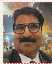
भगत सिंह अभियंता चित्रकूट