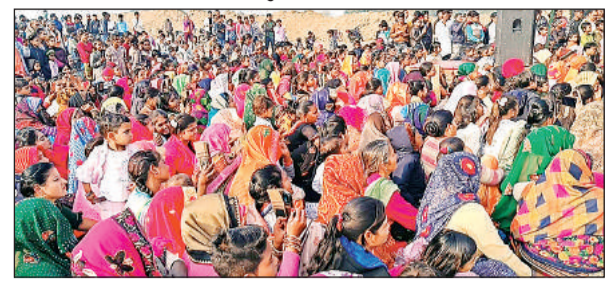
कार्यक्रम को देखने उमड़ी ग्रामीणों की भीड़।

जगह-जगह रामलीला का आयोजन किया जाता है। लेकिन क्षेत्र में ऐसा मंचन जो काल्पनिक न होकर असल होता है जिसे देखने के लिए हजारों लोगों का हजूम नदी के दोनों ओर उमड़ पड़ा।