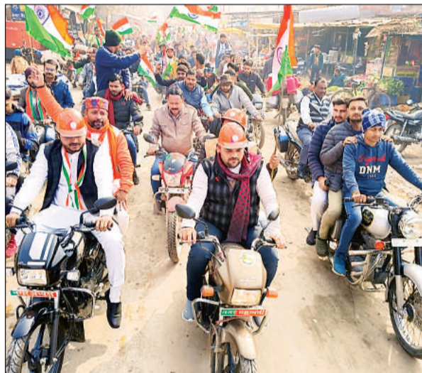
कालपी में तिरंगा यात्रा में शामिल भाजपाई।