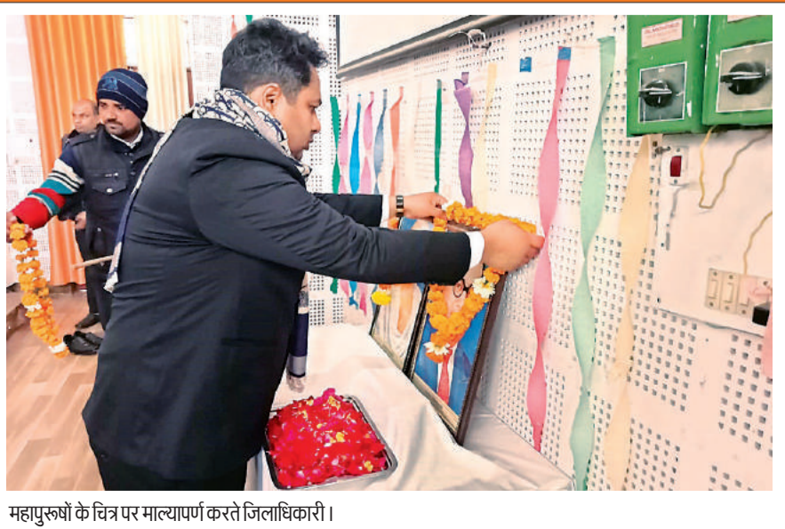
महापुरुषों के चित्र पर माल्यार्पण करते जिलाधिकारी।