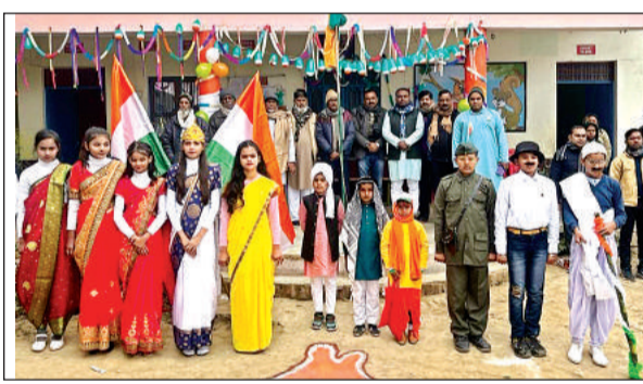
बच्चों द्वारा प्रस्तुत की गई झाकियां ।

झाकियों ने मोह लिया मन खगा। गणतंत्र दिवस पर खखरेर नगर के क्षेत्रीय विद्यालय व सामुदायिक स्वास्थ्य केंद्र सहित सभी कार्यालय में झंडारोहण किया गया। इस बीच तिरंगा फहराने के साथ विद्यालयों में सांस्कृतिक कार्यक्रम एवं झाकियों नगर पंचायत खखरेर में निकाली गई। नेशनल पब्लिक स्कूल के बच्चों द्वारा महात्मा गांधी, सुभाष चंद्र बोस आदि झाकियों तथा थाना अध्यक्ष ने पब्लिक नेशनल स्कूल के छात्रों द्वारा सलामी भी दी गई। पंडित जगहराल इंटर कॉलेज खखरेर, आदर्श नाल विद्यालय जूनियर हाई स्कूल खखरेर, विद्यालय सितलपुर सरस्वती ज्ञान मंदिर खखरेर में नाटक एवं सांस्कृतिक कार्यक्रम प्रस्तुत किया गया।