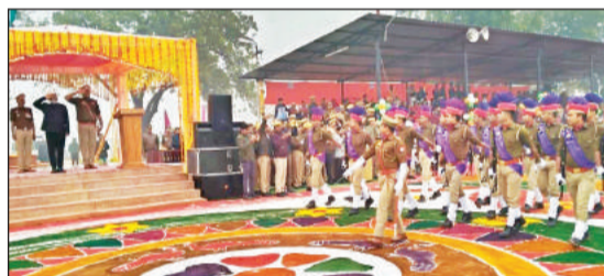
पुलिस परेड की सलामी लेते प्रदेश के जल शक्ति मंत्री स्वतंत्रदेव सिंह।