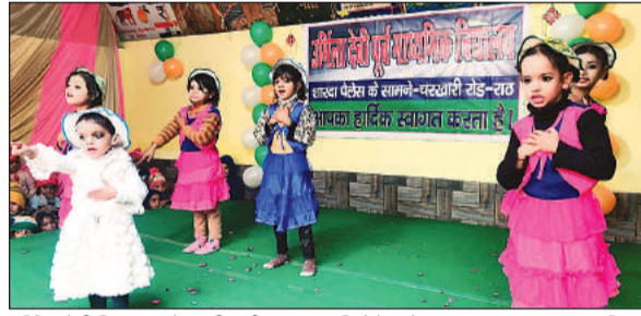
उर्मिला देवी विद्यालय में राष्ट्रीय गीत पर प्रस्तुति देते बच्चे।