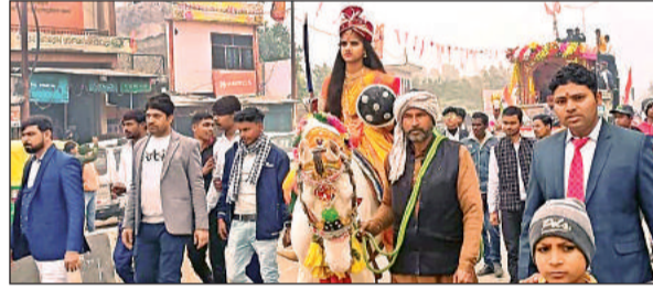
कुरारा कश्मे में रैली निकालते इंटर कॉलेज के छात्र-छात्राएं।