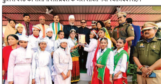
कार्यक्रम के लिए बच्चों को सम्मानित करते जल शक्ति मंत्री स्वतंत्रदेव सिंह।