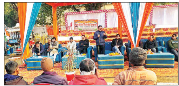
सड़क सुरक्षा संगोष्ठी को संबोधित करते एआरटीओ।