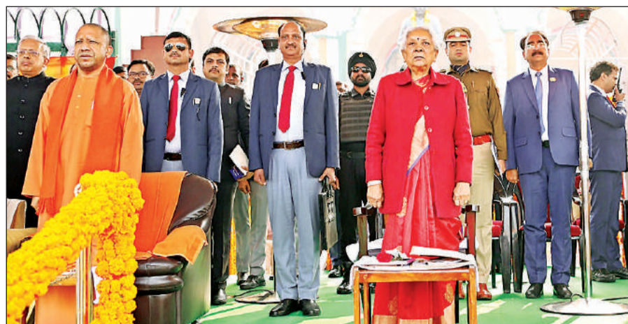
राजधानी में गणतंत्र दिवस परेड कार्यक्रम में राष्ट्रगान के दौरान राज्यपाल आनंदीबेन पटेल, मुख्यमंत्री योगी व अन्य।

बेन पटेल ने विधानभवन पर तिरंगा फहराया। इस दौरान मुख्यमंत्री योगी आदित्यनाथ भी मौजूद रहे। वहीं भारतीय सेना और प्रदेश की सुरक्षा में तैनात विभिन्न सुरक्षा बलों द्वारा राज्यपाल के समक्ष परेड कर सलामी दी गई। विभिन्न स्कूलों के बच्चों ने सांस्कृतिक कार्यक्रमों की प्रस्तुतियां दीं। महिला होमागार्ड्स के मोटरसाइकिल दस्ते ने भी साहसिक प्रदर्शन किया। साथ ही फायर ब्रिगेड और डायल 112 ने भी परेड में अपने दम-खम