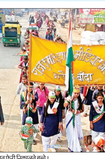
नरैनी में प्रभात फेरी निकालते बच्चों।