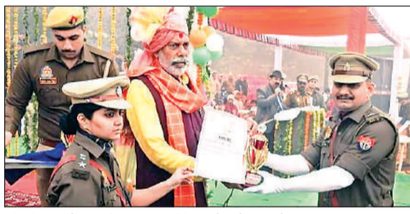
परेड में उपनिरीक्षक को प्रशस्ति पत्र देते प्रभारी मंत्री व एसपी।