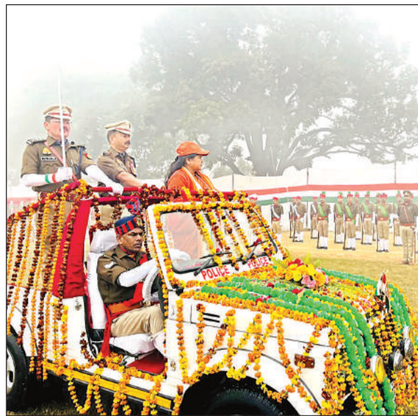
पुलिस लाइन में परेड की सलामी लेतीं केंद्रीय राज्य मंत्री साध्वी निरंजन ज्योति ।