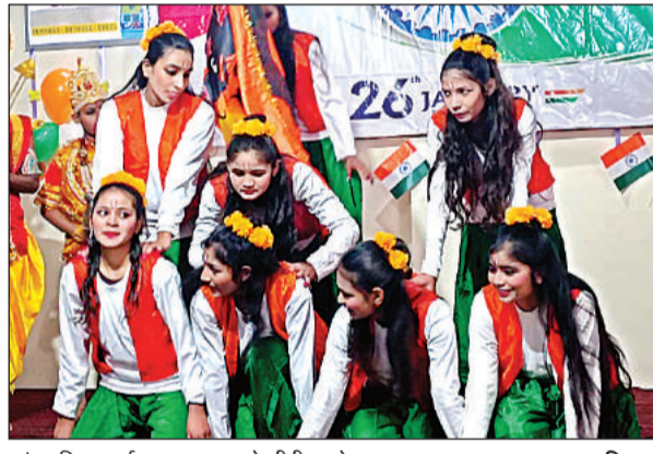
सांस्कृतिक कार्यक्रम प्रस्तुत करते सीपीएस के छात्र ।