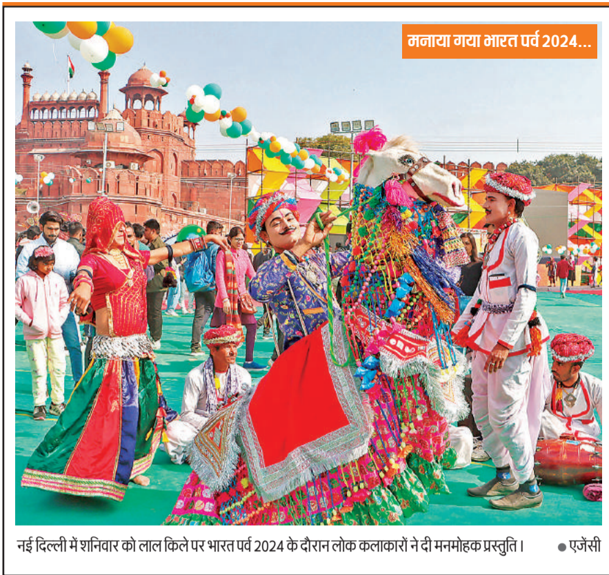
नई दिल्ली में शनिवार को लाल किले पर भारत पर्व 2024 के दौरान लोक कलाकारों ने दी मनमोहक प्रस्तुति।

राष्ट्र, एक विधान मंच' के बारे में बात की थी। मुझे खुशी है कि हमारी संसद और राज्य विधानसभाएं अब ई-विधान और डिजिटल संसद मंचों के माध्यम से इस लक्ष्य पर काम कर रही हैं। 'एक राष्ट्र, एक विधान मंच' परियोजना का उद्देश्य सभी विधानमंडलों को कार्यवाही को एक ही डिजिटल मंच पर उपलब्ध कराना है। प्रधानमंत्री ने जोर देकर कहा कि विधायिका की छवि उसके सदस्यों के आचरण पर निर्भर करती है। मोदी ने कहा-एक समय था जब सदन में अगर कोई सदस्य नियम तोड़ता था और उसके खिलाफ कार्रवाई होती थी तब वह गलती को न दोहराए।