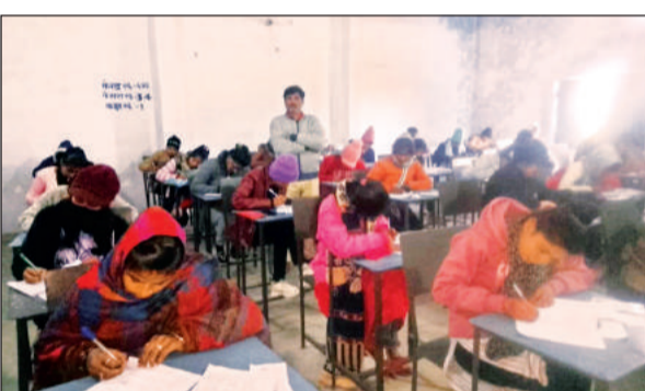
परीक्षा देते परीक्षार्थी। अमृत विचार

अमृत विचार। बुंदेलखंड विश्वविद्यालय झांसी द्वारा संपादित एनईपी सेमेस्टर परीक्षाएं दूसरे दिन भी शांतिपूर्ण ढंग से संपन्न हुई। इस टिटुशन भरी सदी के बाद भी परीक्षार्थियों की उपस्थिति शत प्रतिशत नजर आई। परीक्षा के दौरान परीक्षार्थी खासा उत्साहित दिखाई दिए। बताते चलें कि 25 जनवरी 2024 से बुंदेलखंड विश्वविद्यालय झांसी की एन ई पी सेमेस्टर परीक्षाएं प्रारंभ हो गई हैं। शनिवार को दूसरे दिन परीक्षाएं शांतिपूर्ण ढंग से संपन्न हो गईं। नगर में दो महाविद्यालय जय बुंदेलखंड महाविद्यालय कुलपहाड़ एवं श्री किशोर गोस्वामी महाविद्यालय को परीक्षा केंद्र बनाया गया है। जय बुंदेलखंड