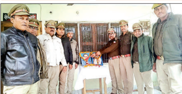
महापुरुषों के चित्र पर माल्यार्पण करते क्षेत्रीय वन अधिकारी व कर्मचारी ।

पुलिस लाइन के मैदान में लोगों में दिखा उत्साह