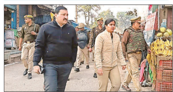
मौदहा कश्मे के पलेग मार्च करते डीएम व एसपी।