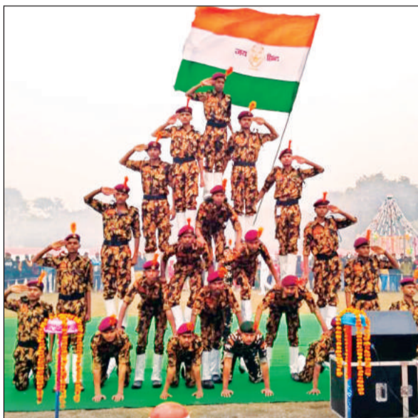
पुलिस लाइन में सेना की वर्दी में तिरंगे को सलामी देते स्कूली छात्र।