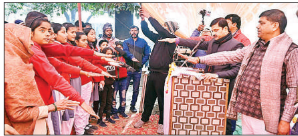
पंचप्रण की शपथ लेते जिलाध्यक्ष व मौजूद अन्य लोग।