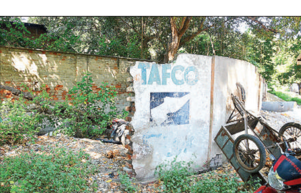
टैपको के पास से टनल निकालने की योजना है।

अमृत विचार। ट्रांसगंगा सिटी से वीआईपी रोड तक गंगा नदी पर पुल बनाने के बजाय टनल बनाने की योजना पर सेतु निगम एक कदम और आगे बढ़ गया है। निगम ने गुड़गांव की कंसल्टेंट कंपनी को चयनित कर लिया है। पांच सदस्यीय कंसल्टेंट टीम अगले हफ्ते शहर आकर टनल निर्माण के लिए स्थल चयन का सर्वेक्षण करेगी। उग्र सेतु निर्माण निगम सर्वे रिपोर्ट मंडलायुक्त और डीएम को सौंपेगा। इसके बाद गंगा में करीब दो किलोमीटर लंबी टनल बनाने की योजना पर मुहर लागेगी और विस्तृत प्रस्ताव बनाकर शासन को भेजा जाएगा। वहां से हरी झंडी मिलने पर डीपीआर तैयार की जाएगी।