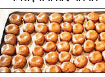
रामलला के राग-भोग के लिए मिष्ठान तैयार करने के लिए पकाया जा रहा दूध व मिष्ठान।

70 वर्षों से रामलला के भोग के लिए समर्पित है परिवार