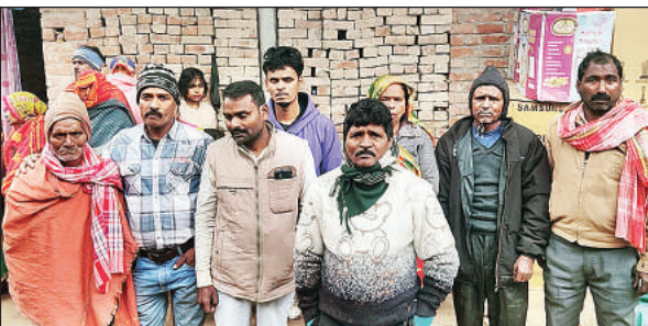
रात भर दूल्हे की तलाश में परेशान रहे जनाती और बाराती।

थाना क्षेत्र के भदोईया मजरे हाशिमपुर भेदपुर गांव के रहने वाले एक व्यक्ति ने अपनी बेटी की शादी फतेहपुर शहर के रेल बाजार निवासी एक युवक के साथ तय की थी। एक वर्ष पूर्व दोनों पक्षों ने विवाह की तारीख तय की थी। बुधवार को युवक दूल्हा बनकर बारातियों के साथ शादी करने के लिए भदोईया गांव पहुंचा। कन्या पक्ष