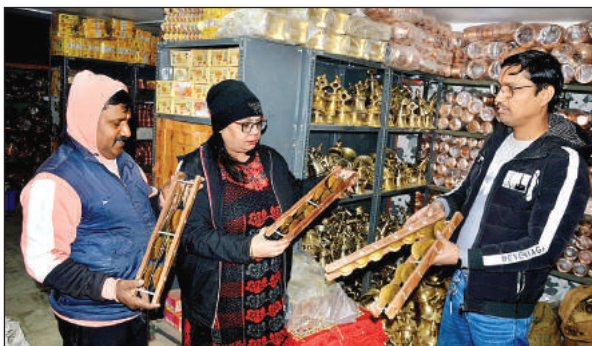
करताल खरीदते लोग।

सबसे अधिक मांग चांदी के राम दरबार की है। इसे देखते हुए सराफा कारोबारियों ने लगभग 12 हजार रुपये कीमत का राम दरबार लांच किया है। इसकी खासियत यह है कि यह देखने में पुरातन काल का लगता है। इसी तरह बाजार में गुरुवार को 'सिल्वर बार' भी लांच किया गया है। इसमें राम मंदिर का श्री-डी मॉडल है। 'सिल्वर बार' तिरछा करने पर आकृति बदलता है। इसमें प्रभु राम धनुष लिए हुए खड़े हैं। 20 ग्राम के इस 'सिल्वर बार' को उपहार में देने के लिए सबसे अधिक खरीदा जा रहा है। पीतल का राम दरबार भी खूब बिक रहा है। इसे लोग अपने घरों के मंदिरों