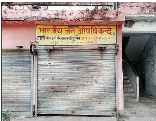
जन औषधि केंद्र में पड़ा ताला।

● चिकित्साधीकष ने कहा कि फार्मासिस्ट बदलते ही नियमित खुलेगा औषधि केंद्र