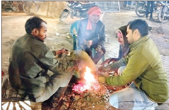
सर्दी से बचने के लिये आग तापते लोग।

जनवरी माह में दिनों दिन पारा लुढ़कता जा रहा है। जिस कारण लोग ठिठुरने को बेबस हैं। बुधवार रात कोहरा छाया रहा। जिसके बाद गुरुवार सुबह मौसम साफ रहा लेकिन बदली छाई रही। वहीं पूरे दिन शीत लहर चलने से हर कोइर ठिठुरता हुआ दिखाई दिया। वहीं दोपहर के समय धूप निकलने से लोगों ने कुछ राहत की सांस ली। वहीं पिछले