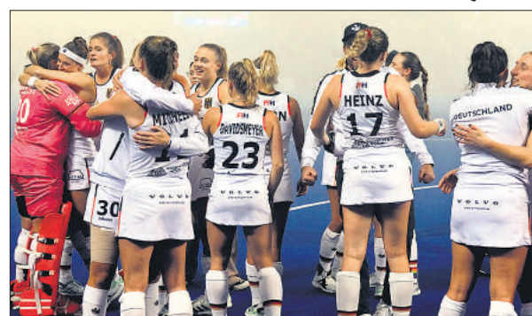
पेनल्टी शूटआउट में जीतने के बाद जश्न मनाते जर्मनी के खिलाड़ी।

भारतीय महिला हॉकी टीम ने गुरुवार को एफआईएच ओलंपिक क्वालीफायर के दूसरे सेमीफाइनल में जुझारू ने जज्बा दिखाया लेकिन पेनल्टी शूटआउट के सबसे अहम चरण में जर्मनी से 3-4 से पराजित हो गई। दोनों टीमों निर्धारित समय में 2-2 की बराबरी पर रहीं, जिससे मैच पेनल्टी शूटआउट में चला गया। इस जीत से जर्मनी ने पेरिस ओलंपिक के लिए अपना टिकट पक्का कर लिया है। भारत के लिए सांत्वना की बात