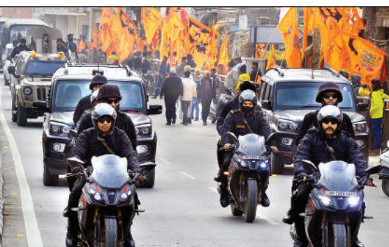
एटीएस के मार्च में कमांडो की अलग-अलग टुकड़ियां शामिल रही।

आवागमन और पहुँच ही नहीं उपलब्ध कराएगा, बल्कि इसी क्यू आर कोड में संबंधित की पूरी कुंडली होगी। स्कैन करते ही यह स्मार्ट इयूटी कार्ड का कोड उनके तैनाती स्थल, टीम लीडर, आवासीय व अन्य व्यवस्था तथा इयूटी प्वाइंट के रुट आदि की जानकारी भी उपलब्ध कराएगा।