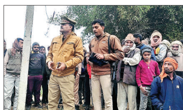
घटनास्थल पर छानबीन करते कोतवाल और ग्रामीणों की भीड़।

ठठिया थाना क्षेत्र की ग्राम पंचायत खामा के मजरा निजामपुर गांव के बाहर 11 हजार वोल्ट की बिजली लाइन गई है। गुरुवार की सुबह ग्रामीणों ने यहां जली हुई पुआल के ढेर के बीच ही एक युवक का बुरी तरह से झुलसा शव पड़ा देखा। सूचना पर पहुंची पुलिस ने शव की शिनाख्त कराई। ग्रामीणों व पुलिस का कहना है कि युवक एचटी लाइन के तार चोरी से काट रहा था। उसी समय घुरा हुई जिससे इसकी