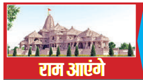
कार्यालय संवाददाता, कानपुर

अमृत विचार। 22 जनवरी को शहर के बाजार अयोध्या की तरह सजेंगे। कन्फेडरेशन ऑफ ऑल इंडिया ट्रेडर्स और उत्तर प्रदेश आदर्श व्यापार मंडल ने सभी प्रमुख बाजारों को राममय करने की तैयारी शुरू कर दी है।