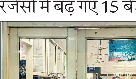
बाल रोग अस्पताल में बना नया आकरिमक वार्ड।