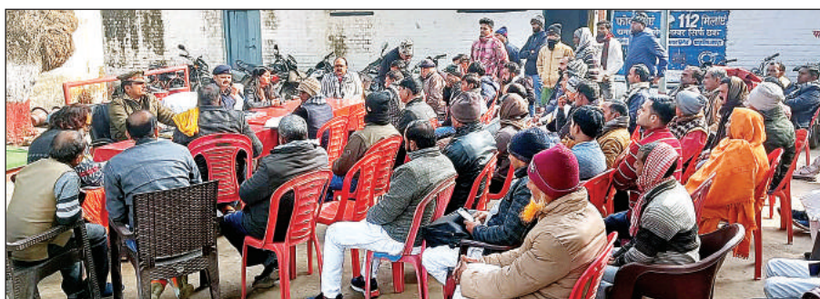
शांति समिति की बैठक में मौजूद अधिकारी व क्षेत्रीय लोग।

बैठक में उपस्थित नगर पंचायत अध्यक्ष प्रतिनिधि, सभासदों, ग्रामप्रधानों को संबोधित करते हुए एसडीएम ने कहा कि शासन के निर्देशों के अनुसार में सभी अपने-अपने क्षेत्रों, गावों में मंदिरों की साफ-सफाई, सजावट करवाएं तथा