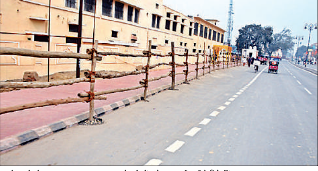
साकेत से लेकर नयाघाट तक सड़क के दोनों ओर लगाई गई बैरिकेडिंग।

आगामी दिनों में अयोध्या में देश-विदेश से लाखों की संख्या में श्रद्धालुओं के पहुंचने का अनुमान लगाया गया है। इसे देखते हुए राष्ट्रीय व अंतरराष्ट्रीय ब्रांड ने अपना प्रचार करना शुरू कर दिया है। बड़ी-बड़ी होटलों में रामचरितमानस की चौपाइयों के साथ अपने ब्रांड का प्रचार कर रही हैं। इसमें सीमेंट, अगरबत्ती, तेल इत्यादि शामिल हैं।