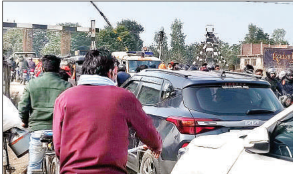
बैराज मार्ग जाम में फंसे वाहन और एम्बुलेंस।

बैराज मार्ग स्थित सरैयां रेलवे क्रासिंग के पास आरओबी का काम होने के कारण दोनों ओर का मार्ग क्षतिग्रस्त हो गया है। इसके साथ ही मार्ग संकरा होने के कारण गुरुवार सुबह से ही जाम लगना शुरू हो गया। वहीं ट्रेनों के आने जाने के दौरान क्रासिंग बंद होने से जाम और तीखा हो गया। इसी तरह दोपहर में भी जाम की स्थिति