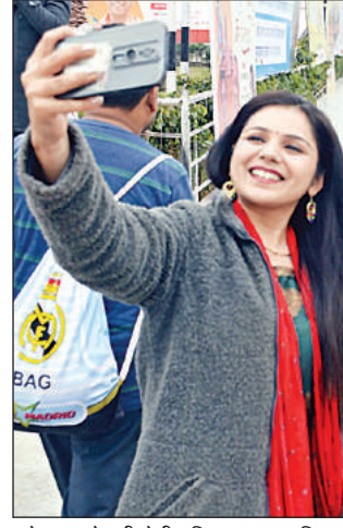
लता चौक पर सेफ्टी लेती महिला।