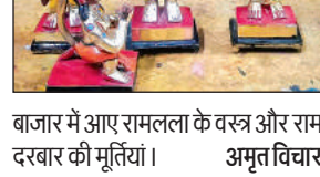
बाजार में आए रामलला के वस्त्र और राम दरबार की मूर्तियां। अमृत विचार