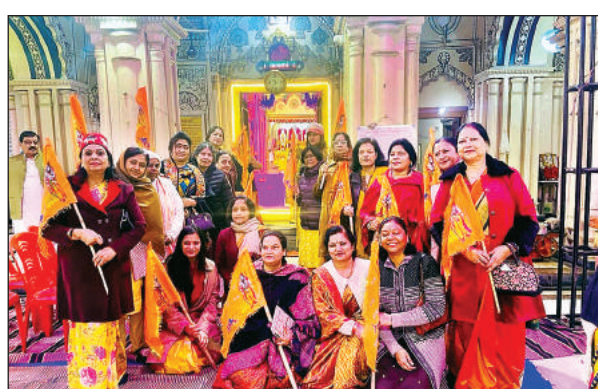
रावतपुर में रामलला मंदिर में हुआ कार्यक्रम।

वीर हनुमान भी सोने की प्रतिमा के रूप में दस्तक दे चुके हैं। चार इंच की वीर हनुमान की आकृति उपहार में देने के लिए लांच की गई है।