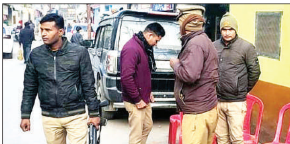
मृतक के घर के बाहर तैनात पुलिसबल।

● अपराध निरीक्षक कर रहे थे विवेचना, कोतवाली प्रभारी को सौंपी गई