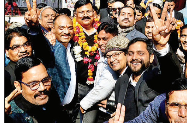
प्रत्याशियों के समर्थकों ने जोरदार नारेबाजी की।