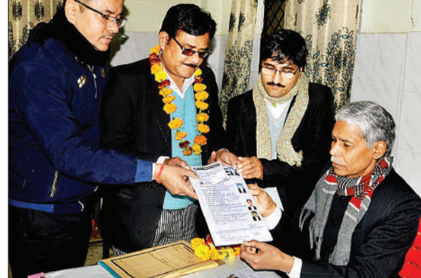
नामांकन दाखिल करते अधिवक्ता।