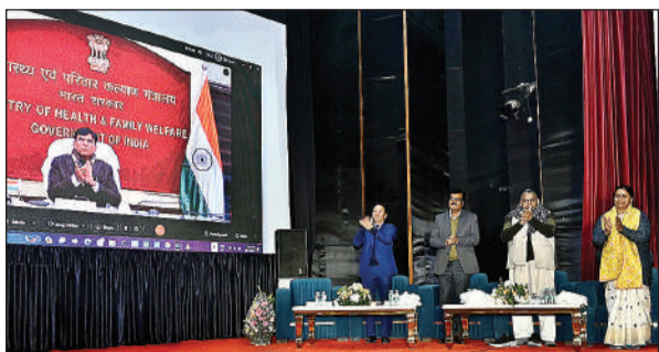
जीएसवीएम पीजीआई का उद्घाटन करते केंद्रीय मंत्री डॉ. मनसुख मांडविया व जीएसवीएम प्राचार्य, सांसद, विधायक व निदेशक।

। गणेश शंकर विद्यार्थी सुपर स्पेशिएलिटी पोस्ट ग्रेजुएट इंस्टीट्यूट ( जीएसवीएसएस पीजीआई) का बुधवार को केंद्रीय स्वास्थ्य एवं परिवार कल्याण मंत्री डॉ.मनसुख मांडविया ने दिल्ली से ऑनलाइन उद्घाटन किया। कानपुर में इस पीजीआई के बनने से आसपास के 17 जिलों के मरीजों को अब गंभीर रोगों के इलाज के लिए लखनऊ, दिल्ली, मुंबई और चेन्नई जैसे बड़े शहरों में नहीं दौड़ना होगा।