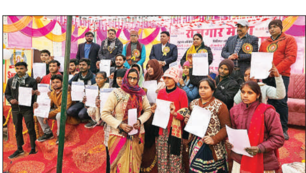
रोजगार मेला में नियुक्ति पत्र के साथ चयनित अभ्यर्थी।