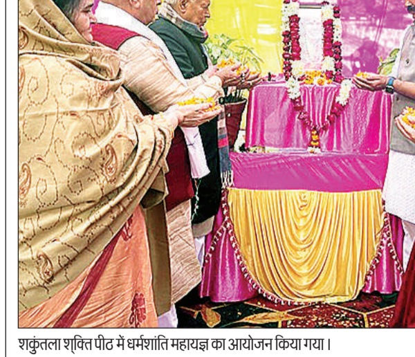
शकुंतला शक्ति पीठ में धर्मशांति महायज्ञ का आयोजन किया गया।

कार्यालय संवाददाता, कानपुर अमृत विचार। बीसीसीआई की कर्नल सीके नायडू ट्रॉफी में यूपी की अंडर 23 टीम ने पुडुचेरी को 19 रनों से हराकर मैच में जीत हासिल की है। लखनऊ के सेंट आनंदराम जैपुरिया मैदान में उत्तर प्रदेश की अंडर-23 टीम ने पांडिचेरी को एक पारी और 19 रन से हराया। टॉस जीतकर उत्तर प्रदेश की टीम ने पहले गेंदबाजी चुनी। पहले बल्लेबाजी करते हुए पुडुचेरी की