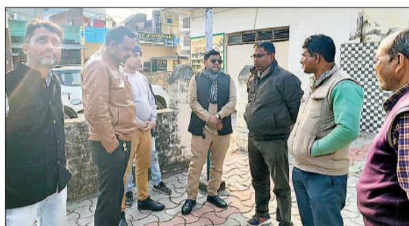
सभासदों ने 22 जनवरी को नगर पालिका कार्यालय खोलने का किया विरोध।