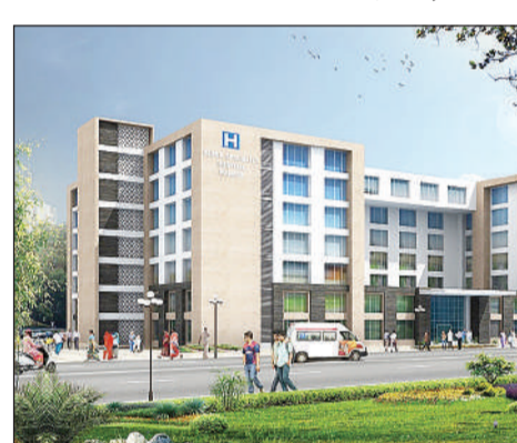
ऐसा बनेगा स्पीच एंड हियरिंग इंस्टीट्यूट।

। कानपुर के सुरार गांव में स्थापित होने वाले ऑल इंडिया इंस्टीट्यूट ऑफ स्पीच एंड हियरिंग की बुधवार को केंद्रीय स्वास्थ्य एवं परिवार कल्याण मंत्री डॉ. मनसुख मांडविया ने वचुअल आधारशिला रखी। संस्थान की स्थापना के लिए मंत्रालय ने 180 करोड़ रुपये मंजूर किए हैं। कर्नाटक में मैसूर के बाद यह देश में दूसरा संस्थान होगा, जहां पढ़ाई के साथ दिव्यांगों के इलाज और प्रशिक्षण की व्यवस्था होगी। बीते एक दशक से इस प्रोजेक्ट को जमीन पर उतारने की कवायद चल रही थी। अब जल्दी ही भवन निर्माण की प्रक्रिया शुरू होगी। वर्ष 2013 में केंद्रीय स्वास्थ्य एवं परिवार कल्याण मंत्रालय ने कानपुर में इंस्टीट्यूट ऑफ स्पीच