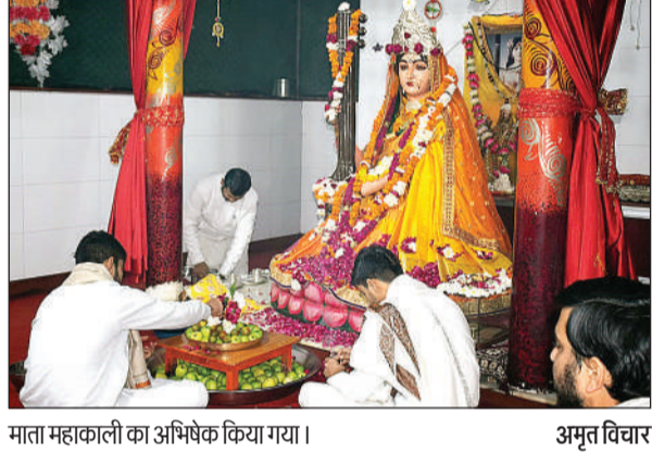
माता महाकाली का अभिषेक किया गया।

आज से गुरु दीक्षा पूर्णिमा महोत्सव का आयोजन कानपुर। श्री करौली शंकर पूर्णज मुक्ति धाम करौली में 25 जनवरी से तीन दिवसीय गुरु दीक्षा पूर्णिमा महोत्सव का आयोजन किया जाएगा। इस महोत्सव में करौली शंकर महादेव महाराज द्वारा पूर्णज की मुक्ति के लिए हवन कराया जाएगा। इस महोत्सव में देश के साथ ही विदेशों से आए भक्त भी हिस्सा लेंगे। करौली शंकर महादेव महाराज का कहना है कि जब हमारे पूर्वजों की मुक्ति होगी तो निश्चित रूप से परिवार में सुख, शांति का वातावरण बनेगा। दुखों से छुटकारा मिलेगा।