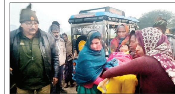
हादसे में घायल महिला को गोद में उठाकर अस्पताल भेजा गया।