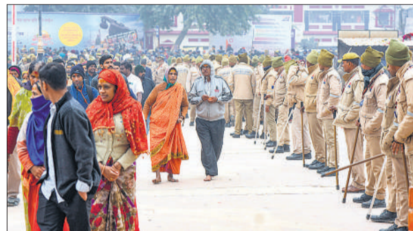
अयोध्या में बुधवार को सुबह ठंड के बीच रामलला के दर्शन को पहुंचे श्रद्धालु।

अमृत विचार : मुख्यमंत्री योगी आदित्यनाथ ने अयोध्याधाम में रामलला के दर्शन को उमड़ रही श्रद्धालुओं की भीड़ को स्वाभाविक बताया है। साथ ही कहा कि, सभी की सुरक्षा, सुविधा व सुगम दर्शन की व्यवस्था करना सरकार का कर्तव्य है। मुख्यमंत्री ने विशिष्ट जनों से उम्मीद की है कि वे अयोध्या आने का कार्यक्रम बनाने से एक सप्ताह पहले स्थानीय प्रशासन, रामजन्मभूमि तीर्थ क्षेत्र न्याय या राज्य सरकार को जानकारी दें। जिससे अयोध्या आने पर उन्हें कोई असुविधा न हो। मुख्यमंत्री ने बुधवार को शासन स्तर के अधिकारियों को आवश्यक निर्देश दिए। इससे पहले उन्होंने मंगलवार को अयोध्या में श्रीरामजन्मभूमि ट्रस्ट के पदाधिकारियों व स्थानीय प्रशासन के साथ परिस्थितियों पर मंथन भी किया था। मुख्यमंत्री के जारी निर्देशों में है कि जो श्रद्धालु दर्शन कर चुके