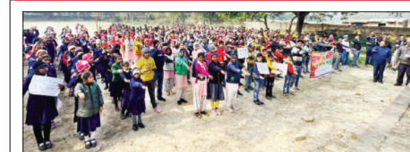
नर्वल में बुधवार को मतदाता जागरूकता रैली निकाली गई।