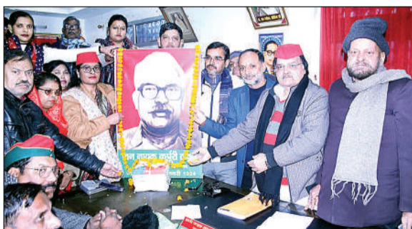
कर्पूरी टाकुर के चित्र पर माल्यार्पण करते सपाईं।

अमृत विचार। बिहार के पूर्व मुख्यमंत्री कर्पूरी टाकुर गरीब, शोषित, पिछड़ों और अल्पसंख्यकों के मसीहा थे। उन्होंने सदैव गरीबों के हितों की रक्षा के लिए लड़ाई की। पिछड़ों की पहचान पूरे देश में कराकर उनके अधिकारों की रक्षा की। उन्होंने अपना पूरा जीवन सादगी व मामूली खर्च में गुजारा। जबकि वह दो बार बिहार के मुख्यमंत्री रहे। यह बात सपा जिलाध्यक्ष फजल महमूद ने कही। नवीन मार्केट स्थित सपा कार्यालय में सपाइयों ने बुधवार को कर्पूरी टाकुर का 100वां जन्मदिवस मनाया। जिलाध्यक्ष हाजी फजल महमूद ने बताया कि कर्पूरी टाकुर लोकतंत्र की सजग प्रहरी, स्वतंत्रता आंदोलन की लड़ाई में अग्रणी भूमिका निभाने वाले और गरीबों व पिछड़ों के मसीहा थे। वह सन् 1981 में कानपुर के नवीन मार्केट