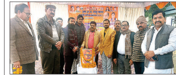
घाटमपुर में कर्पूरी टाकुर की जयंती मनाते सविता समाज के लोग।