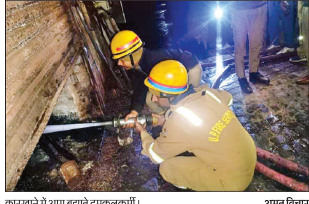
कारखाने में आग बुझाते दमकलकर्मी।

कार्यालय संवाददाता, कानपुर अमृत विचार। चमनगंज थानाक्षेत्र में मंगलवार देर रात आग तापते समय उठी चिंगारी से फर्नीचर से भरे कारखाने में भीषण आग लग गई। दमकल की दो गाड़ियों ने एक घंटे की कड़ी मशक्कत के बाद आग पर काबू पाया। घटना में व्यापारी का लाखों का नुकसान हुआ है। संकरी