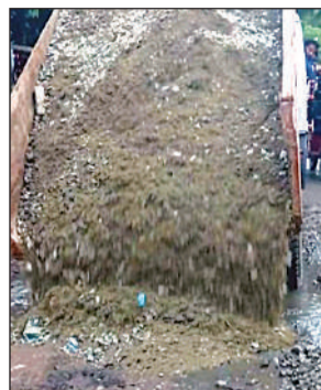
करंही रोड का मौजूदा हाल।

अमृत विचार। मुख्यमंत्री ग्रिड योजना के तहत शहर में पांच सड़कों को 143 करोड़ रुपये से स्मार्ट बनाया जाना है। इसे लेकर नगर निगम ने जलनिगम से पूछताछ की थी, कि इन सड़कों पर पेयजल लाइन डालने या मरम्मत का काम तो नहीं किया जाना है। जलनिगम ने अपनी रिपोर्ट में कहा है कि सभी पांच सड़कों पर कोई भी कार्य प्रस्तावित नहीं है। इस तरह अब इन सड़कों का जल्द निर्माण सुनिश्चित हो गया है।