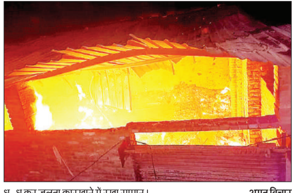
धू-धुंकर जलता कारखाने में रखा सामान।

अलाव की चिंगारी से हुआ हादसा, लाटूश रोड फायर स्टेशन से पहुंची दो दमकल गाड़ियां