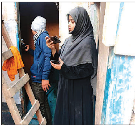
इंडियन आयल की टीम ने किया निरीक्षण।