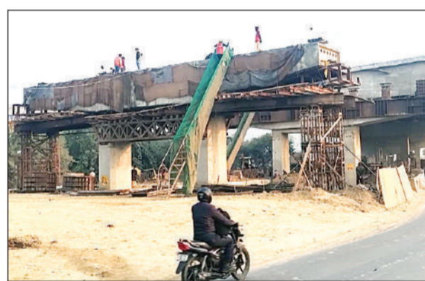
मंघना में बन रहा फ्लाईओवर। अमृत विचार

अमृत विचार। मंघना में रेलवे क्रासिंग पर बनाए जा रहे फ्लाईओवर की बाधा दूर हो गई है। यहां हाईटेशन लाइन की ऊंचाई बढ़ाने की सहमति रेलवे से मिलने के बाद एनएचआई ने पुनः काम शुरू कर दिया है। अब लक्ष्य रखा गया है कि 31 मार्च तक इसका निर्माण पूरा कर लिया जाएगा। कानपुर से अलीगढ़ तक जीटी रोड का निर्माण हो गया है। सिर्फ मंघना में जीटी रोड पर मंघना-बिटूर रेलवे क्रासिंग पर फ्लाईओवर का निर्माण शेष है। इस फ्लाईओवर के बन जाने के बाद लोग फर्रटा भर सकेंगे। अभी मंघना के पहले लोगों को जीटी रोड की पुरानी रोड से जाना