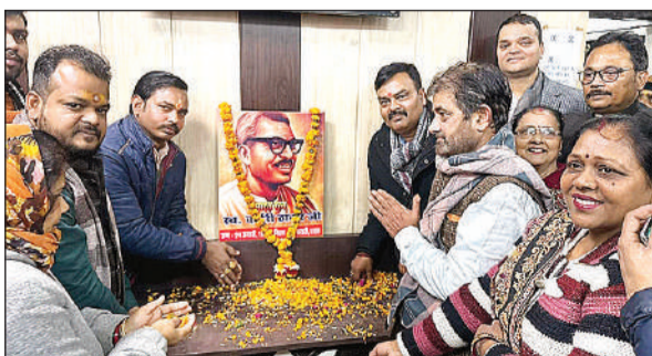
भाजपा ने भी कर्पूरी टाकुर को नमन किया।