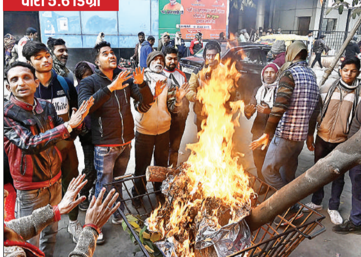
धूप चमकने पर भी दिन में अलाव तापकर ठिठुरन मिटते रहे लोग।