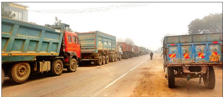
बुधवार को हमीरपुर हाईवे पर भीषण जाम लगा रहा, जिससे वाहन सवार जूझते रहे।

अमृत विचार: बुधवार को सुबह घना कोहरा और शीतलहर के बीच हमीरपुर हाईवे का सफर मुसीबत भरा रहा। नौबस्ता से बिधनू तक एक लेन का ट्रैफिक पूरी तरह जाम रहा। 10 किलोमीटर लंबे जाम में पांच घंटे तक वाहन सवार जूझते रहे, मगर कहीं भी पुलिस नजर नहीं आई। इस जाम की वजह से बीएसपी के परीक्षार्थियों को जूझना पड़ा। सुबह पांच बजे से लगा जाम पूर्वाह्न 11 बजे खुल सका। बुधवार की शुरुआत घने कोहरे के साथ हुई। कोहरे के कारण जैसे भी रात से ही वाहन रेंग-रेंग कर चल रहे थे। दृश्यता इतनी कम थी कि 10 फीट दूर के वाहन साफ नहीं दिख रहे थे। सुबह करीब पांच बजे हमीरपुर हाईवे पर जाम लगना शुरू हुआ। नौबस्ता से शुरू हुआ जाम