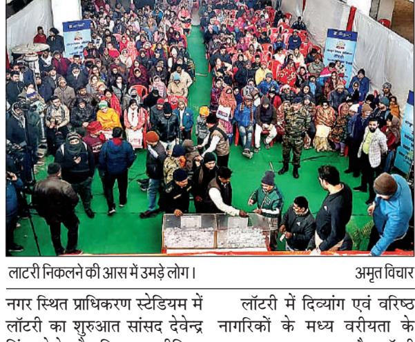
लॉटरी निकलने की आस में उमड़े लोग। अमृत विचार

अमृत विचार। केडीए ने बुधवार को प्रधानमंत्री आवास योजना (शहरी) के अन्तर्गत शताब्दी नगर योजना में निर्मित किये जा रहे 1152 भवनों को लॉटरी के माध्यम से बांट दिया। इन भवनों के लिये कुल 4663 पात्र आवेदकों को चयनित किया था। इस दौरान आवास पाकर कोई खुशी से चहक उठा तो आवास न मिलने पर आधे से ज्यादा आवेदकों के हाथ निराशा लगी। अब 27 जनवरी को जवाहर पुरम योजना की लॉटरी होगी। केडीए सचिव शत्रोहन वैश्य ने बताया कि दुर्बल आय वर्ग के लोग लाभान्वित ह्ये हैं। शताब्दी