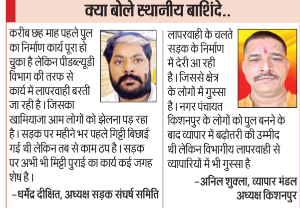
व्या बोले स्थानीय बाशिंदे..

बना हुआ है। ज्ञात हो कि पुल का निर्माण कार्य सन् 2016 में शुरू किया गया था। जिसमें लोक निर्माण विभाग की सुस्ती के चलते करीब छह साल लग गए। किसी प्रकार से जैसे तैसे कर पुल का निर्माण कार्य