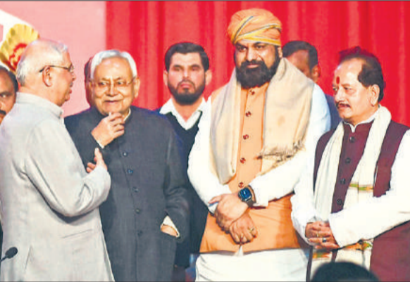
पटना: बिहार के राज्यपाल राजेंद्र आलेंकर, नव-शपथ ग्रहण करने वाले मुख्यमंत्री नीतीश कुमार, उप मुख्यमंत्री सम्राट चौधरी और विजय कुमार सिन्हा।