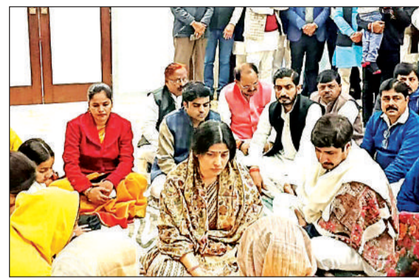
बुराज नगर में शोक जताती सांसद मैनपुरी डिंपल यादव।