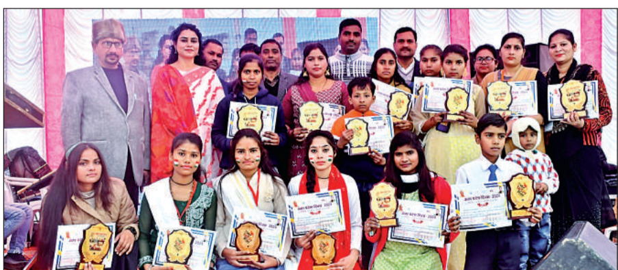
सांस्कृतिक कार्यक्रमों में शानदार प्रदर्शन करने वाली छात्राएं प्रमाण पत्र के साथ।