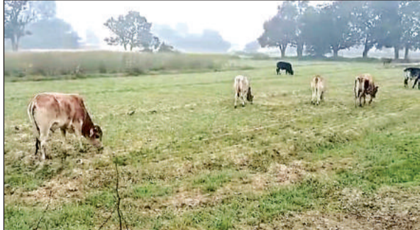
खेत में फसल चरते अन्ना गोवंश।