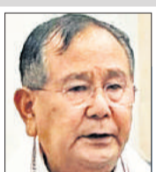
डॉ. राजकुमार रंजन सिंह विदेश व शिक्षा राज्य मंत्री

समय की पाबंदी: परीक्षाओं में अक्सर समय की कमी होती है, जो उन छात्रों के लिए बुरा हो सकता है जो तनाव में काम करने के अभ्यस्त नहीं हैं। वास्तव में छात्र अपनी सफलता की उम्मीदों, अपने माता-पिता और शिक्षकों की अपेक्षाओं के कारण शैक्षणिक तनाव का अनुभव करते हैं। यह सफाई कि माता-पिता की अपने बच्चों से परीक्षाओं में अच्छा प्रदर्शन करने को लेकर अपेक्षाएं होती हैं। इससे उन पर दबाव पड़ता है। हालांकि यह कहा जाता है कि परीक्षा से होने वाला थोड़ा तनाव कुछ हद सकारात्मक और कारगर भी होता है क्योंकि यह परीक्षा से पहले बच्चों को सावधानी और सतर्कता बरतने को प्रेरित करता है। परीक्षा के दौरान बच्चों से अधिक उम्मीदें रखना परीक्षा के तनाव/दबाव और खराब प्रदर्शन का आधार बन सकता है। आमतौर पर यह माना जाता है कि माता-पिता अपने बच्चों के ज्ञानात्मक, व्यावहारिक, भावनात्मक और सामाजिक विकास में महत्वपूर्ण भूमिका निभाते हैं। अपनी भूमिका में माता-पिता बच्चों को सांस्कृतिक और सामाजिक मानदंडों और समाज के मूल्यों से परिचित कराते हैं। इसका उद्देश्य उन्हें समाज की जरूरतों को पूरा करने के साथ-साथ भविष्य के लिए तैयार करना है। बच्चों पर शैक्षणिक आकांक्षाओं के सकारात्मक या नकारात्मक प्रभाव का मार्गदर्शन और प्रबंधन करने में माता-पिता की भी महत्वपूर्ण भूमिका होती है। माता-पिता कुछ शारीरिक, सामाजिक, व्यावहारिक और मनोवैज्ञानिक चीजों को पहचानकर अपने बच्चों को परीक्षा के दबाव से निपटने में मदद कर सकते हैं। बच्चों में परीक्षा के तनाव के लक्षणों को पहचानना और संभव है कि युवा लोग परीक्षा के दबाव और तनाव पर चर्चा करने में सहज महसूस नहीं करेंगे, लेकिन माता-पिता अपने बच्चों में तनाव के किसी भी लक्षण