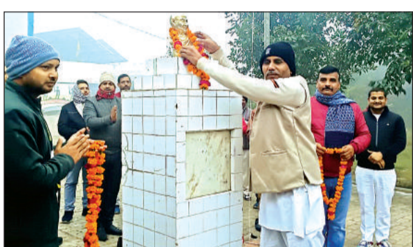
शिवली में गांधी जी की प्रतिमा पर मल्यार्पण करते वेयरमैन।