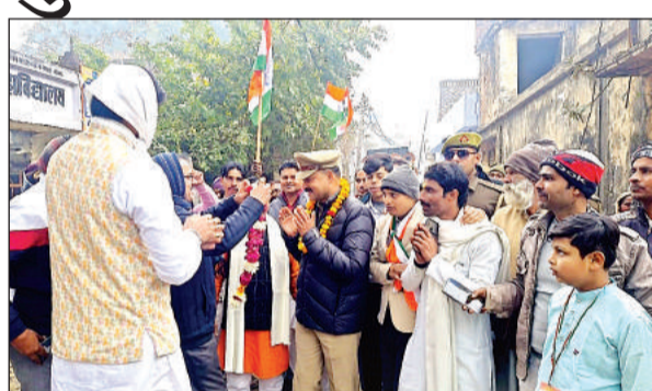
मूसानगर में तिरंगा यात्रा निकालते कोतवाल।