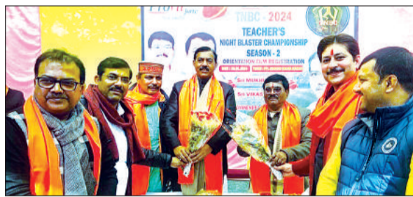
टूर्नामेंट की तैयारियों को लेकर जानकारी देते आयोजक।