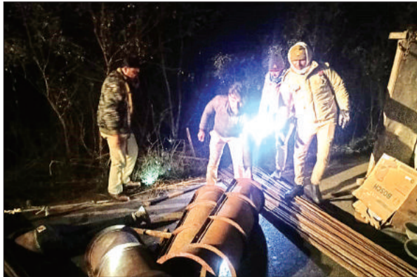
मौके पर राहत कार्य में जुटे पुलिस कर्मचारी।

पुलिस ने दो जेसीबी मंगवाकर पलट्टे हुए ट्रैक्टर व सरिया को हटवाकर तकरीबन आधा घंटे में सरिया के नीचे दबे युवक को निकालवा पाया, तब तक उसकी मौत हो चुकी थी। थाना क्षेत्र के अंदावा में पानी की टंकी के निर्माण कार्य चल रहा है।