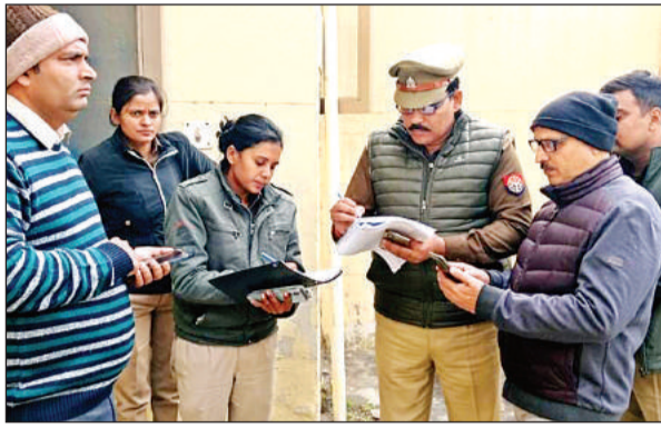
घटनास्थल पर जांच करती पुलिस।