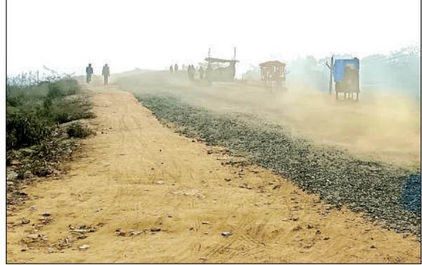
सड़क पर पड़ी गिट्टी व उससे उड़ती हुई धूल।

अमृत विचार। कस्बे को बांदा जनपद से जोड़ने वाले नव निर्मित दादों पुल के मार्ग में महीने भर पूर्व गिट्टी डालकर भूल गये हैं। टेकेदार की लापरवाही से राहगीरों को भारी समस्या हो रही है। रास्ते से उड़ती धूल लोगों के लिए आफत बनी हुई है।