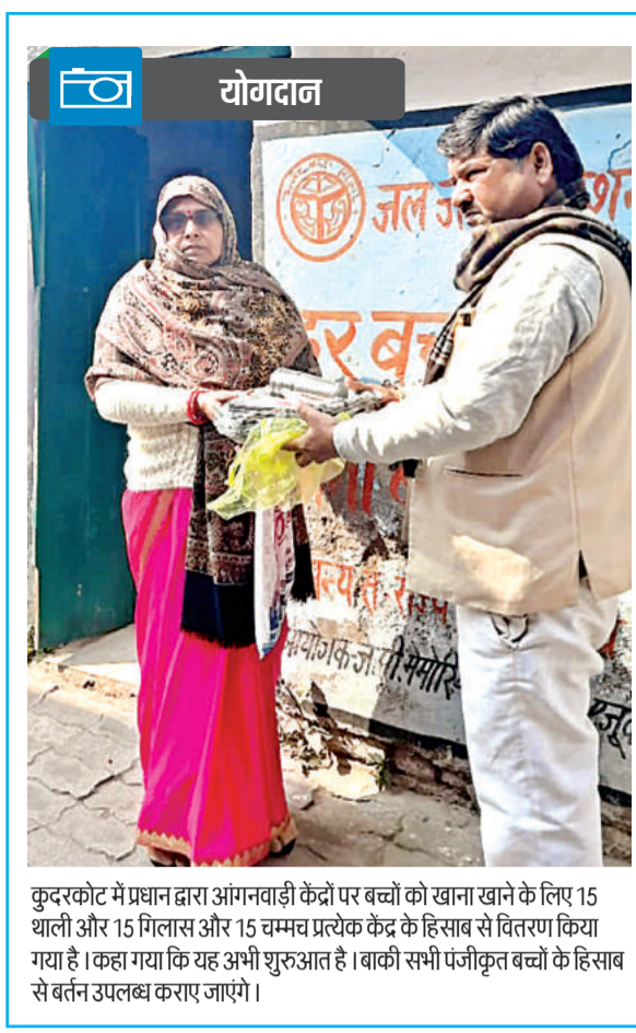
कुदरकोट में प्रधान द्वारा आंगनवाड़ी केंद्रों पर बच्चों को खाना खाने के लिए 15 शाली और 15 गिलास और 15 चम्मच प्रत्येक केंद्र के हिसाब से वितरण किया गया है। कहा गया कि यह अभी शुरुआत है। बाकी सभी पंजीकृत बच्चों के हिसाब से बर्तन उपलब्ध कराए जाएंगे।