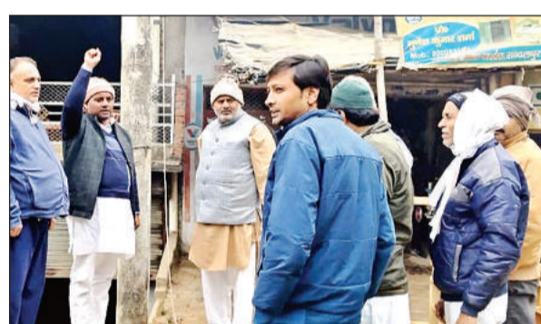
सिकंदरा में झंडारोहण करते व्यापार मंडल के पदाधिकारी।