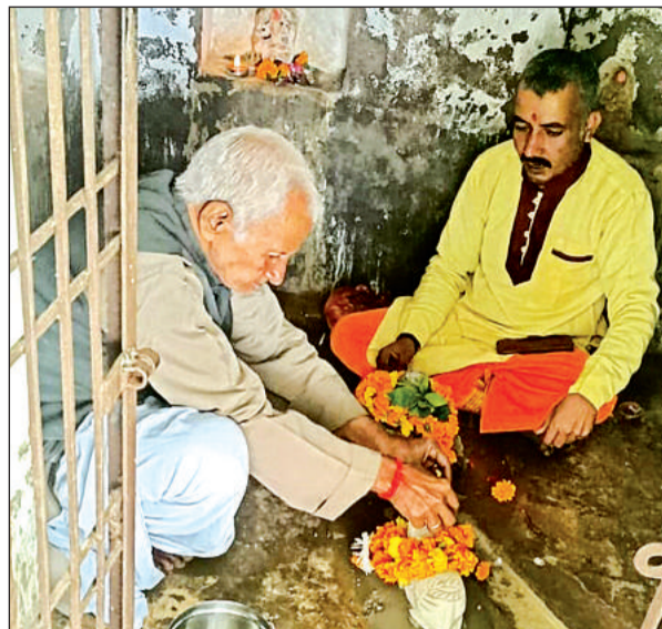
शिवलिंग की स्थापना करते भक्त।

● सराय गांव के दो मंदिरों में चार दिन पहले हुई घटना से आक्रोश