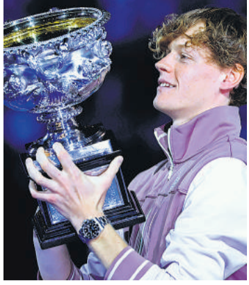
पांच सेट तक चले मैच के साथ ग्रैंडस्लैम के ओपन युग में कोर्ट पर सबसे अधिक समय बिताने का नया रिकॉर्ड बनाया। उन्होंने 2022

यानिक सिनर ने दो सेट से पिछड़ने के बाद शानदार वापसी करते हुए रविवार को ऑस्ट्रेलियन ओपन के फाइनल में दानिल मेदवेदेव को 3-6, 3-6, 6-4, 6-3 से हराकर अपना पहला ग्रैंडस्लैम खिताब जीता है। सेमीफाइनल में उलटफेर कर नोवाक जोकोविच के टूर्नामेंट में लंबे समय से चले आ रहे दबदबे को खत्म करने वाले 22 साल के सिनर पहली बार किसी बड़े टूर फाइनल में खेल रहे थे। वह ऑस्ट्रेलियन ओपन खिताब जीतने वाले इटली के पहले खिलाड़ी हैं। अमेरिकी ओपन 2021 के चैंपियन मेदवेदेव की ग्रैंडस्लैम के 6 फाइनल में यह पांचवां हार है। यानिक सिनर ने टूर्नामेंट के अपने चौथे