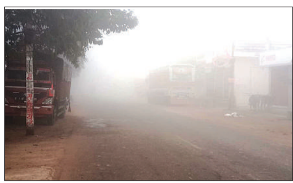
कोहरे के चलते दिन में भी छाई रही धुंध।

अमृत विचार। कोहरे के साथ गलनभरी सर्दी से बेहाल लोगों के लिए रविवार का दिन राहत भरा रहा। सुबह से निकली धूप के गुनगुनेपन ने लोगों को काफी राहत दी। हालांकि टंडी हवाओं की वजह से लोग बेहाल रहे। दिन में धूप निकलने व तापमान सामान्य से डेढ़ डिग्री ऊपर पहुंचने से लोगों को गलन से राहत मिली। हालांकि धूप के बाद भी तेज व टंडी हवाएं राहगीरों को गलन का अहसास कराती रहीं।