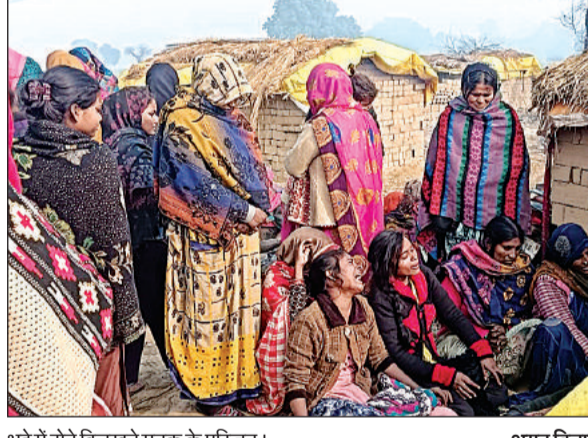
भट्टे में रोते बिलखते मृतक के परिजन।