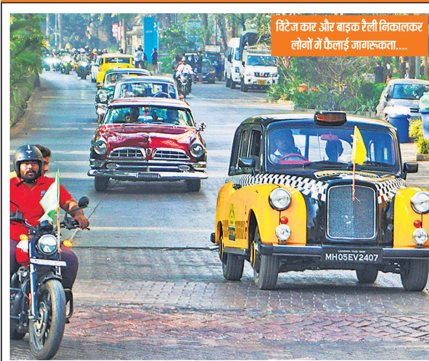
टापे में रविवार को ट्रैफिक नियमों के बारे में जागरूकता पैदा करने के लिए ट्रैफिक पुलिस द्वारा आयोजित विटेंज कार और बाइक रैली में लोगों ने बंद-चढ़कर हिस्सा लिया।

सिलीगुड़ी (पश्चिम बंगाल)। कांग्रेस नेता राहुल गांधी ने रविवार को भारतीय जनता पार्टी (भाजपा) नीत केंद्र सरकार पर देशभर में नफरत और हिंसा फैलाने तथा गरीबों और युवाओं के हितों को नजरअंदाज करके बड़े कॉरपोरेट घरानों के लिए काम करने का आरोप लगाया। गांधी उत्तर बंगाल के सिलीगुड़ी में 'भारत जोड़ो न्याय यात्रा' को संबोधित कर रहे थे। उन्होंने कहा कि केंद्र सरकार ने सशस्त्र बलों के लिए एक अल्पकालिक भर्ती योजना 'अग्निवीर' को शुरू करके उन युवाओं का मखौल उड़ाया है जो सशस्त्र बलों में शामिल होना चाहते थे। उन्होंने कहा-देशभर में नफरत और हिंसा फैलाई जा रही है। इससे कोई फायदा नहीं होगा।