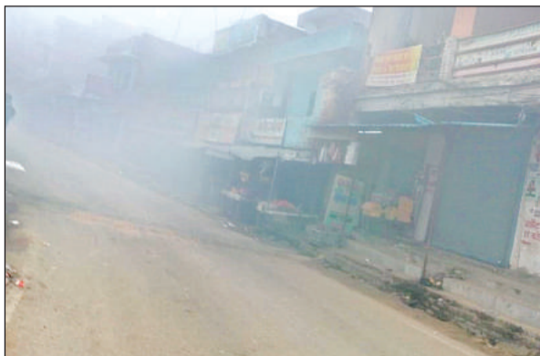
कोहरे के चलते छाई धुंध।

अमृत विचार। जिले में कोहरे के साथ गलनभरी सर्दी से बेहाल लोगों के लिए रविवार का दिन राहत भरा रहा। दिन में निकली चटख धूप के गुनगुनेपन ने लोगों को काफी राहत दी। ठंडी हवा की वजह से लोग बेहाल रहे। दिन में धूप निकलने व तापमान सामान्य से उड़ डिग्री ऊपर पहुंचने से लोगों को गलन से राहत मिली। हालांकि धूप के बाद भी तेज ठंडी हवा राहगीरों को गलन का अहसास कराती रही।