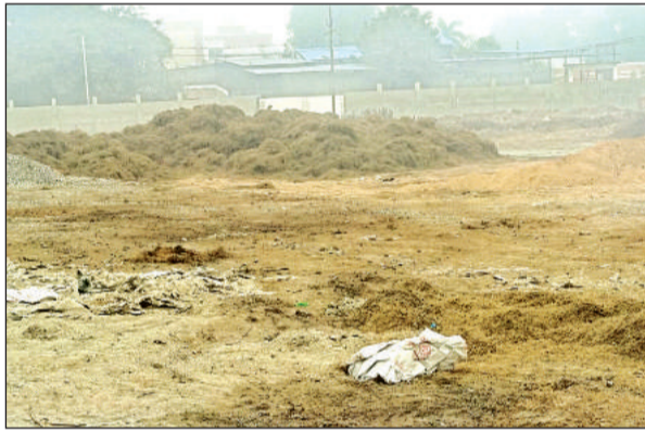
औद्योगिक आस्थान के गंगा पार्क में जमा कचरा।

बता दें कि मकरद्वंदगार में औद्योगिक आस्थान स्थित है, जहां इत्र उद्यमियों के कारखाने हैं। इसके साथ ही कुछ अन्य