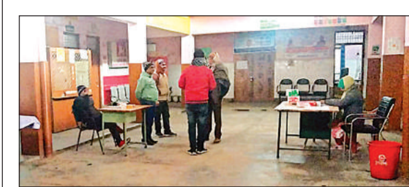
स्वास्थ्य मेले में पसरा सन्नाटा।