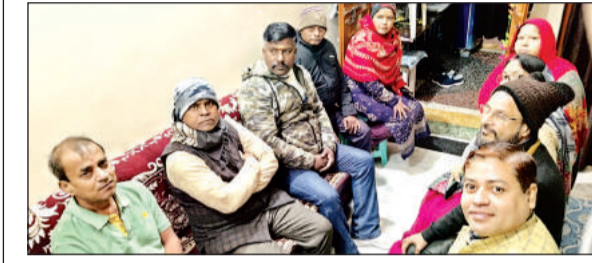
लाइव प्रसारण देख रहे भाजपा नेता।