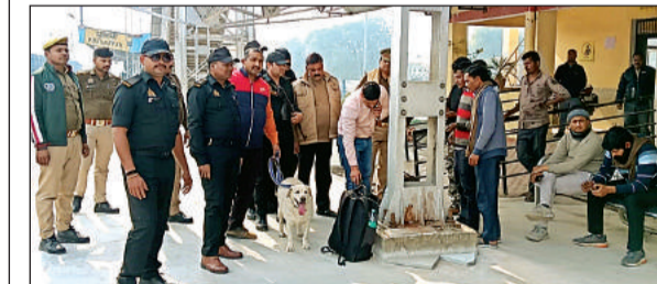
स्टेशन पर चैकिंग करती एसओजी टीम।