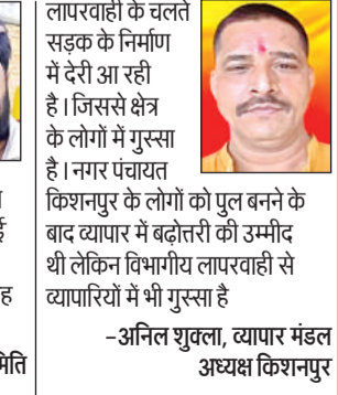
लापरवाही के चलते सड़क के निर्माण में देरी आ रही है। जिससे क्षेत्र के लोगों में गुस्सा है। नगर पंचायत किशनपुर के लोगों को पुल बनने के बाद व्यापार में बढ़ोतरी की उम्मीद थी लेकिन विभागीय लापरवाही से व्यापारियों में भी गुस्सा है

करीब छह माह पहले पुल का निर्माण कार्य पूरा हो चुका है लेकिन पीडब्ल्यूडी विभाग की तरफ से कार्य में लापरवाही बरती जा रही है। जिसका खामियाजा आम लोगों को झेलना पड़ रहा है। सड़क पर महीने भर पहले गिट्टी बिछाई गई थी लेकिन तब से काम ठप है। सड़क पर अभी भी गिट्टी पुराई का कार्य कई जगह शेष है। -धर्मद दीक्षित, अध्यक्ष सड़क संघर्ष समिति