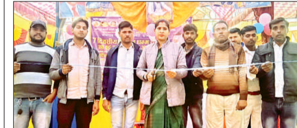
फीता काटकर कथा का उद्घाटन करती पीसीसी सदस्य।