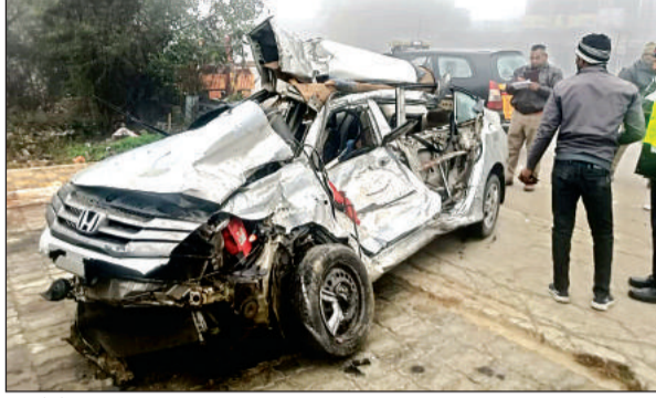
हादसे में क्षतिग्रस्त हुई कार।

आगरा-लखनऊ एक्सप्रेसवे पर तिर्वा कोतवाली क्षेत्र के पंचोर गांव के सामने 18.6 किलोमीटर पर लखनऊ की ओर जा रहा ट्रक हाईवे पर लगे एंगल में टक्कर मारकर उसपर चढ़ गया। हादसे में ट्रक क्षतिग्रस्त हो गया। जिससे आगे नहीं जा सका। वहीं रविवार तड़के बिहार के कारण उनकी कार अनियंत्रित हो गई और खड़े ट्रक में जा चुकी। हादसे में कार क्षतिग्रस्त हो गई। हादसे में दोनों युवक गंभीर रूप से घायल हो गए। सूचना पर पहुंचे यूपीडा कर्मियों ने दोनों को मेडिकल कालेज पहुंचाया। जहां डॉक्टरों ने जांच के बाद दोनों को मृत घोषित कर दिया। पुलिस ने परिजनों को हादसे की सूचना दी है। पुलिस ने शवों को मेडिकल कालेज