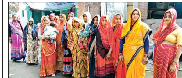
ग्राम प्रधान के घर शिकायत करने पहुंची महिलाएं।