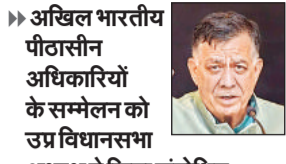
अखिल भारतीय पीठासीन अधिकारियों के सम्मेलन को उप्र विधानसभा अध्यक्ष ने किया संबोधित

अमृत विचार : विधानसभा अध्यक्ष सतीश महाना ने कहा कि सरकारी कामकाज और नीतियों की आलोचना करने का विपक्ष को पूर्ण अधिकार है, पर सदन में औपचारिक अवसरों पर व्यवधान न तो विपक्ष के लिए शोभाजनक माना गया है और न ही इससे लोकतांत्रिक प्रक्रिया मजबूत होती है। विधायिका के सम्मान को नष्ट करने की दिशा में किया गया कोई भी कार्य लोकतंत्र पर घातक प्रहार है। विधानसभा अध्यक्ष मुंबई में आयोजित अखिल भारतीय पीठासीन अधिकारियों के सम्मेलन में 'एजेंडे के बिंदुओं पर चर्चा' पर आयोजित सत्र को संबोधित कर रहे थे।