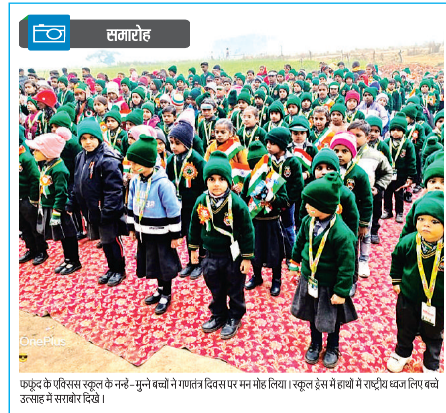
फूड के एक्सिस स्कूल के नन्हें-मुने बच्चों ने गणतंत्र दिवस पर मन मोह लिया। स्कूल ड्रेस में हाथों में राष्ट्रीय ध्वज लिए बच्चे उत्साह में सराबोर दिखे।

दिवस" के उपलक्ष्य में राजभवन झारखण्ड मे एक भव्य आयोजन किया गया था। कार्यक्रम के समापन पर मुख्य अतिथि झारखण्ड के राज्यपाल सीपी राधाकृष्णन ने मुझे उपहार स्वरूप एक शाल एवं स्मृति चिह्न प्रदान कर सम्मानित किया। मेरे लिए यह दूसरा अवसर था जब इस राज्य के राज्यपाल द्वारा यह सम्मान दिया गया।