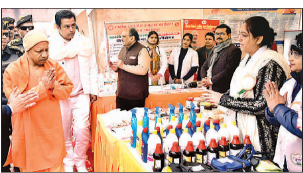
सम्मेलन के दौरान लगी प्रदर्शनी देखते मुख्यमंत्री योगी, साथ में सांसद रवि किशन व अन्य।

अमृत विचार : मुख्यमंत्री योगी आदित्यनाथ ने कहा है कि स्वच्छताकर्मियों को न्यूनतम मानदेय की गारंटी हर हाल में मिलनी चाहिए। सरकार जल्द ही इसे पूरे प्रदेश में सुनिश्चित कराएगी। स्वच्छताकर्मियों के गारंटीड मानदेय के लिए पहले ही एक कमेटी गठित कर रखी गई है और शीघ्र ही इस पर ठोस कदम उठाए जाएंगे। मानदेय के साथ स्वच्छताकर्मियों के लिए आवास और जनकल्याणकारी योजनाओं के लाभ की व्यवस्था भी सुनिश्चित की जाएगी। वे रविवार पूर्वाह्न गोरखपुर नगर निगम की तरफ से अभयनंदन इंटर कॉलेज के मैदान पर आयोजित सफाई