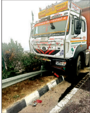
एक्सप्रेसवे पर हादसे का बाद सेप्टी लाइन पारकर लटका ट्रक।

● नोएडा से बिहार घर जा रहे थे दोनों छात्र