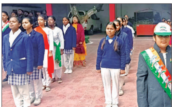
गणतंत्र दिवस पर आयोजित कार्यक्रम के दौरान प्रस्तुति देते स्कूली बच्चे।