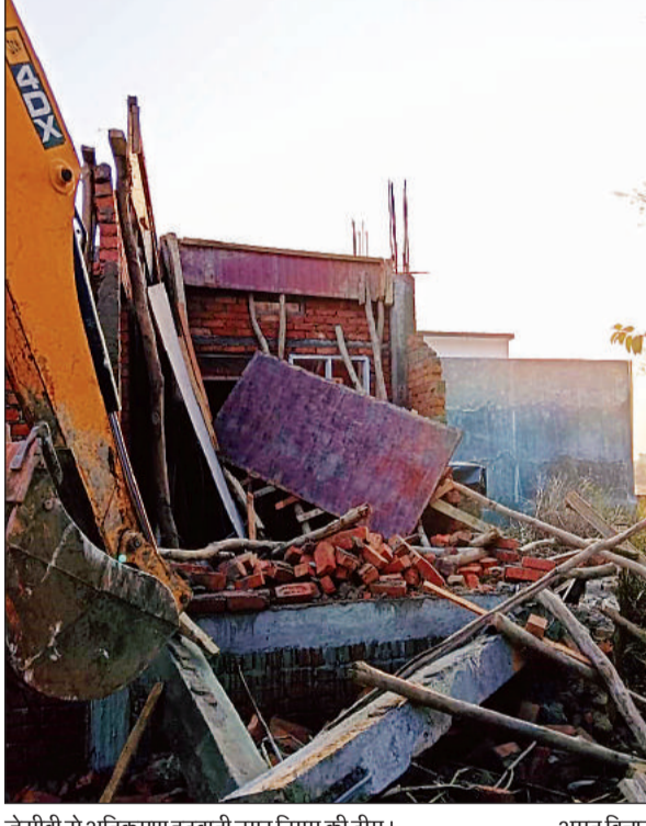
जेसीबी से अतिक्रमण हटवाती नगर निगम की टीम। अमृत विचार

तहसील बीकेटी के ग्राम-बसहा की खसरा संख्या-568 व 516 क्षेत्रफल 3,800 वर्गमीटर व 5,60 वर्गमीटर भूमि पर और ग्राम दसौली की खसरा संख्या 4 क्षेत्रफल 1,140 वर्गमीटर खसरा संख्या 27 क्षेत्रफल 1,360 वर्गमीटर नाला व रास्ते की जमीन पर स्थानीय लोगों ने अवैध कब्जा कर लिया था। तहसील के राजस्व निरीक्षक व लेखपाल और नगर निगम के लेखपाल देशराज व क्षेत्रीय पुलिस बल के सहयोग से अतिक्रमण हटवाया गया। उक्त दोनों भूमि का बाजार मूल्य लगभग 2.30 करोड़ रुपये है।