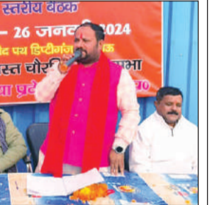
जन चेतना रथ को लेकर जानकारी देते चौरसिया समाज के पदाधिकारी।