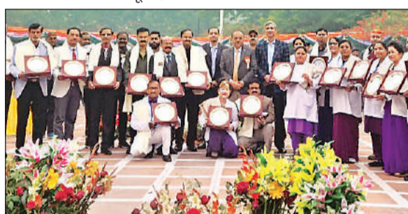
गणतंत्र दिवस पर सम्मानित होने वाले डॉक्टर व कर्मचारी। अमृत विचार