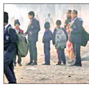
शीतलहर और ठंड के कारण जिलाधिकारी ने दिया आदेश

डीएम ने आदेश दिया है कि विद्यार्थियों को ठंड से बचाने की पूरी जिम्मेदारी स्कूल प्रबंधन की होगी। कक्षा में तापमान सामान्य बनाए रखने के लिए रूम हीटर आदि का प्रयोग करने के निर्देश