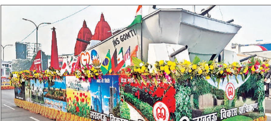
गणतंत्र दिवस की परेड के दौरान निकलती एलडीए की झांकी।

झांकी के सामने की ओर भगवान श्री राम के आकर्षक दिव्य बाल रूप को प्रदर्शित किया गया था। पीछे की ओर श्री राम मंदिर का भव्य, दिव्य एवं सुन्दर रूप देख लोग जय श्री राम के नारे लगाने लगे। झांकी में राम दरबार, दीपोत्सव, सरयू आरती, अयोध्या इंटरनेशनल एयरपोर्ट, धर्मपथ के सूर्य स्तम्भों तथा लता चौक की आकृति ने अयोध्या