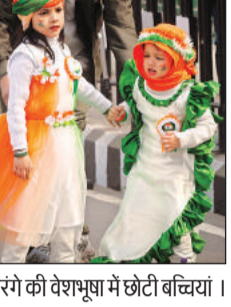
तिरंगे की वेशभूषा में छोटी बच्चियां।