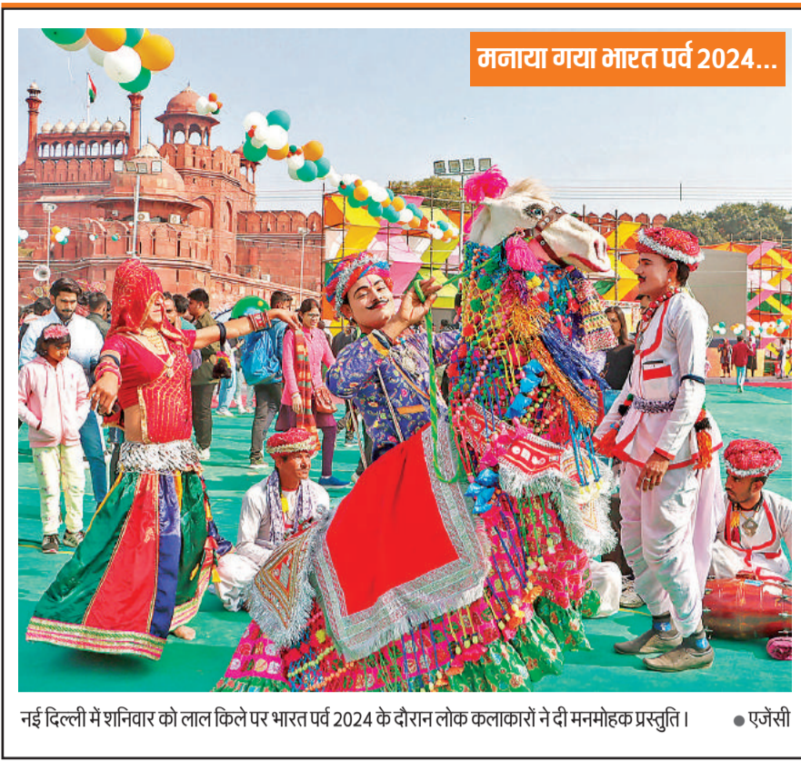
नई दिल्ली में शनिवार को लाल किले पर भारत पर्व 2024 के दौरान लोक कलाकारों ने दी मनमोहक प्रस्तुति।