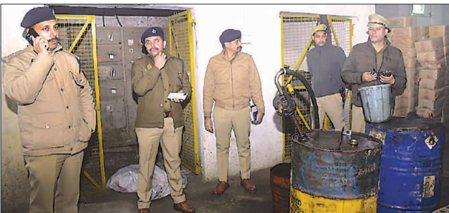
चिनहट में ट्रांसफार्मर फैक्ट्री में डकैती के बाद जांच करते संयुक्त पुलिस आयुक्त अपराध व अन्य। अमृत विचार

जानकारी मिलते ही घटनास्थल पर पहुंची पुलिस टीम ने मुआयना कर सभी कर्मचारियों से पूछताछ की। इसके बाद फैक्ट्री मालिक की लिखित शिकायत पर चिनहट पुलिस ने डकैती की धाराओं में प्राथमिकी दर्ज की। वहीं, डकैतों की तलाश में