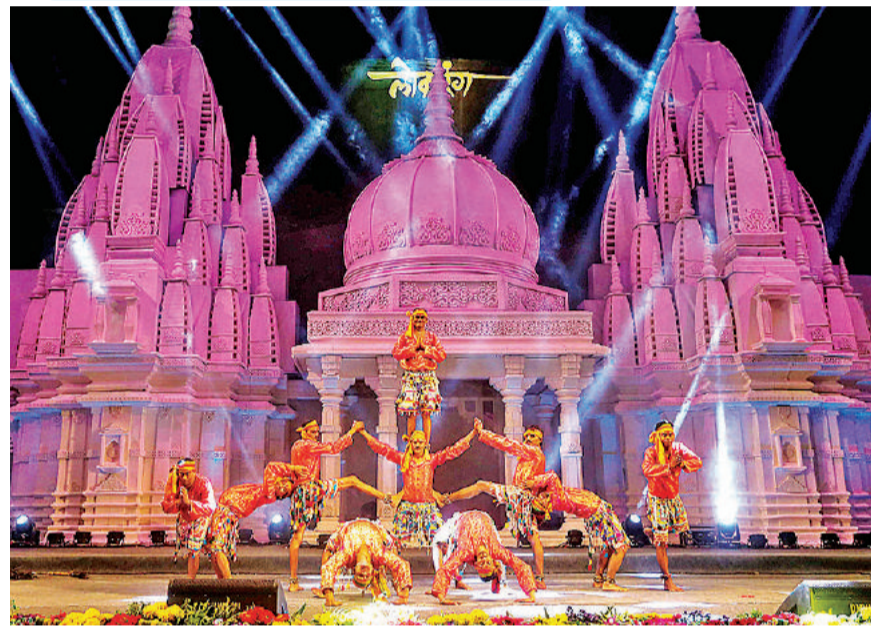
मध्य प्रदेश की राजधानी भोपाल में विश्व प्रसिद्ध लोकरंग उत्सव शुरू हो चुका है। रवींद्र भवन में आयोजित कार्यक्रम में प्रस्तुति के लिए हर बार की तरह देसी-विदेशी कलाकार अपनी संस्कृति की झलक पेश करने पहुंचे हैं। यह उत्सव 30 जनवरी तक चलेगा।