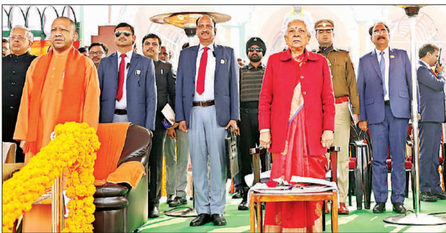
राजधानी में गणतंत्र दिवस पर आयोजित समारोह में राज्यपाल आनंदीबेन पटेल, मुख्यमंत्री योगी व अन्य।

बेन पटेल ने विधानभवन पर तिरंगा फहराया। इस दौरान मुख्यमंत्री योगी आदित्यनाथ भी मौजूद रहे। वहीं भारतीय सेना और प्रदेश की सुरक्षा में तैनात विभिन्न सुरक्षा बलों द्वारा राज्यपाल के समक्ष परेड कर सलामी दी गई। विभिन्न स्कूलों के बच्चों ने सांस्कृतिक कार्यक्रमों की प्रस्तुतियां दीं। महिला होमगार्ड्स के मोटरसाइकिल दस्ते ने भी साहसिक प्रदर्शन किया। साथ ही फायर ब्रिगेड और डायल 112 ने भी परेड में अपने दम-खम