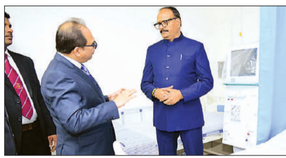
ऑलवेल मेडिकल सेंटर के उद्घाटन पर जानकारी लेते उप मुख्यमंत्री ब्रजेश पाठक।

प्रो. आशीष ने विभाग की उपलब्धियों के बारे में जानकारी देते हुए बताया कि विभाग ने 70 वर्षों में देश को 700 से अधिक ऑर्थोपेडिक सर्जन दिए। बीते साल 25 हजार से अधिक मरीजों को उपचार दिया गया। आर्थोस्कोपी विधि से 200 से अधिक घुटने एवं कंधे की सर्जरी की गई। एक साल में हड्डी के ट्यूमर वाली 100 से अधिक सफल सर्जरी विभाग के डॉक्टरों द्वारा की गई हैं।