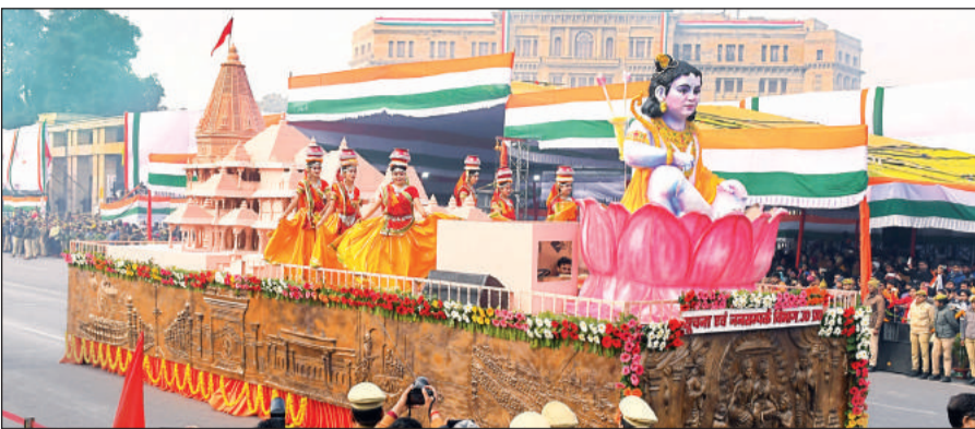
हजरतगंज क्षेत्र में गणतंत्र दिवस के अवसर पर परेड के दौरान निकाली जा रही राम मंदिर व रामलला की झांकी। अमृत विचार

शुक्रवार को गणतंत्र दिवस परेड में 22 झांकियां निकलीं। इसमें श्रीराम मंदिर, यूपी में कानून व्यवस्था और सुशासन के साथ बुलडोजर की झलक देखने को मिली। जबकि सेना के टी-90 भीएम टैंक, बोफोर्स तोप, रॉकेट लॉन्चर, आकाश मिसाइल परेड में आकर्षण का केंद्र रहे। परेड में महिला कमांडो ने दर्शाया कि बेटियां किसी से कम नहीं। होमगार्ड की थंडर बोल्ट वाइफर्स की टीम ने परेड के दौरान अपने करतबों से सभी को रोमांचित किया। चलती बाइक पर सीडी लगाकर इंसाफ राइफल लिए महिला होमगार्ड नारी सशस्त्रकरण का संदेश दिया। बीएमपी 2 तोप, के9 वज्र आर्टिलरी गन, लाइट स्ट्राइक एलएसवी