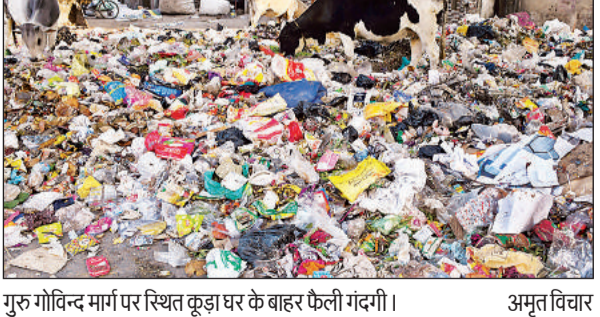
गुरु गोविन्द मार्ग पर स्थित कूड़ा घर के बाहर फैली गंदगी।

सफाई और कूड़ा प्रबंधन का काम देखेंगे। कंपनी को तीन महीने में काम शुरू करने का समय दिया गया है। इस बीच नगर निगम कार्यदायी संस्थाओं के माध्यम से लगे सफाई कर्मियों से सफाई