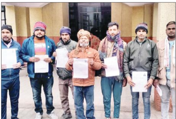
जिला अस्पताल में मेडिकल परीक्षण कराने पहुंचे मजदूर।

इजराइल में हुए युद्ध से पैदा हालात को लेकर वहां की सरकार ने कुशल निर्माण श्रमिकों की मांग की थी। जिसके ले कर केंद्र सरकार ने कवायद शुरू कराई। कौशल विकास एवं उद्यमशीलता मंत्रालय के अधीन कार्यरत एजेंसी इंटरनेशनल के माध्यम से श्रमिकों को इजराइल भेजने को लेकर जनपद से 200 श्रमिकों का चयन