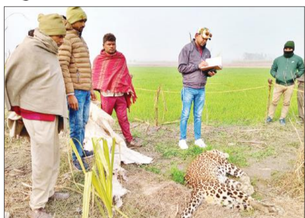
गुलदार के शव की जांच करती वनविभाग की टीम।