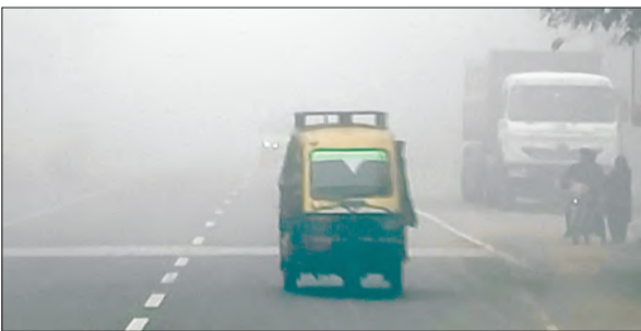
हाइवे पर कोहरे के बीच गुजरता टैपो।