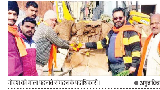
गोशाला में जाना पशुओं का हाल