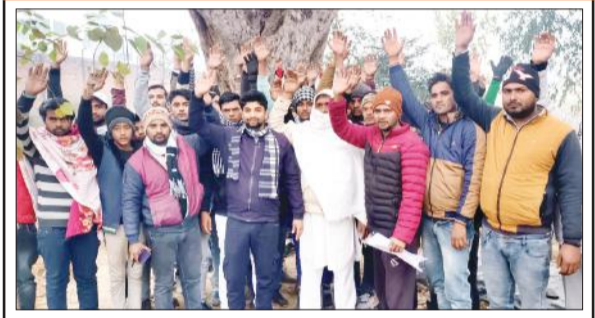
कब्रिस्तान में जलभराव के विरोध में प्रदर्शन करते लोग।