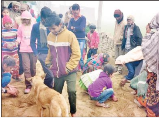
हरगाव्दिपुर गांव में सिक्के खोजने में जुटे ग्रामीण।