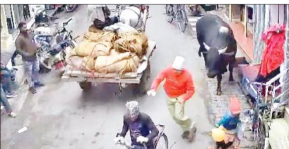
बड़ा बाजार में सांड के हमले से बचकर भागता व्यक्ति।