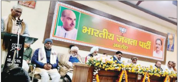
लोकसभा संचालन समिति की बैठक में शामिल भाजपा नेता।