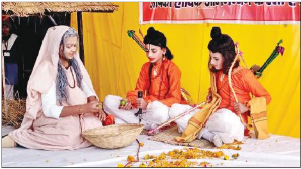
विद्यालय में सांस्कृतिक कार्यक्रम में प्रस्तुति देते बच्चे।