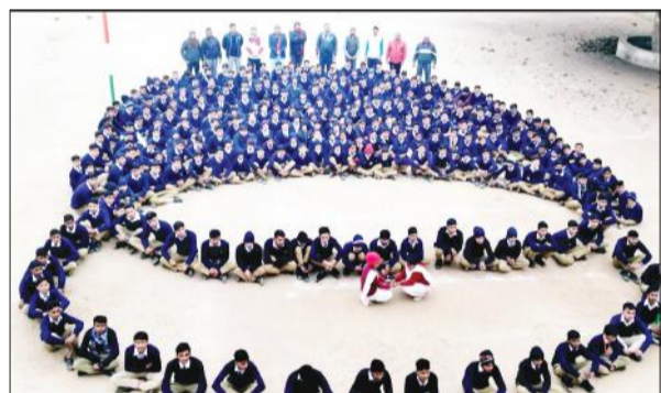
हेलमेट की आकृति बनाकर सुरक्षा का संदेश देते छात्र-छात्राएं। ● अमृत विचार