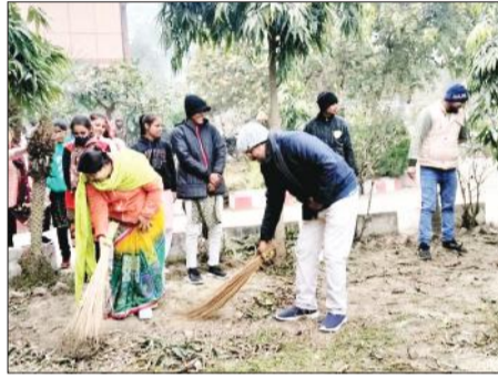
महाविद्यालय में स्वच्छता अभियान चलाती छात्राएं व स्टाफ।