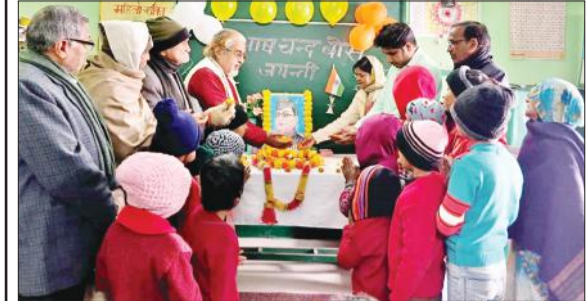
नेता जी के चित्र पर पुष्प अर्पित करते समिति के पदाधिकारी व अन्य।