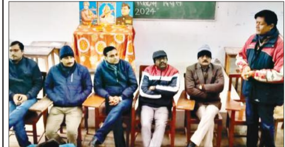
कार्यक्रम में विचार रखते शिक्षक।