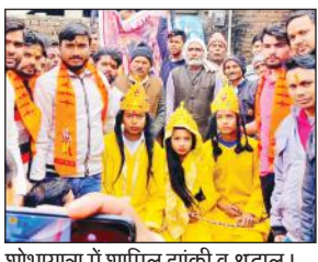
शोभायात्रा में शामिल झांकी व श्रद्धालु।