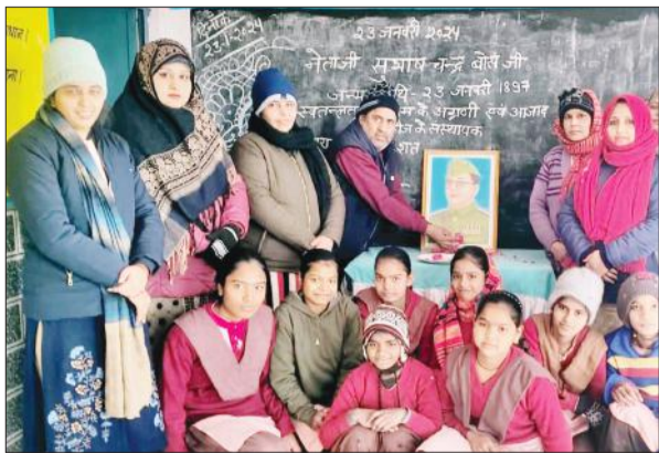
सुभाष चंद्र बोस के चित्र पर पुष्प अर्पित करते शिक्षक व छात्राएं।