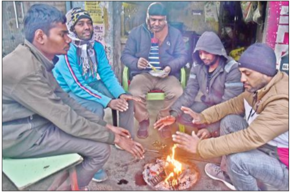
हरथला बाजार में दुकान पर ठंड में अलाव सेंकते लोग। ● अमृत विचार

मंगलवार को अधिकतम तापमान 15 और न्यूनतम तापमान 4 डिग्री सेल्सियस रहा। जबकि आर्द्रता 93 प्रतिशत होने और छह किलोमीटर प्रति घंटे की गति से चल रही हवा से लोग टिटुर गए। दिनभर कोहरा छाये रहने और बादलों की ओट में