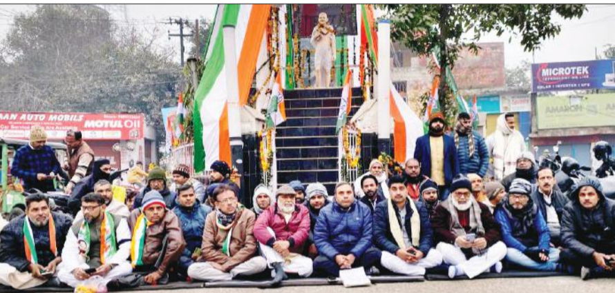
गांधी प्रतिमा के समक्ष प्रदर्शन करते कांग्रेस पदाधिकारी और कार्यकर्ता।