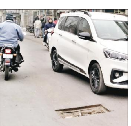
आजाद रोड पर खुले मैनहोल के पास से गुजरती कार।

है। यह दोनों ही मार्ग अति व्यस्त रहते हैं। कई बार शिकायत के बाद समस्या का समाधान होता नजर नहीं आ रहा है। आजाद रोड पर खुले मैनहोल में अब तक कई दोपहिया वाहन