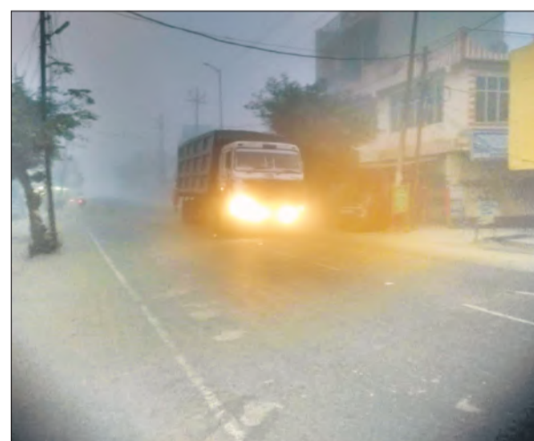
मंडी धनौरा में कोहरे के दौरान हाईवे से गुजरता वाहन।

तहसील क्षेत्र में ठंड का कहर कम होने का नाम नहीं ले रहा है। मंगलवार सुबह भी कोहरे से घिरी रही, वहीं दिन भर आसमान में बादल छाए रहे। इसके चलते धूप न निकलने से ठंड का असर ज्यादा बढ़ गया। दोपहर बाद शीतलहर से ठिठुरन भरी ठंड ने लोगों को सताया। ठंड से बचने के लिए लोगों