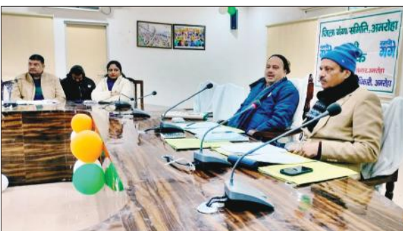
राष्ट्रीय स्वच्छ वायु कार्यक्रम को लेकर बैठक करते जिलाधिकारी।