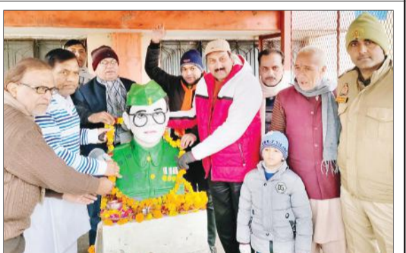
स्वतंत्रता सेनानी सुभाष चंद्र बोस की प्रतिमा पर माल्यापण करते समाजसेवी।