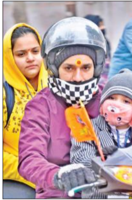
ठंड में कुछ इस तरह जाता स्कूटी सवार।