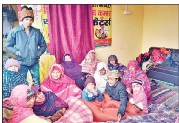
गांव मुनीमपुर में युवक की मौत के बाद बिलखते परिजन। ● अमृत विचार

अमृत विचार : सुरजननगर चौकी क्षेत्र में सोमवार की रात बालू से लदी बैलगाड़ी में बाइक टक्कर हो गई। इसमें बाइक सवार युवक की मौत हो गई जबकि उसका बहनोई घायल हो गया। युवक अपने बहनोई को उसके घर छोड़ने जा रहा था।