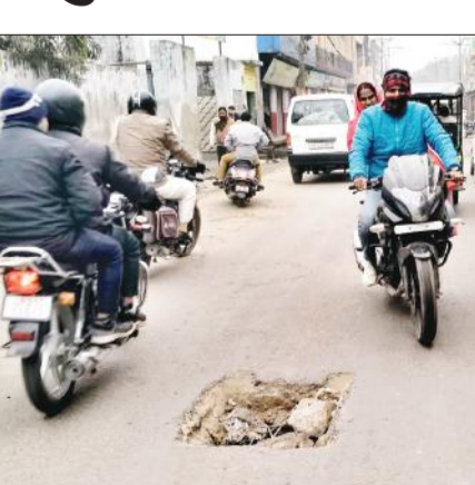
मालगोदाम रोड पर खुले मैनहोल के पास से गुजरती बाइक।

वैसे तो शहर में कई स्थानों पर मैनहोल खुले हैं। मगर आजाद रोड पर रोडवेज बस स्टैंड के पास व मालगोदाम रोड पर जिला पंचायत अध्यक्ष के आवास के नजदीक खुले मैनहोल की मरम्मत न होना आश्चर्यजनक