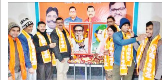
बाला साहब ठाकरे की जयंती के दौरान मौजूद शिवसैनिक।