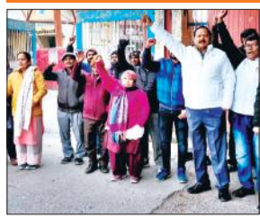
प्रदर्शन करते बीएसएनएल एमप्लाइज युनियन के पदाधिकारी व कार्यकर्ता ।