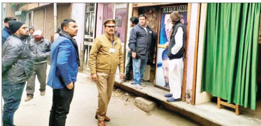
कटघर के मोहल्ला पचपेड़ा में चेंकिंग करते बिजली विभाग के अधिकारी।

इसी क्रम में महानगर के पचपेड़ा मोहल्ले में विद्युत वितरण खंड