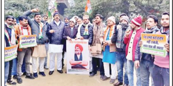
प्रदर्शन करते कांग्रेस कार्यकर्ता।