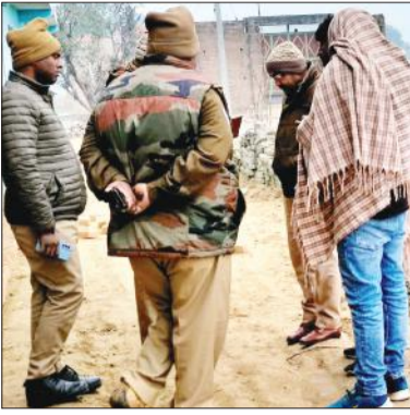
सिक्के मिलने के बाद तेनात पुलिस।

इतिहासकारों के मुताबिक सैयद वंश के अलाउद्दीन आलमशाह ने 1445 से 1450 तक दिल्ली की गद्दी पर राज किया था। अलाउद्दीन के पिता का नाम मुहम्मदशाह था।