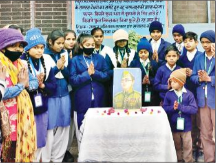
नेताजी की जयंती पर श्रद्धांजलि देते स्कूल के शिक्षक व बच्चे।