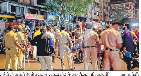
मुंबई में दो समूहों के बीच तनाव उत्पन्न होने के बाद तेनात पुलिसकर्मियों।