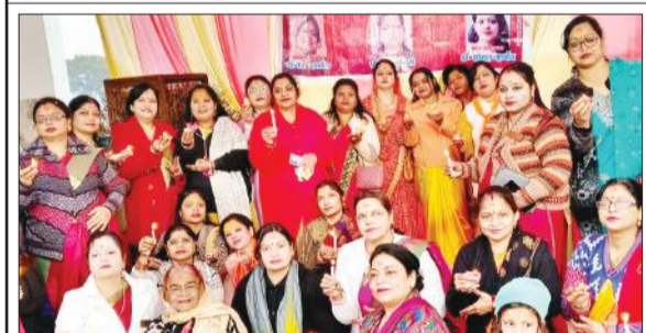
दीपक व मोमबत्ती जलाकर खुशी मनाती समिति पदाधिकारी।