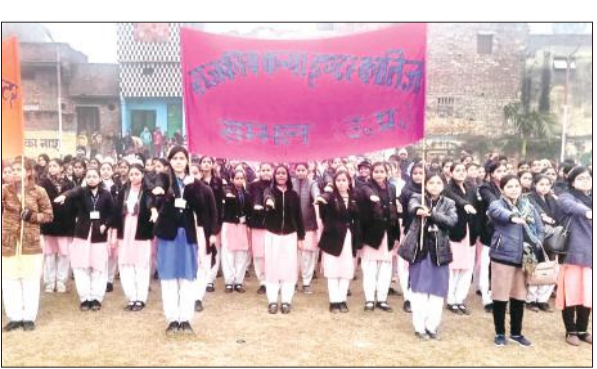
यातायात नियमों के पालन की शपथ लेती छात्राएं।

परिवहन विभाग की ओर से नगर के हिंद स्पोर्ट्स स्टेडियम में मानव श्रृंखला कार्यक्रम का आयोजन हुआ। जिसमें शंकर भूषण शरण जनता इंटर कॉलेज, बृज रतन सुंदर आर्य कन्या इंटर कॉलेज, राजकीय कन्या इंटर कॉलेज, एमजीएम कॉलेज, आचार्य मुक्तेश हकीम रईस सरस्वती इंटर कॉलेज, हिंद इंटर कॉलेज के छात्र छात्राओं ने हिस्सा लिया। छात्र छात्राएं और एनसीसी कैडेट्स मानव श्रृंखला बनाकर खड़े हुए। कार्यक्रम में मुख्य अतिथि