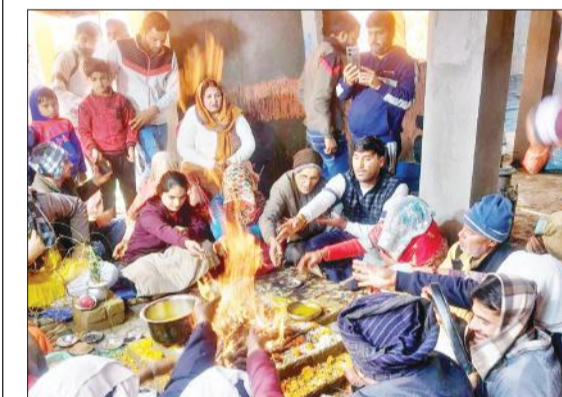
हवन में आहुति देते श्रद्धालु।