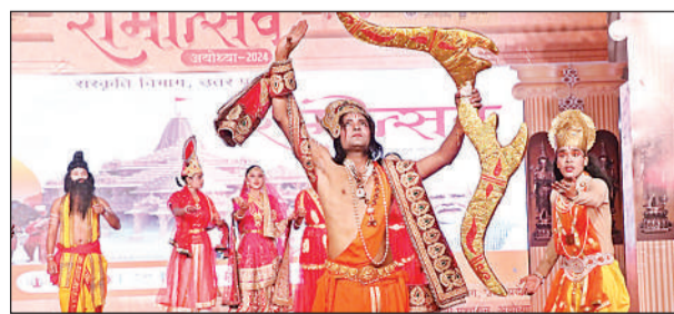
सीता स्वयंवर प्रसंग पर प्रस्तुति देते कलाकार।