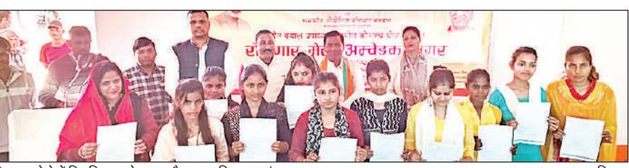
रोजगार मेले में नियुक्ति पत्र के साथ मौजूद चयनित छात्रों।

अमृत विचार। जनपद के बीना सॉफ्ट कौशल विकास मिशन प्रशिक्षण केंद्र पर विकास खंड भीटी में कौशल विकास मिशन, जिला सेवायोजन कार्यालय और राजकीय औद्योगिक प्रशिक्षण संस्थानों के संयुक्त तत्वाधान में दीन दयाल उपाध्याय ग्रामीण कौशल योजना के तहत ब्लॉक स्तरीय रोजगार मेला का आयोजन किया गया। रोजगार मेले में 205 अभ्यर्थियों ने प्रतिभाग किया। जिसमें से 156 अभ्यर्थियों का चयनित कर उन्हें नियुक्ति पत्र वितरित किया गया।