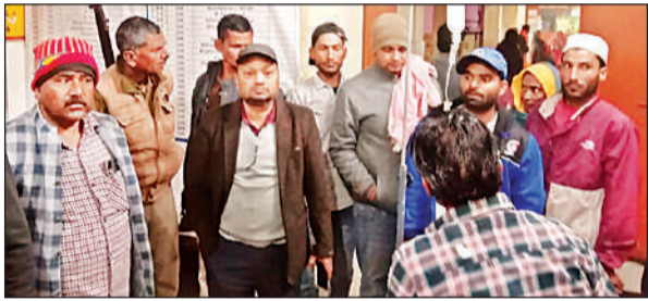
घायलों का सीएससी में हाल जानते एसडीएम।

अमृत विचार : जिले के मोतीपुर और फखरपुर थाना क्षेत्र में सड़क हादसे हो गए। सड़क हादसों में महिला समेत दो लोगों की मौत हो गई। जबकि छह लोग घायल हुए हैं। इन घायलों का इलाज अस्पताल में चल रहा है। मृतकों के शव को पुलिस ने पोस्टमार्टम के लिए भेज दिया है।