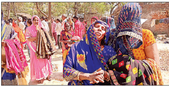
बेटे को खाने के गेम में बिलखती मां।