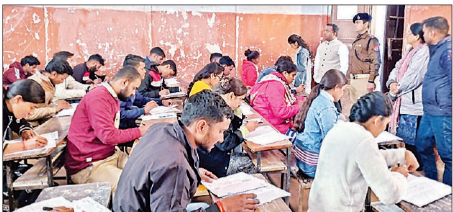
मनोहर लाल इंटर कॉलेज में कक्षा का निरीक्षण करते डीएम और एसएसपी।