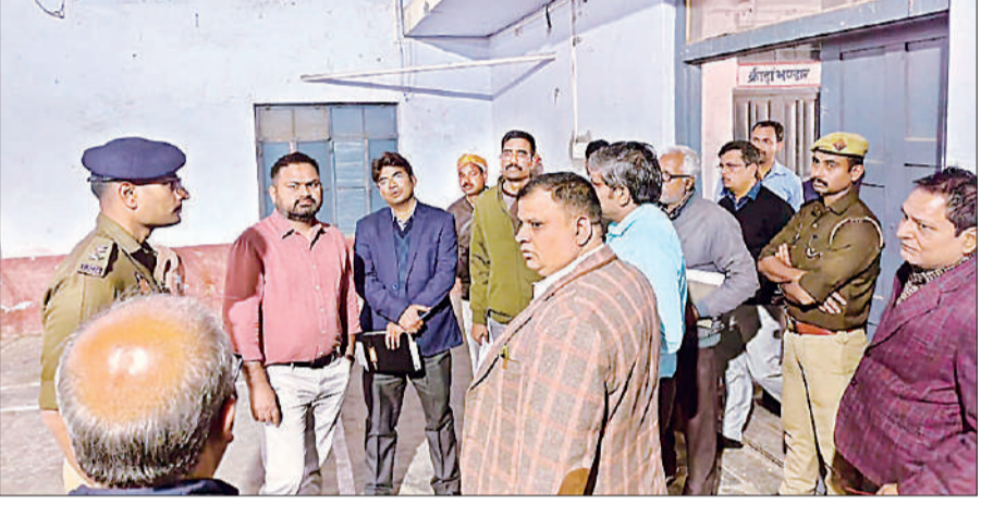
स्ट्रांग रूम का निरीक्षण करते डीएम, एसपी और अन्य प्रशासनिक अधिकारी।