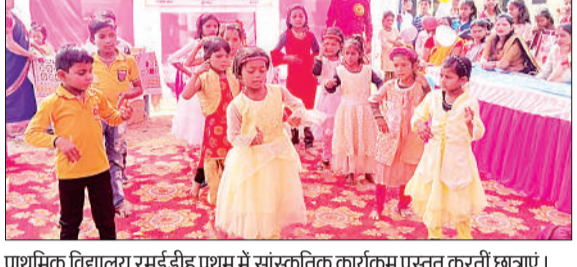
प्राथमिक विद्यालय रमईडीह प्रथम में सांस्कृतिक कार्यक्रम प्रस्तुत करती छात्राएं।