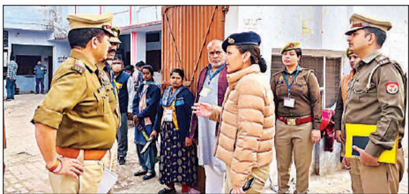
केंद्र पर पुलिस भर्ती परीक्षा का निरीक्षण करती एसीपी।