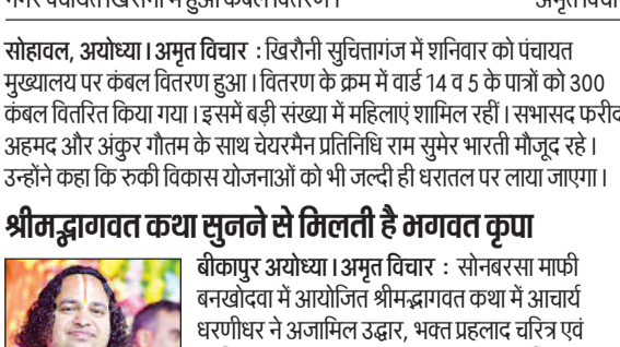
नगर पंचायत खिरौनी में हुआ कंबल वितरण।