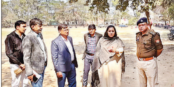
पुलिस भर्ती परीक्षा का निरीक्षण करती डीएम व एसपी। अमृत विचार

संवाददाता, सुलतानपुर। 2541 अभ्यर्थियों ने परीक्षा छोड़ दी, जबकि, परीक्षा में 30,963 अभ्यर्थी शामिल हुए हैं। शनिवार को प्रथम पाली की परीक्षा सुबह दस बजे से शुरू होनी थी। लेकिन निर्देश के मुताबिक अभ्यर्थी लगभग आठ बजे ही सामान्य ज्ञान के भी प्रश्न काफी टफ रहे। कई केंद्रों से बच्चे खुशी से झूमते हुए निकले। दोनों पालियों में