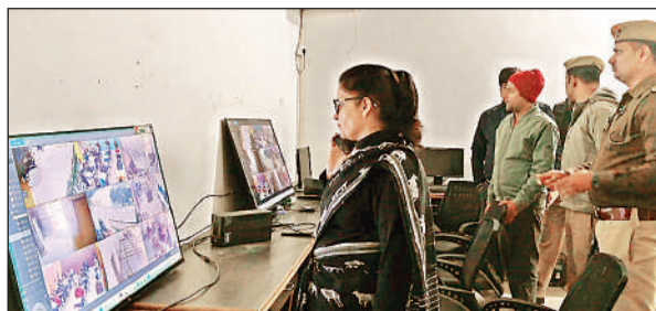
केंद्रों लूम से निरीक्षण करती डीएम।