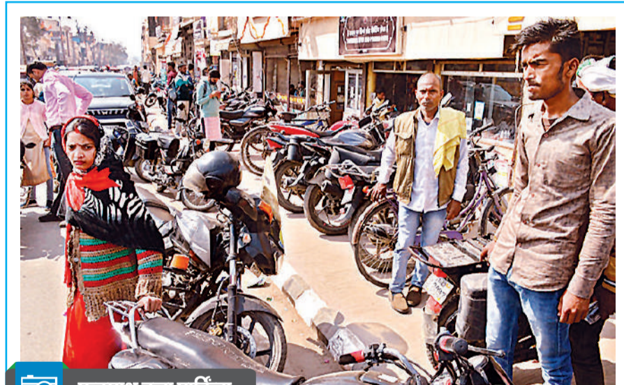
फुटपाथ बना पार्किंग