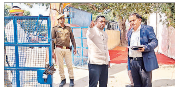
नपाई कराते और निर्देश देते जिलाधिकारी।