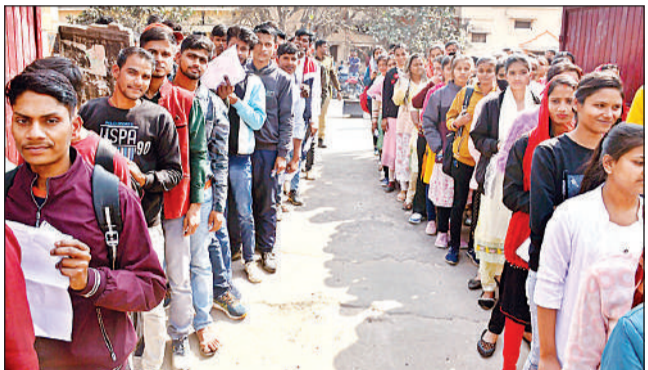
मनोहर लाल इंटर कॉलेज में परीक्षा के लिए प्रवेश करते अभ्यर्थी।