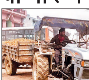
मिट्टी लदी ट्रैक्टर-ट्राली। (फाइल फोटो)

अमृत विचार: कृषि उपयोग में रियासतों के नाम पर ट्रैक्टर के साथ लगे वाली ट्रालियों को आरटीओ पंजीकरण में छूट दिया गया था। अब उसका बेजा इस्तेमाल बढ़ा तो इनका पंजीकरण पुन: अनिवार्य कर दिया गया लेकिन आलम ये है कि बीते वर्ष जिले भर में पंजीकृत ट्रालियों की संख्या सौ का आंकड़ा भी पर नहीं कर सकी है। ईंट, बालू, मोरंग और सीमेंट-सरिया से लेकर गन्ना और मिट्टी तक की धड़ल्ले से ढुलाई की जा रही है। ये अपंजीकृत ट्रालियां शहर की सड़कों पर अक्सर जाम और दुर्घटना का कारण भी बन रही