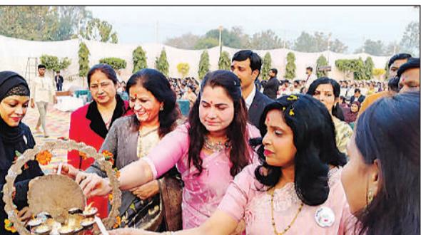
दीप जलाकर कार्यक्रम का उद्घाटन करते अतिथिगण।