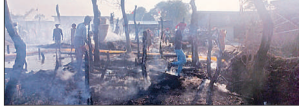
आग लगने से जले मकान।