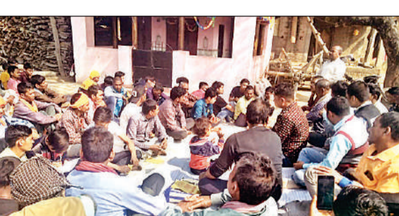
विशुनापुर गांव में आयोजित चौपाल में वार्ता करते ग्रामीण।

अमृत विचार : जिले जंगल से सटे न्याय पंचायत आंबा के लोगों की नाराजगी अब खुलकर सामने आ गई है। सभी का कहना है कि यदि नेताओं को पावर चाहिए तो पहले टावर लगवाना होगा। वरना सभी मतदान का बहिष्कार कर देंगे। कर्तनियाघाट वन्यजीव प्रभाग जंगल से आंबा न्याय पंचायत सटा हुआ है। इस न्याय पंचायत के तहत एक दर्जन से अधिक ग्राम पंचायत आते हैं। लेकिन थारू जनजाति बाहुल्य क्षेत्रों में नेटवर्क को लेकर काफी समस्या है। इसको लेकर