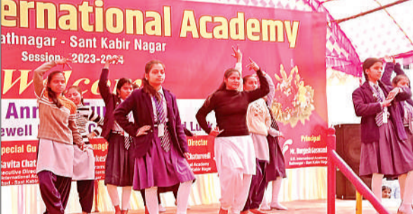
समारोह में सांस्कृतिक प्रस्तुति देती छात्राएं।