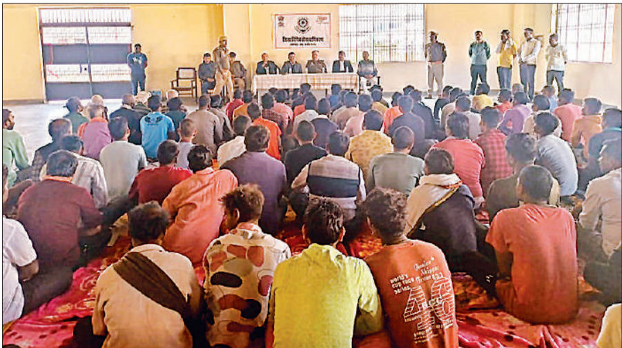
कैदियों को जागरूक करती न्यायिक अधिकारियों की टीम। अमृत विचार

उपलब्ध कराए जाते हैं। इसके लिए उन्हें जेल अधीक्षक के माध्यम से अपना प्रार्थना पत्र जिला विधिक