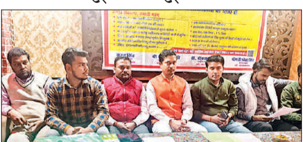
शहर में आयोजित बैठक में मौजूद पदाधिकारी।

अमृत विचार : जनसंख्या नियंत्रण कानून लागू न करने, सनातनी मंदिर-मठों को सरकारी नियंत्रण से मुक्त करने आदि दावों के लागू न होने के विरोध में शनिवार को राष्ट्रधारक दल ने बैठक की। इस दौरान लोकसभा चुनाव में प्रत्याशी उतारने व विभिन्न वादों को लागू करने पर सहमति बनी। बैठक को संबोधित करते हुए राष्ट्रधारक दल के राष्ट्रीय अध्यक्ष लखन सिंह ने बताया कि सरकार द्वारा जनसंख्या नियंत्रण कानून लागू करने, मतांतरण विरोधी कानून, सीएए, यूसीसी, एक समान शिक्षा व्यवस्था लागू करने आदि के वादे किए। लेकिन उन पर अभी