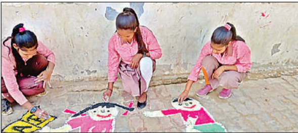
वार्षिकोत्सव कार्यक्रम में रंगोली बनाती छात्राएं।