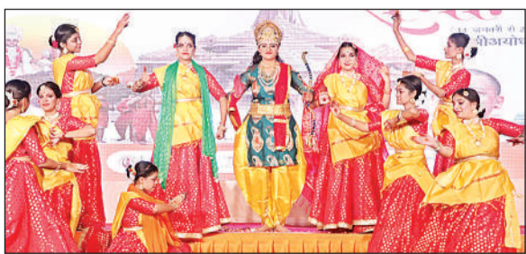
रामकथा पार्क में राम प्रसंग पर नृत्य नाटिका प्रस्तुत करते कलाकार।