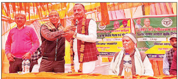
किसान गोष्ठी में मुख्य अतिथि को सम्मानित करते अधिकारी।