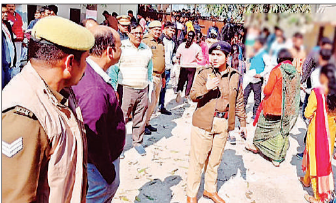
परीक्षा केन्द्र के बाहर वेंकिंग करते पुलिस अधिकारी।

अधीक्षक ने परीक्षा को निष्पक्ष, पारदर्शी व शांतिपूर्ण ढंग से संपन्न कराया जाने के लिए रतनसेन इण्टर कालेज, तिलक इंटरमीडिएट