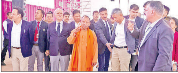
इंदिरा गांधी प्रतिष्ठान गौमती नगर में कार्यक्रम स्थल का निरीक्षण करते मुख्यमंत्री।

हजार से अधिक प्रतिभागी 10 लाख करोड़ रुपये से ज्यादा के निवेश के साक्षी बनेंगे। अकेले बरेली से 99 निवेशकों को न्योता दिया गया है। प्रधानमंत्री नरेन्द्र मोदी की आगुवाई में तमाम वीडियोज यहां मौजूद होंगे।