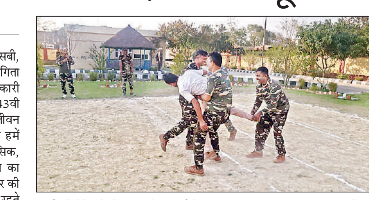
कबड्डी प्रतियोगिता में प्रतिभाग करते एसएसबी के जवान

स्वास्थ्य ही नहीं होता बल्कि यह हमारे मनोवैज्ञानिक विकास के लिए भी आवश्यक है। खेल खेलने से हमारा मन