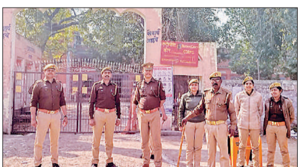
पुलिस भर्ती परीक्षा को लेकर कन्हैया लाल इंटर कॉलेज के बाहर तैनात पुलिस बल।