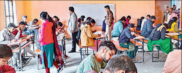
पुलिस भर्ती परीक्षा के दौरान कक्ष का निरीक्षण करते डीएम व साथ में एसपी।

पहली पाली में पंजीकृत 20,736 परीक्षार्थियों में 19,914 अभ्यर्थी उपस्थित रहे और 822 अनुपस्थित रहे। जबकि दूसरी पाली में पंजीकृत 20,736 परीक्षार्थियों में 19,914 अभ्यर्थी उपस्थित रहे और 822 अनुपस्थित रहे। जबकि दूसरी पाली