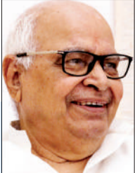
हृदय नारायण दीक्षित पूर्व विधानसभा अध्यक्ष उ.प्र.

पुस्तक रचनाकार की अंतर्काया होती है। कागज का पुलिंदा नहीं और शब्दों का ढेर भी नहीं। ह्वाइट मैन ने 'लांग मैन' कविता में लिखा था "यह पुस्तक नहीं मेरी काया है, जो इसे छूते हैं, वे एक मनुष्य को छूते हैं। वह मैं हूँ, जिसे आप छू रहे हैं। मैं इन पृष्ठों से प्रकट होकर तुम्हारे हृदय में समा जाऊंगा।"