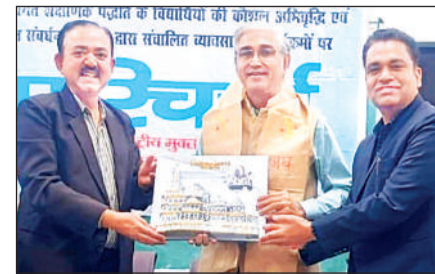
मुख्य अतिथि का स्वागत करते शिक्षक।