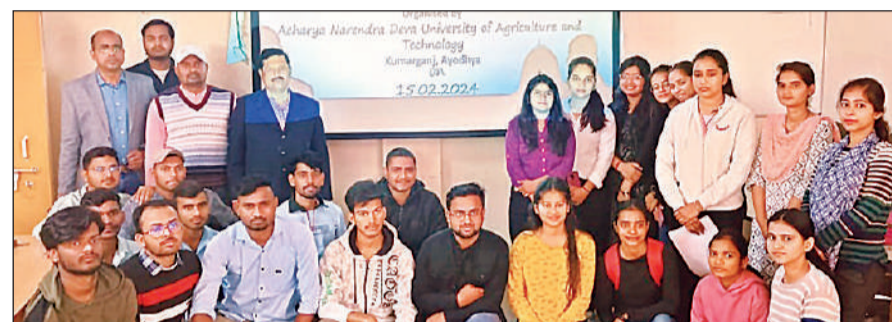
कृषि विश्वविद्यालय में आयोजित मंथन में मौजूद छात्र-छात्राएं।