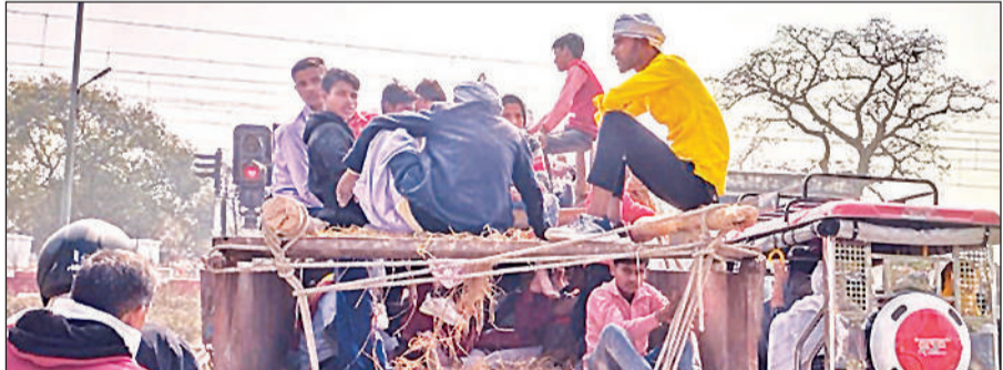
नियमों को धाता बताकर कुछ इस तरीके से ट्राली पर बैठकर जाते लोग।

अमृत विचार: वर्ष 2022 में कानपुर में ट्रैक्टर ट्राली पलटने से उसमें बैठे 26 लोगों की दर्दनाक मौत के बाद सीएम योगी ने ट्राली पर सवारी करने पर दस हजार रुपये जुर्माने की बात कही थी। कुछ समय तक पुलिस प्रशासन नियमों का पालन कराने में सजग दिखा उसके बाद शांत पड़ गया। नतीजा अब सड़कों पर फिर ट्रैक्टर ट्राली में यात्रियों को बैठा कर यात्रा शुरू हो गई। जिससे दुर्घटनाओं में इजाफा देखने को मिल रहा है। बहुसंख्यक की रात बहराइच से कोटवा धाम जा रही ट्रैक्टर ट्राली में एक ट्रक ने ठोकर मार दिया जिससे ट्राली में सवार करीब तीन दर्जन यात्रियों में करीब 15 लोग जख्मी हो गए। गनीमत रही