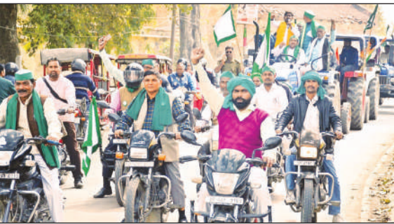
मांगों को लेकर ट्रैक्टर मार्च निकालते किसान।