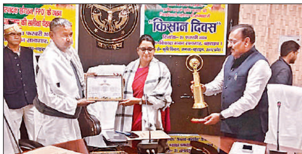
जिला मुख्यालय पर किसान को सम्मानित करती जिला कलेक्टर।