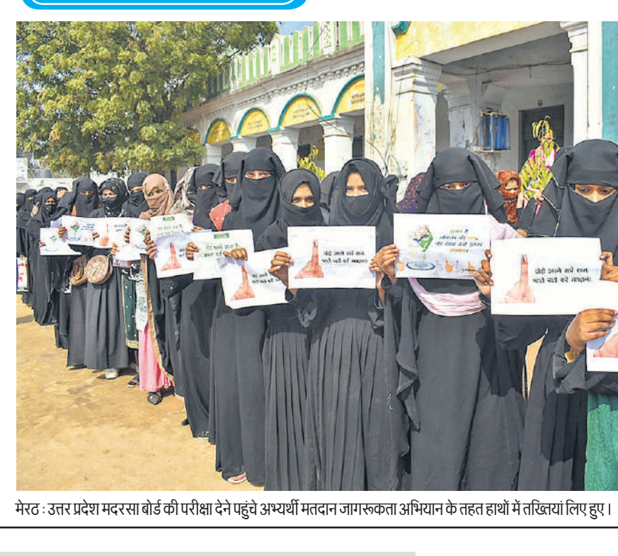
मेरठ : उत्तर प्रदेश मद्रसरा बोर्ड की परीक्षा देने पहुंचे अग्र्यर्थी मतदान जागरूकता अभियान के तहत हाथों में तख्तियां लिए हुए।