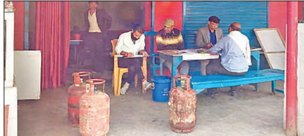
परसपुर में छापेमारी के दौरान बरामद घरेलू सिलेंडर।