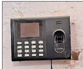
महीनों से बंद पड़ी है बायोमेट्रिक मशीन। अमृत विचार

कराने जाते हैं। ठेका और नीलामी के दिन यहां के संवेदनशील कोषागार कक्ष में सैकड़ों लोगों का जमावड़ा हो जाता है। हाल ही में लोक निर्माण विभाग के अधीक्षण अभियंता कार्यालय में तैनात लिपिक को एक बड़े निर्माण ठेके मामले में