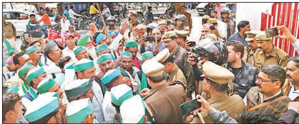
कलेक्ट्रेट में जाने के लिए पुलिस से जद्दोजहद करते किसान। अमृत विचार

संवाददाता, बहराइच अमृत विचार : भारतीय किसान यूनियन के पदाधिकारियों ने बुधवार को किसानों के साथ ट्रैक्टर ट्रॉली मार्च निकाला। सभी एमएसपी लागू करने की मांग को लेकर ट्रैक्टर और ट्राली लेकर डीएम कार्यालय के सामने पहुंच गए। डीएम को राष्ट्रपति का संबोधित ज्ञापन सौंपा गया। भारतीय किसान यूनियन के