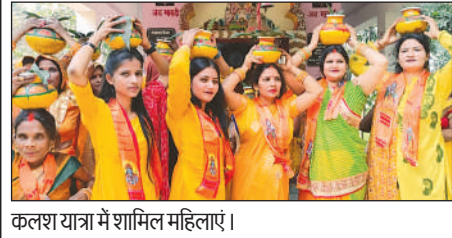
कलश यात्रा में शामिल महिलाएं।