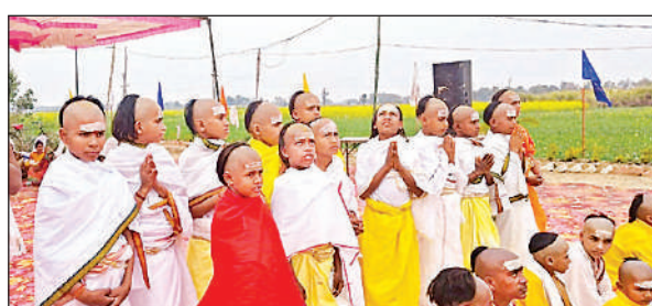
गुरुकुल वेद पाठशाला में उपनयन संस्कार करते विद्यार्थी।

इटियाथोक के भीखमपुरवा गांव स्थित पंडित मदन मदन मोहन मालवीय गुरुकुल वेद पाठशाला में बच्चों को निशुल्क शिक्षा दी जाती है। बच्चों को पढ़ाई से साथ