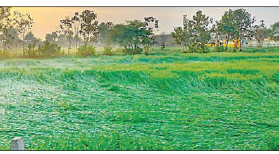
बारिश और हवा के चलते खेतों में गिरी पड़ी गेहूं की फसल। अमृत विचार

अमृत विचार: मंगलवार की देर रात बिगड़े मौसम के मिजाज ने फसलों को जबरदस्त नुकसान पहुंचाया है। तेज हवा और बारिश से गेहूं व सरसों की फसलें जमींदोज हो गयी हैं। जिले के कई इलाकों में ओले भी गिरने की सूचना है। इस बदले मौसम ने किसानों की परेशानी बढ़ा दी है। वहीं आंधी के चलते कई बिजली आपूर्ति ध्वस्त हो गई है और कई इलाकों की बिजली गुल हो गयी है। परसपुर क्षेत्र में दर्जनों बिजली के खंभे टूटकर गिर गए हैं। बुधवार को बिजली कर्मी व्यवस्था को ठीक कर विद्युत व्यवस्था बहाल करने में जुटे रहें।