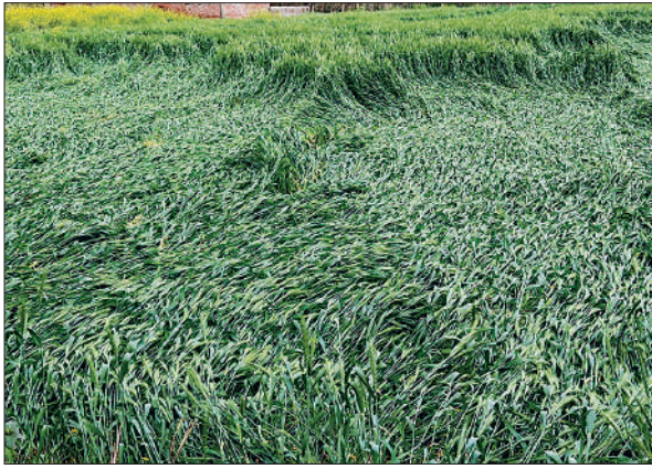
तेज हवा के साथ वर्षा होने से जमींदोज गेहूँ की फसल।

अमृत विचार । देर रात आंधी के साथ वर्षा होने से गेहूं की फसल को नुकसान हुआ है। वहीं पछेती गेहूं व सरसों की फसल को सजीवनी मिली है। सादुल्लाहनगर के ग्राम नेवादा, ऐदहा, मद्दोचाट, हंसऊपर, देवरिया इनायत, गोकुल बुजुर्ग, विशुपुर खरहना, कुरुथुआ खानपुर, मुबारकपुर, सहजौरा, फिरोजपुर, रानीपुर व अचलपुर घाट सहित अन्य गांवों में गेहूं व सरसों की अगेती फसल को तेज हवा से कुछ क्षति हुआ है।