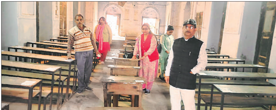
पंडित राम दुलारे इंटर कॉलेज केंद्र के स्ट्रॉग रूम का जायजा लेते डीआईओएस।

बलरामपुर, अमृत विचार । उत्तर प्रदेश माध्यमिक शिक्षा परिषद की बोर्ड परीक्षाएं गुरुवार से दो पाली में शुरू होंगी। परीक्षा में परीक्षार्थी को कलम रबड़ स्केच पेन के साथ हाई पैड के अतिरिक्त अन्य कोई सामग्री न ले जाने की सख्त हिदायत दी गई। बोर्ड परीक्षा के लिए जिले में 64 केंद्र बनाए गए हैं। प्रदेश माध्यमिक शिक्षा परिषद के बोर्ड परीक्षा में नकल पर अंकुश लगाने एवं पारदर्शी सुचिता पूर्ण कराने के लिए कई नियम कानून प्रभावी होंगे। केंद्र व्यवस्थापक को बिना आधार कार्ड के परीक्षा कक्षा में जाने की अनुमति नहीं मिलेगी। सीसीटीवी