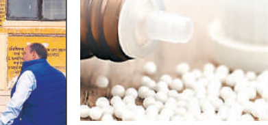
जिला अस्पताल स्थित राजकीय होम्योपैथिक चिकित्सालय।

जिला अस्पताल स्थित राजकीय होम्योपैथिक चिकित्सालय में पहुंच रहे मरीजों में निराशा