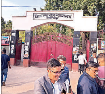
दीवानी न्यायालय का मुख्य गेट।