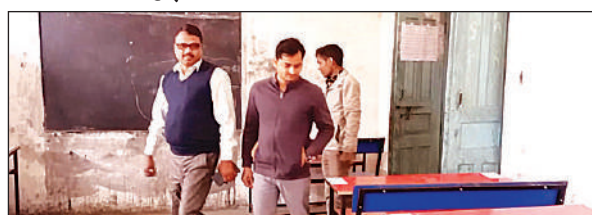
बोर्ड परीक्षा के लिए सुरक्षा जांचते अधिकारी।