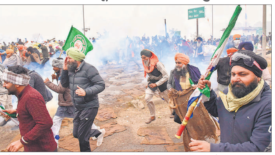
शंभू सीमा पर पुलिस द्वारा दागे गए आंसू गैस के गोले के धुं से बचने के लिए झड़प-उधर भागते प्रदर्शनकारी किसान।

सरकार ने किसानों को वार्ता के लिए आमंत्रित किया : केंद्रीय