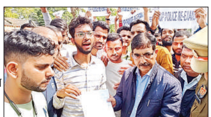
सिटी मजिस्ट्रेट को ज्ञापन देते पुलिस परीक्षा के अभ्यर्थी।

संवाददाता, सुलतानपुर, अमृत विचार। बीती 17 व 18 फरवरी को हुई पुलिस भर्ती परीक्षा में पेपर लीक होने की बात कतेतु हुए अभ्यर्थियों ने कलेक्ट्रेट का घेराव किया। सूचना पर पहुंचे एसडीएम ने