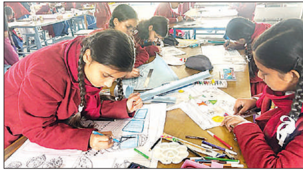
प्रतियोगिता में प्रतिभाग करते बच्चे।

पेंटिंग एवं निबन्ध प्रतियोगिताओं का आयोजन किया गया, जिनमें पूर्वोत्तर रेलवे पर लगभग 14 हजार विद्यार्थियों ने प्रतिभाग किया, जिसमें लगभग 1700 प्रतिभागी सफल हुये। पूर्वोत्तर रेलवे के लखनऊ मंडल के स्टेशनों सहित रोड अंडर ब्रिज के निकटवर्ती 66 विद्यालयों के 5543 विद्यार्थियों ने भाग लिया, जिसमें 390 प्रतिभागी प्रतियोगिता में सफल हुये। इञ्जतनगर मंडल के बरेली, गुरसहायगंज, पीलीभीत, कन्नौज, टनकपुर एवं