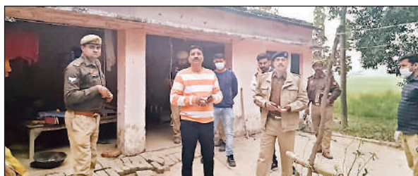
पुजारी की हत्या के बाद जांच करते एसपी ग्रामीण।