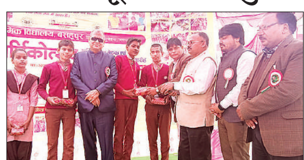
कार्यक्रम में बच्चों को पुरस्कार देते बीएसए व मौजूद अन्य लोग।