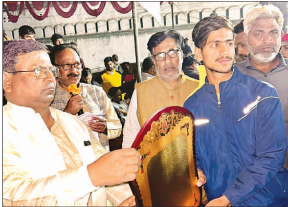
विजेता टीम कैप्टन को शील्ड प्रदान करते मुख्य अतिथि।