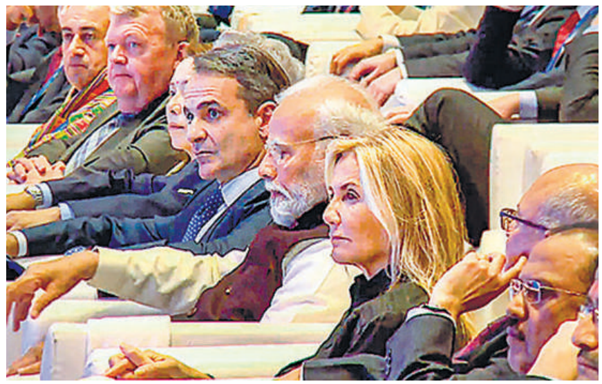
नई दिल्ली में कार्यक्रम के दौरान ग्रीस के प्रधानमंत्री क्यारिाकोस मित्सोटाकिस के साथ प्रधानमंत्री नरेंद्र मोदी।