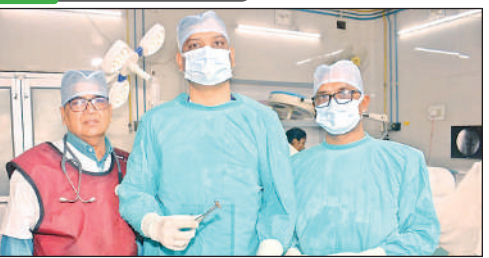
ऑपरेशन के बाद निकाली गई गोली दिखाते चिकित्सक।