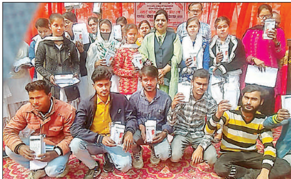
स्मार्ट फोन के साथ मौजूद छात्र और विधायक।