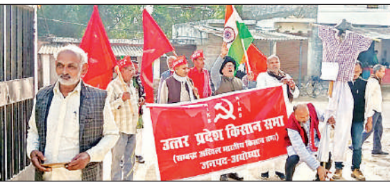
लॉक मुख्यालय पर प्रदर्शन करते संयुक्त किसान मोर्चा के पदाधिकारी।

ज्ञापन में किसानों ने न्यूनतम समर्थन मूल्य पर गारंटी कानून बनाए जाने, सी 2 प्लस 50 यानी खेती में लगी मजदूरी और पूंजी पर ब्याज के आधार पर फसलों का मूल्य तय किए जाने, छुड़ा जानवरों से फसलों को बचाने की व्यवस्था किये जाने, खेती के लिए किसानों को फ्री बिजली, गन्ना बिक्री मूल्य का डिजिटल भुगतान, मनरेगा मजदूरों को साल में 200 दिन काम की गारंटी समेत अन्य मांग रखी है।