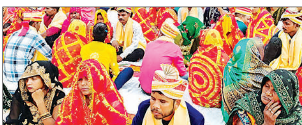
मुख्यमंत्री सामूहिक विवाह कार्यक्रम में मौजूद नवविवाहित जोड़े। अमृत विचार

अमृत विचार। समाज कल्याण विभाग की ओर से मुख्यमंत्री सामूहिक विवाह का आयोजन कुड़वार विकास खंड के प्रांगण में किया गया। शादी समारोह में जनप्रतिनिधियों से लेकर विकासखंड के कर्मचारी ने सहभाग किया। बुधवार को कुड़वार विकास खंड मुख्यालय के प्रांगण में समाज कल्याण विभाग द्वारा सामूहिक विवाह का आयोजन किया गया। सामूहिक विवाह में जनपद के अखंड नगर ब्लॉक से 15, बल्दीयार ब्लॉक से 24, दोस्तपुर ब्लॉक से 06, जयसिंहपुर ब्लॉक से 13, कुड़वार