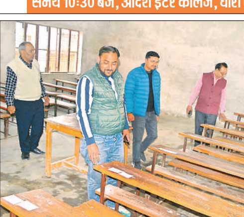
आदर्श इंटर कॉलेज में बुधवार को कक्ष का निरीक्षण करते प्रधानाचार्य।