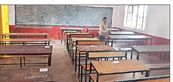
शहर के जीआईसी में बोर्ड परीक्षा के लिए डेस्क पर रिलीफ चरखा करता कर्मचारी।

यूपी बोर्ड की हाईस्कूल व इंटरमीडिएट की वार्षिक परीक्षा गुरुवार से शुरू होकर नौ मार्च तक चलेगी। परीक्षा को नकल विहीन व शुचित्वापूर्ण संपन्न कराने के लिए