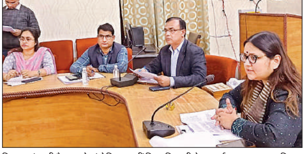
किसान बंधु की बैठक को संबोधित करती जिलाधिकारी नेहा शर्मा। अमृत विचार

अमृत विचार: बुधवार को कलेक्ट्रेट सभागार में जिलाधिकारी नेहा शर्मा की अध्यक्षता में किसान दिवस की बैठक का आयोजन किया गया। किसानों ने कई समस्याओं एवं सुझावों को रखा गया। जिलाधिकारी ने किसानों की समस्याओं के निस्तारण के संबंध में संबंधित अधिकारियों को आवश्यक कार्रवाई करने के निर्देश दिए। उन्होंने सभी विभागों के अधिकारियों को निर्देशित किया है कि किसानों की सभी समस्याओं का निराकरण बिना किसी विलंब के किया जाए।