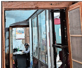
नगरपालिका के हर कक्ष में खराब पड़े सीसीटीवी कैमरे। अमृत विचार

कर्मचारियों की समस्या उपस्थित बताने वाली बायोमेट्रिक मशीन भी काफी समय से खराब है। यहां रोजाना तीन से दस लाख जमा होने वाले कैशा को कर्मचारी कभी साइकिल और कभी मोटर साइकिल से चार किलोमीटर दूर बैंक में जमा