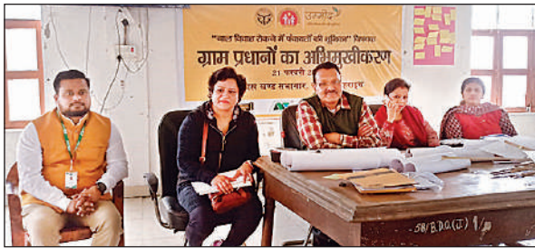
जरवल में आयोजित शिविर को संबोधित करते अधिकारी।

अमृत विचार : बाल विवाह लड़का व लड़की दोनों पर असर डालता है, लेकिन इसका प्रभाव लड़कियों पर अधिक पड़ता है। जिन लड़कियों की शादी कम उम्र में हो जाती है उनके स्कूल से निकल जाने की संभावना बढ़ जाती है। अधूरी शिक्षा और कौशल ज्ञान न होने के कारण उनके पास अपने परिवार की गरीबी दूर करने और नौकरियाँ पाने की क्षमता भी कम हो जाती है। इसके अलावा कम उम्र में शादी करने से जीवन काल में बच्चों की संख्या भी ज्यादा होती है। यह बातें जरवल ब्लॉक सभागार