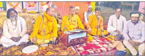
संत समागम में कथा सुनाते कथावाचक।

यज्ञ में अयोजित सन्त सम्मेलन में भक्तों को सन्तो द्वारा अपनी वाणी से कराया अमृत पान तुलसीदास जी का कथन है कि सत्संग संतों का संग किए बिना ज्ञान की प्राप्ति नहीं होती और सत्संग तभी मिलता है जब ईश्वर की कृपा होती है। यह तो आनंद व कल्याण का मुख्य हेतु है। साधन तो मात्र पुष्य की भाँति