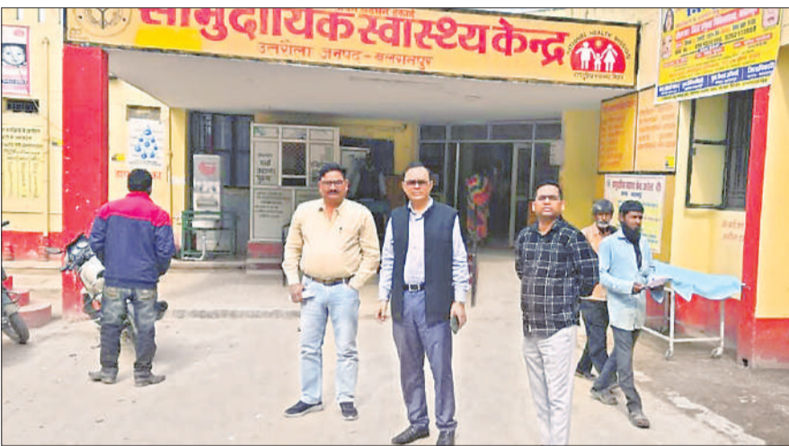
सामुदायिक स्वास्थ्य केंद्र उतरौला में निरीक्षण के दौरान मौजूद सीएमओ व अन्य।