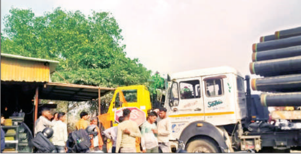
तमाम गाड़ियों को ठोकर मारते हुए दुकान में जा घुसा ट्रक अमृत विचार

सिद्धार्थनगर निवासी वाहन मालिक गुरुवार को नयी डम्पर गाड़ी गोखपुर जिले स्थित गौडा से खरीदकर अपने घर जा रहा था। अभी डम्पर दुर्गा मंदिर चौराहे पर बने क्रॉस प्वाइंट को पार कर ही रहा था कि इसी बीच तेज रफ्तार पाईप लदी लारी ट्रक को चालक गाड़ी से नियंत्रण खो बैठा और डम्पर को तेज ठोकर मारते हुए मौके पर खड़ी एक कार व एक आटो से टकरा कर दुकान में घुस गया। जिससे आटो