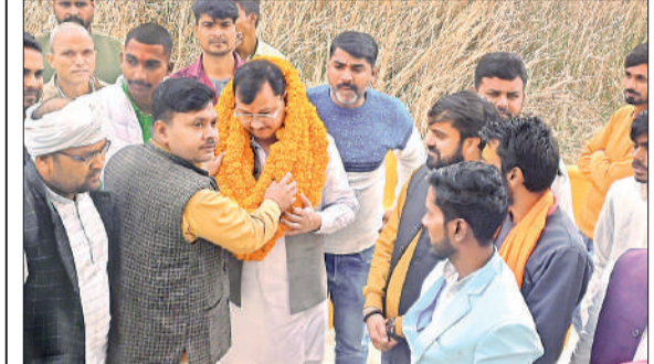
श्रमिक कामगार कर्मचारी महासंघ के राष्ट्रीय महामंत्री का स्वागत करते कार्यकर्ता।