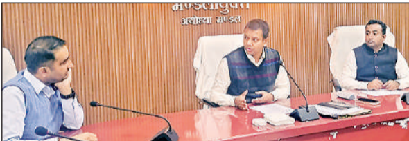
बैठक के दौरान मंडलायुक्त, जिलाधिकारी व मौजूद अन्य लोग।

अमृत विचार : अयोध्या के सौंदर्यीकरण व विकास कार्यों से संबंधित प्रस्तावित शासन में लंबित कार्यों की सूची मंडलायुक्त गौरव दयाल ने कार्यदायी विभागों के अधिकारियों से तलब की है। उन्होंने कहा कि जल्द से जल्द सूची बनाकर दी जाए, ताकि शासन में पैरवी कर कार्यों को स्वीकृत करा लिया जाए। अयोध्या में प्रस्तावित विकास कार्यों की आयुक्त सभागार में समीक्षा करते हुए गौरव दयाल ने कहा कि अयोध्या में निर्माणाधीन प्रमुख पथों यथा-अवध आमन पथ, क्षीरसागर पथ व निर्माणाधीन 14 कोसी एवं पंचकोसी परिक्रमा मार्ग के कार्यों में तेजी लाई जाए। जो भी बाधाएँ हो उनका