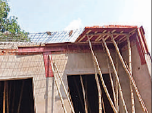
निर्माणाधीन राशन की दुकान की ढही हुई छत।