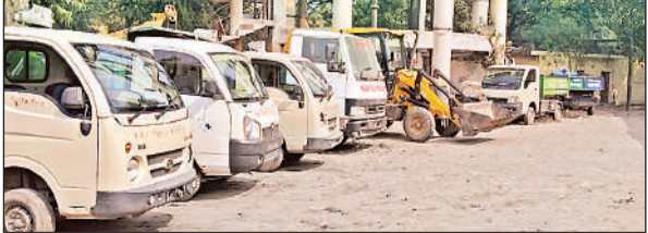
पालिका के जलकल केम्यूस में खड़े नगरपालिका के वाहन।

अमृत विचार: आरटीओ के नियम कानून यहां बेमानी हैं। हाई सिक्युरिटी नंबर प्लेट के इस दौर में भी नगरपालिका के वाहनों में से अधिकांश पर नंबर प्लेट ही नहीं है। इतना ही नहीं कुछ वाहनों का पंजीकरण तक नहीं करया गया है, अस्थायी पंजीकरण की मियाद कब की बीत चुकी है। बिना पंजीकरण शहर की सड़कों पर दौड़ रहे वाहनों की संख्या छह बताई जा रही है। नगरपालिका के पास दो छोटी पोल्सैंड, दो जैसीबी, दो डंपर, 15 मैजिक (डीजल), 12 टेपो