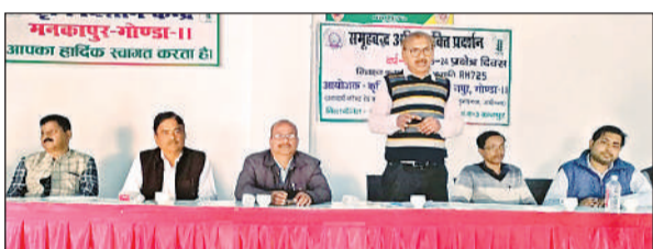
कृषि गोष्ठी को संबोधित करते विशेषज्ञ।