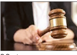
विधि संवाददाता, सुलतानपुर