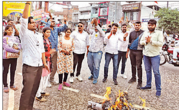
पश्चिम बंगाल सरकार का पुतला जलाते अभिविप के सदस्य।