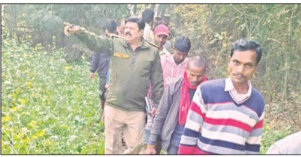
बालिका की हत्या के बाद जांच करते कोतवाल और जमा भीड़।