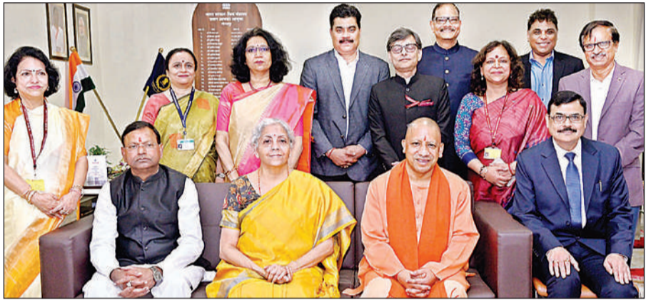
लोकार्पण समारोह के दौरान केंद्रीय वित्त मंत्री निर्मला सीतारमण, मुख्यमंत्री योगी व अन्य।

केंद्रीय वित्त मंत्री ने योगी के लिए खुद द्वारा कहे गए 'डायनमिक शब्द' को समझाया भी। उन्होंने कहा कि प्रदेश में 75 जिले हैं और एक साल में 52 सप्ताह होते हैं। योगी, साल भर में प्रत्येक जिले का कम से कम एक बार दौरा जरूर करते हैं। कुछ जिलों में यह संख्या और कई बार होती है। एक साल में 52 सप्ताह और 75 जिले में कम से कम एक बार जाने वाले वह चीफ