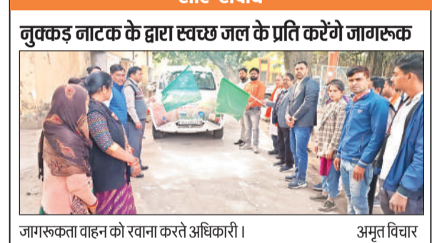
जामरुकता वाहन को रवाना करते अधिकारी।