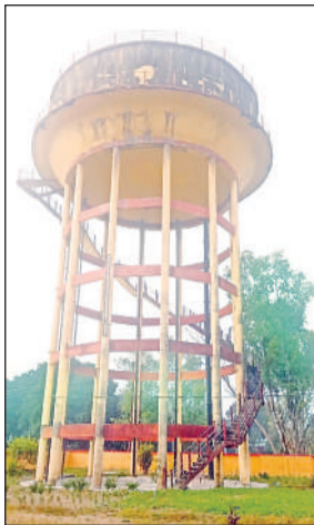
सोनौली मोहम्मदपुर गांव में बनी टंकी।