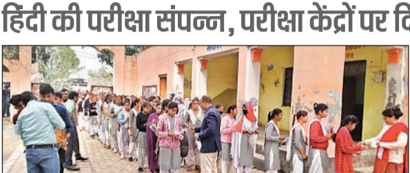
करनेलगंज स्थित परीक्षा केंद्र पर छात्र छात्राओं की तलाशी लेते शिक्षक व शिक्षिकाएं।