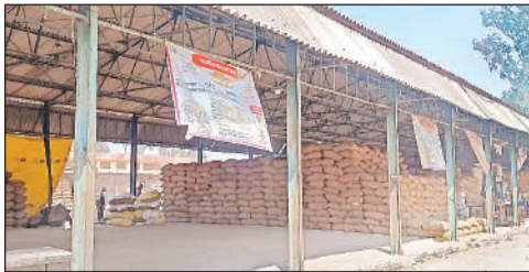
नवीन गल्ला मंडी में स्थापित धान क्रय केंद्र।