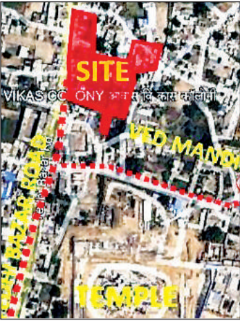
राममंदिर के निकट इसी स्थान पर होगा बहुमंजिली आधुनिक पार्किंग का निर्माण।

जमीन पर कुल 474 कार क्षमता के भूतल के साथ दो-दो मंजिली स्मार्ट पार्किंग के निर्माण की योजना पर काम शुरू किया है। ईपीसी योजना के तहत कार्यदायी संस्था को परियोजना के डिजाइन और इंजीनियरिंग कार्य, आवश्यक सामग्री व उपकरणों की खरीद तथा निर्माण कार्य करना होगा और नियोजन विभाग ने 18 माह में निर्माण और विकास पूरा करने तथा 10 वर्षों तक मरम्मत की शर्त रखी है। जिसके लिए नियोजन विभाग ने निविदा जारी की है। योजना में भूतल प्रथमतया पर कुल 11 दुकानों का निर्माण भी किया जाना है। साथ ही भविष्य में इस पर एक और तल के निर्माण का प्रारूप तैयार किया गया है।