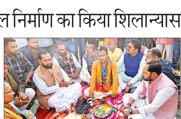
पुल का शिलान्यास पूजन करते विधायक।