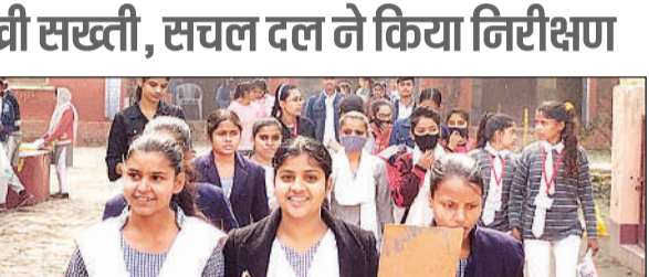
परीक्षा केंद्र से बाहर निकलती छात्राएं।