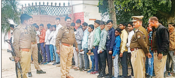
कुड़वार के एक परीक्षा केंद्र पर पुलिस की निगरानी में छात्रों को दिया गया प्रवेश।

अमृत विचार। यूपी बोर्ड की हाईस्कूल व इंटरमीडिएट की परीक्षा गुरुवार से जिले के 122 केंद्रों पर आपाधामी के बीच शुरू हुई। कई केंद्रों पर कक्ष निरीक्षकों की अनुपस्थिति में रिलीवर से काम चलाना पड़ा। सख्ती के चलते पहले ही दिन 3,757 छात्र-छात्राओं ने परीक्षा से किनारा कर लिया। दोनों पालियों में निकले छह-छह उड़नदस्तों को कोई भी नकलची हाथ नहीं लगा। देश शाम तक संकलन केंद्र बनाए गए शहर के जीआईसी में उत्तर