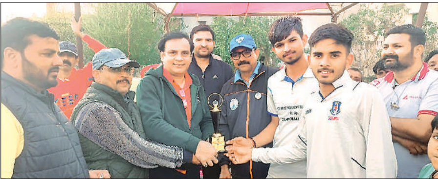
विजेता टीम को शिल्ड देते मुख्य अतिथि।