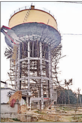
नगर पंचायत में निर्माणधीन पानी टंकी और पड़े पाइप।

जिले के नगर पंचायत रूपईडीहा में वर्ष 2017 में करीब सात करोड़ की लागत से पेयजल परियोजना का निर्माण कराया गया। टंकी बनवाकर पूरे कस्बे में पाइपलाइन डाली गई। पेयजल योजना से करीब 30 हजार आबादी को जलापूर्ति की जानी थी। निर्माण के सात साल बाद भी पेयजल योजना नगर पंचायत को