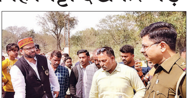
मानकविहीन हो रहे नाला निर्माण पर भड़के विधायक, बुलाई पुलिस। अमृत विचार

राजमार्ग पर बन्धुआकला रेलवे स्टेशन के सामने लगभग दो सौ मीटर नाला बनाने का काम काफी समय से अधूरा पड़ा था। इस बात