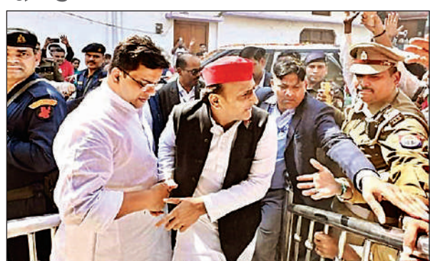
पूर्व कैबिनेट मंत्री के यहां पहुंचे अखिलेश यादव।