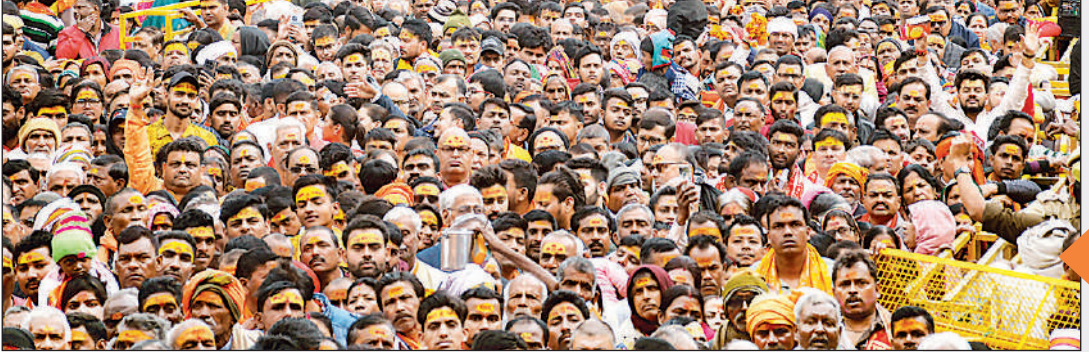
श्रद्धालुओं ने हनुमान मंदिर व राम मंदिर में किया दर्शन-पूजन