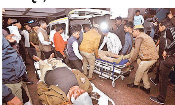
घायलों को सिविल अस्पताल में भर्ती कराने के लिए ले जाते सुरक्षा और स्वस्थकर्मी।

संयुक्त पुलिस आयुक्त कानून एवं व्यवस्था उपेंद्र अग्रवाल के मुताबिक, यह दुर्घटना शाम लगभग 7:45 बजे हुई। मुख्यमंत्री योगी आदित्यनाथ के बेटे की सुरक्षा के लिए इंटरसेप्टर और एंटी-डेमो वाहनों सहित जिला पुलिस के