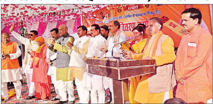
गरीब कन्याओं को पीढ़ा वितरण कार्यक्रम में मौजूद अतिथि।