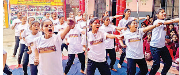
ताइक्वांडो से आत्मरक्षा के टिप्स सीखती छात्राएं।

गुप्ता रहीं। दीप प्रज्वलित कर प्रशिक्षण का समापन हुआ। इसके बाद अतिथियों के सामने छात्राओं ने रंगारंग सांस्कृतिक कार्यक्रम प्रस्तुत किया। ताइक्वांडो के द्वारा अपने आत्मरक्षा का संकल्प लिया। प्रशिक्षण कार्यक्रम के दौरान आग लगने पर कैसे बचाव