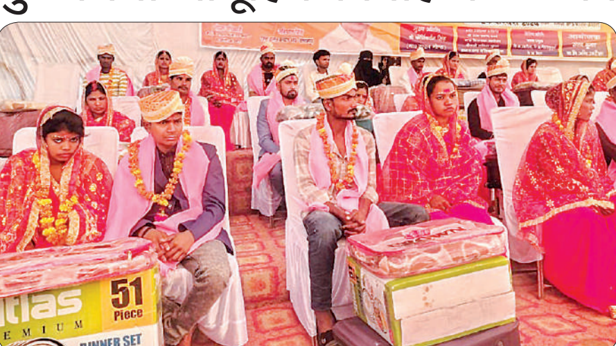
विकास खण्ड उतरौला परिसर में आयोजित सामूहिक विवाह में मौजूद नवविवाहित जोड़े।