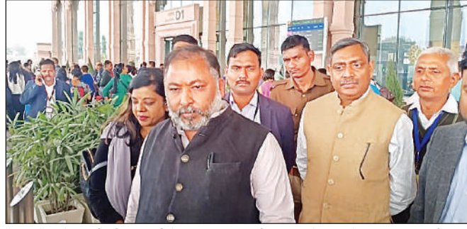
नेपाल के विदेश मंत्री की आगवानी के लिए महर्षि वाल्मीकि एयरपोर्ट पर मौजूद परिवहन मंत्री।

उन्होंने कहा कि नगरिय निदेशालय की ओर से अयोध्या में 225 इलेक्ट्रिक सिटी बसें का संचालन किया जा रहा है। रोडवेज को मुख्यालय से नई बीएस-6 मॉडल की बसें उपलब्ध कराई जा रही हैं। विभाग की योजना भविष्य में प्रदेश के विभिन्न रूटों पर इलेक्ट्रिक बसें के संचालन को है, जिसके लिए प्रक्रिया चल रही है।