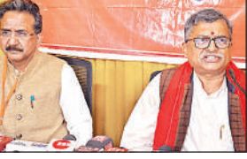
श्रीराम जन्मभूमि मंदिर निर्माण कार्यशाला में पत्रकारों से बातचीत करते विहिप के अंतरराष्ट्रीय महामंत्री।