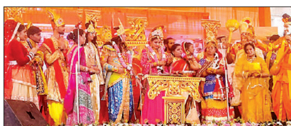
भारत नेपाल मैत्री महोत्सव में सांस्कृतिक कार्यक्रम प्रस्तुत करते कलाकार।