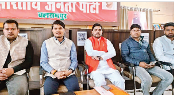
भारतीय जनता पार्टी कार्यालय में बैठक के दौरान मौजूद पदाधिकारी।