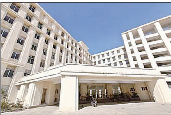
ट्रामा सेंटर, बर्न और आईसीयू के लिए बनकर तैयार बिल्डिंग।

जिले की लगभग 28 लाख आबादी को बेहतर स्वास्थ्य सेवाएं मुहैया कराने के लिए 226 करोड़ की लागत से माधव प्रसाद त्रिपाठी मेडिकल कॉलेज की स्थापना की गई। इसमें प्रशासनिक भवन के साथ 300 बेड का अस्पताल