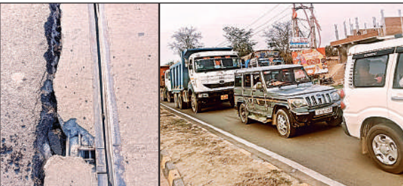
गोमती नदी पुल का टूटा गार्डर। शहर के रास्तों पर लगा वाहनों का काफिला।

ज्वाइंट टूटने से नौ माह में दूसरी बार यातायात प्रभावित हो गया है। 2023 के आगाज के महज 10 दिन पहले ही भारतीय राष्ट्रीय राजमार्ग प्राधिकरण (एनएचआई) की ओर से पुल का नवीनीकरण कराया गया था। इसके बाद फिर लगातार दो बार