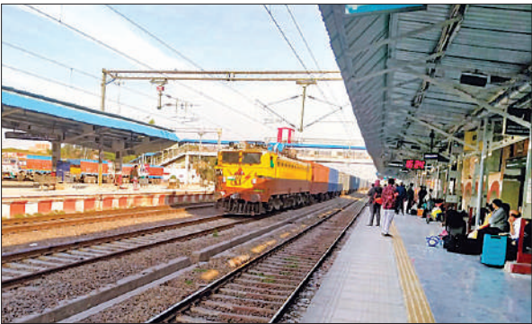
उद्घाटन के लिए रेलवे स्टेशन की शुरू हुई साफ-सफाई।

संतकबीरनगर, अमृत विचार। जनपद मुख्यालय को दो हिस्सों में बांटने वाली रेलवे लाइन के त्रिपाठी मार्केट और तितौवा रेलवे क्रॉसिंग पर प्लाईओवर निर्माण का मामला खटाई में पड़ता दिख रहा है। क्षेत्रीय सांसद ई. प्रवीण निषाद की जिले में विकास के प्रति उदासीनता और धरातल पर उनकी गैर मौजूदगी के चलते प्रधानमंत्री नरेन्द्र मोदी के ड्रीम प्रोजेक्ट में संतकबीरनगर जिले को कोई स्थान नहीं मिल सका है। बताते चलें कि प्रधानमंत्री नरेन्द्र मोदी 26 फरवरी को देश के 544 रेलवे स्टेशनों के कायाकल्प और 1500 रेलवे प्लाईओवरों और अण्डरपासों का वचुंअल तरीके से उद्घाटन और शिलान्यास करने वाले हैं। जनपद वासियों को लग रहा था कि इन दोनों रेलवे फाटकों के बहु प्रतिक्षित प्लाईओवरों का शिलान्यास भी आज ही हो जाएगा।