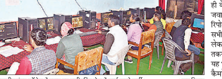
राजकीय इंटर कॉलेज में बनाए गए मॉनीटरिंग सेल में कार्य करते कर्मी।

अयोध्या कार्यालय अमृत विचार : माध्यमिक शिक्षा परिषद की ओर संचालित हाईस्कूल और इंटरमीडिएट परीक्षा के पहले दिन ही गुन्वार को दागी निकले 12 परीक्षा केंद्रों पर अब चौथी नजर भी लग गई है। मॉनीटरिंग सेल की ओर से दी गई रिपोर्ट के आधार पर इन परीक्षा केंद्रों पर नकल का संदेह गहरा गया है। इसे लेकर अब जिला स्तर पर गठित टास्क फोर्स की निगाह भी इन केंद्रों पर गढ़ गई है। जिला विद्यालय निरीक्षक ने नोटिस जारी कर स्पष्टीकरण तलब किया गया है। बताया जा रहा है यदि स्पष्टीकरण से विभाग संतुष्ट नहीं हुआ तो इन सेंट्रों को बोर्ड परीक्षा से डिबार किए