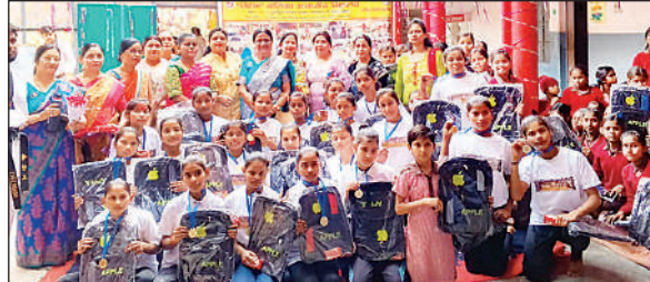
छात्राओं को मिला बैग।