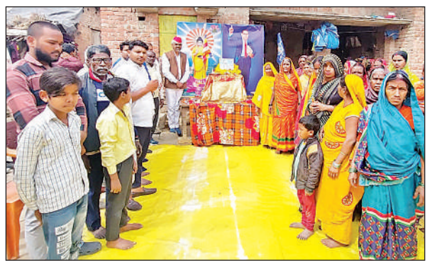
संत रविदास की जयंती मनाते सपा नेता व ग्रामीण।

संत रविदास की जयंती मनाते सपा नेता व ग्रामीण। अमृत विचार