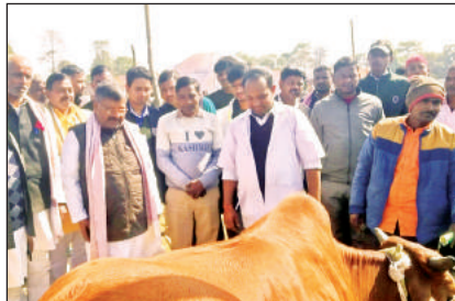
पशु चिकित्सा मेले में पशुओं का उपचार करते चिकित्सक।

अमृत विचार : मर्वई ब्लाक के ग्राम माजनपुर में शनिवार को, दीनदयाल उपाध्याय पशु चिकित्सा मेला का आयोजन किया गया। उद्घाटन मुख्य अतिथि सांसद लल्लू सिंह व विशिष्ट अतिथि रुदीली विधायक रामचंद्र यादव ने किया। मेले में 4205 बड़े पशु, 3310-छोटे पशु को स्वास्थ्य परामर्श तथा उपचार प्रदान किया गया। सांसद लल्लू सिंह ने बताया गया की ग्रामीण क्षेत्रों में पशुपालन स्वरोजगार का एक मुख्य साधन है। उन्होंने पशुपालकों से योजना का लाभ उठाने की बात कही। सांसद ने उरई से आरई विनीता सम्मानित किया गया। विधायक रामचंद्र यादव ने पशुपालकों को जन कल्याणकारी योजनाओं के बारे में जागरूक किया गया। मेले में अपर निदेशक ग्रेड-दो पशुपालन विभाग डॉ. अरविंद कुमार सिंह ने पशुधन बीमा, बकरी, भेड़, कुक्कड़ पालन व जानकी गोकुल मिशन के तहत निशुल्क कुत्रिम भ्रंशान योजना के बारे में विस्तार से राश्ट्रीय की। मुख्य पशु चिकित्साधिकारी डॉ. जगदीश सिंह ने मुख्यमंत्री सहभागिता योजना, निराश्रित गो संरक्षण के बारे में जानकारी दी।