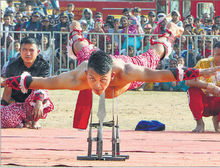
सेना दिवस के अवसर पर नागपुर में आयोजित भारतीय सेना प्रदर्शनी-शौर्य संस्था में एक सेना अधिकारी ने अपना कौशल दिखाया। इस दौरान लोगों ने जवानों के साहसिक करतबों की खूब प्रशंसा की।