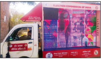
जागरूकता ईवीएम वैन से जागरूक होते लोग।

कैसरगंज, अमृत विचार। कैसरगंज क्षेत्र में ईवीएम वैन के द्वारा लोगों को मतदान के प्रति जागरूक किया गया। जिला प्रशासन द्वारा सामान्य लोकसभा चुनाव के लिए मतदाताओं को ईवीएम से मतदान के जागरूकता के लिए दिनांक 24 जनवरी से जनपद