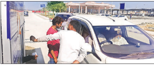
कार सवार से पार्किंग शुल्क वसूला कर्मी।

अमृत विचार : अयोध्या के महर्षि वाल्मीकि अंतरराष्ट्रीय एयरपोर्ट पर अगर आप किसी को छोड़ने जा रहे हैं और आठ मिन्ट से अधिक लगा दिए तो पार्किंग शुल्क देना पड़ेगा। यहां छोटे से बड़े वाहनों के लिए अलग-अलग चार्ज निर्धारित किया गया है। कार से अगर आप किसी को लेने गए हैं तो बाहर आते समय उसका भी अलग चार्ज देना पड़ेगा। इसके लिए एयरपोर्ट अथॉरिटी ने एएस मल्टी सर्विस को पार्किंग का ठेका दिया है। रामलला के भव्य मंदिर में विराजमान होते ही अयोध्या में श्रद्धालु व पर्यटकों की संख्या में भी