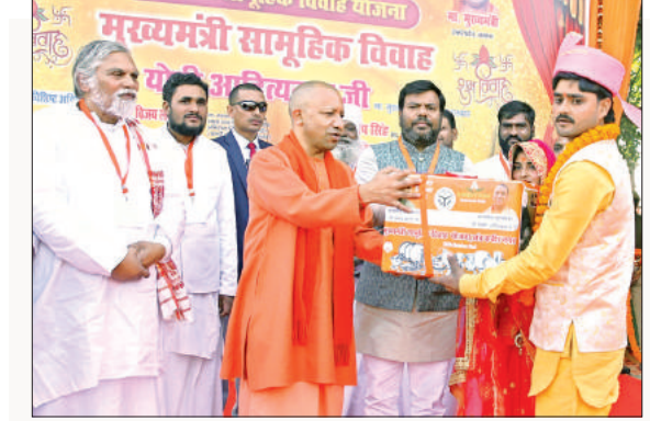
नवविवाहित जोड़े को उपहार प्रदान करते मुख्यमंत्री।