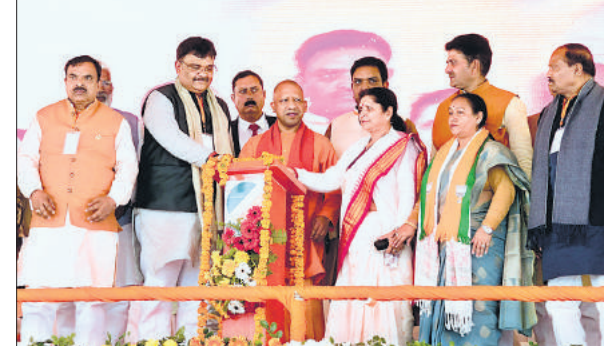
कन्नौज में विकास योजनाओं का लोकार्पण करते मुख्यमंत्री योगी आदित्यनाथ।

मुख्यमंत्री योगी आदित्यनाथ ने शनिवार को तीन जिलों के दौर की शुरुआत कन्नौज से की। यहां में 352 करोड़ की 59 और संत कबीर नगर में 360 करोड़ की 114 परियोजनाओं का शिलान्यास और लोकार्पण किया। साथ ही महाहर