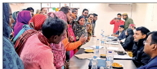
समाधान दिवस में सीडीओ से शिकायत करते पीडित ग्रामीण।