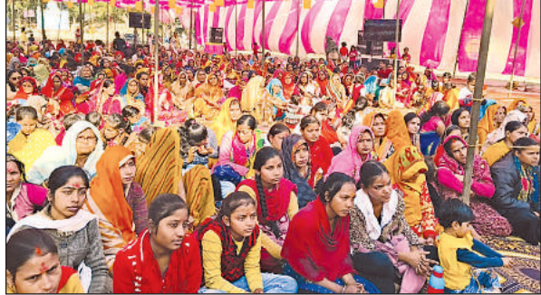
कथा में मौजूद श्रोतामण। अमृत विचार

मैं वार्ता करके अपनी बात रखेंगे कि जिस तरह प्रदेश के हजारों मंदिरों का जीर्णोद्धार उन्होंने किया है। उसी तरह भगवान चतुर्भुजीनाथ मन्दिर का भी जीर्णोद्धार कर इसका उद्घाटन अपने हाथों से करें। कार्यक्रम