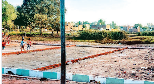
नगर पंचायत के तालाब को पाटकर की गई प्लाटिंग। अमृत विचार

अमृत विचार: स्थानीय नगर पंचायत में भू माफियाओं ने एक तालाब को पाटकर उस पर नींव भर दी। इसके बाद प्लाटिंग कर उसकी खरीद फरोख्त भी शुरू कर दी। शनिवार को सभासदों ने इसका विरोध किया और इसकी सूचना पुलिस को दी। मौके पर पहुंची पुलिस ने निर्माण कार्य बंद करवा दिया। एसडीएम ने तालाब की पैमाइश के लिए नायब तहसीलदार को निर्देश दिया है।