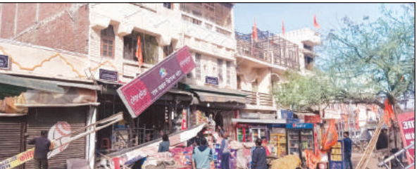
सिविल लाइन में शनिवार को रामपथ पर स्थित दुकानों से बोर्ड हटाते कर्मी।

अमृत विचार : रामपथ पर स्थित दुकानों पर मनमाने ढंग से अब प्रचार बोर्ड नहीं लग सकते हैं। इसे लेकर अयोध्या विकास प्राधिकरण ने कवायद शुरू कर दी है। प्राधिकरण की ओर से दुकानदारों से भी इसे लेकर अपील की जा रही है।