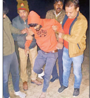
बैंक लूट करने वाले घायल बदमाश को अस्पताल ले जाते पुलिसकर्मी।

गोंडा कार्यालय: पुलिस अधीक्षक कार्यालय से चंद कदम की दूरी पर हुई बैंक लूट की वारदात का पुलिस ने महज 10 घंटे के भीतर खुलासा कर दिया। लुटेरे की तलाश में जुटी पुलिस टीम ने शुक्रवार की देर रात मुठभेड़ में आरोपी को गिरफ्तार कर लिया। मुठभेड़ के दौरान आरोपी ते पैर में गोली लगी है और उसे इलाज के लिए जिला अस्पताल में भर्ती कराया गया है। आरोपी के पास से पुलिस ने लूटे गए 8.54 लाख रुपये व घटना में प्रयुक्त बाइक, हंसिया व हेलमेट बरामद कर लिया है। एसपी ने खुलासा करने वाली एसओजी व नगर कोतवाली की पुलिस टीम को 25 हजार रुपये का पुरस्कार दिया