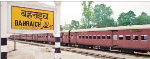
बहराइच - नेपालगंज रेल लाइन।