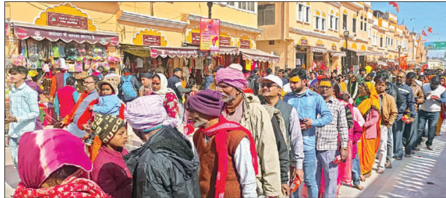
हनुमानगढ़ी पर शनिवार को हनुमंतलला के दर्शन के लिए कतारबद्ध दिखे श्रद्धालु।

अमृत विचार : प्राण प्रतिष्ठा के बाद दूसरे शनिवार को रामनगरी में आस्था का जनसैलाब देखने को मिला। हनुमानगढ़ी में दर्शन के लिए दो किलोमीटर लंबी लाइनें सुबह से ही लगी रही।