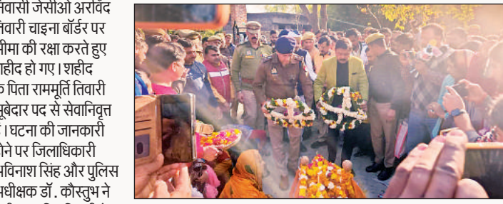
शहीद के पार्थिव शरीर पर पुष्प गुच्छ अर्पित करते डीएम व एसपी।

अहिरोली थाना क्षेत्र के आशागढ़ तिवारी का पूरा गम्भीन हो गया। हर आंख नम थी। इस दौरान उप