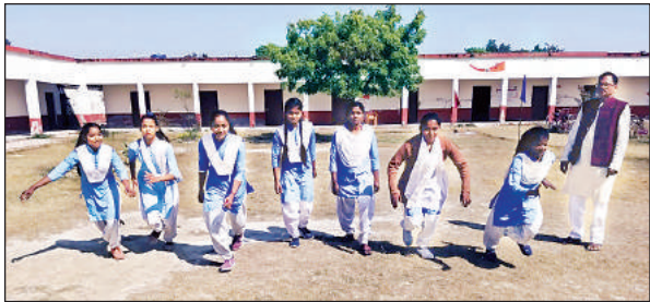
खेलकूद प्रतियोगिता में जोर आजमाइश करती छात्राएं।

शनिवार को विद्यालय परिसर में संस्थापक स्व. सिंह के चित्र पर पुष्पांजलि अर्पित कर उन्हें याद किया गया। वक्तवाओं ने उनके व्यक्तित्व एवं कृतित्व पर व्यापक रूप से प्रकाश डालते हुए उनके आदर्शों का अनुकरण करने