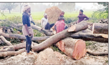
रिसिया क्षेत्र में काटे जा रहे पेड़।

रिसिया, बहराइच, अमृत विचार। रिसिया वन बीट क्षेत्र में बड़े पैमाने पर बगैर परमिट के हरे पेड़ों की कटाव धडल्ले से हो रही है। इन कार्यों में स्थानीय वन महकमा और लकड़कट्टे के बीच सांठ गांठ होने से हरे पेड़ निकट वर्ती भट्टे तक जा रहे है। वन विभाग कोई कार्रवाई नहीं कर रहा है। बहराइच वन प्रभाग के नानपारा रेंज अंतर्गत रिसिया ब्लाक के राय पुर कबूला में पिछले दिनों एक बग में हरे पेड़ों की कटाव हुई थी, तब वन महकमा ने संज्ञान नहीं लिया था, अब बीते दिनों लक्ष्मण पुर शंकर पुर के गुरा गांव में हरे पेड़ों पर लकड़ कट्टे के आरा चल गए, यहां एक दर्जन से अधिक पेड़ काटे गए है, इसी तरह थाना रिसिया क्षेत्र के कुछ अन्य गांवों में भी बीते दिनों हरे पेड़ों की अघाबुंघ कटाव हुई है। इस कार्य में स्थानीय वन महकमे के अधिकारी एवम कमचारियों से लकड़ कट्टे की मिली भगत रही है। नानपारा रेंज के रेंजर से जानकारी ली गई तो उन्होंने बताया कि मुझे जानकारी नहीं है, फिर भी जांच कराई जा रही है।