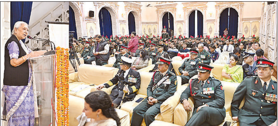
राष्ट्रीय गणतंत्र दिवस समारोह में उत्कृष्ट प्रदर्शन करने वाले एनसीसी कैडेट्स के लिए राजभवन में आयोजित सम्मान कार्यक्रम के दौरान संबोधित करती राज्यपाल आनंदीबेन पटेल, कार्यक्रम में उपस्थित अन्य।

अवगत कराया कि 2017 से 21 दिसम्बर 2022 तक महिलाओं व बच्चियों के साथ घटित अपराधों में 21 हजार 872 अभियुक्तों को सजा दिलाई जा चुकी है। इसमें से 8630 को पॉक्सो एक्ट में, 13217 को अन्य अपराध में, 1384 को आजीवन कारावास, 18 को मृत्युदंड और 135 अपराधियों को 10 साल से कम की सजा दी गई है। भाजपा सरकार में कोई भी अपराधी बच नहीं सकेगा।