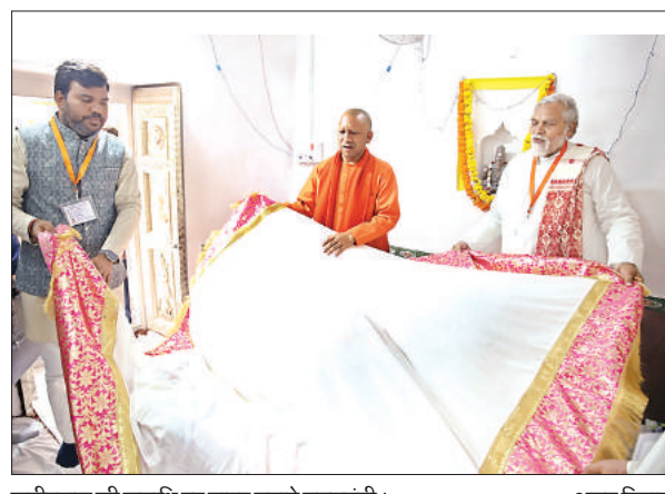
कबीरदास की समाधि पर वादर वढ़ाते मुख्यमंत्री।

उत्तर प्रदेश के चुनिंदा पर्यटन केंद्रों में बखिरा झील को भी शामिल किया जाएगा और मछुआरों को यहां रोजगार के प्रमुख अवसर उपलब्ध कराए जाएंगे। इसके साथ ही जिले की पहचान बाबा तामेश्वरनाथ मंदिर को भी खूबसूरत पर्यटन केंद्र के रूप में स्थापित कराया जाएगा। रुपरेखा तैयार हो चुकी है, शीघ्र ही काम शुरू करा दिये जाएंगे। उन्होंने कहा कि जनपद मुख्यालय पर रोडवेज स्टेशन और मेडिकल कालेज की