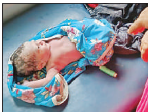
30 मिनट बाद ट्रेन को मनकापुर से छपरा के लिए रवाना किया गया।

गोंडा कार्यालय:शुक्रवार रात दिल्ली से बिहार जा रही बरौनी क्लोन एक्सप्रेस में उस बक्क एक नवजात को किलकारी गूंज उठी जब यात्रा कर रही एक प्रसव पीड़िता ने महिला यात्रियों के सहयोग से ट्रेन में ही एक बेटे को जन्म दिया। महिला की डिलीवरी कराने में मनकापुर रेलवे सुरक्षा बल की भी अहम भूमिका रही। प्रसव पीड़ा की जानकारी मिलते ही आरपीएफ इंस्पेक्टर ने मनकापुर में ट्रेन को रुकवाया और प्रसव पीड़ित महिला को फौजर चिकित्सा सुविधा मुहैया कराई। डिलीवरी के बाद जच्चा बच्चा दोनों स्वस्थ पाए गए। करीब