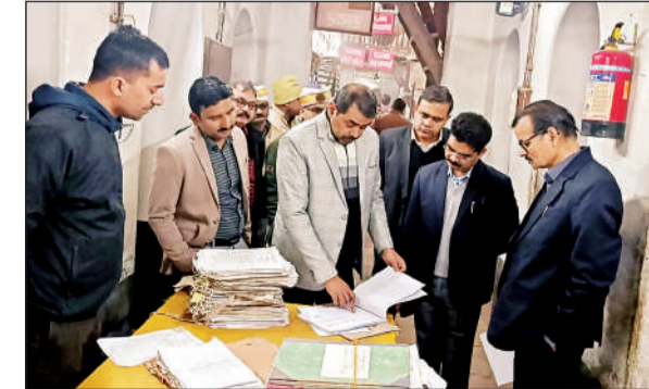
अभिलेखों का निरीक्षण करते अपर आयुक्त।

भूलेख, सम्मिलित कार्यालय, नजूल कक्ष, एनआईसी, सांख्यिकी अनुभाग, राजस्व लेखाकार कक्ष सहित विभिन्न पटलों का निरीक्षण कर विभिन्न कार्यों/कर्मचारियों का अवलोकन किया। कर्मचारियों की व्यक्तिगत पत्रावलिधियों सेवा पुस्तिका आदि का भी अवलोकन किया। शस्त्र अनुभाग के निरीक्षण के दौरान कहा कि वरासत के कोई भी प्रकरण पेंडिंग न रहे, हर शस्त्र के यूएनआई कोड मौजूद रहने चाहिए। पर्यटन विभाग में चल रहे कलेक्ट्रेट परिसर की साफ सफाई एवं अन्य व्यवस्थाओं की सराहना की। रिकॉर्ड और की सफाई व्यवस्था को रूम दुरुस्त करने का निर्देश दिया। राजस्व कार्यों के अंतर्गत विभिन्न बिंदुओं