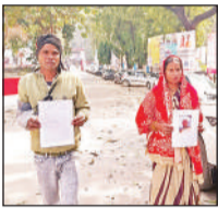
शिकायती पत्र देने आए दंपती।