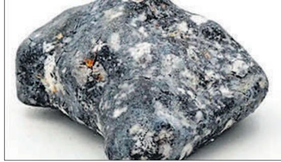
जर्मनी में गिरे क्षुद्रग्रह की तस्वीर।

अमृत विचार: जर्मनी में गिरा क्षुद्रग्रह पृथ्वी के उत्पत्ति में प्रकाश डालने में मददगार साबित हो सकता है। यह क्षुद्रग्रह 21 जनवरी को गिरा था। इस घटना से क्षुद्रग्रह के पृथ्वी के वातावरण में टकराने के दौरान व्यवहार संबंधित कई नई जानकारी मिल सकती है। इस क्षुद्रग्रह को दुर्लभ अंतरिक्ष चट्टान माना जा रहा है। घटना के पांच दिन बाद यह क्षुद्रग्रह बरामद किया गया था। क्षुद्रग्रह का नाम 2024 बीएक्स1 है। वैज्ञानिकों द्वारा जांच करने के बाद पता चला कि चट्टान का यह टुकड़ा ऑब्राइट नामक दुर्लभ श्रेणी का है। इस तरह के टुकड़े सौर मंडल के पुराने दुर्लभ उल्कापिंड होने की पुष्टि करते हैं। अमेरिकी संस्था सेटी इंस्टीट्यूट के