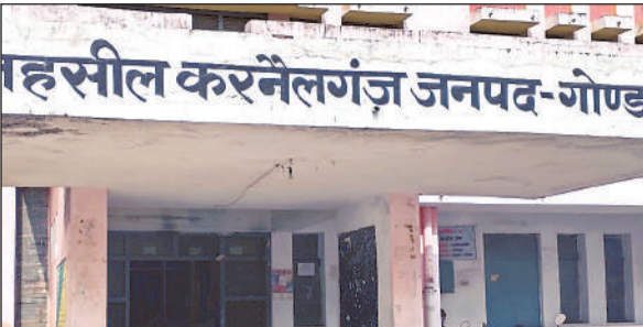
करनैलगंज तहसील की फोटो।

करके मनमानेपन की छूट देने व सरकार की मंशा के विपरीत भ्रष्टाचार पर जोरो टारलेंस नीति का उल्लंघन करने का आरोप लगाया है। अधिवक्ताओं ने वर्षों से विभिन्न पटलों पर जमें पटल सहायको का स्थानान्तरण न करने का आरोप भी लगाया है। मनकापुर