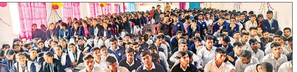
जय बजरंग इंटरमीडिएट कॉलेज में विदाई समारोह में उपस्थित छात्र।