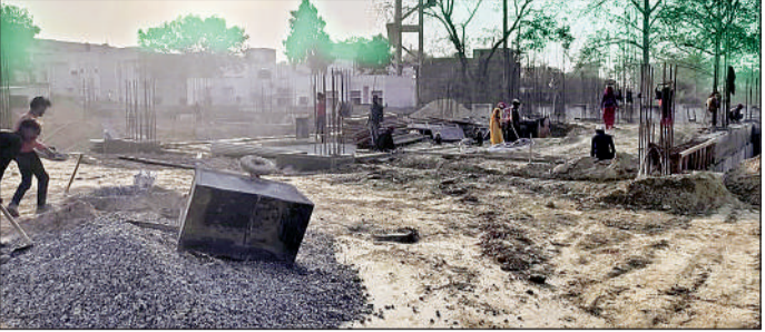
डेडलाइन मिलते ही कार्यवाही संस्था ने ट्रॉमा सेंटर का निर्माण कार्य किया तेज।

अमृत विचार : आने वाले दिनों में बड़ी दुर्घटनाओं के बाद मरीजों को लखनऊ या अन्य महानगरों में जाने की जरूरत नहीं पड़ेगी। न ही जल्दी मरीजों को मेडिकल कॉलेज से हायर सेंटर रेफर किया जाएगा। इसके लिए जिले में बड़ी व्यवस्था की जा रही है। जून 2025 तक मेडिकल कॉलेज के परिसर में ही 110 बेड का ट्रॉमा सेंटर तैयार हो जाएगा। 1500 स्क्वायर मीटर में चार मंजिला भवन तैयार करने का कार्य शुरू हो गया है। इसका निर्माण होते होने से जिले के अलावा गोंडा, बस्ती व