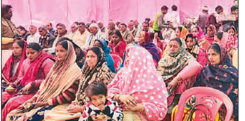
विकासखंड परिसर बसखारी में आयोजित मेले में मौजूद किसान।

से खेती करें। जिला उद्यान अधिकारी सुनील तिवारी ने कृषक गोष्ठी में जनपद में संचालित समस्त योजनाओं के बारे में और जैविक संसाधनों का वैज्ञानिक तरीके से उपयोग लागत में कमी व पर्यावरण की संरक्षा कर खेती का विविध करण कर कृषकों को आय