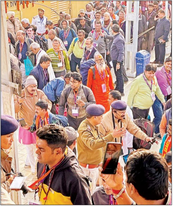
आस्था स्पेशल ट्रेन से रामनगरी पहुंचे रामभक्त।