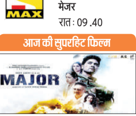
सोनी मेक्स पर रात-09.40 बजे