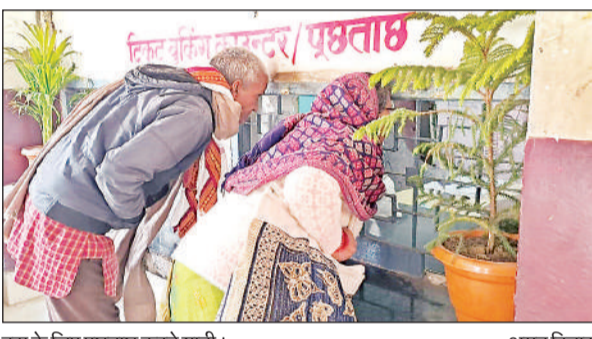
बस के लिए पूछताछ करते यात्री। अमृत विचार