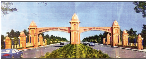
भारत नेपाल सीमा पर इस तरह बन रहा मैत्री द्वार।

जिले की तहसील नानपारा के कस्बे रूपईडीहा में बाराबंकी-बहराइच-रूपईडीहा राष्ट्रीय मार्ग के अन्तिम चौनेज में प्रवेश द्वार का निर्माण कार्य होना है। प्रवेश द्वार के