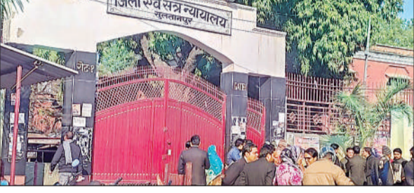
दीवानी न्यायालय का मुख्य गेट।