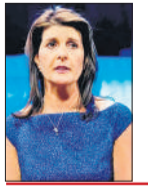
निक्की बोली अमेरिका का भागीदार बनना लेकिन बाइडन पर भरोसा नहीं

निक्की हेली ने कहा कि भारत अमेरिका के साथ भागीदार बनना चाहता है, लेकिन अभी उन्हें अमेरिकियों के नेतृत्व पर भरोसा नहीं है। भारतीय-अमेरिकी राष्ट्रपति पद के उम्मीदवार बनने की रेस में शामिल निक्की ने यह भी कहा कि नई दिल्ली ने मौजूदा वैश्विक स्थिति में चतुराई से खेला है और रूस के साथ करीब रहा है। मीडिया को दिए साक्षात्कार में 51 साल की हेली ने कहा कि फिलहाल भारत अमेरिका को कमजोर मानता है। उन्होंने कहा कि मैंने भारत के