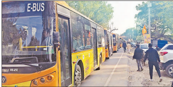
यात्रियों को लेने आई कटार में खड़ी ई-बसें। अमृत विचार

आने और राम दर्शन की खुशी साफ झलक रही थी। स्टेशन पर उतरते ही यात्रियों ने जय श्री राम रा जोरदार जयकारा लगाया। इस उद्घोष से समूचा स्टेशन परिसर गूंज उठा। यात्रियों को पहले टेंट सिटी ले जाया गया जहां उनके चाय नाश्ते की व्यवस्था की गयी थी। इसके बाद उन्हें प्रशासन की तरफ