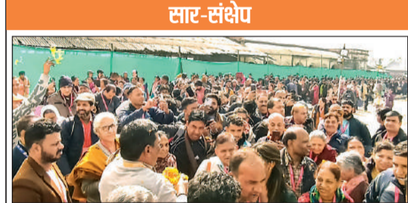
आस्था स्पेशल ट्रेन से अयोध्या कैट रेलवे स्टेशन पहुंचे श्रद्धालु।