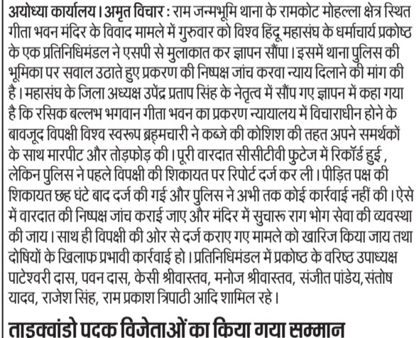
सम्मानित हुए ताइवाइको पदक विजेता।