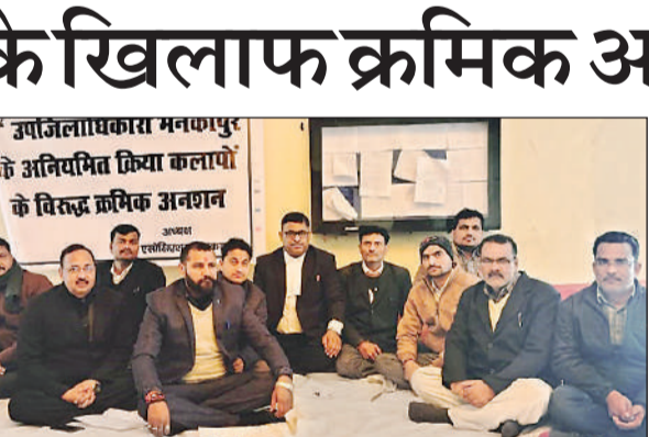
मनकापुर तहसील में एसडीएम के खिलाफ धरने पर बैठे अधिवक्ता।

क्रमिक अनशन करते हुए उपजिलाधिकारी के स्थानान्तरण की मांग किया। अधिवक्ताओं के क्रमिक अनशन की खबर मिलते ही जिलाधिकारी के प्रतिनिधि के रूप में मुख्य राजस्व अधिकारी ने तहसील पहुंच कर संघ के नामित पदाधिकारियों से घंटों वार्ता की लेकिन यह वार्ता बेनतीजा रही। एसडीएम पर अधिवक्ताओं ने लगाये अविवादित मामलो को लंबित रखने प्रशासनिक बल का अनावश्यक प्रयोग करने,अपने अधीनस्थो पर कोई नियंत्रण न