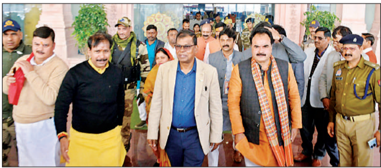
महर्षि वाल्मीकि अंतरराष्ट्रीय एयरपोर्ट से बाहर निकलते फिजी के उप प्रधानमंत्री बिमान प्रसाद व मीजूद अन्य लोग।

विमान से उतरने के बाद भावुक और अभिभूत दिखे उप प्रधानमंत्री ने एयरपोर्ट पर मीडिया से बातचीत करते हुए कहा कि हमारे पूर्वज भारत खासकर उत्तर प्रदेश और बिहार से रामायण और गीता लेकर गए थे। एक लंबे संघर्ष के बाद फिजी में