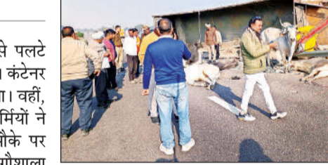
पूर्वांचल एक्सप्रेसवे पर पलटा गोवंशों से लदा कंटेनर।

अमृत विचार। चालक की झपकी से पलटे कंटेनर ने गो तस्करी की पोल खोल दी। कंटेनर पलटने पर चालक मौके से भाग निकला। वहीं, सूचना पर पहुंचे यूपीडा के सुरक्षा कर्मियों ने स्थानीय पुलिस को सूचित किया। मौके पर पहुंची पुलिस ने जीवित गोवंशों को गोशाला भेजा, जबकि मृत गोवंशों को दफन कराया। सांसद मेनका गांधी के निर्देश पर मुकदमा दर्ज कर लिया गया।