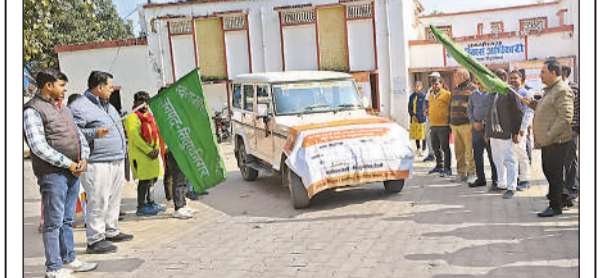
जागरूकता वैन को हरी झंडी दिखाकर रवाना करते अधिकारी।