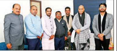
दिल्ली में रक्षामंत्री से मुलाकात करता दल।