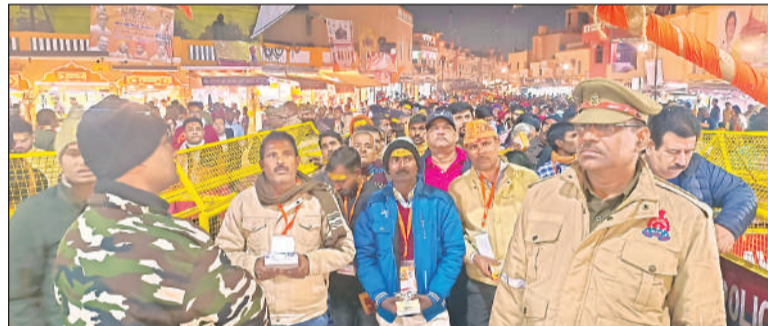
सुरक्षा व्यवस्था में लगे पुलिसकर्मी।

का इस्तेमाल किया जा रहा है। जिससे लोगों को कोई असुविधा न हो। हनुमानगढ़ी मंदिर पर जाने के लिए दर्शनार्थियों के लिए कपिल गंज बाजार