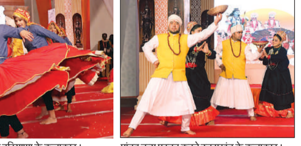
सांस्कृतिक कार्यक्रम में फाग नृत्य पेश करते हरियाणा के कलाकार। पांडव नृत्य प्रस्तुत करते उत्तराखंड के कलाकार।