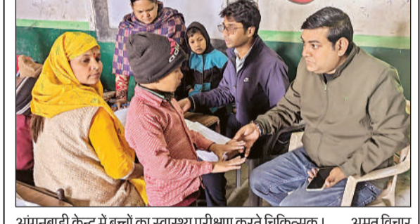
आंगनबाड़ी केन्द्र में बच्चों का स्वास्थ्य परीक्षण करते चिकित्सक। अमृत विचार