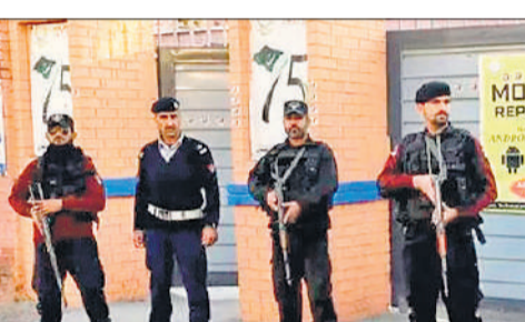
मतगणना स्थलों के आसपास मौजूद रहे सुरक्षाकर्मी दूसरी तरफ मतदान करते पूर्व पीएम नवाज शरीफ।

चुनाव सर्वे में पूर्व प्रधानमंत्री नवाज शरीफ की पार्टी पाकिस्तान मुस्लिम लीग (नवाज) को आगे माना जा रहा है। नवाज को सेना का समर्थन भी माना जा रहा है। बता दें, नवाज की पार्टी पीएमएलएन के नेतृत्व वाली हाइब्रिड सरकार बनने के आसार हैं। हाइब्रिड इसलिए क्योंकि पहले सरकारें सत्ता में आने के बाद सेना से समझौता करती थीं, लेकिन इस बार चुनाव से पहले की सेना और राजनीतिक दलों का गठजोड़ हो गया है। मतदान के बाद मतगणना स्थलों पर ही उम्मीदवारों के एजेंटों के समक्ष मतपेटियों की सील तोड़कर मतगणना शुरू कर दी गई। मतगणना संचालित कराने वाले पीठासीन अधिकारी ही रिटर्निंग ऑफिसर के जरिये पहले प्रबंधन व्यवस्था को सुनिश्चित करेंगे और परिणाम की घोषणा करेंगे। चुनाव प्रक्रिया को शांतिपूर्ण ढंग से पूरा कराने के लिए मतगणना स्थलों के आसपास छह लाख सुरक्षाकर्मी मौजूद रहे।