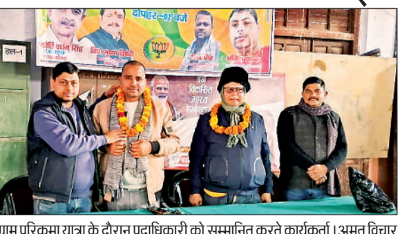
ग्राम परिक्रमा यात्रा के दौरान पदाधिकारी को सम्मानित करते कार्यकर्ता।