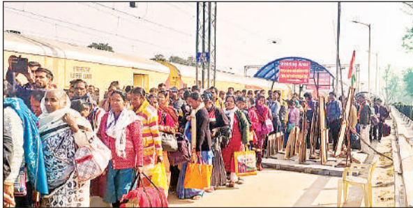
कटरा शिवदयाल गंज में आस्था ट्रेन के उतरते यात्री।