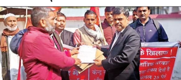
नगर मजिस्ट्रेट को जापान सौंपते कम्युनिस्ट पार्टी के पदाधिकारी। अमृत विचार

गोंडा कार्यालय: केरल व अन्य राज्यों के प्रति केंद्र सरकार द्वारा किए जा रहे भेदभाव तथा विद्युत विधेयक को रद्द किए जाने सहित अन्य मांगों को भारत की कम्युनिस्ट पार्टी ( मार्क्सवादी) जिला कमेटी गोंडा बरगामपुर एवं ट्रेड यूनियन के पदाधिकारियों ने बृहस्पतिवार को जिला कलेक्ट्रेट में पैदल मार्च कर नगर मजिस्ट्रेट को जापान सौंपा। राष्ट्रपति को संबोधित मांगपत्र में केरल सहित अन्य राज्यों को उनके करों और संसाधन के तय हिस्से से वंचित करना बंद किए जाने, केंद्र सरकार पर राज्य सरकारों के उधार लेने की सीमा तय करने पर रोक लगाई जाने, केंद्र सरकार राज्य सूची के विषय में हस्तक्षेप करने के लिए केंद्र प्रायोजित योजनाओं का