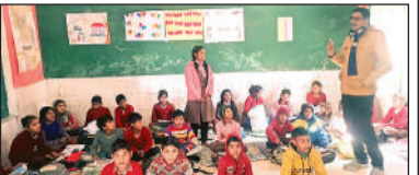
विद्यालय में अनुश्रवण करते निरीक्षण।