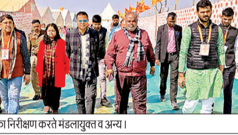
टेंट सिटी का निरीक्षण करते मंडलायुक्त व अन्य।

अयोध्या, अमृत विचार : पर्यटन विकास निगम द्वारा ग्रीन फील्ड टाउनशिप क्षेत्र में बनाई गई टेंट सिटी में बढ़ती श्रद्धालुओं की संख्या को देखते हुए ध्वनि विस्तारक यंत्र लगाए जाएं। जिससे कि अधिक से अधिक लोगों तक सूचनाएं पहुंच सकें। ये निर्देश गुरुवार को मंडलायुक्त गौरव दयाल ने पर्यटन निगम के अधिकारियों को दिए। वो बाहर से आने वाले श्रद्धालुओं को ठहराने और उनको मूल भूत सुविधाओं के सुनिश्चित करने के लिए टेंट सिटी का निरीक्षण कर रहे थे। इस दौरान उन्होंने विभिन्न प्रान्तों से आने वाले महिला व पुरुष दर्शनार्थियों से आने वाले व्यवस्थाओं के बारे में फीड बैक लिया। उन्होंने कहा कि परिसर में स्थापित शौचालयों सहित समस्त स्थलों की साफ-सफाई व्यवस्था सही रहे, इसकी नियमित निगरानी की जाय। उन्होंने परिसर में दर्शनार्थियों की सुविधा हेतु बनाये गए विभिन्न काउंटर का भी निरीक्षण किया। निरीक्षण के दौरान वरिष्ठ भाजपा नेता एमएलसी मानवेंद्र सिंह सहित अन्य उपस्थित रहे।