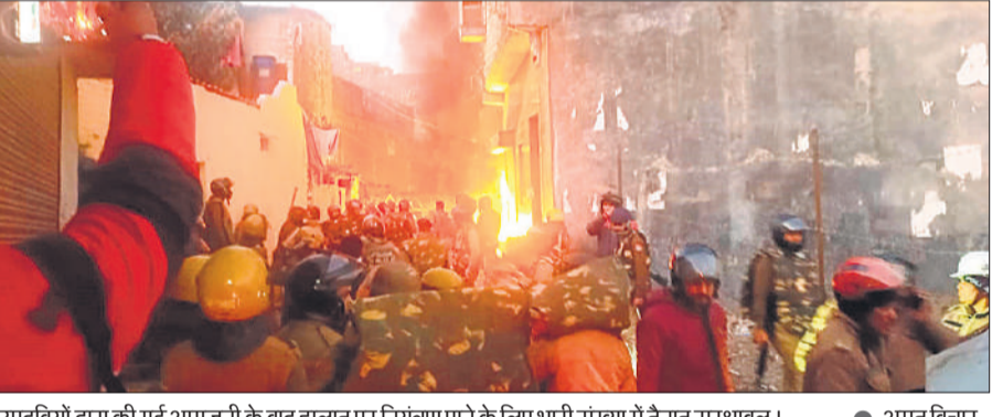
उपद्रवियों द्वारा की गई आगजनी के बाद हालात पर नियंत्रण पाने के लिए भारी संख्या में तैनात सुरक्षाबल।

अमृत विचार : शहर के मुस्लिम बहुल बनभूलपुरा क्षेत्र के मलिक का बगीचा में नजूल भूमि पर बने मद्रसा और मस्जिद ध्वस्त करने पर दंगा भड़क गया। उग्र भीड़ ने प्रशासन, नगर निगम टीम, पुलिस फोर्स और कवरेज कर रहे पत्रकारों पर पथराव व आगजनी कर दी। उग्र भीड़ ने बनभूलपुरा थाना फूँक दिया और दर्जनों बाइकों में आग लगा दी। अंधेरा होता ही फायरिंग और बमबाजी की घटनाएं भी सामने आई हैं। पथराव व आगजनी में 250 से ज्यादा पुलिसकर्मी, प्रशासनिक अधिकारी व लोग घायल हो गए। स्थिति पर नियंत्रण के लिए जिलाधिकारी ने दंगाइयों को देखते ही गोली मारने के आदेश दिए हैं। हालात पर काबू पाने के लिए देशराम सेना भी बुला ली गई है। एहतियातन पूरे शहर में कर्फ्यू लगा दिया गया है।