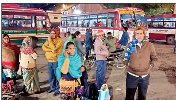
रोडवेज बस स्टैंड पर बस के इंतजार में भटकते यात्री। अमृत विचार

मौनी अमावस्या पर गंगा स्नान के लिए रोडवेज बस अड्डे पर उमड़ी श्रद्धालुओं की भीड़