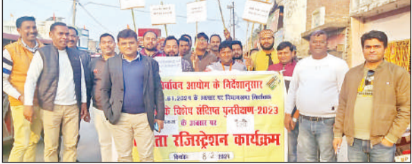
जागरूकता रैली निकालते शिक्षक।