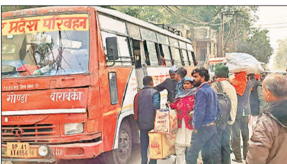
रोडवेज बस में बैठने के लिए यात्रियों की लगी भीड़।