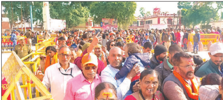
श्रीरामजन्मभूमि दर्शन मार्ग पर गुरुवार को उमड़ा रामभक्तों का रेला।

22 जनवरी को प्राण प्रतिष्ठा कार्यक्रम के बाद अब योजना ही अयोध्या धाम में मेले जैसा दृश्य दिख रहा है। जिला प्रशासन को भी रोज नए दिशा-निर्देश जारी करने पड़ रहे हैं। राम मंदिर में दर्शन कराने के लिए