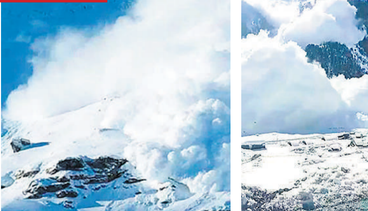
जम्मू-कश्मीर: श्रीनगर-लेह राष्ट्रीय राजमार्ग पर साराबल गांदरबल में बेहद बड़ा हिमस्खलन हुआ है। इसमें किसी प्रकार का जान माल का नुकसान होने की सूचना नहीं है। जानकारी के मुताबिक ये हिमस्खलन निर्माणधीन जोजिला सुरंग से कुछ ही दूरी पर हुआ है। बता दें, कश्मीर घाटी के ऊंचाई वाले इलाकों में हिमस्खलन की चेतावनी जारी की है। 24 घंटे तक खतरा वाले इलाकों में नहीं जाने को कहा गया है। ● एजेंसी