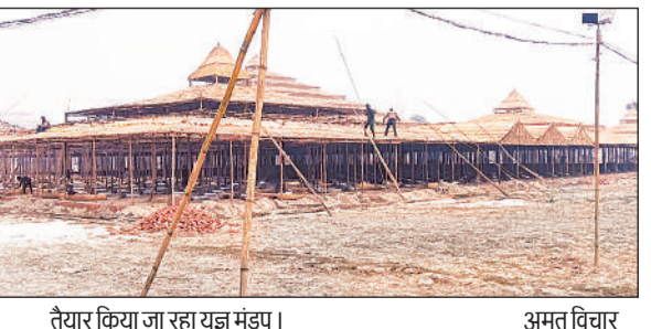
तैयार किया जा रहा यज्ञ मंडप। अमृत विचार

10 फरवरी को भव्य कलश यात्रा के साथ शुरू होगा, जो 18 फरवरी तक चलेगा। पहले दिन 1100 कलश के साथ 5100 श्रद्धालुओं की संख्या में मुख्य यजमान सहित ब्राह्मण व सभी यजमान शामिल रहेंगे। कलश