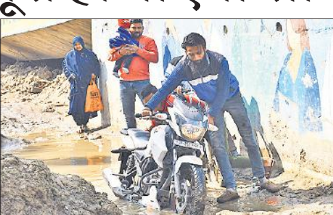
अलखनाथ रोड पर गंदे पानी से होकर गुजरते लोग।

अमृत विचार : शहर में सीवर लाइन के लिए खुदी पड़ी सड़कों से अभी एक महीने तक लोगों को परेशानी उठानी पड़ेगी। अधिकारी मार्च तक काम पूरा होने का दावा कर रहे हैं। जल निगम ने अधिकारियों को इसकी रिपोर्ट प्रशासन को सौंप दी है। सीवर लाइन डालने के बाद सरायतल्फी एसटीपी में 25 एमएलडी पानी का शोधन शुरू हो जाएगा। शहर के सेंट्रल जोन में पुराना शहर, सिविल लाइंस आदि क्षेत्रों 155 किमी लंबी सीवर लाइन बिछाने के