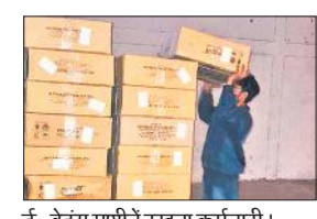
ई-वेइंग मशीनें रखता कर्मचारी।

ई-वेइंग मशीनें लगने के बाद कार्ड के यूनियो के अनुसार वजन पूरा नहीं होने तक पच्ची नहीं निकलेगी। ऐसे में राशन भी लाभार्थी को जारी नहीं किया जा सकेगा। अधिकारियों का कहना है कि जिले में 1800 ई-वेइंग मशीनें प्राप्त होनी हैं। पुणे से करीब 800 मशीनें मिल चुकी हैं। एक हजार और आनी हैं। प्राइवेट एजेंसी को जिम्मेदारी दी गई है। एजेंसी के ही इंजीनियरों की निगरानी में बाटमाप विभाग से मशीनों को प्रमाणित कराकर