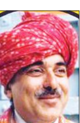
रणवीर सिंह फोगाट