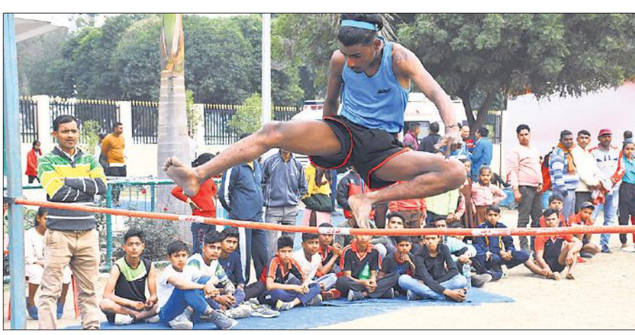
स्पोर्ट्स स्टेडियम में मंडलीय प्रतियोगिता में ऊंची कूद में हिस्सा लेता खिलाड़ी।

वांलीबाल में बालक वर्ग में बरेली, गोला फेंक में बदार्थू, बालिका वर्ग में गोला फेंक में बदार्थू, चक्का फेंक में बालक वर्ग में बदार्थू, बालिका वर्ग में पीलीभीत पहले स्थान पर रहा। इस