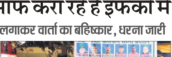
इफको में नौकरी के मुद्दे पर धरना देते बड़ी संख्या में किसान।

किसानों ने बताया कि 15 फरवरी को भारी संख्या में किसान बुलाए जाएंगे और आंदोलन का उग्र किया जाएगा। संगठन प्रदेश महासचिव