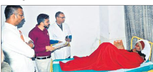
आयुर्वेदिक कॉलेज में मरीजों से जानकारी लेती टीम।