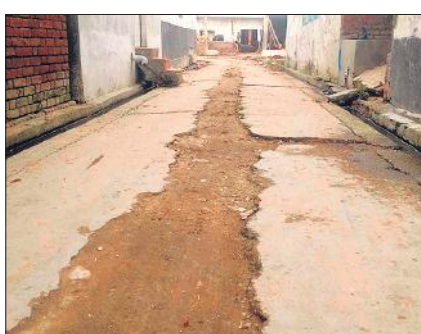
बिथरी के गांव तैयतपुर गांव की सड़क।

बिथरी, नवाबगंज, शेरगढ़, बहेड़ी समेत अन्य ब्लॉकों के सैकड़ों गांवों में जल जीवन मिशन के तहत खोदी गई सड़कें ऐसे ही जर्जर हालत में पड़ी हैं। कार्यदायी संस्था के ठेकेदार इस कदर बेलागम हैं कि पाइप लाइन डालकर सड़कों को दुरुस्त कराना जरूरी नहीं समझते। कहीं साल भर से सड़कें उधड़ी पड़ी हैं तो कहीं महीनों से पानी लीकेज परेशान का सबब बना है। ग्रामीण उधड़ी सड़कों पर गिर रहे हैं वहीं अधिकारी दावा कर रहे हैं कि जहां- जहां पाइप लाइन