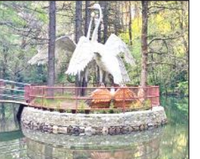
किलबरी स्थित नैना देवी जलकुंड।

अमृत विचार: नैनीताल से लगभग 12 किलोमीटर दूर किलबरी क्षेत्र में नैना देवी बर्ड कंजर्वेशन रिजर्व में वन विभाग की ओर से बनाया गया नैना देवी जलकुंड पर्यटकों व पक्षियों के आकर्षण का केंद्र बना हुआ है। जलकुंड 12 महीने लबालब भरने से ग्रामीण क्षेत्रों में जलस्रोत रिचार्ज होने लगे हैं। साथ ही गर्मी व सर्दी में जंगली जानवरों को भी इस जलाशय का भरपूर लाभ मिल रहा है। यहां पर्यटन गतिविधियां बढ़ने से वन विभाग के साथ ही स्थानीय लोगों को रोजगार के लिए जलकुंड का निर्माण किया