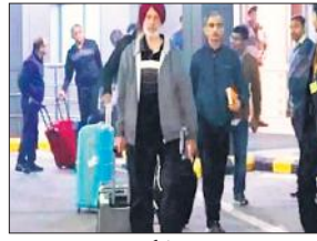
सात भारत लौटे, अगस्त 2022 में जासूसी के आरोप में किया गया था गिरफ्तार

कतर ने जेल में बंद भारतीय नौसेना के उन आठ पूर्व कर्मियों को रिहा कर दिया है, जिन्हें कथित रूप से जासूसी के एक मामले में पिछले साल अक्टूबर में मौत की सजा सुनाई गई थी। इनमें से सात भारत लौटे आए हैं। रिहाई से 46 दिन पहले उनकी मौत की सजा को अलग अलग अवधि की कारावास सजा में तब्दील किया गया था।