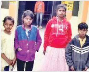
भटककर चन्दौसी पहुंचे चारों बच्चे।

बच्चों को बरेली में अपनी बड़ी बहन के घर जाना था। यह ट्रेन बरेली नहीं जाती है, बल्कि चनहेटी से वाया चन्दौसी आती है। बाल कल्याण समिति ने बच्चों को माता-पिता के घर छोड़ने के आदेश दिए हैं। बच्चों बरेली में अपनी बहन व बहनोई के घर का पता नहीं बता पा रहे हैं। गोरखपुर