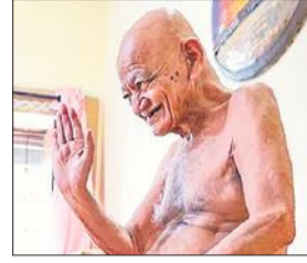
● चंद्रगिरि तीर्थ में छह माह से रह रहे थे, कुछ दिनों से थे बीमार

जाने-माने जैनमुनि आचार्य विद्यासागर महाराज ने छत्तीसगढ़ के राजनंदगांव जिले के डोंगरगढ़ स्थित 'चंद्रगिरि तीर्थ' में 'सल्लेखना' करके रविवार को देह त्याग दी। चंद्रगिरि तीर्थ की ओर से जारी एक बयान के अनुसार सल्लेखना जैन धर्म में एक प्रथा है, जिसमें देह त्यागने के लिए स्वेच्छा से अन्न-जल का त्याग किया जाता है। छत्तीसगढ़ सरकार ने रविवार को आधे दिन के राजकीय शोक की घोषणा की है। मुख्यमंत्री कार्यालय ने 'एकम' पर एक पोस्ट में कहा कि विश्व प्रसिद्ध दिगंबर जैन संत परंपरा के आचार्य विद्यासागर महाराज जी का त्याग निधन हो गया उन्हें वर्तमान समय का वर्धमान कहा जाता है। राजकीय शोक के दौरान राष्ट्रीय ध्वज आधा झुका रहेगा और कोई भी सरकारी समारोह या कार्यक्रम आयोजित नहीं किए जाएंगे। जैनमुनि के निधन पर प्रधानमंत्री नरेंद्र मोदी, केंद्रीय गृहमंत्री अमित शाह, उत्तर प्रदेश के मुख्यमंत्री योगी आदित्यनाथ सहित अन्य