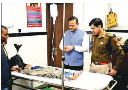
● अमृत विचार घायल बच्ची का हाल पूछते डीएम और एसएसपी। ● अमृत विचार