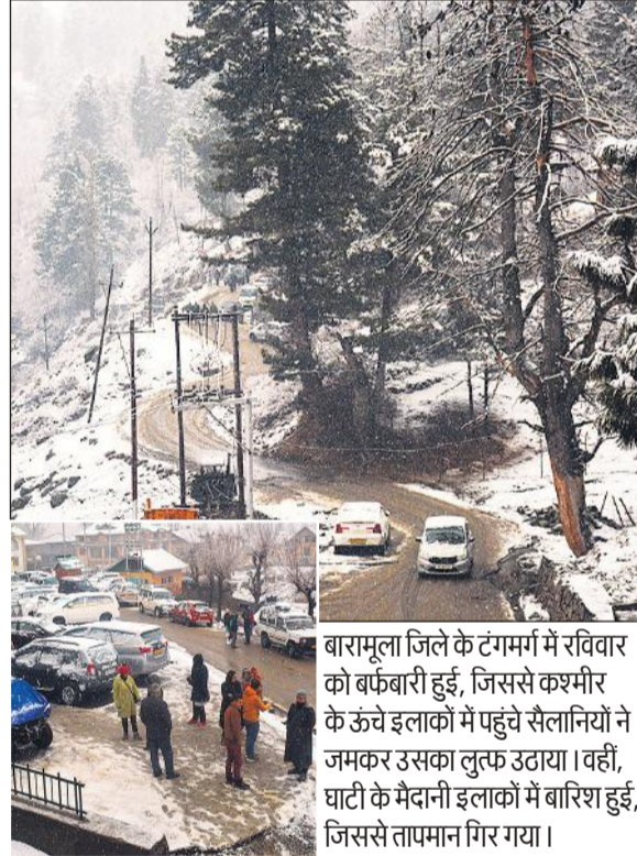
बारामूला जिले के टंगमर्मा में रविवार को बर्फबारी हुई, जिससे कश्मीर के ऊंचे इलाकों में पहुंचे सैलानियों ने जामकर उसका लुक उड़ाया। वहीं, घाटी के मैदानी इलाकों में बारिश हुई, जिससे तापमान गिर गया।

शुरू किया है। चढ़ा ने कहा, मैं इन सभी गलत काम की जिम्मेदारी ले रहा हूँ और आपको बता रहा हूँ कि मुख्य निर्वाचन आयुक्त और प्रधान न्यायाधीश भी इसमें पूरी तरह से शामिल हैं। चुनाव परिणामों में हेरफेर के लिए जिम्मेदारी स्वीकार करने के बाद चढ़ा ने पद से इस्तीफा दे दिया। खान की अगुवाई वाली 'पीटीआई' प्रवक्ता ने मांग की कि मुख्य निर्वाचन आयुक्त सिक्दर सुल्तान राजा और प्रधान न्यायाधीश काजी फैज इसा रावलपिंडी के आयुक्त चढ़ा के खुलासे के बाद अपने पदों से इस्तीफा दें। चढ़ा ने स्वीकार किया है कि 70,000 से अधिक वोटों से आगे चल रहे निर्दलीय उम्मीदवारों की जीत को फर्जी मोहर लगाकर हार में बदल दिया गया।