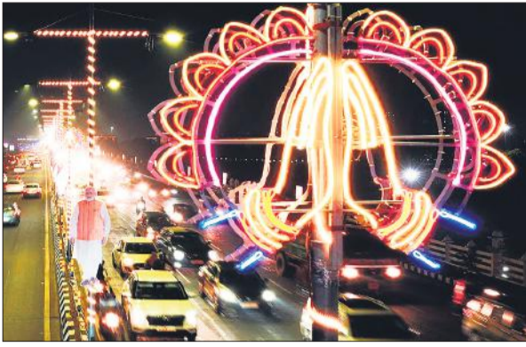
ग्राउंड ब्रेकिंग सेरेमनी (जीबीसी-4) के लिए सजा लखनऊ।

ग्राउंड ब्रेकिंग सेरेमनी (जीबीसी-4) के जरिए प्रदेश की तरक्की के इस महाआयोजन की सफलता में देश-विदेश के बड़े उद्योगपति ही नहीं, ओडीओपी में निवेश करने वाले जिला-जवार के उद्यमियों की मेहनत भी है। पिछले साल इवेंस्टर समिट