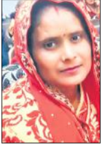
● गजरौला थाना क्षेत्र के डेरम मडरिया गांव में रविवार तड़के हुई वारदात

अमृत विचार : बीमार बेटे के पास सोने के लिए जाने की बात कहने पर नाराज पति ने पत्नी की फावड़े से वार करके हत्या कर दी। बेटे ने बचाने का प्रयास किया तो उस पर भी हमलावर हो गया। इसके बाद मोबाइल और फावड़ा लेकर आरोपी भाग गया। रिपोर्ट दर्ज कर पुलिस आरोपी की तलाश में है।