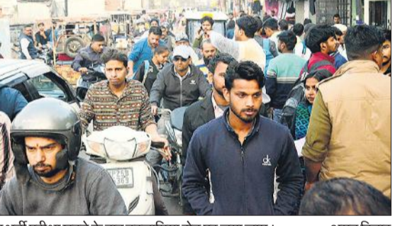
पुलिस भर्ती परीक्षा छूटने के बाद इस्तामिया रोड पर लगा जाम।