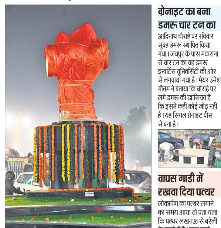
आदिनाथ चौराहे पर लगाया गया डमरू।

बरेली, अमृत विचार : मुख्यमंत्री के बरेली आने की खबर के बाद अफसरों ने डेलापीर से आदिनाथ बने चौराहे पर लगे डमरू का आननफानन उनसे लोकार्पण कराने की तैयारी की लेकिन तय समय से पांच घंटे देरी से उनके यहां पहुंचने के कारण सबकुछ धरा रह गया। त्रिशूल हवाई अड्डे पर उतरे मुख्यमंत्री आदिनाथ चौराहे से ही गुजरते हुए सीधे सर्किट हाउस चले गए।