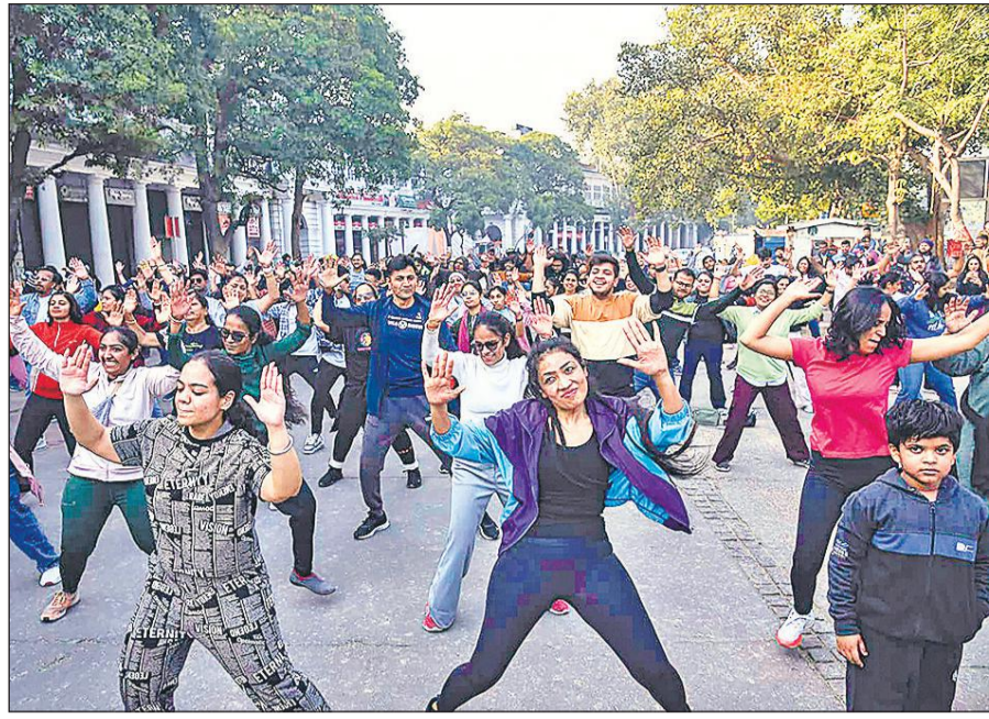
नई दिल्ली के कर्नाट प्लेस में रविवार को दिल्ली पुलिस सड़क सुरक्षा सप्ताह के तहत आयोजित की गई राहगीरी दिवस कार्यक्रम में भाग लेते लोग।