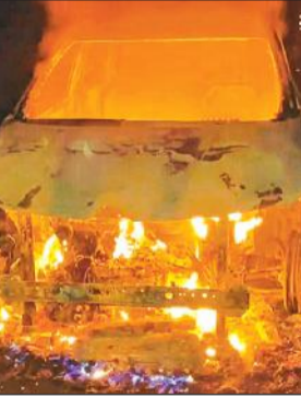
शक्तिफार्म में कार में लगी आग।

अमृत विचार : किच्छा से घर लौट रहे व्यक्ति की कार में अचानक आग लग गई। कार चला रहे वाहन स्वामी और उसके साथी ने कार से निकलकर अपनी जान बचाई। सूचना पर पहुंची फायर ब्रिगेड की टीम ने आग को बुझाया। लेकिन, तब तक कर पूरी तरह जल चुकी थी।