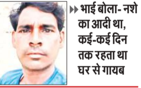
भाई बोला- नशे का आदी था, कई-कई दिन तक रहता था घर से गायब