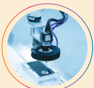
इलेक्ट्रॉनिक मैन्युफैक्चरिंग हब

स्थान : इंदिरा गांधी प्रतिष्ठान, गोमतीनगर, लखनऊ