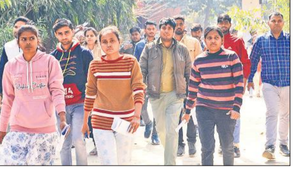
बरेली इंटर कॉलेज में पुलिस भर्ती परीक्षा देकर बाहर आते अभ्यर्थी। ● अमृत विचार

अमृत विचार: दूसरे दिन रविवार को भी जिले के 47 केंद्रों पर पुलिस भर्ती परीक्षा कड़ी सुरक्षा के बीच हुई। पंजीकृत 52,968 में से 37,361 अभ्यर्थियों ने लिया भाग। जबकि 15,607 अनुपस्थित रहे। एसटीएफ और पुलिस टीमों अलर्ट रहीं। पुलिस अफसरों ने केंद्रों का निरीक्षण किया।