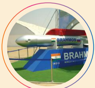
डिफेंस इंडस्ट्रियल कॉरिडोर