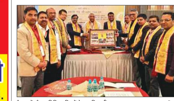
बैठक में मौजूद विभिन्न जिलों के पदाधिकारी। • अमृत विचार