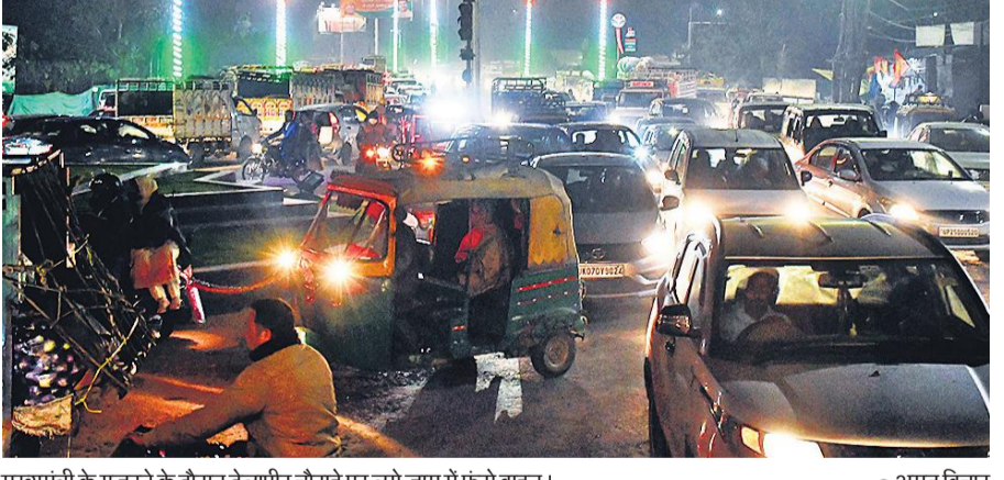
मुख्यमंत्री के गुजरने के दौरान डेलापीर चौराहे पर लगे जाम में फंसे वाहन।