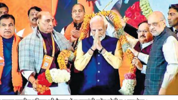
भाजपा राष्ट्रीय परिषद की बैठक में प्रधानमंत्री नरेंद्र मोदी व अन्य नेता।