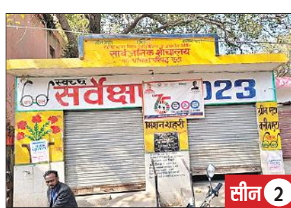
कचहरी रोड स्थित सार्वजनिक शौचालय में लटका ताला।

शहर के कचहरी रोड पर मुख्य डाकघर के समीप सार्वजनिक शौचालय बना है, जिसमें हर समय ताला लटका रहता है। जबकि इधर से होकर लोग कचहरी, एसएसपी कार्यालय व मुख्य डाकघर और बैंक के लिए आते जाते हैं।