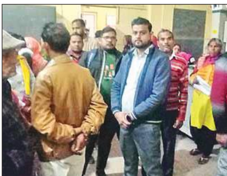
एक्सरे रूम में लगी भीड़।