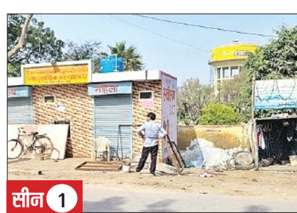
सीन 1 अलीगंज मार्ग स्थित सामुदायिक शौचालय में लगा ताला।

शहर के अलीगंज मार्ग स्थित जिला उद्यान विभाग के समीप सामुदायिक शौचालय है। नगर पालिका ने इसका निर्माण करीब दो साल पहले कराया था। मगर अभी तक इसे खुलवाया नहीं गया है। इससे लोग परेशानी हो रहे हैं।