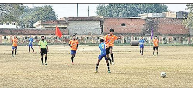
सेमी फाइनल मैच में डीएफए एटा व बरेली टीम के खिलाड़ी।

मैच की शुरुआत से ही एटा डीएफए और बरेली के मध्य कड़ा मुकाबला देखने को मिला। प्रथम हाफ तक दोनों टीमों बराबरी पर रही। दूसरे हाफ में बरेली की टीम ने मैच समाप्त से कुछ समय पूर्व एक गोल कर 1-0 से मैच जीत लिया। मैच जीतने के साथ ही बरेली की टीम ने फाइनल में प्रवेश कर लिया। दूसरा सेमीफाइनल मैच अलीगढ़ व