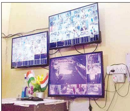
सीएमएस कार्यालय में लगी कैमरे की स्क्रीन।

शनिवार को जिला अस्पताल में करीब दस बजे तीन डॉक्टर ओपीडी में नहीं थे। कैमरों में उनकी कुर्सी खाली पड़ी थी। ओपीडी के बाहर मरीजों की