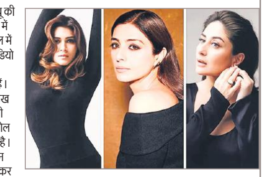
अभिनेत्री करीना कपूर, कृति सैनन और तब्बू की फिल्म द कू 29 मार्च में रिलीज होगी। फिल्म में करीना कपूर, तब्बू और कृति सैनन लीड रोल में हैं। मेकर्स ने रिलीज डेट का अनाउसमेंट वीडियो जारी कर दिया है। इसमें करीना, तब्बू और कृति एयर होस्टस की पोशाक में दिख रही हैं। तीनों एयरपोर्ट की एक गैलरी में चलते हुए दिख रही हैं। वीडियो के बैकग्राउंड में आवाज आती है, देवियों और सज्जनों, मैं आपका कैप्टन बोल रहा हूँ। आज की फ्लाइट में आपका स्वागत है। हमारा कू आपका बहुत ख्याल रखेगा, लेकिन आपसे एक अनुरोध है कि अपनी चोली कसकर पकड़ ले ताकि दिल बाहर ना गिर जाए। वीडियो के आखिरी में द कू की रिलीज डेट 29 मार्च बताई गई है। करीना कपूर खान ने सोशल मीडिया पर लिखा कि अपनी कमर कस लें, अपना पॉपकॉर्न तैयार करें, और परोसने के लिए तैयार हो जाएं। द कू मार्च में सिनेमाघरों में रिलीज होगी। करीना ने कैप्टन में रिया कपूर, कपिल शर्मा और एकता कपूर को भी टैग किया और बताया कि फिल्म में इनकी स्पेशल अपीयरेंस होगी।