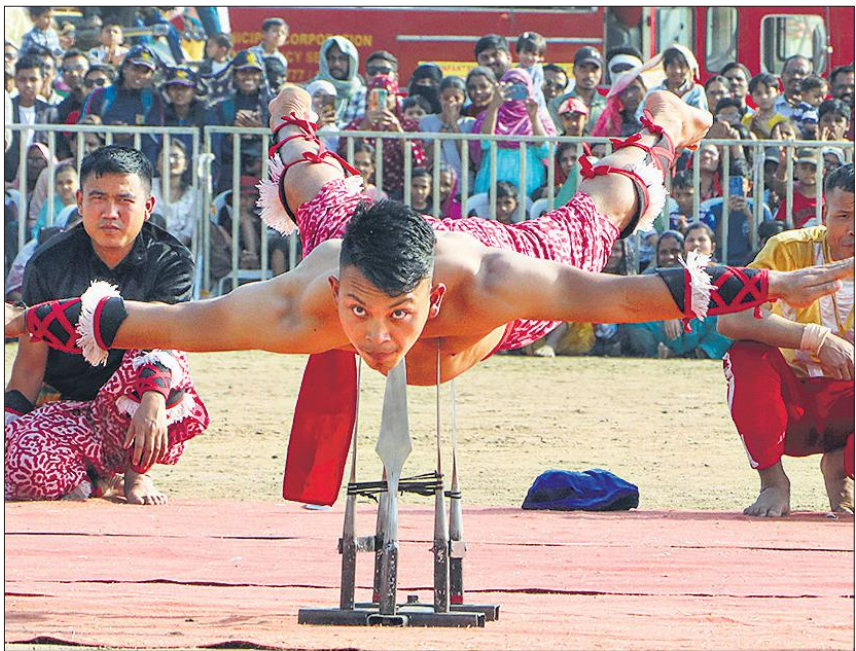
सेना दिवस के अवसर पर नागपुर में आयोजित भारतीय सेना प्रदर्शनी-शौर्य संध्या में एक सेना अधिकारी ने अपना कौशल दिखाया। इस दौरान लोगों ने जवानों के साहसिक करतबों की खूब प्रशंसा की।