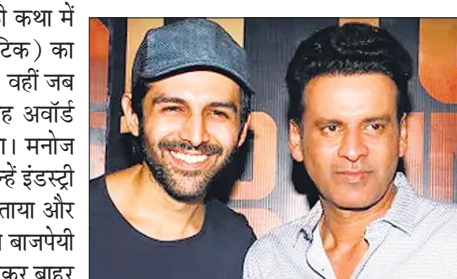
अभिनेता मनोज बाजपेयी ने फिल्म सत्यमेव की कथा में सत्तू के किरदार के लिए सर्वश्रेष्ठ अभिनेता (क्रिटिक) का अवॉर्ड मिलने पर कार्तिक आर्यन की तारीफ की। वहीं जब मनोज बाजपेयी को अवॉर्ड मिला तो उन्होंने यह अवॉर्ड खासतौर से कार्तिक आर्यन को समर्पित किया। मनोज बाजपेयी ने कार्तिक को मंच पर बुलाया और उन्हें इंडस्ट्री में आउटसाइडर लोगों का सच्चा प्रतिनिधि बताया और अपना अवॉर्ड भी उन्हें समर्पित किया। मनोज बाजपेयी ने कहा कि कार्तिक अपनी आंखों में सितारे लेकर बाहर से आने वाले सभी लोगों के सच्चे प्रतिनिधि हैं और इसे सरासर लचोलापन, बुद्धिमत्ता और पूर्ण समर्पण के साथ बनाते हैं। इसलिए निर्देशक द्वारा धन्यवाद देने से पहले, वह उनका और उन जैसे सभी अभिनेताओं को धन्यवाद देता हैं, जो इतना साहस जुटा रहे हैं। जो इस बड़ी सिटी मुंबई आए हैं और दरवाजा खुलने तक हर समय जोर-जोर से दरवाजा खटखटाते रहते हैं, जब तक वह खल न जाए।