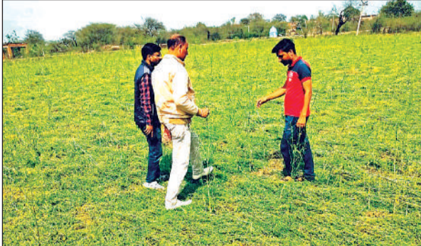
बारिश व ओलावृष्टि से क्षति का आकलन करती राजस्व टीम।