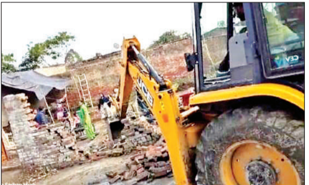
अवैध कब्जे में चलाया गया बुलडोजर।

बुधवार को बिंदकी प्रशासन राजस्व टीम के साथ बुलडोजर लेकर मौके पर पहुंचे। कंशमीरीपुर गांव के मंजूर द्वारा पिछले माह तालाबी सीमा के रकवे पर अवैध ढंग से कब्जा करके बाउंड्री निर्माण कराई गई। कब्जे दावेदारी को लेकर पड़ोसी द्वारा विरोध किया गया और मामला बकेवर थाना पुलिस तक पहुंचा। पुलिस ने मामले का निस्तारण राजस्व टीम से कराये जाने का भरोसा दिया। मौके की