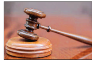
● दोनों पर अदालत ने लगाया 20 हजार रुपये का अर्धदंड