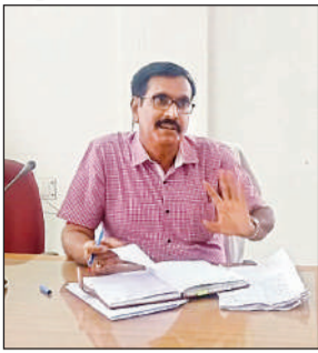
राजस्व वसूली संबंधी बैठक में निर्देश देते उपजिलाधिकारी।

बैठक में एसडीएम ने सरकारी जमीनों, तालाबों व नजूल की भूमि पर किए गए अवैध कब्जों को तुरंत हटाने के निर्देश भी कर्मचारियों और संबंधित अधिकारियों को दिए। एसडीएम ने बताया कि राजस्व निरीक्षकों व लेखपालों को निर्देशित किया गया है कि सरकारी भूमि,