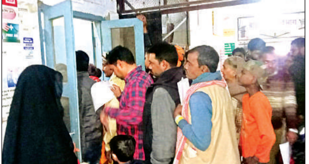
अस्पताल में कम नहीं हो रही मरीजों की भीड़।

अमृत विचार। बदलते मौसम में लोग तेज बुखार, खांसी और सांस लेने में परेशानी जैसी बीमारियों की चपेट में आ रहे हैं। बुधवार को जिला अस्पताल की ओपीडी में डॉक्टरों ने बताया कि बदलते मौसम में खान-पान में लापरवाही सेहत बिगाड़ रही है। डॉक्टरों ने खाने में विटामिन सी से भरपूर खाद्य पदार्थ लेने की सलाह दी है। दिन में लोग हाफ शर्ट और टी-शर्ट में भी दिखायी दे रहे हैं। जबकि सुबह शाम जो मौसम ठंडा है उससे बचने के लिए ठीक से गर्म कपड़े नहीं पहने जा रहे हैं जिससे सेहत को चोट पहुंच रही है। वहीं भीड़ के चलते ओपीडी में बीमारों को इलाज के लिए घंटों इंतजार करना पड़ रहा है। सुबह-शाम सर्दी और