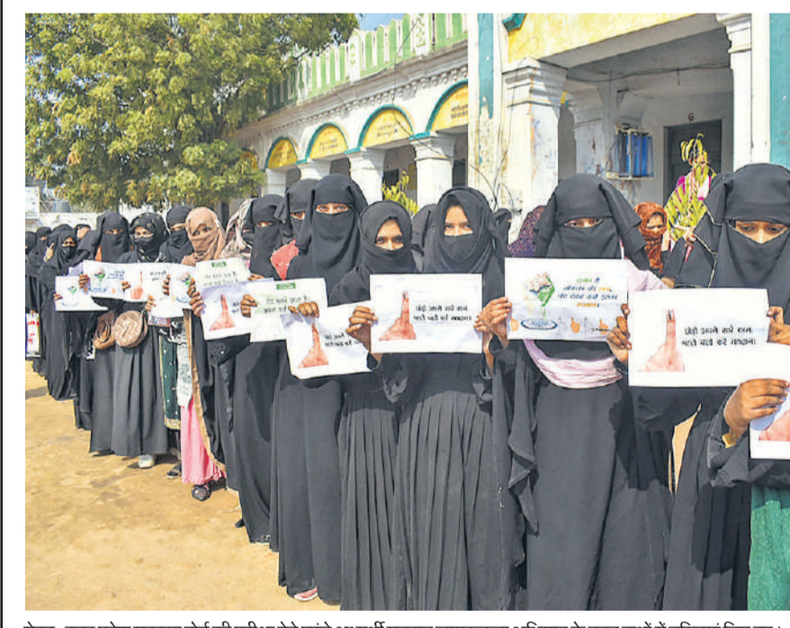
मेरठ : उत्तर प्रदेश मद्रसा बोर्ड की परीक्षा देने पहुंचे अभ्यर्थी मतदान जागरूकता अभियान के तहत हाथों में तख्तियां लिए हुए।