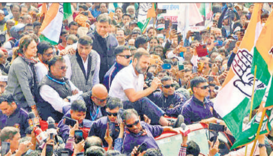
कानपुर में यात्रा के दौरान लोगों को संबोधित करते हुए कांग्रेस अध्यक्ष राहुल गांधी।

अमृत विचार : अंबानी, अडानी, टाटा और बिरला जैसे चंद्र उद्योगपति आज नए भारत के राजा-महाराजा बनकर देश पर राज कर रहे हैं। आपको सलाह जा रहा है। आप लोग इनकी कंपनियों में खून-पसीना देते हो, लेकिन नौकरी से आपको ही निकाला जाता है। यह बात बुधवार को भारत जोड़ो न्याय यात्रा लेकर कानपुर पहुंचे कांग्रेस नेता राहुल गांधी ने घंटायत्रा में एकत्र जन समूह को संबोधित करते हुए कहा। राहुल गांधी लखनऊ से उन्नाव होते हुए शुक्लागंज पुल के रास्ते यात्रा