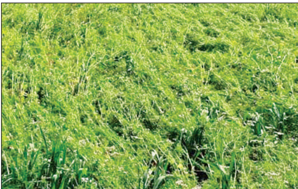
आंधी से गिरी फसल।

काई बनवाया था। बैंक का कर्ज लेकर फसलों की जुताई बुआई की थी। बीज भंडार से कीमती बीज लाकर बोया था। ओलावृष्टि से फसल बर्बाद हो गई है।