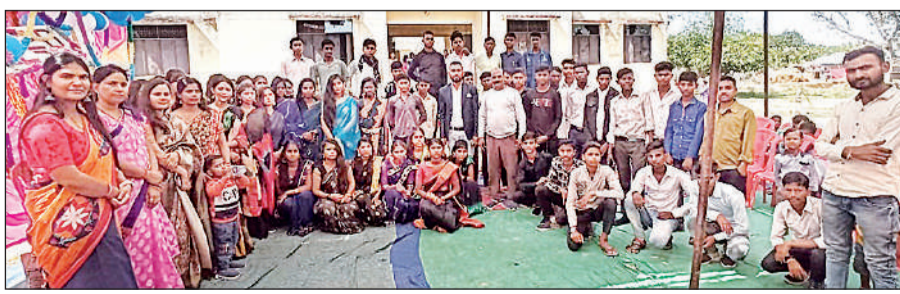
विदाई समारोह के दौरान गुप फोटो खिंचवाते विद्यार्थी और शिक्षक। अमृत विचार

अमृत विचार : बन्के अजन्बी मिले हैं जिंदगी के सफर में, इन यादों के लम्हों को मिटाएंगे नहीं। अगर याद रखना फितरत है तुम्हारी, तो वादा है हम भी आपको कभी भुलाएंगे नहीं...। बुधवार को राजकीय हाईस्कूल सिरावल में छात्र-छात्राओं के मन में यही भाव थे। बोर्ड परीक्षा के पूर्व विद्यालय में विदाई समारोह हुआ तो बच्चे भावुक हो गए।