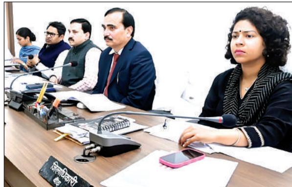
समीक्षा बैठक करते मंडलायुक्त और जिलाधिकारी। अमृत विचार

अमृत विचार : मंडलायुक्त ने मंडलीय समीक्षा बैठक में विकास कार्यों और कानून व्यवस्था की समीक्षा की। उन्होंने अधिकारियों को विकास कार्यों को तेज गति से गुणवत्तायुक्त तरीके से पूर्ण करने के प्रयास किए जाए तथा बोर्ड परीक्षाओं के समय एवं आकांक्षीय ब्लाकों में स्कूलों के समय विद्युत कटौती न करने के निर्देश दिए।