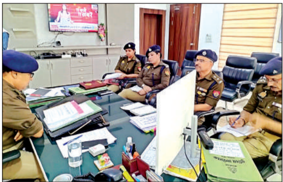
पुलिस अधीक्षकों की बैठक लेते डीआईजी। अमृत विचार

अमृत विचार : पुलिस उप महानिरीक्षक चित्रकूटधाम परिक्षेत्र ने बुधवार को अपराध समीक्षा बैठक कर कानून व्यवस्था का जायजा लिया। अपराध नियंत्रण के संबंध में आवश्यक दिशा निर्देश देते हुए डीआईजी ने आगामी लोकसभा चुनाव की तैयारियों को लेकर दिशा-निर्देश जारी किए। उन्होंने महिला अपराधों पर रोकथाम और समाधान दिवस पर प्राप्त होने वाले प्रार्थनापत्रों का गुणवत्ता के साथ निस्तारण किए जाने के निर्देश दिए।