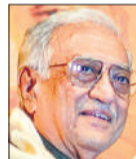
● 42 वर्षों में 50 हजार से ज्यादा कार्यक्रमों में दी आवाज