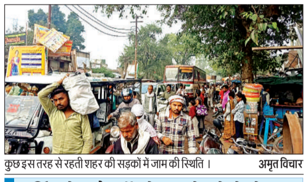
कुछ इस तरह से रहती शहर की सड़कों में जाम की स्थिति।

19 बैंक शाखाएं पार्किंग किसी के पास नहीं: शहर में डेढ़ दर्जन से भी अधिक स्थानों पर बैंक संचालित हो रहे हैं। लेकिन किसी भी बैंक द्वारा पार्किंग के लिए खुद की जगह उपलब्ध नहीं कराई गई है। ऐसी स्थिति में लोगों द्वारा बैंक के बाहर ही सड़क पर अपने वाहनों