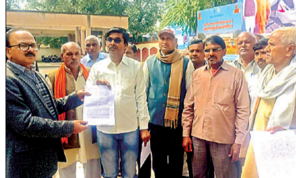
ज्ञापन सौंपते पीड़ित।

अमृत विचार : जनपद में एक-एक करके 16 व्यक्तियों के घरों में रजिस्टर्ड पत्र पहुंचे। पत्र को पढ़ने वालों के होश उड़ गए, क्योंकि इस पत्र के मुताबिक उन्होंने एक लड़की के साथ बांदा व चित्रकूट में गैंगरेप किया। हैरान करने वाली बात यह है कि जिन व्यक्तियों को गैंगरेप का आरोपी बनाया गया है, वे सभी रिटायर्ड सरकारी कर्मचारी हैं। इनकी उम्र 65 से 71 वर्ष के बीच बताई जा रही है। बुधवार को पीड़ितों ने जिलाधिकारी को प्रार्थना पत्र सौंपकर मामले की जांच करवाए जाने की मांग की है।