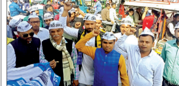
मिष्ठान वितरित कर जश्न मनाते आप कार्यकर्ता। अमृत विचार

आप नेताओं ने किया सुप्रीम कोर्ट के फैसले का स्वागत