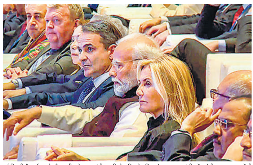
नई दिल्ली में कार्यक्रम के दौरान ग्रीस के प्रधानमंत्री क्यारिाकोस मित्सोटाकिस के साथ प्रधानमंत्री नरेंद्र मोदी।