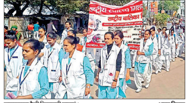
जागरूकता रैली निकालती छात्राएं।