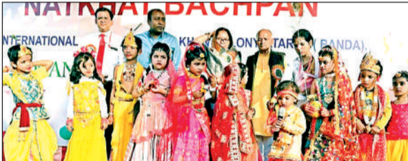
सांस्कृतिक कार्यक्रम प्रस्तुत करते बच्चे।