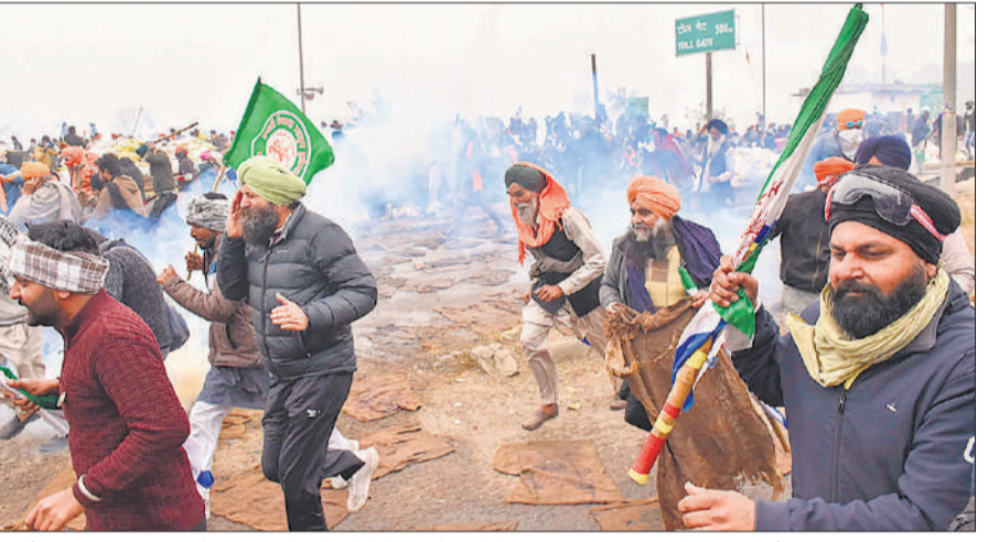
शंभू सीमा पर पुलिस द्वारा दागे गए आंसू गैस के गोले के धुंए से बचने के लिए झड़प-उधर भागते प्रदर्शनकारी किसान।

हरियाणा पुलिस ने शंभू और खनौरी सीमाओं पर किसानों को अवरोधकों की ओर बढ़ने से रोकने के लिए बुधवार को उन पर आंसू गैस के गोले छोड़े। खनौरी सीमा पर झड़प में एक प्रदर्शनकारी की मौत होने के साथ 12 पुलिसकर्मी घायल हुए हैं। फसलों के लिए न्यूनतम समर्थन मूल्य (एमएसपी) पर कानूनी गारंटी देने की मांग कर रहे किसानों ने घोषणा की थी कि वे इस मुद्दे को हल करने के लिए किसानों के साथ चौथे चरण की वार्ता विफल होने के बाद बुधवार सुबह 11 बजे अपना प्रदर्शन फिर से शुरू करेंगे। कुछ किसानों ने हरियाणा में अंबाला के समीप शंभू में कई चरणों में लगाए अवरोधकों की ओर बढ़ने की कोशिश की जिसके बाद पुलिस ने उन्हें तितर-बितर करने के लिए आंसू गैस के गोले छोड़े। थोड़ी देर के विराम के बाद फिर ऐसी ही घटना हुई। शंभू सीमा पर एक ड्रोन भी देखा गया। पंजाब-हरियाणा सीमा पर खनौरी में भी ऐसी ही स्थिति देखी गयी।