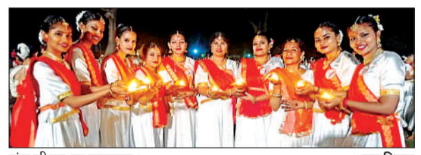
बांदा की कथक कलाकार।

खजुराहो नृत्य महोत्सव के स्वर्ण जयंती वर्ष पर करीब डेढ़ हजार कथक कलाकारों ने एक साथ प्रस्तुति देकर जहां अपनी प्रतिभा का लोहा मनवाया, वहीं इस ऐतिहासिक अवसर को गिनीज बुक ऑफ वर्ल्ड रिकार्ड में दर्ज कराकर विश्व कीर्तिमान स्थापित किया। कार्यक्रम का शुभारंभ मध्यप्रदेश के मुख्यमंत्री मोहन यादव ने वाद्ययंत्रों पर थाप देकर किया तो कलाकारों के पैरों की थाप ने उनके साथ ताल मिलाई। मध्यप्रदेश के खजुराहो में