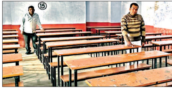
बोर्ड परीक्षाओं की तैयारी को अंतिम रूप देने शिक्षक। अमृत विचार

अमृत विचार : माध्यमिक शिक्षा परिषद बोर्ड परीक्षा गुरुवार से जिले के 64 परीक्षा केंद्रों पर होगी। जिला प्रशासन ने नकल विहीन परीक्षा कराने के लिए चाक-चबंद व्यवस्था करने का दावा किया है। बोर्ड परीक्षा में इस बार जिले के कुल 44,431 परीक्षार्थी प्रतिभाग करेंगे। परीक्षा केंद्रों पर जहां सीसीटीवी कैमरे लगाए हैं। वहीं सुपर जोनल, जोनल और सेक्टर मजिस्ट्रेटों के साथ ही सचल दल का पहरा रहेगा। उधर, प्रशासन की घेराबंदी तोड़ने के लिए नकल माफियाओं ने भी अपनी जुगत भिड़ानी शुरू कर दी है।