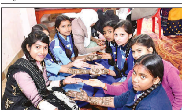
मेहंदी प्रतियोगिता में प्रतिभाग करती छात्राएं।

बैठकर नौका विहार का लुप्त उठाया। उन्होंने बताया की इस महोत्सव में बुंदेलखंड के गौरव के बारे में विस्तार से जानकारी दी जाएगी। वहीं देर शाम को पुलिस परेड मैदान में सांस्कृतिक कार्यक्रम