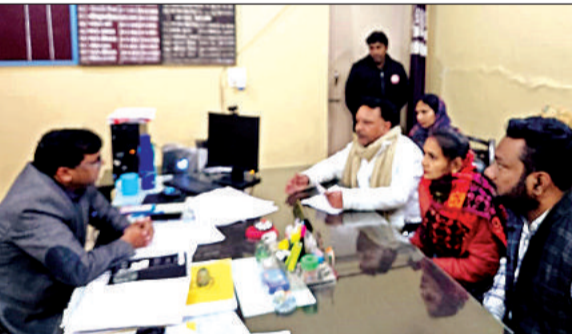
अधिशारी अभियंता से बात कर रहे प्रतिनिधि।