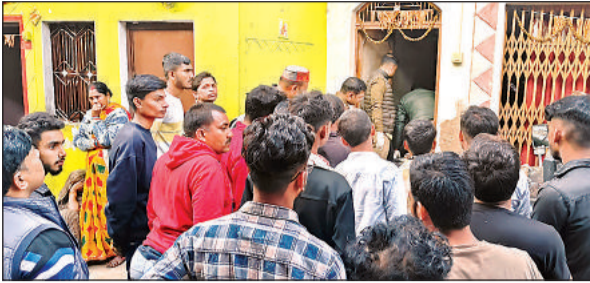
घटनास्थल पर लगी लोगों की भीड़।