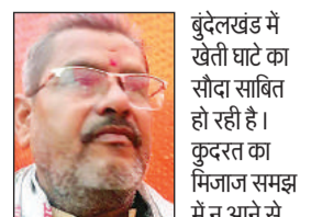
बुंदेलखंड में खेती घाटे का सौदा साबित हो रही है। कुदरत का मिजाज समझ में न आने से साल दर साल लाभ की जगह नुकसान की संभावनाएं बढ़ रही हैं। कभी समय से बारिश नहीं होती तो कभी बेमौसम बरसात कृषि का गणित बिगाड़ कर रख देती है। इस बारिश से अधिकांश फसल को नुकसान होगा।