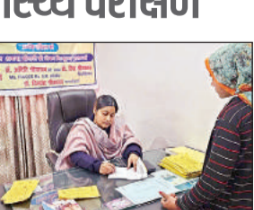
रोगी का स्वास्थ्य परीक्षण करती डॉक्टर।

विश्व एड्स दिवस पर नेत्र ज्योति जांच और रोग विशेषज्ञ व रोग विशेषज्ञ व रोग विशेषज्ञ के स्वास्थ्य केन्द्र कमासिन में डीपीएमआई कौशल केंद्र नेशनल रिकल