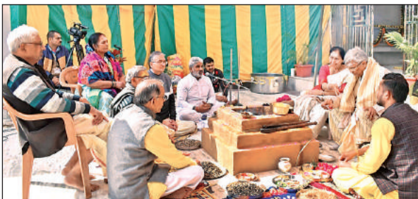
हवन में पूर्णाहुति देते श्रद्धालु।