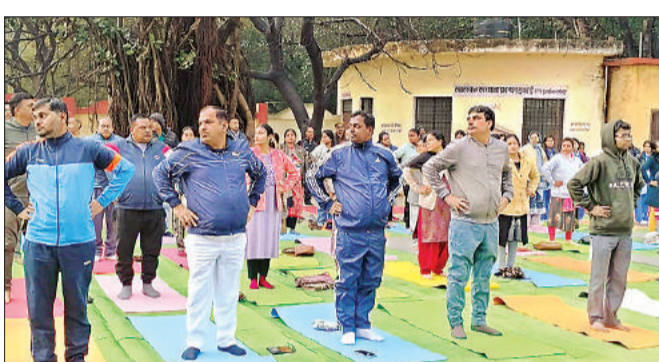
कल्पवृक्ष में योगासन करते अधिकारी व अन्य लोग।