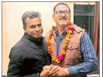
फूल माला पहनकर स्वागत करते कर्मचारी।

जैतपुर महोबा। एडीओ आईएसबी के स्थानांतरण पर ब्लॉक सभागार में विदाई समारोह का आयोजन किया गया। जहां पर उपस्थित समस्त लोगों ने पुष्प गुच्छ भेंट कर शुभकामनाएं दी, और निरंतर आगे बढ़ने की कामना की। विकासखंड जैतपुर में सहायक विकास अधिकारी आईएसबी के पद पर तैनात