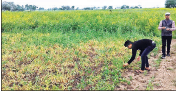
बारिश के बाद फसल का जायजा लेने खेत पहुंचे किसान।

बुंदेलखंड में आज भी तकरीबन 80 फीसद किसान अपने खेतों में फसल उत्पादन के लिए पूरी तरह से प्रकृति पर ही निर्भर हैं। खेतों में सिंचाई के लिए उन्हें वर्षा के देवता इंद्र की मन्तव्य करनी पड़ती है या फिर आसपास के बड़े किसानों के द्यूबवेल का सहारा लेना पड़ता