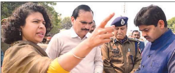
नक्शों का अवलोकन करते अधिकारी।

अमृत विचार: लोकसभा चुनाव के मद्देनजर आज आयुक्त चित्रकूटधाम मंडल व पुलिस उप महानिरीक्षक ने कृषि उत्पादन मण्डी समिति का स्थलीय निरीक्षण किया। मंडलीय अधिकारियों ने मण्डी समिति में चारों विधानसभा क्षेत्रों के लिए बनाए जाने वाले स्ट्रॉग रूम व नक्शों का अवलोकन किया। संबंधित अधिकारियों को निर्देशित किया कि मतदान पार्टियों की रवानगी एवं वापसी, स्ट्रॉग रूमों की तैयारी एवं मतगणना की तैयारी विधान सभावार प्लान तैयार कर की जाए। आयुक्त ने दुकानों/टीन शैडों की रगाई-पुताई