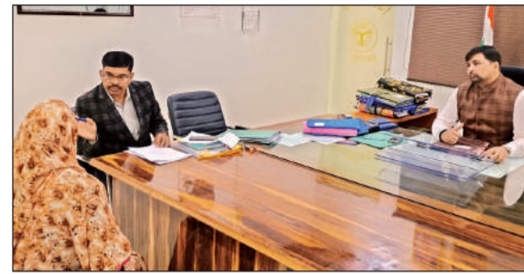
महिला की समस्या सुनते जिलाधिकारी।