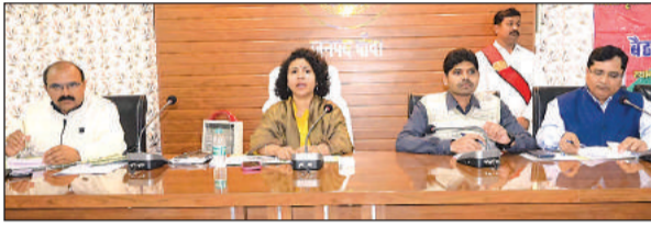
संबंधित अधिकारियों की बैठक लेती डीएम दुर्गा शक्ति नागपाल।

अमृत विचार: जिलाधिकारी दुर्गा शक्ति नागपाल की अध्यक्षता में सोमवार को जिला वृक्षारोपण समिति की बैठक का आयोजन हुआ। बैठक में जिलाधिकारी ने जनपद में तकरीबन 64 लाख वृक्षों के वृक्षारोपण किये जाने के लिए सम्बन्धित विभागों के अधिकारियों को निर्धारित लक्ष्य के अनुरूप गड्डों की खुदाई कराये जाने के निर्देश दिये। जिलाधिकारी ने पर्यावरण को सुरक्षित एवं संतुलित रखने के लिए टास अपशिष्ट पदार्थों एवं मेडिकल वेस्ट तथा मैटेरियल वेस्ट का उचित प्रबन्धन सम्बन्धित विभागों के अधिकारियों को करने के लिए प्रभावी कार्यवाही किये जाने के निर्देश दिये। उन्होंने निर्देशित किया कि नदी एवं नालों में प्रदूषित जल