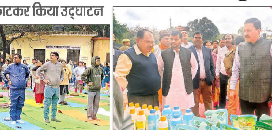
परेड ग्राउंड में स्ताल का निरीक्षण करते डीएम व अन्य। अमृत विचार

बैठकर नौका विहार का लुप्त उठाया। उन्होंने बताया की इस महोत्सव में बुंदेलखंड के गौरव के बारे में विस्तार से जानकारी दी जाएगी। वहीं देर शाम को पुलिस परेड मैदान में सांस्कृतिक कार्यक्रम