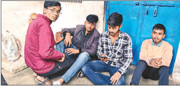
महिला के बेटे को सांत्वना देते मित्र।