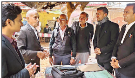
अधिवक्ता संघ चुनाव के लिए प्रचार करते प्रत्याशी।

जिला अधिवक्ता संघ चुनाव में मंगलवार को अध्यक्ष व महासचिव समेत चार पदों के लिए 17 प्रत्याशियों के लिए मतदान होगा। चुनाव के