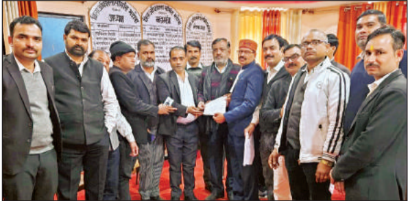
सांसद प्रतिनिधि को जापान सौंपते लोग।