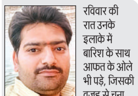
रविवार की रात उनके में बारिश के साथ आफत के ओले भी पड़े, जिसकी वजह से चना, मसूर और सरसों का अधिकांश फूल झड़ गया है। जिससे उनके क्षेत्र में रबी की फसल को भारी नुकसान हुआ है। वेम हालतों में छोट और मध्यमवर्गीय किसानों को साल भर का खर्च भी निकाल पाना मुश्किल होगा।

तक इंतजार करना पड़ता है। इस वर्ष भी पश्चिमी विक्षोभ के चलते कुदरत के रूठ जाने से एक बार फिर बुंदेली किसान उसी बर्बादी की राह पर कदम रख चुका है। यहां के किसानों को समय से बारिश न होने के कारण पहले बुआई के लिए लंबा इंतजार करना पड़ा और जब बुआई हो गई तो समय पर पलेवा के लिए बारिश नहीं हुई। अब जब रबी की फसल चना, मसूर और सरसों