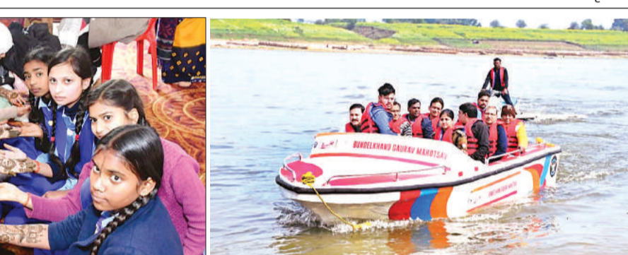
यमुना नदी में वोटिंग का लुक उठाते डीएम व अन्य अधिकारी।

का आयोजन किया जाएगा। उधर महोत्सव के मुख्य कार्यक्रम योग एवं अन्य गतिविधियों के तहत प्रातः प्रशासनिक अधिकारियों, जनप्रतिनिधियों व छात्र छात्राओं ने कल्पवृक्ष परिसर में योग कर महोत्सव का शुभारंभ किया। इस