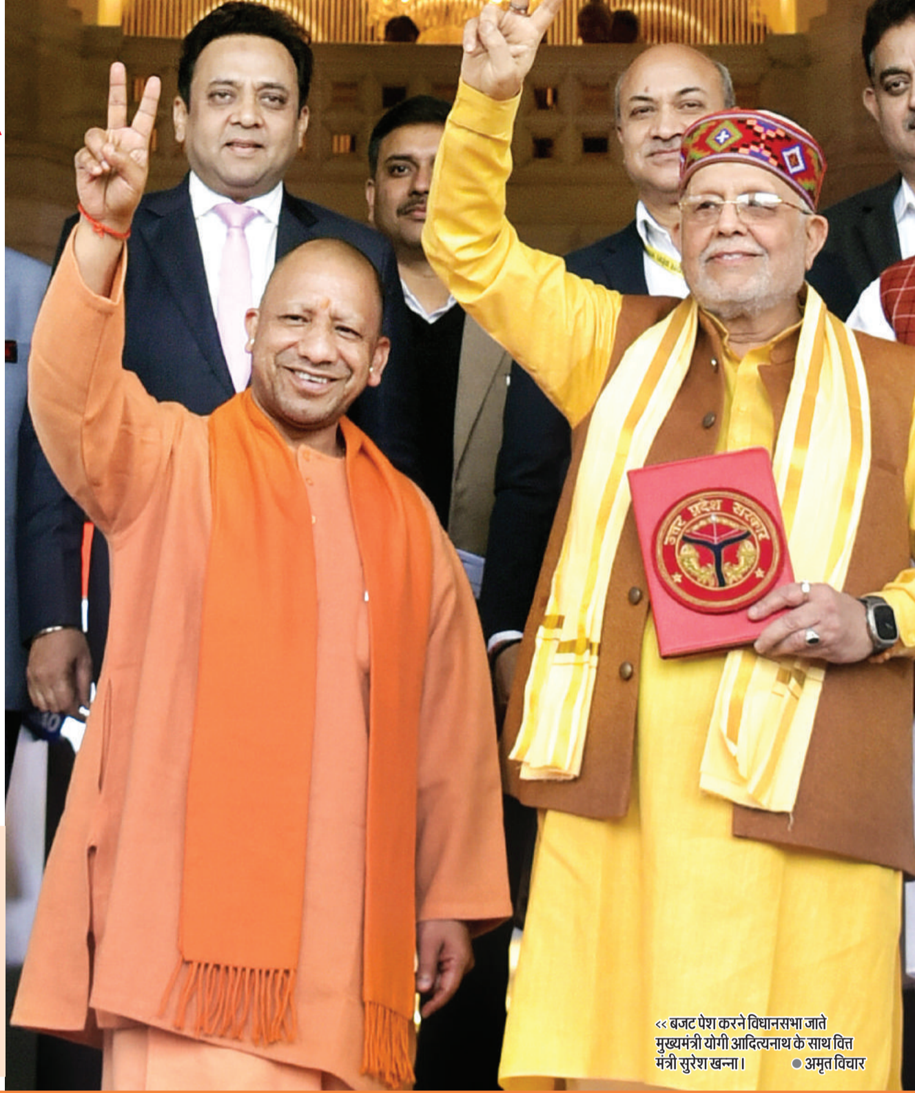
<< बजट पेश करने विधानसभा जाते मुख्यमंत्री योगी आदित्यनाथ के साथ वित्त मंत्री सुरेश खन्ना।

आस्था, अन्त्योदय व अर्थव्यवस्था को समर्पित बजट मुख्यमंत्री योगी आदित्यनाथ ने सोमवार को विधान सभा में वित्तीय वर्ष 2024-25 का बजट प्रस्तुत होने के बाद विधान भवन स्थित तिलक हॉल में आयोजित प्रेसवार्ता को सम्बोधित करते हुए कहा कि यह बजट आस्था, अन्त्योदय और अर्थव्यवस्था को समर्पित है। बजट में बढ़ोतरी डबल इंजन सरकार की प्रदेश की अर्थव्यवस्था को विस्तार देने तथा प्रधानमंत्री नरेन्द्र मोदी के 'सबका साथ, सबका विकास, सबका विश्वास, सबका प्रयास' के विजन के प्रति प्रतिबद्धता को प्रस्तुत करती है। उन्होंने कहा कि यह बजट उत्तर प्रदेश को देश का ग्रोथ इंजन तथा 01 ट्रिलियन डॉलर की अर्थव्यवस्था बनाने की प्रधानमंत्री की संकल्पना का प्रतिनिधित्व करता है। बीते 7 साल में राज्य की अर्थव्यवस्था को दोगुना करने में सफलता प्राप्त हुई है। आज उत्तर प्रदेश देश की सबसे तेजी से उभरती हुई अर्थव्यवस्थाओं में से एक है।