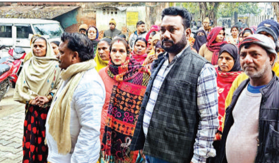
घेराव करते पीड़ित।