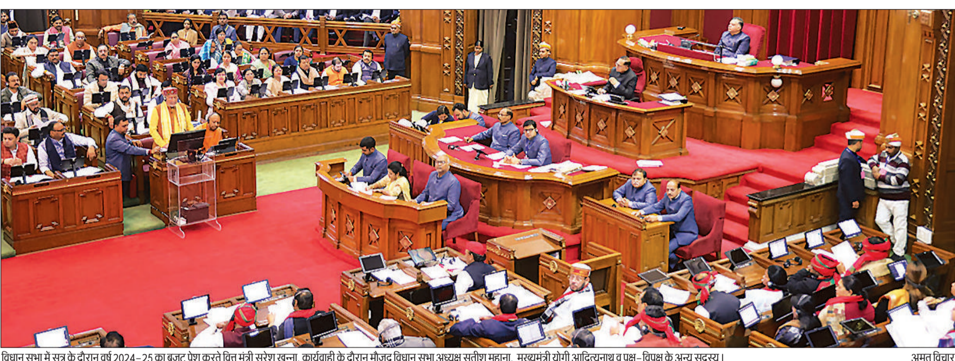
विधान सभा में सत्र के दौरान वर्ष 2024-25 का बजट पेश करते वित्त मंत्री सुरेश खन्ना, कार्यवाही के दौरान मौजूद विधान सभा अध्यक्ष सतीश महाना, मुख्यमंत्री योगी आदित्यनाथ व पक्ष-विपक्ष के अन्य सदस्य।