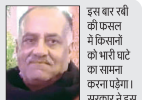
इस बार रबी की फसल में किसानों को भारी घाटे का सामना करना पड़ेगा। सरकार ने इस वर्ष गेहूं के न्यूनतम समर्थन मूल्य में 150 रुपये की बढ़ोतरी की है, जो नाकाफी है। बेमौसम बरसात के कारण जो घाटा होगा उसकी भरपाई कहीं से भी संभव नहीं है। सरकार को सर्वे करवाकर किसानों को मुआवजा देना चाहिए।