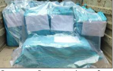
पुलिस द्वारा बरामद किया गया गांजा और घटना की जानकारी देते पुलिस अधीक्षक।

▶▶ जगतपुर पुलिस और एसओजी के संयुक्त ऑपरेशन में मिली कामयाबी