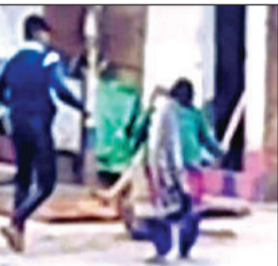
विक्षिप्त को पीटा बेटा व पत्नी।

अमृत विचार। सिकंदरपुर निवासी विक्षिप्त व्यक्ति को उसकी पत्नी व बेटे द्वारा बेरहमी से पीटे जाने का वीडियो बनाकर किसी ने सोशल मीडिया पर वायरल कर दिया। यह घटना कस्बा सिकंदरपुर के मोहल्ला भगत सिंह नगर की बताई जा रही है। यहां एक विक्षिप्त व्यक्ति अपने घर की छत पर था, तभी उसके पुत्र व पत्नी ने उसे लाठी डंडों से मारना पीटना शुरू कर दिया। बेरहमी का दिल यहीं नहीं भरा तो जालिम बेटे ने पिता के हाथ पकड़े और घसीटते हुए जाने की तरफ ले गया। इस दौरान उसकी पत्नी बराबर उसको डंडे से पीटती रही। यह मामला वहां किसी