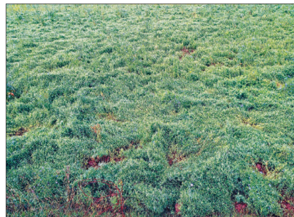
बारिश से खेतों में पसरी पड़ी मसूर की फसल।

पौथिया प्रतिनिधि के अनुसार रविवार को पौथिया सहित उजनेड़ी, शिकरी, सहुरापुर, ललपुरा, कलौलीजार, स्वासा आदि गांवों में दिन में धूप नहीं निकली। दिन