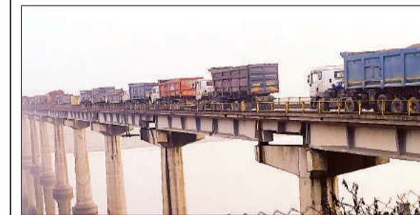
हाईवे पर जाम में फंसे वाहन।