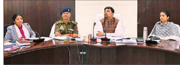
सुनाव संबंधी बैठक में भाग लेते डीएम, एसपी व सीडीओ।

डीएम ने कहा कि सेक्टर मजिस्ट्रेट के साथ पुलिस अधिकारी प्रत्येक बूथ की व्यवस्थाएं देखें। उन्होंने कहा कि मतदाता भयभीत न हों, इसका ध्यान रखें। बूथों की