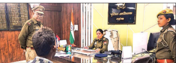
जनसुनवाई में फरियादियों की समस्याएं सुनती एसपी।