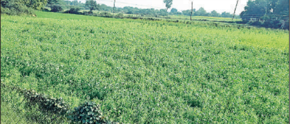
खेत में लहलहाती फसल।

रविवार की रात को करीब नौ बजे से अचानक शुरू हुई बारिश रात ग्यारह बजे तक होती रही, इसके बाद रुक रुक तक तड़के सुबह तीन बजे तक बारिश हुई, जिससे खेतों में ठीक ठाक सिंचाई हो जाने से किसानों ने राहत की सांस ली। किसान इस बारिश से खुसा कदवा रहे, वहीं बारिश से मटर में लग रही सुड़ी भी झड़ गई, इससे मटर की फसल भी लहलहाने लगी है। हालांकि नीचाई इलाकों में जगह जगह पानी भर जाने से लोगों को असुविधा का भी सामना करना पड़ा।