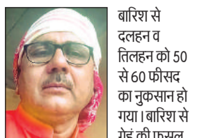
बारिश से दलहन व तिलहन को 50 से 60 फीसद का नुकसान हो गया। बारिश से गेहूं की फसल को फायदा है, लेकिन इससे पहले तकरीबन एक माह तक लगातार कोहरे के कारण गेहूं की फसल को काफी नुकसान हुआ है। जिसकी वजह से इस बार गेहूं का दाना पकने की स्थिति में आने तक काफी पलता हो जाएगा।