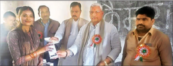
मोबाइल वितरित करते भाजपा नेता।