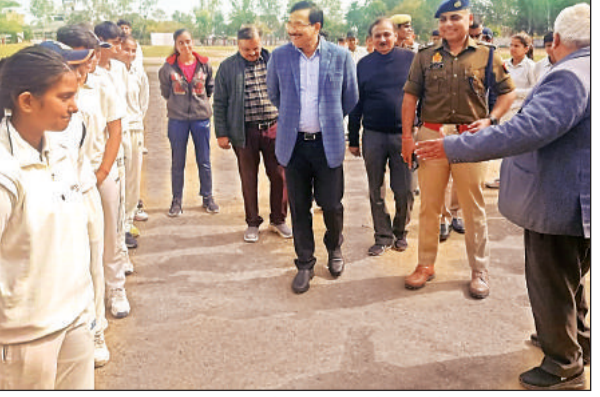
रजिस्टर्ड महिला खिलाड़ी भाग ले रही है, ये टूर्नामेंट जिले में पहली