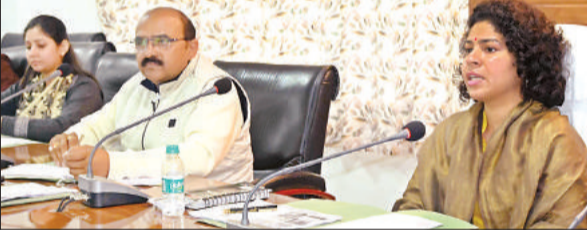
बैठक करती जिलाधिकारी दुर्गा शक्ति नागपाल।