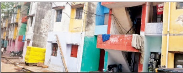
बिना रंगाई पुताई के खड़ी कांशीराम कालोनी।

कांशीराम कालोनीयों तो आबाद हो गईं, लेकिन वहां पर अत्यवस्थाओं का बोलबाला बना हुआ है। बिजली जाने पर बिजली विभाग के कर्मचारी दो दो दिन तक बिजली ठीक करने नहीं जाते हैं, जिससे मजबूरी में लोगों को पैसे देकर प्राइवेट तौर पर बिजली व्यवस्था बहाल करानी पड़ती है।