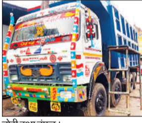
चोरी हुआ डंफर।