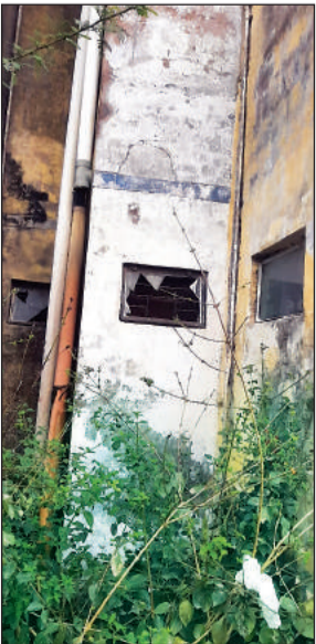
टूटे पाइप जहां से बहाई जाती है गंदगी।