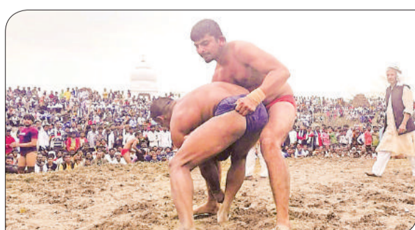
दंगल में दांव पेश दिखाते पहलवान।