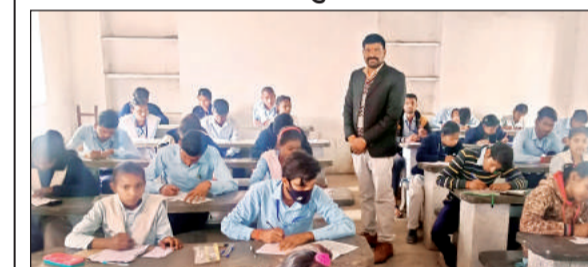
सीआईसी में परीक्षा देते विद्यार्थी।