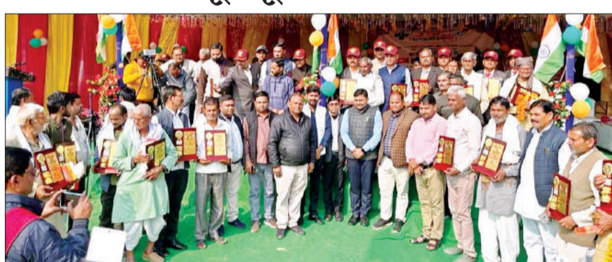
सम्मान समारोह के दौरान मौजूद भूतपूर्व सैनिक और स्वतंत्रता संग्राम सेनानी।