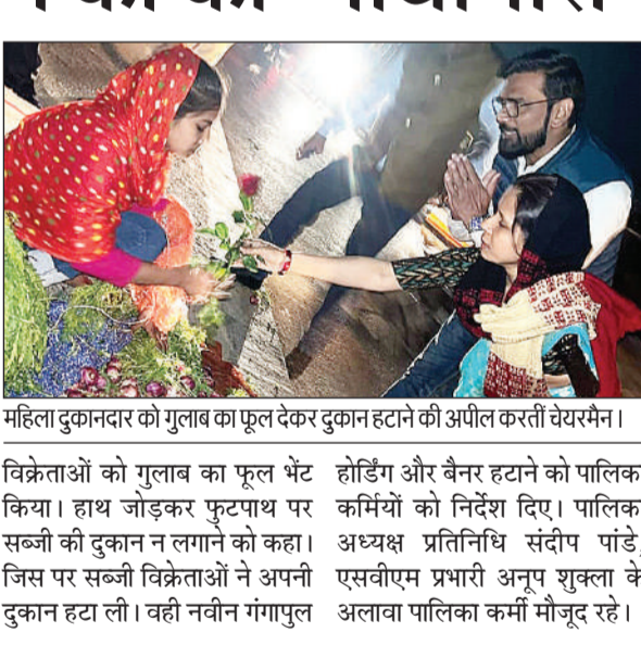
महिला दुकानदार को गुलाब का फूल देकर दुकान हटाने की अपील करती चेयरमैन।