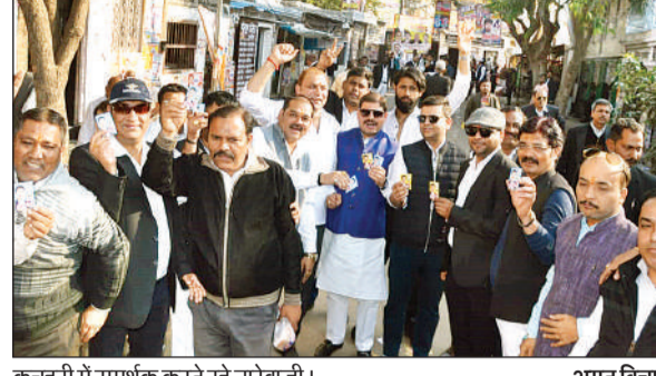
कचहरी में समर्थक करते रहे नारेबाजी।