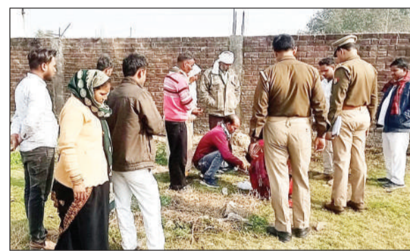
घटना की छानबीन करती पुलिस।