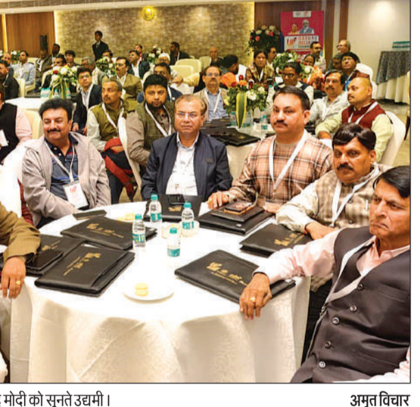
समारोह में लाइव प्रसारण में प्रधानमंत्री नरेंद्र मोदी को सुनते उद्यमी।

की ओर से विकास के बटन को दबाते ही अब इनपर काम शुरू हो जाएगा। ग्राउंड ब्रेकिंग सेरेमनी से उद्यमी उत्साहित हैं। वे मान रहे हैं कि इकाइयों में जल्द ही उत्पादन कार्य भी शुरू हो जाएगा।