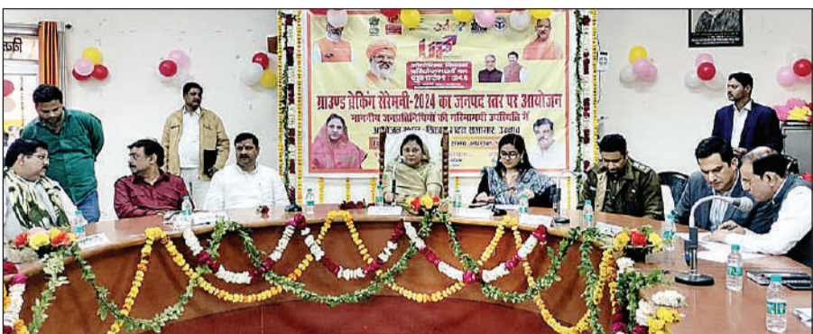
पीएम द्वारा उद्घाटन का लाइव प्रसारण देखते जन प्रतिनिधि व अफसर।

अमृत विचार। लखनऊ के इंदिरा गांधी प्रतिष्ठान सभागार से सोमवार को प्रधानमंत्री नरेंद्र मोदी ने उज्जवा में ग्राउंड ब्रेकिंग सेरेमनी 4 में होने वाले 19424.78 करोड़ रुपये के निवेश में 6276.12 करोड़ के निवेश वाली 74 परियोजनाओं का उद्घाटन किया। जिसके तहत जिले में करीब 20 हजार लोगों को रोजगार मुहैया कराया जायेगा। जिसका सजीव प्रसारण जिले की हर विधानसभा क्षेत्रों में किया गया। जहां जन प्रतिनिधि, उद्यमीगण व निवेशक मौजूद रहे।