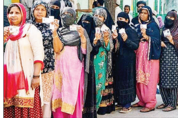
वोट डालने जाती महिलाएं

लोकसभा चुनाव से पहले भारत निर्वाचन आयोग ने विशेष मतदाता पुनरीक्षण अभियान चलाया, जिसमें वीआईपी मतदाताओं की सूची तैयार करने के निर्देश दिए। इनमें सभासद, ग्राम प्रधान, क्षेत्र स्वयंसेवक, जिला पंचायत सदस्य, विधायक, सांसद, ब्लॉक प्रमुख, जिला पंचायत