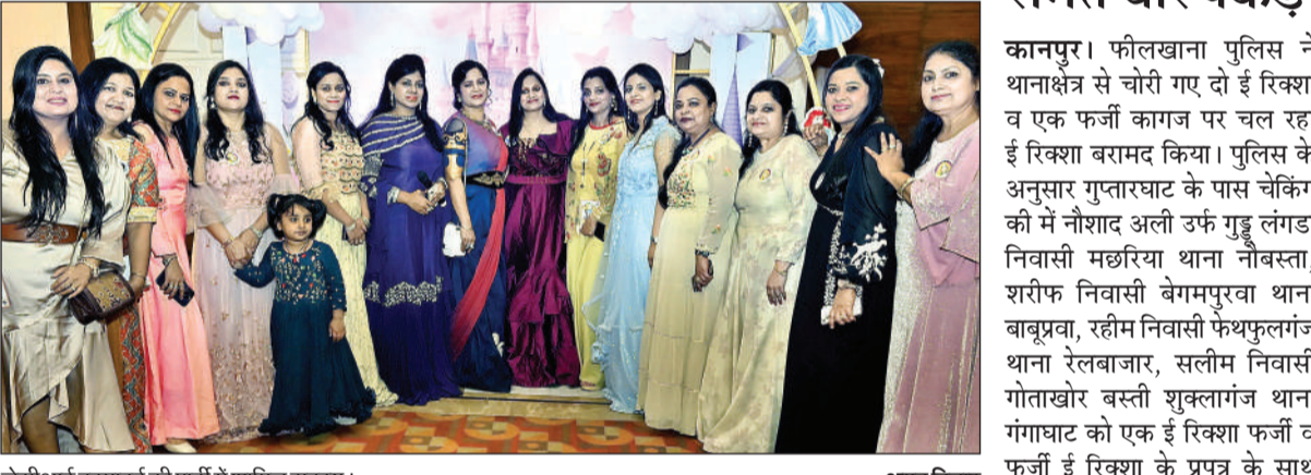
जेसीआई ब्रह्मवर्त की पार्टी में शामिल सदस्य।

अमृत विचार। जेसीआई ब्रह्मवर्त के जेसीरेट विंग के प्रिंसेस पार्टी कार्यक्रम में सोमवार महिला सदस्यों ने जमकर धमाल मचाया। मोतीझील स्थित एक होटल में सोमवार को आयोजित प्रिंसेस पार्टी की तैयारियां काफी समय से चल रही थीं और इसका इंतजार भी था। सोमवार को सभी जेसीरेट प्रिंसेस वेशभूषा में आईं। सभी सदस्यों को आठ समूहों में विभाजित किया गया और सभी समूहों के नाम महार प्रिंसेस ऐलसा, मुलान, ऐरियल, स्नोव्हाइट, रुजल आदि रखे गए। कई आकर्षक व रोचक गेम खेले गए। जैसे ड्रेस लाइक प्रिंसेस, सिनडरेला के शूज,