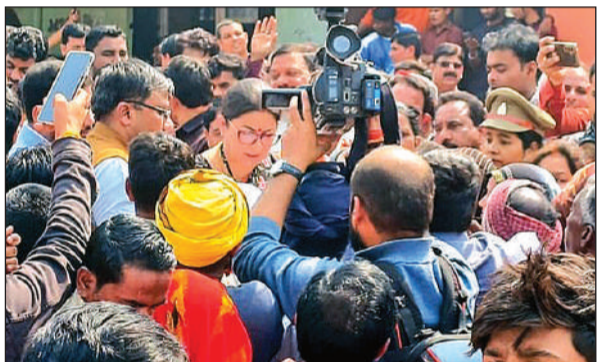
जन संवाद विकास यात्रा के दौरान समस्याएं सुनती केंद्रीय मंत्री स्मृति ईरानी।

अपने चार दिवसीय भ्रमण पर सोमवार को केंद्रीय मंत्री स्मृति ईरानी बाजार में बनाए गए चौपाल स्थल पर 12 बजे पहुंचीं। गाड़ी से