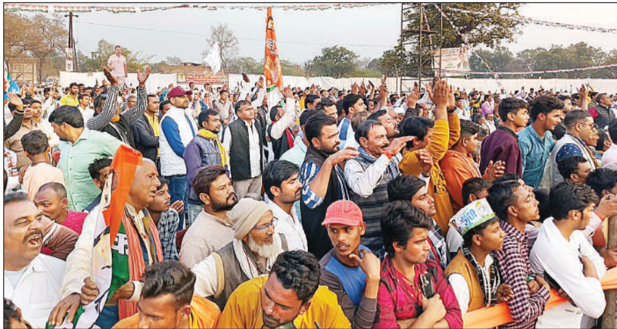
भारत जोड़े न्याय यात्रा के दौरान सभा में मौजूद लोग।

अमृत विचार : भारत जोड़े यात्रा में उमड़ी भीड़ को संबोधित करते हुए कांग्रेस के पूर्व अध्यक्ष और सांसद राहुल गांधी ने कहा कि जय श्रीराम, जय श्रीराम। न्याय यात्रा के दौरान सोमवार दोपहर को गौरीगंज थाना क्षेत्र के बाबूगंज निकट टोल प्लाजा के पास आयोजित जनसभा को संबोधित करते हुए राहुल गांधी ने सरकार को घेरे हुए कहा कि पीएम मोदी ने एयरपोर्ट छीन लिया, पब्लिक सेंटर सब छीन लिया, इंफ्रास्ट्रक्चर छीन लिया, आपके स्कूल कॉलेज सब लेकर चले गए। अपने राम मंदिर समारोह देखा, देखा न, धूमधाम से हुआ, देखा न, उसमें आपने किसी गरीब को देखा, आपकी राष्ट्रपति हमारी राष्ट्रपति आदिवासी है, उनको अंदर नहीं आने दिया गया, उनका चेहरा देखा आपने, मजदूर को देखा, पिछड़े वर्ग को आपने देखा, नहीं। अडानी देखा, उसके बच्चे देखे, अख्तियार देखा, उसके बच्चे देखे, सारे बिजनेसमैन वाले देखे, नरेंद्र मोदी देखे पर नहीं देखे गए तो गरीब। कांग्रेस सांसद राहुल गांधी ने भाजपा पर प्रहार करते हुए कहा कि किसान दिल्ली जा रहे हैं। आज मैंने फोटो देखी कि