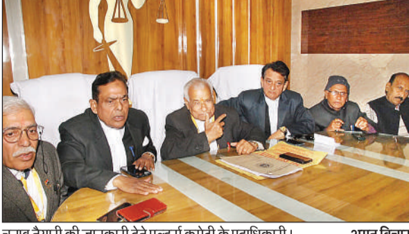
चुनाव तैयारी की जानकारी देते एलडस कमेट्री के पदाधिकारी।

अमृत विचार। लॉयर्स एसोसिएशन के अध्यक्ष, महामंत्री समेत विभिन्न पदों के 61 दावेदारों का फैसला मंगलवार को 6794 वोटर तय करेंगे। चुनाव मंगलवार को डीएवी डिग्री कॉलेज में सुबह नौ से शाम पांच बजे तक संपन्न कराया जाएगा। मतदान से पूर्व सोमवार को मतदान स्थल पर एलडस कमेट्री ने पूरी तैयारियों का जायजा लिया। मतदान सफाई संपन्न कराने के लिए 50एअरओ, दो कंट्रोल रूम, 64 सीसीटीवी कैमरे, दो ड्रोन व 16 पीजीटी कैमरों की व्यवस्था की है। बुधवार सुबह 11 बजे से अध्यक्ष व महामंत्री पदों की गिनती शुरू होगी।