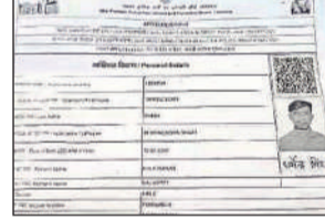
आवेदन जो कैफे पर किया गया।

पुलिस आरक्षी भर्ती परीक्षा के पहले दिन सोशल मीडिया पर फिल्म अभिनेत्री का प्रवेश पत्र वायरल हुआ था जो चर्चा का विषय बन गया। इसमें परीक्षा केंद्र सोनेश्री स्मारक महाविद्यालय दर्ज था जहां सुबह पाली में परीक्षा होनी थी।