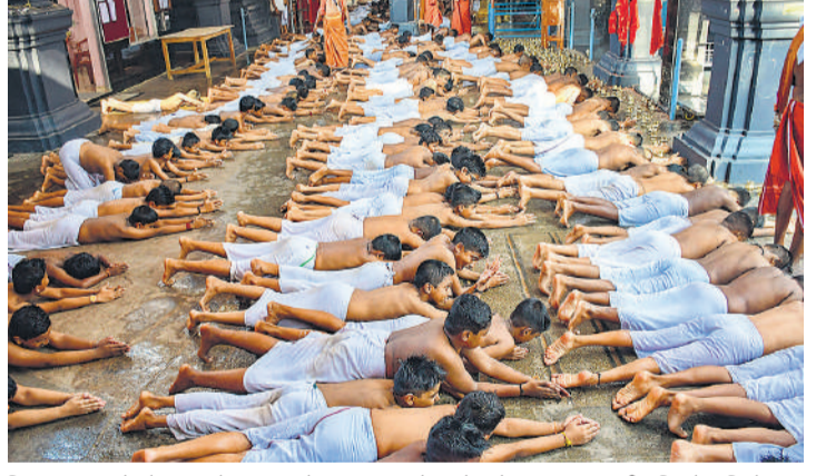
तिरुवनंतपुरम में सोमवार को अटुकल पोंगाला उत्सव से पहले बच्चे अटुकल भगवती मंदिर में कुथियुडुम अनुष्ठान करते हुए।