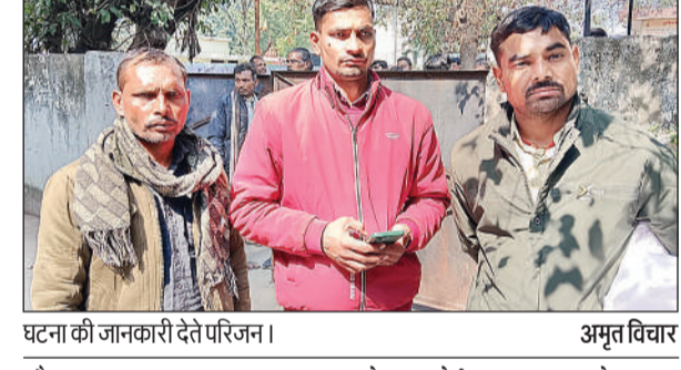
घटना की जानकारी देते परिजन। अमृत विचार

अमृत विचार। दोस्तों के यहां से घूमकर घर वापस जाते समय एक किसान को सेंट्रल स्टेशन की पार्किंग के पास बदमाशों ने अपना निशाना बना लिया। पीड़ित को लूटने के बाद पीट-पीटकर हत्यारोपियों ने मार डाला। पोस्टमार्टम हाउस पहुंचे परिजनों ने यह गंभीर आरोप लगाए हैं। जीआरपी मामले की जांच कर रही है। वहीं पोस्टमार्टम होने के बाद परिजन शव को लेकर बिहार