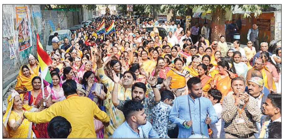
पंचकल्याणक महोत्सव में आदिकुमार के जन्म पर जमकर नाचे भक्त।

जैन मंदिर प्राण-प्रतिष्ठा महोत्सव के तहत सोमवार को पंच कल्याणक महोत्सव हुआ। सोमवार सुबह आदिकुमार का जन्म हुआ। जन्म होते ही महिलाओं ने बधाई गीत गाए। इसी के बाद आदिकुमार की पूजा, आरती, उनपर धनवर्षा की गई। फिर ऐरावत हाथी पर