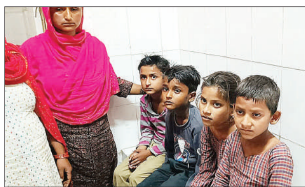
सरसौल सीएचसी भेजे गए बीमार बच्चे।