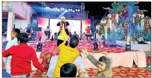
कलाकार द्वारा प्रस्तुत वीठी गीतों पर झूमते भक्त।