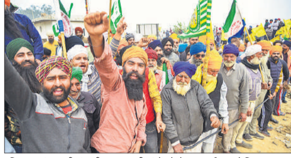
हरियाणा-पंजाब की शंभू सीमा पर अपनी मांगों को लेकर प्रदर्शन करते किसान ।