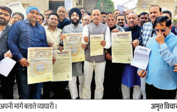
अपनी मांगें बताते व्यापारी।