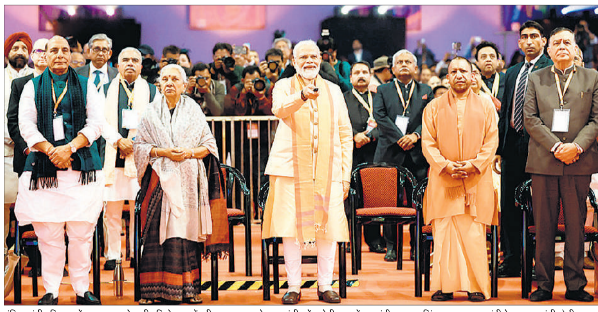
इंदिरा गांधी प्रतिष्ठान में 10 लाख करोड़ की परियोजनाओं की शुरुआत करते प्रधानमंत्री नरेन्द्र मोदी साथ में रक्षामंत्री राजनाथ सिंह, राज्यपाल आनंदी बेन व मुख्यमंत्री योगी ।

अमृत विचार : प्रधानमंत्री नरेन्द्र मोदी सोमवार को इंदिरा गांधी प्रतिष्ठान में उत्तर प्रदेश सरकार के बहुप्रतिष्ठित ग्राउंड ब्रेकिंग सेरेमनी के चौथे संस्करण में शामिल हुए और रिमोट का बटन दबाकर 10 लाख करोड़ रुपये से अधिक की 14 हजार से ज्यादा परियोजनाओं की शुरुआत की। यहां उन्होंने चलचित्र के माध्यम से बदलते उत्तर प्रदेश की झलक भी देखी। प्रधानमंत्री ने इस मौके पर अपने संबोधन में मुख्यमंत्री योगी आदित्यनाथ और उत्तर प्रदेश की प्रशंसा करते हुए अन्य राज्यों को यहां से सबक लेने का संदेश दिया। प्रधानमंत्री ने कहा कि उत्तर प्रदेश में पिछले सात साल में डबल इंजन सरकार ने 'लालफीताशाही' को हटाकर निवेशकों के लिए अनुकूल माहौल बनाया है और उनके स्वागत के लिए 'लाल कालीन' बिजनेस हैं। प्रधानमंत्री ने स्पष्ट कहा कि उत्तर प्रदेश ने ठान लिया है कि वो एक ट्रिलियन डॉलर की इकोनॉमी बनेगा। देश के सभी राजनीतिक दलों से कहेंगे कि राजनीति छोड़िए और उत्तर प्रदेश से सीखिए। आप कितने ट्रिलियन डॉलर की इकोनॉमी अपने राज्य को बनाएंगे, ये संकल्प करके मैदान में आइए। देश तभी आगे बढ़ेगा जब उत्तर प्रदेश की तरह हर राज्य बड़े सपने और संकल्प लेकर चल पड़ेगा। प्रधानमंत्री ने स्वयं को उत्तर प्रदेश का सांसद बताकर यहां से जुड़ी हर उपलब्धि पर गर्व जताया। उन्होंने कहा कि मैं मुख्यमंत्री योगी आदित्यनाथ को विशेष बधाई देता हूँ। हर हिन्दुस्तानी