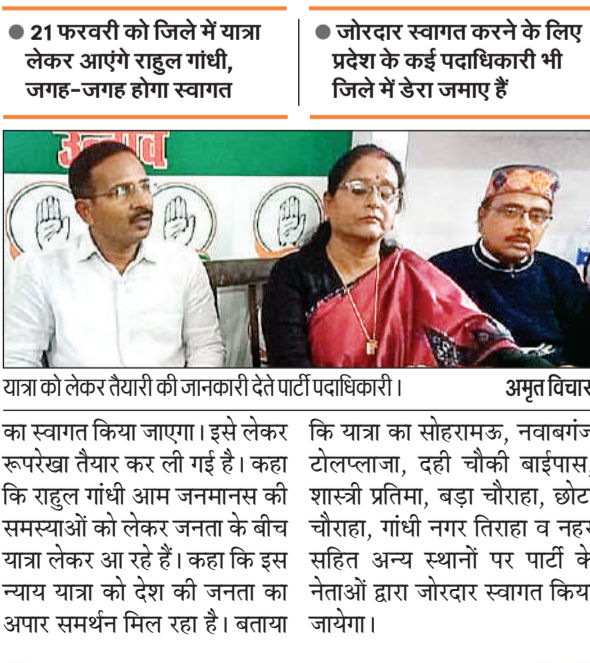
यात्रा को लेकर तैयारी की जानकारी देते पार्टी पदाधिकारी।

जोरदार स्वागत करने के लिए प्रदेश के कई पदाधिकारी भी जिले में डेरा जमाए हैं