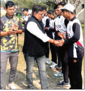
खिलाड़ियों से परिचय प्राप्त करते मुख्य अतिथि व आयोजक।

अमृत विचार। जिला क्रिकेट एसोसिएशन (डीसीए) द्वारा आयोजित 15वीं डा. सुब्रह्मण्य प्रसाद गुप्ता अंडर-16 जनपदीय क्रिकेट लीग में सोमवार को हुए मैच में अगस्त क्लब ने बैंकर्स इलेवन को 23 रनों से हराया।