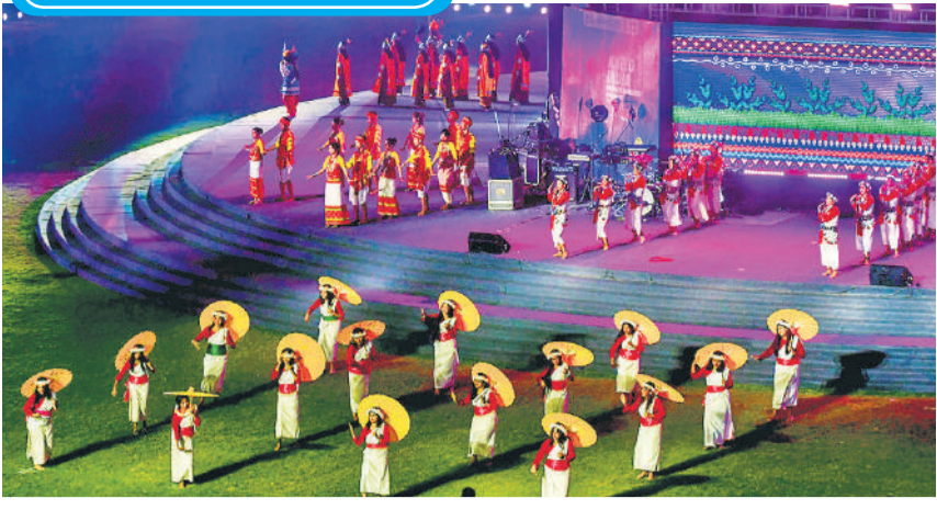
गुवाहाटी में सोमवार को आयोजित खेलो इंडिया यूनिवर्सिटी गेम्स के चौथे संस्करण के उद्घाटन समारोह के दौरान रंगारंग प्रस्तुति देते कलाकार।