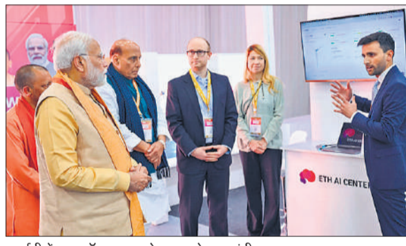
प्रदर्शनी में एक स्टॉल का अवलोकन करते प्रधानमंत्री ।

● रिमोट का बटन दबाकर किया 10 लाख करोड़ की परियोजनाओं की शुरुआत, इंदिरा गांधी प्रतिष्ठान में आयोजित प्रदर्शनी देखी