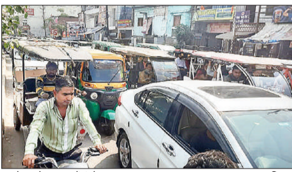
पुल के रास्ते पर जाम में फंसे वाहन सवार। अमृत विचार

अमृत विचार। सोमवार को नवीन पुल पर वाहनों का भार बढ़ने से नवीन पुल पर भीषण जाम लग गया। सुबह के समय जाम लगने के कारण कानपुर सीबीएसई बोर्ड की परीक्षा देने जा रहे सैकड़ों छात्र जाम में फंस गये। फोरलेन तक लगे भीषण जाम को देख पहुंची पुलिस ने आड़े-तिरछे खड़े वाहनों को सीधा कराया। जिसके बाद जाम हट सका। वहीं बोर्ड की परीक्षा देने वाले परीक्षार्थी पैदल पुल पार कर कानपुर की ओर से सवार में बैठकर अपने केन्द्रों पर पहुंचे।