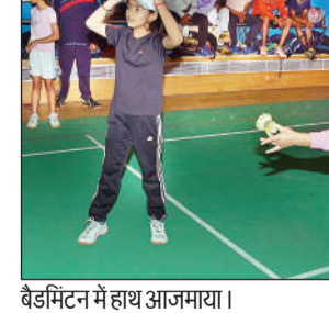
बैडमिंटन में हाथ आजमाया।