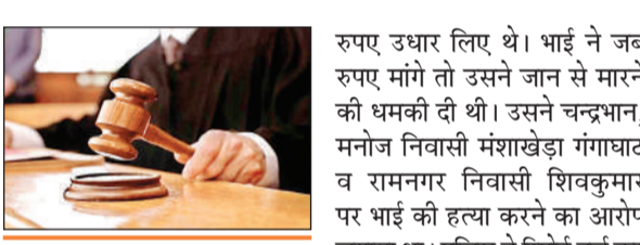
सभी पर 26-26 हजार का जुर्माना भी