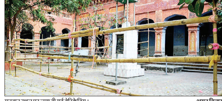
मतदान स्थल पर लगा दी गई बैरिकेडिंग। अमृत विचार

सभी पदों के लिए एक-एक वोट ही डाला जाएगा। 50 एअरओ रहेंगे, एक हजार पुलिसकर्मियों की तैनाती रहेगी। इसके साथ ही 45 रिटायर्ड सैन्यकर्मियों की तैनाती की जाएगी। मतदान पर नजर रखने को कंट्रोल रूम बनेंगे, मतदान व मतगणना परिसर में पांच डिस्प्ले स्क्रीन लगाई जाएंगी।