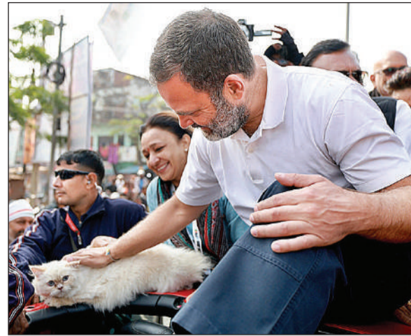
प्रतापगढ़ में जनसभा के दौरान बिल्ली को पुचकारते राहुल गांधी।

निकाल लेते हैं, पेट्रोल का पैसा जा रहा है, जौएसटी जा रहा है, जितना पैसा मैं देता हूँ, उतना ही अडानी दे रहा है तो मुझको लाभ क्यों नहीं मिलता। राहुल गांधी की भारत जोड़े न्याय यात्रा सोमवार को प्रतापगढ़ होते हुए उनके संसदीय क्षेत्र अमेठी