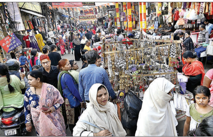
सीसामऊ बाजार में बीच रोड पर खड़े टेले।

अमृत विचार। सन् 1930 में स्थापित पीरोड बाजार उत्तर भारत की सबसे बड़ी संगठित बाजार में शुमार है। पुराने समय में श्रमिक बाजार के रूप में विख्यात बाजार में सुई से लेकर कार तक मुहैया होती है। आज के दौर में करोड़ों की लागत में रोजाना व्यापार करने वाली यह बाजार ई-रिक्शा, अतिक्रमण व जाम की समस्या से परेशान है। मुख्य मार्ग से लेकर गलियों में लगने वाले बाजार में न तो पार्किंग की व्यवस्था है और न ही यूरिनल की। इमारतों में महिलाओं को दूसरों के घरों का दरवाजा खटखटाने तक के लिए मजबूर होना पड़ता है। अंग्रेजों के शासन काल में अनुमानित 300 छोटी-छोटी दुकानों से स्थापित होने वाली पी रोड बाजार में आज करीब पांच से छह हजार की संख्या में दुकानें हैं। जूते, चप्पल, रेडीमेड कपड़ों, साड़ी व सलवार सूट के बड़े-बड़े शोरूम होने के साथ ही बाजार में कास्मेटिक, क्रांफरी, बर्तन बाजार है। महिलाओं की पसंदीदा बाजार में पी रोड में आम दिनों में करीब 30 से 40 हजार संख्या में ग्राहक आते हैं। बाजार का रोजाना का अनुमानित व्यापार करीब पांच करोड़ तक का है, लेकिन बाजार में पार्किंग, यूरिनल जैसी मूलभूत सुविधाएं तक नहीं हैं। दूर-दूर तक