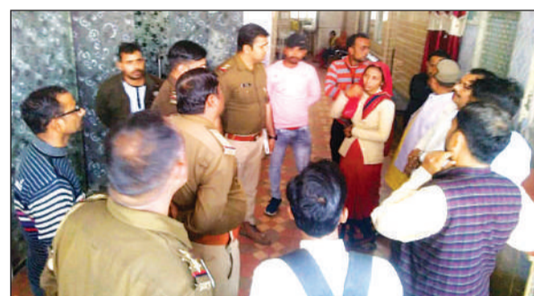
अस्पताल पहुंची पुलिस से शिकायत करते परिजन।