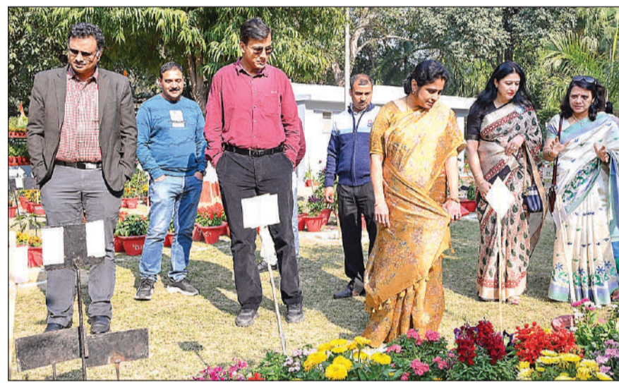
प्रदर्शनी में फूलों को देखते निर्णायक मंडल के सदस्य।

दूसरी श्रेणी में विभिन्न श्रेणियों में 1700 से अधिक गमले लगाए गए, जिसमें डायरेक्टर रजिंडेस को प्रथम