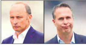
• नासिर और माइकल ने कहा- मेहमान टीम को मैच की स्थिति के अनुसार खेलने की जरूरत

इंग्लैंड के पूर्व कप्तानों नासिर हुसैन और माइकल वान ने भारत के खिलाफ मौजूदा टेस्ट श्रृंखला में 'बैजबॉल' (बेहद आक्रामक होकर खेलने की रणनीति) रवैये की आलोचना करते हुए कहा है कि मेहमान टीम को हमेशा आक्रामक होकर खेलने की रणनीति की जगह मैच की स्थिति के अनुसार खेलने की जरूरत है। भारत ने रविवार को राजकोट में तीसरे टेस्ट में इंग्लैंड को 434 रन से हराकर टेस्ट क्रिकेट में रन के लिहाज से सबसे बड़ी जीत दर्ज की। भारत के 557 रन के लक्ष्य का पीछा करते हुए इंग्लैंड की टीम 122 रन पर ढेर हो गई। मेजबान टीम 5 मैच की श्रृंखला में 2-1 से आगे चल रही है। अंतिम दो टेस्ट रांची