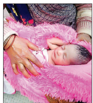
महिला की गोद में जन्मा शिशु।