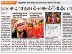
सोमवार को प्रकाशित खबर।

अमृत विचार। बीधापुर ब्लाक में शनिवार को सम्पन्न हुए मुख्यमंत्री सामूहिक विवाह समारोह में अफसरों और प्रधान की मिलीभगत से रुपये के लालच में दंपति की दोबारा शादी कराने के मामले में अब जिम्मेदारों को बचाने का खेल शुरू हो गया है। अविवाहित और पात्रता का प्रमाणपत्र देने वाले ग्राम विकास अधिकारी ने सोमवार शाम वर-वधू के नाम थाने में तहरीर दी। जिसे थाना प्रभारी ने तहरीर में ग्राम प्रधान व सचिव का नाम न होने से तहरीर लौटा दी। उन्होंने एसडीएम के निर्देश के बाद ही तहरीर लेने की बात कही है। बीधापुर तहसील क्षेत्र के ब्लाक