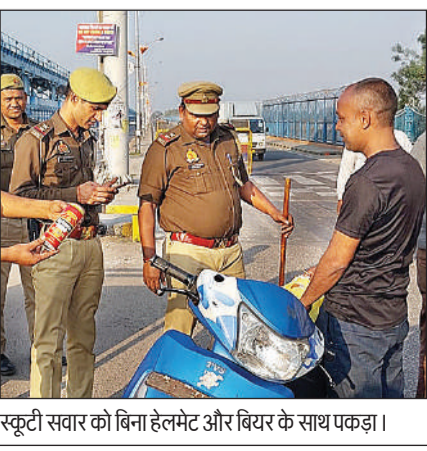
स्कूटी सवार को बिना हेलमेट और बिथर के साथ पकड़ा।

गया तो तीनों सवारों की जांच करने में तीनों शराब के नशे में मिले। वहीं तलाशी लेने पर बिथर और शराब की पैकेट भी मिले। पृथलाछ में तीनों ने शराब पीने और ले जाने की बात बताई। तीनों को पुलिस ने हिरासत में ले लिया। वहीं एक स्कूटी पर तीन महिलाओं और एक पुरुष को रोककर हिदायत दी गई। शाम सवा चार बजे से शुरू हुई चेकिंग साढ़े सात बजे तक चली। नियम तोड़ने वाले बीच पुल से ही गलत साइड भागकर पुलिस से बचते नजर आए।