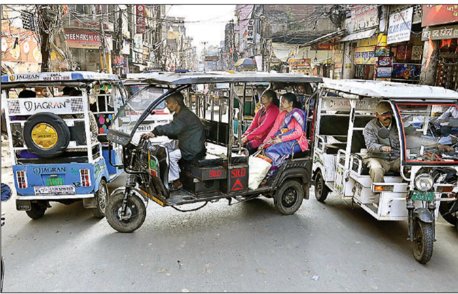
पी रोड पर ई-रिक्शा चालकों की धमाचौकड़ी।

व्यापारियों ने बताया कि गलियों में बसे सीसामऊ बाजार में छोटी-छोटी दुकानों के साथ ही साइडों व कपड़ों के शोरूम भी हैं। बाजार के बीच रोड में टेले पर दुकानें लगती हैं। इसके साथ ही दोनों ओर से फुटपाथों में कब्जा है, जिस कारण भूमिशुंकल 10 फिट चौड़ी सड़क से लोग गुजरते हैं। इसके साथ ही बाजार में जर्जर बिजली के तारों के कारण अक्सर शॉर्ट सर्किट होता रहता है। जिस कारण आगजनी का खतरा मंडरता रहता है। बाजार में गोपाल टॉकीज व वनखंडेश्वर चौराहे के पास हाइडेट पाइप की व्यवस्था थी, जो पूरी तरह से खत्म हो चुकी है।