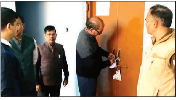
प्रश्नपत्रों को रखकर कमरा सील कर दिया गया है।