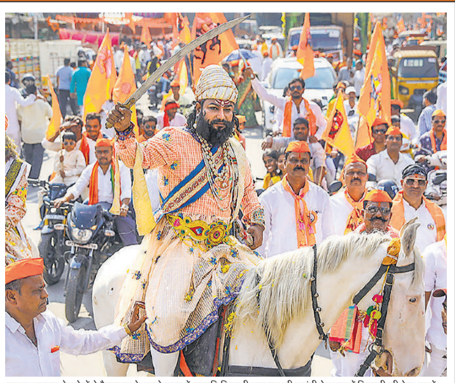
मराठा समुदाय के लोगों ने हैदराबाद के पुराने शहर में छत्रपति शिवाजी महाराज की जयंती के जश्न में शिवाजी की वेशभूषा में हिस्सा लिया। शिवाजी की जयंती का जश्न लोगों ने बढ़-चढ़कर मनाया।