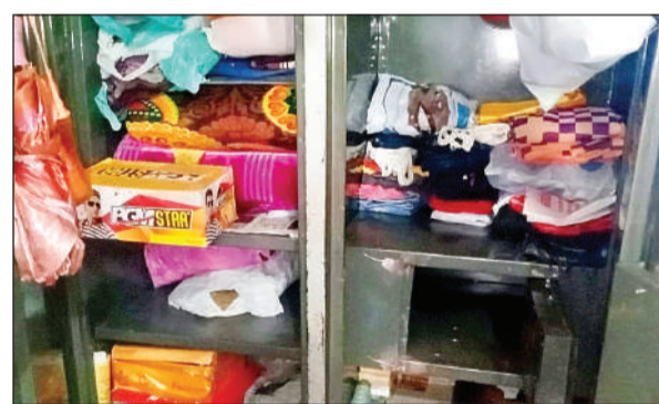
खुली पड़ी अलमारी व बिखरा पड़ा सामान।