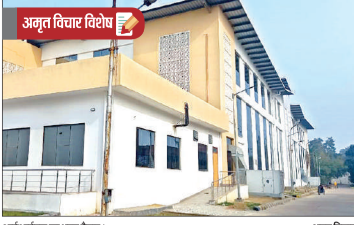
आईआईएस का भवन तैयार।

पीएम नरेंद्र मोदी के महत्वाकांक्षी प्रोजेक्ट आईआईएस (इंडियन इंस्टीट्यूट ऑफ स्किल) के उद्घाटन को लेकर अधिकारियों ने पिछले दिनों दौरा किया था। कौशल विकास और उद्यमिता