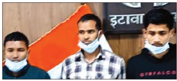
पुलिस की गिरफ्त में साल्वर गैंग के तीन सदस्य।