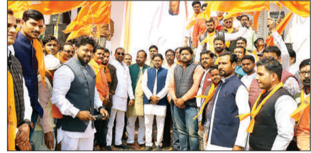
शिवाजी की जयंती पर जुटे लोग।