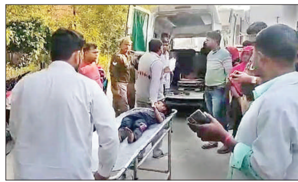
हालत ठीक नहीं देख कांशीराम ट्रामा सेंटर रेफर किया गया।