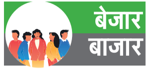
कार्यालय संवाददाता, कानपुर

अमृत विचार। सन् 1930 में स्थापित पीरोड बाजार उत्तर भारत की सबसे बड़ी संगठित बाजार में शुमार है। पुराने समय में श्रमिक बाजार के रूप में विख्यात बाजार में सुई से लेकर कार तक मुहैया होती है। आज के दौर में करोड़ों की लागत में रोजाना व्यापार करने वाली यह बाजार ई-रिक्शा, अतिक्रमण व जाम की समस्या से परेशान है। मुख्य मार्ग से लेकर गलियों में लगने वाले बाजार में न तो पार्किंग की व्यवस्था है और न ही यूरिनल की। इमारतों में महिलाओं को दूसरों के घरों का दरवाजा खटखटाने तक के लिए मजबूर होना पड़ता है। अंग्रेजों के शासन काल में अनुमानित 300 छोटी-छोटी दुकानों से स्थापित होने वाली पी रोड बाजार में आज करीब पांच से छह हजार की संख्या में दुकानें हैं। जूते, चप्पल, रेडीमेड कपड़ों, साड़ी व सलवार सूट के बड़े-बड़े शोरूम होने के साथ ही बाजार में कास्मेटिक, क्रांफरी, बर्तन बाजार है। महिलाओं की पसंदीदा बाजार में पी रोड में आम दिनों में करीब 30 से 40 हजार संख्या में ग्राहक आते हैं। बाजार का रोजाना का अनुमानित व्यापार करीब पांच करोड़ तक का है, लेकिन बाजार में पार्किंग, यूरिनल जैसी मूलभूत सुविधाएं तक नहीं हैं। दूर-दूर तक