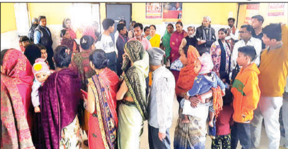
पीएचसी में लगी मरीजों की भीड़।