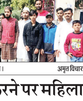
कोतवाली के बाहर जानकारी देते क्षेत्रीय लोग।

अमृत विचार। गंगाघाट कोतवाली क्षेत्र के मदनी नगर निवासी एक महिला को पड़ोसी नशे में धुत होकर गाली गलौज करता है, इसके साथ ही धमकी देता है। जिस पर गुस्साए क्षेत्र के विशेष समुदाय के लोग कोतवाली पहुंचे और युवक के खिलाफ तहरीर देकर कार्यवाही की मांग की है।