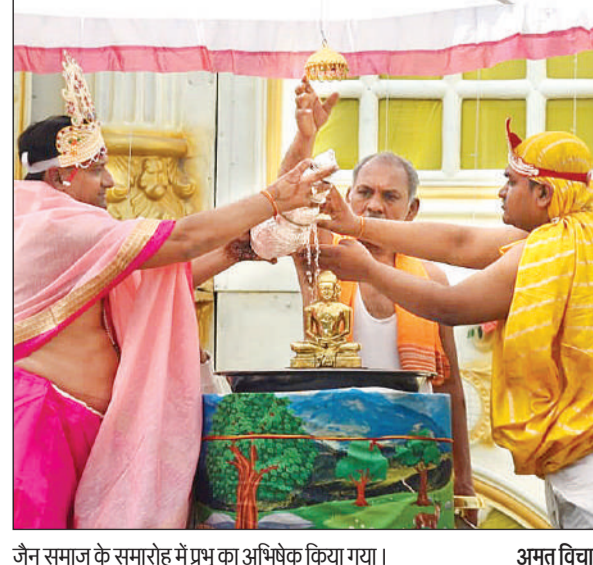
जैन समाज के समारोह में प्रभु का अभिषेक किया गया।