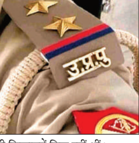
की शिकायतें मिल रही थीं।