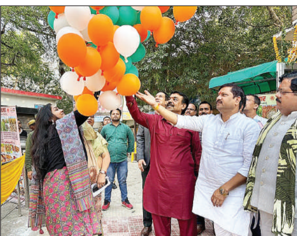
गुब्बारे उड़ते जन प्रतिनिधि व डीएम।