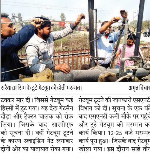
सरैयां क्रासिंग के टूटे गेटबूम की होती मरम्मत।

अमृत विचार। कानपुर-लखनऊ रेल रूट स्थित गंगा बैराज मार्ग पर बनी सरैयां रेलवे क्रासिंग के गेटबूम में मरहला चौराहे से कानपुर की ओर जा रहे अनियंत्रित ट्रैक्टर ने टक्कर मार दी। जिससे बूम दो हिस्सों में टूट गया। गेटमैन ने यातायात रोकने के लिये स्लाइडिंग गेट लगाया। दोपहर बाद गेटबूम की मरम्मत हुई। वहीं आरपीएफ ने ट्रैक्टर चालक के खिलाफ रिपोर्ट दर्ज की है। साढ़े तीन घंटे क्रासिंग बंद होने से कई किलोमीटर लंबा जाम लगा रहा। सोमवार सुबह 9:05 बजे मरहला चौराहे से बैराज मार्ग की ओर जा रहे एक ट्रैक्टर ने बंद हो रही रेलवे क्रासिंग के गेटबूम में