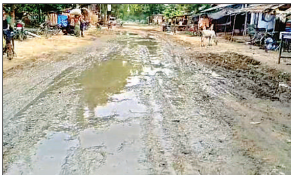
मौजूदा समय में मनावा गांव में गाजीपुर विजयीपुर मार्ग पर कीचड़युक्त सड़क।

मौजूदा समय में 34 किमी का सफर वाहन चालकों के लिए खासा कष्टकारी साबित हो रहा है। मार्ग से मौरंग लदे ट्रक, किसानों के ट्रैक्टर