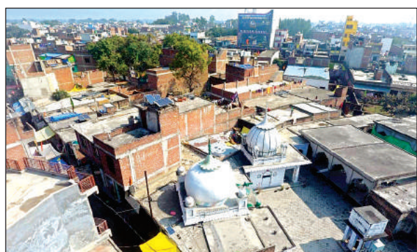
ड्रोन कैमरे से मस्जिद की निगरानी।