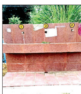
बंद पड़ी नल की टॉटी। अमृत विचार