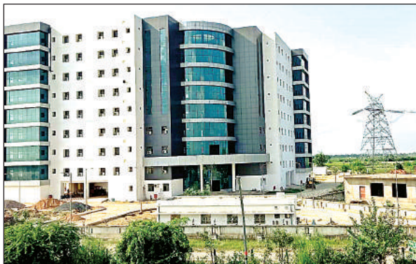
तालग्राम क्षेत्र में आगरा-लखनऊ एक्सप्रेस वे किनारे बनी फॉरेंसिक लैब। अमृत विचार

तहसील तिरवा क्षेत्र के ठटिया के निकट स्थित करीब 30 एकड़ जमीन में बने इत्र पार्क को यूपी सीडी को ओर से बनाया गया है। इसके अलावा तालग्राम क्षेत्र में लखनऊ-आगरा एक्सप्रेस वे के निकट बनी विधि विज्ञान प्रयोगशाला (फॉरेंसिक लैब) का उद्घाटन बहुप्रतीक्षित है। भरोसेमंद सूत्रों की माने तो दोनों ही भवनों का मुख्यमंत्री