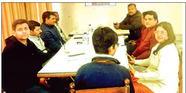
इतिहास संकलन की बैठक में प्रोफेसर व शोध छात्र-छात्राएं।

अमृत विचार। ऐतिहासिक शहर कन्नौज का वास्तविक इतिहास पन्नों में दर्ज होगा और लोगों को इसके वैभवशाली अतीत के बारे में बताया जाएगा। अखिल भारतीय इतिहास संकलन योजना कानपुर प्रांत की बैठक में जिले में एक इकाई के गठन के बारे में विचार विमर्श किया गया। इसमें एक समिति बनाई जाएगी, जो कन्नौज परावैभव काल की घटनाओं को संकलित कर लिपिबद्ध करेगी और इसके बाद संग्रह को पुस्तक के रूप में प्रकाशित किया जाएगा। शुक्रवार को राजकीय महिला