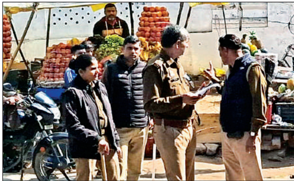
कायमगंज में जामा मस्जिद के बाहर तैनात फोर्स।

जिलाधिकारी व एसपी ने जुमे की नमाज शांतिपूर्वक अदा कराई, खुफिया तंत्र सक्रिय