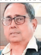
बदी प्रसाद सिंह सेवानिवृत्त आईजी पुलिस, उप्र.

यह उस योजना का हाल है जिसे गरीबों के हित में लागू किए जाने की बात जोर-शोर से कही जाती है। यह एक योजना के एक आयोजन का किस्सा है, समाज के हित में चल रही न जाने कितनी योजनाएं भ्रष्टाचार की भेंट चढ़ रही हैं और करदाताओं का धन बर्बाद हो रहा है। पुनः इतने बड़े आयोजन का धन मात्र एक एडीओ हजम कर गया, यह स्वीकार्य नहीं है। इसमें और भी मारामच्छ शामिल रहे होंगे जिनका भी चेहरा बेनकाब होना चाहिए। इस समारोह के पर्यवेक्षण अधिकारियों पर भी शिथिल पर्यवेक्षण के लिए दंडात्मक कार्यवाही अपेक्षित है। प्रदेश सरकार धार्मिक पुनरुद्धार के साथ-साथ यदि अपने सेवकों के ऐसे कृत्यों पर भी ध्यान दे तो ऐसे घोटालों में अवश्य कमी आएगी एवं गरीब पात्रों को उनका वाजिब धन मिला करेगा।