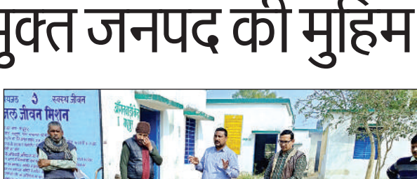
ग्रामीणों को जानकारी देते चिकित्सक व ग्राम प्रधान।

अमृत विचार। 15 दिवसीय स्पर्श कुष्ठ जागरूकता अभियान के क्रम में शुकुवार को जनपद के समस्त ग्राम प्रधान भी कुष्ठ रोग मुक्त जनपद की मुहिम में शामिल हुए। उन्होंने अपने-अपने क्षेत्र के ग्रामवासियों के साथ 'भेदभाव का अंत करें, सम्मान को गले लगाएं', की थीम को साकार करने का संकल्प लिया। कुष्ठ उन्मूलन की शपथ दोहराते हुए जन जागरूकता की अपील की गई।