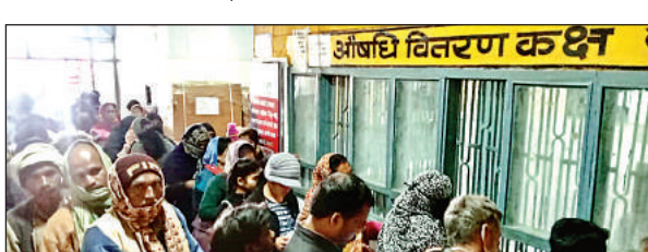
जिला अस्पताल में औषधि कक्ष के बाहर लगी मरीजों की कतार।

जिला अस्पताल में रोजाना करीब 14 सौ नए मरीजों की ओपीडी हो रही है। दिन में गर्मी रात में सर्दी से सभी आयु वर्ग के लोग बीमार हो रहे हैं। वहीं नौनिहाल वायरल फीवर, सर्दी-जुकाम, पेट दर्द, उल्टी, दस्त, निमोनिया की चपेट में आ