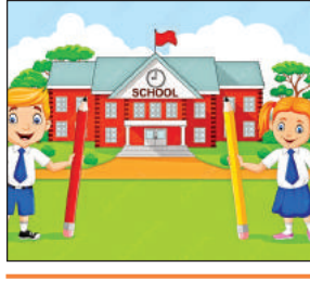
● वार्षिकोत्सव के दिन ही स्कूल में होगी शिक्षक-अभिभावक मीटिंग

परिषदीय विद्यालयों को कॉन्वेंट जैसी तर्ज पर संचालन को बेसिक शिक्षा विभाग लगातार कदम बढ़ा रहा है। पहले स्कूलों का कार्यालय और अब बेसिक शिक्षा विभाग ने एक और कदम आगे बढ़ाते हुए जिले के सभी परिषदीय विद्यालयों में हर साल वार्षिकोत्सव मनाने के निर्देश दिए हैं। बेसिक शिक्षा विभाग आरटीई के दाखिलों में बच्चों के नामांकन बढ़ाने, स्कूलों में उपस्थिति बढ़ाने, गृह कार्य और बच्चों के अधिगम स्तर में वृद्धि के