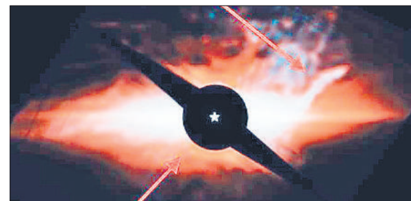
बीटा पिक्टोरिस तारा प्रणाली का चित्र।

किसी तारे का आकार लंबवत कैसे हो सकता है, वह भी इस तरह का, जिसका पिछला हिस्सा किसी बिल्ली के पूछ के समान हो। जिस कारण यह तारा वैज्ञानिकों के आकर्षण का केंद्र बना हुआ था। वैज्ञानिकों