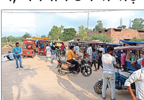
बस स्टॉप के पास कटौता रोड पर आड़े तिरछे खड़े ई-रिक्शा।

अमृत विचार। सड़कों पर तेजी से ई-रिक्शा की संख्या बढ़ रही है। रूट व पार्किंग की कोई व्यवस्था न होने से नगर में जाम की समस्या उत्पन्न हो गई है। तीन पहिया वाहनों की तुलना में आधे से अधिक ई-रिक्शा सड़कों पर दौड़ रहे हैं। प्रशासन या परिवहन विभाग की तरफ से ई-रिक्शा का न तो कोई रूट निर्धारित किया गया है और न ही पार्किंग का ही इंतजाम किया गया है। जिले में 3000 के लगभग ऑटो का पंजीकरण है, जबकि नगर पंचायत असोथर में लगभग 100 ई-रिक्शा हैं। वाहन स्टैंड की बात करें तो नगर में ऑटो व अन्य वाहनों के लिए प्राइवेट स्टैंड की व्यवस्था तो कोई गई है, लेकिन ई-रिक्शा के लिए कोई व्यवस्था नहीं है। जिसके चलते यह हर दिन फराटे से मुख्य