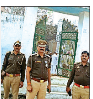
असोथर में मस्जिद में तैनात पुलिस फोर्स।