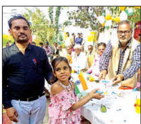
बच्चों को सम्मानित करते खंड शिक्षा अधिकारी।

इस कार्यक्रम का मुख्य उद्देश्य बच्चों में छुपी प्रतिभा को जागृत करना, शासन द्वारा दी जाने वाली सुविधाएं जैसे डीवीडी डेस्क का पैसा सीधा अभिभावकों के खाते में भेजा गया के बारे में जानकारी दी गई। कार्यक्रम के दौरान दौड़ प्रतियोगिता, सुलेख प्रतियोगिता, रंगोली प्रतियोगिता, चार्ट प्रतियोगिता, सांस्कृतिक कार्यक्रम, नाटक, और देश भक्ति आदि कार्यक्रम आयोजित हुए। प्रतिदिन आने वाले बच्चों के