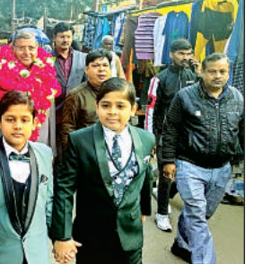
वे इस कालेज के ऐसे पहले शिक्षक व प्रधानाचार्य थे, जिन्हें राष्ट्रपति द्वारा राष्ट्रपति सम्मान से नवाजा गया।

उनको उनके घर तक छोड़ा गया। एक जुलाई 2006 को उन्होंने इस कॉलेज के प्रधानाचार्य के रूप में अपना पदभार ग्रहण किया था। वे इससे पहले मुरादगंज और जिला पंचायत इंटर कॉलेज हेंवारा में प्रधानाचार्य पद पर रह चुके थे। हिंदू विद्यालय को प्रधानाचार्य के रूप में उंचाईयों तक पहुंचाया।