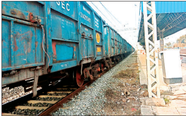
स्टेशन पर खड़ी मालगाड़ी फंसे रहे राहगीर।

शुकुवार को इटावा से कानपुर सेंट्रल जा रही मालगाड़ी के दो वैगन के पहियों के ब्रेक-थू जाम होने से दिक्कत महसूस होने पर लोको पायलट ने मालगाड़ी को रेलवे फाटक और मेन लाइन के बीचो बीच रोक दिया। साथ ही सतर्कता दिखाते हुए स्टेशन मास्टर को सूचना दी। जानकारी होते ही न्यू कंचौसी से पहुंचे कैरिज एंड वैगन के कर्मचारियों ने एक दूसरे से स्प्रे ब्रेक-थू को अलग करते हुए तकनीकी परीक्षण किया। इसके बाद गंतव्य को मालगाड़ी रवाना हो सकी। रेलवे क्रॉसिंग पर मालगाड़ी के खड़े होने से वाहन सवार एक घंटे से ऊपर जाम में फंसे रहे।