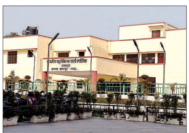
पॉली क्लीनिक पूरी तरह शुरू नहीं हो सकी है।

अमृत विचार। पॉली क्लीनिक रावतपुर के चालू होने में अभी स्टाफ की अड़चनें बरकरार हैं। आधुनिक पॉली क्लीनिक बनकर तैयार है, मगर शासन से अभी पशु चिकित्सकों समेत अन्य स्टाफ की तैनाती नहीं हुई है। जिस कारण अस्थायी तौर पर क्लीनिक को चालू किया गया है। मुख्य पशु चिकित्साधिकारी ने बताया कि शासन को डॉक्टरों की नियुक्ति के लिए प्रस्ताव भेजा है। जल्द पॉली क्लीनिक को विधिवत चालू कराया जाएगा।