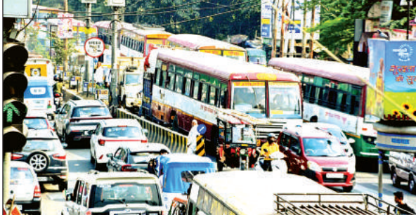
एलिवेटेड रोड बनने से जाम से मिलेगी निजात।

शहर के बीच से निकल रही जीटी रोड पर अनवरगंज से मंधना तक 18 रेलवे क्रॉसिंग हैं। जिससे लोगों को जाम की समस्या का सामना करना पड़ता है। शहर के बीचों-बीच जाम को खत्म करने के लिए 1000 करोड़ का बजट आवंटित किया था। सड़क एवं परिवहन मंत्री नितिन गडकरी ने इसका शिलान्यास भी कर दिया था। जिलाधिकारी विशाख जी अय्यर ने एलिवेटेड रोड के प्रस्ताव को वित्तीय वर्ष 2022-23 की कार्य योजना में शामिल करने के लिए