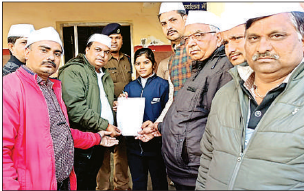
स्टेशन अधीक्षक को ज्ञापन सौंपते समाजसेवी।