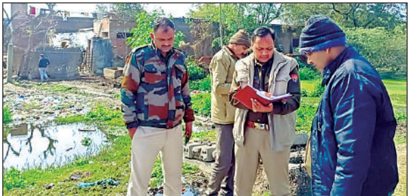
घटनास्थल पर जांच-पड़ताल करती पुलिस।