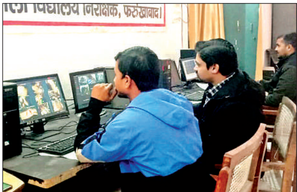
केंद्रों लूम पर हो रही निगरानी।