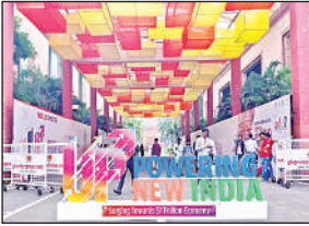
ग्रांड ब्रेकिंग सेरेमनी में पीएम मोदी ने दी आने की सहमति

ग्रांड ब्रेकिंग सेरेमनी को लेकर मुख्यमंत्री योगी आदित्यनाथ के आमंत्रण पर प्रधानमंत्री नरेंद्र मोदी ने आने की सहमति दे दी है। अब