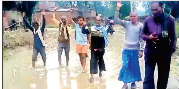
जलभराव युक्त सड़क में विरोध प्रदर्शन करते ग्रामीण।