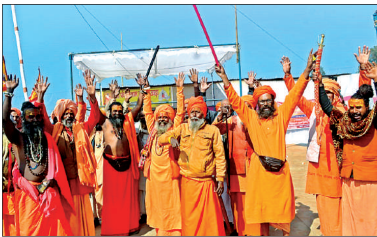
मेला श्री रामनगरिया में शोभा यात्रा निकाल रहे श्री पंच रामानंदी निर्माही अखाड़े के संत।