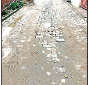
प्रकाश कालोनी में बहाल इंटरलॉकिंग सड़क।