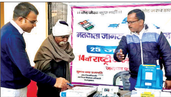
मतदाताओं को ईवीएम की जानकारी देते अधिकारी।