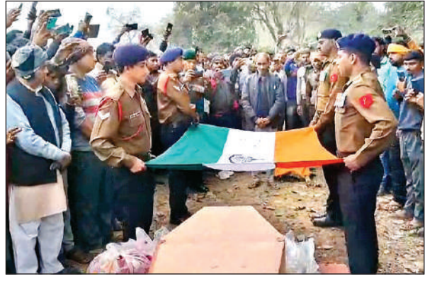
जवानों और ग्रामीणों ने पार्थिव शरीर को दी सलामी।