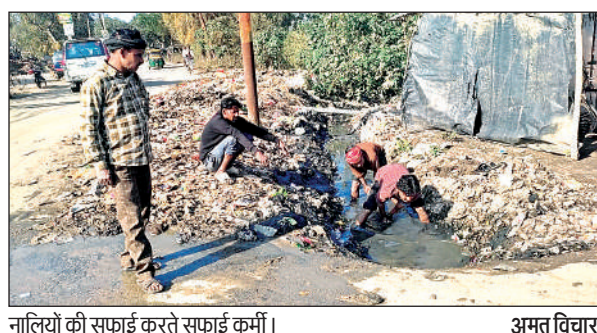
नालियों की सफाई करते सफाई कर्मी। अमृत विचार

उमदां ब्लाक के ठठिया ग्राम सभा के मानीमऊ तिराहा पर तिवा, मानिमऊ व बिल्हौर जाने वाले मार्ग के किनारे गंदगी का अंबार लगा हुआ था। थाने के कुछ ही दूरी पर मानीमऊ तिराहा पर सड़क किनारे पड़ी गंदगी परकार की स्वच्छ भारत अभियान की पोल खोलते नजर आ रही थी। सोमवार के अंक में खबर प्रकाशन के बाद मंगलवार को बीडीओ के निर्देश पर सचिव ने सफाई कर्मियों को लगाकर तिराहा की बजबाज रही नालियों को साफ