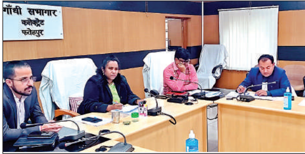
कलेक्ट्रेट सभागार में बैठक कर दिशा निर्देश देती डीएम।

यातायात की सुगमता के लिए मंगलवार को जिलाधिकारी सी. इंदुमती ने कलेक्ट्रेट के महात्मा गांधी सभागार में बैठक की। उन्होंने सभी उपजिलाधिकारियों से कहा कि अपने-अपने क्षेत्र में शेष बचे हुए राष्ट्रीय राजमार्ग के चौड़ीकरण एवं सर्विस रोड बनाने में जो समस्या