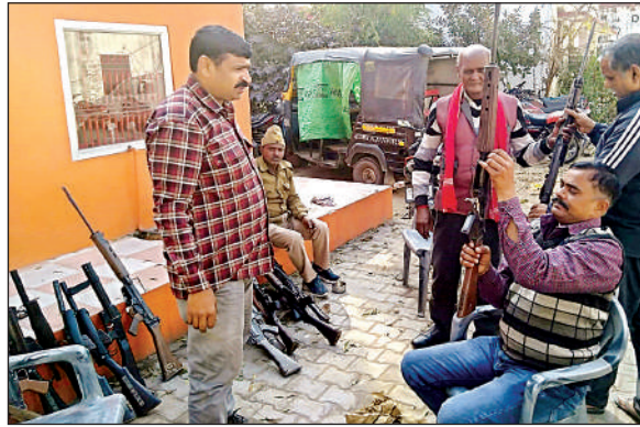
सदर कोतवाली में शस्त्रों की सफाई करते आरमोरर व अन्य।

पुलिस चुनाव में बाधा डालने वालों की सूची तैयार कर रही है वहीं गुण्डा, मिनी गुण्डा एक्ट की कार्रवाई को लेकर सूची भी तैयार की जा रही है। पुलिस अधिकार से अधिक विवादित लोगों को इस सूची में शामिल करने का प्रयास कर रही है। इसी क्रम में सदर कोतवाली पुलिस ने शस्त्रों की सफाई का भी अभियान चलाया है। मंगलवार को पुलिस लाइन से आरमोरर ने पहुंच कर कोतवाली में रखे पुराने शस्त्रों को बाहर निकलवाया। इसके बाद गमं पानी से पहले सभी शस्त्रों को धोया और चेक किया। खामी मिलने पर उसे तत्काल ठीक कर उसमें