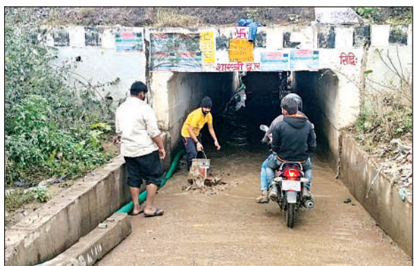
अंडरपास के नीचे पानी में फंसे वाहन सवार। अमृत विचार

संवाददाता, रूरा व आँटो निकलते हैं। बीते दिनों हुई बारिश से अंडरपास में पानी भर गया है, जिसके चलते वाहन सवारों को दिक्कत का सामना करना पड़ता है। कस्बे में रेलवे ओवर ब्रिज निर्माण को लेकर रूरा रेलवे क्रॉसिंग को आगामी छह महीनों तक के लिए बंद किया गया है। जबकि वैकल्पिक