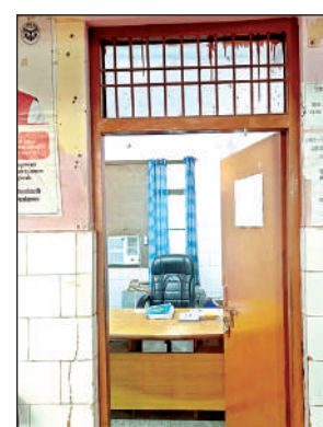
डॉक्टर का खाली कक्ष।

अमृत विचार। कायमगंज सीएचसी पर डॉक्टरों की कमी मरीजों को खल रही है। सीएचसी संविदा पर तैनात डॉक्टरों के हवाले है। आलम यह है कि गाईड काउंटर पर मरीजों के पर्चे बना रहा है। इस सीएचसी पर न तो सर्जन हैं, न आर्थो व बाल रोग विशेषज्ञ और न ही डेंटल चिकित्सक है। उल्लेखनीय है कि इस सामुदायिक स्वास्थ्य केंद्र में कायमगंज, नवाबगंज, शमसाबाद, कंपिल क्षेत्र के अलावा पड़ोसी जनपद एटा, कासगंज, शाहजहांपुर, बदायूं क्षेत्र से मरीज आते हैं।