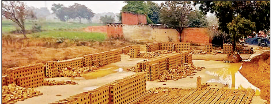
बारिश से खराब हो गई कच्ची ईंटें।

अमृत विचार। जलवायु परिवर्तन का असर अब साफ दिखने लगा है। वर्षा ऋतु में औसत से कम तो सर्दियों में औसत से अधिक बारिश होने से फसलों पर भी इसका प्रभाव पड़ने लगा है। मौसम विभाग की मानें तो आने वाले वर्षों में सर्दियों में बारिश अधिक होगी। इस बार भी इसका असर देखने को मिला। फरवरी में साल 2013 के बाद सबसे अधिक बारिश रिकॉर्ड की गई।