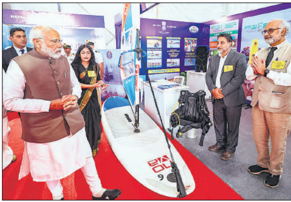
प्रधानमंत्री नरेंद्र मोदी ने गोवा में विकसित भारत, विकसित गोवा 2047 कार्यक्रम के दौरान आयोजित एक प्रदर्शनी का दौरा किया।

उन्होंने वैश्विक कंपनियों को भारत के ऊर्जा क्षेत्र की वृद्धि का हिस्सा बनने के लिए आमंत्रित करते हुए कहा कि देश को 2030 तक अपनी लक्ष्य 6800-6900 मटरदाल 5400-5500 मसूरमलका 7000-7050 मसूरदाल 7050-7100 उड़ददाल 8800-12500 उड़द धोवा 10000-12500 मूंगदाल 9500-10500 मूंग धोवा 9500-11500 चावल (प्रति क्वि.) अरवा 2000-2300 बासमती नं.1 9100-11000 सेला 2500-3000 बासमती नं.2 7000-8000 आटा-मैदा (प्रति 50 किग्रा.) आटा 1490-1550 मैदा 1475-1520 सूजी 1500-1550 चक्कीआटा (ब्राण्डेड 50 किग्रा.) शाहपसंद 1430-1475 तिलहन (प्रति क्वि.) लाही 4950-5000 अलसी 4500-4600 रुपये।