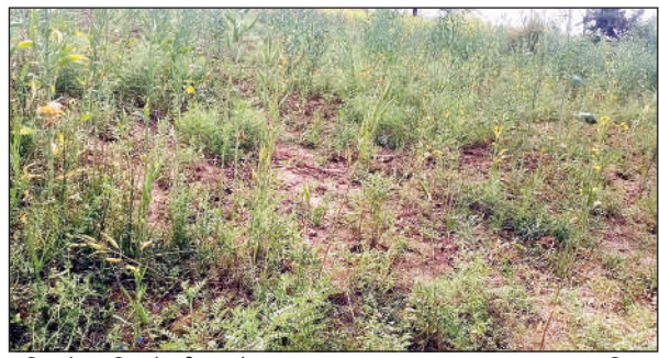
बारिश से प्रभावित हो रही फसलें।

विजयीपुर ब्लाक क्षेत्र में बारिश के साथ आंशिक ओलावृष्टि भी हुई है। मंगलवार को भी बादल दिन भर छाये रहे। कभी धूप तो कभी छांव का सिलसिला चलता रहा। हालांकि देर शाम तक बारिश नहीं हुई। वहीं मौसम कृषि विशेषज्ञ मंगलवार को बारिश होने की अंदेशा जता रहे हैं। इस बीच तापमान में बढ़ोतरी दर्ज की गई है। मंगलवार को सुबह आठ बजे तक बादल मंडराते रहे। इसके बाद कुछ हिस्सों में धूप निकली। पूरे दिन बादल एवं सुरुज के बीच लुकाछिपी