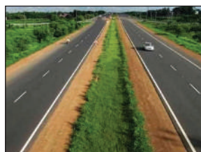
करोड़ की लागत से फोरलेन बनाए जाने की घोषणा की गई थी। मौजूदा समय में इस सड़क की चौड़ाई 7.50 मीटर है। फोरलेन होने के बाद एक तरफ सड़क की चौड़ाई 8.50 मीटर होगी। फोरलेन के दोनों तरफ तीन-तीन फीट चौड़ा फुटपाथ भी बनाया जाएगा। गाजियाबाद की शर्मा कंस्ट्रक्शन को कार्यदायी संस्था

मंधना, बिदूर, शुक्लागंज के 17 किलोमीटर के मार्ग को 122.50