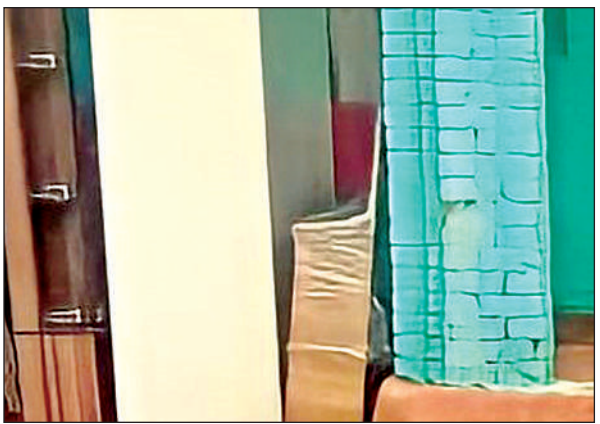
शादी के उपहार का सामान एक कोने में रखा रहा। अमृत विचार

गायब थीं। मंगलवार की सुबह से घर में मातम सा छाया रहा। परिवार वालों के चेहरे पर खुशी की जगह