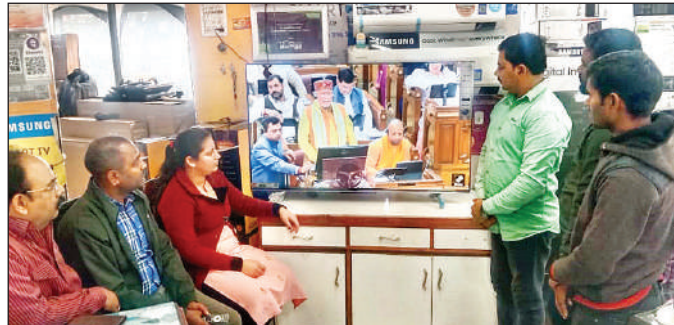
टीवी देखकर बजट पर चर्चा करते लोग।