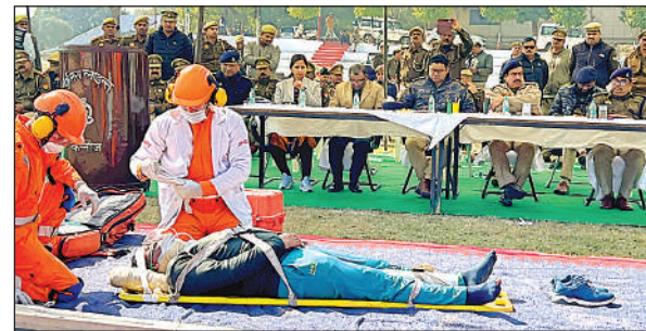
एनडीआरएफ व अन्य अधिकारियों के सामने पीड़ित को उपचार देती टीम।