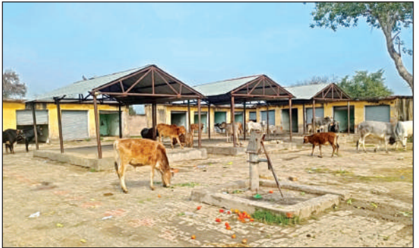
बाजार की बाउंड्री के अंदर बंद छुट्टा मवेशी।

फफूद क्षेत्र के गांव भैसोल के किसान अन्ना पशुओं से परेशान हैं। वह गेहूँ, जौ, मटर और सरसों की फसल की रखवाली के लिए