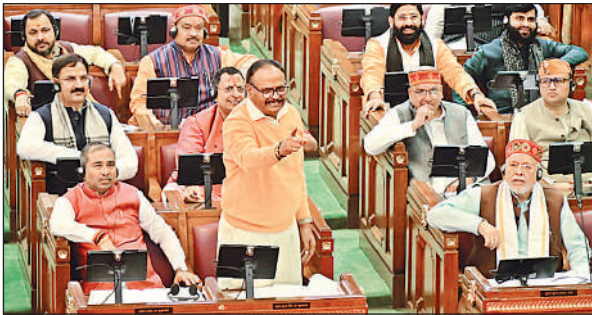
विधानसभा की कार्यवाही के दौरान उप मुख्यमंत्री ब्रजेश पाठक, साथ में अन्य सदस्य।

इससे पूर्व ब्रजेश पाठक ने सपा को निशाने पर लेते हुए कहा था