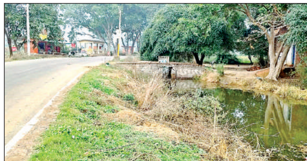
जगन्नाथपुर गांव के पास खतरनाक मोड़ और बगल में नाला। अमृत विचार

इस खतरनाक मोड़ के पास 20 फीट गहरी खाई है। जरा सी चूक होने पर हादसा होना तय है, लेकिन पीडब्ल्यूडी की लापरवाही ही कहेंगे कि अभी तक खतरनाक मोड़ के पास न तो स्पीड ब्रेकर बनाए गए हैं और न ही कोई संकेतक लगाए गए हैं। कोई बोर्ड भी नहीं लगाया गया है। एक तो सिंगल रोड, ऊपर से कोई संकेतक बोर्ड नहीं होने से हादसे-दर-हादसे हो रहे हैं।