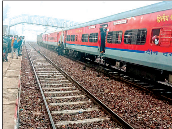
स्टेशन पर खड़ी तेजस राजधानी।

तेजस राजधानी एक्सप्रेस सहित कई अन्य एक्सप्रेस ट्रेनें भी रहीं बाधित