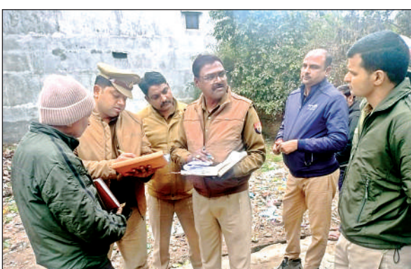
मौके पर छानबीन करती शिवली पुलिस।