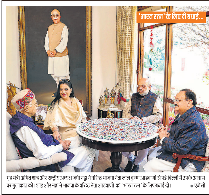
गृह मंत्री अमित शाह और राष्ट्रीय अध्यक्ष जेपी नड्डा ने वरिष्ठ भाजपा नेता लाल कृष्ण आडवाणी से नई दिल्ली में उनके आवास पर मुलाकात की। शाह और नड्डा ने भाजपा के वरिष्ठ नेता आडवाणी को 'भारत रत्न' के लिए बधाई दी।