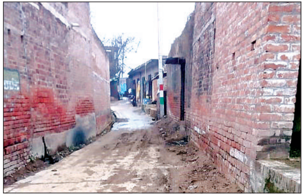
मुर्दा गांव की गलियों में पसरा रहा गम भरा सन्नाटा। अमृत विचार