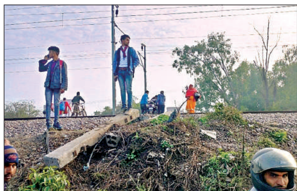
रेलवे लाइन पार कर गुजरते लोग। अमृत विचार