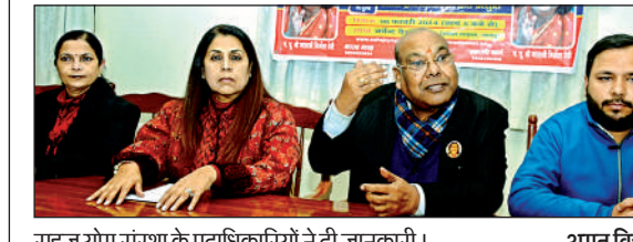
सहज योग संस्था के पदाधिकारियों ने दी जानकारी।