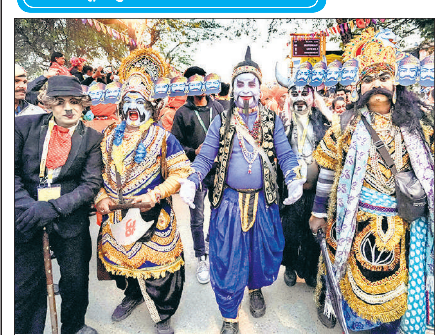
फरीदाबाद जिले में 37वें सूरजकुंड अंतर्राष्ट्रीय शिल्प मेले में परेड के दौरान अलग-अलग किरदारों में सजे कलाकार प्रदर्शन करते हुए। यहां कई राज्यों के कलाकारों ने हिस्सा लिया है।