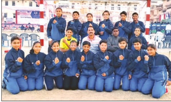
फाइनल में पहुंचने वाली उत्तर प्रदेश की बालिका टीम।

अमृत विचार : उत्तर प्रदेश की बालक व बालिका टीम ने 38वीं राष्ट्रीय सब जूनियर बालक व बालिका हैंडबॉल चैंपियनशिप में इतिहास रचते हुए फाइनल में जगह बना ली है। राजस्थान के चित्तौड़गढ़ में खेले जा रही चैंपियनशिप में शनिवार को खेले गए सेमीफाइनल मुकाबलों में उत्तर प्रदेश के बालकों ने एक रोमांचक मुकाबले में दिल्ली के खिलाफ 35-34 गोल से जीत दर्ज की। ये मुकाबला काफी रोमांचक रहा, जिसके पहले हॉफ में दोनों ही टीमों 18-18 से बराबरी पर रहीं।