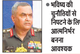
● भविष्य की चुनौतियों से निपटने के लिए आत्मनिर्भर बनना आवश्यक

देश की सुरक्षा को हम न तो आउटसोर्स कर सकते हैं और न ही हम अपनी सुरक्षा को किसी के उदारता पर निर्भर कर सकते हैं। भारतीय थलसेना के प्रमुख जनरल मनोज पांडे ने कहते हुए जोर दिया कि भविष्य की चुनौतियों से निपटने के लिए महत्वपूर्ण सैन्य हाईवेयर में आत्मनिर्भर बनना आवश्यक है। सेना प्रमुख शनिवार को नई दिल्ली में आयोजित फ्रस्टपोस्ट रक्षा शिखर सम्मेलन में पहुंचे थे। सम्मेलन को संबोधित करते हुए जनरल पांडे ने कहा कि देश की सुरक्षा के संरक्षक के रूप में हम अपनी विकास आवश्यकताओं के लिए आयात निर्भरता से पूरी तरह दूर रहने की आवश्यकता से अवगत हैं। भविष्य के लिए तैयार रहने के लिए हमारी रणनीतिक योजना में यह पहलू महत्वपूर्ण है। उन्होंने कहा कि कोविड-19 महामारी और दुनिया भर में चल रहे युद्धों ने सेना की महत्ता समझाई हैं। संघर्षों में महत्वपूर्ण सैन्य घटकों के लिए बाहरी निर्भरता का प्रभाव दिखाया है। सैन्य प्रमुख ने कार्यक्रम में कहा कि हमारी रक्षा जरूरतों को पूरा करने में आत्मनिर्भर होने की जरूरत है।