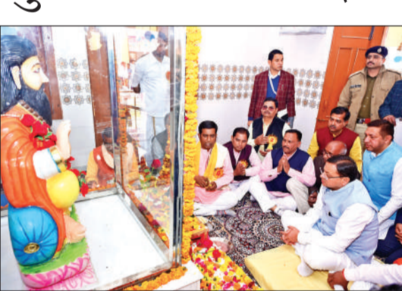
संत शिरोमणि रविदास को नमन करते मुख्यमंत्री धामी।

कार्यालय संवाददाता, मुरादाबाद/ अमरौहा/संभल