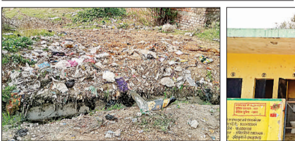
खाली प्लॉट पर लगा कूड़े का ढेर।