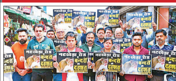
आलम्बाग नटखेड़ा रोड पर बंदरों से परेशान व्यापारियों हाथों में तख्ती लेकर प्रदर्शन करते हुए।