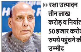
रक्षा उत्पादन तीन लाख करोड़ व निर्यात 50 हजार करोड़ रुपये पहुंचने की उम्मीद

रक्षा मंत्री राजनाथ सिंह ने कहा है कि भारत रक्षा क्षेत्र में तेजी से आत्मनिर्भरता की ओर बढ़ रहा है और वर्ष 2028-29 तक वार्षिक रक्षा उत्पादन तीन लाख करोड़ रुपये तथा रक्षा निर्यात 50,000 करोड़ रुपये तक पहुंचने की उम्मीद है। रक्षा मंत्री ने शनिवार को यहां एक निजी मीडिया संगठन द्वारा आयोजित रक्षा शिखर सम्मेलन को संबोधित करते हुए कहा कि सरकार वर्ष 2047 तक भारत को विकसित राष्ट्र बनाने के लिए दीर्घकालिक परिणामों पर ध्यान केंद्रित कर रही है, न कि अल्पकालिक परिणामों पर। उन्होंने मौजूदा तथा पिछली सरकार की तुलना करते हुए कहा कि दोनों के बीच दीर्घकालिक योजना और दीर्घकालिक लाभ को प्राथमिकता देना मुख्य अंतर है। सिंह ने कहा कि पूर्ववर्ती सरकारों के विपरीत मौजूदा सरकार ने ऐसी नीतियां बनाईं और लागू की हैं, जो केवल पांच वर्षों के लिए अल्पकालिक लाभ प्रदान नहीं करती हैं। उन्होंने पिछले कुछ वर्षों में लंबी अवधि के फायदे के लिए रक्षा क्षेत्र में किए गए सुधारों का उल्लेख किया, इनमें चीफ ऑफ डिफेंस स्टाफ के पद का सृजन और सैन्य मामलों के विभाग की