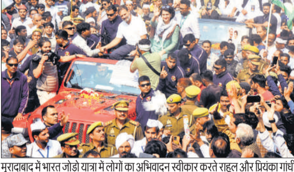
मुरादाबाद में भारत जोड़ो यात्रा में लोगों का अभिवादन स्वीकार करते राहुल और प्रियंका गांधी।

अमृत विचार : कांग्रेस के पूर्व अध्यक्ष राहुल गांधी ने प्रधानमंत्री नरेंद्र मोदी और भाजपा सरकार पर निशाना साधा। उन्होंने मुरादाबाद में भारत जोड़ो न्याय यात्रा के दौरान कहा कि नरेंद्र मोदी जनता का असल मुहों से ध्यान भटकाते हैं और अडाणी-अंबानी जनता की जेब काटते हैं। गरीबों का हक लूटकर उद्योगपतियों को और अमीर बनाया जा रहा है। राहुल ने बहन प्रियंका गांधी के साथ जामा मस्जिद से यात्रा की शुरूआत की। कांग्रेस नेता ने कहा कि भाजपा की नफरत की राजनीति के खिलाफ वह मोहब्बत का पैगाम लेकर निकले