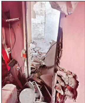
धमाके से टूटा दरवाजा। अमृत विचार

की दीवार व दरवाजा टूटा मिला। दीवार का मलबा पड़ोसी की छत तक जा गिरा था। कमरे की दीवारों पर दरार पड़ गई। इस्पेक्टर कैलाश