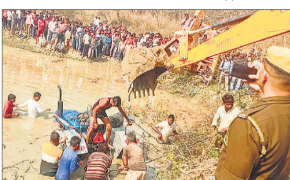
तालाब में डूबे लोगों को जेसीबी से बाहर निकालती पुलिस और ग्रामीण।