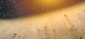
धूल से भरा कुइपर बेल्ट की तस्वीर।

नासा के अनुसार न्यू होराइजन्स मिशन ने 2015 में प्लूटो के सामने से गुजरा था। अब कुइपर बेल्ट की गहराई से गुजर रहा है। यह अंतरिक्ष यान बेशुमार ब्रह्मांडीय धूल भरी आंधी का सामना कर रहा है। अंतरिक्ष धूल से भरा यह हिस्सा माइक्रोन के एक मीटर के लाखों हिस्से से भी छोटे कणों से भरा हुआ है। यह सौर मंडल में अधिकांश