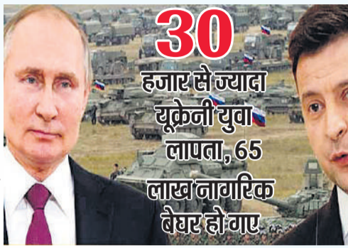
30 हजार से ज्यादा यूक्रेनी युवा लापता, 65 लाख नागरिक बेघर हो गए

पुतिन ने फादरलैंड डे के अवसर पर कहा कि रूस के 95% रणनीतिक परमाणु बलों का आधुनिकीकरण किया गया है। रूसी वायुसेना ने हाल ही में 4 नए सुपरसोनिक परमाणु सक्षम बमवर्षकों की डिलीवरी ली है।