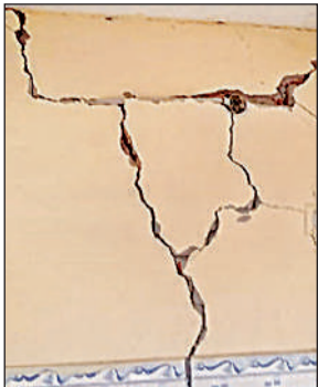
दीवारों में आई दरारें।