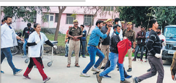
घायल बालक को जिला अस्पताल लेकर जाते स्वास्थ्य कर्मी।

गई और श्रद्धालु पानी में डूब गए। आसपास के ग्रामीणों ने सूचना पुलिस को दी। पुलिस मौके पर पहुंची इससे पहले ही ग्रामीण ट्रॉली को सीधा करने का प्रयास करने लगे। बड़ी संख्या में जुटे ग्रामीणों ने ट्रॉली को हटाया फिर डूबे लोगों को बाहर निकालना शुरू किया। पुलिस भी मदद में जुट गई। लोगों को बाहर निकालकर अस्पताल भेजा गया जहां एक-एक कर कई लोगों को मुक्त घोषित कर दिया गया। दोपहर बाद तक मृतकों की संख्या 23 पहुंच गई। मृतकों में 13 महिलाएं, 9 बच्चे हैं।