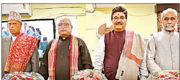
सम्मेलन में शामिल ज्योतिष।

अमृत विचार : पंचांग अब व्यापार बन गया है। इसमें वैदिक और सामाजिक जरूरतों का ध्यान नहीं रखा जा रहा है। इसके कारण व्रत, त्योहार व अन्य गणनाएं आमजन को भ्रमित कर रही हैं। सभी पंचांग के अलग-अलग मत हो रहे हैं। सटीक गणना के बिना पंचांग बनाए जा रहे हैं। ऐसी दुविधा वाली स्थिति में संस्कृत विश्वविद्यालय से प्रकाशित पंचांग पर धरौसा करें। यह चंद्रमा की स्थिति का सही आकलन कर बनाए जाते हैं। इसके निर्माण में खगोल विज्ञान का विशेष महत्व होता है। ये बांटे केंद्रीय संस्कृत विश्वविद्यालय के निदेशक