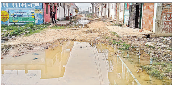
सड़क पर भरा गंदा पानी, आने-जाने में राहगीरों को हो रही परेशानी। अमृत विचार

वार्ड 9 भैंसामऊ में रहने वाले लोग अब दूषित पानी पीने को मजबूर हैं। नगर पंचायत द्वारा उन्हें आजतक स्वच्छ पेयजल तक का