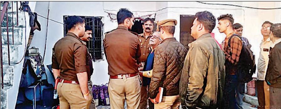
हादसे के बाद घटनास्थल पर जांच करते पुलिसकर्मी।