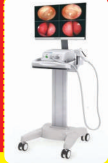
Video Recto Scope

लेज़र विधि एवं DGHAL विधि द्वारा बवासीर (Piles) भगन्दर (Fistula) एवं गुदाद्वार में होने वाली अन्य बीमारियों का उचित इलाज