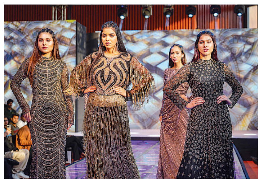
बिखेरा जलवा : नई दिल्ली स्थित भारत मंडपम में आयोजित ग्लोबल टेक्सटाइल एक्सपो 'भारत टेक्स 2024' में एक फैशन शो के दौरान रीप वॉक करती मॉडलस।

की शादी हेतु फिक्स्ड डिपॉजिट में जमा धनराशि जारी करने के लिए आवेदन दाखिल किया। इस तथ्य का प्रमाण ट्रिब्यूनल के सामने दिया गया, लेकिन ट्रिब्यूनल, बुलंदशहर ने क्रमशः दो आदेश पारित कर आधी राशि याचियों को प्रदान करने और शेष राशि को पुनः फिक्स्ड डिपॉजिट में जमा करने का आदेश दिया, उक्त आक्षेपित आदेश को याचियों ने हाईकोर्ट में चुनौती दी और उसे रद्द करने की मांग की। कोर्ट ने भी माना कि फिक्स्ड डिपॉजिट में निवेश बरकरार रखने का निर्देश नहीं दिया जा सकता है। याची प्रार्थना का अनुसार राशि पाने के हकदार हैं। अतः ट्रिब्यूनल को निर्धारित धनराशि और उस पर अर्जित ब्याज तुरंत याचियों को देने का निर्देश दिया गया।