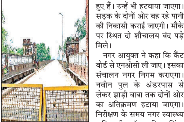
बंद पड़ा पुराना गंगा पुल।

अमृत विचार। बंद हो चुका पुराना गंगा पुल को अब पिकनिक स्पॉट के रूप में विकसित किया जायेगा। आकर्षण बढ़ाने के लिये नगर निगम ने तैयारी शुरू कर दी है। यहां से लोग गंगा दर्शन भी कर सकेंगे। इसके साथ ही खाने-पीने का लुत्फ उठा सकेंगे।