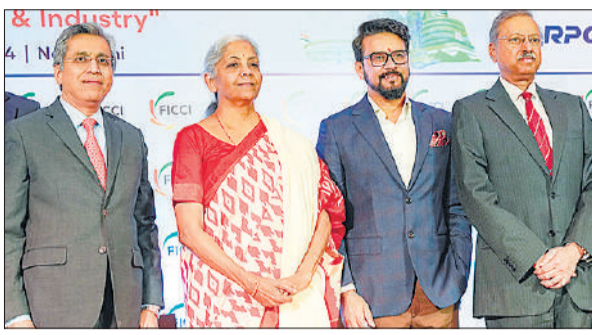
फिक्की के कार्यक्रम में मौजूद सीतारमण, केंद्रीय मंत्री अनुराग ठाकुर व अन्य।

वित्त मंत्री निर्मला सीतारमण ने मंगलवार को भारतीय उद्योग जगत से खुद को 2047 तक 'विकसित भारत' के लक्ष्य के साथ जुड़ने का आह्वान किया। उद्योग निकाय फिक्की की ओर से आयोजित 'विकसित भारत @ 2047: विकसित भारत व उद्योग' सत्र को संबोधित करते हुए मंत्री ने उद्योग जगत को आश्वासन दिया कि प्रधानमंत्री नरेंद्र मोदी की अगुवाई वाली सरकार के तीसरे कार्यकाल में भी सुधार जारी रहेंगे।