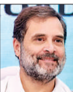
एक्स पर पोस्ट कर कांग्रेस नेता ने भाजपा सरकार को घेरा

कांग्रेस के पूर्व अध्यक्ष राहुल गांधी ने उत्तर प्रदेश में पेपर लोक के मुद्दे को लेकर मंगलवार को आरोप लगाया कि केंद्र सरकार देश के भविष्य की दुश्मन बन गई है। उत्तर प्रदेश सरकार ने विभिन्न जिलों में 17 और 18 फरवरी को हुई पुलिस भर्ती परीक्षा को निरस्त कर दिया है और छह माह के भीतर पुनः परीक्षा कराने के आदेश दिये हैं। मुख्यमंत्री योगी आदित्यनाथ ने उत्तर प्रदेश लोक सेवा आयोग द्वारा वीते 11 फरवरी को आयोजित की गई समीक्षा अधिकारी/ सहायक