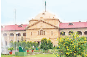
मोटोर एक्सीडेंट क्लेम ट्रिब्यूनल बुलंदशहर को इलाहाबाद उच्च न्यायालय ने दी नसीहत

अमृत विचार : इलाहाबाद हाई कोर्ट ने संवेदनशील मामलों में मोटर एक्सीडेंट क्लेम ट्रिब्यूनल के विवेकहीन और यांत्रिक व्यवहार पर चिंता व्यक्त करते हुए कहा कि बिना सोचे-समझे यांत्रिक रूप से आदेश पारित करना ट्रिब्यूनल का निहायत ही लापरवाह रवैया प्रदर्शित करता है।