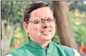
321 करोड़ तकनीकी शिक्षा के लिए 15,376 करोड़ का प्रावधान स्वास्थ्य एवं शिक्षा के लिए

अमृत विचार : उत्तराखंड के मुख्यमंत्री पुष्कर सिंह धामी के नेतृत्व में वित्त मंत्री प्रेमचंद्र अग्रवाल ने मंगलवार को विधानसभा के बजट सत्र के दूसरे दिन वित्तीय वर्ष 2024-25 के लिए 89,230.07 करोड़ रुपये का बजट पेश किया। इसमें सरकार को 88,597.11 करोड़ रुपये के राजस्व प्राप्त का अनुमान है। इसमें राजस्व प्राप्त से 60,552.90 करोड़ और पूंजीगत प्राप्ति से 28,044.21 करोड़ रुपये की प्राप्तियों का अनुमान है। वित्त मंत्री प्रेमचंद्र