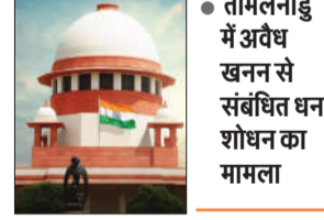
मद्रास उच्च न्यायालय ने पिछले साल 28 नवंबर को केंद्रीय जांच एजेंसी द्वारा जारी समन पर रोक लगा दी थी, जिसमें उसकी ओर से जारी जांच के सिलसिले में वेल्लोर, तिरुचिरापल्ली, कर्नूल, तंजावुर और अरियालुर के जिला अधिकारियों को पेश होने के लिए कहा गया था।