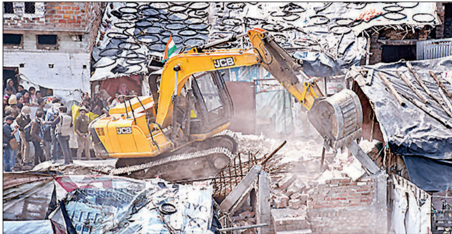
अकबर नगर में ध्वस्तीकरण की कार्रवाई के दौरान जेसीबी से बिना मानक के निर्माणों को तोड़ती एलडीए की टीम।

झुग्गी हटाने समय हुई पत्थरबाजी, जेसीबी का शीशा टूटा : दोपहर में कुकरैल बंधे के पास नदी के किनारे बनीं झुग्गी झोपड़ियां जैसे ही जेसीबी से हटाने की कार्रवाई शुरू हुई लोग आक्रोशित हो गए और पत्थरबाजी शुरू कर दी, जिससे जेसीबी का शीशा टूट गया। लोग हमलावर हो गए,