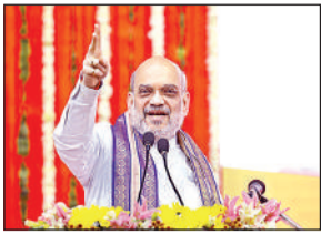
तीसरी बार जीतने पर देश को बनाएंगे तीसरी सबसे बड़ी अर्थव्यवस्था: अमित शाह

केंद्रीय गृह मंत्री अमित शाह ने मंगलवार को कहा कि प्रधानमंत्री नरेन्द्र मोदी के नेतृत्व में पिछले दस वर्षों में विभिन्न क्षेत्रों में हुए विकास को दुनिया ने स्वीकारा है। शाह ने कहा कि अगर मोदी एक बार फिर से सत्ता में आते हैं तो भारत दुनिया की तीसरी सबसे बड़ी अर्थव्यवस्था बन जाएगा। केंद्रीय गृह मंत्री ने गुजरात में अपने निर्वाचन क्षेत्र गांधीनगर में विभिन्न परियोजनाओं का उद्घाटन और शिलान्यास किया। शाह ने इस अवसर पर कहा कि कई क्षेत्रों में नरेन्द्र मोदी द्वारा किए गए विकास कार्यों को दुनिया ने स्वीकार किया