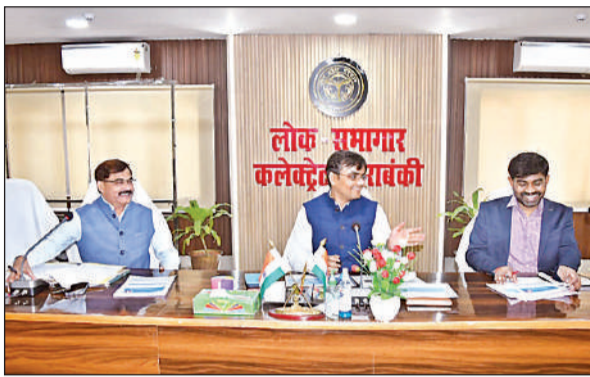
जिला स्तरीय स्वास्थ्य समिति की बैठक को संबोधित करते जिलाधिकारी।

वे शुक्रवार को लोक सभागार में जिला स्वास्थ्य समिति की बैठक में स्वास्थ्य सेवाओं की उपलब्धता की समीक्षा कर रहे थे। सिरौली गौसपुर के सी बेड हास्पिटल की प्रगति की समीक्षा करते हुए डीएम ने सीएमएस की कार्यशैली पर कड़ी नाराजगी जतायी। उन्होंने चेतावनी दी कि यदि अब सुधार नहीं हुआ तो सीएमएस के विरुद्ध नियमानुसार कड़ी कार्रवाई की जाएगी। उन्होंने कहा कि स्वास्थ्य सेवाओं के लिए इस सेवा से सम्बंध डॉक्टरों और