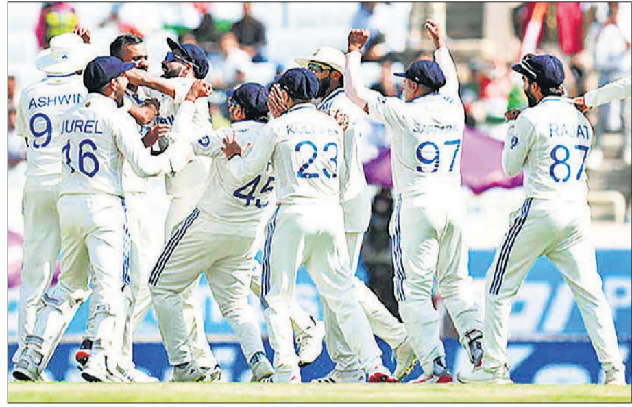
रांची : जेएससीए इंटरनेशनल स्टेडियम कॉम्प्लेक्स में भारत और इंग्लैंड के बीच खेले जा रहे चौथे टेस्ट मैच के पहले दिन इंग्लैंड के ओली पोप का विकेट लेने के बाद जश्न मनाती भारतीय टीम।