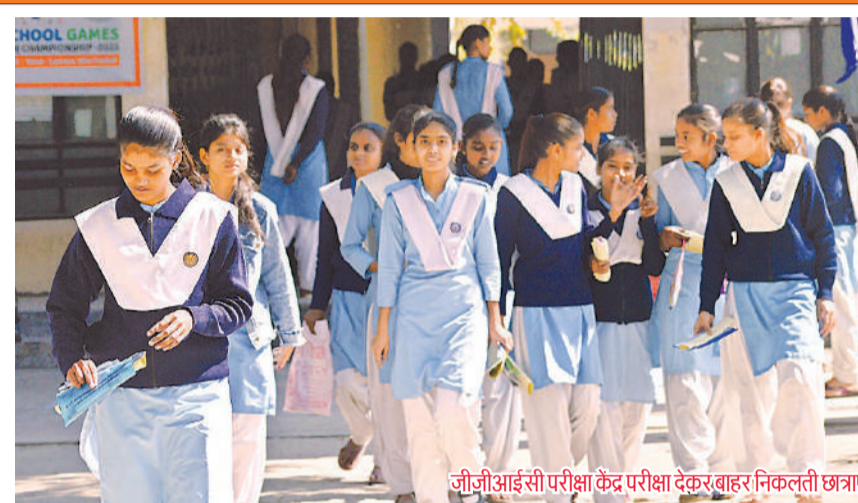
जीजीआईसी परीक्षा केंद्र परीक्षा देकर बाहर निकलती छात्राएं।

अधिशासी अधिकारी ने वर्ष 2024-25 के लिये बजट प्रस्तुत किया गया। बजट की बैठक में वर्ष 2024-25 की अनुमानित आय 53,19,40,000 तथा 31 मार्च अनुमानित बैलेंस 4,50,50,000-00 कुल 57,69,90,000-00 की आय तथा 55,19,75,750-00 का व्यय दर्शाया गया। वर्ष के अन्त में 2,50,14,250-00 का अवशेष रहेगा जो लाभ की स्थिति में होगा। इस बजट में प्रत्येक वर्ग में सड़कों का निर्माण, चौराहों का विकास कार्य तथा पार्कों का विकास कराया जायेगा। नवीन आय के स्रोतों को बढ़ाया जाएगा। नगर पालिका के कर्मचारियों को उनके वेतन भत्ते, पेंशन का सम्य से श्रुतानु सुनिश्चित किया जायेगा।