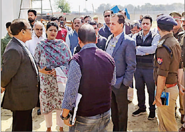
कार्यक्रम की तैयारियों को लेकर जानकारी लेते मुख्य सचिव व अन्य अधिकारी।