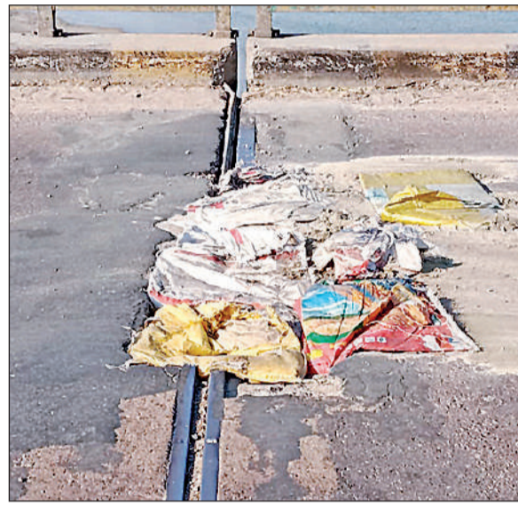
संजय सेतुके टूटे ज्वॉइंटर पर डाली गई बालू की बोरियां।

घाघरा नदी पर बने संजय सेतु में ज्वॉइंटर (लोहे का गार्डर) चार स्थानों से टूट गया। इसके चलते आवागमन ठप हो गया। कई किलोमीटर तक वाहनों का लंबा जाम लग गया। सूचना पाकर मौके पर पहुंची पुलिस ने वन साइड व्यवस्था करके जाम खत्म कराया और इसकी जानकारी भारतीय राष्ट्रीय राजमार्ग प्राधिकरण के अधिकारियों को दी गई। मौके पर पहुंची विभाग की टीम बोरियों में बालू भरकर डाल दिया और चली गयी। हैरत की बात तो यह है कि पड़ोसी देश नेपाल से राजधानी लखनऊ को जोड़ने वाले इस राष्ट्रीय राजमार्ग को मरम्मत और रखरखाव के प्रति जिम्मेदार अधिकारी उदासीन हैं।