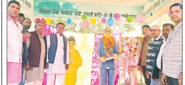
संत गाडगे के चित्र पर माल्यापण करते गाडगे यूथ ब्रिगेड के पदाधिकारी।