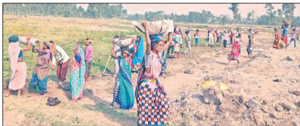
मनरेगाकर्मियों की फाइल फोटो। अमृत विचार

अमृत विचार : 100 दिन के रोजगार की गारंटी देने वाली मनरेगा अपनी डेढ़ दशक की यात्रा के दौरान आज पहली बार इतनी दयनीय हालत में पहुंच गई है कि अब यह मजदूर को न तो समय पर मजदूरी दे पा रही है और न ही योजना से जुड़े अल्प पारिश्रमिक पर काम करने वाले कर्मियों को उनको मिलने वाला मानदेय। मनरेगा से गांव में ही रोजगार पाकर अपने परिवार की आजीविका चलाने वाले तमाम गरीब परिवारों के लोगों को मनरेगा में काम किए हुए महीनों बीत चुके हैं, लेकिन उनके खाते में किए गए काम की मजदूरी का पैसा नहीं आ रहा है। भारत