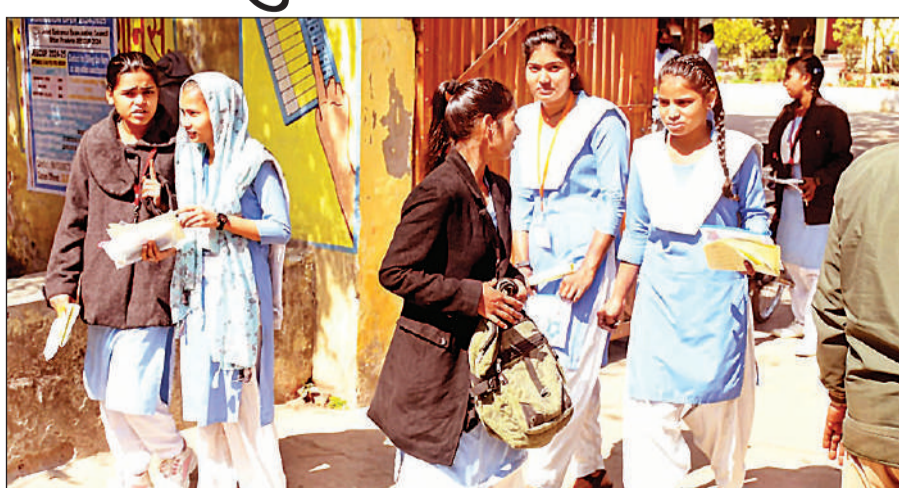
राजकीय बालिका इंटर कॉलेज से परीक्षा देकर निकलती छात्राएं। अमृत विचार

नागरिक शास्त्र विषय की परीक्षा हुई। इसमें पंजीकृत 4778 परीक्षार्थियों के सापेक्ष 4507 ने परीक्षा दी। वहीं 271 अनुपस्थित रहे। वहीं हाईस्कूल के उर्दू और फारसी का एक भी परीक्षार्थी नहीं था। दूसरी पाली में इंटरमीडिएट व्यावसायिक वर्ग की परीक्षा 24 केंद्रों पर हुई। इसमें पंजीकृत 660 छात्र-छात्राओं में 636 ने परीक्षा तो 26 ने परीक्षा छोड़ दी। जबकि हाईस्कूल के संगीत गायन विषय की परीक्षा में पंजीकृत 69 बालिकाओं में 63 ने परीक्षा दी तो छह गैरहाजिर रही। दूसरे दिन की परीक्षा भी सकुशल संपन्न हुई। डीआईओएस ओपी त्रिपाठी ने बताया कि बोर्ड परीक्षा कड़ी सुरक्षा के बीच सकुशल संपन्न कराई जा रही है।