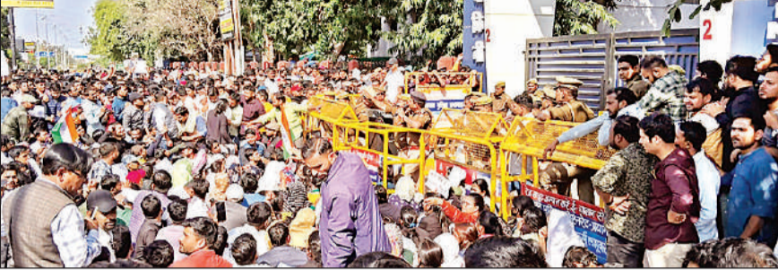
लोक सेवा आयोग गेट के बाहर धरने पर बैठ अभ्यर्थी।