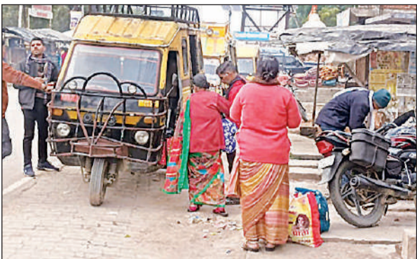
सड़क के किनारे खड़ा टेम्पो।