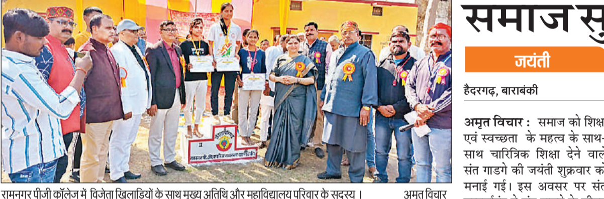
रामनगर पीजी कॉलेज में विजेता खिलाड़ियों के साथ मुख्य अतिथि और महाविद्यालय परिवार के सदस्य।