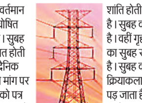
शांति होती है, जिससे पढ़ाई में ज्यादा ध्यान लगता है। सुबह की कटौती के कारण पढ़ाई प्रभावित होती है। वहीं गृहस्थ, व्यवसाय, नौकरी पेशा के लोगों का सुबह से दैनिक क्रियाकलाप की शुरुआत होती है। सुबह की अधोषित विद्युत कटौती से दैनिक क्रियाकलाप प्रभावित होता है, जिससे उत्साह फीका पड़ जाता है। सुबह की शुरुआत अच्छी न होने से उनके मानसिक स्वास्थ्य पर प्रतिकूल असर पड़ता है। आम जनमानस व विद्यार्थियों की आवश्यकता को ध्यान में रखते हुए जनहित में सुबह की अधोषित विद्युत कटौती को बंद कर आपूर्ति चालू रखने की मांग की।