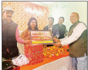
बीईओ को स्मृति चिन्ह देते अध्यापक।