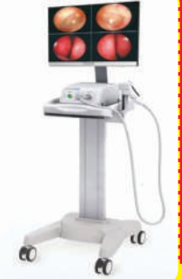
Video Recto Scope

क्लीनिक का पता एस-80, गोल चौराहा, महानगर कोतवाली के सामने, महानगर, लखनऊ www.anorectalclinic.com 7388913338, 8005423919