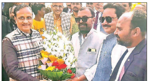
पूर्व उपमुख्यमंत्री का स्वागत करते कार्यकर्ता।