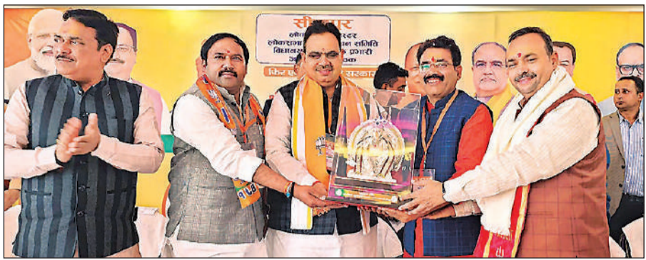
राजस्थान सीएम भजनलाल शर्मा को गणेश की प्रतिमा देते जिलाध्यक्ष राजेश शुक्ला, सांसद अशोक रावत व अन्य।

अमृत विचार : आगामी लोकसभा चुनाव को लेकर राजस्थान सीएम भजन लाल शर्मा ने शुक्रवार को लोकसभा कलस्टर चुनाव प्रबंधन समिति और विधानसभा संयोजक प्रभारी सहित जनप्रतिनिधियों के साथ बैठक की। बैठक के दौरान आगामी लोकसभा चुनाव में अवध क्षेत्र की सभी लोकसभा सीटों पर चुनाव जीतने का मंत्र दिया। 5 घंटे तक चली बैठक के बाद सीएम ने खैराबाद स्थित प्रबुद्ध वर्ग सम्मेलन को संबोधित कर कार्यकर्ताओं को चुनाव जीतने का मंत्र दिया। गोपनीय बैठक के दौरान सीएम ने खीरी, धौरहरा, सीतापुर, हरदोई, मिश्रख लोकसभा के संचालन समिति की बैठक कर कार्यकर्ताओं को जीत का मंत्र दिया। मुख्यमंत्री ने लोकसभा क्षेत्र के प्रभारी, विस्तारक व संयोजकों को लोकसभा चुनाव में जीत का अंतर कैसे बढ़ाया जाए, इसके लिए मंत्र देते हुए कहा कि कैलेंडर बनाकर कार्य करें। सीतापुर दौरे पर पहुंचे सीएम भजन लाल शर्मा ने सर्वप्रथम नैमिषारण्य पहुंचकर मां ललिता देवी के चरणों में हार्जिरी लगाई। सीएम ने नैमिषारण्य के साधु-संतों से मुलाकात कर उनका आशीर्वाद लिया। इसके बाद सीएम ने शहर स्थित एक निजी गेस्ट हाउस में कलस्टर समिति की बैठक का दीप प्रज्वलित कर शुरुआत की।