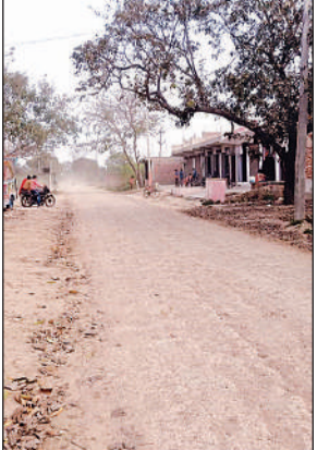
बदहाल सतवाखेड़ा - भगवंतनगर मार्ग लंबाई लगभग 10 किमी है। इस मार्ग का डामर जब उखड़ गया तो

अमृत विचार। मानकों को अनदेखी कर कराई गई मरम्मत से सतवाखेड़ा - भगवंतनगर मार्ग पर लोगों को आवागमन में परेशानी का सामना करना पड़ रहा है। स्थानीय लोगों ने कई बार शिकायत की, लेकिन अफसरों ने एक नहीं सुनी। लगातार बदहाल मार्ग से आवागमन में हो रही परेशानी से लोगों में आक्रोश बढ़ता जा रहा है। सतवाखेड़ा - भगवंतनगर सड़क से क्षेत्र की चार प्रमुख मंडियां जुड़ी हुई हैं। इसमें लालगंज, सरेनी, रसूलपुर व भगवंतनगर (उन्नाव) शामिल हैं। सड़क की