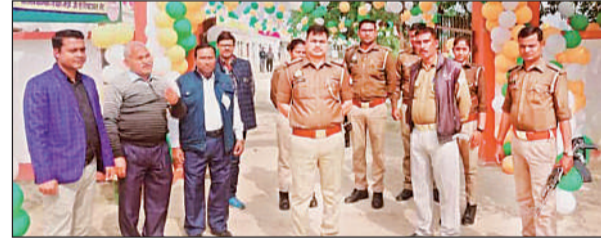
साधुी शिरोमणि इंटर कालेज के बाहर सुरक्षा व्यवस्था का जायजा लेने पहुंचे एसओ जेटवारा।

अमृत विचार : यूपी बोर्ड की हाईस्कूल इंटर की परीक्षा में शुक्रवार को दूसरे दिन पहली पाली में 190 व दूसरी पाली में 56 केंद्रों पर परीक्षा हुई। पहली पाली में हाईस्कूल पालि, अरबी की परीक्षा में 31 व इंटर नागरिक शास्त्र में 719 ने परीक्षा छोड़ दी। वहीं दूसरी पाली में हाईस्कूल संगीत गायन में 250 तथा इंटर कृषि भाग एक एवं दो में 688 ने परीक्षा दी। डीआईओएस समेत अन्य सचल दल ने केंद्रों का