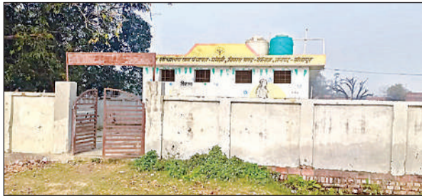
शौचालय परिसर व उसके अंदर लगे हैंडपंप की टूटी चौकी।

अमृत विचार : सरकार की महत्वाकांक्षी योजनाओं में से एक व स्वच्छ भारत मिशन योजना के अंतर्गत सभी ग्राम पंचायतों में सामुदायिक शौचालय बनाए गए थे। सामुदायिक शौचालय बनाने का सरकार का मुख्य उद्देश्य यह था कि ग्रामीण शौचालयों का प्रयोग करें जिससे किसी भी ग्रामीण को खुले में शौच न जाना पड़े। ग्राम पंचायतों में बने इन सामुदायिक शौचालयों की देखरेख व साफ-सफाई के लिए केयर टेकर भी रखे गए थे। जिनको हर महीने इसका भुगतान भी दिया