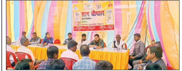
ग्राम चेपाल में योजनाओं की जानकारी देते अधिकारी।

शोधित लोगों तक पहुंचाया जाए योजनाओं का लाभ