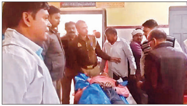
घायल को उपचार करते चिकित्सकर्म।