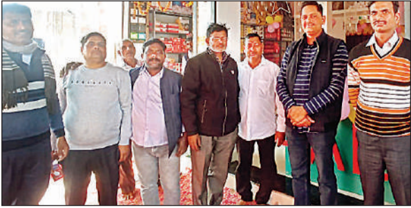
उदघाटन के अवसर पर मौजूद लोग।

इलेक्ट्रॉनिक की दुकान बहुत कम थी जिन्हें पड़तका कानुन पर सामान लाना खतरा था। अंबे इलेक्ट्रॉनिक के खुलने से अब उसी रेट में सारा इलेक्ट्रॉनिक सामान यही उपलब्ध