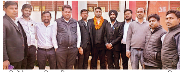
साथियों के साथ नवनियुक्त विधानसभा अध्यक्ष।