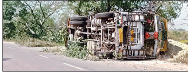
रेलिंग विहीन पुलिया पर पलटा पड़ा ट्रक। (फाइल फोटो)