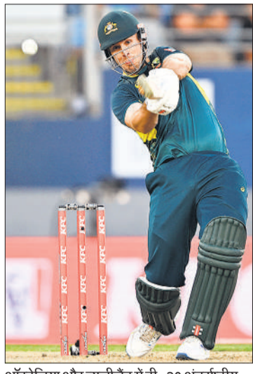
ऑस्ट्रेलिया और न्यूजीलैंड में टी-20 अंतर्राष्ट्रीय मैच में बल्लेबाजी करते ऑस्ट्रेलिया के मिशेल मार्श।

बेन सीयर्स ने 29 रन देकर दो विकेट झटके। ऑस्ट्रेलिया ने अंतिम 9.5 ओवर में 59 रन के अंदर छह विकेट गंवा दिए। न्यूजीलैंड को खेल शुरू होने से पहले ही झटका लगा जब रचिन रविंद्र घुटने की हल्की चोट के कारण बाहर हो गए और डेवोन कॉनवे को भी विकेटकीपिंग करते हुए अंगूठे में चोट लग गई, जिससे उन्हें एक्स-रे कराने के लिए अस्पताल ले जाया गया। जब पता चला कि कोई फ्रेक्चर नहीं है, तब कॉनवे मैदान पर लौटे, लेकिन वह फिर भी बल्लेबाजी नहीं कर पाए। न्यूजीलैंड ने बल्लेबाजी करते हुए 29 रन पर 4 विकेट गंवा दिए थे। ग्लेन फिलिप्स (42) और जोश क्लार्कसन ने पांचवें विकेट के लिए 45 रन जोड़े, लेकिन इसके बाद टीम का स्कोर जल्द ही छह विकेट पर 74 रन हो गया। फिर टीम 17 ओवर में 102 रन पर सिमट गई।