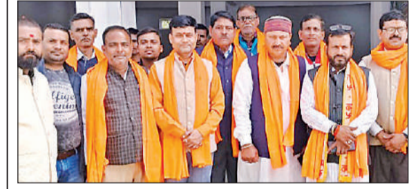
कार्यक्रम के बाद मौजूद भाजपा नेता।