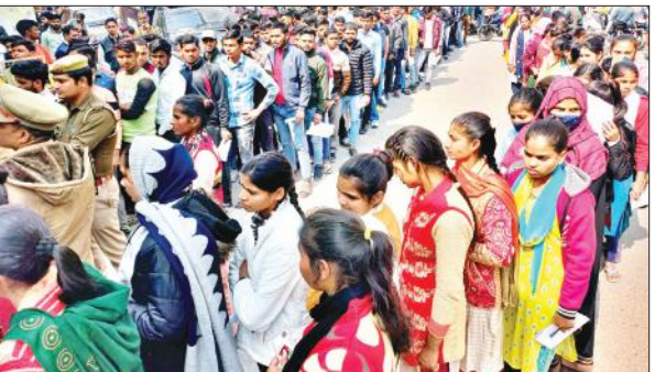
संभल में पुलिस भर्ती परीक्षा देने पहुंचे परीक्षार्थियों की कतारें।

सुबह दस बजे से दोपहर 12.5 बजे तक, दूसरी पाली अपराह्न तीन बजे से शाम 5.05 बजे तक हुई। परीक्षा केंद्र पर पर्याप्त संख्या में पुलिस बल तैनात किया गया। जिससे किसी प्रकार कोई गड़बड़ी नहीं हो सकी। प्रश्न पत्र में पूछे गए सवालों से कई अभ्यर्थी परेशान रहे।