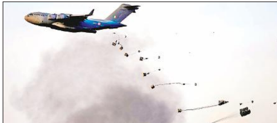
जैसलमेर : पोखरन क्षेत्र में वायु शक्ति –2024 अभ्यास के दौरान करतब दिखाता वायुसेना का सी–17 ग्लोबल मास्टर विमान ।

अब दोबारा भेजे जाने का कोई तुक नहीं समझ आ रहा। हमास चाहता है कि गाजा में स्थाई युद्धविराम हो और इजराइल फलस्तीन के उन सभी केंद्रियों को रिहा करे जो उसकी जेलों में बंद हैं। नेतन्याहु ने मिस्र के साथ लगती गाजा की सीमा पर स्थित शहर राफा में जमीनी हमले रोकने के अंतरराष्ट्रीय अनुरोध की भी अनदेखी की है। वह किसी भी सुरत में हमले रोकने के पक्ष में नहीं है। उन्होंने कहा कि हमास पर ‘ पूर्ण विजय ’ के लिए हमले जरूरी हैं। ‘एसोसिएटेड प्रेस’ के पत्रकारों और अस्पताल के अधिकारियों के अनुसार शनिवार को मध्य गाजा में हवाई हमलों में बच्चों सहित 40 से अधिक लोग मारे गए और कम से कम 50 लोग घायल हुए हैं। इजराइल की सेना ने कहा कि उसने हमास के खिलाफ हमले किये हैं। गाजा के स्वास्थ्य मंत्रालय ने शनिवार को कहा कि गाजा में अब तक 28,858 लोग मारे गए हैं।