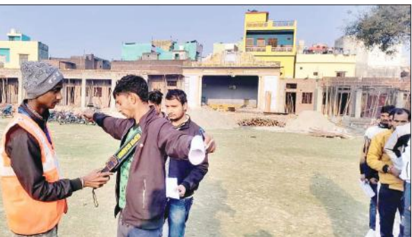
परीक्षार्थियों की चेंकिंग करता कर्मचारी।

हुई जो 12 बजे तक चली। परीक्षा केंद्रों पर सुरक्षा व्यवस्था बेहद कड़ी रही। अभ्यर्थी को मोबाइल फोन और किसी भी तरह की इलेक्ट्रॉनिक डिवाइस लेकर जाने पर पूरी तरह पाबंदी रही। परीक्षा जोन, सेक्टर और स्टैटिक मजिस्ट्रेट की निगरानी में सम्पन्न हुई करेंगे। जैमर लगे होने के कारण परीक्षा केंद्रों के आस पास मोबाइल नेटवर्क पूरी तरह जाम रहे। परीक्षा देकर लौटे परीक्षार्थियों के