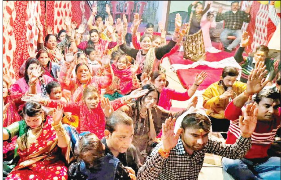
नागेश्वर मंदिर मिलन विहार में भजनों पर झूमते श्रद्धालु।

जन्म जन्मान्तरों की बुराई गुरुदेव क्षण ही में नष्ट कर देते हैं। जीवन, जवानी तथा राज्य का भेद से कोई भी स्थिर नहीं