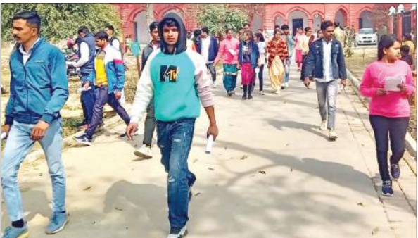
एसएम इंटर कॉलेज में पुलिस भर्ती परीक्षा देकर परीक्षा केंद्र से बाहर आते अभ्यर्थी।

रविवार को दूसरे दिन भी शहर के सात परीक्षा केंद्र सेक्रेड हार्ट कान्चेंट स्कूल, राजेश कुमार सरस्वती इंटर कॉलेज, सिल्वर स्टोन कान्चेंट स्कूल, एसएम इंटर कॉलेज, बीएमजी इंटर कॉलेज, चन्दौसी इंटर कॉलेज, एफआर इंटर कॉलेज में दो पारियों में पुलिस भर्ती परीक्षा संपन्न कराई गई। जिसमें पहली पाली