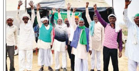
अंडरपास निर्माण के लिए प्रदर्शन करते किसान।