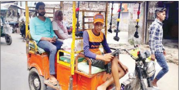
चन्दौसी में ई-रिक्शा चला रहा किशोर।

शहर में जिस सड़क पर देखो ई-रिक्शा ही नजर आता है। शहर में जाम लगने का कारण भी ई-रिक्शाओं के अधिक संचालन को माना जा रहा है। जबकि नाबालिगों द्वारा भी ई-रिक्शा का संचालन किया जा रहा है। नाबालिग लापरवाही से ई रिक्शा चलाते हैं। जिससे हादसे होने का खतरा बना रहता है। कभी-कभी ई-रिक्शा पलट जाता है और उसमें सवार लोग घायल हो जाते हैं। यातायात पुलिस व परिवहन विभाग भी इस संबंध में कोई कार्रवाई नहीं करता। शिकायतों के बाद यातायात