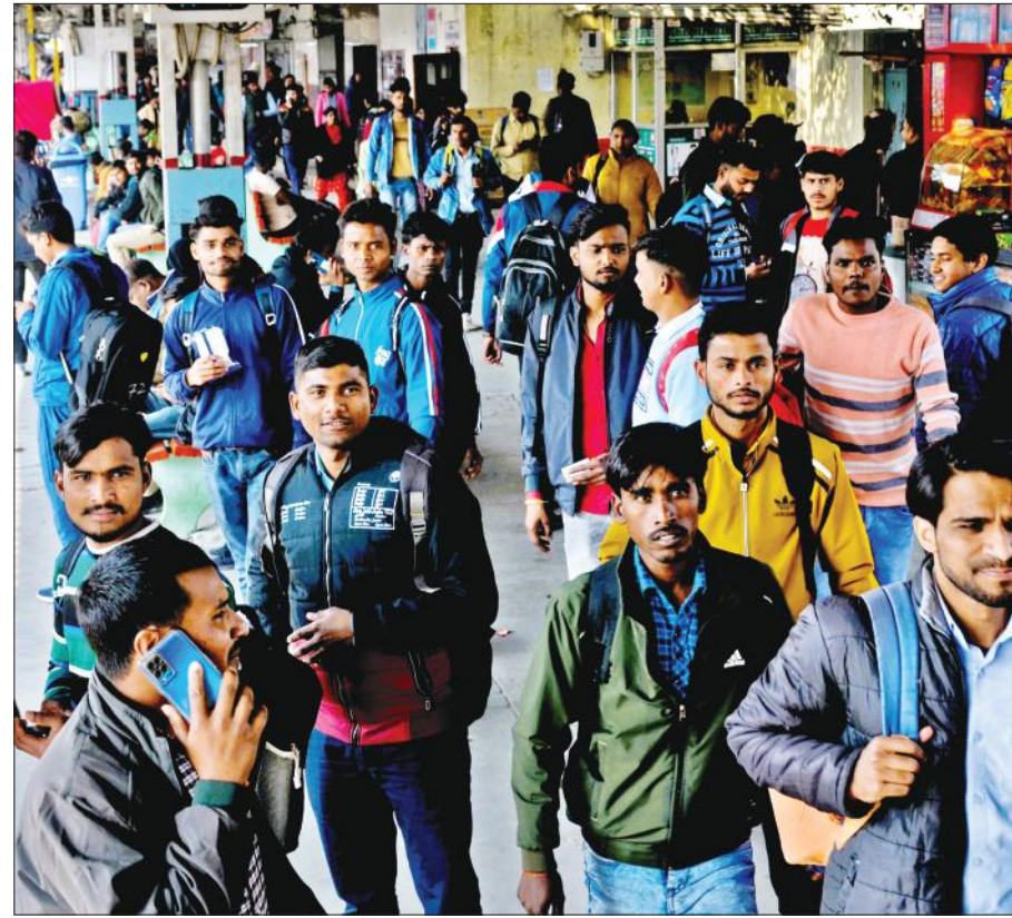
● अमृत विचार परीक्षा के बाद रेलवे स्टेशन पर ट्रेन का इंतजार करते अभ्यर्थी।