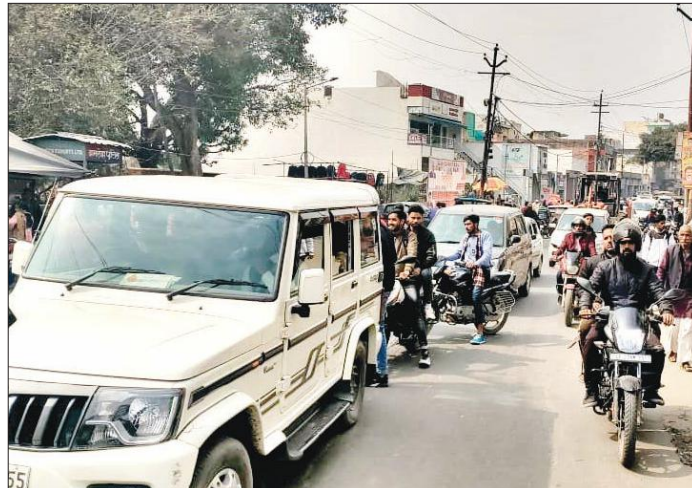
शहर में लगे जाम में फंसे वाहन।