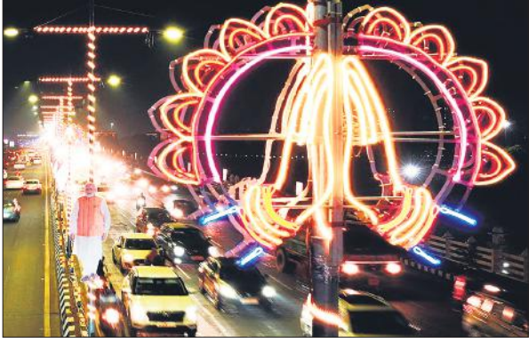
ग्रांड ब्रेकिंग सेरेमनी ( जीबीसी-4 ) के लिए सजा लखनऊ।

दिशाशूल-पूर्व । ऋतु-शिशिर। चन्द्रबल-मेघ, मिथुन, सिंह, कन्या, धनु मकर। ताराबल-भरणी, रोहिणी, मृगशिरा, अर्द्रा, पुनर्वसु, आश्लेषा, पूर्वा फाल्गुनी, हस्त, चित्रा, स्वाति, विशाखा, ज्येष्ठा, पूर्वाषाढा, श्रवण, धनिष्ठा, शतभिषा, पूर्वाभाद्रपद, रेवती। नक्षत्र-मृगशिरा 10.33 तक तत्पश्चात आर्द्रा।