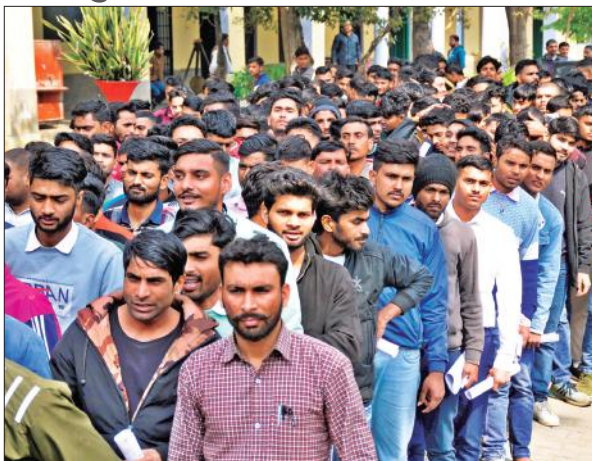
आरएन इंटर कॉलेज में परीक्षा देकर बाहर आते परीक्षार्थी।

रविवार को दूसरे दिन सुबह 10 से 12 और दोपहर तीन से शाम पांच बजे तक दो पालियों में सिपाही भर्ती परीक्षा कड़ी सुरक्षा के बीच हुई। पहली पाली में 25176 अभ्यर्थियों को शामिल होना था, लेकिन सुबह की पाली में 1457 अभ्यर्थी शामिल नहीं हुए। इसी तरह दूसरी पाली की परीक्षा में 2231 अभ्यर्थियों ने परीक्षा छोड़ दी। दोनों पालियों की परीक्षा में कुल 3688 अभ्यर्थी परीक्षा देने के लिए नहीं पहुंचे। सभी 54 परीक्षा केंद्र