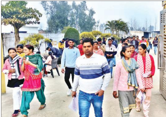
परीक्षा देकर केंद्र से बाहर निकलते परीक्षार्थी।