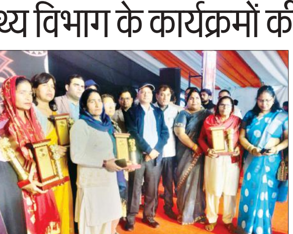
आशाओं को मोमेंटो देकर सम्मानित करते डीएम।

कहा कि आशाएं स्वास्थ्य विभाग द्वारा चलाये जाने वाले कार्यक्रमों व अभियानों को समाज के अंतिम पायदान पर पहुंचाने का कार्य करती हैं। घर-घर जाकर सरकार की योजनाओं से लोगों को लाभान्वित करती हैं। उनका योगदान सराहनीय है। डीएम ने कहा कि अभी भी स्वास्थ्य विभाग द्वारा चलाये जा रहे बहुत से महत्वपूर्ण कार्यक्रम हैं, जिन पर कार्य करने की आवश्यकता है। जो भी पात्र व्यक्ति अभी तक आयुष्मान योजना से लाभान्वित