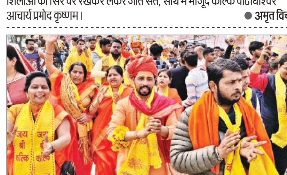
कल्क धाम शिलान्यास कार्यक्रम में भाग लेने वाले लोगों की तस्वीरें।