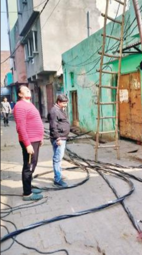
मोहल्ला लालबाग में कहरों के मंदिर क्षेत्र में एबीसी केबल बदलने का कार्य करते बिजली कर्मचारी।