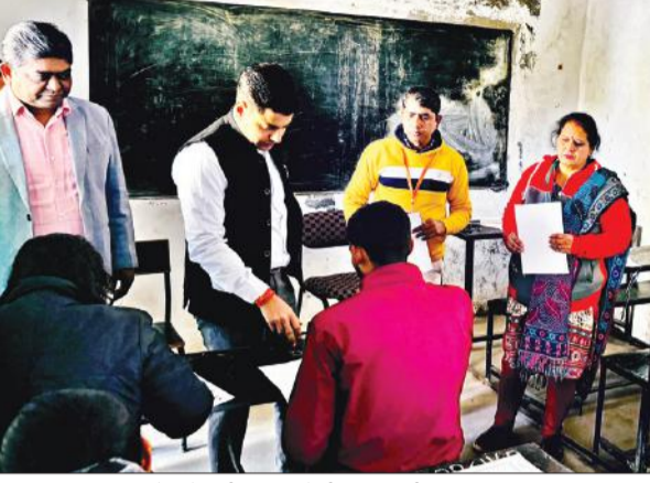
जुलफिकार इंटर कॉलेज में निरीक्षण करते डीएम एवं एडीएम।