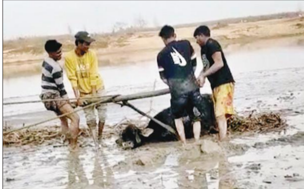
गाय को बाहर निकालते युवक।

अमृत विचार : चौकी क्षेत्र के एक गांव में कोसी नदी के जंगल में घूम रही छुट्टा गाय दलदल में फंस गई। जानकारी पर पहुंचे मुस्लिम युवकों ने दलदल में फंसी गाय को बाहर निकाला।