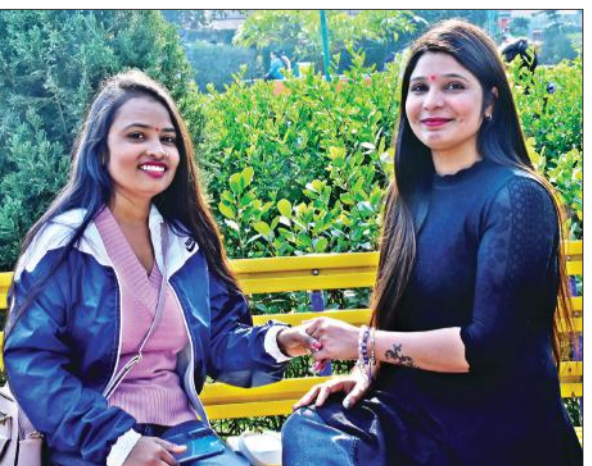
कंपनी बाग में प्रॉमिस डे पर जीवन भर दोस्ती निभाने का वादा करती युवतियां।

वेलेंटाइन वीक का पांचवां दिन प्रॉमिस डे के रूप में मनाया जाता है। इस दिन प्रेमी एक-दूसरे से जीवन भर साथ निभाने का और हर मुश्किल में साथ रहने का वादा करते हैं। इन वादों से रिश्ते मजबूत बनते हैं और प्रेमियों को एक दूसरे के प्रति और करीब लाते हैं। वादे कई तरह के हो सकते हैं, साथ निभाने के वादे, एक दूसरे का सम्मान करने, एक दूसरे की भावनाओं का आदर