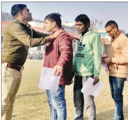
केंद्रों के बाहर अभ्यर्थियों की वेंकिंग करता पुलिसकर्मी।

परीक्षा को लेकर सुबह से ही पुलिस प्रशासन और माध्यमिक शिक्षा विभाग सतर्क रहा। जोनल मजिस्ट्रेट लगाए गए। परीक्षा केंद्रों स्टेटिक मजिस्ट्रेट ने अभ्यर्थियों पर कड़ी नजर रखी। सभी परीक्षा केंद्रों पर सुरक्षा व्यवस्था के कड़े इंतजाम रहे। उत्तर प्रदेश लोक सेवा आयोग द्वारा आयोजित