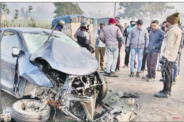
गजरोला में क्षतिग्रस्त कार।