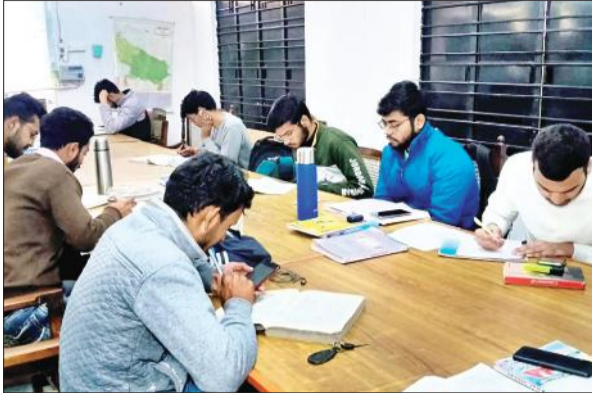
राजकीय पुस्तकालय में पढ़ाई करते छात्र।