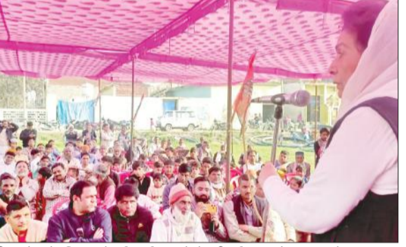
सींगनखेड़ा में रविवार को हुई कार्यशाला में बोलती पूर्व सांसद बेगम नूरबानो।

अमृत विचार : पूर्व सांसद बेगम नूरबानो ने कहा कि देश के हालात सबको पता हैं। भाईचारे को खत्म कर नफरत फैलाई जा रही है। भाजपा अपनी नाकामियों को छिपाने के लिए सांप्रदायिक सौहार्द को बिगाड़ रही है। देश में मंहगाई और बेरोजगारी की चर्चा न हो, इसके लिए लोगों को आपस में लड़ाया जा रहा है। उन्होंने लोगों से कहा कि भाईचारा कायम रखें।