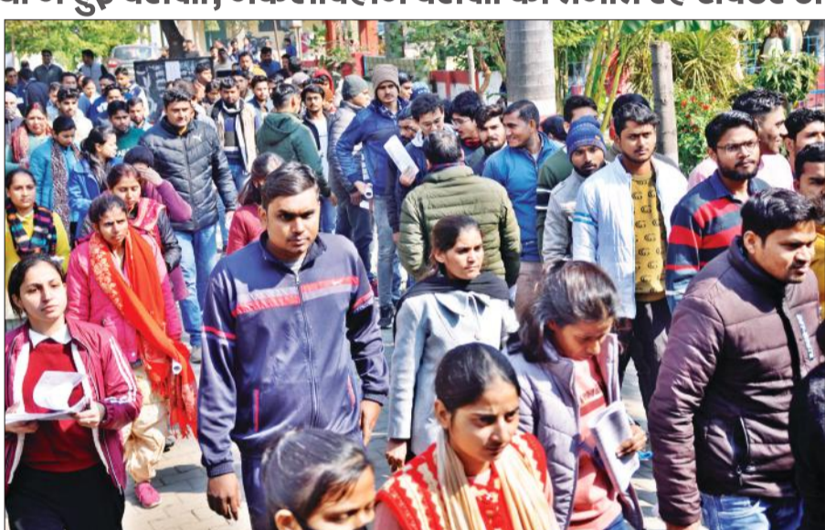
आरएन इंटर कॉलेज परीक्षा केंद्र से परीक्षा देकर बाहर आते परीक्षार्थी।

अमृत विचार: महानगर में 49 केंद्रों पर रविवार को दो पाली में समीक्षा अधिकारी और सहायक समीक्षा अधिकारी की परीक्षा कराई गई। शांतिपूर्ण तरीके से हुई परीक्षा में 22,299 परीक्षार्थी पंजीकृत रहे। पहली पाली में 14,688 उपस्थित रहे जबकि 7611 परीक्षार्थियों ने किनारा कर लिया। दोनों पालियों में करीब 34 प्रतिशत परीक्षार्थियों ने परीक्षा छोड़ दी। पुलिस ने सुरक्षा व यातायात बनाए रखने का इंतजाम किया। परीक्षार्थियों का कहना है कि परीक्षा न तो ज्यादा मुश्किल थी और न ही आसान। सभी छात्र परीक्षा देने के बाद सहज दिखे।