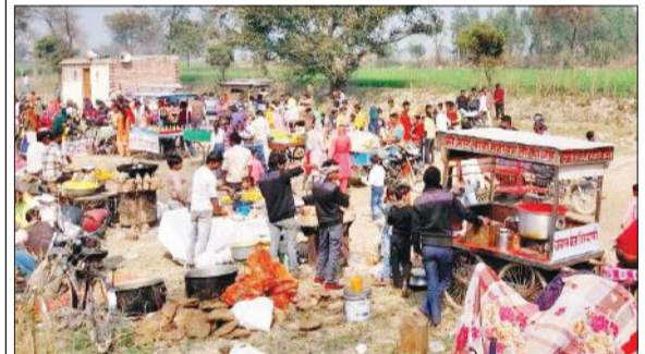
बूढ़े बाबा के मेले में खरीदारी करते लोग।