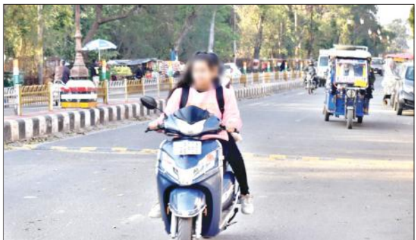
स्टार चौराहे पर स्कूटी चलाती किशोरी।

रोए दिगने ने रहे हादसों पर लोक लगाने के लिए शासन ने नया आदेश जारी किया था। इसमें