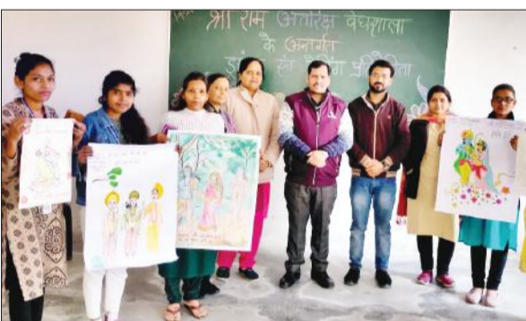
प्रतियोगिता में पेंटिंग दिखाती छात्राएं।

शाहबाद रोड स्थित दीक्षित कॉलेज ऑफ हायर एजुकेशन में रविवार को हुई प्रतियोगिता में छात्र-छात्राओं ने अपनी प्रतिभा दिखाई। प्रतिभागियों ने अपनी प्रतिभा को पोस्टर पर उकेर दिया। शीर्षक के अनुरूप किसी ने राम प्रतीष्ठा पूजन, मां सीता को पौधे सींचते हुए, राम-लक्ष्मण, सीता को वन भ्रमण करते हुए चित्रित किया तो किसी ने धनुष तोड़ते श्री राम, वीर हनुमान और वानर सेना द्वारा रामसेतु बनाने हुए दृश्य को