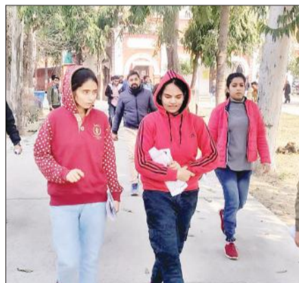
परीक्षा देकर बाहर निकलते अभ्यर्थी।