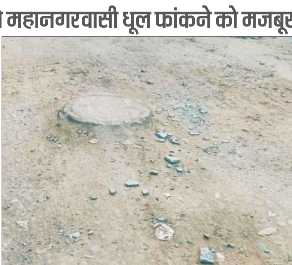
रामगंगा विहार में सीवर लाइन के लिए खोदी गई सड़क।