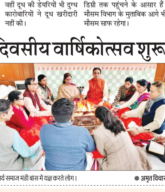
आर्य समाज मंडी बांस में यज्ञ करते लोग।