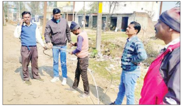
बरेली गेट स्थित जर्जर तारों को सही कराते जेई।

अमृत विचार : सिविल लाइंस क्षेत्र में पूर्वाह्न 11 से अपराह्न 3 बजे तक शट डाउन लेकर 33केवी लाइन के जर्जर तार बदलवाए गए। नए पोल लगाए जाने की वजह से रविवार को क्षेत्र की आपूर्ति तीन घंटे बंद रही। इससे उपभोक्ताओं को काफी परेशानियों का सामना करना पड़ा। तीन बजे के बाद आपूर्ति सुचारू होने पर उपभोक्ताओं ने राहत की सांस ली। मालगोदाम स्थित 33/11 केवी बिजलीघर में सात फीडर हैं। इससे सात हजार से अधिक उपभोक्ताओं को विद्युत आपूर्ति की जाती है। शौकत अली रोड, पुरानी आवास विकास, न्यू आवास विकास, सिविल लाइंस, रोशन बाग, बरेली रोड, भमरौआ रोड, बाबा दीप सिंह क्षेत्र के उपभोक्ता बिजलीघर से जुड़े हैं।