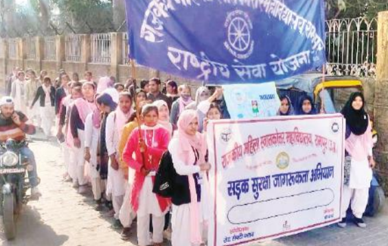
जागरुकता रैली निकालती स्वयंसेविकाएं।