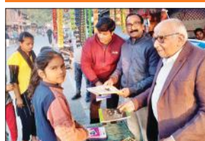
झुग्गी झोपड़ी में रहने वाले बच्चों को कितने भेंट करते रोटी वलब के पदाधिकारी।