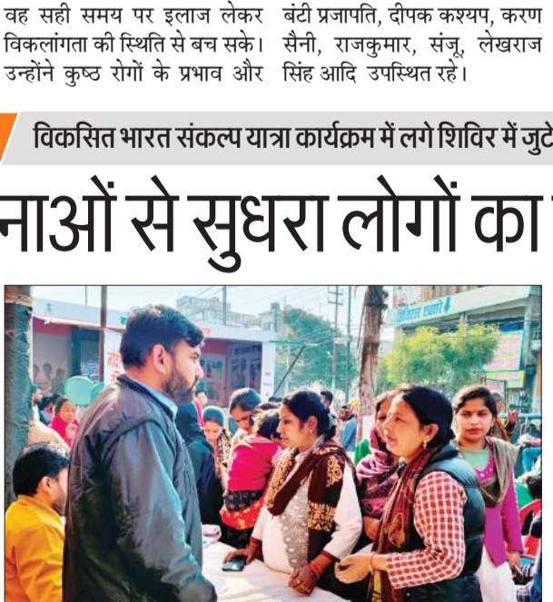
विकसित भारत संकल्प यात्रा में स्टॉल पर जानकारी लेती महिलाएं।

अमृत विचार: नगर निगम की ओर से विकसित भारत संकल्प यात्रा का आयोजन हनुमान मूर्ति तिरहा पर रविवार को किया गया। इसमें प्रधानमंत्री स्वनिधि योजना, प्रधानमंत्री उज्वला योजना, आयुष्मान भारत योजना के बारे में बताया गया। कहा गया कि केंद्र सरकार की योजनाओं से लोगों के जीवन स्तर में सुधार हुआ है। प्रधानमंत्री उज्वला योजना के अंतर्गत आपूर्ति विभाग की ओर से लगाए गए स्टॉल पर दो पात्रों को निशुल्क गैस कनेक्शन दिया गया। स्वास्थ्य शिविर में 218 लोगों की जांच कर इलाज किया गया। साथ ही आयुष्मान कार्ड बनाने के लिए