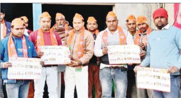
नौगांवा सादात में बैठक में मौजूद भाजपा कार्यकर्ता।