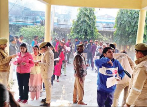
परीक्षा के पहले चेकिंग करती पुलिस।