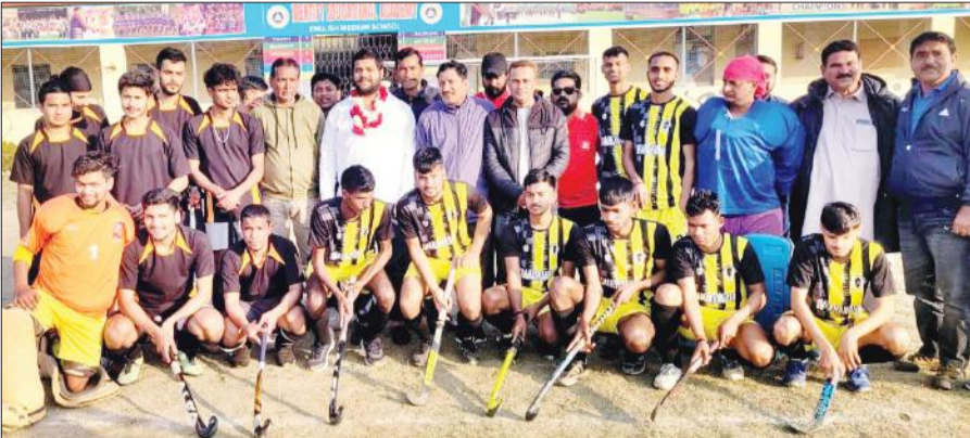
विजयी टीम के साथ मुख्य अतिथि।