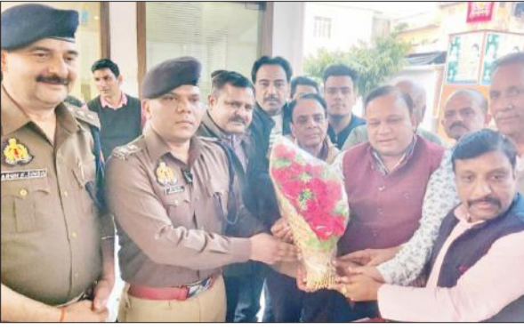
खुलासे के बाद एसपी को बुके देकर सम्मानित करते व्यापारी।