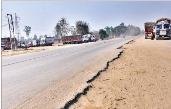
एनएच-84 में सुरपुर बाईपास का ब्लैक स्पाट।