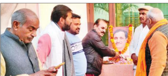
पंडित दीनदयाल उपाध्याय के चित्र पर पुष्प अर्पित करते भाजपाई।