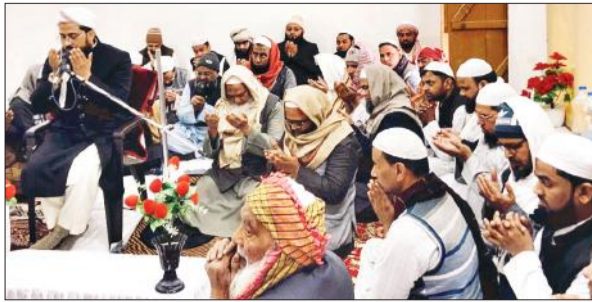
जलसा तकमील ए कुरआन में हुआ कराते मौलाना।