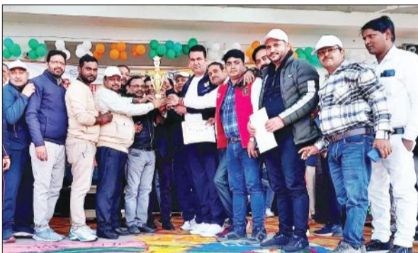
ट्रॉफी के साथ मौजूद शिक्षक।

बेसिक शिक्षा विभाग की एक दिवसीय मंडलीय क्रीड़ा एवं शैक्षिक प्रतियोगिता अमरोहा के गजरोला स्थित ऑक्सफोर्ड इंटर नेशनल स्कूल में हुई। इसमें रामपुर, बिजनौर, अमरोहा, सम्भल एवं मुरादाबाद के बालक एवं बालिकाओं ने प्रतिभाग किया गया। प्राथमिक स्तर बालक वर्ग कबड्डी में संविलियन विद्यालय नानकार की टीम प्रथम स्थान पर रही। खो-खो में मॉडल प्राथमिक विद्यालय गोकुलनगरी की टीम रनरअप रही। प्राथमिक स्तर बालिका वर्ग खो-खो में प्राथमिक विद्यालय जहांगीरपुर की