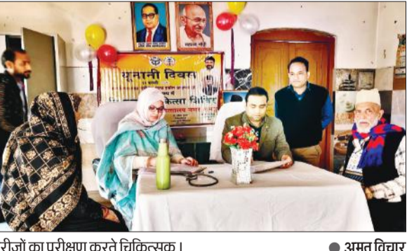
मरीजों का परीक्षण करते चिकित्सक।

लाइनों के जर्जर तार टूटना, पेड़ों की कटाई छंटाई नहीं होने की वजह से क्षेत्र की आपूर्ति बाधित होत रहती है। पेड़ों की छंटाई नहीं होने के कारण लाइनों में हुए मामूली फॉल्ट को तलाशने में काफी समय लग जाता है। काफी देर तक बिजली नहीं आने से उपभोक्ताओं को काफी परेशानियों का सामना करना पड़ता है। रविवार की सुबह साढ़े 33 केवी की लाइन के जर्जर तारों, पुराने बिजली के पोल बदलवाकर नए लगाए गए हैं। इसके लिए पूर्वाह्न 11:30 से दोपहर तीन बजे तक शटडाउन लिया गया था। -इमरान खान, एक्सईएन प्रथम ग्यारह से दोपहर ढाई बजे तक 33 केवी लाइन के तारों को दुरुस्त कराने और नए बिजली के पोल लगाने का काम किया गया।