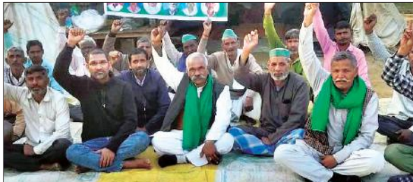
अंडरपास निर्माण की मांग को लेकर धरने पर नारेबाजी करते किसान।