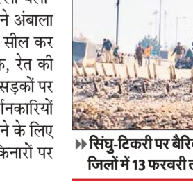
सिन्धु-टिकरी पर बैरिकेडिंग, हरियाणा के सात जिलों में 13 फरवरी तक इंटरनेट बंद

दिल्ली कूच की मुहिम को रोकने के लिए जौंद और फतेहाबाद जिलों की सीमाओं पर भी व्यापक इंतजाम किए गए हैं। फतेहाबाद में पुलिस ने पंजाब के प्रदर्शनकारियों को दिल्ली की ओर बढ़ने से रोकने के लिए जाखल इलाके में सड़क पर कंक्रिट के अवरोधक लगाए हैं और कील वाली पट्टियों भी बिछा रखी हैं। हरियाणा सरकार ने सात जिलों अंबाला,