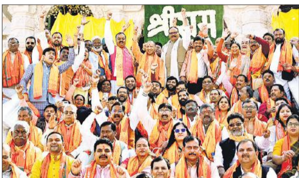
मंदिर परिसर में योगी सरकार के मंत्री-विधायक जय श्रीराम का उद्घोष करते हुए।