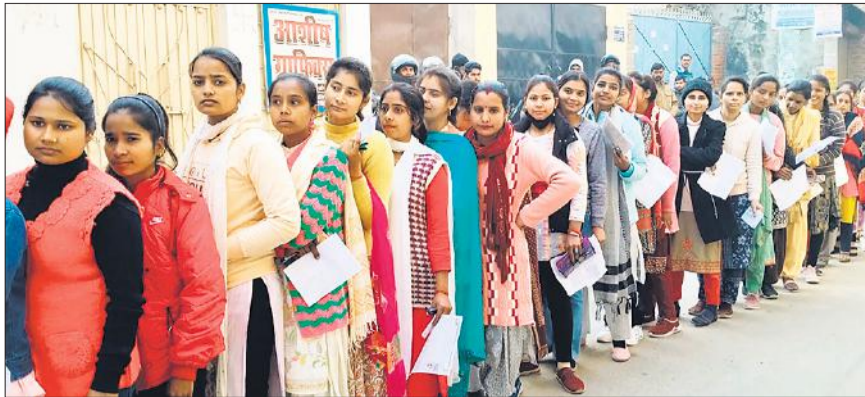
परीक्षा केंद्र पर प्रवेश के लिए लाइन में लगी छात्राएं।