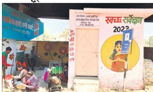
कचहरी ओवरब्रिज के नीचे बंद पड़ा शौचालय।