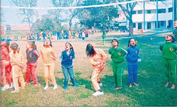
जलेबी दौड़ में भाग लेती छात्राएं।