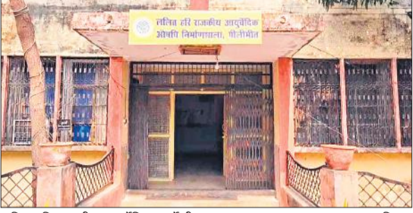
ललित हरि राजकीय आयुर्वेदिक फार्मसी।