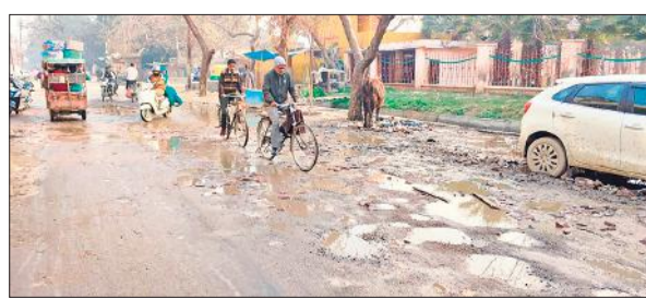
शहर में सड़क के गड्ढों में भरा पानी।

ज्यादा परेशानी नहीं हो रही है। दूसरी ओर वर्तमान में शहर की ज्यादातर सड़कें खुदी हुई हैं और गड्ढों में तब्दील हो गई हैं। हालांकि यहां सड़क के ढेर लगे हैं। हालांकि सड़क के एक किनारे खोदाई की गई है, जिसके चलते बहुत