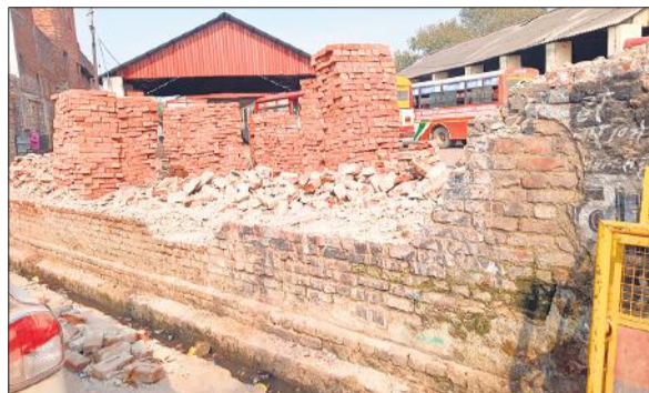
रोडवेज के वर्कशॉप का निर्माण शुरू करने पर तोड़ी गई पुरानी दीवार।

इससे बड़े-बड़े मल्टीपरपज हॉल, शोरूम बनेंगे। जिसमें घर गृहस्थ व दैनिक उपयोगी सारा सामान एक ही जगह पर लोगों को मिल सकेगा। सीएनडीएस अधिकारियों ने बताया कि निर्माण कार्य एक साल में हो जाएगा। साथ ही इन्व्हायरी कक्ष, टिकट काउंटर,