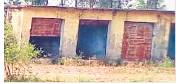
गरगइया त्रिलोकपुर में हॉट बाजार में बनी दुकानों से शटर गायब।

गरगइया त्रिलोकपुर में हॉट बाजार का निर्माण वर्ष 2011 में कराया गया था। उस वक्त प्रदेश में बसपा सरकार थी। इस हॉट बाजार का निर्माण कराने का मकसद क्षेत्र के लोगों को रोजगार मुहैया कराने और किसानों को उनकी फसल का बेहतर मूल्य दिलाने का था। लगभग दो एकड़ में बनी इस हॉट बाजार में 20 पक्की सीमेंट की दुकानें बनवाई गई थीं, हॉट बाजार परिसर में दो टीनशेड डाले गए थे। इसके दक्षिणी कोने पर शौचालय