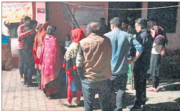
सीएचसी में दोनों बिलखते परिवार वाले।