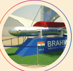
डिफेंस इंडस्ट्रियल कॉरिडोर