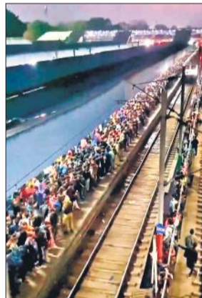
कानपुर सेंट्रल स्टेशन पर उमड़ी भीड़।

घरों को लौटने के लिए प्लेटफार्मों पर डेरा जमाए थे। इसी बीच दिल्ली से चलकर सेंट्रल स्टेशन पहुंची महाबोधि एक्सप्रेस प्लेटफार्म पर रुक भी नहीं पाई थी, तभी भीड़ चढ़ने लगी। प्लेटफार्म पर उतरने वाले यात्री गेट