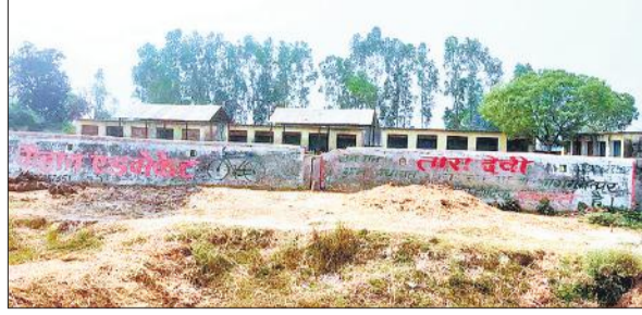
सिधौली के गांव गरगइया त्रिलोकपुर में बना हॉट बाजार।

खास बात यह कि इसको लेकर अधिकारी और नेता सब खामोश हैं। वर्षों से निष्प्रयोज्य पड़े इस हॉट बाजार को गोशाला बनाए जाने के लिए ब्लॉक अधिकारी ने उच्चाधिकारियों से पत्राचार की बात कह रहे हैं।