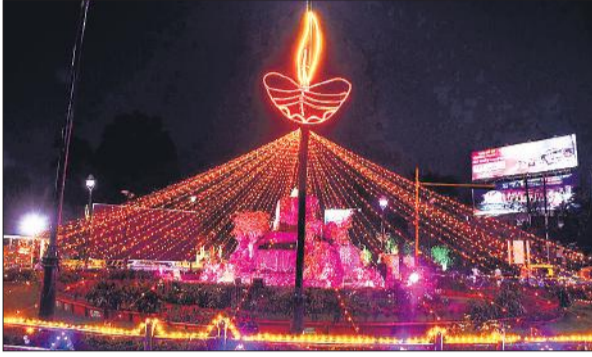
विद्युत झालरों से सजा राजधानी का चौराहा।

अफसर व अधीनस्थकर्मों दिन-रात एक किए हुए हैं।