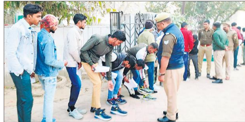
परीक्षा केंद्र पर चेंकिंग के दौरान जूते उतरवाता पुलिस कर्मी।

पुलिस भर्ती परीक्षा का पेपर छूटने के बाद यातायात पुलिस को ट्रैफिक व्यवस्था संभालने में खासी मशकत करनी पड़ी। खासतौर पर राजकीय इंटर कॉलेज, इस्लामिया इंटर कॉलेज, आर्य महिला इंटर कॉलेज, जनता इंटर कॉलेज, देवी प्रसाद इंटर कॉलेज परीक्षा केंद्र शहर के बीच में है। जहां परीक्षा छूटने पर जाम की स्थिति बनी रही। ई-रिक्शा, चार पहिया वाहन, दो पहिया वाहन भीड़ में फंसे रहे। यह अव्यवस्था दोपहर और शाम दोनों पालियों के पेपर छूटने पर देखी गई। हालांकि यातायात व्यवस्था संभालने के लिए और पहले दिन से सबक लेते हुए ट्रैफिक पुलिस खासी चौकनी थी, लेकिन भीड़ के आगे किसी की नहीं चलती। तमाम परीक्षार्थियों के कालेज गेट के बाहर ही वाहन पर बैठने के कारण स्थितियां बनती-बिगड़ती रहीं।