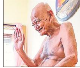
● चंद्रगिरि तीर्थ में छह माह से रह रहे थे, कुछ दिनों से थे बीमार

जाने-माने जैनमुनि आचार्य विद्यासागर महाराज ने छत्तीसगढ़ के राजनंदगांव जिले के डोंगरगढ़ स्थित 'चंद्रगिरि तीर्थ' में 'सल्लेखना' करके रविवार को देह त्याग दी। चंद्रगिरि तीर्थ की ओर से जारी एक बयान के अनुसार सल्लेखना जैन धर्म में एक प्रथा है, जिसमें देह त्यागने के लिए स्वेच्छा से अन्न-जल का त्याग किया जाता है। छत्तीसगढ़ सरकार ने रविवार को आधे दिन के राजकीय शोक की घोषणा की है। मुख्यमंत्री कार्यालय ने 'एक्स' पर एक पोस्ट में कहा कि विश्व प्रसिद्ध दिगंबर जैन संत परंपरा के आचार्य विद्यासागर महाराज जी का त्याग निधन हो गया उन्हें वर्तमान समय का वर्धमान कहा जाता है। राजकीय शोक के दौरान राष्ट्रीय ध्वज आधा झुका रहेगा और कोई भी सरकारी समारोह या कार्यक्रम आयोजित नहीं किए जाएंगे। जैनमुनि के निधन पर प्रधानमंत्री नरेंद्र मोदी, केंद्रीय गृहमंत्री अमित शाह, उत्तर प्रदेश के मुख्यमंत्री योगी आदित्यनाथ सहित अन्य