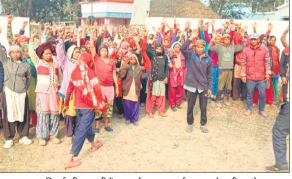
दुधवा टाइगर रिजर्व की बनकटी रेंज कार्यालय पर प्रदर्शन कर नारेबाजी करते थारु।

अमृत विचार: दुधवा टाइगर रिजर्व की बनकटी रेंज के जंगल में रविवार को जलोनी लकड़ी लेने डनलप सहित घुसे थारु जनजाति के कुछ लोगों की सूचना मिलने पर वन विभाग के रेंज ऑफिसर बनकटी ने तीन लोगों को हिरासत में ले लिया। इसकी सूचना थारु गांवों में आग की तरह फैल गई और बड़ी संख्या में थारु जनजाति के स्त्री व पुरुष बनकटी रेंज कार्यालय पहुंच गए। वहां उन्होंने जबदस्त प्रदर्शन कर नारेबाजी शुरू कर दी, जिससे वन कर्मियों में अफरा-तफरी मच गई। आनन-फानन में पुलिस बुलाई गई। रविवार को कुछ थारु डनलप लेकर रेंज के संरक्षित जंगल में जा घुसे और लकड़ी काटने की कोशिश करने लगे। किसी ने इसकी सूचना बनकटी रेंज को दी। इसके बाद वनकर्मियों व पुलिस ने जंगल में घुसे थारु जनजाति के लोगों को रोका और तीन लोगों को पकड़ कर बनकटी रेंज कार्यालय ले आए और उनसे पूछताछ शुरू कर दी। उधर, जैसे ही थारु जनजाति के