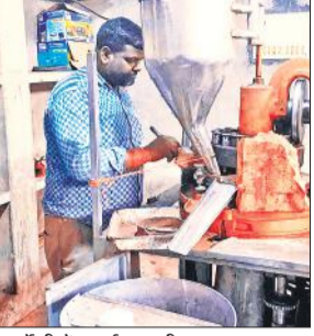
फार्मसी में बनाई जा रही दवा।

छात्रों को औषधियों के निर्माण की प्रक्रिया से रूबरू कराया जाता था। इसके बाद कॉलेज के पीछे 20 एकड़ जमीन भी मुहैया कराई। जहां