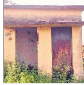
बाजार के शौचालय से दरवाजा गायब।