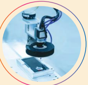
इलेक्ट्रॉनिक मैन्युफैक्चरिंग हब

स्थान : इंदिरा गांधी प्रतिष्ठान, गोमतीनगर, लखनऊ