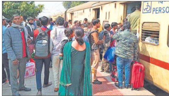
ट्रेन में उमड़ी अभ्यर्थियों की भीड़।

बता दे कि जिले में उत्तर प्रदेश पुलिस कांस्टेबल भर्ती परीक्षा 17 व 18 फरवरी को थी। परीक्षा दो पाली में थी। जिले में 11 परीक्षा केंद्र बनाए गए थे। 18 फरवरी की प्रथम पाली और दूसरी पाली की परीक्षा समाप्त होने के बाद रेलवे स्टेशन पर अभ्यर्थियों की भीड़ उमड़ पड़ी। परीक्षार्थी मुरादाबाद, संभल, अमरौहा आदि जिले से आए थे और कुछ परीक्षार्थी जिले के थे। दोपहर डेढ़ बजे जननायक एक्सप्रेस प्लेटफार्म चार आई। अभ्यर्थियों ट्रेन में चढ़ने के लिए