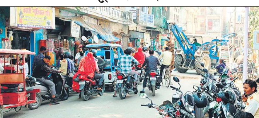
दूसरा खंभा लगाने में जुटे बिजली कर्मचारी और रोड पर लगा जाम।