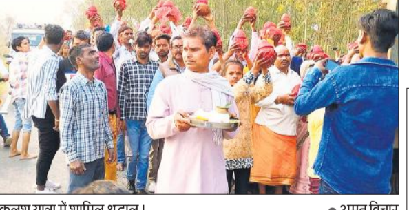
कलश यात्रा में शामिल श्रद्धालु।