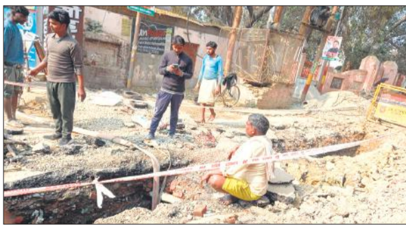
पेयजल लाइन की मरम्मत के लिए खोदाई करते कर्मचारी।

सीवर लाइन के लिए खोदी गई सड़कों पर पानी भरने से लोगों को जाने आने में भारी परेशानी हो रही है। खासकर दो पहिया वाहन और पैदल चलने वाल ज्यादा परेशान हैं। बाइक, स्कूटी और साइकिल