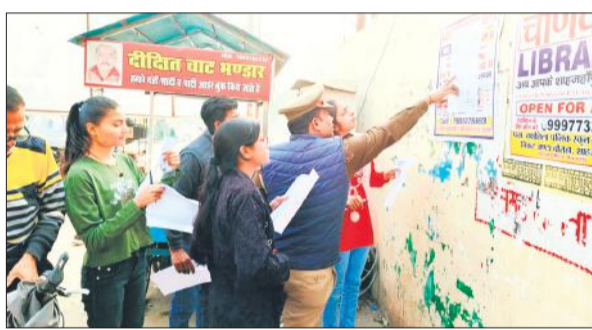
परीक्षा केंद्र के बाहर सीटीएम प्लान देखते अभ्यर्थी।