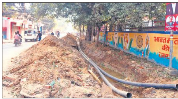
कचहरी रोड पर सड़क की खोदाई के चलते लगे मिट्टी के ढेर।