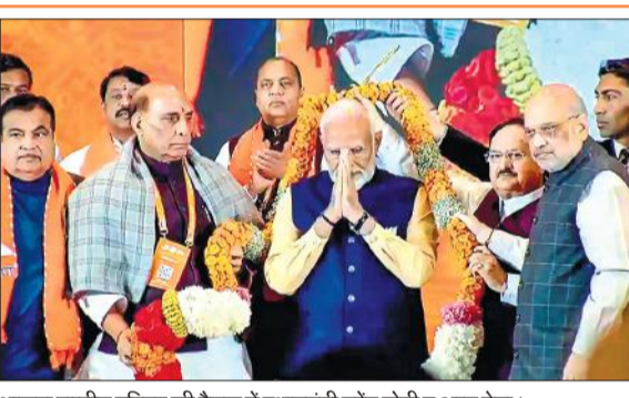
भाजपा राष्ट्रीय परिषद की बैठक में प्रधानमंत्री नरेंद्र मोदी व अन्य नेता।