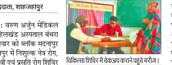
चिकित्सा शिविर में चेकअप कराने पहुंचे मरीज।