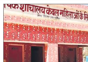
शहर में बीएसए कार्यालय के पास बना गंदे शौचालय।

शहर की मार्केट में नगर निगम के खस्ताहाल शौचालयों को लेकर दुकानदार और ग्राहक कई बार रोष जता चुके हैं। लंबे समय से गंदे शौचालयों का खरखराव नहीं हो पा रहा है। शौचालयों में गंदगी और बदबू के कारण दुकानदार और ग्राहक इनका प्रयोग तक नहीं कर