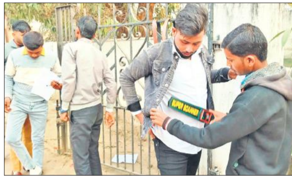
मेटल डिटेक्टर से तलाशी लेता कर्मचारी।

दोनों पालियों में भ्रमण पर रहते हुए व्यवस्था पर नजर गड़ाए रहे। प्रथम पाली सुबह 10 से 12 बजे तक और दूसरी पाली अपरान्ह तीन से पांच बजे तक चली। पहले दिन की तरह दूसरे दिन भी परीक्षार्थी अपने परीक्षा केंद्रों पर निर्धारित समय से डेढ़-दो घंटे पहले ही पहुंच गए थे। केंद्रों के बाहर मुख्य मार्ग के किनारे लंबी-लंबी कतारें लगाए छात्र-छात्राएं तलाशी देकर ही कक्ष में भेजे जा रहे थे। वहीं, सभी के प्रवेश पत्र तथा परिचय पत्रों की भी जांच की गई।