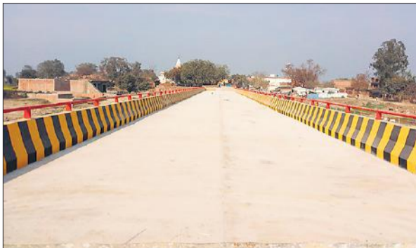
स्रोत नदी पर बनकर तैयार हुआ पुल।

मिर्जापुर क्षेत्र में ढाई गांव के पास स्रोत नदी पर बना नया पुल पुराने से काफी चौड़ा है। यहां पहले बना पुल संकरा है, जर्जर हो चुका है। सुरक्षा के लिहाज से पुराने पुल से होकर केवल छोटे वाहन गुजारे जा रहे हैं। जलालाबाद- ढाई घाट, शमशाबाद, विधुना स्टेट हाईवे