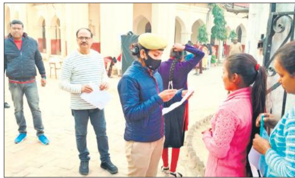
अभ्यर्थियों का प्रवेश पत्र चेक करती पुलिस।