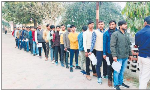
राजकीय इंटर कॉलेज के बाहर लगी अभ्यर्थियों की लंबी कतार।

आरक्षी नागरिक पुलिस के पदों पर सीधी भर्ती परीक्षा शनिवार और रविवार को दो दिन कराई गई। दोनों दिन चार पालियों में समान रूप से 5256-5256 परीक्षार्थी आवंटित किए गए थे। दोनों दिन की चारों पालियों में कुल 21024 परीक्षार्थी आवंटित किए गए थे। पुलिस भर्ती परीक्षा 11 केंद्रों पर शांतिपूर्वक संपन्न होने पर अधिकारियों ने राहत की सांस ली। सभी केंद्रों पर बड़ी