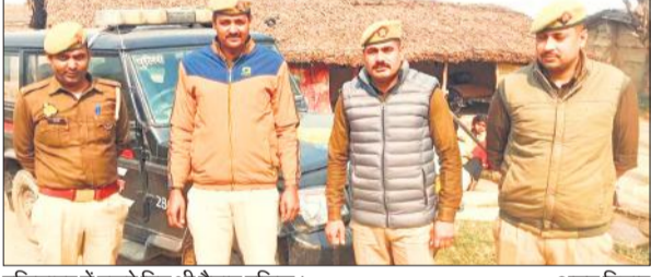
पसियापुर में दूसरे दिन भी तैनात पुलिस।