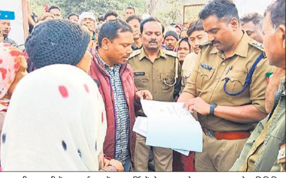
दुधवा की बनकटी रेंज कार्यालय में वन कर्मियों से बात करते थारु समुदाय के प्रतिनिधि।

लोगों को इसकी खबर लगी दर्जनों की संख्या में महिलाओं व पुरुषों ने बनकटी रेंज कार्यालय में पहुंचकर हंगामा करना शुरू कर दिया। हंगामा के साथ ही वन विभाग के खिलाफ जमकर प्रदर्शन व नारेबाजी शुरू कर दी। यहां तक कि डिप्टी डायरेक्टर व रेंज अधिकारी के खिलाफ मुर्दाबाद के नारे लगाए और वनकर्मियों पर थारु