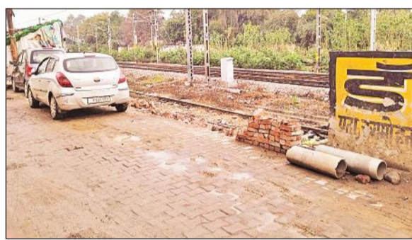
रोडवेज रेलवे फाटक व लकड़ी वाले पुल के बीच टूटी रेलवे की दीवार। ● अमृत विचार

अमृत विचार: रोडवेज रेलवे फाटक व लकड़ी वाले पुल के बीच रेलवे की दीवार तोड़कर लोगों ने रास्ता बना लिया। निराश्रित पशु टूटी दीवार से रेलवे लाइन पर निकल जाते हैं। जिससे ट्रेन से टकराकर हादसा होने का खतरा है। आईओडब्ल्यू को मेमो देने के बाद भी टूटी दीवार नहीं बनाई गई है। रोडवेज रेलवे फाटक से तेल टंकी मोड़ पर जाने वाले मार्ग रेलवे की लाइन के किनारे रेलवे की दीवार है। दीवार बनाने का उद्देश्य था कि निराश्रित पशु और लोग रेल लाइन पार न कर सकें। इधर 15 दिन पूर्व एक स्थान पर लोगों ने दीवार तोड़ दी और आम रास्ता बना लिया। लोग रेल लाइन पार करके पुल के नीचे अशफाकनगर