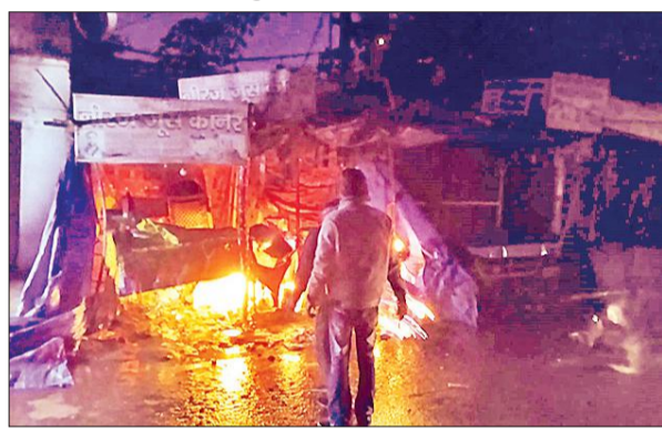
दुकान में लगी आग को बुझाते लोग।