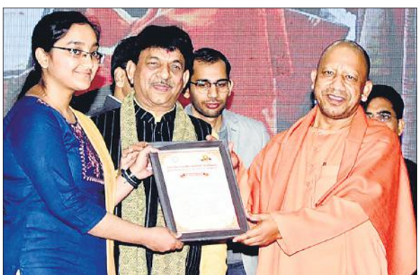
रविवार को गोरखपुर में आयोजित वृहद रोजगार मेले में नवचयनित अभ्यर्थियों को नियुक्ति पत्र देते हुए मुख्यमंत्री योगी आदित्यनाथ।

योगी रविवार को गोरखपुर के मदन मोहन मालवीय प्रौद्योगिकी विश्वविद्यालय परिसर में वृहद रोजगार मेला एवं नवचयनित अभ्यर्थियों के नियुक्ति पत्र वितरण समारोह को संबोधित कर रहे थे। उप्र. कौशल विकास मिशन की तरफ से आयोजित इस कार्यक्रम में मुख्यमंत्री ने कहा कि युवाओं को ट्रेनिंग से जोड़कर उन्हें आगे बढ़ाने की जरूरत है। मुख्यमंत्री इंटरनेशनल कार्यक्रम के साथ युवाओं को जोड़कर आगे बढ़ाने का प्रयास करना चाहिए। मुख्यमंत्री