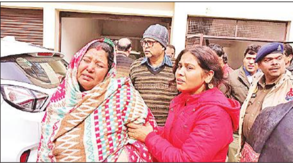
बेटी महिला जज की मौत पर विलाप करती उनकी मां।