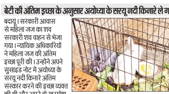
पिंजड़े में रखकर ले जाया गया खरगोश।