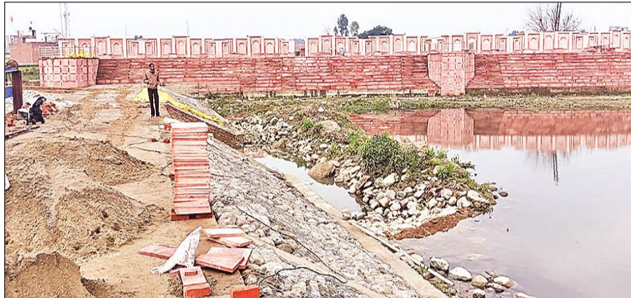
हनुमतधाम के दक्षिणी ओर निर्माणाधीन घाट।

अमृत विचार: प्रदेश सरकार द्वारा हनुमतधाम को पर्यटन स्थल घोषित किए जाने के बाद क्षेत्र का सौंदर्यीकरण लगातार जारी है। खन्नौत नदी के बीच टापू पर बनाए गए भव्य मंदिर में लगभग 105 फिट ऊंची रामभक्त हनुमान की दिव्य प्रतिमा और कृत्रिम गुफा में श्री गणेश जी, भोले नाथ, हनुमान जी, श्रीराम दरबार, मां दुर्गा के मनोहारी दरबार में मत्था टेकने के लिए दिनभर श्रद्धालुओं का तांता लगा रहता है। धार्मिक स्थल का सौंदर्यीकरण कराने के लिए वित्त एवं संसदीय कार्य मंत्री सुरेश कुमार खन्ना के मार्ग दर्शन में टीम लगातार प्रयासरत रहती है। श्रद्धालुओं की उमड़ती भीड़ को देखते हुए हनुमतधाम प्रबंध समिति लगातार तीर्थस्थल के रूप में विकसित होने वाले धाम का सौंदर्यीकरण करा रही है। खन्नौत नदी के चारों ओर राजस्थानी पैटर्न पर लाल पत्थर से घाट बनवाए जा रहे हैं। घाट बनवाने का सिलसिला लगातार जारी है। वर्तमान में नदी के दक्षिणी दिशा की ओर नदी किनारे