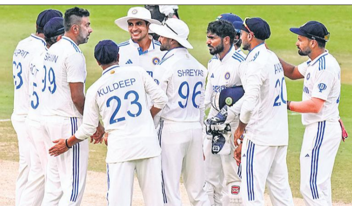
बेन डेकेट का विकेट लेने के बाद खुशी जाहिर करते भारतीय टीम के खिलाड़ी।

भारत ने दिन की शुरुआत बिना विकेट खोए 28 रन से की थी। टीम ने सुबह के सत्र में 102 रन जोड़े लेकिन कप्तान रोहित शर्मा (12), यशस्वी जायसवाल (17), श्रेयस अय्यर (29) और रजत पाटीदार (09) के विकेट गंवाए। सुबह के सत्र में शुरुआती 30 मिनट एंडर्सन के नाम रहे। उन्होंने अपने पहले ओवर में रोहित का ऑफ स्टंप उखाड़ा। फिर अगले ओवर में पहली पारी में दोहरा शतक जड़ने वाले यशस्वी जायसवाल को पहली स्लिप में जोरूट के हाथों कैच कराया। खराब फॉर्म से जूझ रहे शुभमन गिल और श्रेयस अय्यर ने 81 रन जोड़कर पारी को संभाला। गिल को