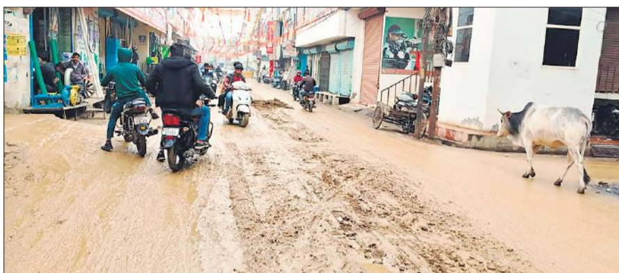
मुख्य बाजार में सड़क पर कीचड़।

अमृत विचार: सीवर लाइन बिछाने के लिए महानगर की सभी सड़कें खोद दी गईं। सबसे बड़ी लापरवाही यह देखने को मिल रही है कि कार्यदायी संस्था एक के बाद एक सड़क खोदती गई लेकिन न शहर के जिम्मेदारों और न ही जनप्रतिनिधियों ने शहरवासियों की पीड़ा को समझा। मिट्टी खोद जाने की वजह से सड़कें दलदली हो गईं। कहीं ज्यादा गहरा गड्ढा है तो कहीं मिट्टी की मोटी परत जमी हुई है। लापरवाही की वजह से खुदी पड़ी सड़कें बारिश में शहर के लोगों के लिए मुसीबत बन गई हैं। कीचड़ से भरी सड़कों पर फिसलन इस कदर बढ़ गई कि राहगीर फिसल कर चोटिल हो रहे हैं। हालात यहां तक खराब हैं कि लोग निकलने से डर रहे हैं, कहीं कीचड़ वाली सड़कें जानलेवा न बन जाएं। बारिश ने सड़कों की दुर्दशा को और बढ़ा दिया है। नवनि्युक्त नगर आयुक्त कामता प्रसाद के लिए महानगर की बदहाल सड़कों की स्थिति में जल्द सुधार कराना भी बड़ी चुनौती बना है, क्योंकि ठेकेदार सड़कों को खोदने के बाद ठीक से मरम्मत तक नहीं कर रहे हैं। जल निगम ने कार्यदायी संस्था टेक्नोक्राफ्ट को मार्च तक काम पूरा करने की समय सीमा तय की है। इसलिए कार्यदायी संस्था के कर्मिकों को दिन-रात काम पर लगाकर कार्य करा रही है। शनिवार को भी पूरे दिन काम चला। इससे आवागमन प्रभावित रहा।