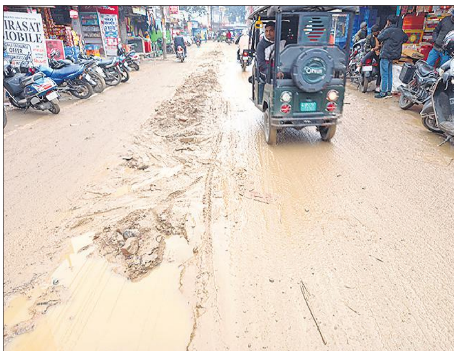
एसपी ऑफिस के सामने वाली सड़क पर कीचड़।

► कीचड़ से सड़कों पर फिसलन बढ़ी राहगीर फिसल कर चोटिल हो रहे, नगर आयुक्त के सामने स्थिति से निपटना चुनौती