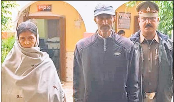
कटरा पुलिस की गिरफ्त में मादक पदार्थ तस्करी के आरोपी।