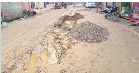
निशात रोड पर बीच सड़क में कीचड़।