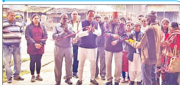
वरुण अर्जुन मेडिकल कॉलेज ने कटरा में लगाया कैंप