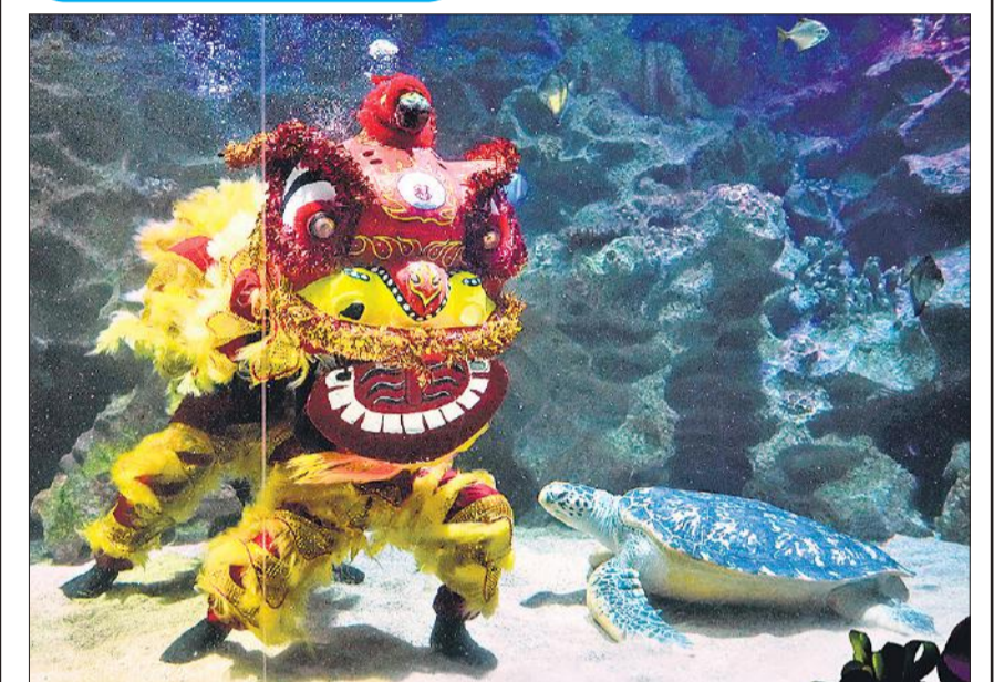
रविवार को मलेशिया के कुआलालंपुर में चीनी चंद्र नव वर्ष समारोह से पहले गोताखोरों ने केएलसीसी एक्वेरियम में पानी के अंदर शेर नृत्य का प्रदर्शन किया।