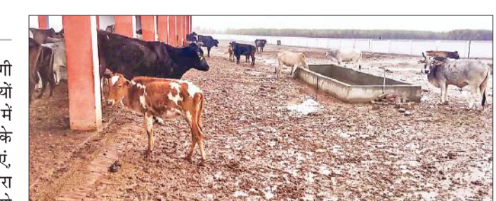
रायो गांव स्थित वृहद गो संरक्षण केंद्र में दुर्दशा का शिकार गोवंश।

अमृत विचार: मुख्यमंत्री योगी आदित्यनाथ के प्रशासनिक अधिकारियों को साफ निर्देश हैं कि गोशालाओं में गोवंशों को सर्दी से बचाव समेत उनके खान-पान की समुचित व्यवस्थाएं कराएं, लेकिन करीब दो माह पहले गंजडुंडवाड़ा क्षेत्र के रायो गांव में खोले गए वृहद गो संरक्षण केंद्र की दुर्दशा पर प्रशासन ने कोई ध्यान नहीं दिया। गोशाला की मौजूदा स्थिति यह है कि यहां करीब 30 दिन में 45 गोवंशों की मौत हो चुकी है। 24 घंटे में ही एकसाथ 12 गोवंशों की ठंड से मौत होने की बात सामने आने के बाद जिम्मेदारों ने जांच के आदेश दिए हैं। दरअसल इस सरकारी गोशाला का उद्घाटन के बाद न जनप्रतिनिधियों और ना ही प्रशासन ने इसकी ओर मुड़कर देखा। यहां काम करने वाले कई कर्मचारियों ने नाम न छापने की शर्त पर