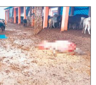
वृहद गो संरक्षण केंद्र में मृत पड़ीं गायें व अन्य गोवंश।

अव्यवस्थाएं तमाम हैं। रविवार को भी गोशाला में गोवंशों के शव इधर-उधर पड़े थे। एकसाथ 12 गोवंशों की मौत होने के बाद भी जिम्मेदार गोशाला की स्थिति पर गंभीर नहीं दिख रहे हैं। हरे चारे का अभाव है। हरा चारा नहीं मिलने की वजह से गोवंशों की दुर्दशा हो रही है। परिसर में चारों ओर गंदगी फैली हुई है। करोड़ों रुपये की लागत से बनाई गई गोशाला में 540 गोवंश संरक्षण के लिए रखे गए हैं लेकिन इसकी साफ सफाई