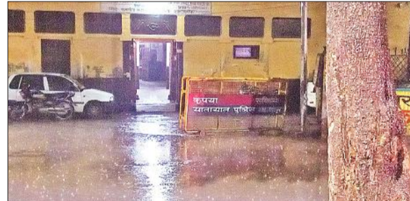
रविवार रात महानगर में होती झमाझम बारिश हुई।

अमृत विचार : कोहरे के बाद रविवार को बेमौसम बारिश ने ठंड बढ़ा दी। दिनभर हुई रिमझिम बारिश रात को झमाझम में बदल गई। शाम लगभग नौ बजे के आसपास बे-मौसम जमकर बरसात हुई। लोग बचने के लिए छत तलाशते दिखाई दिए। कुछ लोगों ने पेड़ व भवनों की आड़ लेकर स्वयं को बारिश से बचाया। साइकिल और बाइक सवार तो जहां थे, वहीं रुक कर आड़ में हो गए। बारिश का यह सिलसिला देर रात तक चलता रहा। बे-मौसम हुई बारिश गेहूं की फसल के लिए अच्छी मानी जा रही है। पंपिंग सेट से सिंचाई करने वाले किसानों के डीजल का खर्च बच गया। हालांकि शहर में कीचड़ और बढ़ गया। वहीं, भावलखेड़ा में सुबह से शाम तक रुक-रुक बूंदाबांदी होती रही।