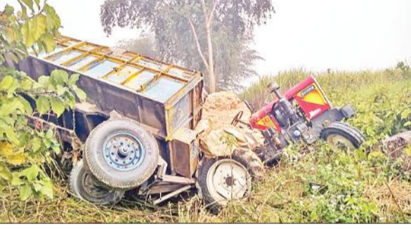
दुर्घटनाग्रस्त ट्रैक्टर ट्राली।

अमृत विचार: जिले में अलग-अलग स्थानों पर 12 घंटे के भीतर दो सड़क दुर्घटनाएं हुईं। रविवार की सुबह मिताली थाना क्षेत्र में भूसा लेकर जा रही ट्रैक्टर ट्रॉली अनियंत्रित होकर पलट गई, हादसे में दो लोगों की मौत हो गई और एक मजदूर घायल हो गया। उधर शनिवार की देर रात सड़क किनारे खड़ी बरात की कार में दूसरी कार ने पीछे से टक्कर मार दी, जिससे कार चालक समेत उसमें सवार सात लोग घायल हो गए। एक घायल ने