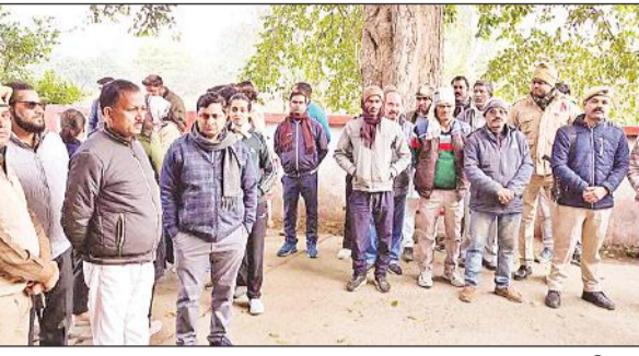
शव के पोस्टमार्टम के दौरान मौजूद न्यायिक अधिकारी।

उन्होंने बताया कि बेटी ने पहले प्रयास में ही पीसीएस-जे की परीक्षा पास की थी। वह बहुत होनहार थी। आवास में रिकवॉरिटी होने के बाद भी बेटी ने असहाय होकर ऐसा कदम उठा लिया। उन्होंने बताया कि पास में रहने वाले एक न्यायिक अधिकारी की