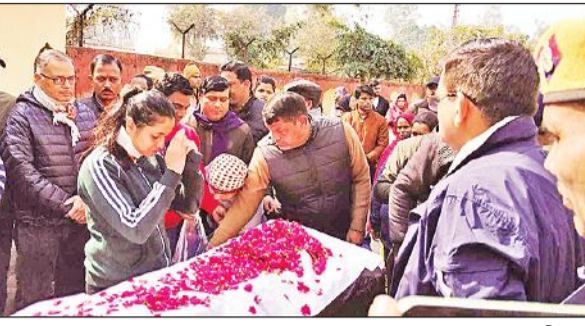
अंतिम दर्शन के बाद पुष्प अर्पित करते न्यायिक अधिकारी।