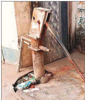
बंडा कस्बे में खराब पड़ा हैंडपंप।

इस बार गर्मी विकराल रूप धारण करेगी। इसलिए लोगों को प्यास भी ज्यादा लगेगी। यदि हैंडपंप ही सही नहीं होंगे तो लोगों को पानी कैसे मिलेगा। - ओमप्रकाश गंगवार