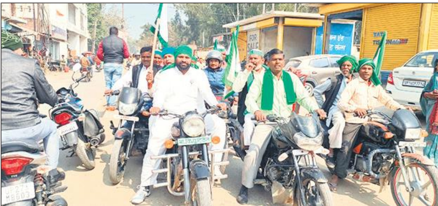
तिलहर में बाइक रैली निकालते किसान। ● अमृत विचार

पूर्ण होने पर भी पेंशन योजना से वंचित हैं, इन मजदूरों का डाटा भी यूपी बीओसीडीब्ल्यू बोर्ड के पोर्टल से गायब हो जाता है। इन मजदूरों को शीघ्र ही बोर्ड से पांच हजार रुपये पेंशन दी जाए। ई-श्रम कार्ड में पंजीकृत सभी आठ करोड़ असंगठित श्रेत्र के मेहनतकशों को सामाजिक सुरक्षा योजना बनाकर लागू किया जाए, मनरेगा में फर्जी तरीके से जांब कार्डों द्वारा निधि का दुरुपयोग किया जा रहा है, जिसकी जांच शासन स्तर से कराई जाए, सहित 15 मांगें शामिल हैं। इस दौरान यूनियन प्रदेश