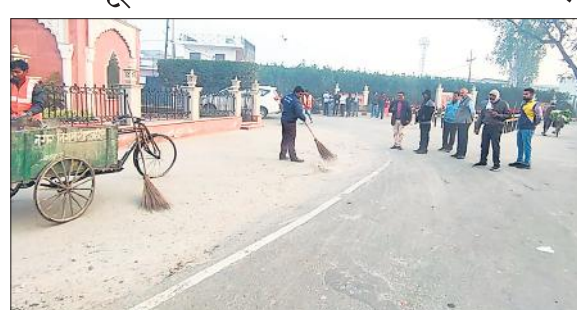
घंटाघर में सफाई व्यवस्था का निरीक्षण करते नगर आयुक्त कामता प्रसाद सिंह।