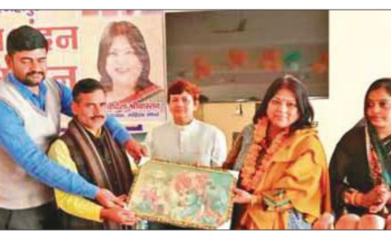
कार्यक्रम में मुख्य अतिथि को श्री कृष्ण और मीरा भक्ति का चित्र भेंट करते भाजपा पदाधिकारी।

उन्होंने बताया कि नारी शक्ति को अग्रणी करने में भाजपा ही एक ऐसा दल है जो महिलाओं को बढ़-चढ़कर उनके मान सम्मान के लिए तत्पर रहती है और नारी शक्ति को बढ़ावा दे रही है। इस