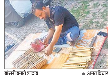
बांसुरी बनाने का शौक।

अमृत विचार: पीलीभीत की बांसुरी महज एक रोजगार का माध्यम ही नहीं बल्कि एक विरासत भी है, लेकिन बदलते वक्त के साथ अब इसके सुर भी बिखरते जा रहे हैं। बांसुरी नगरी कहे जाने वाली पीलीभीत की बांसुरी को उम्मीद थी कि ओडीओपी योजना में शामिल होने के बाद बांसुरी कारीगरों के घरों में सिमटे इस कुटीर उद्योग को फिर से नई पहचान मिलेगी, लेकिन पांच साल बाद बीतने के बाद इनकी उम्मीदें अब टूटती नजर आ रही हैं। पिछले छह माह की बात करें तो यह कारोबार अर्ध से फर्श पर आ पहुंचा है। कारोबारियों की मानें तो बांसुरी बिक्री का कोई बड़ा प्लेटफार्म न होने की वजह से बांसुरी कारोबार अब खत्म होने के कगार पर आ चुका है।