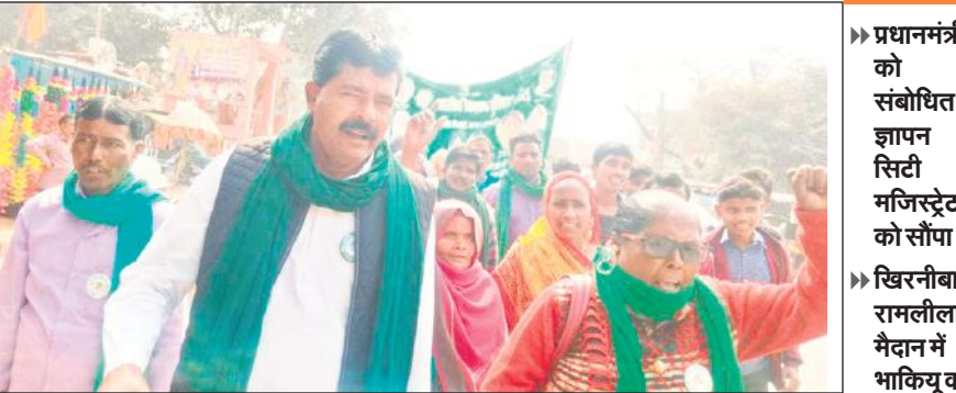
निगोही में प्रदर्शन करते भाकियू टिकैत गुट के कार्यकर्ता।

खिरनीबाग रामलीला मैदान में भाकियू किसान सरकार के संस्थापक अध्यक्ष के नेतृत्व में दिए गए ज्ञापन में किसानों की मांग है कि किसान आयोग का गठन किया जाए, छुट्टा पशुओं की समस्या से निजात दिलाई जाए और