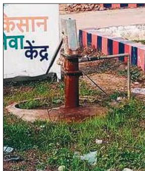
कॉलोनी में हैंडपंप में फिट किया गया मोटर।

नगर में जल संकट की स्थिति अभी से गहराने लगी है। मगर पेयजल संकट से निपटने की कवायद अप्रैल- मई में शुरू की जाती है। नागरिक पानी के लिए इधर-उधर भटक रहे हैं। यहां की रामनगर कॉलोनी में कुछ लोगों ने सरकारी हैंडपंप