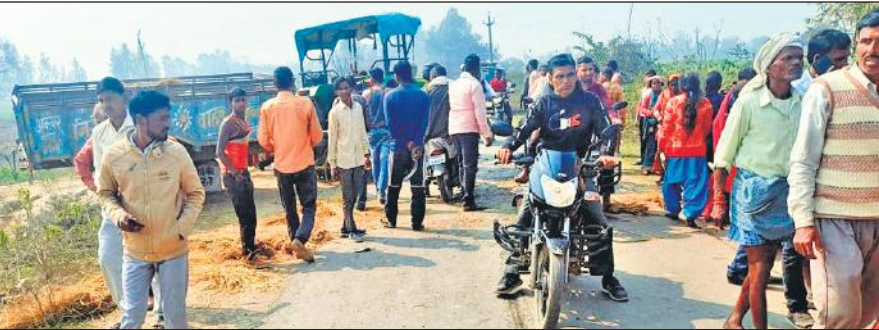
घटना स्थल पर लगी लोगों की भीड़।

अमृत विचार : साइकिल सवार को बचाने के लिए ट्रैक्टर चालक ने अचानक ब्रेक लगाए तो झटका लगने के साथ ट्रॉली तिरछी हो गई। इससे ट्रॉली में बैठे 13 श्रद्धालु नीचे जा गिरे। इसमें गंभीर चोटें आने से एक की मौके पर मौत हो गई, जबकि 12 घायल हो गए। सभी लोग भौती गांव से ट्रैक्टर-ट्रॉली में बैठकर ढाईघाट