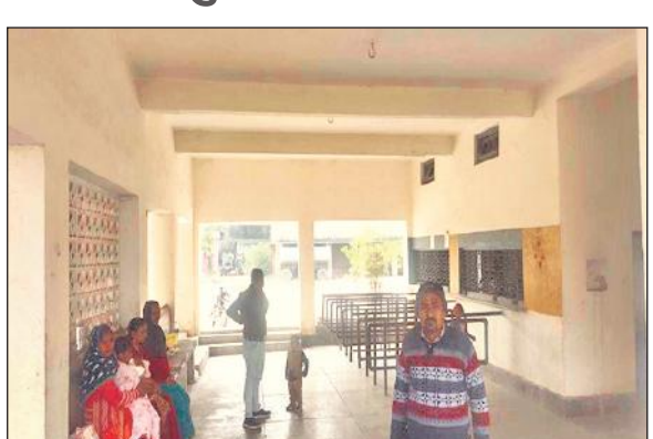
कांट स्थित रोडवेज स्टैंड पर बस के इंतजार में बैठे यात्री।

शाहजहांपुर-जलालाबाद रोड पर कांट कस्बे में रोडवेज बस स्टैंड दशकों पुराना है। यहाँ बिजली और पानी के लिए शुद्ध पानी तक की व्यवस्था नहीं है। नियमित सफाई न होने से गंदगी की भरमार है। कांट रोडवेज से रोजाना हजारों