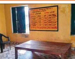
मजदूरों से खाली कराया गया महुआ पिमई का आंगनबाड़ी केंद्र।

गांव में पाइप लाइन डालने वाले मजदूरों को रहने के लिए दिया गया था आंगनबाड़ी केंद्र