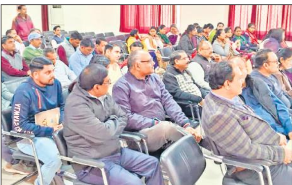
मुमुक्षु महोत्सव की तैयारी में आयोजित बैठक में शिक्षक-शिक्षिकाएं। ● अमृत विचार