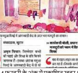
14 फरवरी के अंक में प्रकाशित खबर।

आंगनबाड़ी मभरा मजदूरों का सामान, बच्चे बैठ रहे बाहर