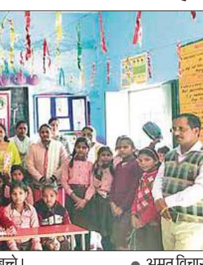
पुरस्कार के साथ प्रतियोगिताओं के विजेता बच्चे।