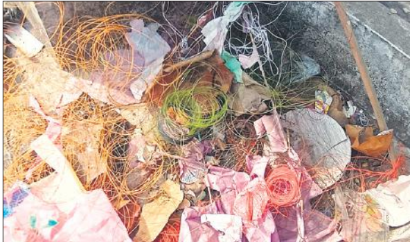
एक मकान की छत पर पड़ा चाइनीज मांझे का गुच्छ।

प्रशासन और पुलिस विभाग भले ही चाइनीज मांझा की बिक्री नहीं होने को वकालत कर रहा हो, लेकिन सत्यता यह है कि पतंगों की दुकानों पर धड़ल्ले से चाइनीज मांझा बिकता देखा जा सकता है। सवाल यह भी है कि अगर दुकानों पर चाइनीज मांझा नहीं बिक रहा है, तो गली-मोहल्लों, कूड़े के ढेर, छतों पर कहां से आ रहा है। चाइनीज मांझा से लोगों के गले कट रहे हैं। कभी-कभी तो यह