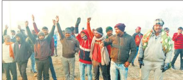
बजाज हिंदुस्थान चीनी मिल में बाहर से गन्ने की नगद खरीद के विरोध में प्रदर्शन करते किसान।

अमृत विचार: किसानों का बकाया भुगतान देने में बीते कई सालों से पिछड़ती रही बजाज हिंदुस्थान चीनी मिल बरखेड़ा में अब गन्ने की सीधी खरीद करने पर हंगामा हो गया। अपने भुगतान के लिए चक्कर लगाकर परेशान हो चुके किसानों ने मिल पहुंचकर गंभीर आरोप लगाते हुए विरोध किया। नारेबाजी करते हुए तीनों कांटों पर तौल बंद करा दी। सूचना मिलने पर पहुंचे चीनी मिल के अधिकारियों ने करीब तीन घंटे तक वार्ता की और फिर सेंटर से गन्ना आने की बात कहते हुए सफाई पेश कर किसी तरह मामला शांत कराया। तब जाकर तौल शुरू हुई। हालांकि किसानों ने अपनी बात पर अडिग होकर