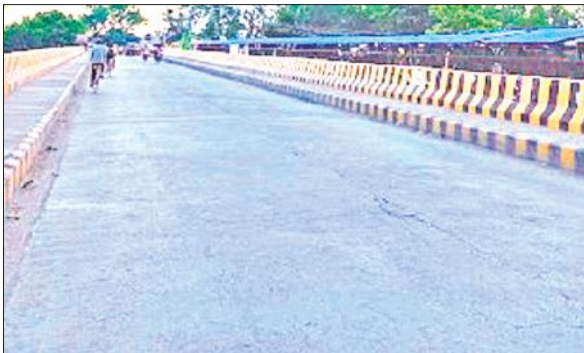
गर्रा पुल शाहजहांपुर।

शहर को एक और बड़ी सौगात देने की तैयारी है। गर्रा नदी पर अब एक नहीं बल्कि दो-दो पुल होंगे। वर्तमान में बने पुल के समानांतर दूसरा पुल बनाया जाएगा। शहर की खन्नीत नदी पर दो पुल हो गए हैं। एक पुल पुराना बना हुआ है और दूसरा पुल भी उसी के पास नया बना दिया गया है। खन्नीत नदी पर दूसरा पुल बनने से पहले जाम की स्थिति विकराल हो रही थी। लोगों को आने-जाने में परेशानी का सामना करना पड़ता