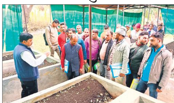
गन्ना शोध परिषद में प्रशिक्षण लेते किसान।