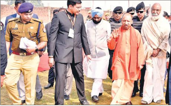
संभल के ऐचोड़ा कम्बोह में भाजपा पदाधिकारियों के साथ फोटो खिंचवाते मुख्यमंत्री ।

अमृत विचार: संभल के ऐचोड़ा कम्बोह में कल्कि धाम शिलान्यास कार्यक्रम में 19 फरवरी को प्रधानमंत्री नरेंद्र मोदी के आगमन को देखते हुए उत्तर प्रदेश के मुख्यमंत्री योगी आदित्यनाथ ने आयोजन स्थल पर पहुंचकर तैयारियों को देखा। समीक्षा बैठक में मुख्यमंत्री ने अधिकारियों को हिदायत दी कि सभी तैयारियों को समय से पूरा कर लिया जाये। यह भी ध्यान रखें कि प्रधानमंत्री के कार्यक्रम में शामिल होने वाले लोगों को कोई परेशानी न झेलनी पड़े।