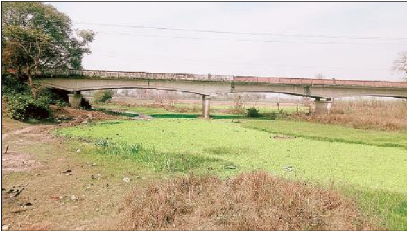
सरयू नदी पुल व जलकुभी से घिरी नदी।

व लाही की फसलें लहलहा रही हैं। कुछ तटीय क्षेत्रों में शकरकंद व मूंगफली की खेती की जा रही है। इधर, जिम्मेदार बेखबर होकर सरयू घाट का सौंदर्यकरण कराने