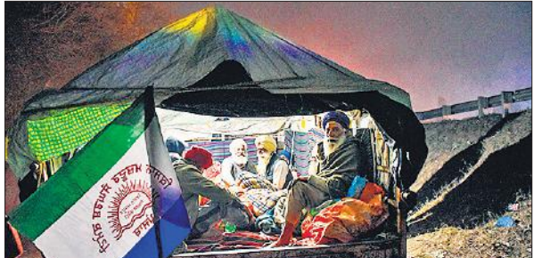
'दिल्ली कूच' के तहत अपने वाहन से हरियाणा के फतेहाबाद पहुंचे किसान ● एजेंसी

दूसरी तरफ कुछ किसान नेताओं के साथ चंडीगढ़ में केंद्र सरकार के मंत्रियों ने बैठक की, लेकिन देररात तक चली यह बैठक बेततीजा रही।