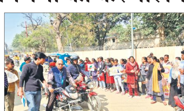
राहगीरों को सड़क सुरक्षा के प्रति जागरूक करते जीएफ कॉलेज एनएसएस छात्र।