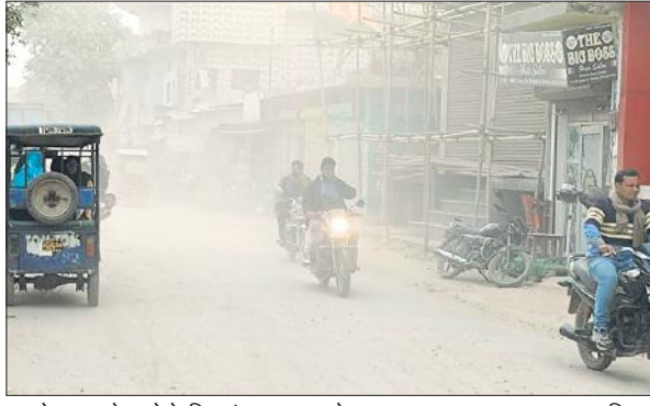
धूल के गुबार से बचने के लिए मुंह पर हाथ रखे बाइक चालक।

हैं बल्कि व्यापारी भी परेशान हैं। दुकानों के काउंटर और दुकान के बाहर खड़े वाहनों पर धूल की मोटी चादर बिछ जाती है। वहीं उड़ती धूल लोगों के फेफड़ों पर भी असर डाल रही है। इसके लिए कुछ दिन पहले व्यापारी डीएम को ज्ञापन भी सौंप चुके हैं लेकिन इसका अभी तक