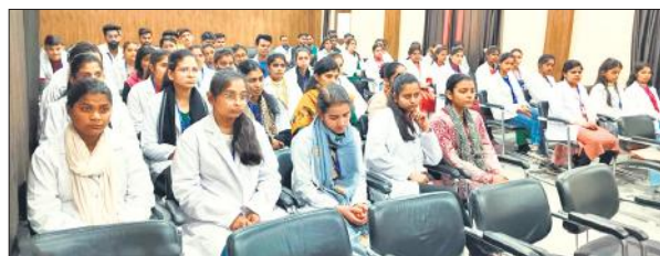
एसएस कॉलेज में वैश्विक संसाधनों के संरक्षण पर व्याख्यान सुनते विद्यार्थी।