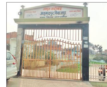
अमृत सरोवर के गेट पर लगा ग्रेनाइट पत्थर हुआ गायब।

पट्टियाँ कोई उखाड़कर ले गया। दीवारों पर दरारें पड़ गई हैं।