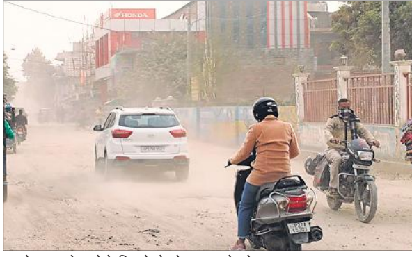
धूल के गुबार से बचने के लिए चेहरे को मफ़लर से ढके एक बाइक सवार।

अमृत विचार: शहर में सीवर लाइन बिछाई जा रही है। इसके लिए मुख्य सड़कों से लेकर गलियां तक खुदी पड़ी हैं। जहां पाइप लाइन डाली गई है, उन सड़कों को मिट्टी से पाट दिया गया है। डामरीकरण नहीं कराया गया है। इन सड़कों से धूल उड़ते निकल रहे चार पहिया वाहन दोपहिया वाहन चालकों, पैदल निकलने वालों के लिए मुसीबत बने हुए हैं। धूल से लोग सराबोर हो रहे हैं। लगातार धूल फांक रहे लोगों को उतर सता रहा है कि कहीं यह धूल उन्हें बीमार न कर दे। धूल के गुबार का सामना सबसे पहले रोडवेज बस स्टैंड से रेलवे स्टेशन की ओर जाने वाली सड़क पर होता है। यहां पर हर वक्त वाहनों का दबाव रहता है, इसलिए वाहनों से उड़ने वाली धूल से लोगों को सांस लेने में भी दिक्कत होने लगती है। इसके बाद लाल इमली चौराहे से घंटाघर की ओर जाने वाले मुख्य मार्ग पर भी दिनभर धूल उड़ती रहती है। यही हाल खिरनी