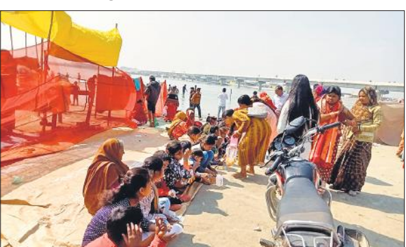
गंगातट पर कन्याभोज कराते श्रद्धालु।