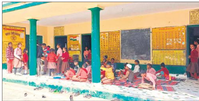
सविलियन विद्यालय महाराजनगर में शिक्षिका नदारद, बच्चे मंचा रहे धमाचौकड़ी।

अमृत विचार: बेसिक शिक्षा विभाग के परिषदीय विद्यालयों में शिक्षकों की भारी कमी है। सृजित पदों के सापेक्ष रिक्त पदों का फासला बढ़ते-बढ़ते करीब 50 फीसदी तक पहुंच गया है। कई प्राथमिक और उच्च प्राथमिक विद्यालयों में एक भी शिक्षक तैनात नहीं हैं, जिससे उन विद्यालयों में शिक्षण व्यवस्था एकदम चौपट हो गई है। कई विद्यालय ऐसे भी हैं, जो शिक्षकविहीन होने के कारण शिक्षामित्र या अनुदेशक के सहारे ही संचालित किए जा रहे हैं। वर्तमान समय में प्राथमिक विद्यालयों में करीब 4006 पद रिक्त तो वहीं उच्च प्राथमिक विद्यालयों में भी शिक्षकों के 2441 पद खाली हैं। सरकार जहां परिषदीय विद्यालयों में कायाकल्प कराने के साथ शैक्षिक गुणवत्ता का स्तर बढ़ाने को लेकर तमाम दावे कर रही है। प्रति वर्ष निपुण असेसमेंट टेस्ट (नैट) परीक्षा का आयोजन करा रही है। साथ ही