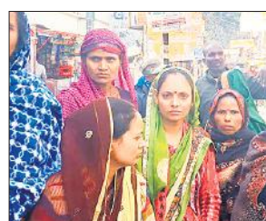
थाने में शिकायत करने पहुंची महिलाएं।

अमृत विचार : बर्तन बिक्री करने गांव आई चार महिलाओं ने सात घरों की महिलाओं को झांसे में लेकर लाखों रुपये के जेवरात उड़ा लिए। पीड़ित महिलाओं के मुताबिक आरोपी महिलाओं ने उनको सम्मोहित कर घटना को अंजाम दिया। महिलाओं से शिकायत मिलने पर सुनगढ़ी पुलिस जांच में जुटी है। थाना सुनगढ़ी क्षेत्र के गांव रूपपुर कमालू की सात परिवारों की महिलाओं ने सोमवार को थाना सुनगढ़ी पुलिस को दी तहरीर में कहा गया कि करीब दो माह से उनके गांव में चार महिलाएं बर्तन बेचने के लिए आ रही थीं जो पुराने बर्तनों को लेकर उन्हें नए बर्तन दे रही थीं। काफी दिनों से आने