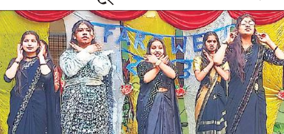
सांस्कृतिक कार्यक्रम प्रस्तुत करते गुरु नानक पाठशाला के बच्चे।