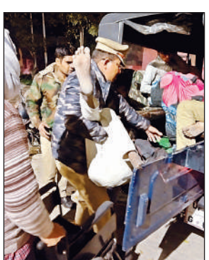
हादसे के बाद घायलों को पुलिस जीप में बैठाते कर्मचारी। अमृत विचार

अमृत विचार: वजीरगंज थाना क्षेत्र के अयोध्या-गोंडा मार्ग पर अचलपुर के पास शुकवार भोर 3:40 पर रोडवेज बस चालक के बस पर नियंत्रण खो देने से ट्रक के पीछे टकरा गई, जिससे बस चालक समेत पांच सवार घायल हो गए। जिनका इलाज जिले के मेडिकल कॉलेज में हो रहा है। बस चालक की इलाज के दौरान मौत हो गयी। अयोध्या से गोंडा का रही गोंडा डिपो की बस थाना क्षेत्र के अचलपुर के पास अचानक अनियंत्रित होकर ट्रक की पीछे