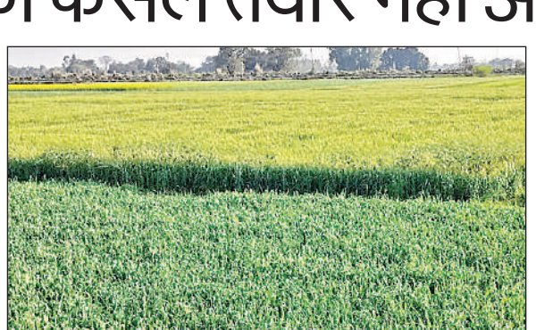
खेतों में पकने के करीब गेहूं की फसल। अमृत विचार

अमृत विचार: गेहूं की बालियां अभी पकी नहीं हैं, महकमा क्रय केंद्र खोल गेहूं खरीदने में लग गया है। खरीदे गए धान अभी भी क्रय केंद्रों पर डंप पड़े हुए हैं। फिर भी शासन के निर्देश पर महकमा 61 क्रय केंद्र खोल गेहूं खरीद में जुट गया है। बीते वर्ष महकमा गेहूं की खरीद 1 अप्रैल से शुरू की थी। गेहूं की अधिक खरीद न होने के चलते इस वर्ष शासन ने 15 मार्च से गेहूं खरीद का निर्णय लिया था, लेकिन शासन के निर्देश पर गेहूं खरीद 1 मार्च से ही शुरू कर दिया गया