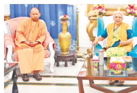
राज्यपाल आनंदीबेन से मुलाकात करने पहुंचे मुख्यमंत्री योगी।

अमृत विचार : लोकसभा चुनाव-24 में प्रदेश की सभी 80 सीटों में से भाजपा सहयोगी दलों के लिए छह सीट छोड़ सकती है। इसमें राष्ट्रीय लोकदल को दो सीटें मिल सकती हैं, जबकि अपना दल (एस) भी दो सीटों पर चुनाव लड़ सकती है। वहीं, निषाद पार्टी को संत कबीर नगर सीट और ओम प्रकाश राजभर की सुभासपा को घोसी सीट मिल सकती है।