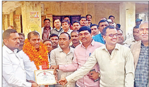
निर्वाचित पदाधिकारी और कार्यकर्ता।

में जनपद के सांसद, विधायक अपने-अपने क्षेत्र के अन्नपूर्णा दुकानों का अनावरण करेंगे। इसके बाद इन गांव में खाद्यान्न का वितरण अन्नपूर्णा भवन से ही किया जाएगा।