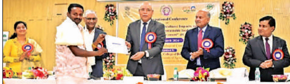
संगोष्ठी में उत्कृष्ट किसानों को सम्मानित करते कुलपति व नाबार्ड के अधिकारी।

वो विश्वविद्यालय के सामुदायिक विज्ञान प्रेक्षागृह में जलवायु परिवर्तन एवं कृषि में प्रभाव विषय पर दो दिवसीय अंतरराष्ट्रीय संगोष्ठी के शुभारंभ अवसर पर उपस्थित लोगों