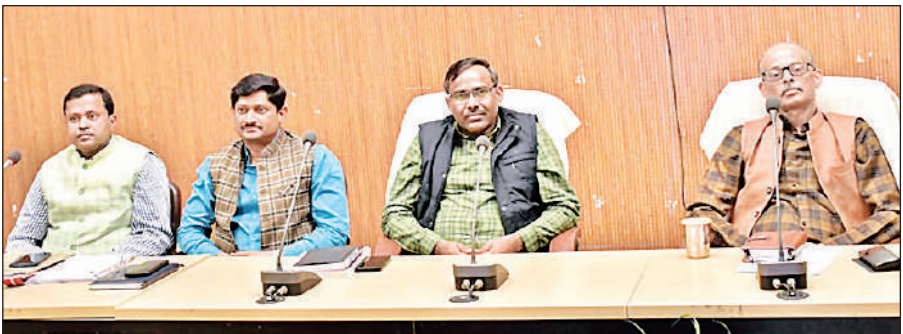
कलेक्ट्रेट सभागार में वय अनुवीक्षण समिति से संबंधित प्रशिक्षण कार्यक्रम में मौजूद अधिकारी।

जानकारी पूर्वोत्तर रेलवे के मुख्य जन संपर्क अधिकारी पंकज कुमार सिंह ने दी है।