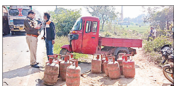
एलपीजी वाहन की टोकर से पलटा सिलिंडर से लदाई-रिक्शा। अमृत विचार

अमृत विचार: सुलतानपुर-वाराणसी हाइवे पर स्थित कोतवाली देहात के बगल ईट भट्टे के पास शुक्रवार को अनियंत्रित बोलरो वाहन एलपीजी गैस लदे टैंपो को टक्कर मारकर पलट गयी। जिसकी चपेट में आकर पीआरडी जवान सहित नौ लोग घायल हो गये। सुलतानपुर-वाराणसी हाइवे पर शुक्रवार की सुबह साढ़े 10 बजे कोतवाली देहात के बगल स्थित ईट भट्टा के सामने वाराणसी की ओर जा रही बोलरो वाहन सामने से आ रही एलपीजी गैस लदे टैंपो को टक्कर मारकर सड़क किनारे गड़्डे में पलट