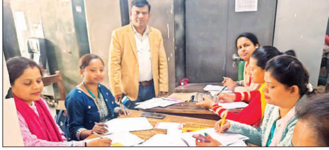
जिला विद्यालय निरीक्षक कार्यालय में स्थापित कंट्रोल रूम से निगरानी करती शिक्षिकाएं।

मामला जनता इंटर कॉलेज जयसिंह मऊ से जुड़ा हुआ है। जिला विद्यालय निरीक्षक द्वारा जारी कारण बताओ नोटिस