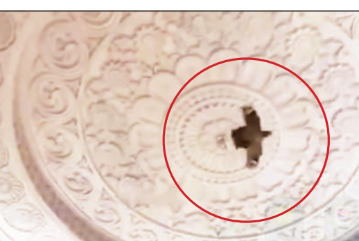
वायरल वीडियो का स्क्रीनशॉट (लाल घेरे में पक्षी)।

अमृत विचार : रामलला के गर्भगृह में एक पक्षी के उड़ने का वीडियो वायरल हो रहा है। सोशल मीडिया के सभी प्लेटफॉर्म पर इसके वायरल होते ही लोग इसे आस्था से जोड़कर देख रहे हैं। परिक्रमा कर रहे पक्षी को लोग गरुड़ देव बता वायरल कर रहे हैं। रामलला के भव्य मंदिर में विराजमान होने के बाद कई ऐसे दृश्य सामने आ रहे हैं, जिसे देख लोग आश्चर्य मानने के साथ ही उसे वायरल भी कर रहे हैं। अभी कुछ दिन पहले हनुमान जी के स्वरूप माने जाने वाले बंदर के रामलला के दर्शन का वीडियो वायरल हुआ था। उस वीडियो