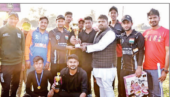
क्रिकेट टूर्नामेंट जीतने के बाद कप ग्रहण करते खिलाड़ी। अमृत विचार

फाइनल मुकाबला राज स्पोर्ट निंदूरा और बालपुर की टीम के बीच हुआ। जिसमें बालपुर की टीम ने टॉस जीतकर पहले बल्लेबाजी करते हुए 160 रन का