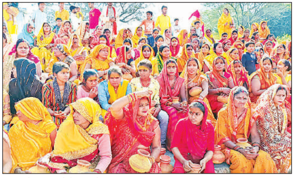
कलश में जल भरने के लिए तैयार महिलाएं। अमृत विचार

अमृत विचार: श्री नवचंडी महायज्ञ व संगीतमय रामकथा का आयोजन पंडरी कृपाल ग्राम सभा के काली माता मंदिर पर जय मां काली सेवा समिति द्वारा किया जा रहा है। कथा के प्रथम दिन गांव की महिला व पुरुष श्रद्धालुओं द्वारा कलश यात्रा निकाली गई। यात्रा यज्ञ साल से शुरू हुई जो सुभाग पुर स्थित च्यवन मुनि आश्रम के पोखर से जल भरकर वापस आए। यज्ञ का आयोजन विगत कई वर्षों से किया जा रहा है। अयोध्या से आए संतो द्वारा यज्ञशाला में पूजा अर्चना किया जा रहा है। यज्ञ धीश की भूमिका में