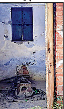
राजकीय नलकूप की खराब मोटर।

वर्तमान में किसान गेहूं आदि की सिंचाई के लिए भटक रहे हैं। उन्हें समय से सरयू नहर से पानी नहीं मिल रहा है। राजकीय नलकूप तकनीकी खामियों से खराब हैं। ऐसे में किसानों को भारी दिक्कत पेश