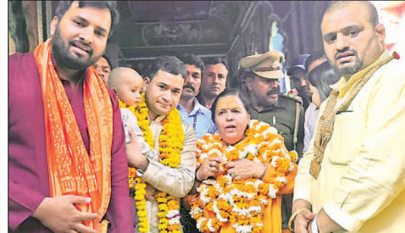
रामलला व हनुमानगढ़ी का दर्शन कर लौटती पूर्व केंद्रीय मंत्री उमा भारती।

अमृत विचार : अयोध्या में भव्य राम मंदिर निर्माण का कार्य पूरा हो रहा है। अब काशी और मथुरा में मंदिर निर्माण का इंतजार भी जल्द खत्म होगा। यह बातें पूर्व केंद्रीय मंत्री व रामजन्मभूमि मंदिर आंदोलन में अहम भूमिका निभाने वाली साध्वी उमा भारती ने कहीं। वे शुकवार को यहां दर्शन-पूजन के लिए पहुंची थीं। उन्होंने रामजन्मभूमि मंदिर के अलावा हनुमानगढ़ी व कनक भवन में भी दर्शन किया। काशी और मथुरा के मामले पर उन्होंने कहा कि इसकी सुनवाई कोर्ट में है। लेकिन मथुरा और काशी में मंदिर बनना बहुत जरूरी है। मेरी आस्था मेरे दिल में है। इस दौरान उन्होंने कांग्रेस और सपा पर कटाक्ष किया। उन्होंने कहा कि विपक्ष ने कभी भी अपनी पूर्ण जिम्मेदारी नहीं निभाई है। विपक्ष