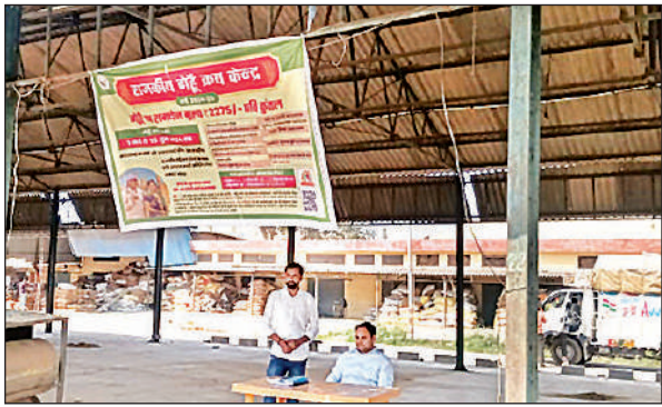
मंडी स्थल पर लगा गेहूं क्रय केंद्र का कोटा।

हालांकि अभी गेहूं खरीद की तैयारी आधा अधूरी है। बड़ी मुश्किल से क्रय केंद्र पर बैनर लगाए जा सके हैं। जिले में अभी गेहूं की फसल तैयार भी नहीं है।