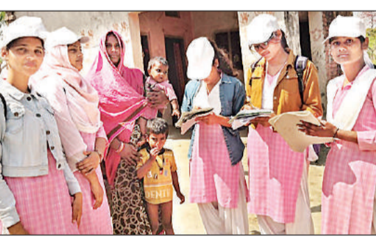
ग्रामीणों को जागरूक करते राष्ट्रीय सेवा योजना के स्वयं सेवक।