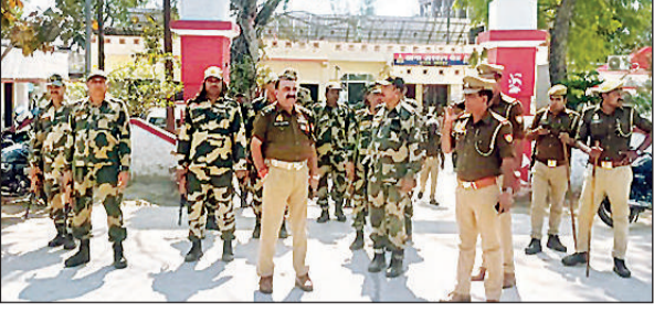
लखनऊ-बहराइच मार्ग पर फ्लैग मार्च करते पुलिस व केंद्रीय टीम के जवान।