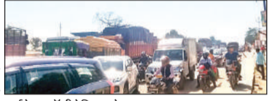
हाईवे पर पॉलीटेक्निक के पास जाम लगा।

अमृत विचार: लखनऊ-गोरखपुर हाईवे पर पालीटेक्निक के पास रविवार को लंबा जाम लगा।