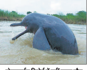
● पोस्टमार्टम रिपोर्ट में नहीं खुला मौत का राज तो किया था विसरा सुरक्षित