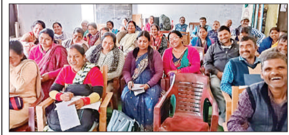
ब्लॉक संसाधन केंद्र में मौजूद शिक्षक।