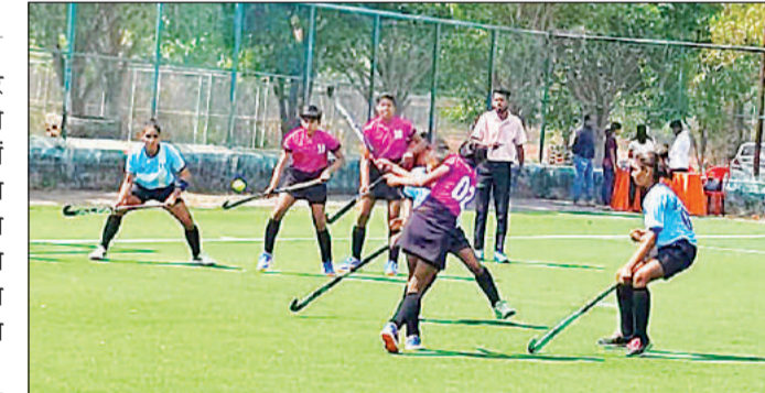
गोल के लिए संघर्ष करती स्पोर्ट्स कॉलेज व वाराणसी की टीमें।