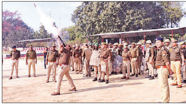
दंगा नियंत्रण अभ्यास के दौरान आंसू गैस का गोला दागता पुलिसकर्मी।

आगामी लोक सभा चुनाव एवं त्योहारों के दृष्टिगत जनपद में कानून एवं शान्ति व्यवस्था सुदृढ़ रखने तथा आकस्मिक