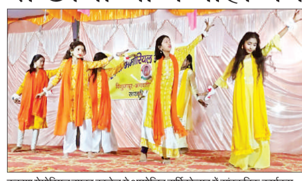
करुणा मेमोरियल इण्टर कालेज में आयोजित वार्षिकोत्सव में सांस्कृतिक कार्यक्रम प्रस्तुत करती छात्राएं।