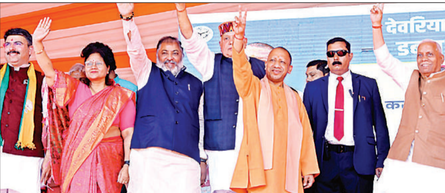
रविवार को गोरखपुर, देवरिया व कुशीनगर में अरबों रुपये की विकास योजनाओं के लोकार्पण व शिलान्यास के दौरान मुख्यमंत्री योगी आदित्यनाथ, मंत्री सुर्य प्रताप शाही, मंत्री दया शंकर सिंह, मंत्री विजय लक्ष्मी गौतम, साथ में अन्य।

मुख्यमंत्री ने गोरखपुर नगर निगम की 482 करोड़ रुपये की 253 विकास परियोजनाओं, देवरिया को 679 करोड़ रुपये की 673 विकास परियोजनाओं और कुशीनगर में 2,134 करोड़ की 483 विकास परियोजनाओं का लोकार्पण और शिलान्यास कार्यक्रमों को संबोधित करते हुए कहा कि सरकार 50 साल की गारंटी वाली सड़कें बनवा रही है। गोरखपुर शहर की सुंदरता में रामगढ़ताल की चर्चा करते हुए कहा कि जो रामगढ़ताल 7 साल