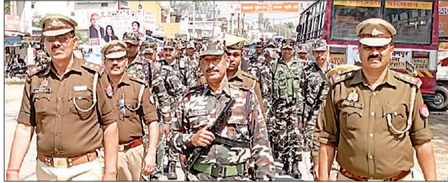
इटियाथोक करबे में मार्च करते पैरामिलिट्री के जवान व स्थानीय पुलिस। अमृत विचार