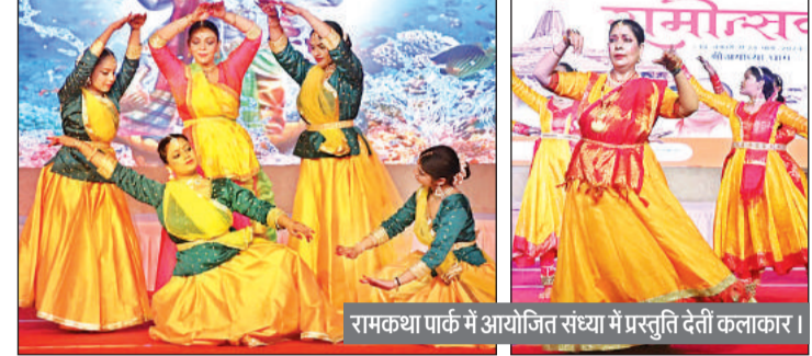
रामकथा पार्क में आयोजित संध्या में प्रस्तुति देती कलाकार।