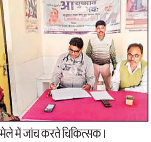
स्वास्थ्य मेले में जांच करते चिकित्सक।