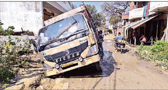
नगर पंचायत में खराब सड़क में अनियंत्रित हुई डीसीएम। अमृत विचार

अमृत विचार : जल जीवन मिशन योजना के अंतर्गत हर घर जल पहुंचाने के लिए करोड़ों की लागत से बनी सड़कें गड्ढों में तब्दील हो रही हैं। इस ज्वलंत समस्या से जहां जिम्मेदार अंजान बने हैं वहीं गड्ढा युक्त सड़कों पर गिरकर आये दिन लोग चोटिल हो रहे हैं। सड़कों को