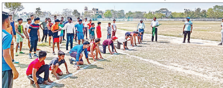
खेल प्रतियोगिता में भाग लेते खिलाड़ी।