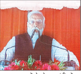
लाइव प्रसारण में बोलते प्रधानमंत्री नरेंद्र मोदी।

जिले के रामगांव क्षेत्र में रविवार को आयोजित कार्यक्रम का लाइव प्रसारण आयोजित हुआ। जिले की 164.729 करोड़ रुपये की लागत से 29 सड़क परियोजनाओं जिसकी लम्बाई 200.92 किमी का लोकार्पण हुआ। मुख्य विकास अधिकारी राम्या आर ने बताया कि