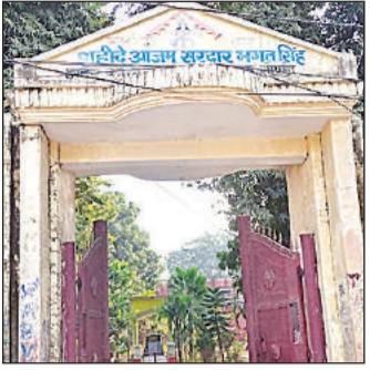
मूल्यांकन केंद्र। अमृत विचार

अमृत विचार: हाई स्कूल में इंटरमीडिएट की परीक्षाएं खत्म हो चुकी हैं और मूल्यांकन की तैयारी शुरू कर दी गई है। 16 मार्च से मूल्यांकन कार्य प्रारंभ किया जाएगा। इसके लिए जिले के चार स्कूलों को मूल्यांकन केंद्र बनाया गया है। उत्तर पुस्तिकाओं के मूल्यांकन को लेकर माध्यमिक शिक्षा परिषद के सचिव की तरफ से गाइडलाइन जारी कर दी गई है। इस गाइडलाइन के मुताबिक मूल्यांकन कार्य में लगाए गए परीक्षकों को मूल्यांकन के लिए निर्धारित समय से आधे घंटे पहले केंद्रों पर पहुंचना होगा। उन्हें छुट्टी भी आधे घंटे बाद दी जाएगी। यह बदलाव परीक्षा की गोपनीयता को बनाए रखने के लिए किया गया है।