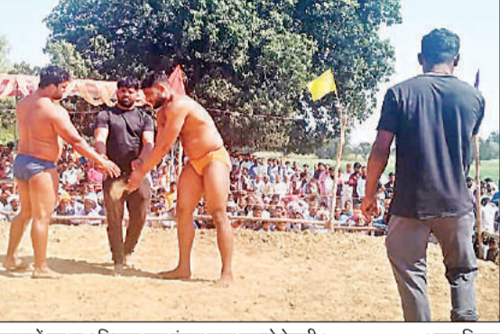
पहलवानों का हाथ मिलवा कर दंगल शुरू कराते रेफरी।