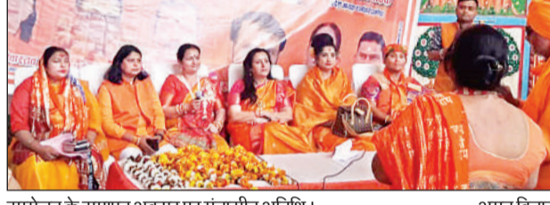
सम्मेलन के समापन अवसर पर मंचासीन अतिथि।