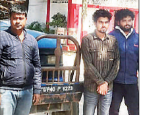
पुलिस ने की गिरफ्त में आरोपी चोर।