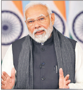
महिलाओं को एक हजार रुपये की मासिक सहायता दी जाएगी। प्रधानमंत्री मोदी ने वाराणसी से रिमोट दबाकर इस योजना की शुरुआत की और 70 लाख से अधिक महिलाओं के बैंक खातों में 655 करोड़ रुपये की राशि का अंतरण किया। उन्होंने योजना की शुरुआत करते हुए कहा, 'छत्तीसगढ़ की माताओं-बहनों को

प्रधानमंत्री नरेंद्र मोदी ने रविवार को छत्तीसगढ़ में महिलाओं को आर्थिक सहायता प्रदान करने के लिए 'महतारी वंदन' योजना की शुरुआत करते हुए कहा कि राज्य की 'डबल इंजन' सरकार (केंद्र और राज्य में भारतीय जनता पार्टी (भाजपा) की सरकार) की प्राथमिकता महिलाओं का कल्याण है। प्रधानमंत्री मोदी ने समारोह को डिजिटल तरीके से संबोधित करते हुए कहा कि उनकी सरकार ने देश में तीन करोड़ महिलाओं को 'लखपति दीदी' बनाने का संकल्प लिया है। मोदी ने रविवार को छत्तीसगढ़ में 'महतारी वंदन योजना' का डिजिटल तरीके से उद्घाटन किया। इस योजना के तहत पात्र विवाहित