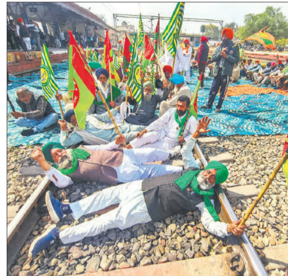
रेल रोको आंदोलन के दौरान प्रदर्शन करते किसान।