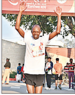
मैराथन में विदेशी धावकों ने भी प्रतिभाग किया।