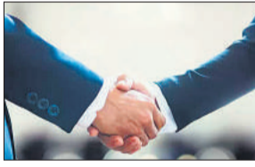
अरब डॉलर के निवेश की प्रतिबद्धता जताई है। यूरोपीय मुक्त व्यापार संघ (ईएफटीए) के सदस्य देशों में आइसलैंड, लीश्टेंस्टीन, नॉर्वे और स्विट्जरलैंड शामिल हैं।

भारत और चार देशों के यूरोपीय समूह ईएफटीए ने निवेश और वस्तुओं एवं सेवाओं के दोतरफा व्यापार को बढ़ावा देने के लिए रविवार को एक मुक्त व्यापार समझौते (एफटीए) पर हस्ताक्षर किए। एफटीए के तहत ईएफटीए ने अगले 15 साल में भारत में 100 अरब डॉलर के निवेश की प्रतिबद्धता जताई है।