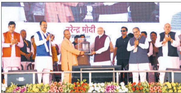
आजमगढ़ में जनसभा के दौरान प्रधानमंत्री को प्रतीक चिन्ह देते मुख्यमंत्री योगी।

अमृत विचार : प्रधानमंत्री नरेंद्र मोदी ने प्रदेश में अपने दौर के दूसरे दिन रविवार को आजमगढ़ से प्रदेश में पांच नए एयरपोर्ट और लखनऊ के चौधरी चरण सिंह इंटरनेशनल एयरपोर्ट के नवीन टर्मिनल का लोकार्पण करते हुए ईडी गठबंधन को जातिवाद, परिवारवाद, भ्रष्टाचार, माफियाराज, तुष्टिकरण और कट्टरपंथ का पोषक ठहराया। कहा कि अब उप्र. से माफियाराज और कट्टरपंथ खत्म हो गया है। मुख्यमंत्री योगी की तारीफ करते कहा कि उत्तर प्रदेश पहले देश की राजनीति तय करता था, अब विकास की दिशा भी तय कर रहा है।