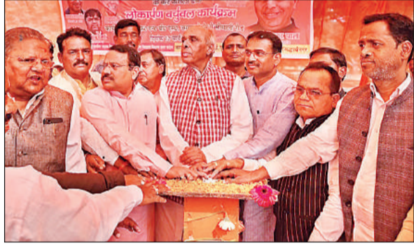
जिले में आयोजित कार्यक्रम में मौजूद सांसद जगदंबिका पाल व अन्य जनप्रतिनिधि।

नगर पंचायत अंतर्गत उसका-सोहांस मार्ग के किनारे तेरती गांव के बागीचे में आयोजित कार्यक्रम में लोगों ने प्रधानमंत्री के भाषण को एलईडी स्क्रीन के माध्यम से देखा व सुना। कार्यक्रम में मौजूद सांसद जगदंबिका पाल ने कहा कि केंद्र एवं प्रदेश सरकार द्वारा विकास के लिए