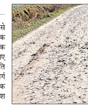
सोनहरा गांव के लिए जाने वाली जर्जर सड़क। अमृत विचार

अमृत विचार: लखनऊ हाईवे से सोनहरा गांव जाने वाली टूटी सड़क दुर्घटना को दावत दे रही है। सड़क पर बने बड़े बड़े गड्डे राहगीरों के लिए मुसीबत बने हैं। संपर्क मार्ग की स्थिति इस कदर जर्जर हो चुकी है कि इस मार्ग से गुजरना मुश्किल हो गया है। सड़क की मरम्मत न होने से लोगों में आक्रोश पनप रहा है। बालपुर क्षेत्र के सोनहरा गांव जाने वाले संपर्क मार्ग की निर्माण करीब 10 साल पहले कराया गया था। ग्रामीणों का कहना है कि निर्माण के कुछ दिनों बाद ही यह सड़क टूटने लगी थी। क्षेत्र के