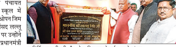
नवनिर्मित चहारदीवारी और ओपन जिम का लोकार्पण करते सांसद।