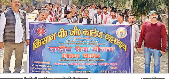
जागरूकता रैली में शामिल एनसीसी कैडेट्स।