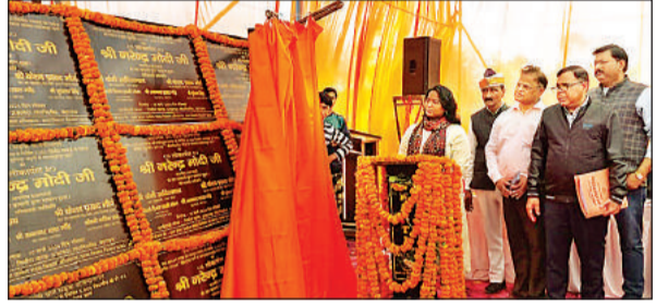
बहराइच में लोकार्पण कार्यक्रम में मौजूद अधिकारी।