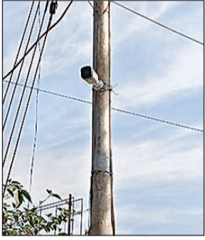
मंडी परिसर में लगा सीसीटीवी कैमरा।

गेट समेत परिसर में लगाए गए हैं आठ सीसीटीवी कैमरे