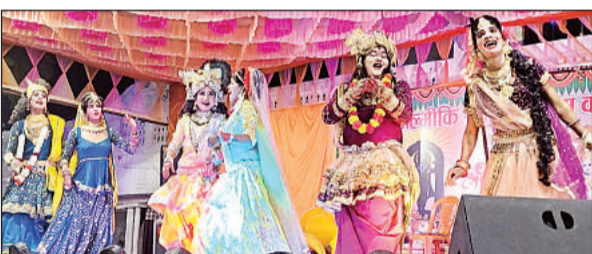
कथा समापन के बाद कार्यक्रम प्रस्तुत करते कलाकार। अमृत विचार