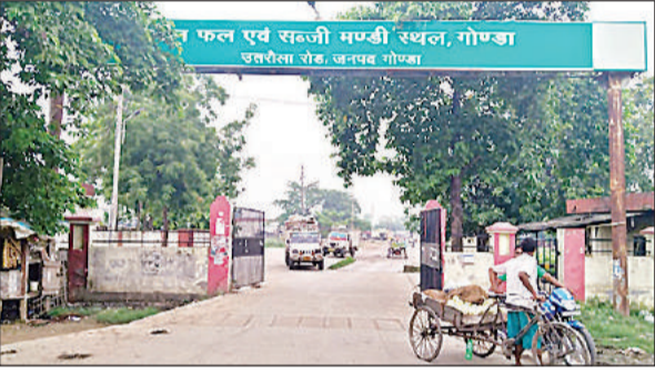
उत्तरोला रोड स्थित फल और सब्जी मंडी का गेट। अमृत विचार

साफ-सफाई न होने से व्यापारियों में आक्रोश सब्जी एवं फल मंडी परिसर को भले ही हाईटेक कर दिया गया हो लेकिन सफाई व्यवस्था युस्त दुरुस्त नहीं है। परिसर के अंदर जाने वाली सड़के किनारे कचरे का ढेर लगा है। व्यापारियों ने कई बार साफ-सफाई को लेकर मंडी प्रशासन से गुहार भी लगाई, लेकिन हर बार आश्वासन ही अधिकारियों ने दिया।