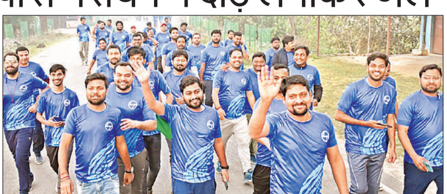
जल संरक्षण के लिए जागरूकता को लेकर मैराथन में प्रतिभाग करते युवा। अमृत विचार

जल संरक्षण के संदेश को जन-जन तक पहुंचाने के उद्देश्य रविवार को पांच किलोमीटर जागरूकता मैराथन वाटर फॉर पीस का आयोजन किया गया। मैराथन की शुरुआत रघुकुल विद्यापीठ के पास से की गई। यह