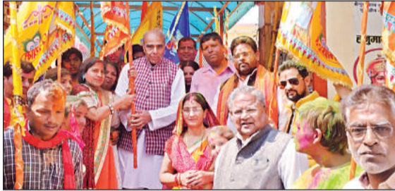
टूलकिट वितरण कार्यक्रम में मौजूद सांसद व लाभार्थी।