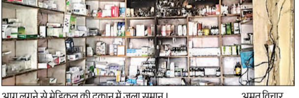
आग लगने से मेडिकल की दुकान में जला समान।