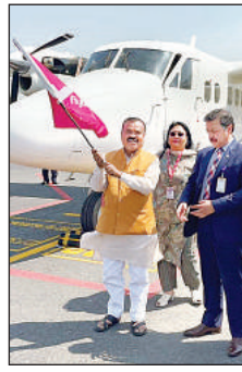
विधायक ने विमान को हरी झंडी दिखाकर किया रवाना। अमृत विचार

जिसके तहत आज श्रावस्ती एयरपोर्ट से जनपद लखनऊ के लिए 19 सीटर विमान से हवाई सेवा का