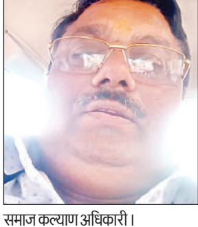
समाज कल्याण अधिकारी।

एकड़ जमीन है। इस सरकारी जमीन पर कुछ भू माफियाओं की नजर गड़ गई है। जिसके चलते ग्रामीणों के सहारे अन्य लोग इस