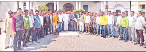
मंडलायुक्त कार्यालय में ज्ञापन देते पांच गांवों के किसान।

अमृत विचार : एयरो सिटी योजना को लेकर आन्दोलित किसानों के तेवर नर्म नहीं पड़ रहे हैं। अयोध्या विकास प्राधिकरण की इस योजना को लेकर बीते दस दिनों से मुखर किसानों ने मंगलवार को मुख्यालय का रुख कर लिया। पांच गांवों के यह किसान बड़ी संख्या में दोपहर मुख्यालय पहुंचे और मंडलायुक्त कार्यालय, कलेक्ट्रेट और सदर तहसील तीनों जगह पहुंचे। किसानों के मुख्यालय कूच को लेकर जिला प्रशासन भी एलर्ट मोड में रहा।