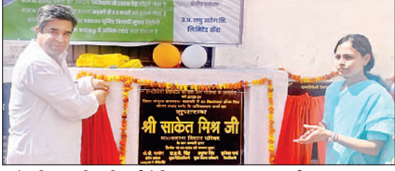
साकेत मिश्रा एवं जिलाधिकारी ने शिलापट्ट का अनावरण कर की शुरुआत।

अमृत विचार : सीएसआर योजना के अन्तर्गत वर्ष 2023-24 के तहत संयुक्त जिला चिकित्सालय भिनगा में 40 किलोवाट ऑफ ग्रिड सोलर पावर प्लांट के अधिष्ठापन कार्य का शुभारम्भ किया गया। जिसका माननीय सदस्य विधान विधान परिषद साकेत मिश्रा एवं जिलाधिकारी कृतिका शर्मा ने शिलापट्ट का अनावरण कर शुभारम्भ किया। इस योजना के तहत संयुक्त जिला चिकित्सालय में 40 किलोवाट आफ ग्रिड सालर पावर प्लांट, सामुदायिक स्वास्थ्य केन्द्र मल्होपुर में 20 किलोवाट, सामुदायिक