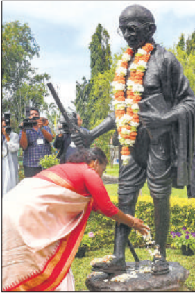
ऐतिहासिक दांडी मार्च की वर्षगांठ पर राष्ट्रपिता महात्मा गांधी को श्रद्धांजलि अर्पित करती राष्ट्रपति मुर्मू।

इस दौरान उन्होंने घोषणा की कि भारत सरकार पवित्र गंगा तालाब परिसर का धार्मिक, सांस्कृतिक और पर्यटक केंद्र के रूप में पुनर्विकास करने में मॉरीशस सरकार की मदद करेगी। वह तीन दिवसीय मॉरीशस की राजकीय यात्रा पर हैं। राष्ट्रपति द्रौपदी मुर्मू मंगलवार को मॉरीशस के 56वें राष्ट्रीय दिवस समारोह में मुख्य अतिथि के रूप में शामिल