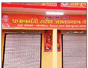
अन्नपूर्णा भवन। अमृत विचार

बनकर तैयार हुए अन्नपूर्णा भवन से मार्च माह में खाद्यान्न वितरण किया जाएगा। जनपद में 44 अन्नपूर्णा भवन बनकर तैयार हो गए हैं। जिनका लोकार्पण मुख्यमंत्री ने वचुआल किया था अब यह लाभार्थियों के लिए सौंप दिए गए हैं। जिले में 75 अन्नपूर्णा भवन बनने हैं, जिनमें से 44 बनकर तैयार हो गए हैं। विकासखंड झंझरी के रामनगर तरहर में बना अन्नपूर्णा भवन लोकार्पण के लिए मुख्यमंत्री द्वारा किया गया। विकासखंड झंझरी के रामनगर तरहर, चक्सड रुपईडीहा के बिछुड़ी, बेलवाभान बहली जोत मुजेना विकासखंड में