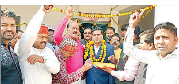
चालक और गाँव का माला पहनाकर सम्मान करते लोग।

परसपुर, गोंडा: नगर के राजपुर मुहल्ले में स्थित प्राचीनतम श्री शिव मंदिर जीर्णोद्धार उपरांत महाशिवरात्रि पर्व को ॐ नमः शिवाय जाप व पूजा आराधना कार्यक्रम आयोजित हुआ। जिसके बाद मंगलवार को परसपुर कस्बा में डीजे बाजे के साथ धूम पूर्वक प्रतिभा झाँकी शोभायात्रा निकाली गई। जिसमें आसपास के सैकड़ों महिला पुरुष व बच्चों ने अवीर गुलाल उड़ते हुए हर्षोल्लास पूर्वक प्रतिभाग किया। डीजे, ढोल, ताशा, डमरू, शंखनाद ध्वनि पर स्थितके पाँव श्रद्धालु आगे बढ़े। राजपुर मुहल्ला से प्रारंभ शोभायात्रा आटा हनुमान गढ़ी, ब्रह्मदेव मन्दिर, श्रीराम जानकी मंदिर, राजमन्दिर समेत विभिन्न स्थलों पर स्पर्श