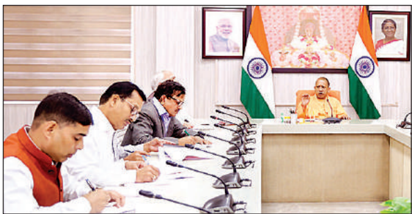
समीक्षा बैठक के दौरान मुख्यमंत्री योगी और अधिकारी।

अमृत विचार: मुख्यमंत्री योगी आदित्यनाथ ने मंगलवार को एक उच्चस्तरीय बैठक में जल जीवन मिशन की प्रगति की समीक्षा की और आवश्यक दिशा-निर्देश दिए। इस दौरान मुख्यमंत्री ने कहा, पेयजल परियोजना के कारण जगह-जगह रोड की खुदाई हुई है। इससे आवागमन प्रभावित हो रहा है, दुर्घटना की आशंका भी बनी हुई है। कार्यदायी संस्था की यह जिम्मेदारी है कि कार्य समाप्त के साथ ही सड़क को मरम्मत हो जाए। पेयजल परियोजना के कारण सड़क खराब न रहे। यदि ऐसा हुआ तो जवाबदेही तय की जाए। मुख्यमंत्री ने बताया कि प्रधानमंत्री नरेंद्र मोदी के मार्गदर्शन