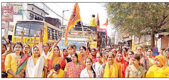
शोभायात्रा में शामिल महिलाएं।