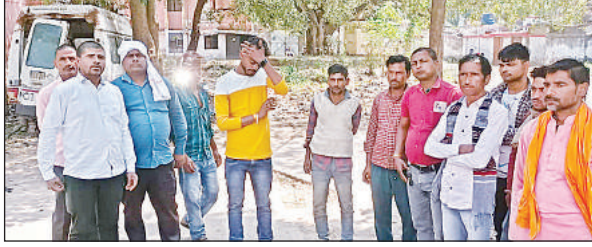
सड़क हादसे में दो लोगों की मौत के बाद गमगीन परिवार के लोग। अमृत विचार

हरदी थाने के बहराइच सीतापुर हाईवे के रमपुरवा चौकी के पास सोमवार रात लगभग 11 बजे तेज रफ्तार वाहन ने बाइक में टक्कर मार दी। जिसके चलते बाइक