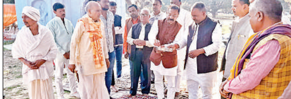
भूमि पूजन करते विधायक और अन्य।