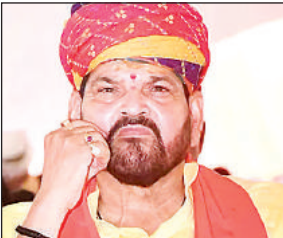
सांसद बृजभूषण शरण सिंह।

अमृत विचार: 34 वर्ष की राजनीति में कई झटके पर बुलंदियों की सीढ़ी चढ़ने वाले बृजभूषण शरण सिंह को आखिर कहाँ से मिलती है इतनी ऊर्जा? हर व्यक्ति जानने की कोशिश कर रहा है। उतार-चढ़ाव, विरोधियों से टकराव तथा किसी आफत से निपटने की कला ही बृजभूषण शरण सिंह को देवीपाटन मंडल का सूरमा बनाती है। भाजपा 34 वर्ष की राजनीति में 29 साल भाजपा की डोर ही पकड़ कर चलने वाले बृजभूषण शरण सिंह के टिकट कटने या मिलने के कयास लगाए जा रहे हैं। कोई विकास का दुष्मन कहता है तो कोई उन्हें युवाओं का