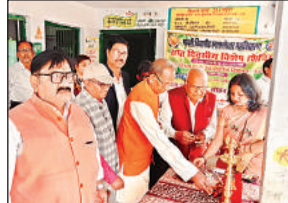
एनएसएस शिविर का शुभारंभ करते मुख्य अतिथि। अमृत विचार

राष्ट्रीय सेवा योजना की स्वयंसेविकाओं के द्वारा स्वागत गीत