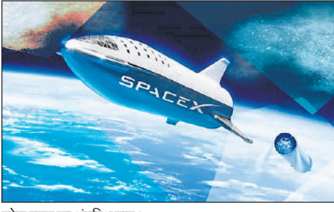
स्पेस एक्स का अंतरिक्ष यान।

लिहाजा संचालकों को सावधानी बरतनी बेहद जरूरी है। स्पेस टूरिज्म का सपना शायद सदियों पुराना रहा हो, लेकिन इसने वर्ष 2020 से जोर पकड़ा है। बेहद जोखिमभरा पर्यटन होने के बावजूद वर्तमान में दुनिया के हजारों लोग इस पर्यटन का आनंद लेना चाहते हैं। मगर इस पर्यटन में अंतरिक्ष मौसम विकिरण बड़ा जोखिम हो सकता है। इससे