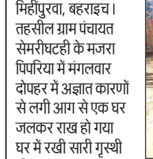
आग लगने से मकान हुआ राख। अमृत विचार

मिहौपुरवा, बहराइच। तहसील ग्राम पंचायत सेमरी घटही के मजरा पिपरिया में मंगलवार दोपहर में अज्ञात कारणों से लगी आग से एक घर जलकर राख हो गया घर में रखी सारी गुस्थी भी जलकर नष्ट हो गई। मौके पर पहुंचे ग्राम