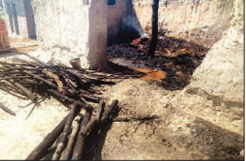
अज्ञात कारणों से लगी आग से एक घर जलकर राख हो गया घर में रखी सारी गुस्थी भी जलकर नष्ट हो गई।

मिहौपुरवा, बहराइच। तहसील ग्राम पंचायत सेमरी घटही के मजरा पिपरिया में मंगलवार दोपहर में अज्ञात कारणों से लगी आग से एक घर जलकर राख हो गया घर में रखी सारी गुस्थी भी जलकर नष्ट हो गई। मौके पर पहुंचे ग्राम