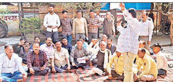
धरने पर बैठे पालिका कर्मचारी।

अधिकारी कार्यालय में ही बैठे ठेकेदारों से से एक पंजीकृत फर्म के ठेकेदार ने निर्माण लिपिक को झापड़ मारने की धमकी दी थी। इस घटना से आक्रांशित कर्मचारियों ने अध्यक्ष से मिलकर आरोपी के विरुद्ध कार्रवाई की मांग की थी। अध्यक्ष के आश्रसन के बाद