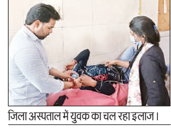
जिला अस्पताल में युवक का चल रहा इलाज।

बहराइच, अमृत विचार : लखनऊ के केसरबाग से बहराइच आ रही रोडवेज बस में एक यात्री जहर खुरानी गिरोह का शिकार हो गया। जिला मुख्यालय पहुंचने पर बस के चालक और परिचालक ने यात्री को बेहोश देखा। इस पर उसे मेडिकल कॉलेज में भर्ती कराया, उसका इलाज चल रहा