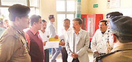
राजकीय इंजीनियरिंग कॉलेज में मतगणना स्थल का निरीक्षण करते मंडलायुक्त, आईजी व साथ में जिलाधिकारी व एसपी।