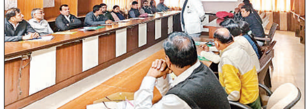
सीएमओ सभागार में आयोजित कार्यशाला को संबोधित करते अधिकारी।

अमृत विचार : कुत्ता, बंदर, बिल्ली या अन्य स्तनधारी जानवरों के काटने से रैबीज होने का खतरा रहता है। इससे बचने के लिए जानवर काटने वाले दिन ही एन्टी रैबीज का टीका लगवाना चाहिए। अभी तक यह टीके जिला मुख्यालय सहित ब्लॉक सीएचसी पर ही लगते थे। लेकिन अब इसकी सुविधा जनपद के सभी प्राथमिक स्वास्थ्य केंद्रों पर भी की गयी है। यहां प्रतिदिन टीके उपलब्ध रहेंगे।