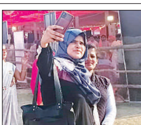
सेलफी लेती मुस्लिम महिला।

शहर के सरदार भगत सिंह इंटर कॉलेज ग्राउंड पर आयोजित कार्यक्रम में मुख्यमंत्री ने बटन दबाकर 1189 करोड़ रुपये की परियोजनाओं का लोकार्पण तथा