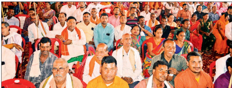
जनसभा में मौजूद लोगों की भीड़।

अमृत विचार: विकसित भारत के लिए विकसित उत्तर प्रदेश और विकसित उत्तर प्रदेश के लिए विकसित अयोध्या जरूरी है। अब सूर्यवंश की राजधानी अयोध्या भगवान सूर्य की रोशनी से प्रकाशित होगी। अयोध्या देश की पहली सोलर सिटी बन गई है। ये बातें मुख्यमंत्री योगी आदित्यनाथ ने गुरुवार को कहीं। वह राजकीय इंटर कॉलेज के प्रांगण में कृषि मेला और प्रदर्शनी के समापन अवसर पर जनसभा को संबोधित कर रहे थे। इस मौके पर उन्होंने 1090 करोड़ की 411 परियोजनाओं का लोकार्पण व शिलान्यास करते हुए कहा कि इसमें सबसे बड़ी परियोजना सोलर सिटी है। 40 किलोवाट के सोलर प्लांट के उद्घाटन और इतनी ही क्षमता के सोलर प्लांट का शिलान्यास करते हुए कहा कि सूर्य वंश की राजधानी अयोध्या अब यह भगवान सूर्य की ही रोशनी से प्रकाशित होगी। अयोध्या देश की पहली सोलर सिटी बन गई। इससे पहले अपने संबोधन में