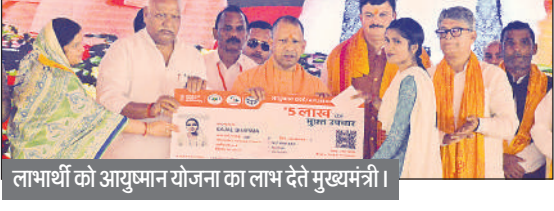
लाभार्थी को आयुष्मान योजना का लाभ देते मुख्यमंत्री।