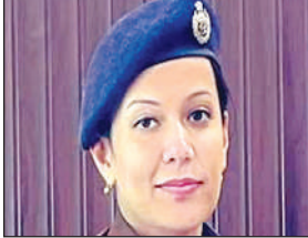
पुलिस अधीक्षक वृंदा शुक्ला।

अमृत विचार : जिले में लोक सभा चुनाव को देखते हुए पुलिस ने अपराधियों के विरुद्ध अभियान चलाया। जिसमें 323 एनबीडब्ल्यू के वारंटी जेल भेजे गए हैं। पुलिस ने अपहृत हुई 56 लड़कियों को बरामद किया है।