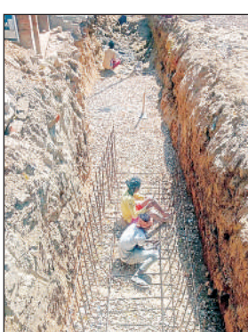
मानक विहीन किया जा रहा है नाले का निर्माण।

अमृत विचार। राजेसुल्तानपुर कस्बे में नाला निर्माण की खामियां जोर पकड़ने लगी हैं। एक करोड़ से ऊपर की लागत से बन रहा नाला मानक और गुणवत्ता की अनदेखी के चलते लोगों के आक्रोश का कारण बनता जा रहा है। बावजूद जिम्मेदारों के कानों में जू तक नहीं रेंग रहा है। बता दें कि राजेसुल्तानपुर नगर पंचायत की ओर से स्थानीय कस्बे में कराए जा रहे नाला निर्माण की खामियां उजागर न हो इसके लिए निर्माण कार्य में तेजी पकड़ लिया है। एक करोड़ 40 लाख की लागत से नाला निर्माण करने की जिम्मेदारी नगर पंचायत प्रशासन ने कार्यदाई संस्था को सौंपकर अपने कर्तव्यों की इतिश्री समझ ली है। जिसकी वजह से नाला निर्माण में मानक और गुणवत्ता की अनदेखी जमकर की जा रही है।