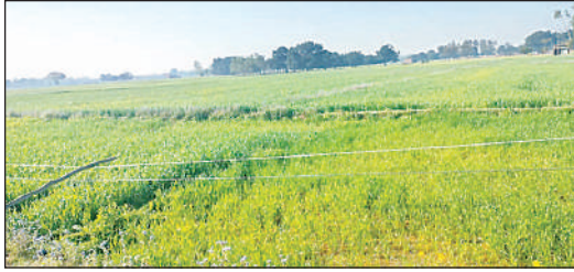
नानपारा के अगोया में लटक रही एचटी लाइन।

अमृत विचार : जिले में कई स्थानों पर नीचे तार लटक रहे हैं। जिसके चलते हादसे हो रहे हैं। इसके बाद भी बिजली विभाग सबक नहीं ले रहा है। कहीं खेत में बिल्कुल नीचे तो कहीं मकान को छू रहे तार हादसे को दावत दे रहे हैं। लेकिन बिजली महकमा आंख बंद कर सिर्फ तमाशा देख रहा है।