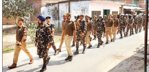
ग्राम पंचायत उर्रा में फ्लैग मार्च करते थानाध्यक्ष और एसएसबी के जवान।

आगामी लोकसभा सामान्य निर्वाचन की संवेदनशीलता को देखते हुए गुरुवार को को तहसील मोतीपुर अंतगत थाना मोतीपुर क्षेत्र के भारत नेपाल अंतर्राष्ट्रीय सीमा के समीप के गांव एवं अन्य कई गांवो के