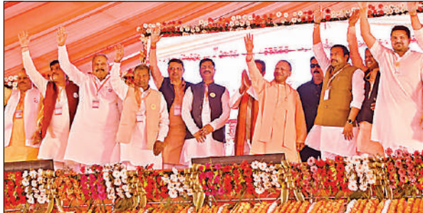
टामसन मैदान में मंच से लोगों का अभिवादन करते सीएम व अन्य जनप्रतिनिधि।