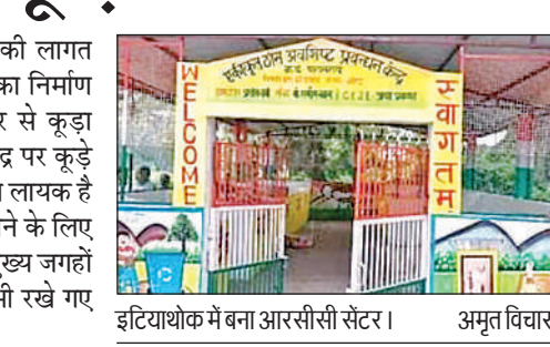
इटियाथोक में बना आरसीसी सेंटर। अमृत विचार

इटियाथोक, गोंडा: सरकार लाखों की लागत से ग्राम पंचायत में आरआरसी सेंटर का निर्माण करवा रही है जिसका उद्देश्य हर घर से कूड़ा इकट्ठा कर केंद्र पर लाया जाए और केंद्र पर कूड़े को अलग कर जो कूड़ा इस्तेमाल करने लायक है उसे इस्तेमाल किया जाए। कूड़े को लाने के लिए गाड़ी भी खरीदी गई है। गांव में मुख्य मुख्य जगहों पर कूड़ा इकट्ठा करने के लिए डिब्बे भी रखे गए हैं। लेकिन ये निष्प्रयोज्य हैं।