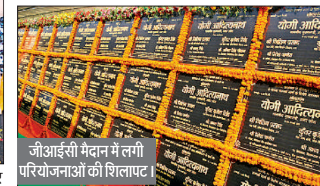
जीआईसी मैदान में लगी परियोजनाओं की शिलापट।