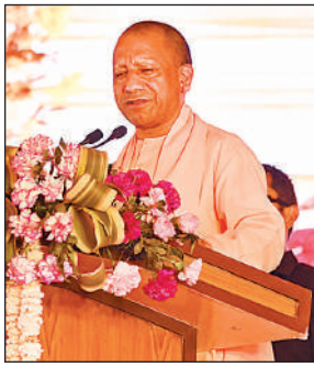
सभा को संबोधित करते सीएम योगी।

मुख्यमंत्री बृहस्पतिवार को जिले के शहीदे आजम सरदार भगत सिंह