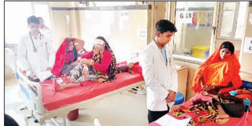
मेडिकल कॉलेज में परीक्षा के दौरान मौजूद एमबीबीएस छात्र और प्रोफेसर।