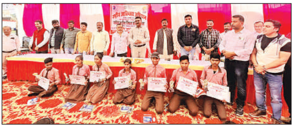
क्विवज प्रतियोगिता में शामिल छात्र।

क्विवज प्रतियोगिता में उच्च प्राथमिक विद्यालय गजाधरपुर