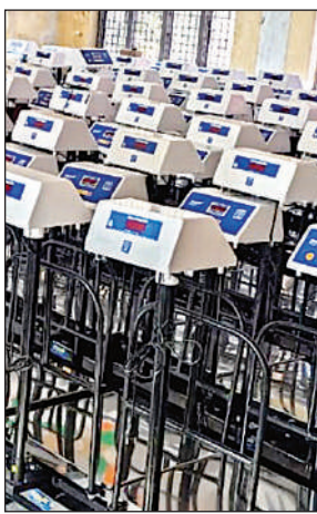
तौल के लिए आए इलेक्ट्रॉनिक कांटे।

अमृत विचार: खाद्यान्न वितरण की तिथि जारी कर दी गई है। इस माह में राशन वितरण नए इलेक्ट्रॉनिक तौल व ई-पास मशीन से किया जाएगा। जिले में वितरण शुरुवार से होगा। इसे लेकर कोटेदारों को प्रशिक्षण दिया गया था। इसके बाद कोटेदारों को मशीन दी गई है। जिले में वर्तमान समय में 1393 उचित दर विक्रेताओं की दुकान संचालित हो रही है। कालाबाजारी पर अंकुश लगाने के लिए सरकार ने तकनीक का सहारा लिया है और खाद्यान्न का वितरण इलेक्ट्रॉनिक तौल मशीन से करने को निर्णय लिया गया है। लिंक वेब कंपनी के प्रशिक्षकों ने कोटेदारों को मशीन कैसे चलाया