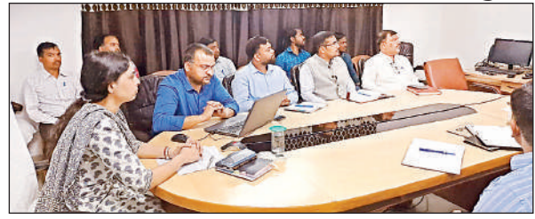
पोर्टल आदि की जानकारी दी गई।

प्रशिक्षण में सभी अधिकारियों को चुनाव आयोग द्वारा तैयार की गई विभिन्न मोबाइल ऐप की जानकारी दी गई। जिसमें विभिन्न ऐप जैसे-इनकोर, सी-विजिल ऐप, सक्षम ऐप, वोटर हेल्पलाइन, सम्बन्धित