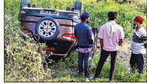
खड्ड में गिरी अनियंत्रित कार।

अमृत विचार : जिले में नानपारा बहराइच मार्ग से जा रहे कार चालक को झपकी आ गई तो कार खड्ड में जाकर पलट गई। हादसे में चार लोग घायल हुए हैं। सभी को अस्पताल में भर्ती कराया गया है। प्राप्त जानकारी के अनुसार जिला मुख्यालय से कार सवार लोग नानपारा की ओर रात में जा रहे थे। मटेरा थाना क्षेत्र के नानपारा बहराइच मार्ग पर गौरा धनौली मोड़ पर कार पहुंची, तभी चालक को झपकी आ गया। झपकी आने पर चालक कार अनियंत्रित होकर खड्ड में जाकर पलट गई। प्रभारी