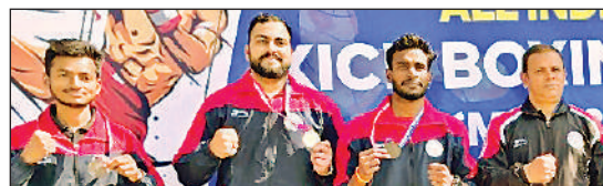
प्रतियोगिता में पदक जीतने वाले प्रतिभावां खिलाड़ी।