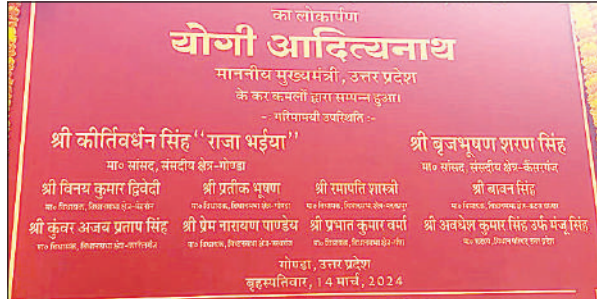
लोकार्पित की गई परियोजना में करनेलगंज के मौजूदा को छोड़ पूर्व विधायक का नाम।

जनसभा को संबोधित करते हुए मुख्यमंत्री योगी ने कहा कि विकसित भारत के लिए विकसित उत्तर प्रदेश आवश्यक है। इसी तरह विकसित उत्तर प्रदेश के लिए विकसित गोंडा भी जरूरी है। इसी विकास के दृष्टिकोण जिले को 17 अरब रुपये के विकास योजनाओं की सौगात मिली है। विकसित भारत के लिए जिले को मेडिकल कॉलेज दिया गया है। बाढ़ की परियोजना को पूरा किया जा रहा है। सरयू नहर की परियोजना पूरी हुई है। श्रावस्ती को वायु सेवा से जोड़ा गया है। मुख्यमंत्री ने कहा कि