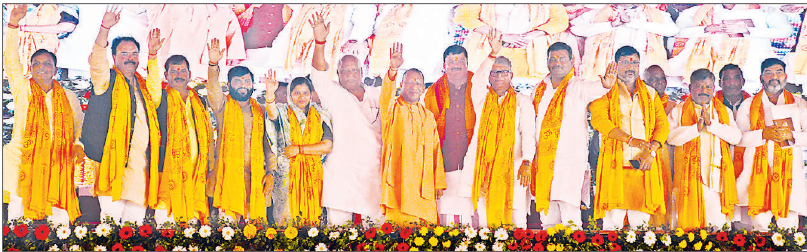
जीआईसी ग्राउंड में मंच से लोगों का अभिवादन करते मुख्यमंत्री व मौजूद अन्य लोग।

रोजा शिया सहरी : 04.48 बजे इफ्तार : 06.24 बजे सुन्नी सहरी : 04.43 बजे इफ्तार : 06.10 बजे नोट : रोजेदारों की सुविधा के लिए सहरी का समय एक दिन आगे का दिया जा रहा है।