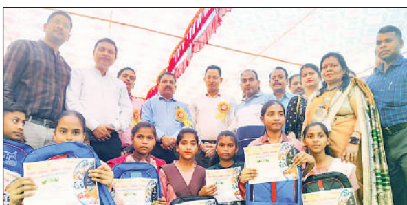
प्रतियोगिता में पुरस्कृत किए गए छात्र - छात्राएं व अधिकारी।

जनपदीय प्रतियोगिता में प्रत्येक विकासखंड से आठ उत्कृष्ट प्रतिभागियों ने प्रतिभाग किया। कुल 12 विकासखंडों के 96 प्रतिभागियों ने अपने विज्ञान के उत्कृष्ट मॉडलों का प्रदर्शन किया। इस कार्यक्रम का उद्देश्य प्राथमिक के बच्चों में विज्ञान की विषय वस्तु एवं वैज्ञानिक सोच