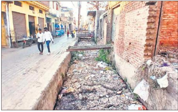
कासगंज शहर के नावट्टी रोड पर बना नाला, जो गंदगी से अटा पड़ा है।

सीवर लाइन बिछाने की जरूरत काफी लंबे समय से दिखाई दे रही है। सबसे अधिक जरूरत गंगेश्वर कॉलोनी, लवकुशनगर और पालनगर में है, क्योंकि यह कॉलोनियां काफी गहरी हैं। यहां हल्की सी बरसात में भी तालाब का दृश्य बन जाता है। घरों