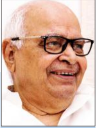
हृदय नारायण दीक्षित पूर्व विधानसभा अध्यक्ष उ.प्र.

वायु प्राण हैं। प्राण नहीं तो जीवन नहीं। वैदिक परंपरा में वायु अमर देव हैं। वैदिक ऋषि वायु की प्रीति में सराबोर हैं। वे प्राणशक्ति के संचालक हैं, लेकिन दिखाई नहीं पड़ते। वायु का रूप नहीं होता। वायु की तीव्र गति आंधी है। आंधी का शोर सुनाई पड़ता है, लेकिन वायु का रूप नहीं।