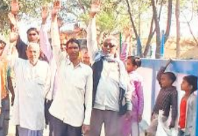
एक माह से गांव में बिजली नहीं आ रही है। कई बार प्रधान के द्वारा शिकायत की गई लेकिन अभी तक कोई सुनवाई नहीं हुई है।