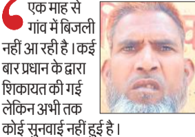
खेती-बाड़ी करने में समस्या आ रही है। समय पर पानी नहीं लग पा रहा है। फसलों को नुकसान हो रहा है। गृह की उपज कम होगी।

तीन पात है। गांव में शाम होते ही अंधकार छा जाता है। सिंचाई के लिए भी पानी की जरूरत है। परेशान किसानों का कहना है