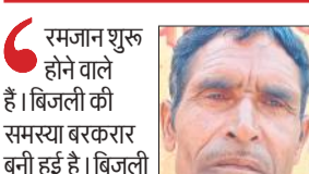
विभाग के अधिकारी नहीं सुन रहे हैं। अब डीएम के यहां जाकर गृहार लगाएंगे। विभाग को गांव की आपूर्ति सुचारु करनी चाहिए।

कि अधिकारी सुन नहीं रहे हैं। जिलाधिकारी के यहां दस्तक देगे। यदि फिर भी सुनवाई नहीं हुई तो आंदोलन करेंगे।