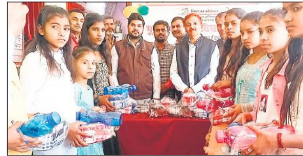
प्रतिभाशाली छात्रों को पुरस्कृत करते अतिथि।