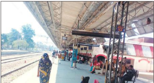
● अमृत विचार

अमृत विचार : एक्सप्रेस ट्रेनों में कोच की जानकारी देने के लिए रेलवे स्टेशन पर एक साल पहले कोच गाइडेंस सिस्टम लगने शुरू हुए। अब रेलवे प्रशासन ने कोच गाइडेंस सिस्टम चालू कर दिया है। एक्सप्रेस ट्रेनों में यात्रा करने वाले यात्रियों को अब अपने कोच की जानकारी मिल जाएगी और उन्हें कोच तलाशने के लिए प्लेटफार्म पर दौड़ नहीं लगानी पड़ेगी।