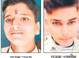
मृतक लक्ष्य मृतक आशीष

● पुलिस ने वाहन कब्जे में लिया, पुलिस ने रिपोर्ट दर्ज की