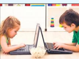
देखने में प्रॉब्लम होती है। कई रिसर्च में सामने आया है कि आंखों के लिए छोटी डिजिटल स्क्रीन बेहद खतरनाक है और जिन बच्चों के चरमा लगा हुआ है। उनका नंबर बहुत तेजी से बढ़ रहा है।

सबसे ज्यादा नकारात्मक असर तीन साल के बच्चों में था, जब उन्होंने रोजाना औसतन 2