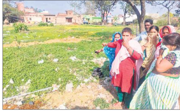
तहसील फरीदपुर के ग्राम पऊनगला के तालाब में गिरकर डूबे कई गोवंश, बदबू आने से परेशान महिलाएं।

● 13 साल से तहसील फरीदपुर के ग्राम पऊनगला में जलकुंभी और अमर बेल से घिरे तालाब की नहीं हुई है साफ-सफाई