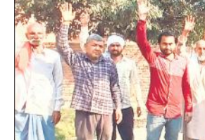
विद्युत आपूर्ति सुचारु किए जाने की मांग को लेकर प्रदर्शन करते ग्रामीण और किसान।

अमृत विचार : विकास खंड कासगंज के गांव गुरहना में विभागीय अधिकारियों की अनदेखी के चलते ग्रामीणों और किसानों को एक माह से बिजली नहीं मिल रही है। शाम होते ही गली और कूचों में अंधकार छा जाता है। फसलों की सिंचाई के लिए भी पानी न मिलने से किसान परेशान है। परेशान किसान आंदोलन का मन बना रहे हैं। लभग एक माह पूर्व विभागीय कर्मचारियों ने गांव में लगे ट्रांसफार्मर गांव के बाहर शिफ्ट किए और केबिल उतार ली थी। ग्रामीणों को बताया गया था कि एक दो दिन में लाइन चालू हो जाएगी। नलकूपों और घरलू