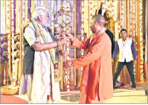
मंदिर में पूजन से पूर्व त्रिशूल उठाए प्रधानमंत्री मोदी व मुख्यमंत्री योगी।

अमृत विचार : 2024 के लोकसभा चुनाव में भाजपा से उम्मीदवार बनाए जाने के पश्चात प्रधानमंत्री नरेंद्र मोदी शनिवार को अपनी काशी पहुंचे। शाम सात बजे लाल बहादुर शास्त्री अंतरराष्ट्रीय एयरपोर्ट पर मुख्यमंत्री योगी आदित्यनाथ ने उनका भव्य स्वागत किया। एयरपोर्ट से काशी विश्वनाथ धाम व बीएलडब्लू तक 28 किलोमीटर की सड़क यात्रा में काशी वासियों ने 38 स्थानों पर पीएम का अभूतपूर्व स्वागत किया। प्रधानमंत्री नरेंद्र मोदी श्री काशी विश्वनाथ मंदिर गए, यहां उन्होंने विधिवत दर्शन पूजन किया। 15 दिन में दूसरी बार काशी पहुंचे प्रधानमंत्री : प्रधानमंत्री नरेंद्र मोदी 15 दिन में दूसरी बार वाराणसी