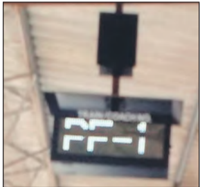
रेलवे स्टेशन पर लगाया गया कोच गाइडेंस सिस्टम।

नीचे तार डाले गए और रेलवे स्टेशन पर लगाए गए करीब दो दर्जन कोच गाइडेंस सिस्टम एक दूसरे से कनेक्ट कर दिए गए हैं। कोच गाइडेंस सिस्टम पूरी तरह लगने के बाद 8 मार्च को चालू कर दिए गए। यह कोच गाइडेंस सिस्टम एसी, स्लीपर और जनरल कोच की जानकारी देगा। जिससे एक्सप्रेस ट्रेन में सफर करने वालों को दिक्कत नहीं होती है। इसी तरह यहां पर एक साल पहले रेलवे स्टेशन पर कोच गाइडेंस सिस्टम लगाने का कार्य शुरू किया गया। रेलवे स्टेशन के फर्श को तोड़ कर उसके