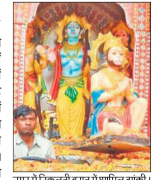
नगर में निकलती बरात में शामिल झांकी।