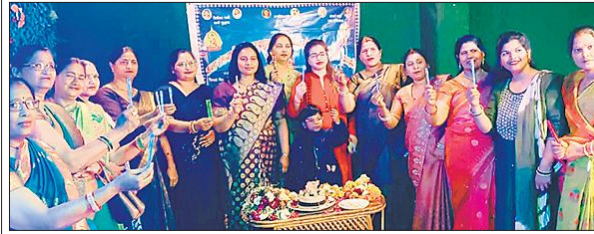
सम्मान समारोह में मौजूद महिलाएं।