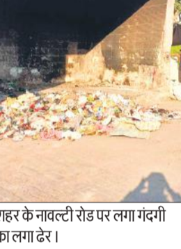
शहर के नावटली रोड पर लगा गंदगी का लगा डेर।

अमृत विचार: मार्च माह का प्रथम पखवाड़ा है, लेकिन इस माह में अब मच्छरों का 'मार्च' शुरू हो गया है। तेजी के साथ मच्छर पनप रहे हैं। वैसे तो जिले में कई तरीके के मच्छर हो सकते हैं, लेकिन इसकी सरकारी पड़ताल नहीं हो पा रही है। जिले में मच्छरों के घनत्व सर्वेक्षण के लिए कोई भी यूनित नहीं है। हर साल मौतें होती हैं, लेकिन कभी भी यहां घनत्व सर्वेक्षण नहीं हुआ।