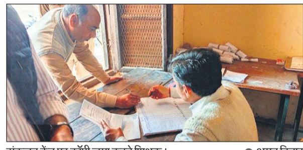
संकलन केंद्र पर कॉपी जमा करते शिक्षक।

शनिवार को प्रथम पाली में इंटरमीडिएट ट्रेड और हाईस्कूल की उर्दू विषय की परीक्षा संपन्न हुई। वैकल्पिक विषयों में 223 परीक्षार्थी पंजीकृत थे। इनमें से 213 उपस्थित रहे और 10 अनुपस्थित