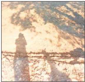
समतलीकरण करने के बाद ऐसे तैयार होगी खेत।

अमृत विचार : बढ़ती आबादी घटते संसाधन अब समस्या का बड़ा कारण बनता जा रहा है। उपजाऊ जमीनों का बंटवारा होने से एवं उन पर निर्माण कार्य होने से जमीन का रकबा दिन प्रतिदिन कम होता जा रहा है जिससे अनाज की उपज पर इसका विपरीत प्रभाव पड़ रहा है। इसलिए अब जिले में बंजर और ऊसर जमीन का समतलीकरण कराया जाएगा। सभी तहसीलों में बंजर जमीनों का रिकार्ड खंगाला जाएगा, जिससे वहां पर खेती योग्य जमीन को बनाया जा सके। जनपद में इस समय साढ़े तीन लाख हेक्टेयर जमीन पर विभिन्न