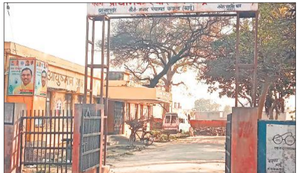
सूना पड़ा कछला का स्वास्थ्य केंद्र।