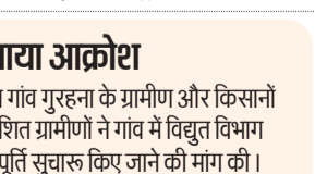
रमजान शुरू होने वाले हैं। बिजली की समस्या बरकरार बनी हुई है। बिजली विभाग पर कई बार शिकायत की है लेकिन कोई सुनवाई नहीं हुई है।

तीन पात है। गांव में शाम होते ही अंधकार छा जाता है। सिंचाई के लिए भी पानी की जरूरत है। परेशान किसानों का कहना है