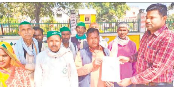
एलआईयू को ज्ञान सौंपते भाकियू नेता।