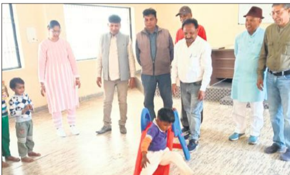
दिए गए स्लाइडर पर खेलता बंदी महिला का बालक।