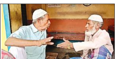
युवाओं की चर्चा करते मुस्लिम समुदाय के लोग।