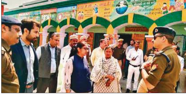
शहर के नवाब तरीरा मतदान केंद्र का निरीक्षण करने के बाद अधिकारियों को निर्देशित करती मंडलायुक्त चैत्रा.बी, आईजी शलभ माथुर।

मंडलायुक्त चैत्रा. बी ने कहा कि लोकसभा चुनाव में निर्वाचन आयोग द्वारा दिए गए दिशा निर्देशों को कड़ाई