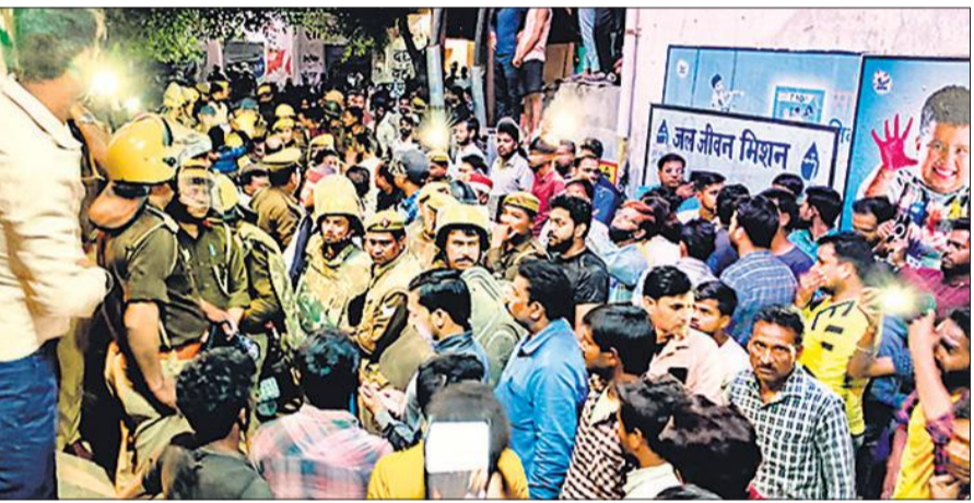
घटना के बाद पुलिस के खिलाफ नारेबाजी करते लोग।