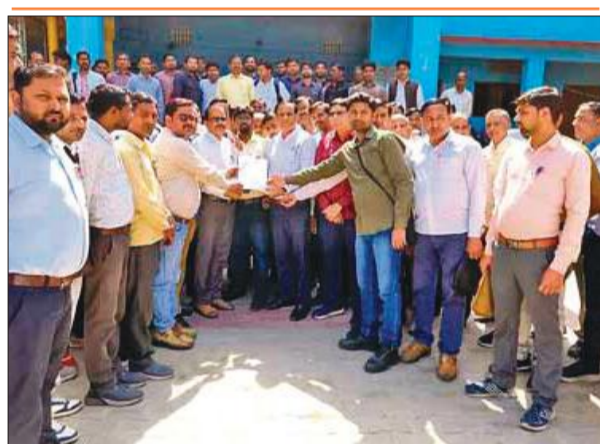
डीआईओएस पीके मौर्य को ज्ञापन देते शिक्षक।

● शिक्षक संघ ने सीएम को संबोधित ज्ञापन डीआईओएस को दिया