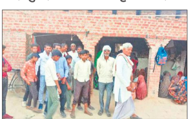
महिला की मौत की सूचना पर घर पहुंचे ग्रामीण।