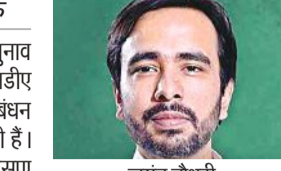
जयंत चौधरी बागपत व बिजनौर की मिली सीटों के बाद जाट व गुजर बाहुल्य सीटों पर रालोद ने कमर कसी