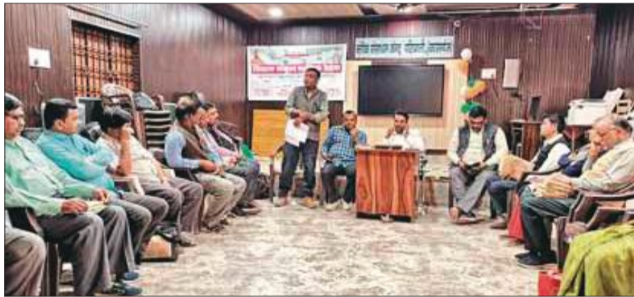
परिषदीय विद्यालयों में परीक्षाओं को लेकर अधीनस्थों को निर्देशित करते खंड शिक्षाधिकारी।