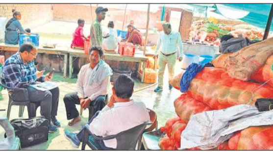
चिप्स फैक्ट्री में सैपल लेते खाद्य विभाग के अधिकारी।