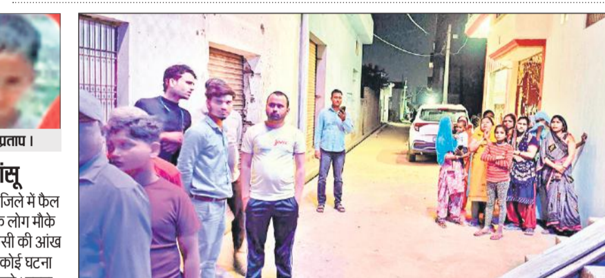
दो भाइयों की हत्या के बाद सन्न रह गए मोहल्ले के लोग।

जिसने सुना, छलक पड़े आंसू दोहरे हत्याकांड की घटना आग की तरह जिले में फैल गई। सूचना पर मोहल्ले और आसपास के लोग मौके पर पहुंचे। दोनों बच्चों की हत्या पर हर किसी की आंख में आंसू थे। आरोपी को कोस रहे थे। हर कोई घटना जानने के लिए एक दूसरे को फोन करने लगे। घटना दिल दहला देने वाली है।