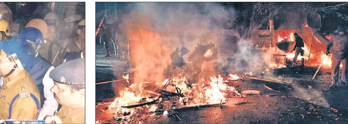
गुस्साये लोगों ने कई खोखों में लगा दी आग। आग बुझाने का प्रयास करते पुलिसकर्मी।