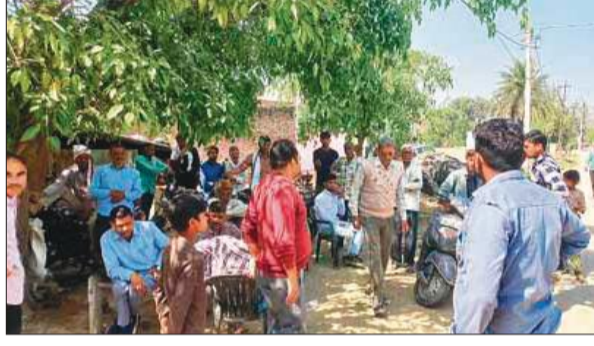
घटनास्थल पर मौजूद ग्रामीणों की भीड़।