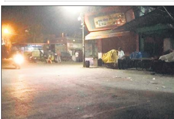
वाहनों का संचालन बंद कराने के बाद डिपो चौराहा पर पसरा सन्नाटा।