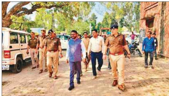
एक पोलिंग बूथ का जायजा लेकर बाहर आते डीएम व एसएसपी।

डीएम ने निर्देश दिए कि पोलिंग स्टेशनों पर आयोग की मंशानुसार पेयजल, शौचालय, रैम्प, दरवाजे, एक पोलिंग बूथ का जायजा लेकर बाहर आते डीएम व एसएसपी।