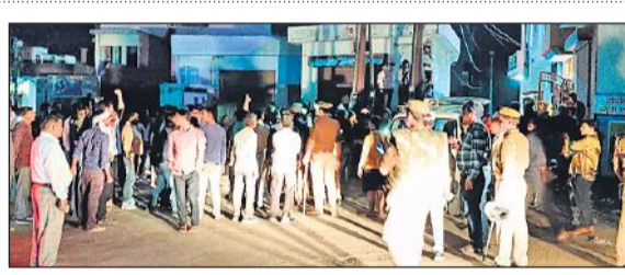
घटनास्थल के बाहर बड़ी संख्या में लोग और पुलिस।

लेते हुए प्रशासन ने रोडवेज बसों का संचालन रोक दिया। इसके साथ ही वहां खड़े ठेले खोमचे वालों को भी हटा दिया। इसके बाद रोडवेज बस स्टैंड पर सन्नाटा पसर गया। संगठनों ने जताया आक्रोश : वीभत्स घटना को लेकर विभिन्न संगठन के लोगों ने