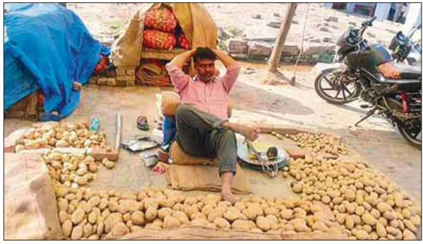
आलू पर महंगाई के कारण ग्राहकों का इंतजार करता आलू विक्रेता।

आलू को सब्जी का राजा कहा जाता है। घर की रसोई से लेकर हर कार्यक्रम में इसकी मांग हमेशा बनी रहती है। विशेषकर होली पर घरों में आलू के चिप्स और पापड़ बनाए जाते