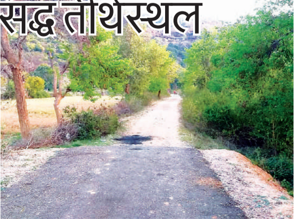
यह है बांकेसिद्ध धार्मिक स्थल का अधबना मार्ग।