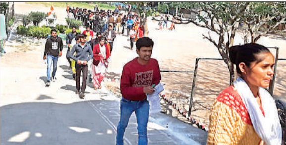
बोर्ड परीक्षा देकर घर जाते परीक्षार्थी।

अमृत विचार। उत्तर प्रदेश माध्यमिक शिक्षा परिषद प्रयागराज की हाईस्कूल और इंटरमीडिएट की गुरुवार को बोर्ड परीक्षा कड़ी सुरक्षा व्यवस्था के बीच संपन्न कराई गई। अधिकारियों की सख्ती के चलते जिले में एक भी नकलची पकड़ा नहीं गया। कड़ी निगरानी के बीच सुबह और शाम की पाली में हाईस्कूल और इंटरमीडिएट की विज्ञान, गणित, कृषि, वाणिज्य विषय की परीक्षा में 16352 पंजीकृत परीक्षार्थियों से 747 परीक्षार्थियों ने परीक्षा छोड़ी। नकलविहीन परीक्षा संपन्न होने से परीक्षार्थी भी खासा खुश हैं।