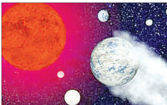
ट्रेपिस्ट-1 का सौरमंडल।

अमृत विचार : सात ग्रहों का ट्रेपिस्ट एक्सोप्लैनेट (बाहरी ग्रहों) का सौरमंडल खत्म हो जाएगा। कुछ ऐसी ही संभावनाएं खगोल वैज्ञानिक जता रहे हैं। ताजा शोध में पता चला है कि रहने योग्य इस इस सोलर सिस्टम का एक ग्रह ट्रेपिस्ट-1ई का वातावरण नष्ट हो रहा है। इस जानकारी के बाद किसी दूसरे ग्रह पर जीवन की उम्मीद जाती रही। ट्रेपिस्ट सात ग्रहों वाला सौर मंडल है। जिसके तीन ग्रहों पर जीवन की संभावना वैज्ञानिकों ने जताई थी। मगर अब जो जानकारी मिली है, उससे पता चलता है कि इस बाहरी सिस्टम में रहने योग्य ग्रहों को उसके लाल बौने तारे से निकलने वाले कठोर विकिरण उसके वायुमंडल से खत्म कर रहा