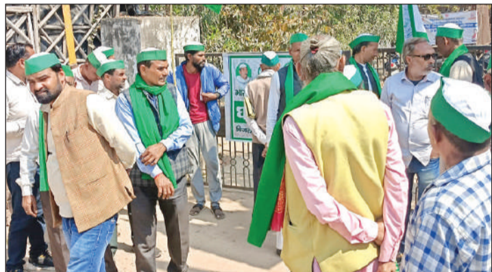
पावर हाउस के बाहर प्रदर्शन करते किसान यूनियन के पदाधिकारी।