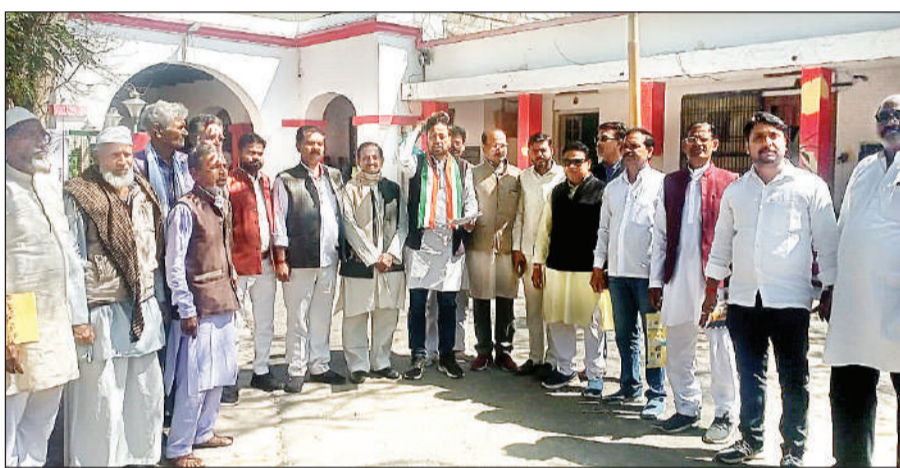
कलेक्ट्रेट पहुंच कर नारेबाजी करते कांग्रेस कार्यकर्ता।

इस दौरान श्रद्धालुओं द्वारा संत रविदास जी एवं डॉ. भीमराव आंबेडकर जी की प्रतिभाएं स्थापित करने का प्रयास किया गया। प्रशासन द्वारा स्थान को विवादित बनाते हुए उन्हें प्रतिमाएं स्थापित करने से रोक दिया और प्रशासन और श्रद्धालुओं में कई घंटों की वार्ता के बाद दोनों पक्षों को समझाकर प्रतिमाएं विवादित स्थान से हटाकर