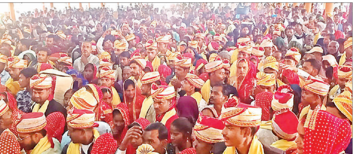
समारोह में मौजूद नवदंपति।