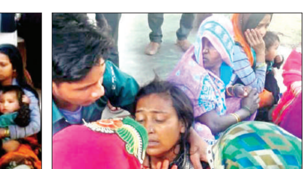
अमृत विचार घर पर रोते-बिलखते परिजन।