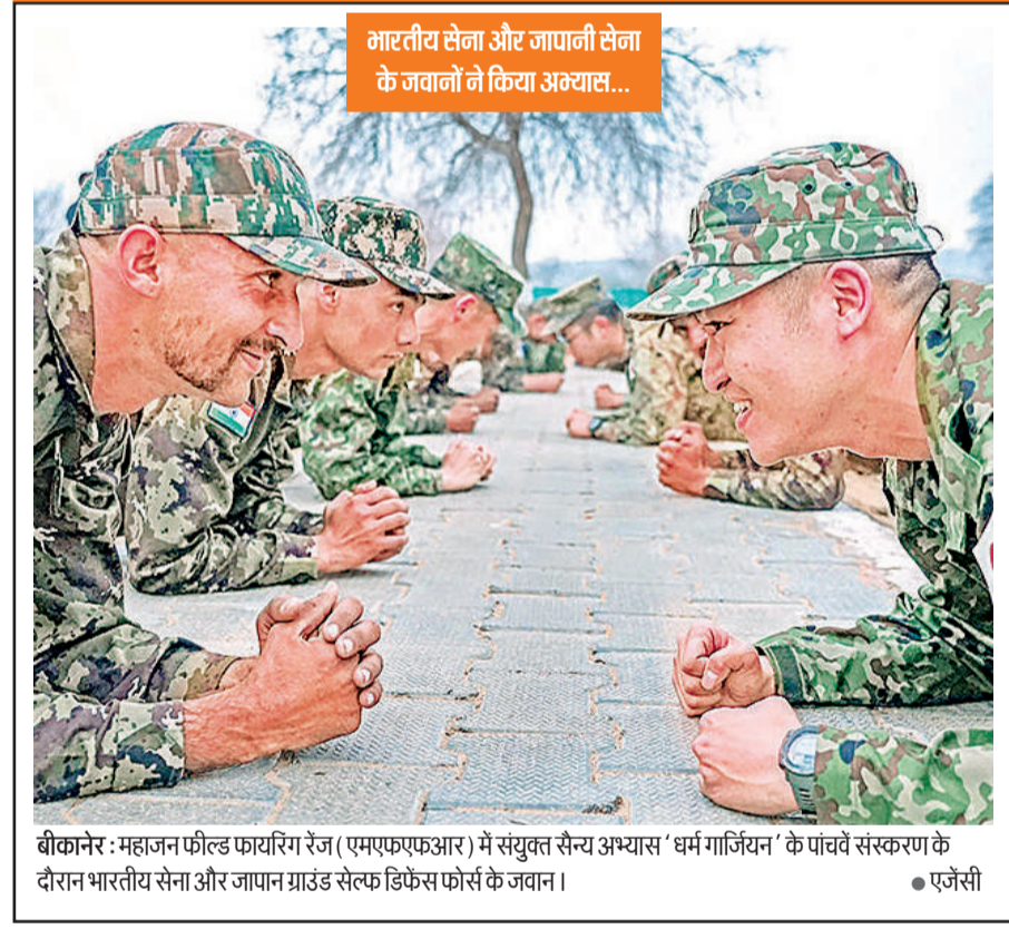
बीकानेर - महाजन फील्ड फायरिंग रेंज (एमएफएफआर) में संयुक्त सैन्य अभ्यास 'धर्म गार्जियन' के पांचवें संस्करण के दौरान भारतीय सेना और जापान ग्राउंड सेल्फ डिफेंस फोर्स के जवान।

तिरुवनंतपुरम। राष्ट्रपति द्रौपदी मुर्मू ने राज्य विधानसभा द्वारा पारित केरल लोकायुक्त विधेयक को मंजूरी दे दी है लेकिन उन्होंने तीन विश्वविद्यालय कानून विधेयकों पर अपनी स्वीकृति अभी नहीं दी है। राज्यपाल आरिफ मोहम्मद खान ने राष्ट्रपति को ये विधेयक उनकी स्वीकृति के लिए भेजे थे। राजभवन ने बृहस्पतिवार को एक बयान में कहा कि राष्ट्रपति ने केरल विश्वविद्यालय कानून (संशोधन संख्या 2) विधेयक 2022 पर अभी अपनी स्वीकृति नहीं दी है। बयान के अनुसार इसके अलावा विश्वविद्यालय कानून संशोधन विधेयक, 2022 और विश्वविद्यालय कानून संशोधन विधेयक, 2021 को भी राष्ट्रपति को मंजूरी नहीं मिली है। राष्ट्रपति को भेजे गए सात विधेयकों में से केवल एक विधेयक केरल लोकायुक्त संशोधन विधेयक, 2022 को सहमति दी गई है।