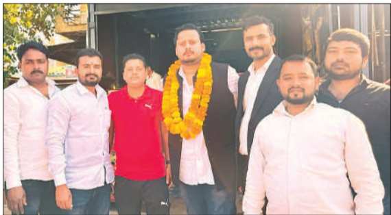
नेताओं का स्वागत करते युवा।