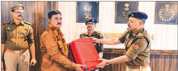
सेवानिवृत्त पुलिसकर्मियों को विदाई देते एसपी।