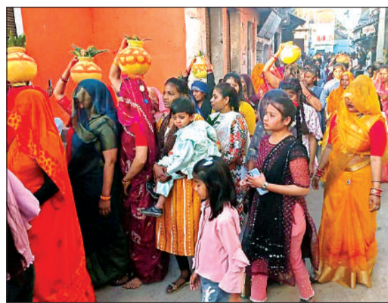
सरीला कस्बे में निकली शोभायात्रा में शामिल महिलाएं व युवतियां।