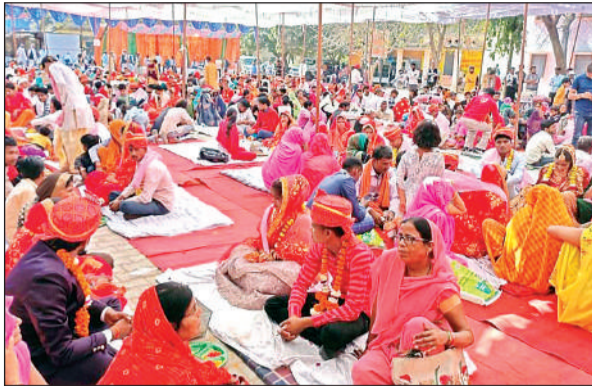
मुख्यमंत्री सामूहिक विवाह सम्मेलन में शादी की रस्मों को पूरा करते वर वधु।

अमृत विचार। समाज कल्याण एवं जिला प्रशासन के तत्वावधान में आयोजित मुख्यमंत्री सामूहिक विवाह सम्मेलन में 68 जोड़ों ने हिंदू रीति रिवाज से व तीन जोड़ों ने मुस्लिम रीति रिवाज से शादी संपन्न कराई गई। एक ही पंडाल के नीचे हिंदू मुस्लिम समाज की बेटियों का विवाह एक साथ संपन्न करा कर क्षेत्रवासियों ने कौमी एकता की मिसाल पेश की है। वहीं कुछ जोड़े परिसर के मंडप के नीचे बैठे बिना ही शुभ मुहूर्त न होने की बात कहकर अपना सामान प्राप्त कर वहां से चले गए। इस मामले में जब समाज कल्याण अधिकारी से बात की गई तो उन्होंने साफ साफ इस बात को नकारते हुए अपना पल्ला झाड़ लिया। विकासखंड कार्यालय परिसर में आयोजित मुख्यमंत्री सामूहिक विवाह सम्मेलन का शुभारंभ अपर