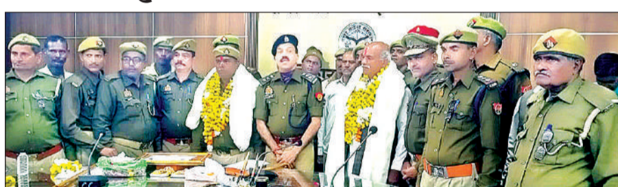
सेवानिवृत्त होमगार्डों को विदाई देते अधिकारी व अन्य साथी।