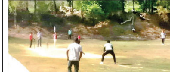
कुरारा के झुमरी तलेया तालाब मैदान में क्रिकेट खेलते खिलाड़ी।