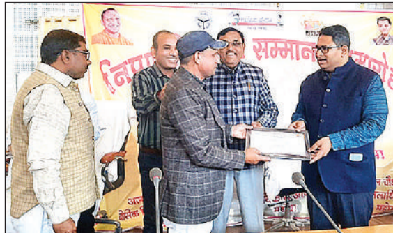
प्रशस्ति पत्र देकर सम्मानित करते डीएम।