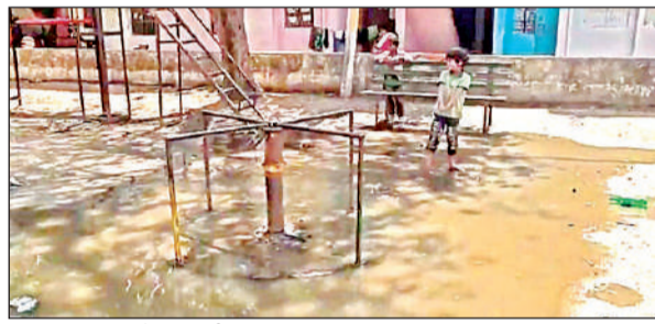
विद्यालय परिसर में भरा पानी।