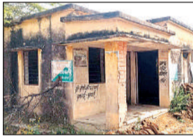
छान्नी गांव में खंडहर बना खड़ा पशु सेवा केंद्र।

सुमेरपुर (हमीरपुर)। ब्लाक क्षेत्र की आधा दर्जन पंचायतों में बने पशु सेवा केंद्रों के भवन जर्जर होने के बाद निष्प्रयोज्य घोषित कर दिए गए हैं। बजट न मिलने से पशुपालन विभाग इनकी मरम्मत भी नहीं कर पा रहा है। साथ ही पशुधन प्रसार अधिकारियों के सेवानिवृत्त होने तथा 2010 से भर्ती न होने के कारण यहां पर किसी की तैनाती भी नहीं है। पशुपालक झोलाछाप से उपचार करने को मजबूर है। ब्लाक क्षेत्र में तीन पशु चिकित्सालय सुमेरपुर, छान्नी, पौधिया संवालिंत हैं। इसके अलावा ग्राम पंचायत पंघरी, पवखुरा खुर्द, बिदोखर मंदनी, सुरीली बुजुर्ग में पशु सेवा केंद्र बनाकर पशुधन प्रसार अधिकारी नियुक्त किए गए थे। इन जगहों पर तैनात पशुधन प्रसार अधिकारी सेवानिवृत्त हो चुके हैं।