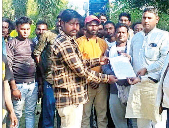
नगरपालिका अध्यक्ष को ज्ञापन देते सफाई कर्मचारी।