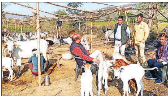
गौशाला का निरीक्षण करते सीडीओ।