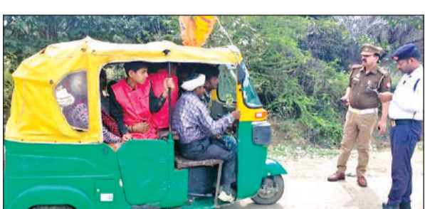
सवारियों से भरी ऑटो को रोकती पुलिस।