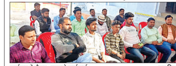
कार्यक्रम में मौजूद भाजयुवो कार्यकर्ता।