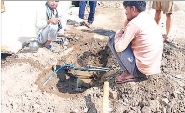
सड़क पर कनेक्शन के लिए खोदे गए गड़ढे।

अमृत विचार। कस्बे के मुख्य मार्ग का अधूरा पड़ा सीसी निर्माण को पूरा कराने के लिए मार्ग में बिछाई गई पाइप लाइन बाधक बन गई है। जगह-जगह पाइप लाइन बिछाने के चक्रम में खोदे गए गड़ढे सीसी निर्माण कार्य के लिए परेशानी खड़ी कर रहे हैं। इससे तेज गति से निर्माण कार्य नहीं हो पा रहा है। लोगों को आवागमन में भारी दिक्कत का सामना करना पड़ रहा है। ग्रामीणों में जल निगम के अधिकारियों की लापरवाही के प्रति खासा गुस्सा है।