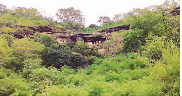
पहाड़ में स्थित है बांकेसिद्ध तीर्थस्थल।

महीनों पहले पत्र लिखा था। पर्यटन विभाग ने वक्त विभाग को पत्र भेज देने की बात कहकर इतिथी कर ली। जबकि सांसद ने यह भी कहा था कि