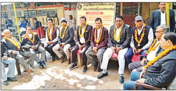
जिला जजो गेट के सामने धरना प्रदर्शन करते अधिवक्ता।

जजो परिसर में धरना- प्रदर्शन व हड़ताल पिछले 20 फरवरी से जारी है। धरने में अधिवक्ताओं ने कहा पिछले 20 से 28 फरवरी तक इस अदालत ने 50 से अधिक वाद खारिज कर दिए हैं। जबकि अधिवक्ता 20 फरवरी से न्यायिक कार्य से विरत हैं एवं इसके पूर्व भी एक माह में 190 वाद खारिज किए जा चुके हैं। जिससे वादकारियों के प्रति न्यायालय की गरिमा गिर रही है। इनके व्यवहार से अधिवक्ता