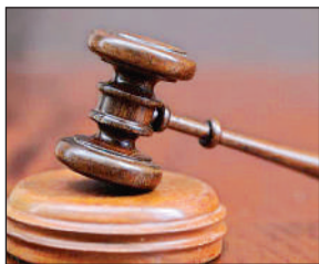
● 20 मई 2019 की घटना में सजा, कोर्ट ने 60 हजार का अर्थदंड भी दिया