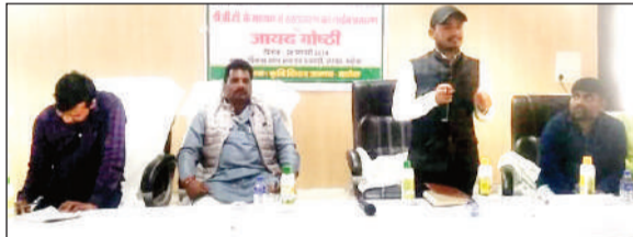
गोष्ठी में बोलते वक्ता।