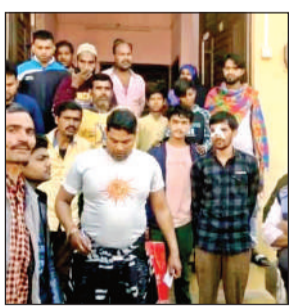
पीड़ित के घर के बाहर लगी भीड़।