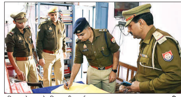
रजिस्टर चेक करते पुलिस अधीक्षक ईराज राजा।

अमृत विचार। जनपद के तेजतरंग पुलिस अधीक्षक ईराज राजा ने जनपद की वीहड़ में स्थित माधौगढ़ थाने का औचक निरीक्षण किया। निरीक्षण के दौरान पुलिस अधीक्षक ने थाना परिसर, थाना कार्यालय, सीसी टीएनएस कार्यालय, महिला हेल्प-डेस्क के अलावा साइबर