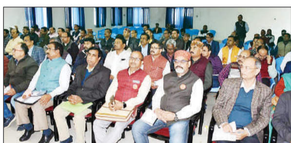
विश्वविद्यालय में उपस्थित किसान।