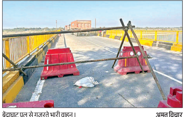
बेंदाघाट पुल से गुजरते भारी वाहन।

अमृत विचार: नेशनल हाईवे स्थित बेंदाघाट यमुना पुल मरम्मत कार्य पूरा होने के बाद जिलाधिकारी ने राष्ट्रीय राजमार्ग प्राधिकरण (एनएचआई) की रिपोर्ट मिलने के बाद भारी वाहनों के गुजरने की अनुमति दे दी। करीब चार माह पूर्व पुल क्षतिग्रस्त होने पर पुल से सभी प्रकार के वाहनों के गुजरने पर प्रतिबंध लगा दिया था। तब से मरम्मत कार्य चल रहा था। वाहनों को बबरू व औगासी के रास्ते लगभग 21 किलोमीटर लंबा चक्कर लगाकर फतेहपुर व रायबरेली आना-जाना पड़ रहा था। बांदा-टांडा नेशनल हाईवे से कानपुर व लखनऊ जाने के लिए ट्रक से लेकर बस अन्य वाहन रातों दिन गुजरते हैं। अगस्त मह में पुल की बीम में दरांर आने से इसमें हादसों की आशंका बढ़ गई थी। भारतीय राष्ट्रीय राजमार्ग प्राधिकरण,