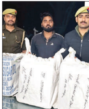
नकली कैस्ट्रोल के साथ गिरफ्तार युवक।