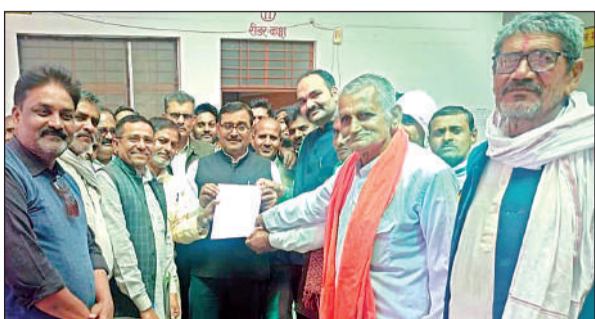
एसडीएम को ज्ञापन सौंपते क्षेत्रीय किसान।

बुंदेलखंड में एक माह के भीतर तीन बार बारिश और ओलावृष्टि होने से जसपुरा क्षेत्र के ग्राम तनगामऊ, कानाखेड़ा, नरौली, सोनामऊ, चंदवारा, गौरी खुर्द आदि गांवों में सरसों, चना, गेहूं, अरहर और मटर की फसल चौपट हो गई। कुछ किसानों का तो इतना अधिक नुकसान हुआ है कि इस बार वे साल भर की मेहनत के बदले खेतों से अपने घर एक दाना भी नहीं ले जा सकेंगे। नुकसान की भरपाई की मांग को लेकर गुरुवार को किसानों ने तबाही की दास्तां बयान