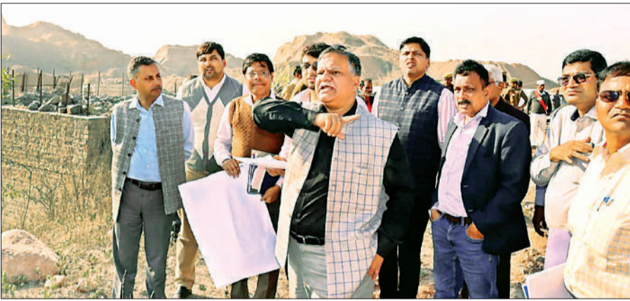
डिफेंस कॉरिडोर जीरो प्वाइंट में मुआयना करते कार्यपालक अधिकारी, साथ में डीएम और अन्य अफसर।

बीते दिन कार्यपालक अधिकारी ने कलेक्ट्रेट सभागार में बुंदेलखंड एक्सप्रेसवे के विस्तारिकरण एवं डिफेंस कॉरिडोर में पेयजल आदि सुविधाओं के संबंध में बैठक की। उन्होंने एक्सप्रेसवे को निर्देशित किया कि कॉरिडोर में पेयजल की सुविधा उपलब्ध कराई जानी है। इसके लिए एक सप्ताह के अंदर डब्ल्यू टीपी, इंटेकवेल, पाइप लाइन बिछाने आदि कामों का प्रस्ताव बनाकर उपलब्ध कराएं। उन्होंने एक्सप्रेसवे सिंचाई को भी कार्य संबंधी निर्देश दिए। उप जिलाधिकारी राजापुर से कहा कि डब्ल्यूटीपी के लिए जगह चिह्नित करके उपलब्ध