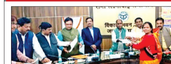
आंगनबाड़ी कार्यकर्तियों को नियुक्ति पत्र देने अधिकारी।