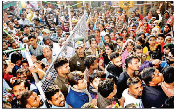
बामदेवेश्वर मंदिर में उमड़ा भक्तों का सैलाब।