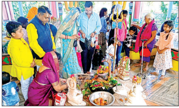
उमगेश्वर मंदिर में पूजा करते भक्त।