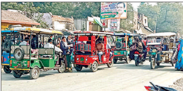
कुछ इस तरह से रहती है शहर की सड़कों पर ई-रिक्शाओं की मनमानी। अमृत विचार

शहर की सड़कों पर दिन भर रही जाम के ज़ाम की समस्या