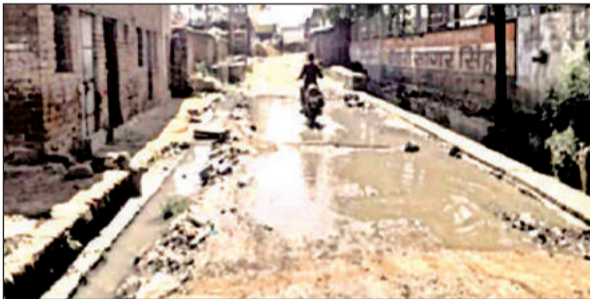
सड़क पर भरा गंदा पानी।

बाईपास रोड पर पेट्रोल पंप के पास से ग्रामीण क्षेत्र की ओर जाने वाली सड़क का निर्माण कराते समय दोनों तरफ नालियां भी बनवाई गई थी, लेकिन उनकी साफ सफाई न किए जाने से नालियों का गंदा पानी बस्ती और सड़क पर