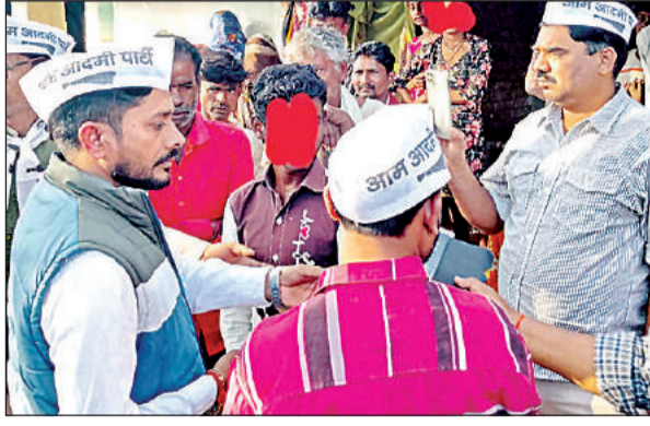
पीड़ित परिवार के गांव पहुंचा आम आदमी पार्टी का प्रतिनिधिमंडल। अमृत विचार

घाटमपुर कोतवाली क्षेत्र के बरौली के ईट भट्टे में फुफेरी बहनों के साथ जिस तरह जघन्य खेल खेला गया, उसमें घाटमपुर पुलिस शुरू से ही लीपापोती करने की कोशिशों में जुटी है। पुलिस प्रशासन की ओर से मामले को हल्के में निलटाने की जिस तरह कोशिश की गई, उसी का नतीजा रहा कि एक किशोरी का पिता अपनी जान देने को मजबूर हो गया। अभी भी घाटमपुर पुलिस की लचर कारगुजारी से पीड़ित परिवार