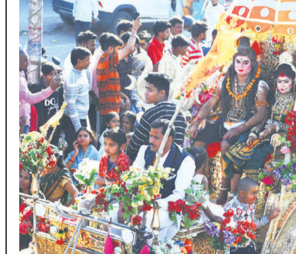
महाशिवरात्रि के पावन अवसर पर राजधानी लखनऊ के विभिन्न मंदिरों में भक्तों ने शिव की आराधना की। इसी कड़ी में टाकुरगंज में कल्याणगिरी मंदिर से निकली शिव बरात में भक्तों ने बद्ध-चढ़कर प्रतिभाग किया। इस अवसर पर झांकी भी निकाली गई जिसमें भक्तों का उत्साह देखते ही बना।