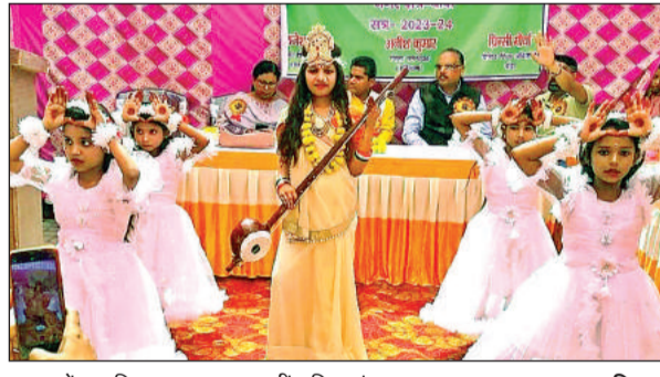
उत्सव में सामूहिक नृत्य प्रस्तुत करती बालिकाएं।