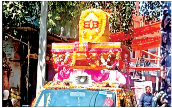
ब्रह्माकुमारियों ने निकाली शिव रथ यात्रा।