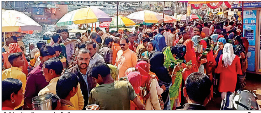
तीर्थक्षेत्र में लगी श्रद्धालुओं की भीड़।