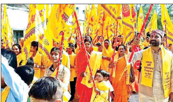
खाटू श्याम निशान यात्रा में शामिल श्रद्धालु।

अमृत विचार : गाजे-बाजे के साथ श्रद्धालुओं ने बाबा खाटू श्याम की निशान यात्रा निकालकर नगर भ्रमण किया। यात्रा में आस्था का सैलाब उमड़ पड़ा। हाथों में निशान लेकर कई किलोमीटर तक आस्था में सराबोर भक्त नंगे पैर चले। जगह-जगह लोगों ने पुष्प वर्षा कर निशान यात्रा की जोरदार अगुवानी की। बाबा श्याम की झांकी देखने एवं पूजा-अर्चन करने को सड़क किनारे भक्तों की कतारें लगी रहीं। बजनों पर खाटू श्याम के भक्त झूम उठे।