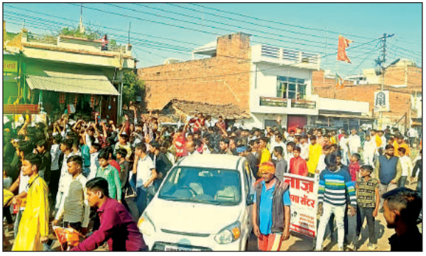
प्रभु के दर्शन को भक्तों की उमड़ी भीड़।