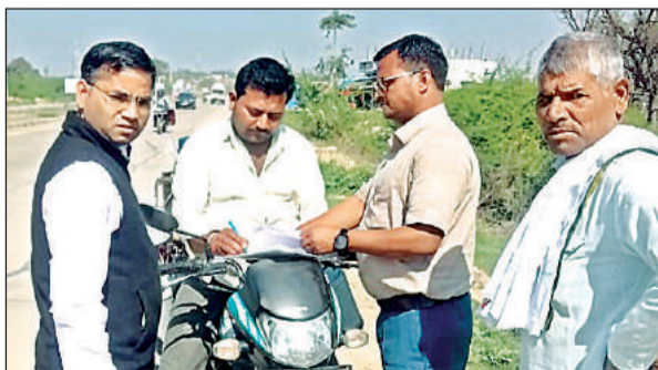
दूधिया को रोककर नमूना लेती टीम।

अमृत विचार। मिलावट खोरों से निपटने के लिए खाद्य सुरक्षा एवं औषधि विभाग जालौन के सचल दल ने विशेष अभियान चलाया। सर्वाधिक मिलावट वाले पदार्थ दूध एवं दुग्ध पदार्थ से बनी मिठाई, पनीर, दही आदि के नमूने लिए। खाद्य विभाग के छापेमारी अभियान से मिलावट खोरों में हड़कंप मच गया। टीम ने परचूनी की दुकानों से रिफाईंड ऑयल, सरसो तेल, दालचीनी के स्थान पर कैसिया नाम की लकड़ी के विक्रय किए जाने की आशंका से कई दुकानों से दल चीनी के सैंपल भरे तथा कस्बों के बाहर दूध वालों को रोक कर दूध के नमूने लिए।