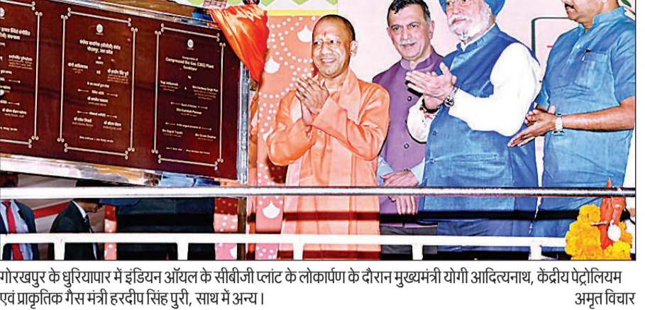
गोरखपुर के धुरियापार में इंडियन ऑयल के सीबीजी प्लांट के लोकार्पण के दौरान मुख्यमंत्री योगी आदित्यनाथ, केंद्रीय पेट्रोलियम एवं प्राकृतिक गैस मंत्री हरदीप सिंह पुरी, साथ में अन्य।

राज्य ब्यूरो, लखनऊ अमृत विचार : केंद्रीय पेट्रोलियम एवं प्राकृतिक गैस मंत्री हरदीप सिंह पुरी ने कहा है कि वर्तमान में उत्तर प्रदेश में दस सीबीजी प्लांट हैं और आने वाले समय में उप. में सौ सीबीजी प्लांट होंगे।