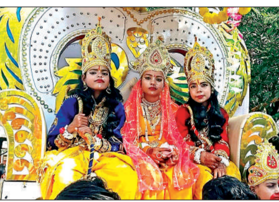
शिव बारात में शामिल श्रीराम-सीता-लक्ष्मण की झांकी।

फाग गीतों पर झुमे सुमेरपुर। गांव की चौपालें होली गीतों से गुंजायमान हो उठीं हैं।