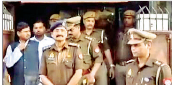
अस्पताल पहुंचकर जानकारी लेते पुलिस के अधिकारी।