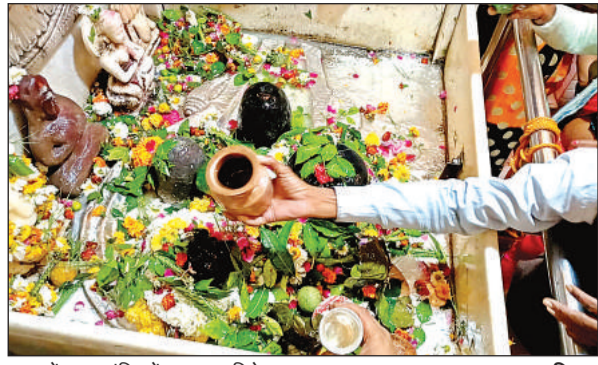
मतगजेंद्रनाथ मंदिर में हुआ जलाभिषेक।