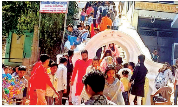
बलखंडेश्वर मंदिर में आते श्रद्धालु।