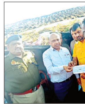
25 हजार का चेक देते एसडीएम।

सिसोलेर थाना क्षेत्र की रहने वाली गौंगरेप का शिकार किशोरियों के परिवारों की आर्थिक हालत बेहद दयनीय है। खास बात यह है कि एक किशोरी के पिता ने भी वारदात और धमकियों से आहत होकर फांसी लगाकर जान दे दी है, जिससे अब परिवार के सामने मुसीबतों के सिवा कुछ नहीं दिखाई दे रहा है, लेकिन प्रशासन इस मामले को किसी तरह दबाने के प्रयास में जुटा है। 28 फरवरी को गौंगरेप की वारदात, 29 फरवरी को दोनों