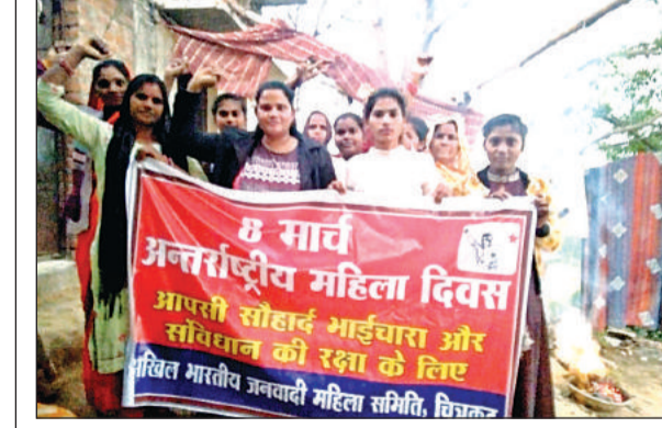
जागरूकता रैली निकालती जनवादी महिला समिति की कार्यकर्ता।