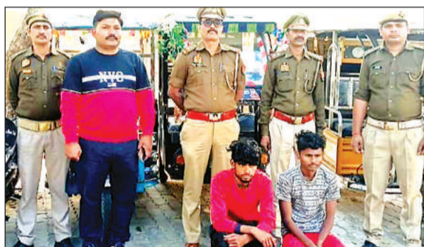
पुलिस हिरासत में ई रिक्शा के साथ दोनों शातिर लुटेरे।

ई-रिक्शा लूट की घटनाएं नगर कोतवाली, थाना कोतवाली देहात क्षेत्र से हुई थी जिनका पर्दाफाश किया गया। इसके लिए पुलिस अधीक्षक द्वारा टीम का गठन किया गया था और टीम के सदस्यों ने क्योटरा चैराहे से एक ई-रिक्शा एक अज्ञात अभियुक्त सवारी बनकर बैठ गया। भूरागढ़ चैकी क्षेत्र अंतर्गत त्रिवेणी बाईपास पहुंचे के बाद अभियुक्तों द्वारा ई-रिक्शा चालक से मारपीट की और ई-रिक्शा लूट लिया गया। घटना बीते 26 फरवरी की बताई गई है। यह मामला मटौध थाने में पंजीकृत किया गया था। इस संबंध में मुखबिर की सूचना पर शुक्रवार को नहर पुलिस मोहनपुरवा के पास से अभियुक्त को