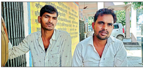
बिधनू पुलिस ने दोनों आरोपियों को गिरफ्तार किया।