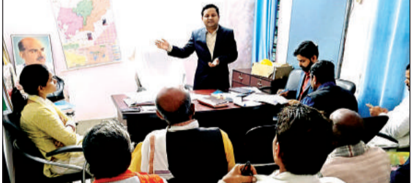
किसानों को जानकारी देते प्रशिक्षक।