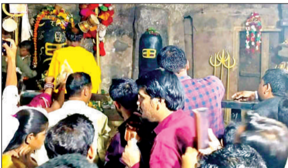
नीलकण्ठेश्वर मंदिर में दर्शन करते श्रद्धालु।