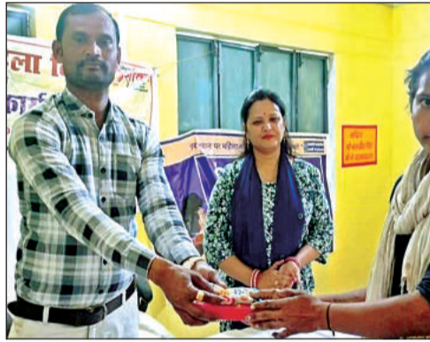
कार्यक्रम में बालिका को पुरस्कृत करते प्रधान।