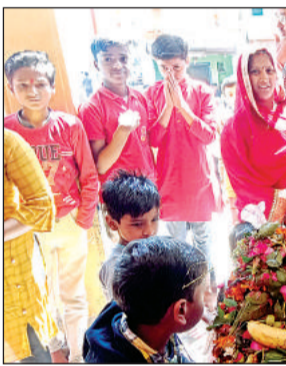
राजापुर स्थित मंदिर में पूजा अर्चना करते श्रद्धालु।