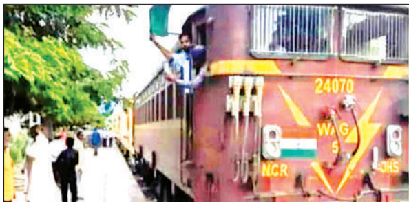
स्टेशन पर खड़ी ट्रेन।

कोरोना से पहले तक एट जक्शन में बॉम्बे बीटी, साबरमती समेत आधा दर्जन एक्सप्रेस ट्रेनों का स्टॉपेज था, मगर कोरोना काल में ट्रेनों का संचालन बंद कर दिया गया, पुनः ट्रेनों का संचालन तो शुरू हो गया मगर एक्सप्रेस ट्रेनों का एट स्टेशन का स्टॉप खत्म कर दिया गया है। जो आज तक शुरू नहीं हो