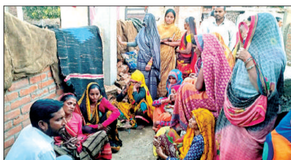
रोती-बिलखती परिवार की महिलाएं।

अमृत विचार। शहर कोतवाली के मेरापुर मोहल्ले में गुरुवार को युवती ने फांसी लगाकर आत्महत्या कर ली है। मृतका की मां ने आरोप लगाया कि बेटी की शादी तय हो गई थी। बेटी मंगेतर से फोन पर बात भी करती थी। लड़के ने बेटी से शादी को लेकर कुछ ऐसी बात कह दी, जो उसे नागवार गुजरी और उसने घर पर फांसी लगा ली। अस्पताल में युवती को मृत घोषित किए जाने पर परिजनो ने वहां हंगामा भी किया।