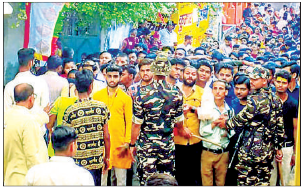
भीड़ को नियंत्रित करते एसएसबी के जवान।