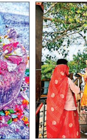
पहाड़ी के पालेश्वर नाथ धाम में पूजा करते श्रद्धालु।