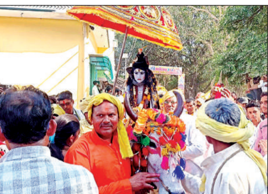
सर्रीला में बारात में निकली शिव की झांकी।

शुक्रवार को तड़के से ही प्राचीन श्री शल्लेश्वर मंदिर में कांवाड़ियों व भक्तों का तांता लग गया था। दोपहर से शुरू हुई शिवबारात में नंदी पर सवार शिव स्वरूप बालक आकर्षण का केन्द्र बना रहा। बारात में भूतप्रेत, संतों की टोली, पागल, बहुरूपिए, सजी हुई बैलगाड़ियां, दलदल घोड़ी की टोली, बैण्ड बाजे सहित अन्य कलाकार शामिल रहे। बच्चों की राधा कृष्ण, राम सीता, लक्ष्मण व हनुमान सहित तीन दर्जन से