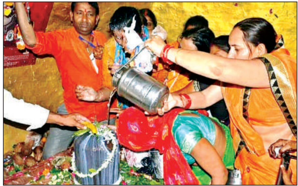
बामदेवेश्वर मंदिर में पूजा करते श्रद्धालु।