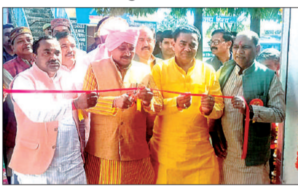
प्रदर्शनी का फीता काटकर उद्घाटन करते केन्द्रीय राज्यमंत्री भानु प्रताप सिंह वर्मा।