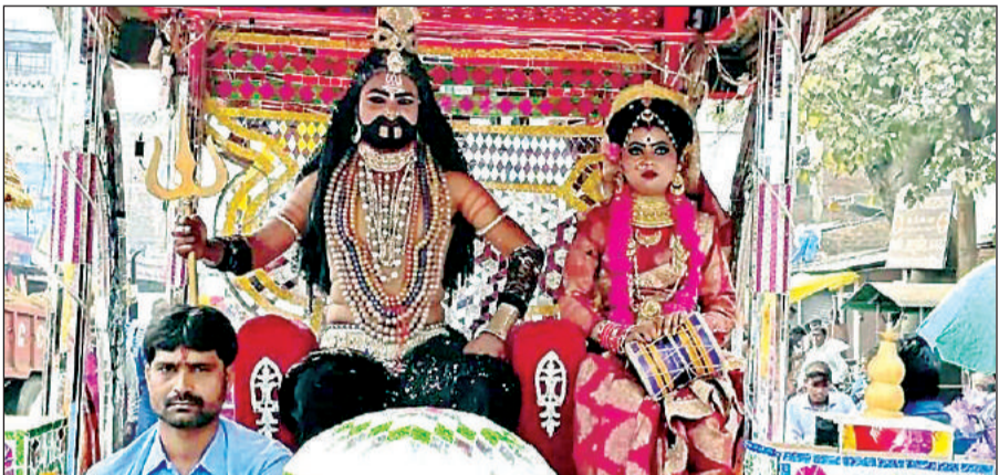
नरैनी कस्बे में निकाली गई शिव बरात।

आदिदेव महादेव के दरबार से कोई भक्त खाली हाथ नहीं लौटता। मान्यता है कि एक चावल का दाना मात्र अर्पित करने से भोला भंडारी जिस पर प्रसन्न होते हैं, तीन लोक की संपत्ति तक दान कर देता है। समूचे जनपद में महाशिवरात्रि का पर्व शुक्रवार को धूमधाम से मनाया गया। रात 2 बजे से ही श्रद्धालुओं