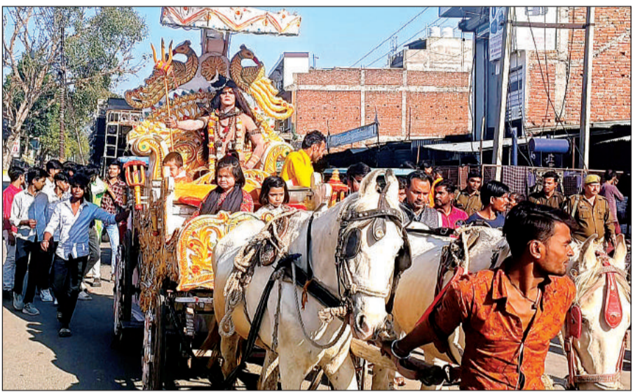
बाजार से रथ पर निकली भोलेनाथ की झांकी।

महाशिवरात्रि पर्व पर शुक्रवार को शिवालयों में शिव शंकर का विशेष