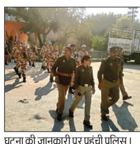
घटना की जानकारी पर पहुंची पुलिस।