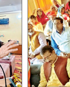
कार्यक्रम में मौजूद जनप्रतिनिधि और किसान व अन्य लोग।