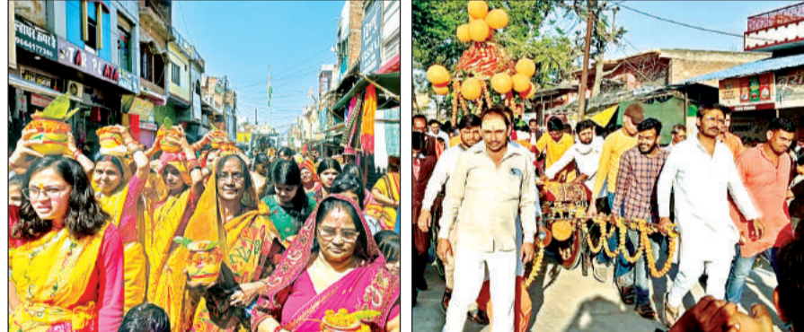
शिवरात्रि पर्व पर निकाली गई शोभायात्रा में शामिल श्रद्धालु।

अमृत विचार। जिले सहित कस्बों, गांवों में शिवरात्रि का पर्व धूमधाम से मनाया गया। पर्व के तहत जालौन के द्वारकाधीश बड़ी माता मंदिर प्रांगण से शोभायात्रा प्रारंभ होकर बस स्टैंड, खंडा चौराहा, बिजली घर, छोटी माता मंदिर, सब्जी मंडी होते हुए शिव मंदिर पर संपूर्ण हुई। शोभायात्रा में भगवान भोलेनाथ, मां पार्वती, की झांकी थी जो नगर के प्रमुख मार्गों से होकर निकाली गई। शोभायात्रा में भक्त डीजे की धुन पर भगवान भोलेनाथ के भजनों पर नाचते-गाते चल रहे थे। सैकड़ों की संख्या में महिलाएं पीतांबर वस्त्रों पहने हाथों में मंगल कलश लिए शोभा यात्रा को दिव्य स्वयं प्रदान कर रही थीं। अंत में मां गौरी के साथ भगवान भोलेनाथ की भव्य झांकी शोभायमान थी। शोभायात्रा का नगर में अनेक स्थानों पर भक्तजनों द्वारा पुष्प वर्षाकर स्वागत किया गया। अपने गंतव्य पर पहुंचकर यह शोभायात्रा भजन कीर्तन मंडली में परिवर्तित हो गई।