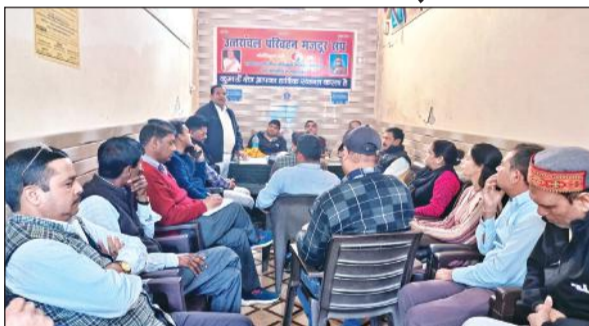
परिवहन मजदूर संघ की बैठक में मौजूद सदस्य।

रोडवेज स्टेशन में गुरुवार को परिवहन मजदूर संघ की बैठक हुई। बैठक में कर्मचारियों ने कहा कि निगम को राजकीय विभाग घोषित किया जाए और चारधाम यात्रा शुरू होने से पहले 500 बसें खरीदी जाएं। कहा कि उनकी मांगों को सरकार पूरी नहीं करती है तो संगठन आंदोलन करने को मजबूर