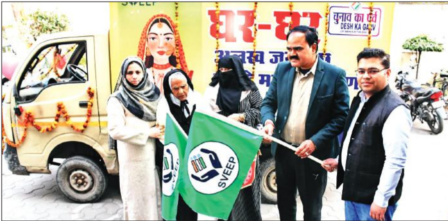
चुनाव रथ को रवाना करती 101 वर्षीय मतदाता मजीदन, साथ में सीडीओ व नगर आयुक्त।

मिश्रा ने कहा कि आदर्श आचार संहिता लगने के बाद पहले 24 घंटे में निजी परिसंपत्तियों से होर्डिंग्स, बैनर, पोस्टर, पंपलेट आदि हटाए जाएंगे। दीवारों की रंगाई-पुताई होगी। उन्होंने कहा कि यदि अभी से सरकारी कार्यालयों में होने वाले पत्राचारों में प्रयुक्त डाक लिफाफों पर चुनाव का पर्व देश का गर्व, लोकतंत्र का सम्मान करें शत प्रतिशत मतदान करें थीम मुद्रित कर भेजे जाएंगे इससे चुनाव में मतदान प्रतिशत बढ़ेगा। बैठक में सभी नगर निकायों के ईओ, जिला पंचायत अधिकारी आदि मौजूद रहे।