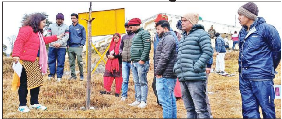
कीवी के पौधों के वैज्ञानिक तरीके से रोपण की जानकारी देते उद्यान के वैज्ञानिक।