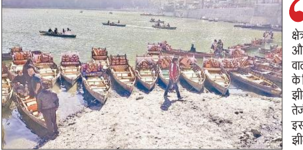
मल्लीताल स्थित बोट स्टैंड के पास झील में उभरने लगे डेल्टा। ● अमृत विचार

बीते 5 सालों की अपेक्षा इस बार नैनीताल में बारिश और बर्फबारी औसतन कम हुई है। इसकी वजह