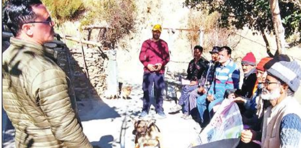
जिले के दूरस्थ गांवों में मतदाताओं को मतदान के लिए जागरूक करती स्वीप टीम।