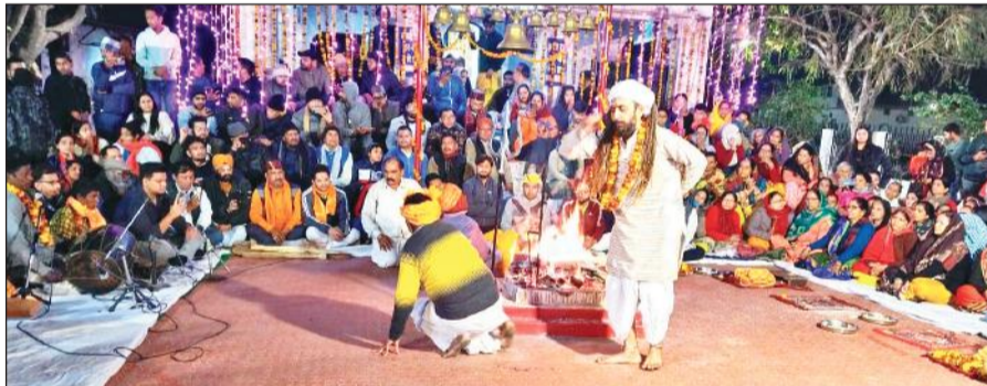
पर्वतीय सांस्कृतिक उत्थान मंच में जागर में मौजूद श्रद्धालु। ● अमृत विचार