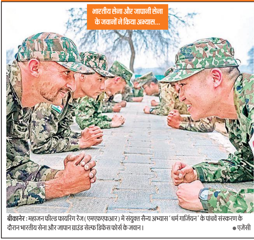
बीकानेर - महाजन फील्ड फायरिंग रेंज (एमएफएफआर) में संयुक्त सैन्य अभ्यास 'धर्म गार्जियन' के पांचवें संस्करण के दौरान भारतीय सेना और जापान ग्राउंड सेल्फ डिफेंस फोर्स के जवान।

तिरुवनंतपुरम। राष्ट्रपति द्रौपदी मुर्मू ने राज्य विधानसभा द्वारा पारित केरल लोकायुक्त विधेयक को मंजूरी दे दी है लेकिन उन्होंने तीन विश्वविद्यालय कानून विधेयकों पर अपनी स्वीकृति अभी नहीं दी है। राज्यपाल आरिफ मोहम्मद खान ने राष्ट्रपति को ये विधेयक उनकी स्वीकृति के लिए भेजे थे। राजभवन ने बृहस्पतिवार को एक बयान में कहा कि राष्ट्रपति ने केरल विश्वविद्यालय कानून (संशोधन संस्था 2) विधेयक 2022 पर अभी अपनी स्वीकृति नहीं दी है। बयान के अनुसार इसके अलावा विश्वविद्यालय कानून संशोधन विधेयक, 2022 और विश्वविद्यालय कानून संशोधन विधेयक, 2021 को भी राष्ट्रपति को मंजूरी नहीं मिली है। राष्ट्रपति को भेजे गए सात विधेयकों में से केवल एक विधेयक केरल लोकायुक्त संशोधन विधेयक, 2022 को सहमति दी गई है।