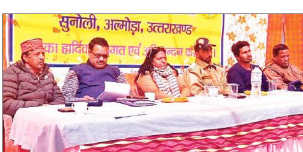
ताकुला में आयोजित बैठक में मंवासीन अतिथि।

बैठक के दौरान संस्था के सहयोग से बनाई गई ग्राम पंचायत विकास योजना में शामिल मुद्दों पर