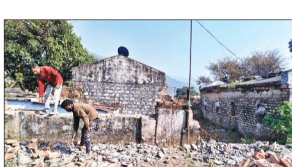
काठगोदाम में बनने वाले हिल डिपो के लिए पुराने भवनों को ध्वस्त करने की कार्रवाई हुई।