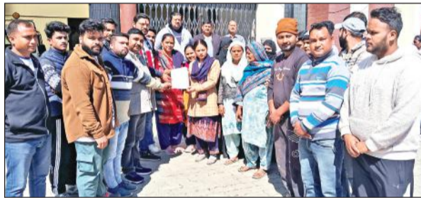
एसडीएम को ज्ञापन देते क्षेत्रवासी।