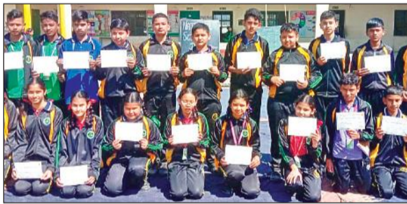
मैक्सटन स्ट्रॉग स्कूल में छात्र-छात्राएं अपने प्रमाण पत्र के साथ।

कक्षा 4 व 5 को वैज्ञानिक सीवी रमन के जीवन पर आधारित बायोग्राफी दिखाई गईं। वहीं छात्र-छात्राओं के द्वारा विज्ञान वरदान