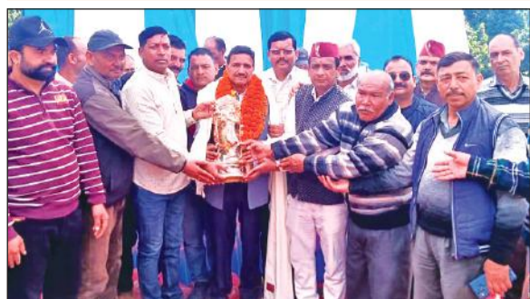
कालाढूंगी में यूसी उपेती को सम्मानित करते ठेकेदार। ● अमृत विचार