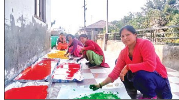
भीमताल विकासखंड में मोबिलाइजेशन कैंप। • अमृत विचार