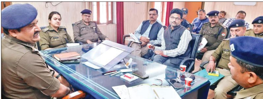
काशीपुर में कांठड़ यात्रा को लेकर बैठक करते प्रशासनिक व पुलिस अधिकारी।