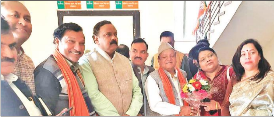
रुद्रपुर में लोकसभा क्षेत्र प्रभारी का स्वागत करते भाजपा कार्यकर्ता।