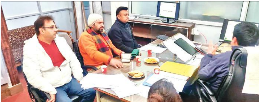
बैठक में प्रतिभाग करते मां नयना देवी व्यापार मंडल के पदाधिकारी। • अमृत विचार

मीटिंग में वन टाइम सेटलमेंट स्कीम 2023-24 के संबंध में व पुराना बकाया और वेट बकाया वसूली के संबंध में एक सूची व्यापार मंडल को उपलब्ध कराई है। विभाग द्वारा व्यापार मंडल से संबंधित नामों को सूची के अनुसार