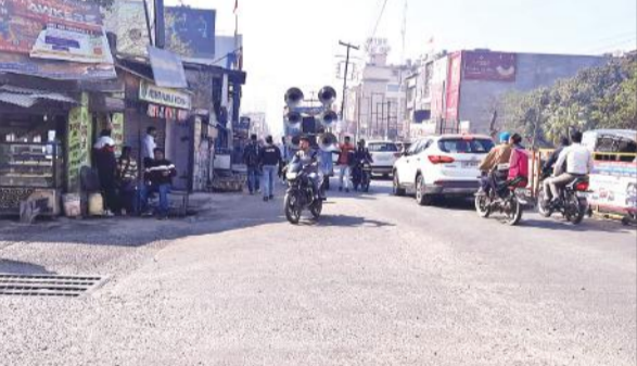
काशीपुर में गलत दिशा में बाइक जाते लोग। ● अमृत विचार

वर्तमान में बाजपुर रोड पर फ्लाइंग ओवर के निर्माणधीन होने से बाजपुर रोड पर यातायात पूरी तरह से बंद है। जिसके चलते वाहनों की