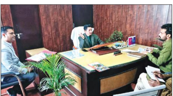
खटीमा में पल्स पोलियो अभियान को लेकर बैठक लेते एसडीएम बिष्ट।

खुराक पिला सके। कोई भी बच्चा पोलियो खुराक से वंचित न रहे इस