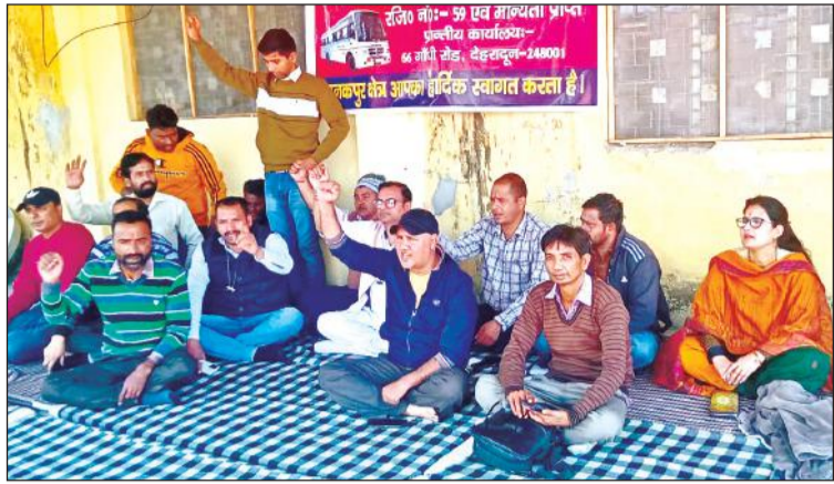
टनकपुर रोडवेज कार्यशाला परिसर में प्रदर्शन करते रोडवेज के कर्मचारी।