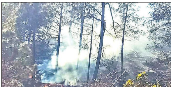
सल्ट के कालीगांव में आग से धधकता जंगल। • अमृत विचार

अमृत विचार : जिले के विकास खंड सट्ट में वनानि की घटनाएं रुकने का नाम नहीं ले रही हैं। बीते दिनों ब्लॉक मुख्यालय मौलेखाल से सटे जंगल के बाद गुरुवार को करीब चार किमी दूर कालीगांव में जंगल भयानक आग से धधक गए। वनानि के कारण दिन भर जंगल जलते रहे, लेकिन शिकायत के बाद भी वन विभाग का कोई अधिकारी मौके पर नहीं पहुंचा। वन विभाग जंगलों की आग पर काबू पाने के लिए भले ही तमाम प्रयास करने के दावे क्यों ना कर रहा हो, लेकिन सच्चाई यह है कि