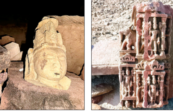
ये मूर्ति भी निकली।