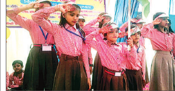
कार्यक्रम में बच्चों ने देशभक्ति गीत पर दी सलामी।