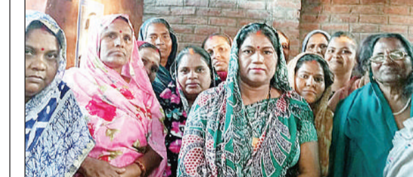
महिलाओं के साथ भाजपा पदाधिकारी। अमृत विचार