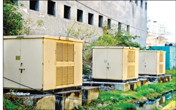
परिसर में रखे उपकरण व जनरेटर कंठम हो गए।

। पांडु नगर बीमा अस्पताल परिसर में निमाणाधीन सुपर स्पेशिएलिटी हॉस्पिटल के संकट के पत्र मुख्यमंत्री योगी आदित्यनाथ के कार्यालय तक भी पहुंचे थे, लेकिन कुछ न हुआ। केंद्रीय मंत्री तक भी मामला जा चुका है पर सब शांत बैठे हैं। ऐसा तब है जब केंद्रीय स्वास्थ्य मंत्री डॉ. मनसुख मंडविया और प्रदेश के स्वास्थ्य मंत्री ब्रजेश पाठक स्वास्थ्य सुविधाओं के बेहतर होने का दावा कर रहे हैं।