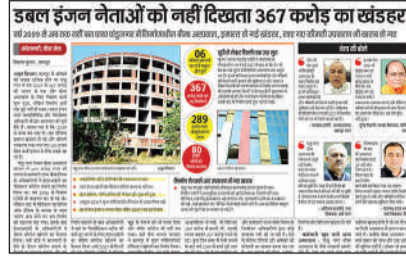
डबल इंजन नेताओं को नहीं दिखाता 367 करोड़ का खंडहर 29 फरवरी के अंक में छपी खबर। अमृत विचार

■ पांडु नगर अस्पताल को राज्य से हैंडओवर की हुई थी बात