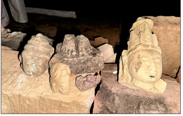
देवी-देवताओं की मूर्तियों के ऐसे टुकड़े मिले।

अमृत विचार। क्षेत्र के परास गांव में प्राचीन मंदिर रख रखाव के अभाव में खंडहर हो गया था। ग्रामीणों के द्वारा मंदिर का निर्माण कार्य शुरू कराया गया है। जिसके लिए नींव की खोदाई चल रही है, जिसमें कई प्राचीन मूर्तियां निकली हैं। सभी मूर्तियां खंडित हैं। खोदाई में मंदिर का बना हुआ चबूतरा भी निकला। चबूतरे में चारों तरफ सीढियां बनी हैं। गांव के बुजुर्गों का कहना है, कि लगभग 60 वर्ष पहले यहां पर पुरातत्व विभाग की टीम आई थी। तत्कालीन ग्राम प्रधान से टीम ने मंदिर की मूर्तियां को लेकर लखनऊ चले गए थे। मूर्तियां जाने के बाद मंदिर खंडहर में तब्दील होकर ध्वस्त हो गया था। बुधवार देर शाम नींव की खोदाई के दौरान यहां एक दर्जन से अधिक खंडित मूर्तियां निकली। जिन्हें ग्रामीणों ने सहेज कर बगल में बने प्राचीन शिव मंदिर के चबूतरे पर रखा है। खोदाई के दौरान यहां पर दो शिलापट भी निकले हैं। इस तरह का