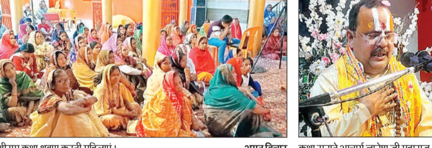
श्रीराम कथा श्रवण करती महिलाएं।