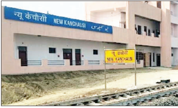
न्यू कंचौसी का स्टेशन।

अमृत विचार। आजादी के लंबे अंतराल के बाद भी कानपुर देहात व औरैया जनपदों की सीमा पर बसा कंचौसी प्रदेश व देश की विकास रफ्तार से अभी कौनों दूर है। जहां जनता के मूलभूत साधनों के लाले हैं। आज जब कंचौसी कानपुर देहात नगर पंचायत का हिस्सा बन गया है। जिसका बड़ा भाग पहले से न्यू कंचौसी रेलवे स्टेशन जो बान परजनी गांव के मध्य नया बना डीएफसी का स्टेशन है। उसी नाम से राज्य सरकार द्वारा औद्योगिक क्षेत्र नगर पंचायत बनने से पहले सरकारी अभिलेखों में बना दिया गया था। लेकिन, आज भी यह क्षेत्र गांव है और यहां के वाशिंग ग्रामीण परिवेश में मेहनत मजदूरी कर गुजर बसर लिए परीक्षणशाला बिजवा दिया।