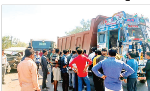
दुर्घटना के बाद जाम हटाने लोग।

गुरुवार दोपहर लगभग बारह बजे एक कार में सवार चार लोग कानपुर से लखनऊ जा रहे थे, जैसी ही हाइवे स्थित कल्लपुरवा गांव के पास पहुंचे तो उनकी कार अनियंत्रित हो गई और डिवाइडर से टकरा गई। कार की रफ्तार तेज होने के कारण लखनऊ से कानपुर की ओर जा रहे एक ट्रक से भिड़ गई। जिससे कार में सवार चार लोग गंभीर रूप से घायल हो गये। दुर्घटना देख आस पास के लोग दौड़े और घायलों को बाहर निकला। जिसके बाद उन्हें इलाज के लिये एक निजी अस्पताल ले जाया