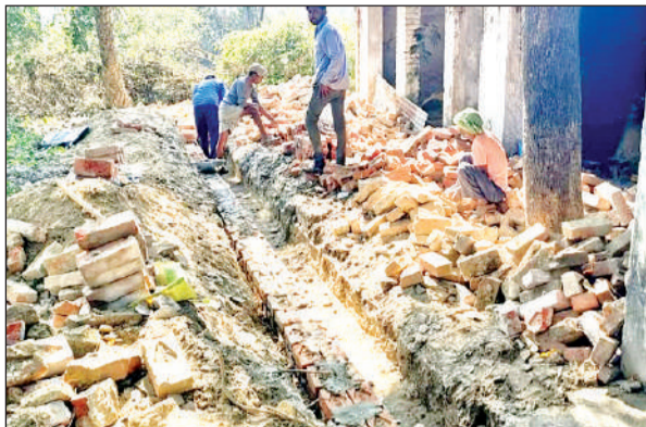
पुरानी ईंट से निर्माण करते मजदूर।

एक ओर सरकार किसानों के हित में तमाम योजनाएं धरातल पर ला रही है। लेकिन भ्रष्ट अधिकारी अपनी आदत से बाज नहीं आ रहे हैं। निजी को तो छोड़ ही दे सरकारी काम में भी जमकर भ्रष्टाचार हो रहा है। सोहरामऊ थानाक्षेत्र के गांव अर्जुनामऊ में सई नदी किनारे कई वर्षों पुराना एक पंपसेट बनी