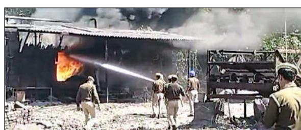
फैक्ट्री में लगी आग बुझाने दमकल कर्मों।

दही थानांतर्गत इंडस्ट्रियल एरिया में मोहन स्टील फैक्ट्री बोते पांच