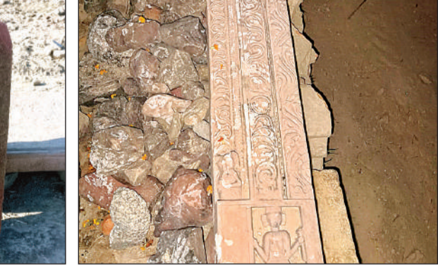
ये शिलापट बहेटा बुजुर्ग मंदिर से मिलते-जुलते।

मंदिर के निर्माण कार्य को देखने और ग्रामीणों के द्वारा दिए जा रहे चंदे का रख रखाव करने के लिए गांव के ग्यारह लोगों की समिति बनाई गई है। समिति के लोगों का कहना है, कि ठाकुर जी के मंदिर का गर्भगृह बनाने के बाद वह लोग कानपुर डीएम से मुलाकात कर मांग पत्र सौंपेंगे। समिति के सदस्यों की मांग सिर्फ ठाकुर जी की मूर्तियों को पुरातत्व विभाग से वापस लेकर मंदिर में स्थापित करवाना है।