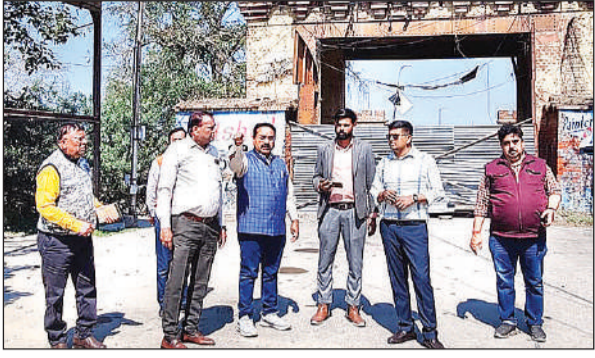
पुराने गंगा पुल के बंद प्रवेश द्वार पर निरीक्षण करते नगर आयुक्त व अधिकारी।