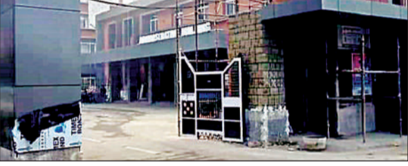
मोतीझील स्थित नगर निगम मुख्यालय।

अमृत विचार। गृहकार वसूली के दौरान बड़े बकाएदारों से ली गई 13.83 करोड़ रुपये की चेकें बाउंस हो गई हैं। इतनी बड़ी राशि की चेकें बाउंस होने के बावजूद नगर निगम अधिकारी बकाएदारों के खिलाफ किसी कार्रवाई से बच रहे हैं। लेखा विभाग की रिपोर्ट पर मुख्य कर निर्धारण अधिकारी ने सभी जोनल अधिकारियों से चेक बाउंस होने के बाद फॉलोअप रिपोर्ट मांगी है। नगर आयुक्त ने मामले की जांच के आदेश दिए हैं।