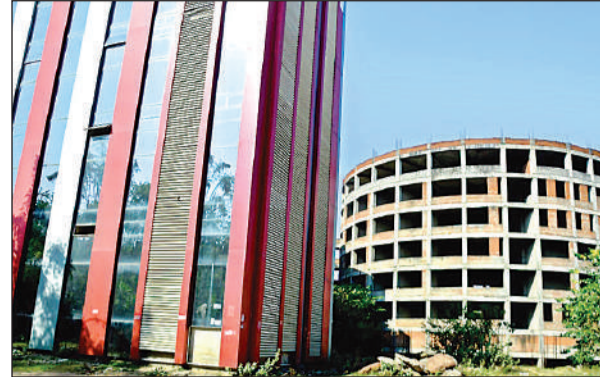
निर्माण कार्य बंद होने से बिल्डिंग में लगे कांच टूट रहे। अमृत विचार

बदहाली का दंश झेल रहे हैं। वर्ष 2009 से पांडु नगर स्थित बीमा अस्पताल परिसर में 367 करोड़ से बन रही छह मंजिला इमारत का निर्माण कार्य भी अटका हुआ है। ऐसा तब है जब केंद्र में वर्ष 2014 में भाजपा सरकार बनने के बाद तत्कालीन केंद्रीय श्रम मंत्री दत्तात्रेय ने छह अक्टूबर 2016 में पांडु नगर में सुपर स्पेशिएलिटी