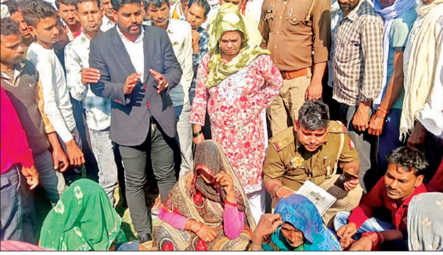
छात्र की मौत से पुरे परिवार में कोहराम मच गया।