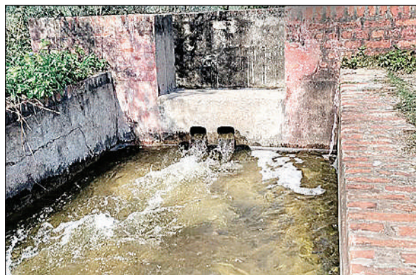
कैनाल से निकलती नहर।

भूमाफियाओं ने विभागीय सेंटिंग से कब्जा कर लिया है। क्षेत्र में चर्चा है कि नहर पर मकान बनाकर रह रहे लोग जिम्मेदारों को धन भी देते हैं। वहीं, दूसरी ओर गांव अर्जुनामऊ में कैनाल के पास एक कार्यालय का निर्माण हो रहा है। जिसमें