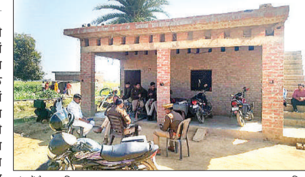
गांव में तेनात पुलिस।

परिजनों का कहना था कि दोनों एक साथ रहा करती थीं। बुधवार शाम को परिजनों को खाना देने के बाद दोनों बाहर निकल गईं। दोनों खेलने के लिए बताकर निकलीं थीं लेकिन इसके बाद रात तक उन्हें