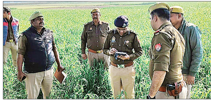
भट्टे के पास खेत में जांच करते पुलिसकर्मी।

एक किशोरी के पिता ने बताया कि उसकी किसी से कोई दुश्मनी नहीं है। एक किशोरी की मां का