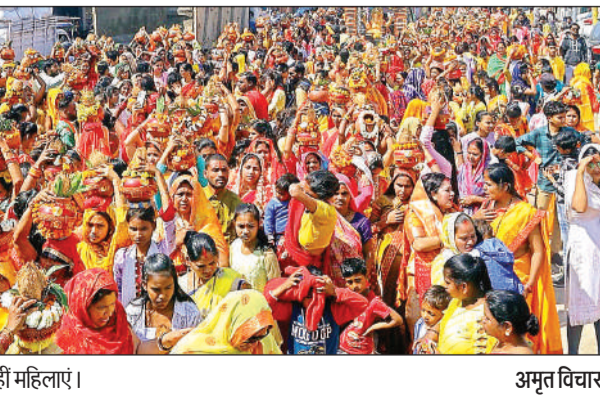
कलश लेकर चल रही महिलाएं।