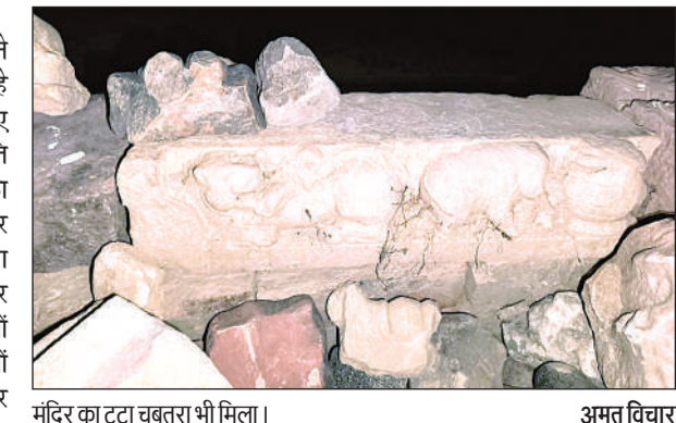
मंदिर का टूटा चबूतरा भी मिला।