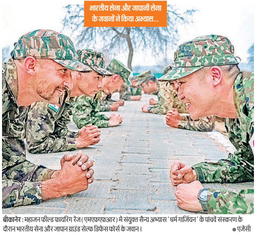
बीकानेर - महाजन फील्ड फायरिंग रेंज (एमएफएफआर) में संयुक्त सैन्य अभ्यास 'धर्म गार्जियन' के पांचवें संस्करण के दौरान भारतीय सेना और जापान ग्राउंड सेल्फ डिफेंस फोर्स के जवान।

तिरुवनंतपुरम। राष्ट्रपति द्रौपदी मुर्मू ने राज्य विधानसभा द्वारा पारित केरल लोकायुक्त विधेयक को मंजूरी दे दी है लेकिन उन्होंने तीन विश्वविद्यालय कानून विधेयकों पर अपनी स्वीकृति अभी नहीं दी है। राज्यपाल आरिफ मोहम्मद खान ने राष्ट्रपति को ये विधेयक उनकी स्वीकृति के लिए भेजे थे। राजभवन ने बृहस्पतिवार को एक बयान में कहा कि राष्ट्रपति ने केरल विश्वविद्यालय कानून (संशोधन संख्या 2) विधेयक 2022 पर अभी अपनी स्वीकृति नहीं दी है। बयान के अनुसार इसके अलावा विश्वविद्यालय कानून संशोधन विधेयक, 2022 और विश्वविद्यालय कानून संशोधन विधेयक, 2021 को भी राष्ट्रपति को मंजूरी नहीं मिली है। राष्ट्रपति को भेजे गए सात विधेयकों में से केवल एक विधेयक केरल लोकायुक्त संशोधन विधेयक, 2022 को सहमति दी गई है।