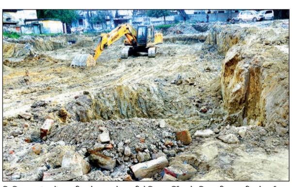
सिविल लाईंस में तहसील के सामने मल्टीलेवल पार्किंग के लिए की जा रही खोदाई।

अमृत विचार । तहसील कैंपस में प्रस्तावित मल्टीलेवल पार्किंग के निर्माण से पहले यहां खोदाई का कार्य शुरू हो गया है। जल निगम की कंपनी कंस्ट्रक्शन एंड डिजाइन सर्विसेज (सीएंडडीएस) ने प्रस्तावित स्थल पर लेबलिंग के साथ ही मिट्टी का परीक्षण के लिये खोदाई कार्य शुरू किया है। इससे पहले विभाग ने नगर निगम को पत्र लिखकर यहां बने आरआई बंगला और पुराने आवासीय भवन को ध्वस्त करने या शिफ्ट करने के लिये पत्र लिखा था ताकि, सिविल कार्य शुरू हो सके। वहीं, सिविल वर्क शुरू करने के लिये एएसआई