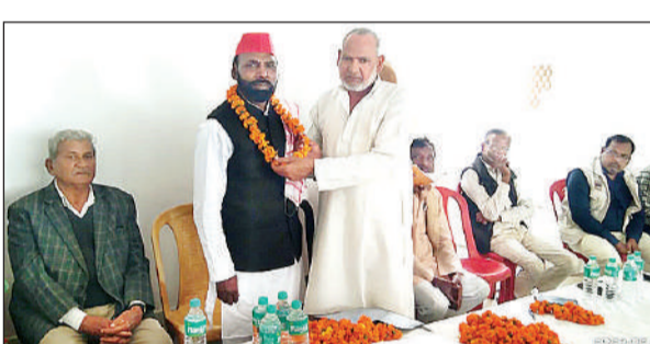
पूर्व प्रदेश अध्यक्ष का स्वागत करते कार्यकर्ता।