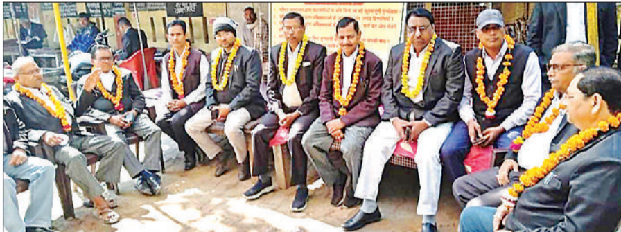
जिला जज जी गेट के सामने धरना-प्रदर्शन करते अधिवक्ता।