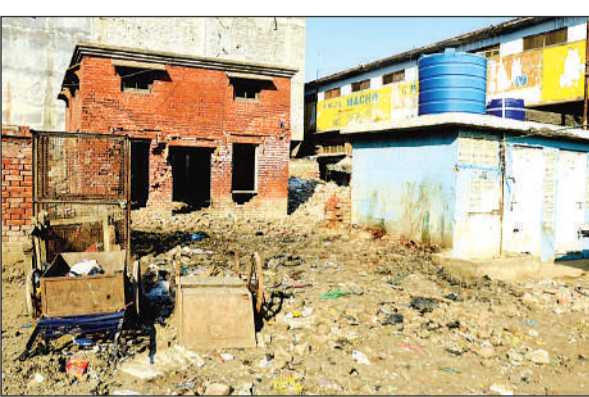
बंद स्लॉटर हाउस में गंदगी का अंबार। अमृत विचार

बीते सात सालों से बंद पड़ा है यूरिनल रोजाना तकरीबन एक हजार से भी अधिक महिलाएं बाजार में आती हैं। व्यापारियों ने बताया कि बाजार में एक ही यूरिनल नहीं है। करीब सात साल पहले नगर निगम ने स्लॉटर हाउस के पास यूरिनल बनाया था, लेकिन वह अब तक शुरू नहीं हो पाया।