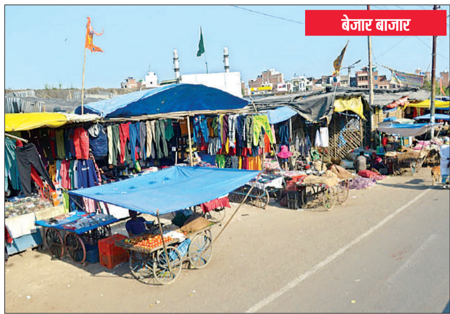
सड़क तक लगी है दुकानें। अमृत विचार

अमृत विचार। 25 लाख रुपये का रोजाना कारोबार करने वाली बाकरगंज बाजार के व्यापारी अव्यवस्थाओं के संक्रमण से परेशान हैं। करीब 90 साल पुराने संकरी गलियों में बसे इस बाजार की सबसे बड़ी समस्या है वर्षों से बंद पड़ा स्लॉटर हाउस। स्लॉटर हाउस में गंदगी का अंबार व सुअरों के आतंक के कारण व्यापारियों के जीना दुश्वार बना हुआ है। साथ ही बाजार की गलियां जर्जर पड़ी हैं, जल निकासी की सुविधा का बाजार में कोई इंतजाम नहीं है। नालियों की सफाई न होने के कारण बाजार में प्रवेश करने वाले मुख्य मार्गों पर जलभराव की समस्या बनी रहती है। बाकरगंज बाजार में किराना, गल्ला, सब्जी मंडी के साथ ही कपड़ा व रेडीमेड के साथ ही चूड़ी, कॉस्मेटिक व्यापारियों की करीब 500 से अधिक दुकानें हैं। मध्यवर्गीय लोगों की बाकरगंज बाजार में पिछले 15-16 सालों से स्लॉटर हाउस बंद पड़ा है। बाजार के पिछले हिस्से में स्थित स्लॉटर हाउस की बाउंड्री टूटी पड़ी है। जिसमें क्षेत्र