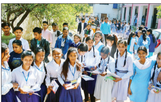
बोर्ड परीक्षा देकर बाहर निकलते परीक्षार्थी।

अमृत विचार। यूपी बोर्ड परीक्षा के दौरान गुरुवार को शिक्षा अधिकारी अलर्ट मोड पर रहे। इसकी वजह आगरा में पेपर आउट होने की सूचना रही। शिक्षा अधिकारियों और उड़नदस्तों ने परीक्षा केंद्रों पर जाकर सघन निगरानी की। ऑनलाइन कंट्रोल रूम में भी अधिकारियों के दौरे होते रहे। कंट्रोल रूम में ड्यूटी पर तैनात शिक्षकों व कर्मचारियों को विशेष निर्देश दिए गए। बोर्ड परीक्षा में सुबह हाईस्कूल के परीक्षार्थियों ने विज्ञान और दूसरी पाली में इंटर के परीक्षार्थियों ने जीव विज्ञान और गणित का प्रश्न पत्र दिया। पहली पाली में हुई परीक्षा में 50,384 में 47,970 परीक्षार्थियों ने परीक्षा दी। 2,414 परीक्षार्थी अनुपस्थित रहे। दूसरी पाली में इंटर जीव विज्ञान में 16,351 में 15,556 ने परीक्षा दी। इस परीक्षा में 786 परीक्षार्थी अनुपस्थित रहे। गणित के प्रश्न पत्र में 17,518 परीक्षार्थियों में 16,695 ने परीक्षा दी। 823 परीक्षार्थी अनुपस्थित रहे। कठिन विषयों की परीक्षा होने से अधिकारियों ने केंद्रों पर दौरे किए। जिला विद्यालय निरीक्षक ने दोनों पालियों में जीबीएस इंटर कॉलेज, करचूलीपुर, बीआरडी इंटर कॉलेज, वरूई, दयानंद ज्वाला प्रसाद इंटर कॉलेज, कुढ़नी, श्री पथिक शिक्षा परिषद इंटर कॉलेज, साढ़ और पं. बेनी सिंह इंटर कॉलेज भीतरगांव समेत 17 केंद्रों का निरीक्षण किया।