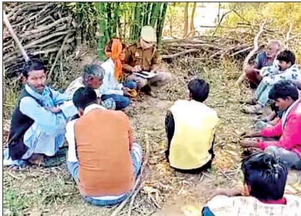
पुलिस ने गांव वालों से घटना के बारे में छानबीन की।

जो विरोध करने की जुरत करता है, उसके खिलाफ थाने और पुलिस अधिकारियों तक फर्जी शिकायत कर इतना परेशान कर देती है कि लोग अपना मुंह बंद रखने को मजबूर हो जाते हैं। यही उसने किशोरी के पिता के साथ करने की कोशिश की, जिससे आहत होकर उसने कानूनी लड़ाई लड़ने के बजाय मौत को गले लगा लिया।