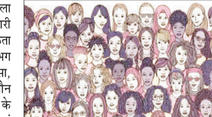
अंतर्राष्ट्रीय महिला दिवस

किशोरवय लड़कियों और उनका स्वास्थ्य: वर्ष 2019-21 के दौरान संपन्न पांचवें 'राष्ट्रीय परिवार स्वास्थ्य सर्वेक्षण' के अनुसार 10 से 19 वर्षीय भारतीय किशोरवय पांच लड़कियों में तीन लड़कियां एनीमिया से पीड़ित हैं जब कि ऐसे लड़कों की संख्या लगभग 28 प्रतिशत है। यह किशोरवय लड़कियों के दीर्घकालिक गंभीर स्वास्थ्य जटिलताओं से प्रभावित होने की एक विशेष स्वास्थ्य चुनौती है, जो उनके बौद्धिक और शारीरिक विकास में बाधक हो सकती है। लौह की कमी से उत्पन्न एनीमिया व्यक्तियों और संपूर्ण आबादी की कार्य क्षमता घटा देती है। विश्व स्वास्थ्य संगठन के अनुसार इस स्थिति से उत्पन्न गंभीर आर्थिक संकट राष्ट्र की विकास में बाधक होता है। जर्नल ऑफ़ न्यूट्रिशन में वर्ष 2002 में संपन्न एक अध्ययन पर प्रकाशित रिपोर्ट के अनुसार एनीमिया के कारण कठोर शारीरिक श्रम करने वाले मजदूरों की उत्पादक क्षमता में लगभग 17 प्रतिशत और मध्यम श्रेणी के कार्यों से जुड़े व्यक्तियों में 5 प्रतिशत की गिरावट पाई गई। 15 से 19 वर्षीय प्रति 1000 महिलाओं में प्रजनन क्षमता दर 'राष्ट्रीय परिवार स्वास्थ्य सर्वेक्षण-4' (2015-16) में 51 से घटकर 'राष्ट्रीय परिवार स्वास्थ्य सर्वेक्षण-5' (2019-21) में 43 पाई गई है। राष्ट्रीय परिवार स्वास्थ्य सर्वेक्षण-5 के अनुसार 15 से 19 वर्षीय आयु वर्ग की लगभग 6.8 प्रतिशत किशोरवय लड़कियों पर मातृत्व भार पड़ गया था।