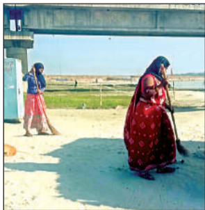
घाटों की सफाई करते पालिका कर्मी।