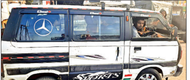
वैन में भूसे की तरह भरे गए बच्चे।

अमृत विचार। शुक्लागंज से तमाम बच्चे कानपुर के अलावा आस पास पढ़ने के लिये जाते हैं। जिसमें अधिकांश बच्चे स्कूली वैन और प्राइवेट वैन के सहारे अपने विद्यालयों तक पहुंच रहे हैं। अगर देखा जाये तो अधिकांश वैन मानक विहीन हैं। वैन में आग बुझाने के साधन भी नहीं हैं। जिससे गंगाघाट क्षेत्र में भी कानपुर और उन्नाव के सोहरामऊ जैसी घटना हो सकती है। शुक्लागंज के अलावा आस पास क्षेत्रों के अधिकांश बच्चे कानपुर में पढ़ाई करने जाते हैं। जिन्हें लाने के लिये अधिभावकों ने प्राइवेट