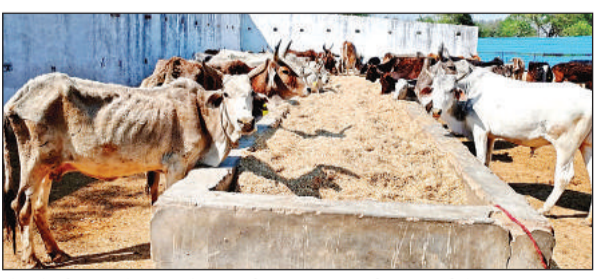
गोवंशों की हालत देखकर गोशाला की व्यवस्थाएं समझी जा सकती हैं। अमृत विचार

पड़री लालपुर गोशाला भीतरगांव रोड पर बंवा के किनारे करीब पांच बोधे में फैली है। करीब एक बोधे में गोवंशों को बांधने लिए दो टिनशेड और चारा भंडारण के लिए एक स्टोर बना हुआ है। करीब चार बोधा जमीन गोवंशों के चारे की व्यवस्था