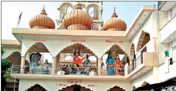
दक्षिण क्षेत्र में बने बाराहदेवी मंदिर में स्थापित देवी की मूर्ति।