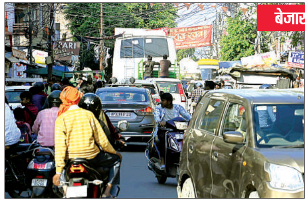
मेन रोड पर वाहन रेंगते हैं।

अमृत विचार। इलेक्ट्रॉनिक्स गुड्स के लिए प्रख्यात जवाहर नगर, नेहरू नगर बाजार की सबसे बड़ी समस्या पार्किंग व यूरिनल है। पूरे बाजार में एक भी यूरिनल न होने के कारण व्यापारियों व ग्राहकों को पार्क व गलियों में लघुशुंका के लिए जाना पड़ता है। जिस कारण रिहायशी क्षेत्र के लोगों को गंदगी व दुर्गंध की समस्या उठानी पड़ती है। पार्किंग न होने से सड़कों पर वाहन खड़े होते हैं, जिस कारण थोड़ी-थोड़ी देर में जाम की समस्या होती है। अतिक्रमण के कारण फुटपाथ पूरी तरह से गुम है। बाजार में करीब 150 इलेक्ट्रॉनिक्स व इलेक्ट्रिकल्स दुकाने होने के साथ ही जनरल मर्चेट, रेस्टोरेंट, फर्नीचर के साथ अन्य प्रतिष्ठान हैं। प्रदेश भर में इनवर्टर, स्टेपलाइजर्स की सप्लाई होती है। बाजार में आम दिनों में एक से डेढ़ हजार तक ग्राहकों का आवागमन होता है। करीब 10 से 15 लाख का रोजाना का टर्नओवर देने वाली जवाहर नगर बाजार में सबसे प्रमुख यूरिनल व पार्किंग की समस्या है। अतिक्रमण भी एक प्रमुख समस्या