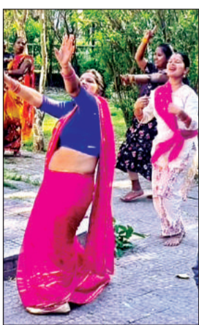
सखी केंद्र की थिरकती महिलाएं।