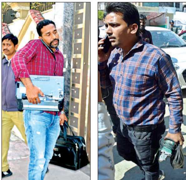
सपा विधायक के घर ईडी कर्मियों फोटो कॉपी मशीन लेकर जाते हुए।