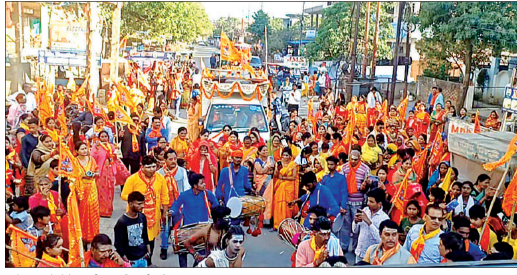
यशोदानगर से भोलेनाथ की बारात निकाली गई।