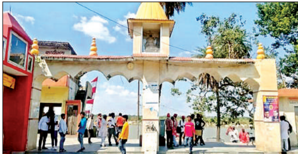
मेस्कर घाट का मुख्य द्वार।