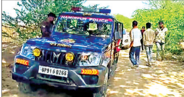
दो दिन से गांव में सिसौलर थाने की पुलिस दस्तक दे रही है।

पीड़ित परिवार को मुकदमे में राजीनामा करने की लगातार धमकियां मिल रही थीं। परिवार