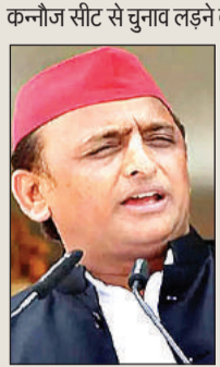
सिर्फ एक समाज की नहीं, बल्कि देश की दुश्मन है।

कन्नौज सीट से चुनाव लड़ने की चर्चाओं पर अखिलेश यादव ने कहा हम लड़ेंगे भी और लड़ाएंगे भी। अब सब कुछ किया जाएगा। कन्नौज ही नहीं, यूपी की सभी 80 सीटों पर बीजेपी को हराने का काम किया जाएगा। हम सम्मान के लिए राजनीति करते हैं और कुछ लोग सम्मान पाने के लिए राजनीति में आए हैं। विकसित भारत का नारा देने वाली बीजेपी विधायकों और नेताओं को पार्टी छोड़ने के लिए पैकेज देती है। यह लोकतंत्र में उचित नहीं है। अखिलेश यादव ने कहा कि अकेले मरसू को ही नहीं, बल्कि संस्कृत विद्यालयों को भी बंद किया जा रहा है। सरकार संस्कृत बोर्ड को भी खत्म करने की तैयारी कर रही है। बीजेपी सरकार सिर्फ एक समाज की नहीं, बल्कि देश की दुश्मन है।