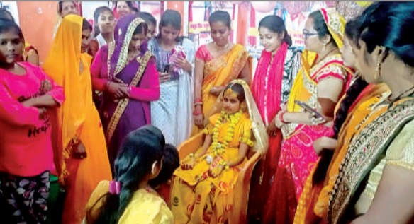
कूम्हांडा देवी मंदिर में गुरुवार को तेल पूजन का कार्यक्रम हुआ।

महादेव मंदिर से निकलने वाली शिव बारात मां कूम्हांडा देवी मंदिर पहुंचने के बाद शिव-पार्वती का विवाह होगा। इसके बाद नगर में शोभायात्रा निकाली जाएगी। कूम्हांडा देवी मंदिर में सनातन धर्म के अनुसर शादी की सारी