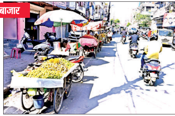
सड़क पर टेले वालों का कब्जा।