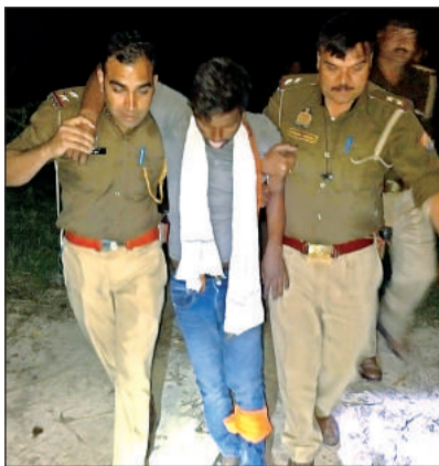
गोली लगने से घायल बदमाश।

गुरुवार रात एसएचओ महाराजपुर अपनी टीम के साथ प्रयागराज हाईवे पर वाहनों की रूटीन चेकिंग कर रहे थे। इसी दौरान रात लगभग साढ़े आठ बजे कानपुर की ओर से एक तेज रफ्तार लोडर आता दिखाई दिया जिसमें नंबर प्लेट नहीं थी। संदिग्ध जानकर