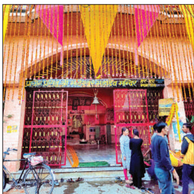
शिवरात्रि पर्व की पूर्व संध्या पर सजाया गया शिवालय।