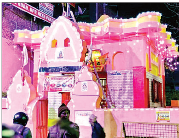
रात के समय झालरों से जगमगाता बालूघाट का आनंदेश्वर मंदिर। अमृत विचार