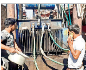
ट्रांसफार्मर की मरम्मत करते बिजली कर्मियों।

अमृत विचार। फोरलेन कोतवाली चौराहे के पास रखा 630 केवीए के ट्रांसफार्मर से तेल रिस रहा था। जिसकी जानकारी क्षेत्रीय लोगों ने बिजली विभाग को दी।