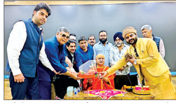
स्वामी नलिनानन्द का सम्मान करते उद्यमी।