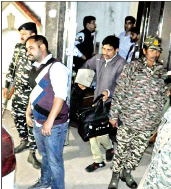
रात साढ़े आठ बजे लेकर निकली ईडी की टीम।

ले जाकर पूछताछ की जा रही है। ये पूछने पर कि क्या आपके नाम पर हंगामा होने लगा। उन्होंने बताया कि सुबह साढ़े छह बजे टीम आई थी। उनके मोबाइल जमा करा लिए थे।