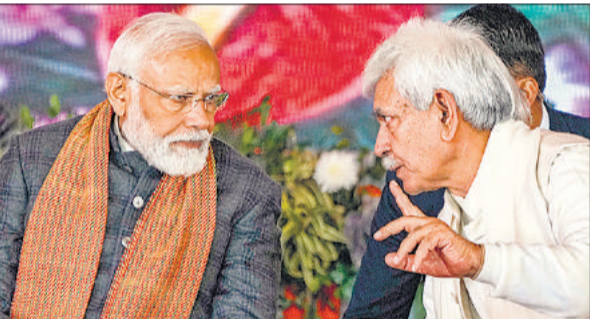
सभा के दौरान प्रधानमंत्री मोदी के साथ जम्मू-कश्मीर के उपराज्यपाल मनोज सिन्हा।

प्रधानमंत्री नरेन्द्र मोदी गुरुवार को जम्मू-कश्मीर में थे। इस दौरान उन्होंने 'विकसित भारत, विकसित जम्मू-कश्मीर' कार्यक्रम के तहत करोड़ों रुपये की विभिन्न विकास परियोजनाओं का लोकार्पण और शिलान्यास किया और एक जनसभा को संबोधित किया। मोदी ने कहा कि संविधान के अनुच्छेद 370 के अधिकतर प्रावधानों को निरस्त किए जाने के बाद जम्मू-कश्मीर विकास की नई ऊंचाइयों को छू रहा है और स्वतंत्र रूप से सांस ले रहा है। उन्होंने कांग्रेस पर अनुच्छेद 370 पर न केवल जम्मू-कश्मीर के लोगों को बल्कि पूरे देश को गुमराह करने का आरोप लगाया। प्रधानमंत्री ने आगामी रमजान के पवित्र महीने और महाशिवरात्रि के पर्व के लिए अपनी अग्रिम