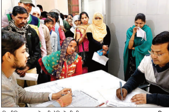
फिजीशियन कक्ष में लगी रोगियों की भीड़।

अमृत विचार। मौसम में बदलाव के चलते जुकाम-बुखार, खांसी के रोगियों की संख्या में बेतहाशा वृद्धि हो रही है। लोहिया अस्पताल में प्रतिदिन 200 से 250 रोगी जुकाम-बुखार, खांसी के आ रहे हैं।