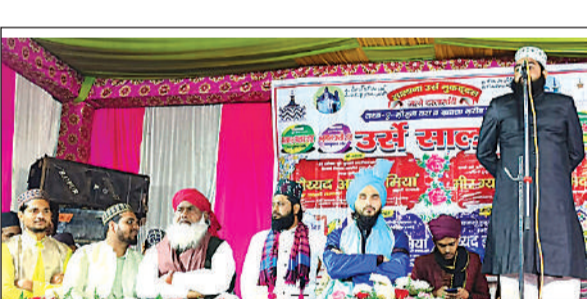
उर्स में तकरीर पेश करते उलेमा।

अमृत विचार। कस्बे के खानकाहे आलिया अहमदिया व दारुल उलूम अहमदिया बरकातिया में 31वें सालाना उर्स मुकद्दस जश्न ए गौसुलवरा व ख्वाजा गरीब नवाज जश्न के बंदी का आयोजन किया गया। उर्स मुकद्दस में पहुंचे उलेमाओं ने दीनी बातों पर रोशनी डालते हुए तकरीरे पेश की। वहीं दारुल उलूम अहमदिया बरकातिया के तीन बच्चों को दस्तारे हिफ्ज से नवाजा। बुधवार की रात को कस्बे के खानकाहे आलिया अहमदिया व दारुल उलूम अहमदिया बरकातिया में आयोजित सालाना उर्स मुकद्दस जश्न ए गौसुलवरा व ख्वाजा