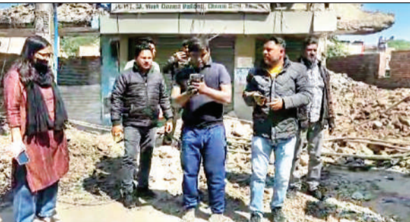
चुन्नीगंज में पड़े मलबा देखने पहुंचे नगर निगम के अधिकारी।