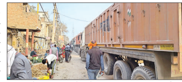
बुधवार रात से लगा जाम गुरुवार दोपहर में टूट सका।

अमृत विचार। बहुआ-ललौली मार्ग पर स्थित गौरी नहर पुल की जर्जर सड़क में बुधवार रात करीब दस बजे मौरंग लोड ट्रक की कमाना टूट गई। उसी समय बगल से निकल रहे ओवरलोड मौरंग लदे ट्रक का पहिया जर्जर सड़क में जा धंसा। इससे बहुआ-ललौली मार्ग पर रात से गुरुवार दोपहर तक भीषण जाम लगा रहा। नहर पुल से बहुआ कस्बे और दूसरी ओर बंधवा तक करीब सात किलोमीटर लंबी वाहनों की