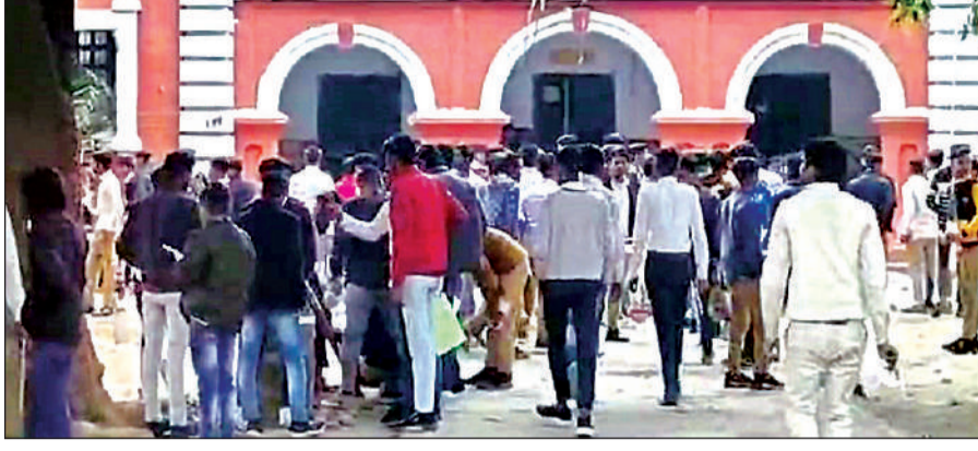
परीक्षा केंद्र में प्रवेश करते परीक्षार्थी।

अमृत विचार। यूपी बोर्ड परीक्षा 2024 में सुबह की पाली में विज्ञान विषय की परीक्षा कड़ी निगरानी के बीच हुई। जबकि इंटर के लेखा की परीक्षा में सभी परीक्षार्थी हाजिर रहे। प्रश्न पत्र सरल आने से परीक्षार्थियों के चेहरों पर मुस्कान थी। परीक्षार्थियों का कहना था कि बहुविकल्पीय व लघु उत्तरीय प्रश्न काफी सरल आए। छह-छह नंबर के दीर्घ उत्तरीय प्रश्न थोड़े जरूर कठिन थे। वहीं माध्यमिक शिक्षा परिषद के ज्वाइंट डायरेक्टर (जेडी) ने परीक्षा केंद्रों का निरीक्षण किया।