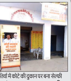
तिर्वा में कोटे की दुकान पर बना सेल्फी प्वाइंट। अमृत विचार

कन्नौज/तिर्वा। जिले के 27 उचित दर विक्रेताओं (कोटेदारों) के यहां मोदी सरकार की गारंटी... वाले सेल्फी प्वाइंट लग गए हैं। इसमें प्रधानमंत्री की फोटो के साथ राशनकार्ड धारक अपनी फोटो खिंचवा सकते हैं। डीएसओ राजीव मिश्र ने बताया कि कन्नौज, तिर्वा व छिबरामऊ तहसील क्षेत्र की नौ-नौ दुकानों में सेल्फी प्वाइंट बनाए गए हैं। तिर्वा तहसील क्षेत्र के ब्लॉक उमदा में पांच व हसेरन में चार दुकानों पर सेल्फी स्टैंड लग गई है। क्षेत्रीय खाद्य अधिकारी मनोज गहराना ने बताया कि सभी चिह्नित दुकानों पर पीएम की फोटो लगे कटआउट पहुंचा दिए गए हैं। उमदा क्षेत्र के टठिया कस्बे की दो दुकानों, भखरोली, अहेर, बहसार व हसेरन ब्लॉक इलाके में कलसान, नादेमऊ, सकतपुर और हसेरन की दुकानों में सुविधा दी गई है।