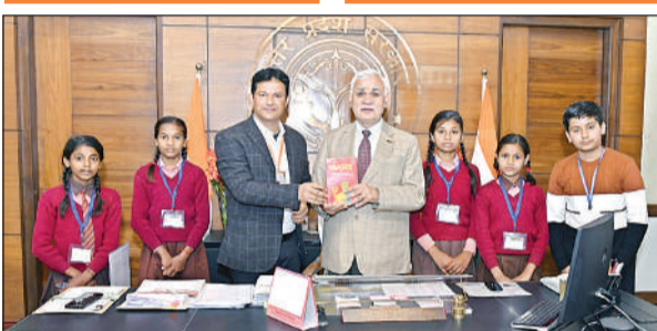
लखनऊ में मुख्य सचिव के साथ मौजूद बच्चे।