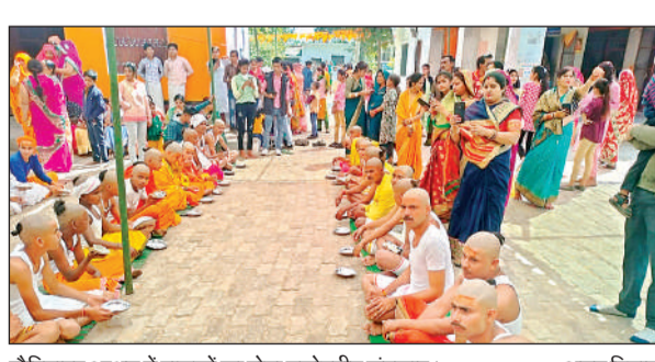
गौरियापुर आश्रम में बालकों का होता यज्ञोपवीत संस्कार।

गुरुवार को श्रीरामजानकी संस्कृत महाविद्यालय गौरियापुर के विद्यार्थियों ने सही बटुओं को गायत्री मंत्र प्रदान किया और उदेशित करते हुए कहा कि यज्ञोपवीत संस्कार के बाद मनुष्य का दूसरा जन्म हुआ माना जाता है। इस संस्कार के बाद बालक को सदाचार से रहते हुए विद्यार्जन करना चाहिए। कभी भी अपने चरित्र और अपने अमूल्य