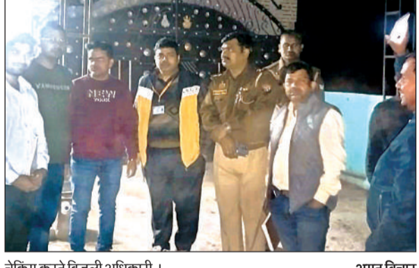
चैकिंग करते बिजली अधिकारी।