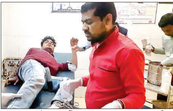
छात्र का इलाज करते स्वास्थ्यकर्मी।