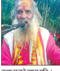
कथा सुनाते व्यासमुनि।

नहीं होते हैं। मन हर्षित रहता है। प्रातःकाल में की गई पूजा अर्चना से भगवान प्रसन्न होकर मनुष्य की समस्त मनोकामनाएं पूर्ण करते हैं। आगे कहते हैं कि वेद-पुराण सुनें मन लाई, आप कहें अनुज्ञे समुझाई, दिन में वेद-पुराणों की कथाओं का श्रवण करना चाहिए और यह रामकथा तो एह गंभीर पापों का नाश करने वाली है। रामकथा सुन्दर करतारी, संशय विहंग उड़ानहार हारी। आज कथा सुनाते व्यासमुनि। कथा हमारे संस्कार लुप्त हो रहे हैं। युवा पीढ़ी हमेशा मोबाइल पर चिपकी रहती है। अपने माता पिता गुरु जनों की सेवा करने में शर्म लगती है। इन्हें अपने बच्चों को संस्कारवान बनाया चाहिए तभी हमारा आपका और हमारे देश का उत्थान हो सकता है।