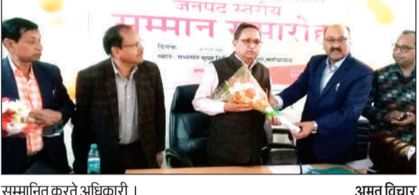
सम्मानित करते अधिकारी।