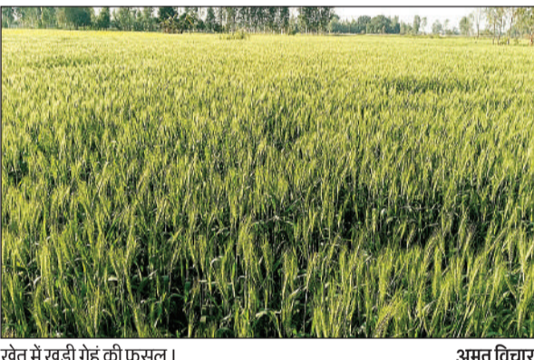
खेत में खड़ी गेहूं की फसल।

बीते वर्ष यह खरीद 2125 रुपये प्रति क्विंटल की दर से की जा रही थी। इस बार 150 रुपये की वृद्धि की गई है। गेहूं की फसल सरकारी केंद्रों पर बेंचने के लिये अभी तक 835 किसान रजिस्ट्रेशन करा चुके हैं। अन्य किसानों को रजिस्ट्रेशन के लिये प्रेरित किया जा रहा है। अभी तक शासन ने जिले में गेहूं खरीद का लक्ष्य निर्धारित नहीं किया है। इसके बाद ही विभाग अधिक से अधिक गेहूं की खरीद करने की पूरी तैयारी कर चुका है। किसानों को बताया जा रहा है कि वह केंद्र पर गेहूं साफ व सुखाकर ही लेकर आए यदि नम गेहूं हुआ तो मशीन से जांच की जायेगी। इसके बाद ही खरीदा जायेगा।