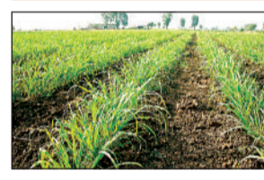
से फिर से ओले गिरने व बारिश की संभावना से परेशान किसान पककर तैयार सरसों, धनियां आदि की फसलों की कटाई व आलू की खुदाई में मशगूल दिखे। मौसम विभाग की मानें तो दो व तीन मार्च को गरज चमक के साथ बारिश होने व ओले गिरने की भी संभावना है। किसान किसी तरह से अपनी कड़ी मेहनत से तैयारी की गई फसलों को जल्द से जल्द घर ले जाने का प्रयास कर रहे हैं। जिससे दैवीय आपदा वाले नुकसान से फसलों को बचाया जा सके।