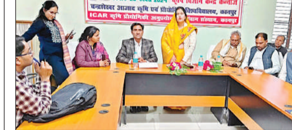
किसानों को संबोधित करती ब्लाक प्रमुख।