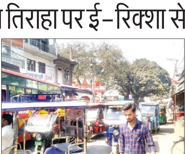
जीटी रोड के रेलवे रोड तिराहे पर आड़े तिरछे खड़े ई-रिक्शा।

सरायमीरा हो या मकरंदनगर या फिर पाल चौराहा। इन सभी चौराहों व तिराहों पर यातायात व्यवस्था बेहतर रखने के लिये पीआरडी जवानों को लगाया गया है। यह जवान अपने प्वाइंट पर मुस्तैद तो रहते हैं लेकिन इयूटी की फिर्न नहीं करते। इसी का नतीजा है सरायमीरा जीटी रोड के रेलवे रोड तिराहा पर ई रिक्शा चालकों की रेलमपेल। यह हालात तब हैं जब यहां पर चार पीआरडी जवान लगे रहते हैं। एक