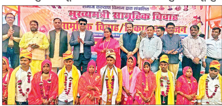
केंद्रीय राज्यमंत्री व अधिकारियों के साथ मौजूद वर वधु।

महाविद्यालय के मैदान पर जिला समाज कल्याण विभाग की ओर से संचालित मुख्यमंत्री सामूहिक विवाह का उद्घाटन मुख्य अतिथि केन्द्रीय राज्यमंत्री व सांसद साध्वी निरंजन ज्योति ने दीप प्रज्वलित कर किया। जिले के विभिन्न ब्लाकों में हुए 382 जोड़ों के रजिस्ट्रेशन हुआ था। गुरुवार को जहां हिन्दू रीति-रिवाज के अनुसार जोड़ों का विवाह कराया गया। तो वहीं मुस्लिम जोड़ों को विधि-विधान के साथ निकाह कराया गया। पूरा पांडाल अतिथियों से भरा रहा। वर वधुओं ने एक दूसरे का साथ निभाने का वादा किया।