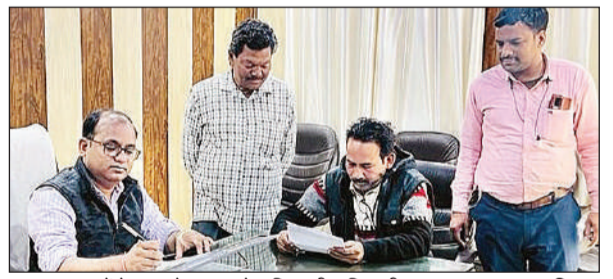
पटल सहायकों के साथ बैठक करते अधिशासी अधिकारी।

अमृत विचार। नगर को अतिक्रमण और जाम की समस्या से निजात दिलाने के लिए पालिका प्रशासन ने कमर कस ली है। इसके लिए नगर पालिका ने सर्विलांस और अवलोकन टीम का गठन किया है। दोनों टीमों अगले सप्ताह से नगर में भ्रमण कर अतिक्रमण पर नजर रखेंगी और इसकी सूचना पालिका कार्यालय में देंगी। इसके बाद कार्रवाई की जाएगी। यह जानकारी नगर पालिका परिषद अधिशासी अधिकारी अनिल