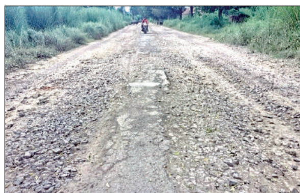
बदहाल गाजीपुर विजयीपुर मार्ग।