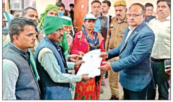
एसडीएम को ज्ञापन देने जाते किसान नेता।