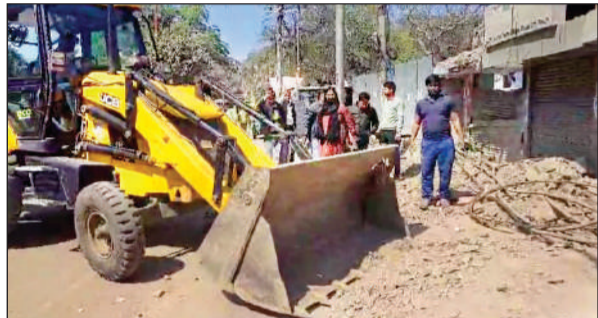
चुन्नीगंज में पड़े मलबे को हटाता नगर निगम की जेसीबी।

आजाद नगर के हाई स्कूल के एक छात्र ने प्रश्न किया कि 'सर यह बोर्ड परीक्षा क्यों ली जाती है, जब हर क्लास में हम लोग परीक्षा देते हैं तो इस परीक्षा को भी स्कूल में ही कराया जाए'।