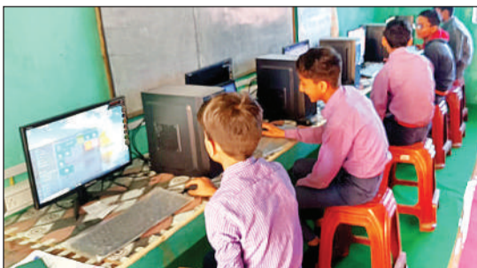
कम्प्यूटर क्लास में शिक्षा लेते निहाल छात्र।