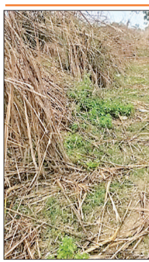
सूखी पड़ी नहर की नहीं हुई सिल्ट सफाई।