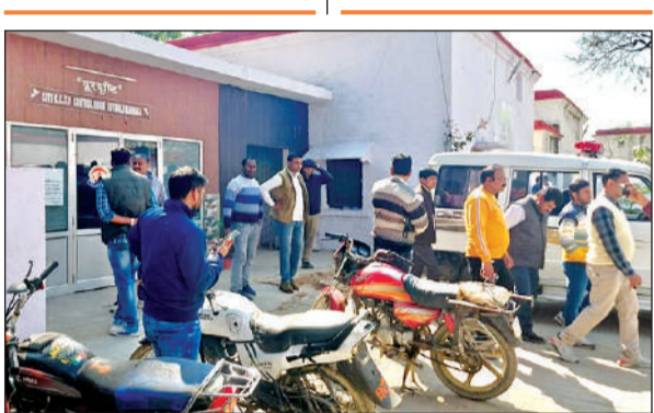
कोतवाली में मौजूद कर्मचारी व शिक्षक।

● एरियर निकालने के लिए पहली किस्त में 10 हजार रुपये लेने का आरोप