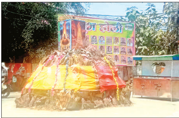
दहन के लिए तैयार होलिका।

होली के गीत जगह-जगह सुनाई देने लगे। फिर रंगों के साथ उड़ताई और भांग घोंटी गई। कई