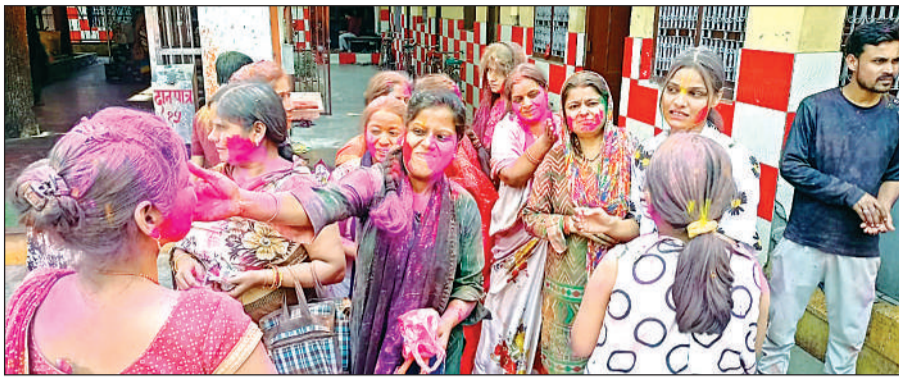
एक-दूसरे को गुलाल लगाती महिलाएं।

रेलवे रोड, घुमना बाजार, नेहरू रोड, लोहाई रोड, चौक, पक्कापुल, लालसराय, साहबगंज चौराहा, सेंट गली, चूड़ी वाली गली, भोलेपुर और कोतवाली रोड फतेहगढ़ आदि बाजारों में सुबह से ही सुबह से ही खरीदारी करने के लिए लोगों की भीड़ उमड़ी। पंसार की दुकानों से लेकर शॉपिंग मॉलों पर लोग खरीदारी करते दिखे। घुमना बाजार में दोपहर को भीड़ के चलते जाम लग गया। घरों में साफ-सफाई के साथ ही महिलाओं ने गुड़िया, अहिंसे और बेसन के सेव आदि ज्वन बनाए। शाम को शुभ मुहूर्त में होलिकादहन किया गया।