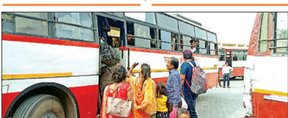
रोडवेज बस में चढ़ते यात्री।

● भीड़ अधिक होने से कराना पड़ा यात्रियों को घंटों इंतजार