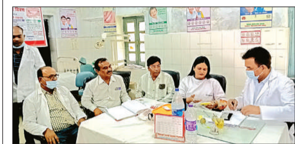
डेंटल हास्पिटल में लगाया गया कैप।