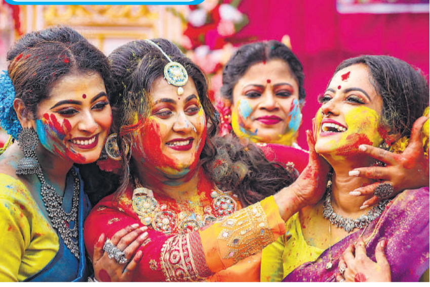
पश्चिम बंगाल के दक्षिण दिनाजपुर जिले के बालुरघाट में होली खेलती महिलाएं।