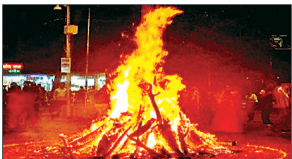
नगर के एक मोहल्ले में होलिका दहन करते लोग।