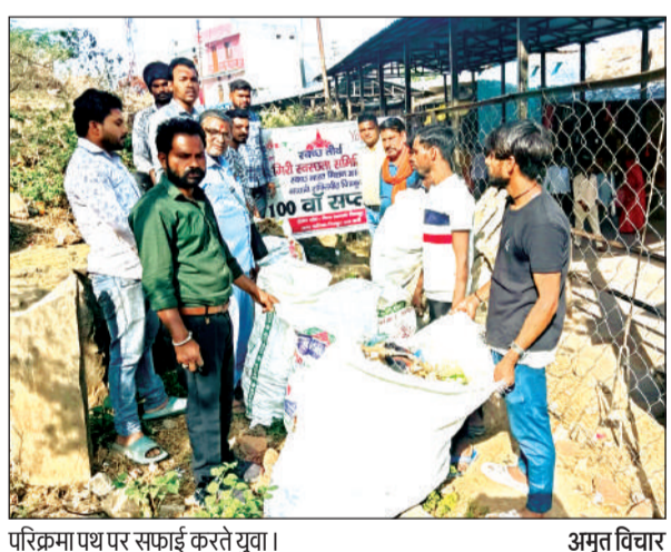
परिक्रमा पथ पर सफाई करते युवा।