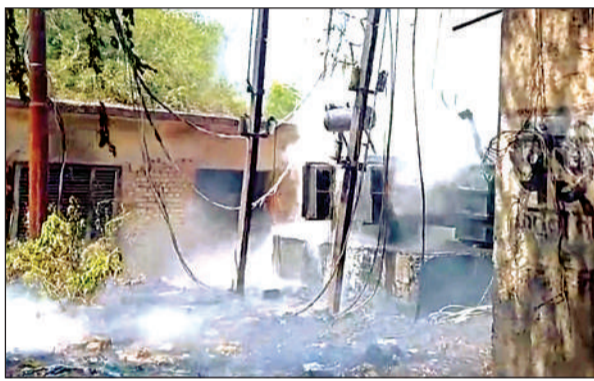
तेल लीकेज के चलते जलता हुआ ट्रांसफार्मर।

● केबिल जलने से कई मोहल्लों की बिजली हुई गुल