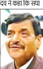
शिवपाल सिंह यादव।