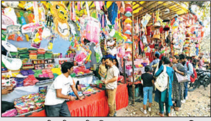
दुकान पर खरीदारी करती महिलाएं। अमृत विचार

कन्नौज। इस बार होली से पहले आलू महंगा हो गया, जिससे होली का रंग हलका हो गया। कृषि प्रधान जनपद होने से यहां प्रत्येक त्योहार फसल पर ही निर्भर होते हैं। इस बार आलू का उत्पादन कम हुआ और निर्यात बंद होने से आलू के दामों में इजाफा हो गया। ऐसे में त्योहार से पहले किसान की जेब भारी हो गई, जिसका परिणति बाजार में देखने को मिली। दुकानदारों ने बताया कि पिछले साल की अपेक्षा इस बार होली पर दुकानदारी ठीक हुई है। महिलाओं ने होली के पकवान और रंग खरीदे तो बच्चों ने अपनी पसंद की पिचकारी खरीदी।