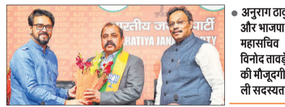
● अनुराग ठाकुर और भाजपा महासचिव विनोद तावड़े की मौजूदगी में ली सदस्यता

पूर्व वायुसेना प्रमुख राकेश कुमार सिंह भदौरिया और तिरुपति के पूर्व सांसद वरप्रसाद राव रविवार को भारतीय जनता पार्टी (भाजपा) में शामिल हो गए। केंद्रीय मंत्री अनुराग ठाकुर और भाजपा महासचिव विनोद तावड़े की मौजूदगी में दोनों को पार्टी की सदस्यता दिलाई गई। भदौरिया भारतीय वायुसेना के 26वें प्रमुख हैं। तत्कालीन एयर चीफ मार्शल भदौरिया जून 1980 में वायु सेना की लड़ाकू शाखा में शामिल हुए थे। भदौरिया की गिनती वायु सेना के उन चुनिंदा पायलटों में होती है जिन्होंने राफेल विमान उड़ाया