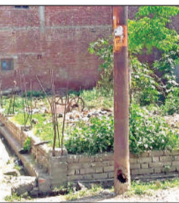
रामकृष्ण नगर में लगा जर्जर विद्युत पोल।