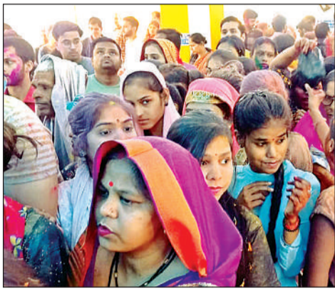
पंडा बाग में दिन भर चली पूजा-अर्चना।