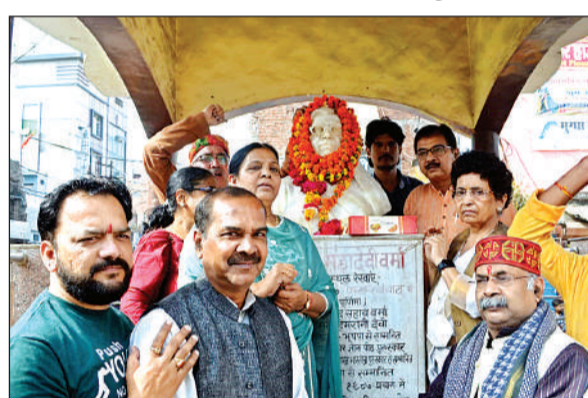
महीयसी की प्रतिमा पर माल्यार्पण करते बुद्धिजीवी।