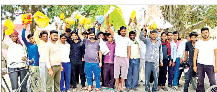
राशन न मिलने पर आक्रोश व्यक्त करते ग्रामीण।