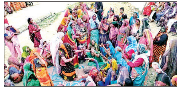
कुंडौरा में होली खेलती महिलाएं।