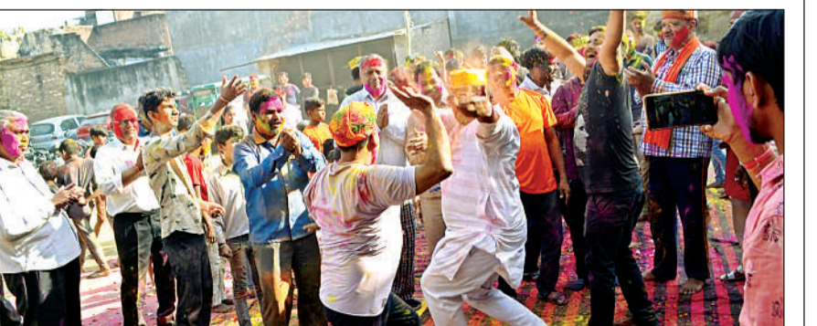
होली पर मस्ती में झूमते स्वयंसेवक।