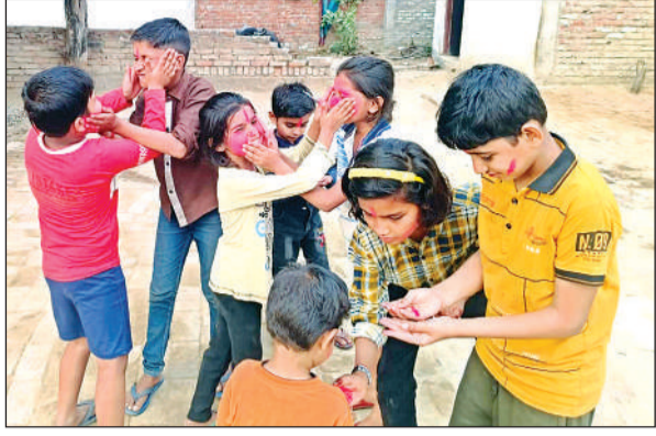
शिवली में रंग-गुलाल लगाकर होली खेलते बच्चे।

गांव-गांव हरियारों की टोलियां निकलीं और हर तरफ रंग बरसता रहा। होली पर सबसे अधिक