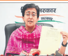
● केजरीवाल का पत्र दिखाती दिल्ली की जलमंत्री आतिशी