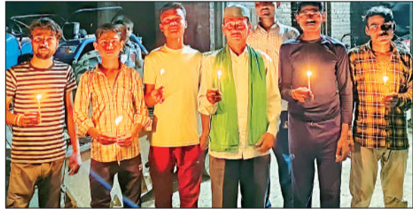
कैंडल जला शहीदों को श्रद्धांजलि देते किसान नेता। अमृत विचार

उन्होंने बताया कि लोकसभा चुनाव की आचार संहिता लागू हो चुकी है। किसी भी समाज विरोधी गतिविधि पर दोषी व्यक्ति के खिलाफ कार्रवाई की जाएगी।