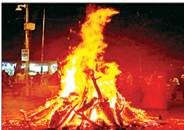
एक मोहल्ले में होलिका दहन करते लोग।

अमृत विचार। रविवार को हस्त नक्षत्र व सर्वाथ सिद्धि योग में होलिका दहन के साथ ही जिले में होली के त्योहार की धूम शुरू हो गई। भद्रा के चलते इस बार 1 घंटे 13 मिनट का होलिका दहन का मुहूर्त था लेकर कई स्थानों पर मुहूर्त के बाद भी होलिका दहन किया गया। होली जलने के बाद से ही अबीर गुलाल उड़ाना शुरू हो गया था। जिले भर में परंपरागत ढंग से जगह-जगह होलिका दहन किया गया वहीं शहर में सैकड़ों स्थानों पर छोटी बड़ी होलिका जलाई गई। होलिका दहन के बाद लोगों ने एक दूसरे को गुलाल लगाकर होली की शुभकामनाएं भी दी।