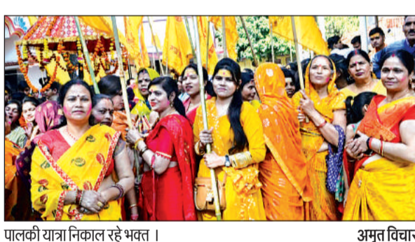
पालकी यात्रा निकाल रहे भक्त।

अमृत विचार। महाशिवरात्रि से पूर्व ऐतिहासिक प्राचीन महाभारत कालीन श्री पांडेश्वर नाथ द्वादश ज्योतिर्लिंग शक्तिपीठ मंदिर से महादेव की पालकी यात्रा बड़ी धूमधाम से निकाली गई।