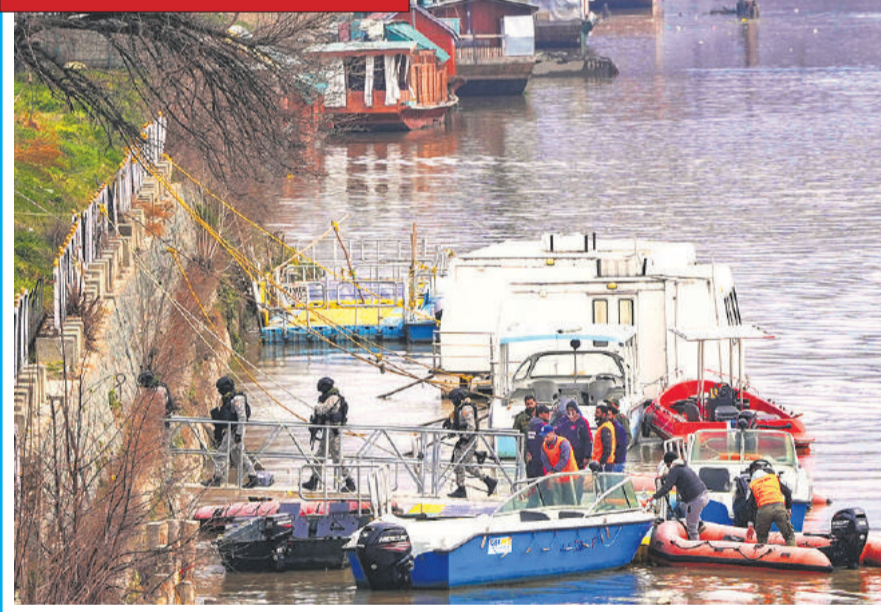
श्रीनगर: प्रधानमंत्री नरेन्द्र मोदी के सात मार्च को घाटी दौरे पर हैं। पूरे जम्मू-कश्मीर में असाधारण सुरक्षा व्यवस्था की गई है। पीएम के दौरे से एक दिन पहले झेलम नदी पर गश्त करते मरीन कमांडो। घाटी प्रधानमंत्री के स्वागत के लिए तैयार है। पांच अगस्त 2019 को अनुच्छेद 370 हटाए जाने के बाद पीएम मोदी की ये घाटी की पहली यात्रा होगी।