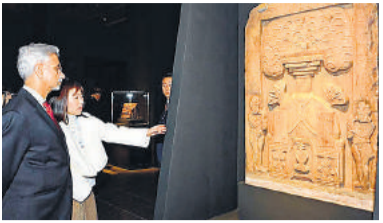
दक्षिण कोरिया के सियोल में राष्ट्रीय संग्रहालय में भारत की बौद्ध कला प्रदर्शनी को देखते जयशंकर।

जयशंकर ने अपने समकक्ष चो ताइ युन के साथ 10वीं भारत-दक्षिण कोरिया संयुक्त आयोग बैठक (जेसीएम) की सह अध्यक्षता करने के दौरान यह टिप्पणी की। उन्होंने कहा कि प्रधानमंत्री नरेन्द्र मोदी की 2015 में दक्षिण कोरिया यात्रा के दौरान द्विपक्षीय संबंधों को विशेष रणनीतिक साझेदारी तक बढ़ाया गया। बता दें, जयशंकर दक्षिण कोरिया और जापान की अपनी चार दिवसीय यात्रा के पहले चरण में सोल में हैं। मंत्री ने कहा, 'यह महत्वपूर्ण है कि हम उस पर खरा उतरें। हम बीते वर्षों में मजबूती से आगे बढ़े हैं। हम एक दूसरे के लिए वास्तव में महत्वपूर्ण भागीदार बन गए हैं। हमारे द्विपक्षीय आदान-प्रदान,