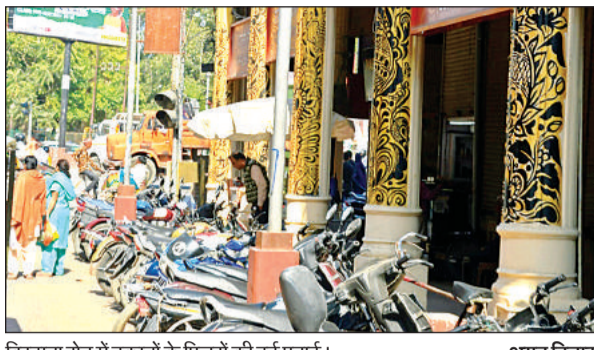
बिरहाना रोड में दुकानों के पिलरों की हुई पुताई।

प्राइवेट संस्था ने रातों-रात बिना बताये कई प्रतिष्ठानों के बोर्ड उतार दिये, इसके बाद नये बोर्ड और पेंटिंग कराने के नाम पर वसूली शुरू कर दी गई। उन्होंने बताया कि करीब