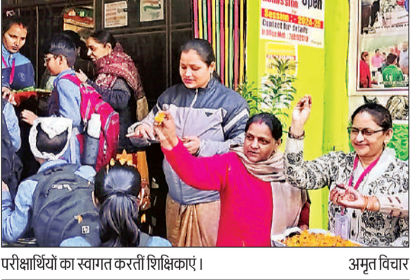
परीक्षाधियों का स्वगत करती शिक्षिकाएं। अमृत विचार

बाल निकुंज में वार्षिक परीक्षोत्सव की हुई शुरुआत अमृत विचार, लखनऊ : बाल निकुंज स्कूल्स एंड कॉलेजज की सभी शाखाओं में गुरुवार से वार्षिक परीक्षा उत्सव शुरू हो गया। समस्त परीक्षाधियों का स्वगत कर शान्ति का अलख जगाया। स्कूल प्रार्थना, सर्वधर्म प्रार्थना, विश्व संसद एवं गीत-संगीत, कव्वाली की मनोहारी प्रस्तुतियों ने सभी का मन मोह लिया। समस्त छात्राओं के चेहरे पर मुस्कान बिखरी हुई थी और खुशी-खुशी, बिना किसी तनाव से परीक्षा में सम्मिलित होने के लिए अपनी-अपनी परीक्षा कक्षा में प्रवेश किया। बाल निकुंज ने अन्य उत्सवों की भांति परीक्षा को उत्सव के रूप में मनाने का फैसला लिया है जिससे बच्चों के मन में किसी प्रकार के तनाव की गुंजाइश न रहे।