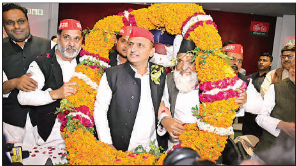
राष्ट्रीय अध्यक्ष अखिलेश यादव को माला पहनाकर स्वागत करते सपा के कार्यकर्ता।

सपा मुख्यालय, लखनऊ में गुरुवार को समाजवादी बाबा साहेब अम्बेडकर वाहिनी, समाजवादी अनुसूचित जाति प्रकोष्ठ, समाजवादी अल्पसंख्यक सभा और समाजवादी पिछड़ा