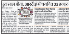
अमृत विचार में प्रकाशित खबर

वहीं शैक्षिक सत्र 2024-25 का बजट अभी बाद में आयेगा। अधिकारियों ने बताया कि बकाया फीस भुगतान होने के बाद नये सत्र में प्रवेश के पात्र बच्चों को अगर निजी स्कूल प्रबंधन प्रवेश देने से