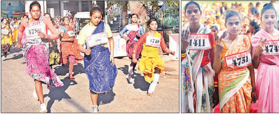
केडी सिंह बाबू स्टेडियम से दौड़ लगती महिलाएं और युवतियां।

अमृत विचार : साड़ी के पल्लू को पहले कमर में खोंसा... फिर बालों को ठीक किया। जैसे ही इशारा हुआ महिलाओं ने तेजी से दौड़ना शुरू किया। किसी के पैरों में जूते थे कुछ नंगे पांव ही दौड़ पड़ी। यह नजारा गुरुवार को केडी सिंह बाबू स्टेडियम के मुख्य द्वार पर दिखाई पड़ा, जहां से महिलाओं के लिए साड़ी दौड़ आयोजित की गई थी। इसमें उन गृहणियों ने हिस्सा लिया, जिनका खेल जगत से कोई लेना देना नहीं था। दौड़ शुरू के बाद कुछ महिलाएं थोड़ी दूर पर जा कर रुक गईं तो कुछ की रफ्तार धीमी हो गई। दौड़ खत्म होने के बाद महिलाओं ने बताया कि धरों में बचपन में खूब दौड़ लगाईं। फिर विवाह के बाद घर के काम से फुरसत ही नहीं मिली। आज एक बार फिर से बचपन के साथ स्कूल