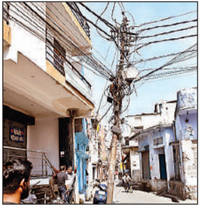
तारों के बोझ से झुका खंभा।

चिंगारियां निकलती रहती हैं। फाल्ट होने से घंटों बिजली गुल रहती है।