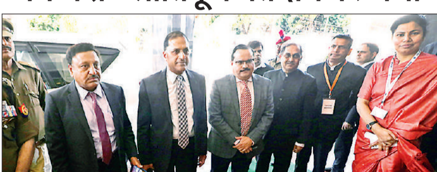
समीक्षा बैठक के लिए जाते मुख्य निर्वाचन आयुक्त राजीव कुमार, निर्वाचन आयुक्त अरुण गोयल व टीम के अन्य सदस्य।