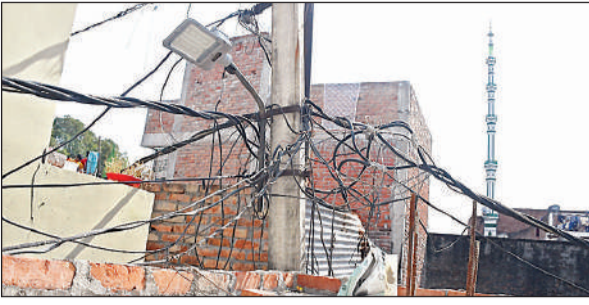
कदम रसूल वार्ड में घरों की छतों के पास फैला तारों का मकड़जाल।

फंड के अभाव में स्मार्ट सिटी की यह योजना पूरी नहीं हो सकी। जिन क्षेत्रों में प्राथमिकता से काम किया जाना था, वहां भी खंभों पर तार झूल रहे हैं। इसका खामियाजा