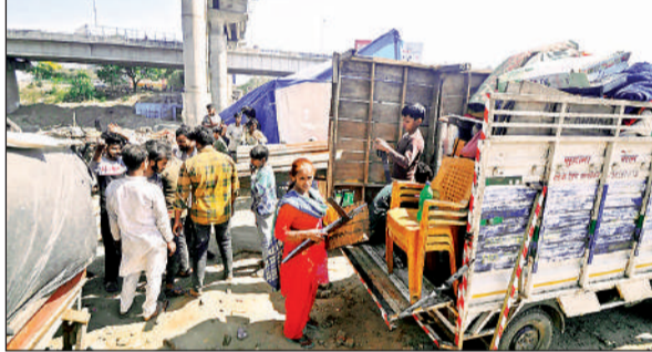
गृहस्थी के सामान को लोडर पर रखती महिला, व अन्य।