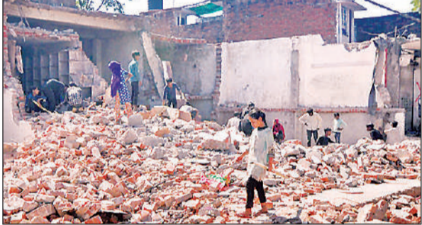
अकबर नगर में तोड़े गए शोरूम के मलबे से सामान बीनते बच्चे। अमृत विचार

एलडीए की टीम ने 10 जेसीबी व पोकलैंड की मदद से आठ घंटे तक मलबे को भी कराया बराबर