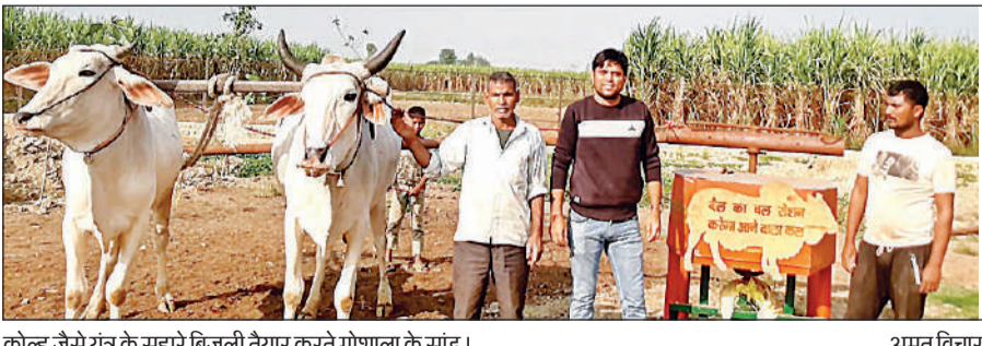
कोल्हू जैसे यंत्र के सहारे बिजली तैयार करते गोशाला के सांड।

इस तरह से तैयार हो रही बिजली: नया शोध कोल्हू की तरह ही है। इसमें बीच के स्थान पर गेयर बॉक्स को डिजायन किया गया है। अल्टरनेटर लगा है। इसमें तारों की वाइडिंग से जुड़ा स्टैटर भी है, जो चुंबकीय क्षेत्र तैयार करता है। इन्हीं व्यवस्थाओं के सहारे सांड/बैलों के घुमाये जाने पर बिजली उत्पन्न होती है। एक बैल/सांड की जोड़ी प्रति घण्टे 2 यूनिट से अधिक बिजली तैयार करती है।