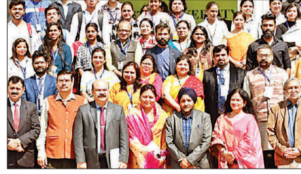
कार्यक्रम के दौरान उपस्थित छात्र व अतिथि।

प्रक्रिया जारी रहेगी। दूसरे चरण में एक मार्च 2024 से 30 मार्च 2024 तक तथा सत्यापन तिथि निर्धारित है। वहीं एक अप्रैल 2024 से 7