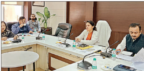
मंडलीय उद्योग बंधु की बैठक के दौरान मंडलायुक्त डॉ. रोशन जैकब व अन्य। अमृत विचार

गुरुवार को मंडलीय उद्योग बंधु की बैठक में मंडलायुक्त डॉ. रोशन जैकब के समक्ष व्यापारियों ने अपनी समस्याएं रखीं। मंडलायुक्त ने नाली, सड़क और जल निकासी की समस्या तत्काल दूर करने के लिए नगर निगम के अधिकारियों को निर्देश दिए। साथ ही निरीक्षण करने को भी कहा। जबकि तालकटोरा औद्योगिक क्षेत्र में अतिक्रमण हटाने के लिए जिला उद्योग केंद्र, नगर निगम और पुलिस को समन्वय बनाकर कार्रवाई करने को कहा। दूसरी ओर कानपुर-लखनऊ राष्ट्रीय राजमार्ग पर उन्नाव औद्योगिक क्षेत्र के बंधर और शेणपुर नरी के निकट लंबी दूरी तक कोई कट न होने के कारण औद्योगिक इकाइयों को आवागमन में परेशानी हो रही है। उद्यमियों ने राष्ट्रीय राजमार्ग पर कट