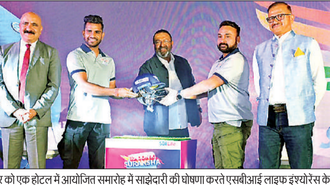
गुरुवार को एक होटल में आयोजित समारोह में साझेदारी की घोषणा करते एसबीआई लाइफ इंश्योरेंस के अधिकारी और एलएसजी के खिलाड़ी व पदाधिकारी।