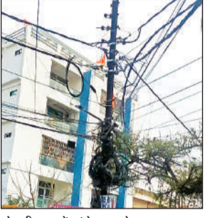
गोमतीनगर में खंभे पर लगे तार।

उपभोक्ताओं को भुगतना पड़ रहा है। खुले तारों के आपस में टकराने से