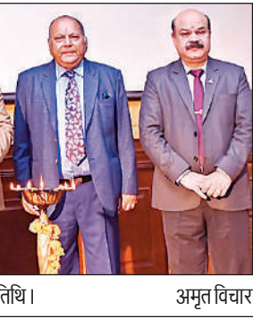
मंच पर दीप प्रज्ज्वलन के दौरान उपस्थित अतिथि। अमृत विचार

कार्यालय संवाददाता, लखनऊ अमृत विचार : प्रदेश के 52 जिलों से आये सामयिक संग्रह अमीन व अनुसेवकों का धरना 10वें दिन भी जारी रहा। धरने को सम्बोधित करते हुए वक्ताओं ने कहा कि 23 जिलों में काम न मिलने के कारण हम लोगों का परिवार भुखमरी की कगार पर है लेकिन अभी तक सरकार ने