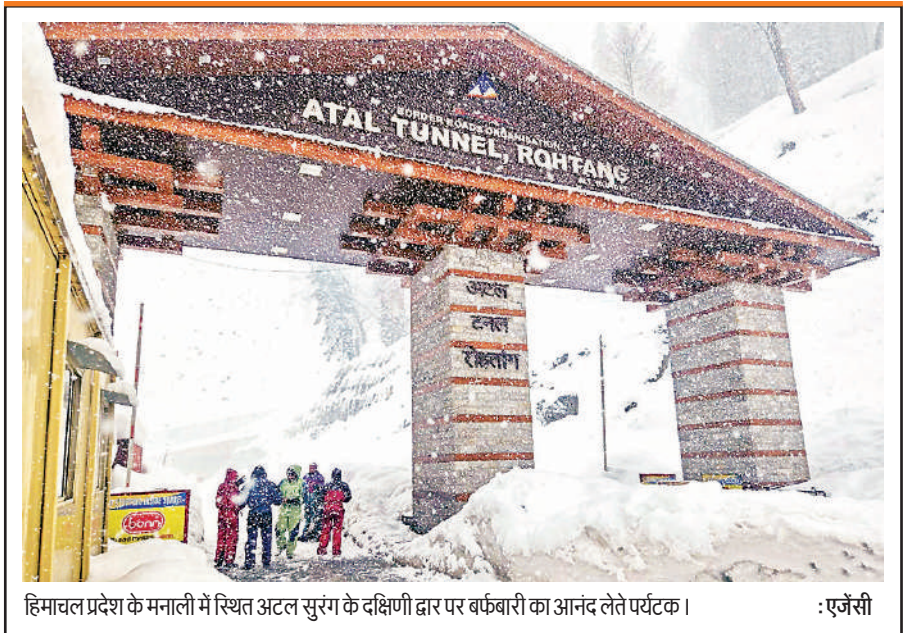
हिमाचल प्रदेश के मनाली में स्थित अटल सुरंग के दक्षिणी द्वार पर बर्फबारी का आनंद लेते पर्यटक।

की दस कंपनी तैनात की जाएंगी। उत्तर 24 परगना जिले में 21 और दक्षिण 24 परगना में नौ कंपनी तैनात की जा रही हैं। अधिकारी ने बताया कि केंद्रीय बलों की आठ कंपनी नादिया जिले में तैनात की जाएंगी जबकि नौ कंपनी हावड़ा और हुगली जिलों में तैनात की जाएंगी। उन्होंने बताया कि चुनाव की घोषणा होने के बाद और केंद्रीय बल राज्य में आएंगे। एक कंपनी में औसतन 100 जवान होते हैं।