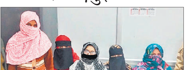
बनभूलपुरा हिंसा में गिरफ्तार महिलाएं।