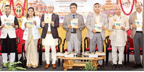
अंतरराष्ट्रीय सेमिनार में मौजूद भारत और नेपाल के प्रतिनिधि।

शुक्रवार को वह महाराणा प्रताप महाविद्यालय जंगल धूसड़ में आयोजित 'भारत-नेपाल सांस्कृतिक अंतर्संबंधों की विकास यात्रा : अतीत से वर्तमान