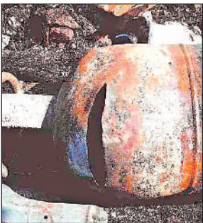
घर में आग लगने से फटा गैस सिलेंडर।

अमृत विचार। किसान और उसके घर वाले खेत की सिंचाई कर रहे थे, उसी बीच उसके घर में आग लग गई। इसका पता होते ही उसके पड़ोसी दौड़ पड़े। आग को काबू किया जा रहा था, उसी बीच वहां रखे गैस सिलेंडर में तेज आवाज के साथ ब्लास्ट हो गया। शुक्रवार की दोपहर ही हुए हादसे में एक अर्धेड पड़ोसी की मौत हो गई, जबकि 5 लोग बुरी तरह से झुलस गए। जिसमें से एक युवक की हालत नाचुक बताई जा रही है। जिसे मेडिकल कालेज में भर्ती कराया गया है।