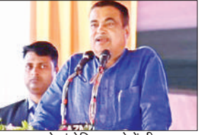
जनसभा को संबोधित करते केंद्रीय सड़क एवं परिवहन मंत्री नितिन गडकरी।

अमृत विचार : केंद्रीय सड़क एवं परिवहन मंत्री नितिन गडकरी अपने एक दिवसीय दौरे पर शुक्रवार को रायबरेली पहुंचे। केंद्रीय मंत्री ने जिले को करीब 41 सौ करोड़ की आठ बड़ी परियोजनाओं की सौगात दी। उन्होंने कहा कि प्रदेश में मोदी सरकार से पहले 2014 में राष्ट्रीय राजमार्ग की लम्बाई 7643 किमी थी, लेकिन अब यह लम्बाई 13 हजार किलोमीटर की हो गई है। गडकरी ने कहा कि देश का पहला एक्सप्रेस-वे उन्होंने मुंबई और पूना के मध्य बनवाया था। इस बात की