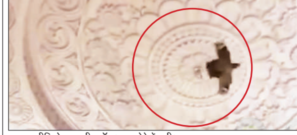
वायरल वीडियो का स्क्रीनशॉट (लाल धरे में पक्षी)।

रामलला के गर्भगृह में पक्षी के उड़ने का वीडियो वायरल