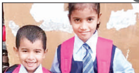
बच्चियों की फाइल फोटो।

अमृत विचार : कोतवाली रामसनेहीघाट के अंतर्गत ब्लॉक बनीकोडर के सामने एक ट्रक ने एक बाइक सवार को जोरदार टक्कर मार दी। जिसमें बाइक पर पीछे बैठी दो छात्राओं की दर्दनाक मौत हो गई। जबकि गंभीर रूप से घायल बाइक सवार युवक की अस्पताल में मौत हो गई। मुख्यमंत्री योगी आदित्यनाथ ने मृतकों के परिजनों के प्रति संवेदना व्यक्त की। उन्होंने अधिकारियों को तत्काल मौके पर पहुंच कर राहत कार्य में तेजी लाने के निर्देश दिए। पुलिस के अनुसार, सुमेरगंज