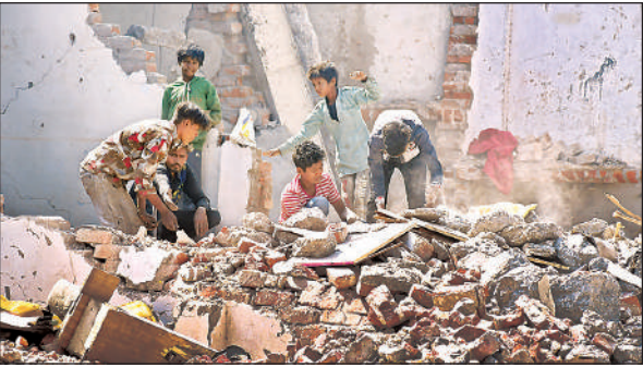
अकबर नगर में एलडीए द्वारा चलाए गए अभियान में तोड़े गए भवनों के मलबे से जरूरत का सामान निकालते स्थानीय लोग। अमृत विचार

अधिकारियों ने भ्रमण कर क्षेत्र की गतिविधियों पर नजर रखी। कुछ परिवारों ने देहशत के बीच मकान व दुकान खाली किए तो कई परिवार दूसरा ठिकाना तलाशते रहे। इससे पहले ध्वस्त किए गए भवनों के मलबे में लोगों ने सामान ढूंढा। दुकानों से गेट, टीनशेड, कांच आदि सुरक्षित करा सामान निकाला।