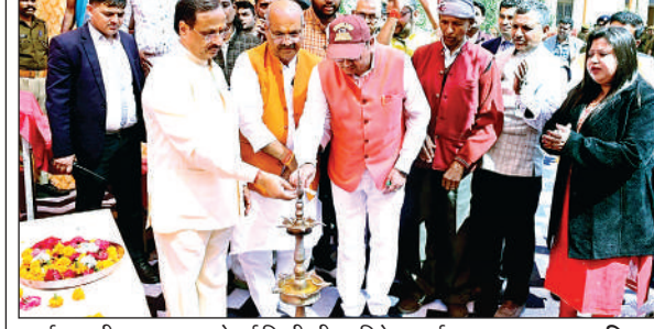
कार्यक्रम की शुरुआत करते पूर्व डिप्टी सीएम दिनेश शर्मा।

अमृत विचार संवाददाता, चौबेपुर : युवा देश का भविष्य है। उनके द्वारा किए गए मतदान से देश की दिशा बदलेगी। नए मतदाताओं को चाहिए कि वह आगामी चुनाव में अपने मत का प्रयोग अवशर करें। यह बातें शुक्रवार को अहमिहारा गांव के प आरके शुक्ला कोलेज ऑफ लॉ में बतौर मुख्य अतिथि पहुंचे राज्यसभा सदस्य एवं प्रदेश के पूर्व उप मुख्यमंत्री डॉ. दिनेश शर्मा ने कही। इस दौरान उन्होंने युवाओं को नमो पैप के बारे में महत्वपूर्ण जानकारियां दीं। नमो नव मतदाता सम्मेलन में दोषहर करीब डेढ़ बजे पहुंचे पूर्व उप मुख्यमंत्री डॉ. दिनेश शर्मा ने सबसे पहले दीप प्रज्वलित कर कार्यक्रम का शुभारंभ किया। कहा देश का भविष्य युवाओं के हाथ में है। अच्छी शिक्षा ग्रहण कर विभिन्न क्षेत्रों में सफलता के नए आयाम स्थापित कर रहे युवा ही देश की दिशा व दशा तय करते हैं।