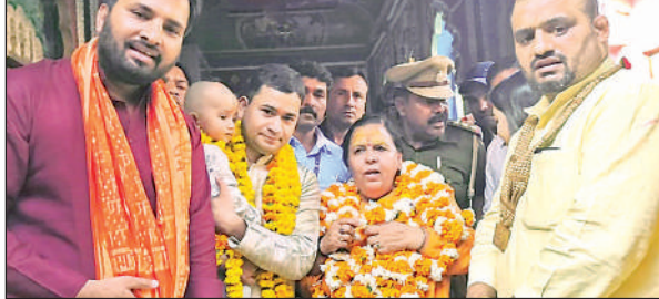
रामलला व हनुमानगढ़ी का दर्शन कर लौटती उमा भारती का स्वागत करते भाजपा कार्यकर्ता।

वे शुक्रवार को यहां दर्शन-पूजन के लिए पहुंची थीं। उन्होंने रामजन्मभूमि मंदिर के अलावा हनुमानगढ़ी व कनक भवन में भी दर्शन किया। काशी और मथुरा के मामले पर उन्होंने कहा कि इसकी