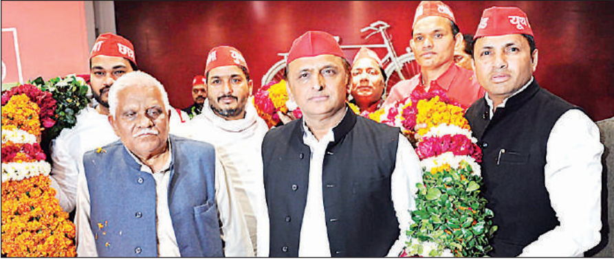
प्रदेश कार्यालय पर आयोजित कार्यक्रम के दौरान सपा के राष्ट्रीय अध्यक्ष अखिलेश यादव का माला पहनाकर स्वागत करते कार्यकर्ता।

समाजवादी पार्टी प्रमुख अखिलेश यादव ने भाजपा को समाज के लिए खतरा बताते हुए आरोप लगाया है कि इस सरकार में भ्रष्टाचार का बोलबाला है। अखिलेश ने सवाल भी उठाया कि सीबीआई, ईडी, भाजपा के गोरखधंधों की जांच क्यों नहीं कर रही है? भाजपा सिर्फ समाजवादी नेताओं के खिलाफ झूठे मुकदमे करती है। लेकिन समाजवादी भाजपा के जुल्म से डरने वाले