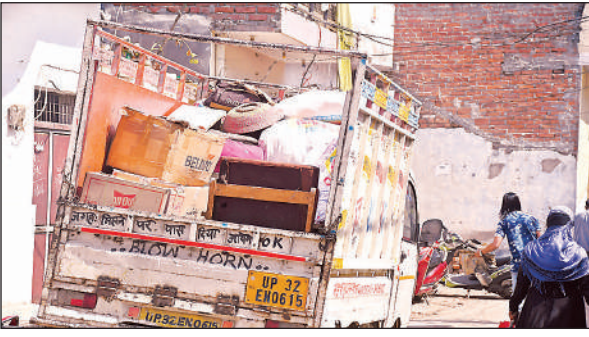
अकबर नगर में एलडीए द्वारा चलाए गए अतिक्रमण विरोधी अभियान के तहत नॉटिस मिलने के बाद मकान खाली कर वाहन से सामान ले जाते लोग।