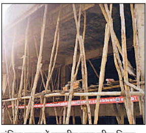
इंदिरा नगर में एलडीए द्वारा सील किया गया निर्माण। अमृत विचार