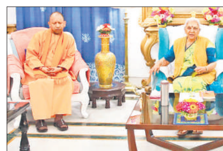
राज्यपाल आनंदीबेन से मुलाकात करने पहुंचे मुख्यमंत्री योगी।

अमृत विचार : लोकसभा चुनाव-24 में प्रदेश की सभी 80 सीटों में से भाजपा सहयोगी दलों के लिए छह सीट छोड़ सकती है। इसमें राष्ट्रीय लोकदल को दो सीटें मिल सकती हैं, जबकि अपना दल (एस) भी दो सीटों पर चुनाव लड़ सकती है। वहीं, निषाद पार्टी को संत कबीर नगर सीट और ओम प्रकाश राजभर की सुभासपा को घोसी सीट मिल सकती है।