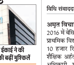
● वित्तीय खुफिया इकाई ने की कार्रवाई, बैंक की बड़ी मुश्किलें

पेटीएम पेमेंट्स बैंक पर आरबीआई की कार्रवाई के बीच दोनों के बीच अंतर-कंपनी समझौतों को खत्म करने को मंजूरी दे दी है। वन97 कम्प्युनिकेशंस ने शुक्रवार को कहा कि दोनों कंपनियों के बीच एक-दूसरे पर निर्भरता कम करने के लिए यह कदम उठाया गया है।