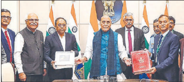
रक्षा मंत्री राजनाथ सिंह रक्षा समझौतों पर हस्ताक्षर के बाद अधिकारियों को दस्तावेज सौंपते हुए।

इन समझौतों में मिग-29 जेट के लिए ब्रह्मोस सुपरसोनिक क्रूज मिसाइलों, रडार, हथियार प्रणालियों और हवाई-इंजन की खरीद भी शामिल है। पूर्वी लद्दाख में चीन के साथ भारत के काफी समय से चल रहे सीमा विवाद के बीच यह व्यापक खरीद समझौते किए गए हैं और इन्हें धरेलू रक्षा विनिर्माण को बढ़ावा देने के लिए सरकार की नीति के व्यापक