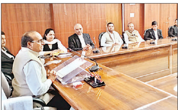
अधिवक्ताओं की बैठक को संबोधित करते जिला जज दिनेश चंद्र।

उन्होंने बताया कि 5 से 7 मार्च तक पिटी अफेन्स के वादों के निस्तारण के लिए विशेष लोक अदालत का आयोजन किया जा रहा