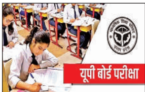
यूपी बोर्ड परीक्षा

इस संबंध में डीआईओएस ने शुक्रवार की शाम सभी केन्द्र व्यवस्थापकों को सूचना भेज दी है। इसके साथ ही किसी भी केन्द्र के बाहर कोई संदिग्ध दिखाता है