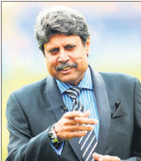
24 सत्र के लिए केंद्रीय अनुबंधित खिलाड़ियों की सूची से बाहर कर दिया गया था। इस फैसले पर मिश्रित प्रतिक्रिया मिल रही हैं, जिसमें क्रीति आजाद और इरफान पटान ने इन दोनों खिलाड़ियों का

नई दिल्ली, एजेंसी भारत के पूर्व कप्तान कपिल देव ने शुक्रवार को भारतीय क्रिकेट बोर्ड (बीसीसीआई) के घरेलू क्रिकेट खेलने की प्रतिबद्धता पूरा नहीं करने पर केंद्रीय अनुबंध नहीं देने के फैसले का समर्थन करते हुए कहा कि कुछ खिलाड़ियों को तकलीफ होगी तो होने दो क्योंकि देश से बढ़कर कोई नहीं है। कपिल ने कहा कि यह प्रथम श्रेणी टूर्नामेंट जैसे रणजी को बचाए रखने के लिए जरूरी कदम है। इशान किशन और श्रेयस अय्यर को बुधवार को 2023-24 सत्र के लिए केंद्रीय अनुबंधित खिलाड़ियों की सूची से बाहर कर दिया गया था। इस फैसले पर मिश्रित प्रतिक्रिया मिल रही हैं, जिसमें क्रीति आजाद और इरफान पटान ने इन दोनों खिलाड़ियों का