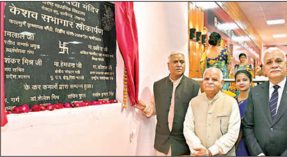
केशव सभागार लोकार्पण

ग्राम पंचा० अधिकारी सालेहनगर, विकास खण्ड देवा बाराबंकी