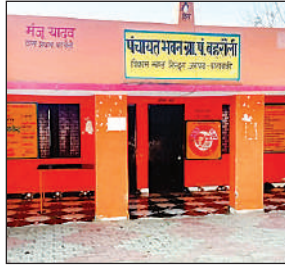
पंचायत भवन की सांकेतिक फोटो।

अमृत विचार : ग्राम पंचायतों को विकसित करने के साथ-साथ अब तकनीकी से जोड़ने के लिए भी प्रयास जारी हैं। राष्ट्रीय ग्राम स्वराज अभियान योजना के तहत प्रत्येक ग्राम पंचायत के पंचायत भवन में कॉमन सर्विस सेंटर की स्थापना कर ग्रामीणों को योजना का लाभ देने की व्यवस्था की गई है। सीएससी की स्थापना के लिए पंचायत भवन में अलग से कार्य अतिरिक्त कक्ष का निर्माण कराया जाएगा। इसी कड़ी में अब जिले के आठ विकास खंडों के 24 ग्राम