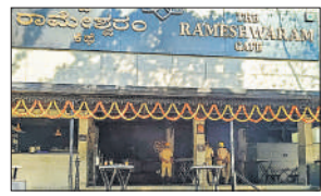
● बैग में रखे बम में लगा था टाइमर जांच टीम सुराग ढूँढने में जुटी

बेंगलुरु, एजेंसी बेंगलुरु के एक लोकप्रिय कैफे में शुक्रवार को बम धमाके से 10 लोग घायल हो गए। पहले शक था कि एक सिलेंडर में विस्फोट होने के कारण आग लगी, लेकिन बाद में कर्नाटक के उप मुख्यमंत्री डीके शिवकुमार ने कहा कि रामेश्वरम कैफे में शुक्रवार को हुआ धमाका कम तीव्रता का था और उसमें टाइमर लगा हुआ था। आग लगी, लेकिन बाद में कर्नाटक विस्फोट स्थल पर पहुंच गई है। बम और फोरेसिक टीम भी जांच में सहायता कर रही है। शिवकुमार ने राज्य के गृहमंत्री