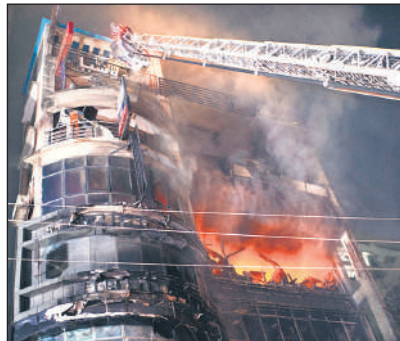
ढाका में गुरुवार देर रात इमारत में धक्कती आग, दूसरी तरफ आग पर काबू पाते अग्निशमन कर्मी।