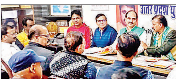
अखिल भारतीय उद्योग व्यापार मंडल के प्रमुख पदाधिकारियों की बैठक को संबोधित करते संगठन अध्यक्ष। अमृत विचार

अमृत विचार, लखनऊ : लेसा सिस गोमती-प्रथम के आलमबाग, कानपुर रोड, वृंदावन, सेस-1, सेस-2, सेस-3 और सेस-4 के उपभोक्ताओं के लिए दो मार्च को शिविर लगाया जाएगा। शिविर आशियाना क्षेत्र के चंसलर क्लब सेक्टर-के 1 में लगाया जा रहा है। विभाग के स्थानीय अधिकारियों से लेकर उच्च अधिकारी तक इस शिविर में मौजूद रहेंगे। जो उपभोक्ताओं की समस्याओं का निस्तारण करेंगे। यह जानकारी विद्युत निगरीय वितरण खंड के अधिशासी अभियंता ने दी।