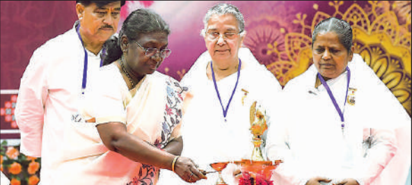
ओडिशा के कटक में शुक्रवार को ब्रह्म कुमारी के स्वर्ण जयंती समारोह का दीप प्रज्वलन के साथ शुरुआत करती राष्ट्रपति द्रौपदी मुर्मु।

राष्ट्रपति द्रौपदी मुर्मु ने शुक्रवार को कहा कि विकास तभी हो सकता है जब शांति का माहौल हो, और कई धार्मिक संस्थान देश में आध्यात्मिक चेतना का प्रसार करने के लिए काम कर रहे हैं। मुर्मु यहां जवाहरलाल नेहरू इन्डोर स्टेडियम में ब्रह्म कुमारी के स्वर्ण जयंती समारोह में शामिल हुईं और कहा कि हम असली खुशी तभी हासिल कर सकते हैं जब हम अपनी भौतिक इच्छाओं को सीमित कर दें। उन्होंने कहा कि विकास तभी हो सकता है जब शांति मौजूद हो... ब्रह्म कुमारी