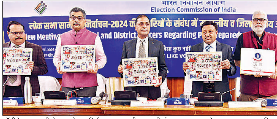
कॉपी टेबल बुक का विमोचन करते मुख्य निर्वाचन आयुक्त राजीव कुमार, निर्वाचन आयुक्त अरुण गोयल व अन्य। अमृत विचार