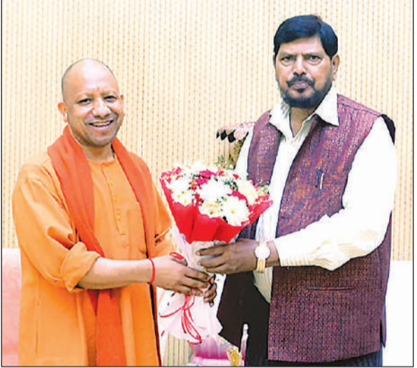
सोमवार को केन्द्रीय राज्यमंत्री सामाजिक न्याय एवं अधिकारिता रामदास आठवले ने मुख्यमंत्री योगी से उनके सरकारी आवास पर मुलाकात की। अमृत विचार

अमृत विचार: यूपी बोर्ड ने सोमवार को हाईस्कूल एवं इंटरमीडिएट परीक्षा की उत्तरपुस्तिकाओं के मूल्यांकन कार्यक्रम भी घोषित कर दिया। 16 मार्च से 31 मार्च तक काफियों का मूल्यांकन प्रदेश के 260 केंद्रों पर होगा। बोर्ड ने मूल्यांकन केंद्रों का निर्धारण कर दिया है। इन सभी केंद्रों पर करीब डेढ़ लाख परीक्षक तीन करोड़ काफियों का मूल्यांकन करेंगे। परीक्षक 55 लाख से अधिक परीक्षार्थियों के शैक्षणिक भविष्य का मूल्यांकन 13 दिन के भीतर करेंगे। बीच में तीन दिन 24 से 26 मार्च तक होली का अवकाश रहेगा। यूपी बोर्ड ने परीक्षा के साथ ही उत्तरपुस्तिकाओं के मूल्यांकन की