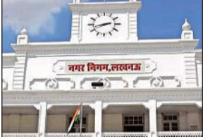
शासन ने नगर निगम को दी जिम्मेदारी, निकाला टैंडर

सरकार ने नालों का गंदा पानी सोधे नदी में न गिरे, इसको लेकर मुहिम तेज कर दी है। जब तक एसटीपी चालू नहीं हो जाते तब तक ओवरफ्लो होने वाले हैदर कैनाल, किला मोहम्मदी, कुकरैल सहित 14 नालों के गंदे पानी में मौजूद