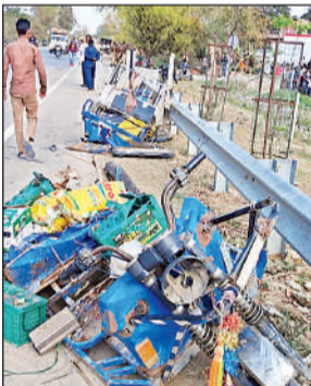
हादसे के बाद क्षतिग्रस्त ई-रिक्शा।

अमृत विचार : मोहम्मदी-गोला मार्ग पर सोमवार की शाम भीषण हादसा हो गया। दिलावरपुर के पास रोडवेज की अनुबंधित बस ने ई-रिक्शा को सामने से टक्कर मार दी, जिससे ई-रिक्शा के परखच्चे उड़ गए। हादसे में ई-रिक्शा पर सवार एक महिला की मौत पर ही मौत हो गई, जबकि तीन साल की बच्ची और युवती ने शाहजहांपुर अस्पताल ले जाते समय दम तोड़ दिया। चार घायलों को अस्पताल में भर्ती कराया गया है। पुलिस ने तीनों शव पोस्टमार्टम के लिए भेज दिए हैं।