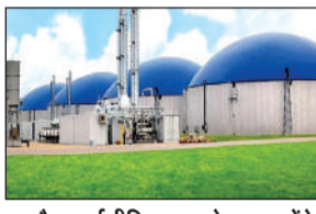
जैव ऊर्जा नीति-2022 के तहत लगे पांच निजी कम्प्रेसड बायोगैस संयंत्र

इन अपशिष्ट के मिश्रण से बनेगी बायो सीएनजी नेपियर, कृषि, गोबर, सुगरकेन प्रेस मड, ठोस व तरल अपशिष्ट आदि