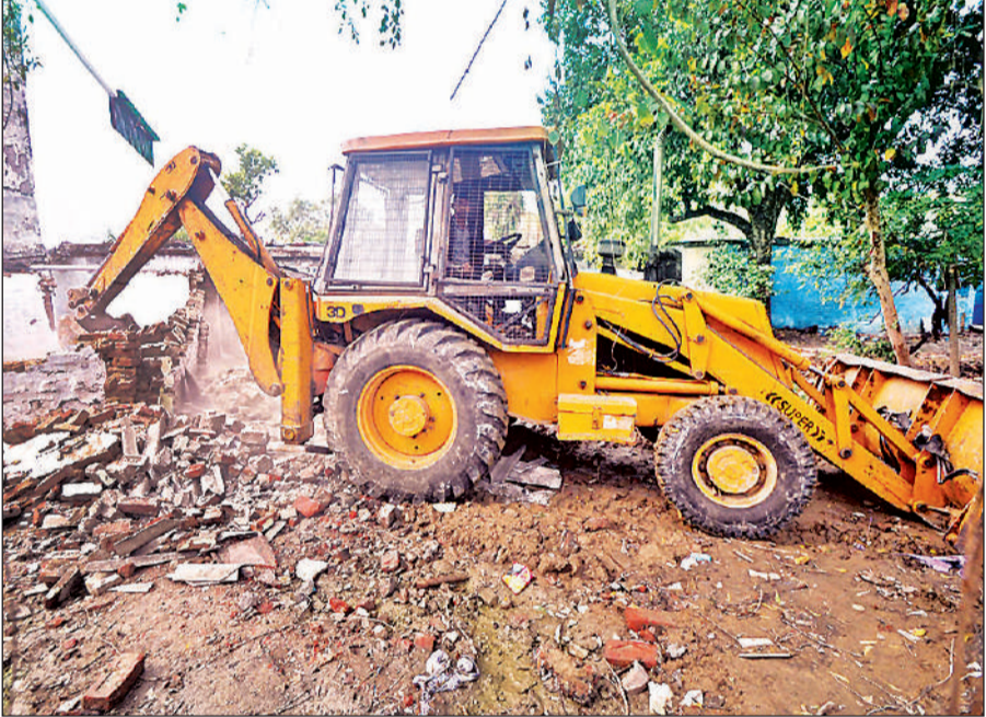
सोमवार को बटलर पैलेस में अभियान के दौरान जेसीबी से अतिक्रमण हटाती एलडीए की टीम।