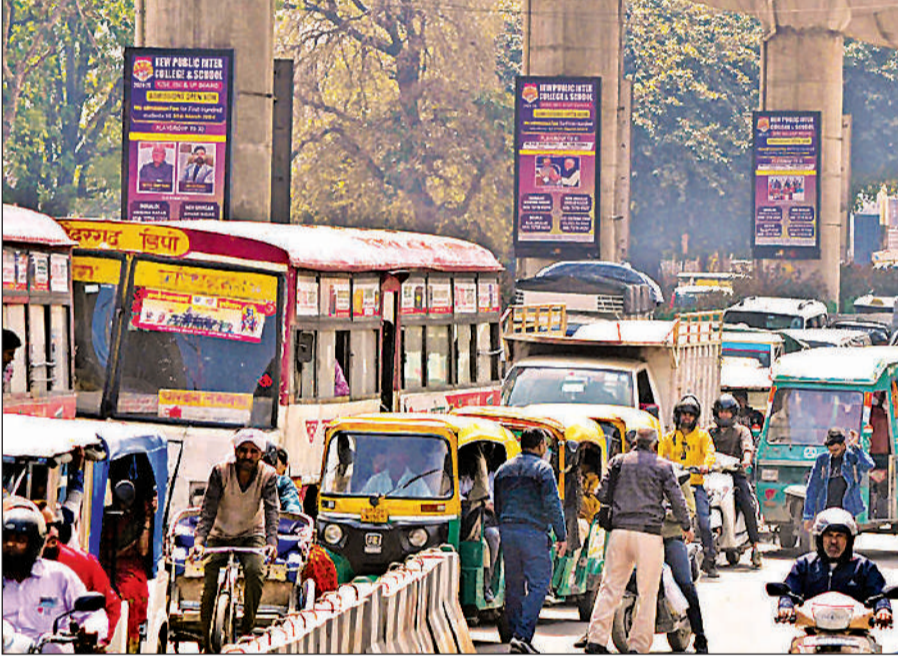
राजधानी में सोमवार को अवध चौराहे पर लगा भीषण जाम, राहगीर हुए परेशान। अमृत विचार

स्थानीय निवासियों के अनुसार कहीं आरडीएसएस योजना के तहत कई क्षेत्रों का अनुरक्षण कार्य पूरा हो चुका है। इसके बाद भी किसी ना किसी समस्या के चलते बिजली लगातार जा रही है। शिकायत करने पर भी कर्मचारी समस्या को दूर नहीं करते हैं। अधिकारियों का फोन बंद रहने के साथ कभी उठता ही नहीं है। बिजली चले जाने की दशा में सबसे अधिक परेशानी पानी और बच्चों को लेकर होती है। कई इलाकों में शाम 7 बजे के बाद ही बिजली की आपूर्ति सामान्य हो पाई।