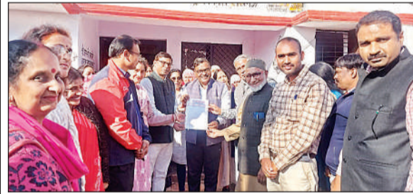
खंड शिक्षा अधिकारी को ज्ञापन देते शिक्षक।