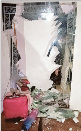
टूटा पड़ा शीशा।