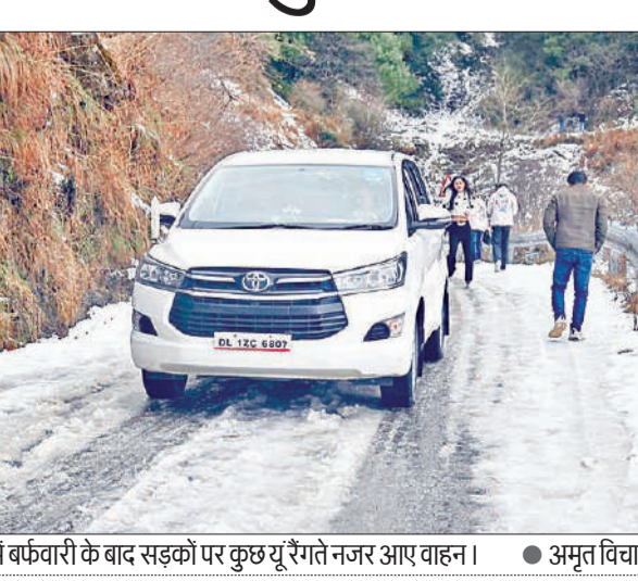
देहरादून में बर्फबारी के बाद सड़कों पर कुछ यूँ रंगते नजर आए वाहन। ● अमृत विचार

छा गई थी। हालांकि तेज धूप के बाद दोपहर तक माल रोड, बड़ा बाजार आदि क्षेत्रों में ओले पिघल चुके थे। लेकिन बारापत्थर, हिमालय दर्शन आदि ऊंचाई वाले क्षेत्रों में पाला गिरने से आने वाले कुछ दिनों तक बर्फबारी का दीदार किया जा सकता है। इधर, मौसम विभाग के मुताबिक राज्य के उत्तरकाशी, चमोली और पिथौरागढ़ जिलों में बारिश होने की संभावना है। शेष जिलों में मौसम शुष्क बना रहेगा। राज्य में 3200 मीटर से ज्यादा ऊंचाई वाले इलाकों में बर्फबारी की भी संभावना है।