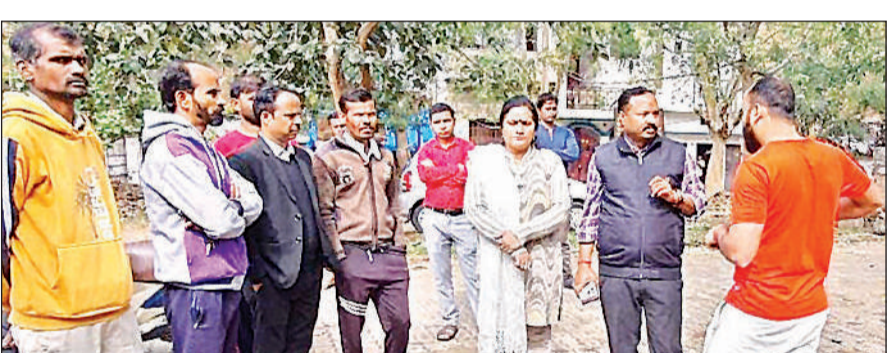
विद्यालय के निरीक्षण के दौरान बीएसए से बहस करता युवक, साथ में खड़े ग्रामीण।