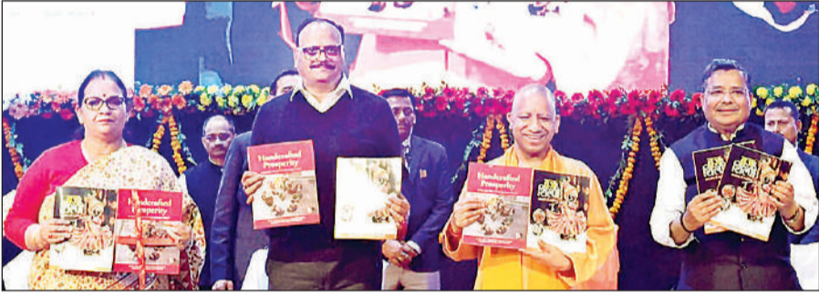
कार्यक्रम के दौरान मुख्यमंत्री योगी, उप मुख्यमंत्री ब्रजेश पाठक, पर्यटन मंत्री जयवीर सिंह और महापौर सुषमा खर्कवाल।

उन्होंने कहा कि पहली बार राज्य के सभी 75 जिलों में और सभी 403 विधानसभा क्षेत्र में किसी न किसी पर्यटन स्थल को व्यवस्थित