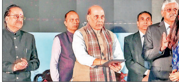
सोमवार को नई दिल्ली में आयोजित कार्यक्रम में राजनाथ सिंह समेत मौजूद अन्य।