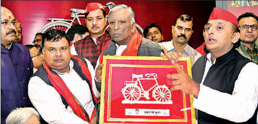
सपा मुख्यालय पर विभिन्न दलों से पार्टी में आए लोगों के साथ राष्ट्रीय अध्यक्ष अखिलेश यादव।