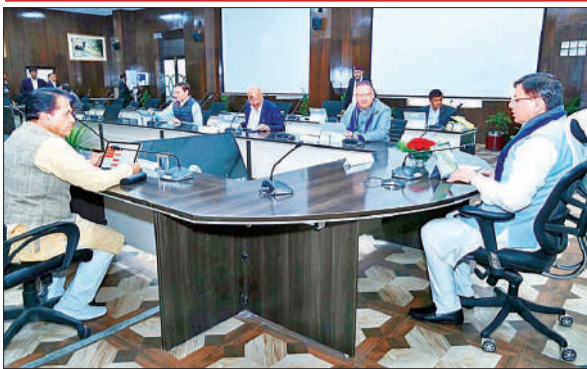
देहरादून सचिवालय में मंत्रिमंडल की बैठक लेते मुख्यमंत्री पुष्कर सिंह धामी।

संपत्ति की भरपाई के साथ ही 8 लाख तक का जुर्माना व दंगा नियंत्रण का खर्चा भी भरना होगा