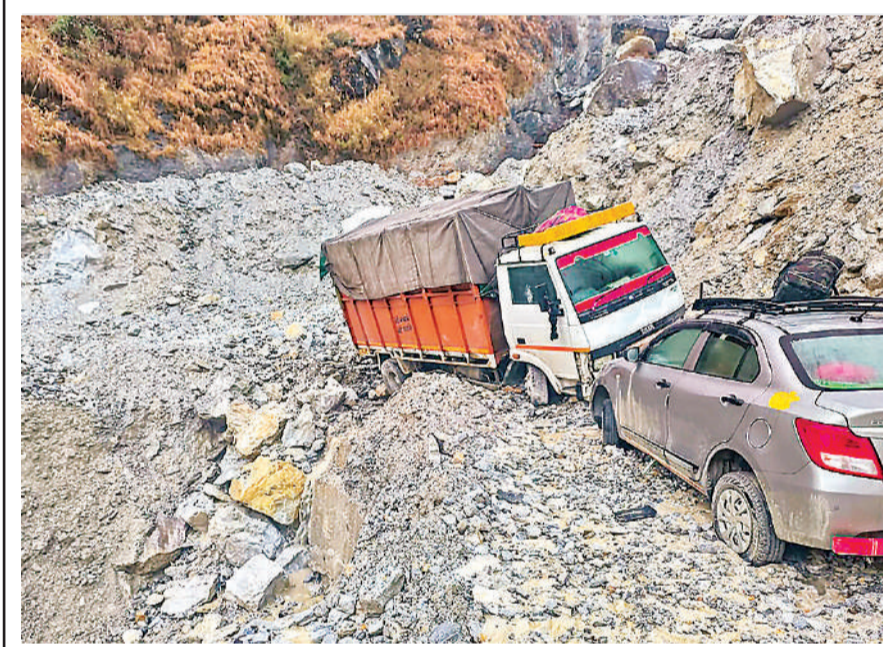
उत्तराखंड के चमोली में भारी वर्षा के बीच पहाड़ से मलबा गिरने के चलते बदनौथा हाइवे पर वाहन कुछ इस तरह फंस गए।