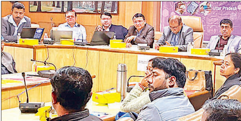
एक दिवसीय प्रशिक्षण कार्यक्रम में शामिल स्वास्थ्य अधिकारी ।

घातक साबित हो जाता है। ऐसे मरीजों को सांस लेने में भी समस्या आ जाती है। ज्यादातर मामलों में ये देखा गया है कि उम्र बढ़ने के साथ ये समस्या और गहराती है। यही कारण है कि इन मरीजों का समय से इलाज जरूरी है।