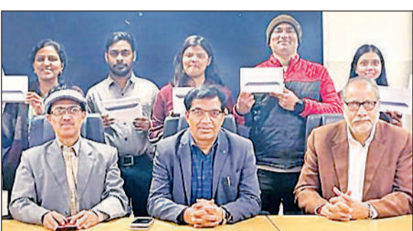
कार्यक्रम के दौरान टेबलेट लिए छात्र व उपस्थित अतिथि।