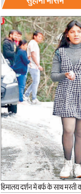
हिमालय दर्शन में बर्फ के साथ मस्ती करते सैलानी।