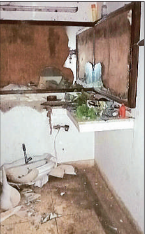
घर में टूटा वाशबेसिन।