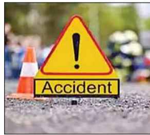
कार्यालय संवाददाता, बाराबंकी

रामनगर व रामसनेहीघाट कोतवाली क्षेत्र में हुई दुर्घटनाएं, एक की हालत गंभीर