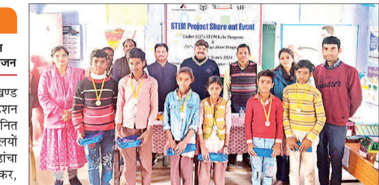
इवेंट में विजेता बच्चों के साथ अध्यापक व फाउंडेशन सदस्य। अमृत विचार

सिधौली, अमृत विचार। विकास खण्ड सिधौली में अमेरिकन इण्डिया फाउंडेशन द्वारा विगत दो वर्ष से उग्र में चयनित सात जिलों के 30 सरकारी विद्यालयों में प्रौद्योगिकी आधारित बुनियादी ढांचा (लैपटॉप, प्रोजेक्टर, स्क्रीन, स्पीकर, पेन ड्राइव, गणित एवं विज्ञान किट्स) उपलब्ध कराकर अनुकूलित क्षमता निर्माण कार्यक्रम संचालित किया जा रहा है। शिक्षण पद्धति और प्रक्रिया में आईसीटी को एकीकृत करने के लिए शिक्षकों के तकनीकी कौशल में वृद्धि हेतु निरंतर सहयोग भी प्रदान किया जा रहा है। ब्लाक सिधौली के चार विद्यालयों में स्ट्रेम प्रोजेक्ट शेयर आउट इवेंट का आयोजन किया गया। जिसमें विद्यालय से कक्षा छः से आठ तक लगभग 198 बच्चों ने बहू-चक्रकर प्रतिभाग किया। जिसमें बच्चों ने बेस्ट आउट ऑफ द वेस्ट और विज्ञान व गणित थीम पर वर्कआउट और रचनात्मक माॉडल प्रदर्शनी में प्रस्तुत किये। बच्चों ने शिक्षकों के मार्गदर्शन में स्वयं लगन से कई दिनों से विभिन्न थीम पर