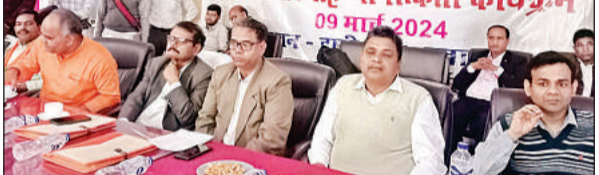
पीएम विश्वकर्मा योजना पर आधारित सेमिनार में मंचासीन अफसर व नेता।

अमृत विचार: एक तरफ सरकार महिलाओं के सम्मान की बात करती है। वहीं, दूसरी ओर सरकार की योजना से जुड़े सेमिनार और जागरूकता कार्यक्रम में सत्ता पक्ष के नेता और अफसर कुर्सी पर बैठे रहे। महिलाओं समेत कार्यक्रम में बड़ी संख्या में आये लोग सभागार में खड़े रहे। खास बात यह रही कि नेता व