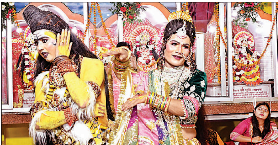
शहर के लोधेश्वर नाथ मंदिर में शिव पार्वती की झांकी प्रस्तुत करते कलाकार।