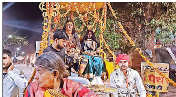
फतेहपुर में निकाली गई शिव बरात।