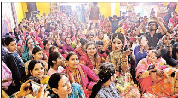
लोधेश्वरनाथ मंदिर परिसर में कार्यक्रम मौजूद श्रद्धालु।