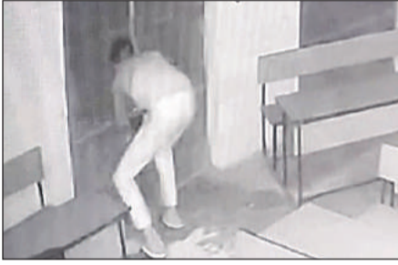
ताला तोड़ते हुए सीसीटीवी में कैद चोर ।