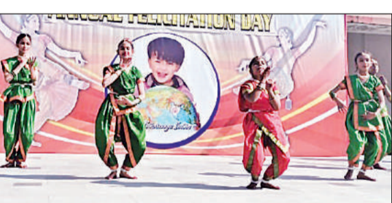
स्कूल में वार्षिक वंदन समारोह में सांस्कृतिक कार्यक्रम प्रस्तुत करते बच्चे।

अमृत विचार। शनिवार को एसजेएस पब्लिक स्कूल गुरुबक्शगंज का वार्षिक वंदन समारोह का धूमधाम से आयोजित किया गया। कार्यक्रम में छात्रों का विद्यालय के नन्हे-मुन्हे बच्चों ने विभिन्न प्रकार के सांस्कृतिक व प्रेरक कार्यक्रम प्रस्तुत किये। साथ ही बच्चों का वार्षिक परीक्षाफल