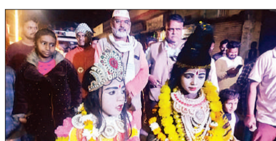
रामनगर में निकली शिव बरात में शिव-पार्वती के स्वरूप।