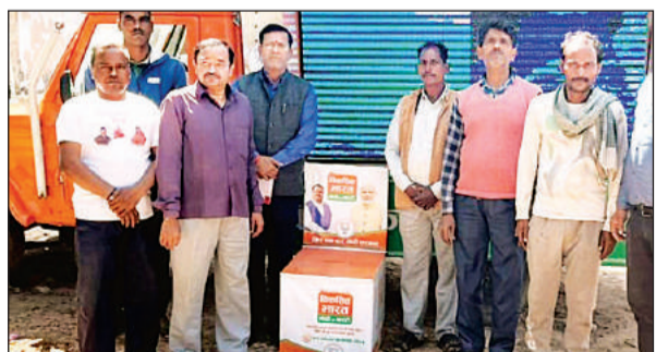
मोदी गारंटी वैन में रखी पेटिका में सुझाव पत्र डालने पहुंचे लोग।