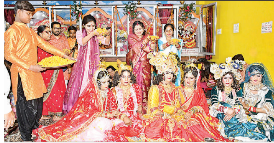
शहर के लोधेश्वर नाथ मंदिर में फूलों की होली खेलते कलाकार।