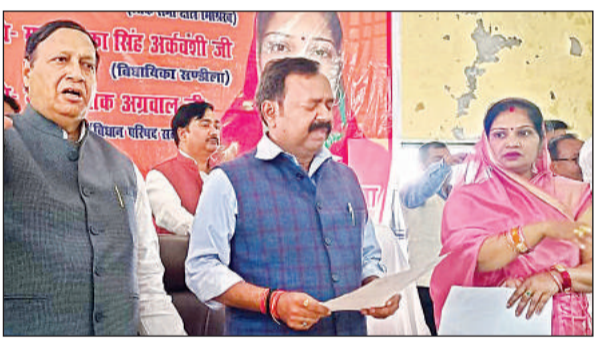
क्षेत्र पंचायत की बैठक में मौजूद सांसद अशोक रावत व अन्य जनप्रतिनिधि।

सडीला, हरदोई अमृत विचार। क्षेत्र पंचायत की बैठक पंचायत भवन के हाल में हुई। मुख्य अतिथि सांसद अशोक रावत एवं विशिष्ट अतिथि एमएलसी अशोक अग्रवाल रहे। बैठक की अध्यक्षता ब्लाक प्रमुख आरती गुप्ता ने की। बैठक में 10 बिंदुओं पर चर्चा कर सर्वसम्मति से तीन करोड़ 36 लाख 59 हजार का बजट पारित किया गया। सांसद ने कहा कि आज भाजपा की सरकार में सभी धर्मों के लोग संतुष्ट हैं। भाजपा सरकार ने उज्ज्वला योजना, प्रधानमंत्री आवास