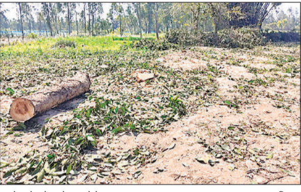
वन रेंज क्षेत्र में काटे गए हरे पेड़।