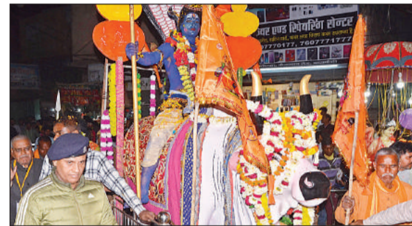
नागेश्वर नाथ मंदिर से निकली महादेव की बरात।