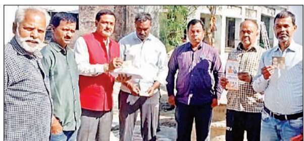
लाभार्थी संपर्क योजना के तहत जानकारी देते भाजपा नेता।