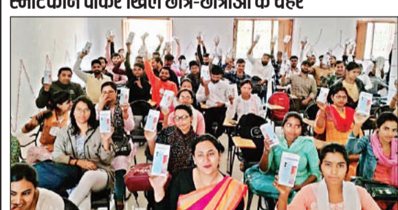
स्मार्टफोन पाने वाले छात्र-छात्राएं।