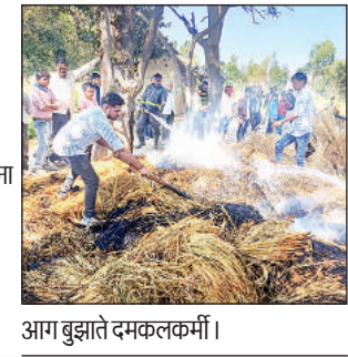
आग बुझाते दमकलकर्मी।

स्थानीय कोतवाली क्षेत्र के दर्यामपुर गांव में किसान जला प्रसाद के अज्ञात के पास राखे जाने के पुआल में इजाजत कारणां से शनिवार को अचानक आग लग गयी। इस घटना में हजारों का पुआल जलकर राख हो गया। संकरी जगह होने के कारण दमकल आग वाली स्थान नहीं पहुंच पाई। कड़ी मशक्कत के बाद ग्रामीणों की मदद से आग बुझाई गई।