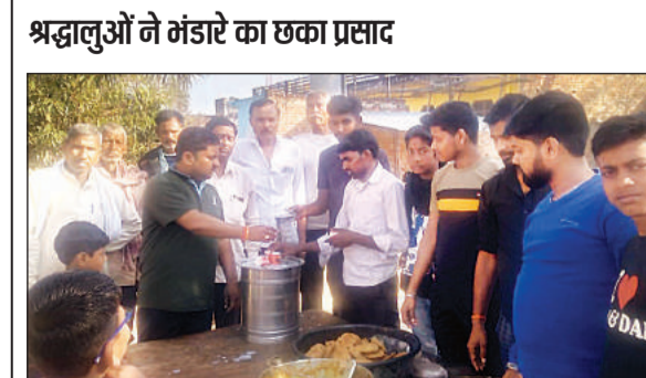
भंडारे में प्रसाद लेते श्रद्धालु।