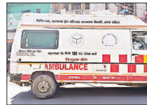
एम्बुलेंस की खिड़की से गायब शीशा।

पर मरीजों की जिंदगी दांव पर है। मौजूदा समय में 108 और 102 की कुल 84 एंबुलेंस हैं, जिनमें कई एम्बुलेंस तीन लाख किलोमीटर के आसपास चल चुकी हैं। लेकिन अभी उन्हें बदला