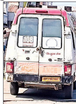
जर्जर हालत में एम्बुलेंस।

जिले में चल रही कई सरकारी एम्बुलेंस के पुरानी हो जाने