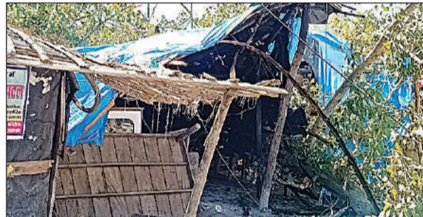
चाय की दुकान पर गिरी हुई पेड़ की डाल।