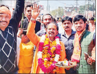
शिव बरात में शामिल श्रद्धालु।