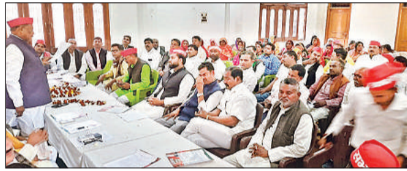
समाजवादी पार्टी की जिला कार्यकारिणी की बैठक में मौजूद कार्यकर्ता।