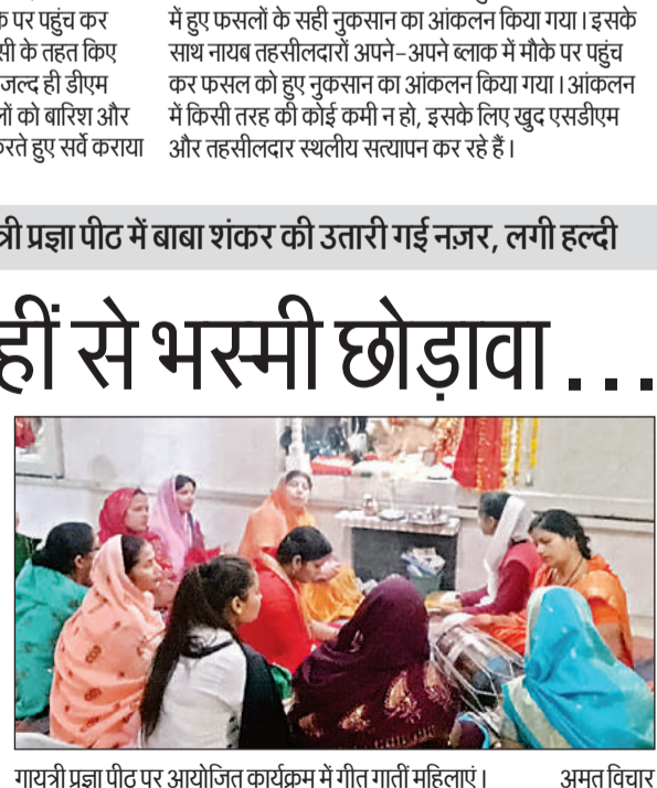
गायत्री प्रज्ञा पीठ पर आयोजित कार्यक्रम में गीत गाती महिलाएं।