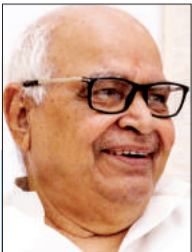
हृदय नारायण दीक्षित पूर्व विधानसभा अध्यक्ष उ.प्र.

वायु प्राण हैं। प्राण नहीं तो जीवन नहीं। वैदिक परंपरा में वायु अमर देव हैं। वैदिक ऋषि वायु की प्रीति में सराबोर हैं। वे प्राणशक्ति के संचालक हैं, लेकिन दिखाई नहीं पड़ते। वायु का रूप नहीं होता। वायु की तीव्र गति आंधी है। आंधी का शोर सुनाई पड़ता है, लेकिन वायु का रूप नहीं।