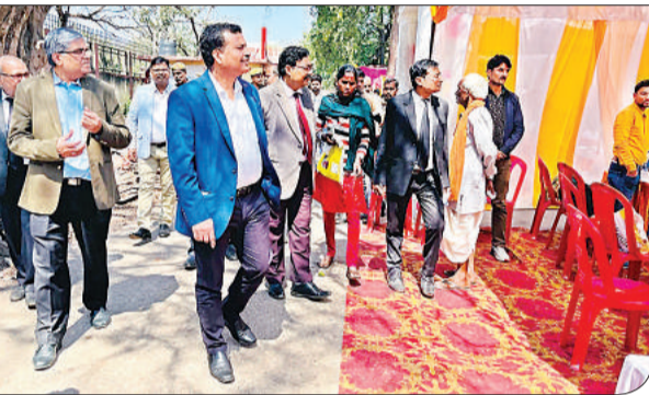
न्यायालय परिसर में लगे शिविरों का निरीक्षण करते जनपद न्यायाधीश। अमृत विचार