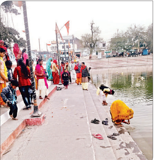
कलश में जल भरते श्रद्धालु। अमृत विचार