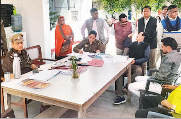
बेनीगंज में थाना दिवस में शिकायतें सुनते अधिकारी ।

जानकारी के अनुसार शुक्रवार की देर रात लोनार पुलिस को सूचना मिली कि एक संदिग्ध लज्जरी बावन रोड पर नहर के किनारे खड़ी है । इसका पता होते ही बावन पुलिस चौकी की टीम जांच पड़ताल के लिए निकल पड़ी । उसी बीच एक