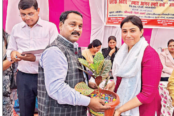
अतिथि को पौधा भेंट करते आयोजन।