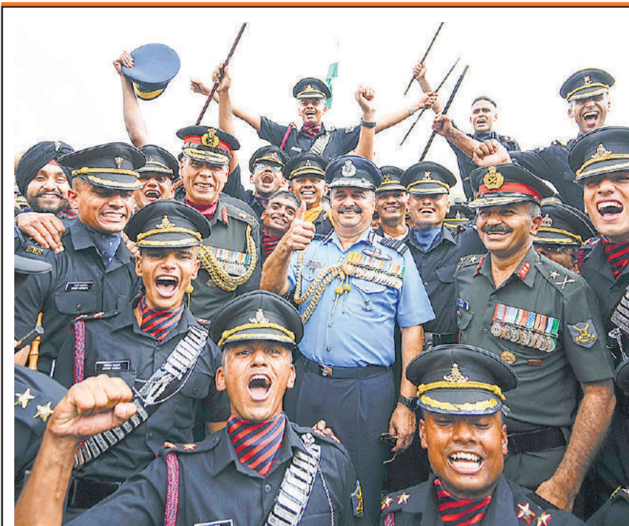
वेनई में शनिवार को एयरफोर्स चीफ वीआर चौधरी के साथ ऑफिसर्स ट्रेनिंग अकादमी (ओटीए) में पारिंग आउट परेड और पिपिंग समारोह के दौरान कैडेट।

जोरहाट (असम)। प्रधानमंत्री मोदी ने पूर्वी असम के जोरहाट में 'अहोम सेनापति' लचित बोडुफुकन के समाधि स्थल पर उनकी 125 फुट ऊंची कांसे की प्रतिमा का शनिवार को अनावरण किया। इस 'स्टैच्यू ऑफ वेलर' (वीरता की प्रतिमा) की ऊंचाई 84 फुट है और इसे 41 फुट की चौकी पर स्थापित किया गया है। इससे यह संरचना 125 फुट ऊंची हो गयी है। प्रधानमंत्री ने टोक के समीप होलोंगापा में लचित बोडुफुकन मैदाम डेवलपमेंट प्रोजेक्ट में इस प्रतिमा का अनावरण किया। 16.5 एकड़ से अधिक के इस क्षेत्र का विकास एक पर्यटक स्थल के रूप में किया जा रहा है जो क्षेत्र के इतिहास को दर्शाता है। पूर्व राष्ट्रपति रामनाथ कोविंद ने फरवरी 2022 में इस प्रतिमा की नींव रखी थी।