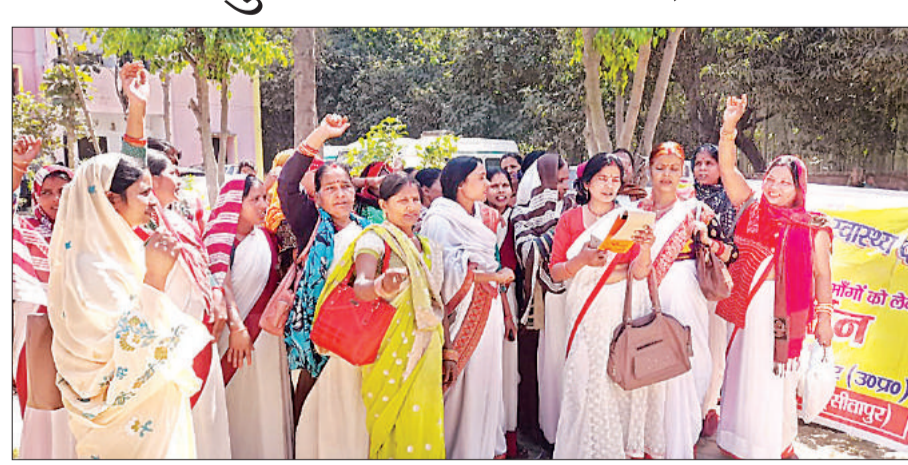
सीएचसी में प्रदर्शन करती आशा बहुएं। अमृत विचार